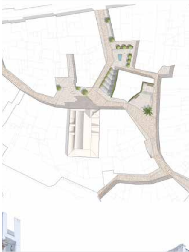
Remodelación del casco antiguo de Nàquera

Es una de las obras que van a mejorar la organiza-