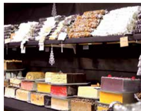
Casa Fina venent a la Fira.