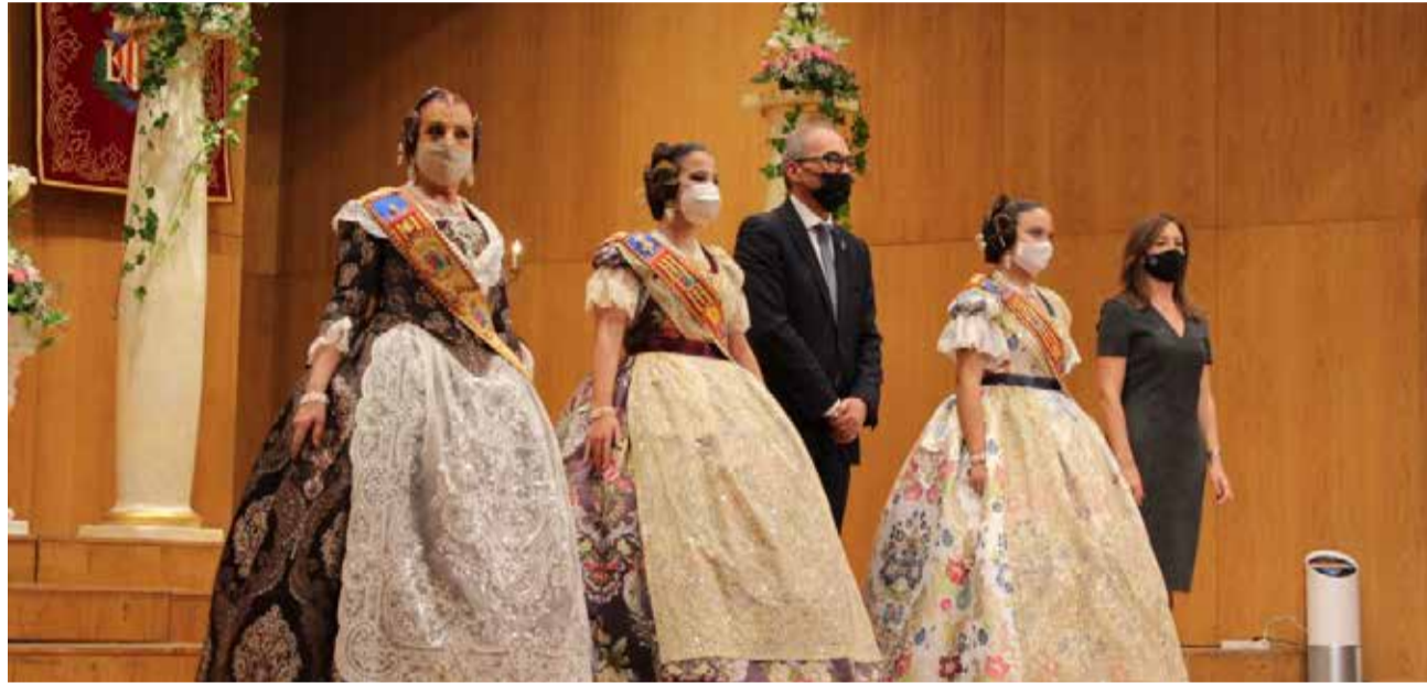
Las falleras mayores de Benaguasil durante el acto en el municipio.

Los parlamentos protocolarios de la presidenta de la