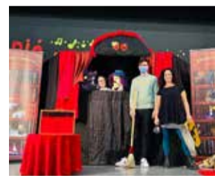
Inici de l'obra