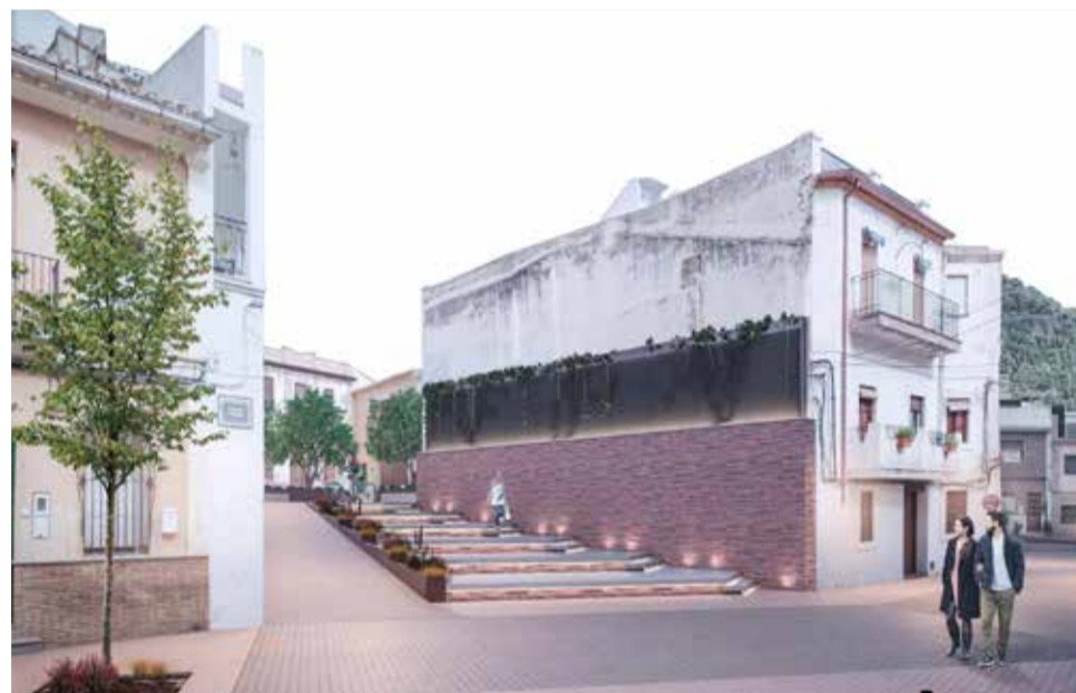
Escaleras proyectadas en una de las zonas de Nàquera.

Eso sí, el casco antiguo no será el único en tener un gran cambio, el CEIP Emili Lluch va a tener una gran mejora