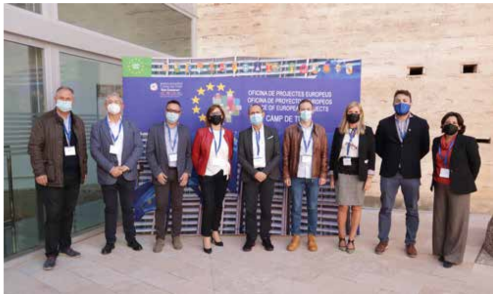
Los representantes del Camp de Túria durante el acto

Una cita que reunió a alcaldes, alcaldesas, concejales y concejalas de los 17 ayuntamientos que conforman el ente supramunicipal. Personal técnico de las administraciones locales, de la Federación Valenciana de Municipios y Provincias, de la Diputación de Valencia, de la universidad, institutos tecnológicos, empresas referentes en la comarca como PowerElectronics, sociedad civil representada por los sindica-