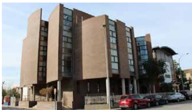
Juzgados de Llíria

La magistrada atribuye al delito alevosía y ensañamiento, por las 22 puñaladas