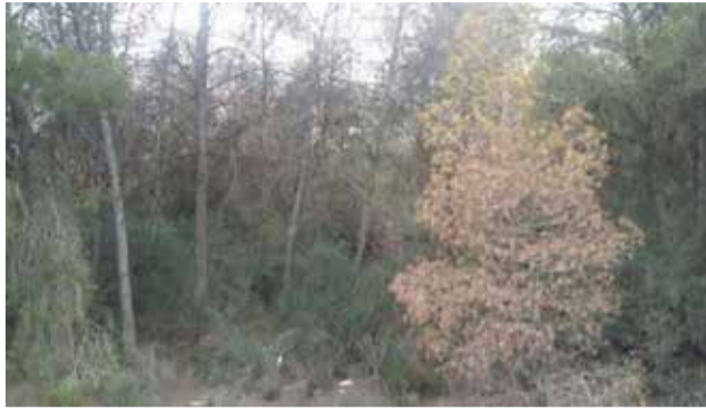
Pinos en una zona de Bétera.

El partido de Compromís en el municipio de Bétera se encuentra en un momento de tensión, tras haber saltado uno de los asuntos pendientes en materia forestal de la Conselleria de Agricultura, Desarrollo Rural, Emergencia Climática y Transición Ecológica. Se trata de la limpieza de la zona forestal situada entre las urbanizaciones de Pinares-Brucar y Torres de Portacoeli, que se había solicitado en febrero de 2019 por la conocida Junta de Montes y Señeríos Territorial de Bétera, y que ha provocado una ruptura dentro de la formación. No ha sido hasta este año cuando se ha ejecutado la limpieza por dicha fundación, con la subvención realizada por Conselleria tras la aprobación del proyecto; una tarea que ha levantado las críticas de diversos vecinos, así como del grupo municipal de Compromís.