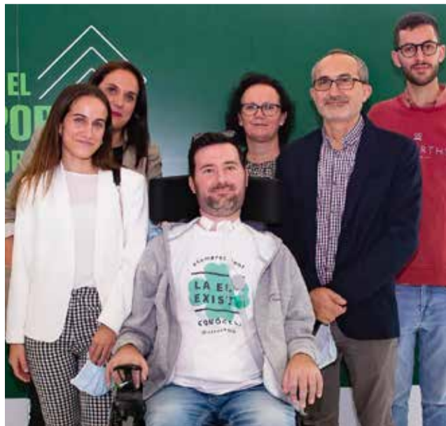
El vecino de Benaguasil durante una presentación

"La ELA (Esclerosis Lateral Amiotrófica) es una enfermedad neurodegenerativa sin cura, que hace que los músculos de todo el cuerpo dejen de funcionar poco a poco, perdiendo la capacidad de moverse, hablar, respirar y tragar, manteniendo la