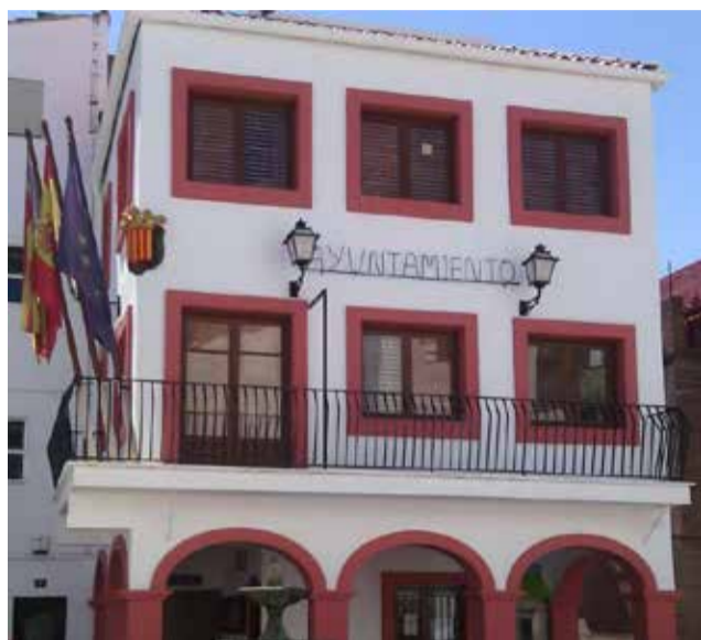
Ayuntamiento de Gátova / EPDA

En ellos compartiremos experiencias y aprenderemos herramientas y dinámicas para desarrollar un proceso de envejecimiento enriquecedor y participativo. Las personas mayo-