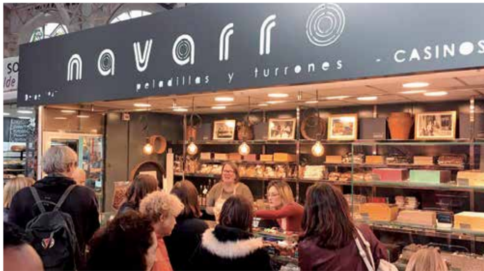
La parada Navarro venent durant un dels anys anteriors.

Els Torrons de Gemma, Gemma Torrada, Bla, Duro, Neu, Guirlache i de Xocolata són els més demandats i representatius, però a més els Mestres Artesans sorprenen cada any amb novetats arribant-se a elaborar hui dia més de 90 varietats de torró entre ells alguns peculiars com els de cassalla, mojito, limoncello, cheesecake, té verd amb ginebre, cirera, mandarina, orxata, llet me-