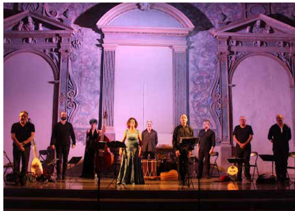
Una de les actuacions del LLUM Fest en l'any passat