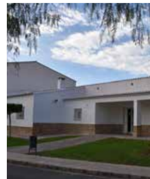
Centro de salud.

Con esta subvención se ha reparado, también, de forma integral el tejado, con una antigüedad de 50 años, y se ha sustituido el enfoscado así como mejorado los muros exteriores y se ha pintado todo el centro de salud. Las obras, que han cumplido el plazo de ejecución de dos meses, comenzaron en el mes