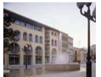
El consistorio.