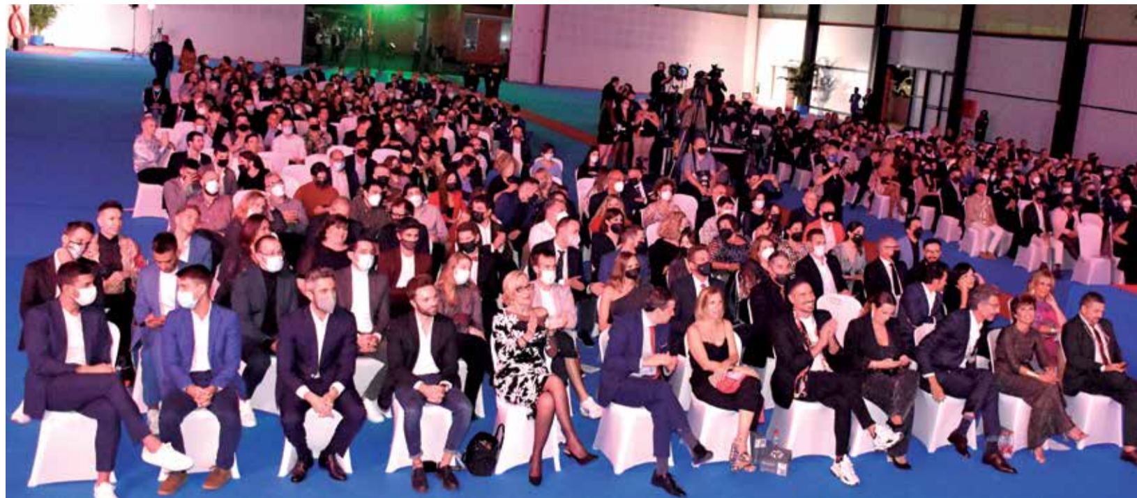
Algunos de los invitados a la gala de los V Premios de AquíTV.