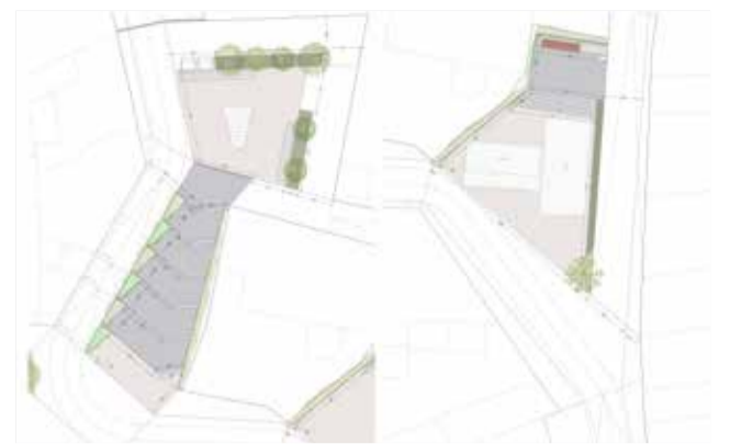
Remodelación del núcleo antiguo.

y no son otros que la adquisición por parte del Ayuntamiento de los terrenos de zona verde y vial denominados 'Tras horno' y el sondeo vertical para la explotación de aguas subterráneas del pozo 'Les Voltes'. Se trata de dos avances para mejorar el bienestar de todos los ciudada-