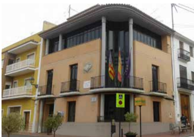
El Ayuntamiento de Olocau.

ROPERO: "QUEREMOS DEMOSTRAR EL APOYO Y EL COMPROMISO CON LAS VÍCTIMAS"