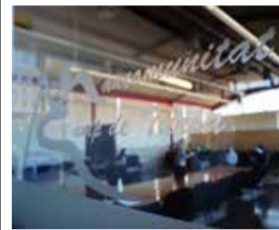
La Mancomunitat / EPDA