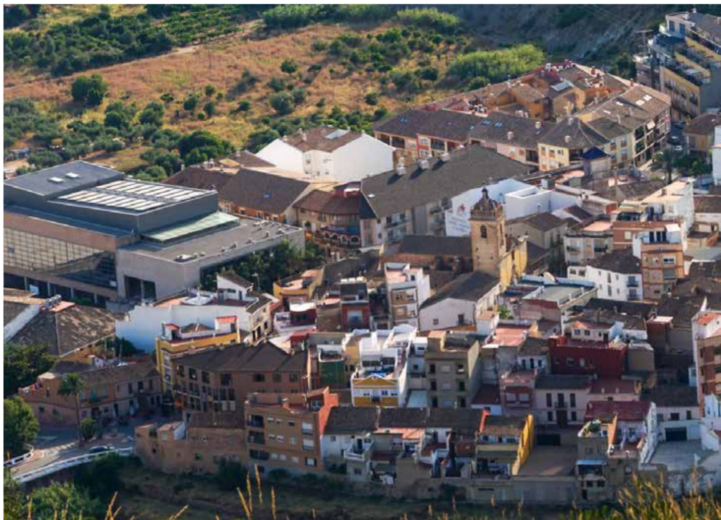
El municipio valenciano de Nàquera visto desde el cielo, en un día soleado.

Además del casco antiguo, próximamente empezarán las obras de la plaza Jaume I que harán de ese espacio, denominado 'Espai Moscatell', un lugar lúdico que una