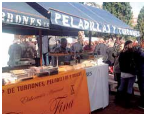
Casa Fina venent a la Fira.