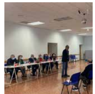
El acto de la UDP.

En la Asamblea ha estado presentes el alcalde de Be-