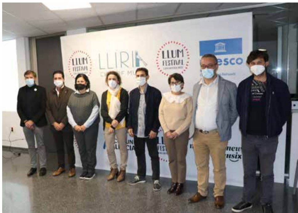
Presentació del LLUM Fest, amb els organitzadors i l'Ajuntament

LA CITA MUSICAL COMPTARÀ EN ESTA EDICIÓ DE 2021 AMB UN 'SPECIAL ENSEMBLES' EN HOMENATGE AL ARTISTA GUSTAV MAHLER