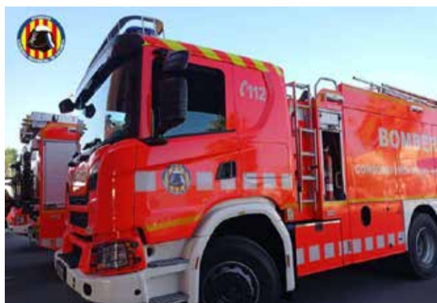
Un camión de bomberos.