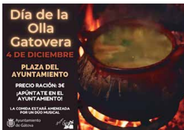
Cartel del Día de la Olla Gatovera.