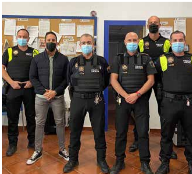
Presentación de los nuevos equipos policiales / EPDA

Con esta adquisición el equipo de Gobierno continúa con su objetivo de dotar de mejores medios materiales a los profesionales de la Policía Local, renovando sus equipamientos y medios técnicos. En este senti-