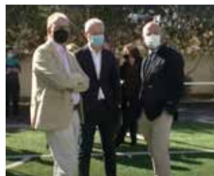
Durant la visita

La Diputació visita Les Casetes i el camp de futbol