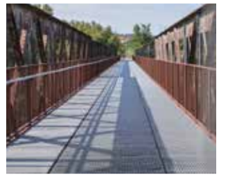
Pont de Ferro.