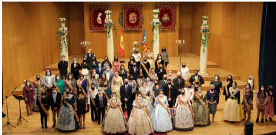
Todos los asistentes al acto del 40 aniversario en Benaguasil

Junta Local Fallera y del alcalde, la interpretación del himno de la Comunidad y una foto de familia, dieron por finalizado el acto.