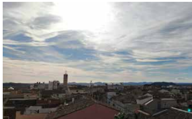
Vista des de dalt del municipi de Casinos.