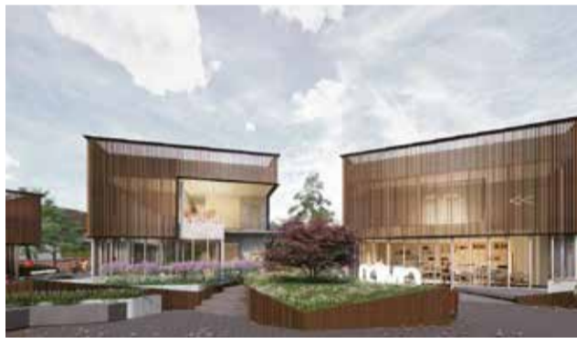
Proyección del centro cívico

En la actualidad la zona sur del municipio, que alberga alrededor del 30% de la población total, cuentan con un espacio reducido y no de titularidad municipal donde se acogen las actividades "Bétera Saludable" para mayores de 65 años así como espectáculos culturales organizados por el área de Derechos