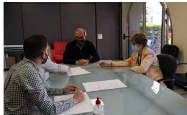
Una de las reuniones en el Espai de la dona.