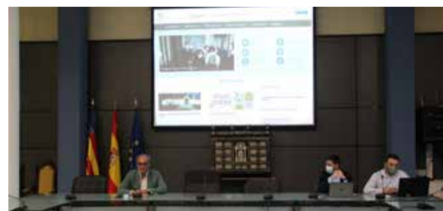
El alcalde presentando la nueva web municipal