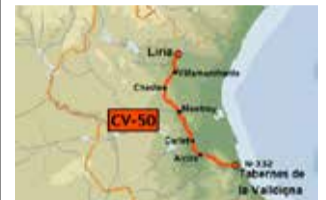
Recorrido CV-50.

La CV-50 es un proyecto de largo recorrido. La Generalitat Valenciana suspendió en 2015 las obras de ampliación, cuando solo se había acometido una primera fase, desde la CV-35 hasta Benaguasil. Debido a la crisis económica, las obras se paralizaron y se terminó por cancelar el contrato y abonar la compensación a la empresa concesionaria. En total, a día de hoy quedan por ejecutar 16 kilómetros, por lo que se ha reclamado en diversas ocasiones su finalización..