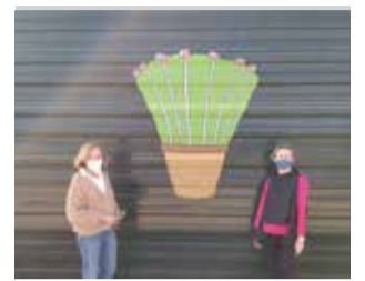
Una de las obras. / EPDA