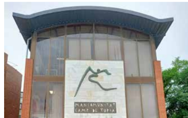
Sede de la Mancomunitat / EPDA

la Diputación de Valencia, la Federación Española de Municipios y Provincias (FEMP), la Federación Valenciana de Municipios y Provincias (FVM) y representantes de distintas mancomunidades de la provincia de Valencia hablarán sobre la importancia de las mancomunidades para vertebrar el territorio.