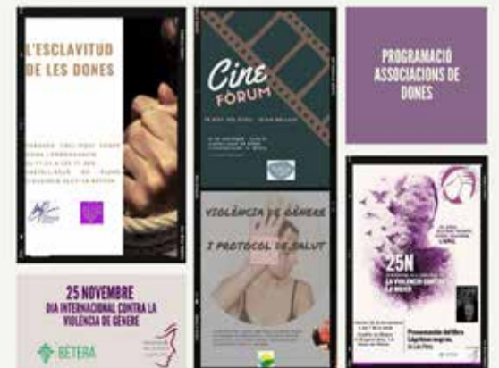
Algunos de los actos programados

Además el edificio de Casa Nebot se iluminará de color morado durante toda la semana del 22 al 28 de noviembre en conmemoración de este día.