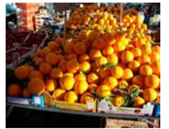
Naranja valenciana.

Reparten el tratamiento contra la mosca de la fruta