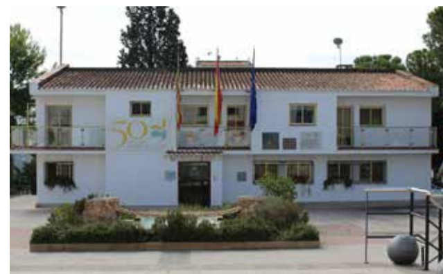
El Ayuntamiento de Loriguilla.