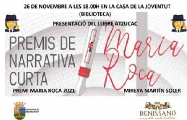
Cartell del premi.

A més d'escriure també li agrada molt la música. Toca la flauta a la Banda de Benis-