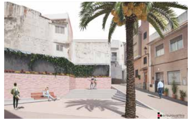
Proyección de una de las reformas integrales.