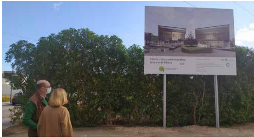
La alcaldesa de Bétera, visitando la zona donde se realizará el centro

El centro está concebido como un parque multifuncional ajardinado, con espacios y edificios aislados, autoabastecidos energéticamente, diseñados para la reunión, convivencia y disfrute de los vecinos de la zona sur de Bétera. Porque, tal y como ha comentado el concejal de Urbanizaciones, "estene nuevo centro pretende, desde la arquitectura respetuosa con el entorno, la regeneración urbana de la zona, construyendo un complejo cívico y administrativo abierto y sin barreras para el uso de todos los vecinos y vecinas".