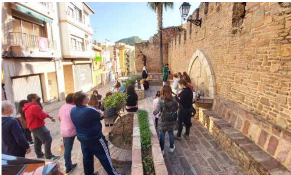
Visitants a la ruta teatralitzada en una de les escultures

Pel carrer de la Pilota s'arriba a la torre del Senyor de la Vila, on la figura del Senyor de la Vila explica el passat feudal de la localitat. I finalment, El rei Yahia, en la plaça del Castell, remet al passat àrab del municipi.