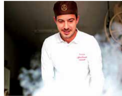
Turrones Casinos preparant el dolç.