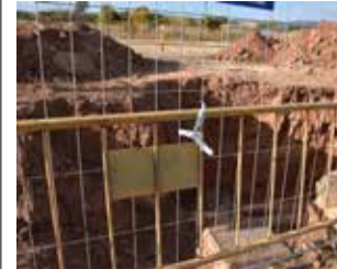
Obras en Marines