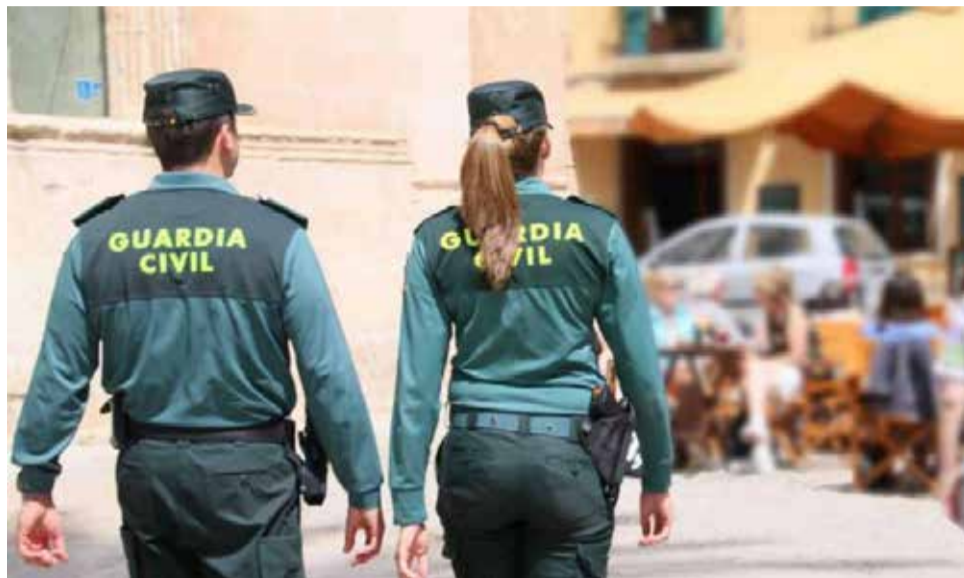
Dos agentes de la Guardia civil patrullando

El juzgado que lleva el caso ha decretado el decreto