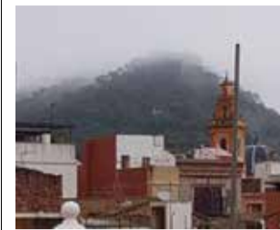
Benissanó / EPDA