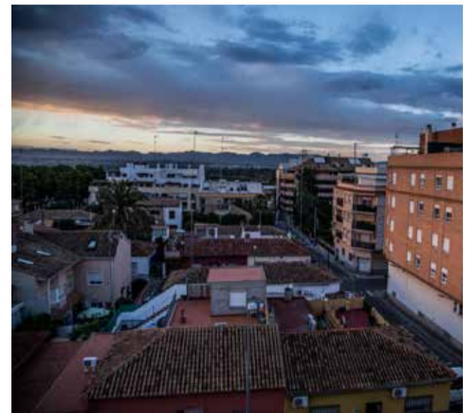
Panorámica del municipio de Riba-roja

tro. En concreto, este grupo de trabajo tendrá como objetivo principal centrarse en los indicadores de la 'Agenda 2030' y trabajar sobre cuestiones como la de su implantación en municipios pequeños y medianos. Así el alcalde ha querido recordar que su municipio ya tiene constituido un consejo de trabajo y de participación por la 'Agenda 2030'.