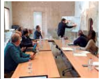
Reunión / EPDA