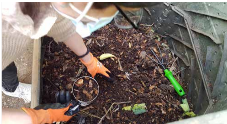
Labores de compostaje.

consultar sus dudas y tienen un acompañamiento en este proceso de gestión de residuos que, en la mayoría de los casos, es nuevo para ellas. El programa abarca la formación, la entrega de la compostera ajustada al tipo de vivienda y el acompañamiento para que el proceso sea un éxito.