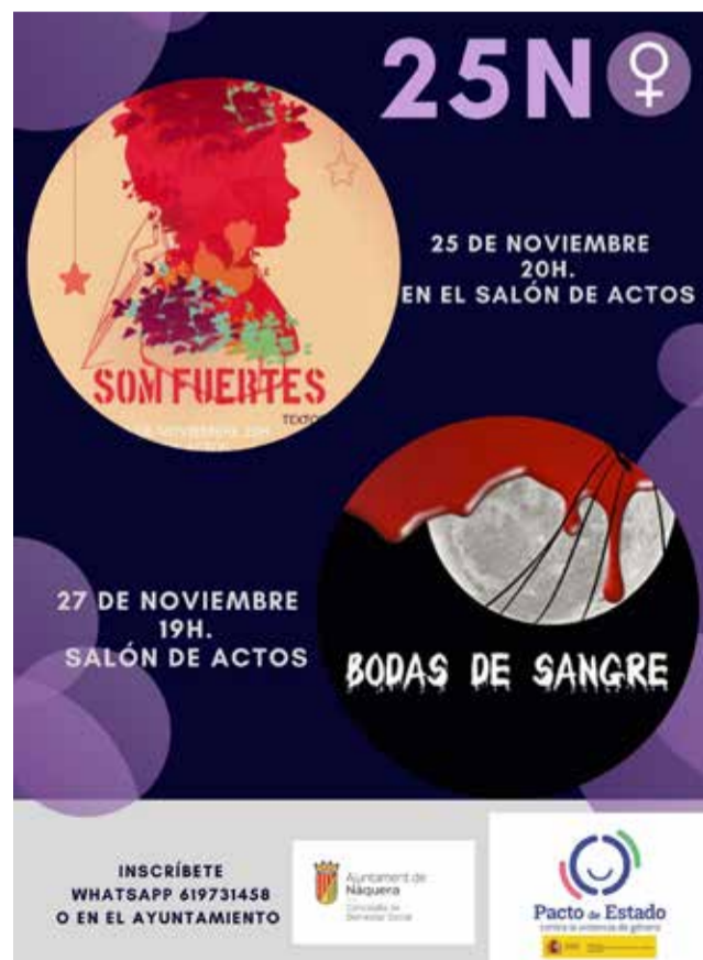
Cartel del 25N.

Eso sí, esta no será la única porque también habrá una obra de teatro, 'Bodas de sangre', tendrá lugar el día 27 de noviembre a las 19 horas también en el salón de actos del Ayuntamiento. Hay que recordar que es necesario inscribirse en el Ayuntamiento para poder asistir a ambas actividades. Además, los lugares más emblemáticos de toda la población tendrán luces moradas para demostrar que Nàquera está unida contra la Violencia de Género.