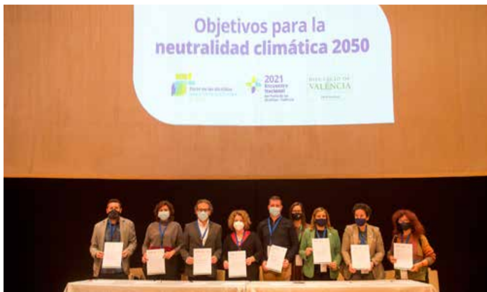
Presentació del pacte en la que ha participat l'Eliaana

Els municipis tenen la responsabilitat d'actuar en relació al transport i al consum de l'energia i la seua implicació resulta imprescindible per a aconseguir objectius com la reducció de les emissions de CO 2 , millorar l'eficiència energètica, utilitzar fonts d'energia renovable i desenvolupar mesures per a adaptar-se a les conseqüències del canvi climàtic.