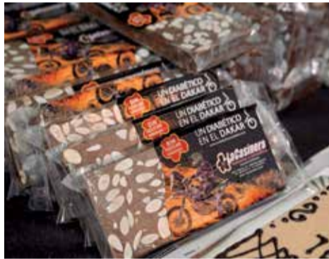
Torrons de La Casi.