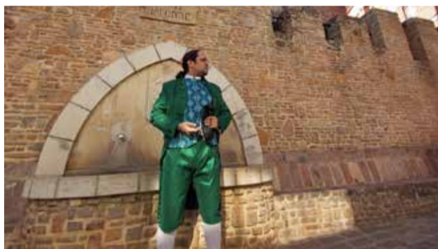
Un dels encarregats explicant l'escultura

La ruta permet conèixer les escultures de La Calderona, Sant Roque, el Cartoixà o el Senyor de la Vila