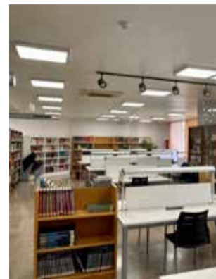
Biblioteca municipal.

D'aquesta manera, les activitats de foment lector realitzades entre l'1 de gener i el 30 de juny i que han permès optar a la convocatòria han sigut, entre al-