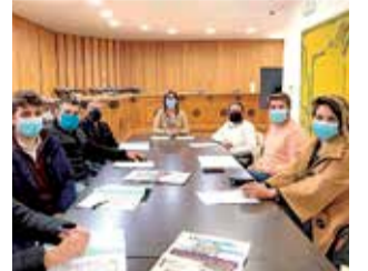
Reunión de Buñol.