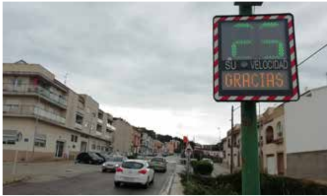
Radar de Chiva.