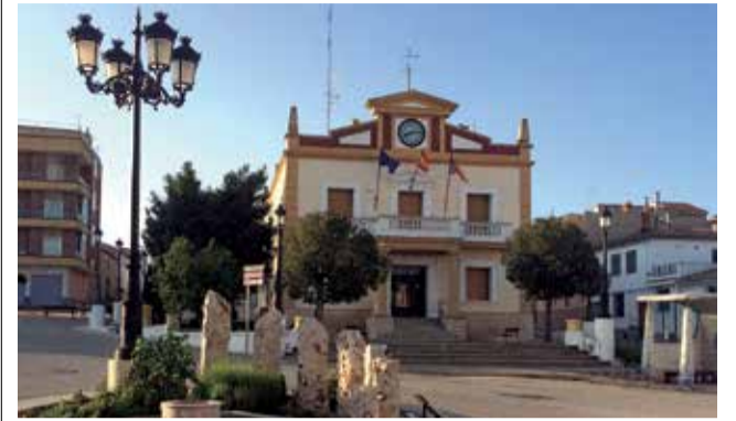
Ayuntamiento de Sinarcas.