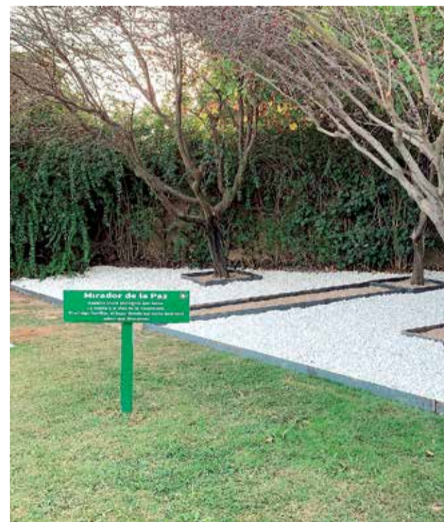
Parque de la Paz de Chiva.

Por último, el Parque de la Paz fue seleccionado Mejor Cementerio de España 2016, por la prestigiosa publicación 'Adiós Cultural'.