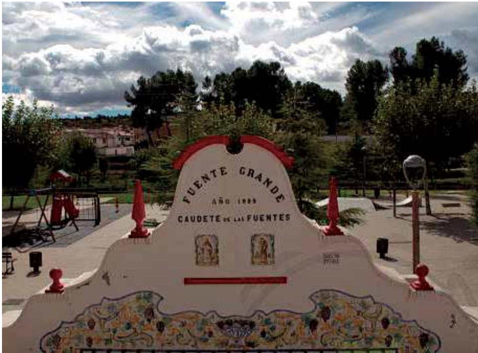
Fuente Grande de Caudete de las Fuentes.

La Diputación Provincial de Valencia, en el BOP de Valencia n.º 216 del pasado martes 9 de noviembre de 2021, ha publicado el anuncio sobre concesión de subvenciones para la mejora del ciclo integral del agua "Reacciona 2021", en el cual el Ayuntamiento a resultado beneficiario con un importe de 100.000'00€ para llevar a cabo la ejecución de la obra de instalación de contadores domiciliarios de agua potable con telelectura y red fija de comunicaciones.