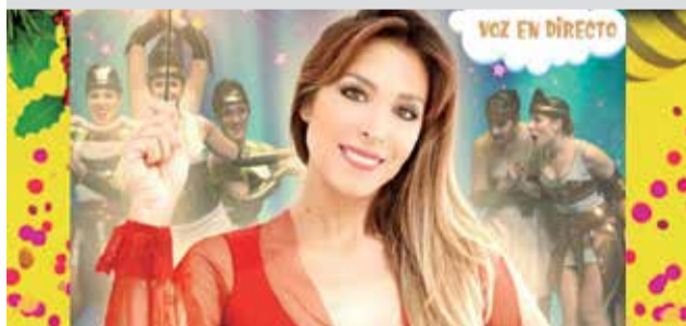
► La cantante Gisela actuará en concierto en el Concert Kids el próximo 19 de diciembre a las 18 horas.