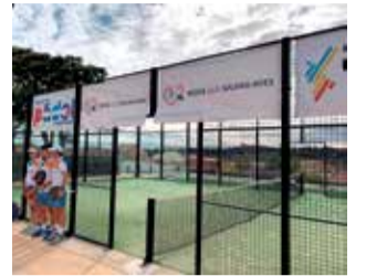
Proyecto redes.