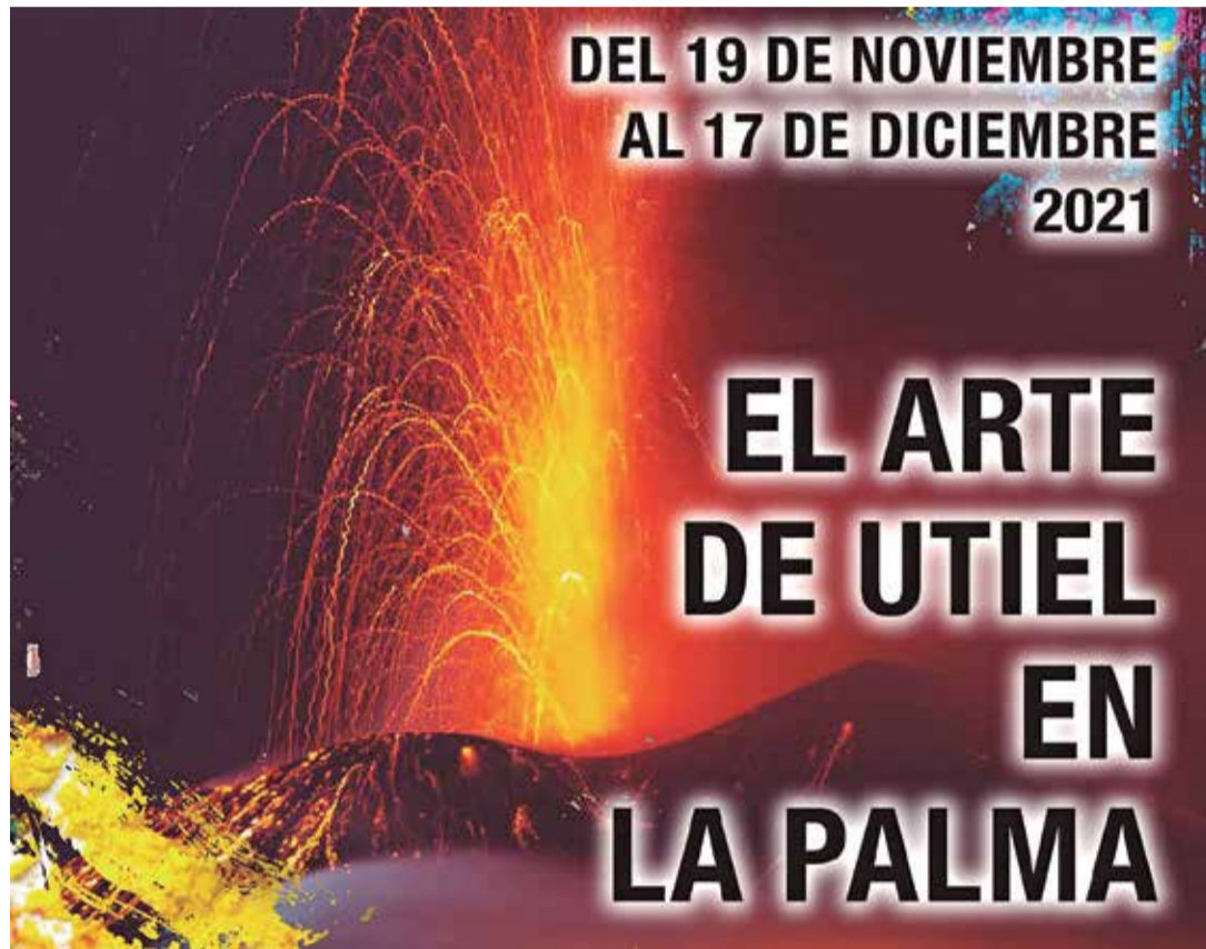
Cartel exposición "El arte de Utiel en La Palma".

Del mismo modo, se ha habilitado una "Fila 0" para aquellos que quieran realizar aportaciones directas mediante transferencia o BIZUM al Cabildo Insular.