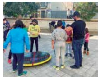
Actividades Bley. / EPDA