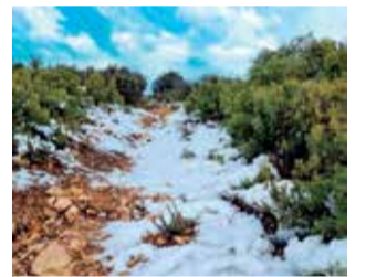
Nevada Chera. / EPDA