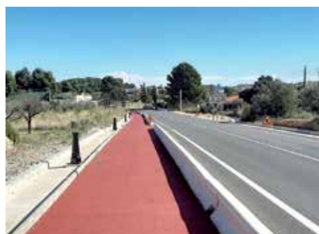
Nuevas farolas entre los términos de Macastre y Yátova.