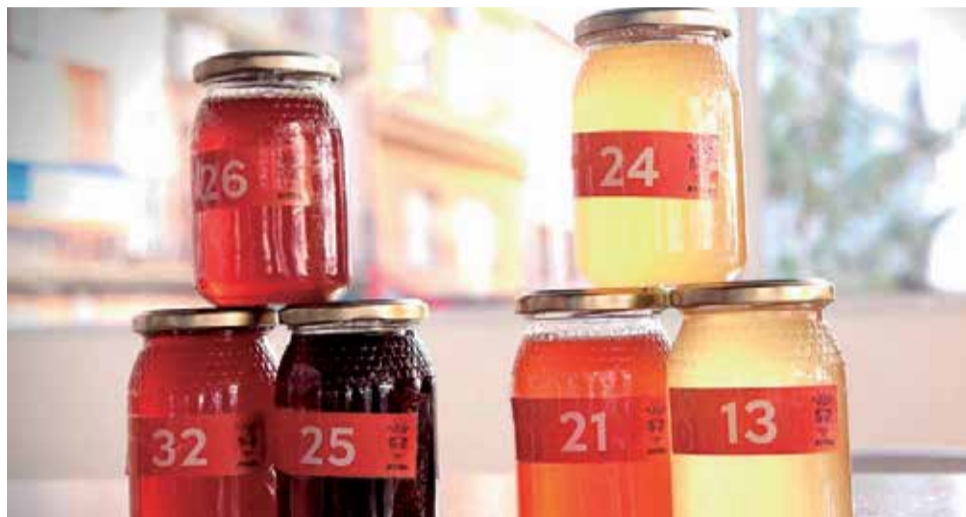
Tarros de miel.

Tras el éxito de la edición inaugural del pasado 2020, el 4 de noviembre del presente 2021 se celebró la segunda edición. Si en la primera decidieron abordar la miel desde una perspectiva histórica, viendo la evolución de la práctica apícola desde la Prehistoria hasta la actualidad, en esta segunda edición analizaremos los