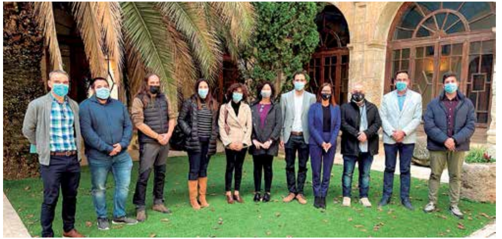
Alcaldes y alcaldesas de los municipios de la comarca Utiel-Requena.

■ FUENTERROBLES ASISTIÓ A LA PRESENTACIÓN DEL PLAN DIRECTOR