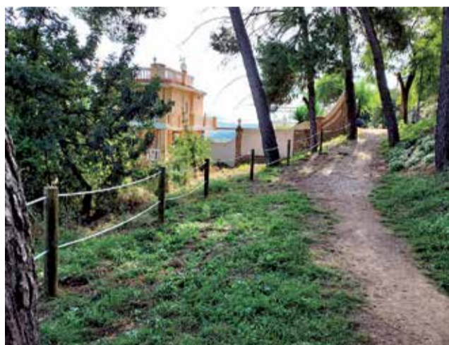
Actuaciones en el parque de El Planell y La Violeta

Dentro del corredor deportivo que se está generalizando en toda la localidad para poder caminar de forma segura por todo el municipio y visitar todos los parques, se ha mejorado la conexión