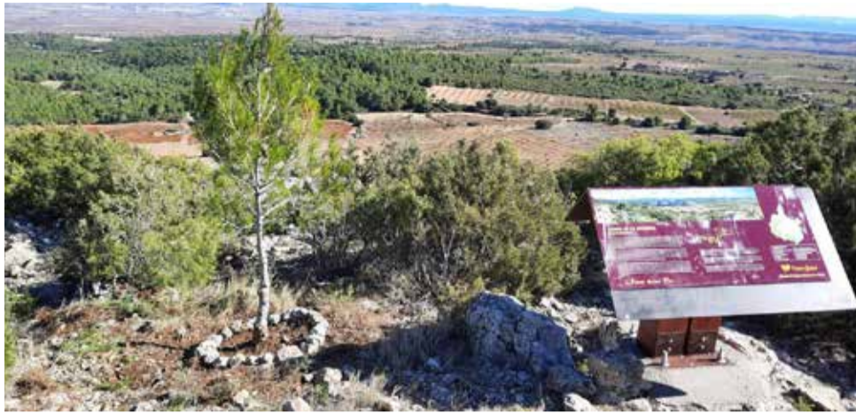
Nueva señalización turística a la localidad.

■ TORRE DEL TELÉGRAFO DE LA BICUERCA Y SU MIRADOR SON ALGUNAS DE ELLAS