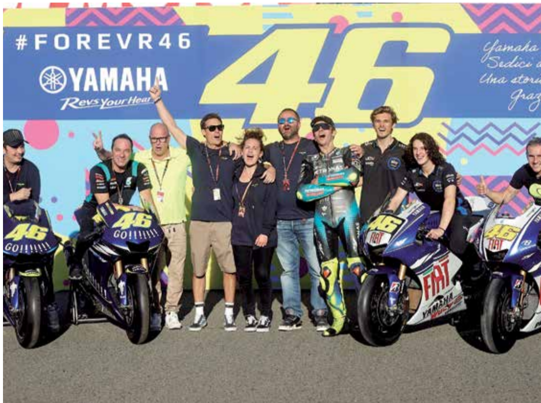
El piloto italiano Rossi posa con miembros del equipo en el circuito Ricardo Tormo.

Rossi, natural de Urbino, donde nació el 16 de febrero de 1979, no ha podido resistir el paso del tiempo frente al "tírón" de las jóvenes promesas y ello unido a su escasez de resultados le llevó a tomar la determinación de dejar de competir al final de la presente temporada en el campeonato del mundo de motociclismo, pero en su mente ya se gestan nuevos retos en el mundo de las cuatro ruedas que irá desvelando con el paso del tiempo, aunque ahora toca despedirse y ese, aunque lo disimule, va a ser un momento duro para alguien que lo ha dado