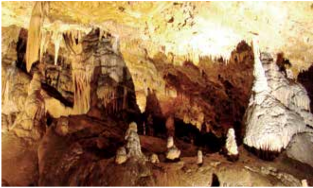
Interior Cueva de Don Juan.