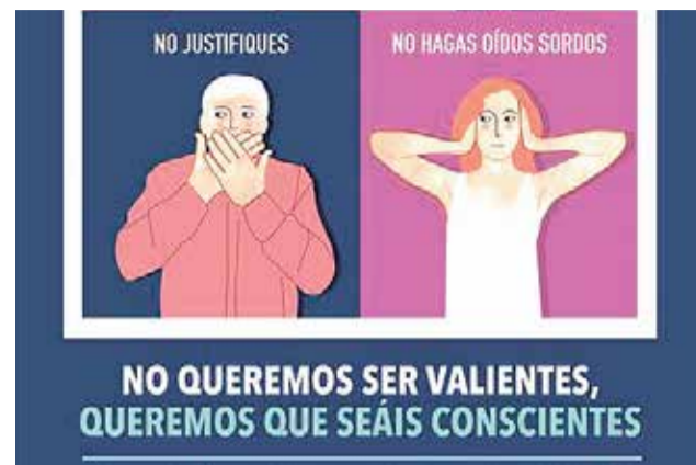
Cartel 25N de Ayora. / EPDA