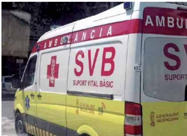
Foto archivo ambulancia.