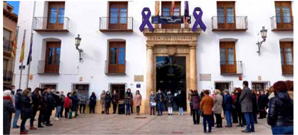
Lectura de manifiesto del 25N./EPDA

Actualmente se está trabajando en la elaboración del Plan de Igualdad Municipal con la implicación directa de la ciudadanía ya que se ha puesto en marcha una encuesta en la que se plantean cuestiones relativas a la situación actual en materia de igualdad de oportunidades entre hombres y mujeres. La campaña de Utiel en con-