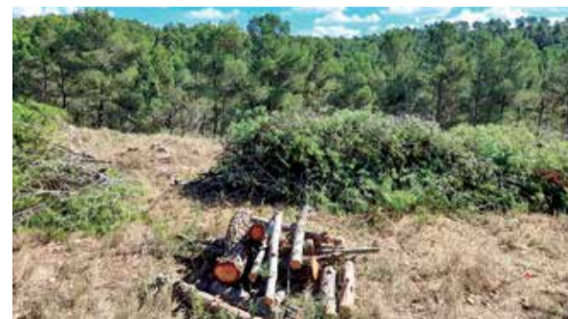
Obras del proyecto Emerge 2021.

Se están realizando tareas de desbroce de zonas sobrepobladas, limpieza de fajas auxiliares, mantenimiento de cortafuegos, entre otros.