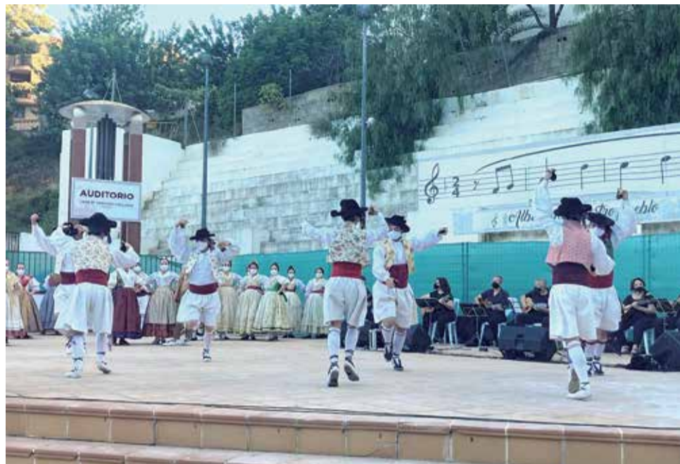
Actuación jota Andurriana./ EPDA

Para dejar constancia del trabajo realizado el Ayuntamiento ha contado con la colaboración del reputado grupo folclórico Les