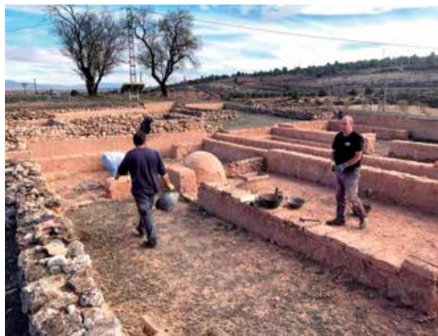
Zona reparada de Kelin.

El recinto arqueológico Kelin ubicado en Caudete de las Fuentes ha pasado por varios procesos de obras en algunas de sus zonas visitables por el deterioro producido por las inclemencias del tiempo. A pesar de ello, no resultan unas obras de gran envergadura. Además, se está llevando a cabo otro de los proyectos pertenecientes para la conservación como es el caso de GEOibers. Desde las redes sociales oficiales del Ayuntamiento han facilitado nueva información sobre las últimas visitas de