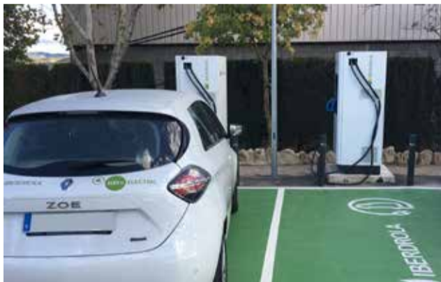
Vehículo eléctrico.