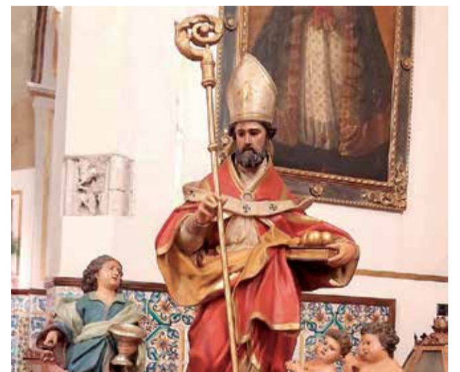
La imagen de San Nicolás.

Volverán a voltear las campanas de San Nicolás para recordar que el patrón de Requena está en la calle.