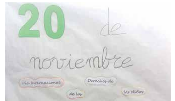
Dibujo conmemoración Día del Niño. / EPDA