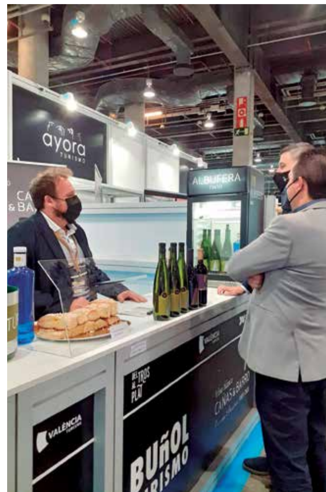
Stand de Buñol Turismo.

Vallés incide en la importancia de continuar abriendo cada vez más campos que sirvan para promocionar y dar a conocer a nuestro entorno más cercano sobre el gran atractivo turístico que tenemos, y no sólo desde el punto de vista cultural o paisajístico sino también gastronómico.