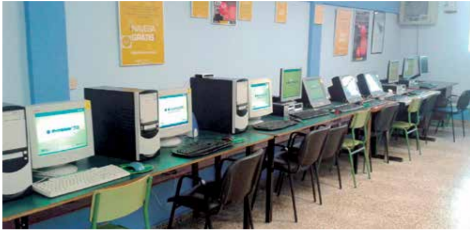
Telecentro de Villargordo del Cabriel.

La Sociedad del conocimiento genera nuevas formas de exclusión para todas aquellas personas que por motivos económicos, educativos o sociales no