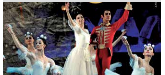
► El Teatro Rambal de Utiel acogerá el 26 de diciembre a las 28:30 horas la obra ‘El Cascanueces’.