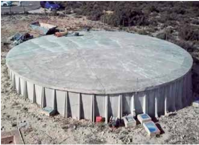
Depósito Bicuerca. / EPDA