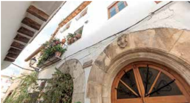
Portal de un edificio del barrio La Villa.

tación de las mismas. De este modo, el plazo de presentación de ofertas será de treinta días naturales, contados desde el día siguiente a la publicación del correspondiente anuncio en PLACE.