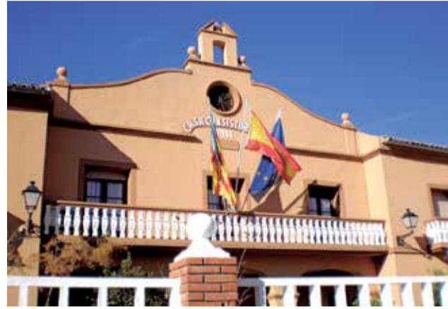
Ayuntamiento Chera.

Esta red tan extensa supone un problema importante para el Ayuntamiento a la hora de controlar las pérdidas en red, y aunque en los últimos años se han ido re-