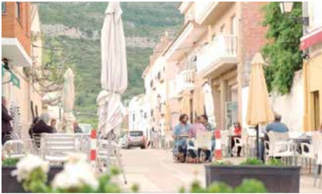
Calle de Chera.