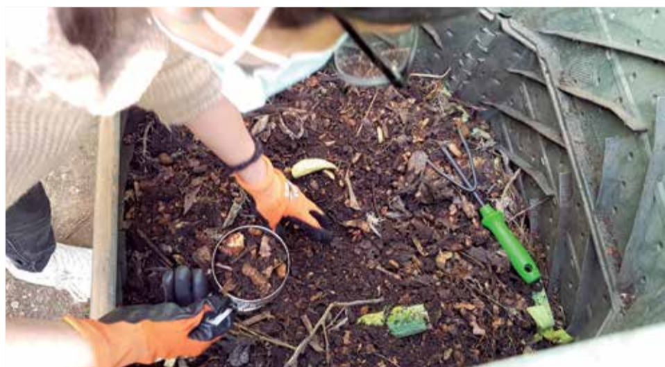
Labores de compostaje.

ga gratuita de una compostera con un código QR personalizado para su vivienda. El QR da acceso a una APP que proporciona asesoramiento de manera personal por parte del equipo de educación ambiental del Consorcio y facilita el seguimiento de la actividad de compostaje. Las familias pueden consultar sus dudas y tienen un acompañamiento en este proceso de gestión de residuos que, en la mayoría de los casos, es nuevo para ellas. El programa abarca la formación, la entrega