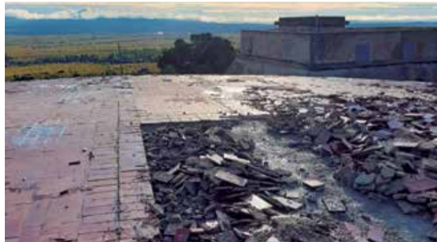
Calles afectadas.

Se ha sufragado con remanentes de tesorería por importe de 44.000€. En la página web del consistorio está la numeración con las calles afectadas, han sido casi todas las del casco urbano. Estas dos últimas nevadas 2017-2020 han deteriorado mucho los viales debido a la retirada de la nieve con las máquinas.