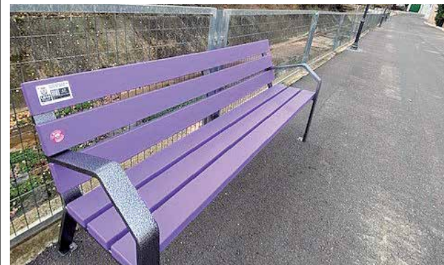
Banco violeta.