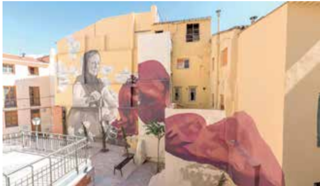
Barrio La Villa de Requena.

- O bien, en formato papel, presentando los sobres en el Negociado de Contratación del Ayuntamiento de Requena en horario de 9 a 14 horas de lunes a viernes, en la forma que se determina en los Pliegos, durante el plazo de presen-