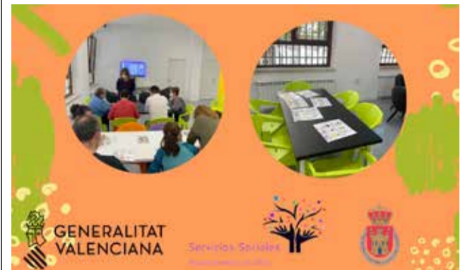
Cartel taller de apoyo a la vida dependiente.