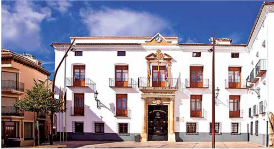
Ayuntamiento de Utiel. / EPDA

En el año 2022 se recuperará el servicio de agua potable mediante gestión directa del Ayuntamiento, al igual que ocurriera con la municipalización del servicio de limpieza viaria. El principal ob-