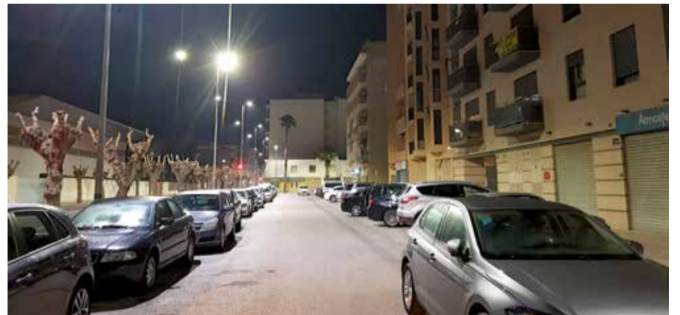
Carrer de Carlet.

Amb les dues actuacions, la de 2019 i esta que es portarà a terme al llarg dels mesos de desembre i gener, l'Ajuntament haurà invertit més de 200.000 € en la millora de l'enllumenat de la ciutat.