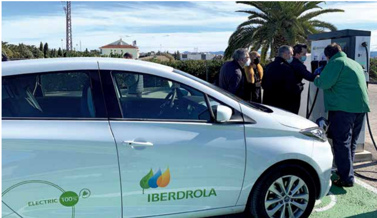
Cotxe de recàrrega ràpida.

El projecte forma part de l'acord aconseguit entre Iberdrola i Restaurant Doménech per a conjuminar esforços en la lluita contra el canvi climàtic i fomentar la sostenibilitat.