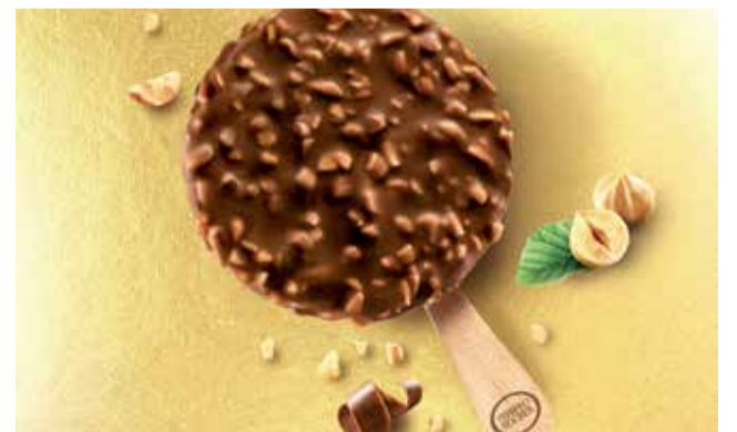
Gelat de Ferrero.

ICFC “per a recolzar els seus objectius estratègics a llarg termini en el mercat de gelats” la relació “ha demostrat ser molt reeixida” i en l’estiu de 2021 s’han produït llançaments de gelats sota les ensenyes Raffaello i Ferrero Rocher. Ferrero, que va nàixer a Itàlia en 1946, compta en l’actualitat amb 31 plantes de producció, 37.000 empleats i una facturació de 12.300 milions d’euros a tot el món.