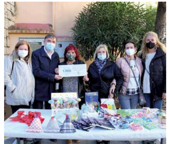
Campanya del Benestar Animal a l'Alcúdia.

L'Ajuntament de l'Alcúdia ha volgut recordar i conscienciar a la població que les mascotes també són del municipi. En la mateixa activitat, al Mercat Municipal i també compartida a les xarxes socials, s'ha promogut el cens municipal de les mascotes.