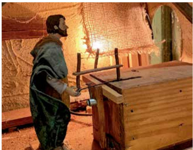
Belén de la Casa Guarner.