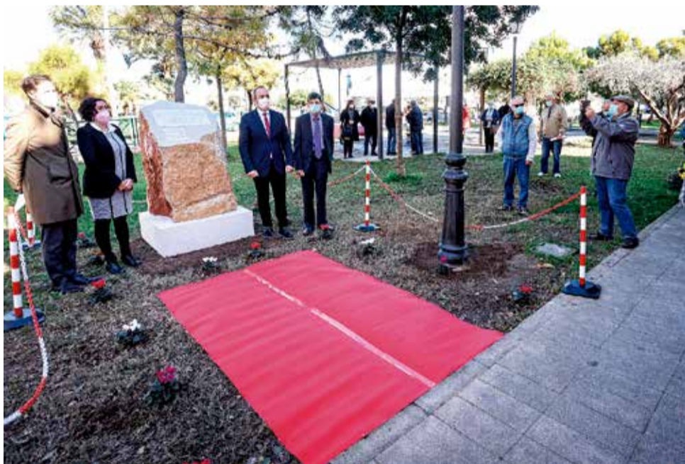
Homenatge a Favara.

Alguns camps de la mort com Mauthausen, Buchenwald, Dachau o Ravensbrück, conegut com L'Infern de les dones, van ser testimoni de l'holocaust valencià.