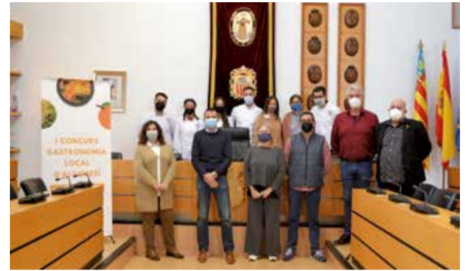
Entrega de premis. / EPDA