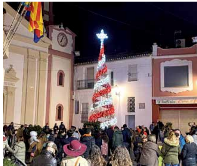
Encesa de les llums al Nadal passat.

Des de l'Ajuntament donem les gràcies a tots per la prudència i us desitgem a tota la població que passeu un Bon Nadal.