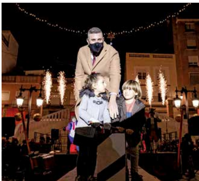
Presentació Nadal a Cullera.

Jardins del Mercat on rebrà a aquells xiquets i xiquetes que desitgen acostar-se a ell i fer-li arribar les seues peticions. Este mateix dia a la vesprada, a les 19 hores, a la sala multiusos del Mercat tindrà lloc la tradicional actuació de la "Murga El Burro". En la vesprada del 26 de desembre se celebrarà a la Casa de la Cultura la representació de "Lu" a càrrec de la companyia Ma-duixa Teatre.