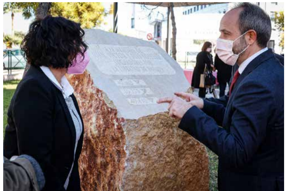
L'alcalde Oro Azorín i el diputat de Memòria Històrica Ramiro Rivera.