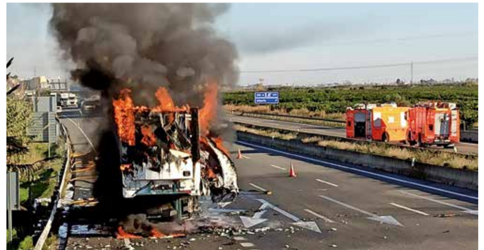
Camión afectado.

Cinco dotaciones del consorcio provincial de bomberos y varios mandos se han trasladado al lugar del accidente, y aunque han dado por controlado el incendio a las 6:10 horas, aunque tardó en declararse extinto dado que se trataba de material inflamable, como disolventes y pinturas.