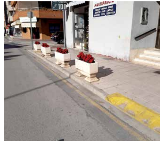
Carrer de El Perelló.

L'actuació està prevista que es realitze a la fi de gener i suposarà la substitució d'un total de 116 lluminàries en les següents zones: parc del Socarrat, carrer Ferrer Cardona, carrer Crevillent i plaça, carrer Juan Ferrer Martí, carrer Vicent Ferrer, carrer Fernández Aguado, carrer Socarrat, carrer Monsent and Bou, avinguda Adolfo Suárez, carrer Arquitecte Lavernia, plaça Roger de Lloria i tres lluminàries i columnes a l'Església.