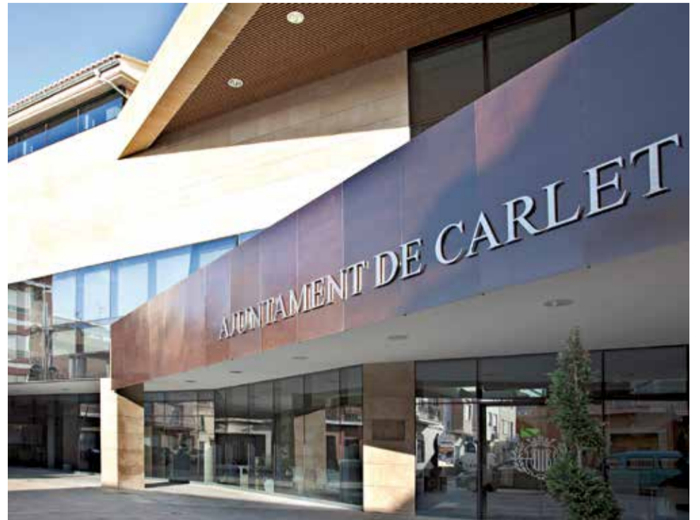
Ajuntament de Carlet./ EPDA

La partida de parcs i jardins, en tràmit d'adjudicar el nou contracte, augmenta en 100.000 €. També s'hi aplica un augment a la partida de la Regidoria de Festes, en vista que en el 2022 es podrien celebrar les Falles i les