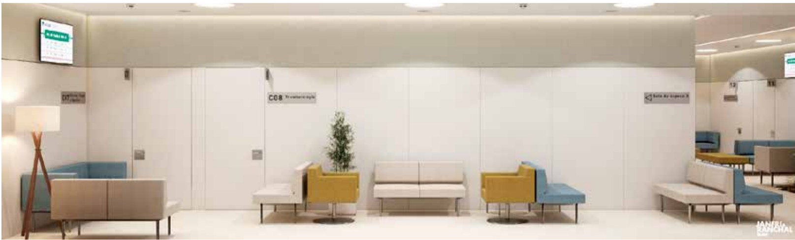
Así será el nuevo centro médico de Vithas en Alzira.