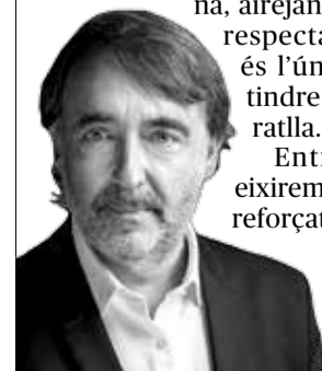
Andreu Salom Porta ALCALDE DE L'ALCÚDIA