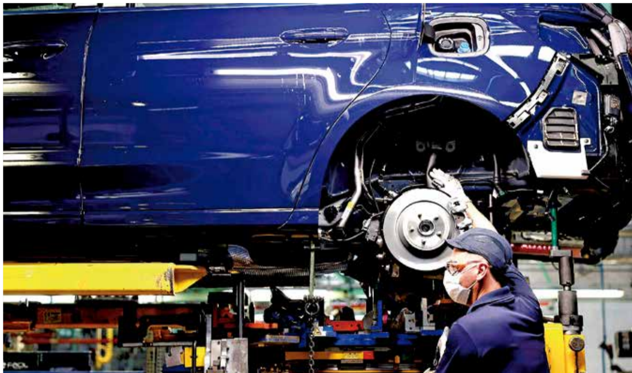
Trabajador de Ford en la factoría de Almussafes.

CCOO considera que mientras la empresa continúe dispuesta a realizar recortes salariales y no dé marcha atrás en sus pretensiones, las protestas previstas seguirán llevándose a cabo, y señala el clima de inestabilidad que actualmente se vive en el polígono industrial Juan Carlos I, agravado por la crisis que sufre el sector del automóvil.