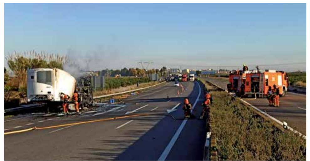
Carretera de la A-7 cortada.