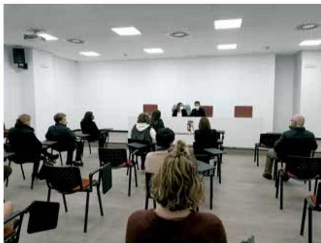
Entrega de premis del comerç local.

Fins al 15 de desembre, les persones que compren en establiments d'Almussafes adherits a la campanya municipal 'Tot al teu poble' rebran un tiquet per a participar en el sorteig d'un total de 70 vals de diferents imports. Amb aquesta proposta, l'Ajuntament invertirà 5.000 euros per a fomentar el consum de productes i serveis en botigues de la població. Com a novetat, enguany s'entregaran més vals per a beneficiar a més persones. Tal com comenta el regidor de Comerç,