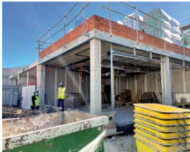
Visita a la residència.

A principis del segon trimestre del pròxim any 2022, la Residència de Majors 'La Vila' inaugurarà la nova ala de l'edifici amb la qual augmentarà en un total de 34 el nombre de places disponibles per al col·lectiu de ma-