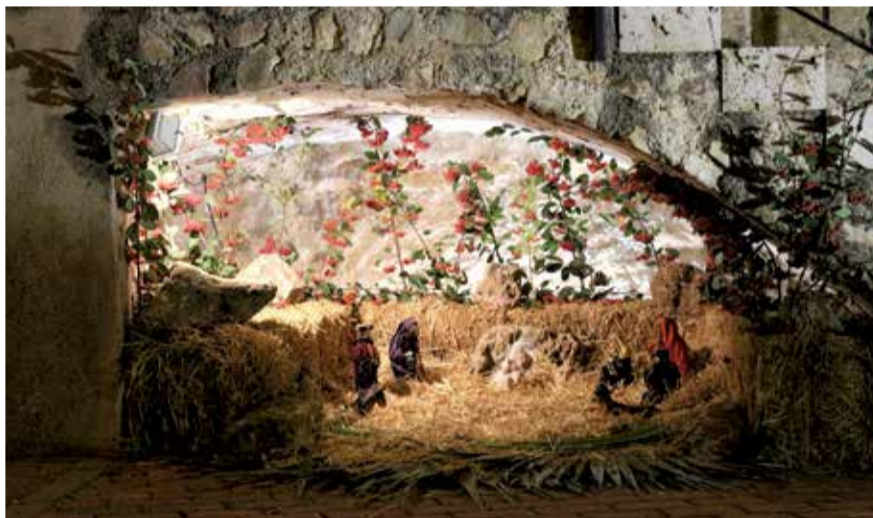
Belén tradicional de Segorbe.

dir cita previa aunque, en cumplimiento de las medidas sanitarias decretadas con motivo de la pandemia, habrá aforo limitado durante el recorrido y será obligatoria la mascarilla. Estará abierto de las 11 a las 14 horas y de las 17 a las 20 horas, de lunes a domingo.