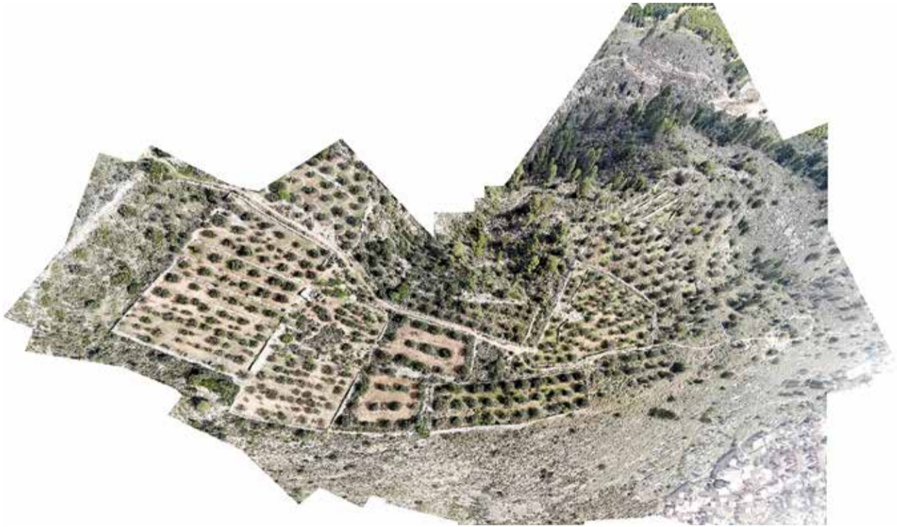
Poblat Iber Creueta Alta.