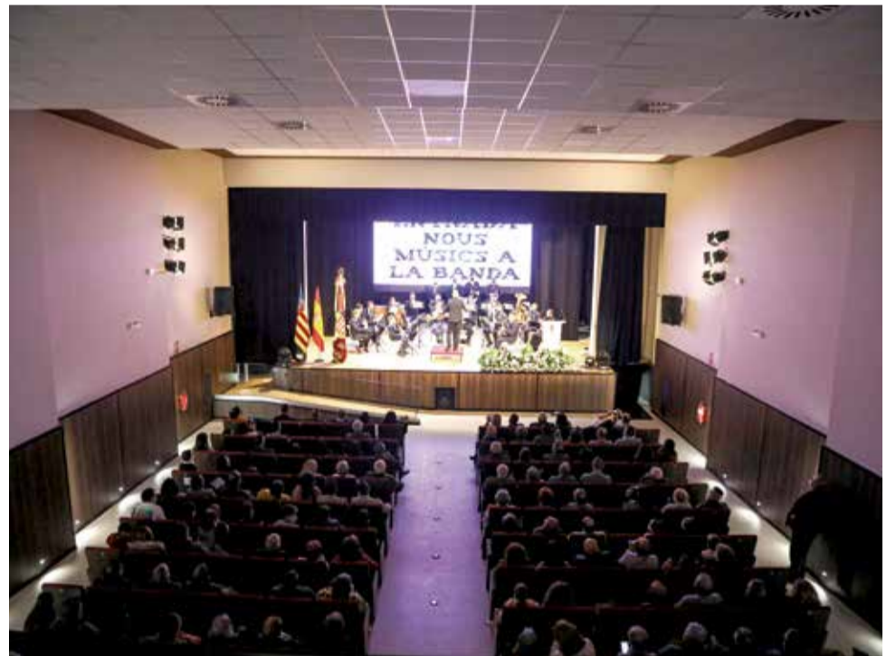
Reobertura del Teatre Municipal.

De fet, els encarregats de comprovar el bon funcionament del teatre van ser els músics de la Unió Musical de Massalavés, que van aprofitar l'ocasió per a donar la benvinguda als nous educands i delectar al públic assistent amb un xicotet concert.