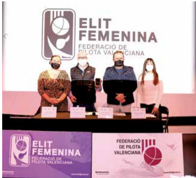
Presentació Elit Femenina a Sueca.

Entre estes partides, que ja s'organitzen entre setmana i el cap de setmana en diferents trinquets, estarà també el Masters Femení, que comptarà amb quatre partides: dues semifinals els dies 10 i 12 de desembre, i la partida del tercer i quart lloc i la gran final, el matí del 18 de desembre.