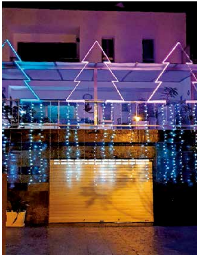
Façana decorada.

Hi ha previstos deu premis per als comerços participants. El primer premi està dotat amb 800 euros i l'assignació d'un estand a la fira comercial, el segon premi amb 500 euros i el tercer, amb 300. Així mateix hi ha altres categories dotades amb un premi de 150.