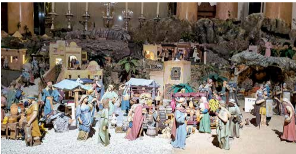
Belén de la Basílica de la Virgen de Valencia.

como típicas escenas de poblados antiguos de Israel, paisajes artísticos con ganado pastoreando y zonas de cultivo.