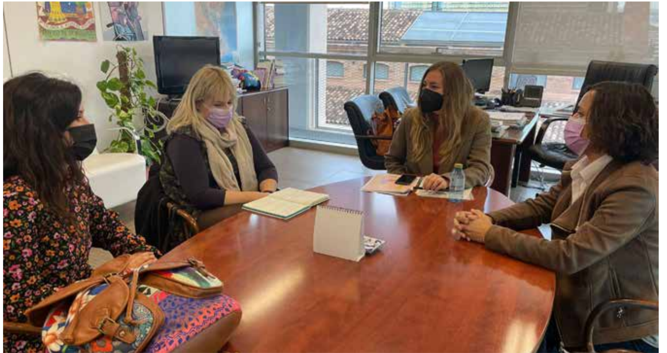
Reunió entre Albocàsser i la Generalitat per Noves Arrels.

EL PROYECTO 'NOVES ARRELS' BUSCA HABILITAR Y PROPORCIONAR UN HOGAR SEGURO Y ESTABLE A LAS MUJERES QUE SON VÍCTIMAS DE VIOLENCIA DE GÉNERO