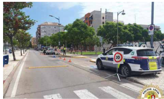
Policia Local. / EPDA