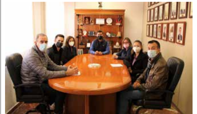
Persones desocupades.