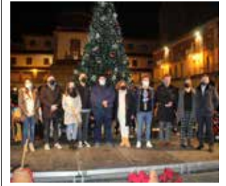
Navidad en Nules.