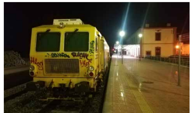
Tren de obras en la estación de Segorbe