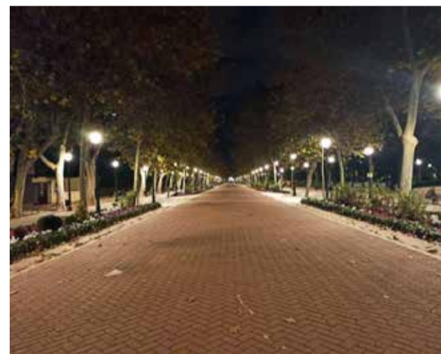
Passeig central del parc Ribalta.

de Castelló evitarà l'emissió a l'atmosfera de 7.373 tones de CO 2 cada any. El canvi és a més intel·ligent, eficient i econòmic: les noves llums duren més del doble que les seues predecessores de vapor de sodi, redueixen el consum energètic en 14,3 Gwh i estalviaran 1,9 milions d'euros en la factura anual de la llum.