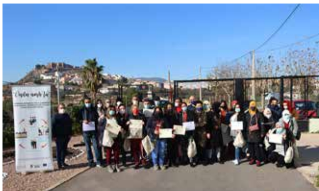
Graduados en Onda.