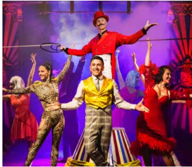
Circo Raluy Legacy.

Lucas, sonido, coreografías únicas, el vanguardismo más actual y lo último en tecnología hacen que TODO (LO)CURA se haya convertido en el espectáculo del momento.