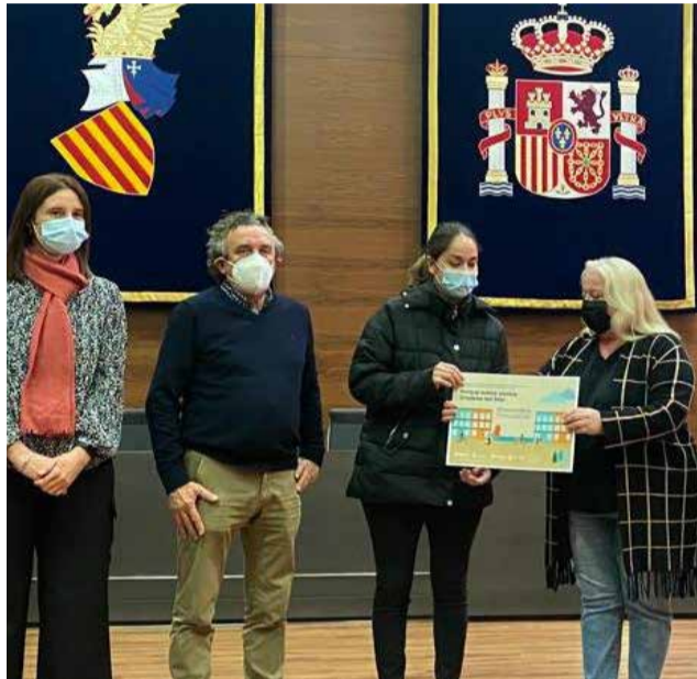
Campaña comercio local.

Cabe destacar que esta campaña ha contado con un