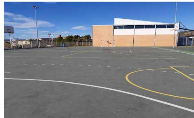
CEIP de Cabanes.