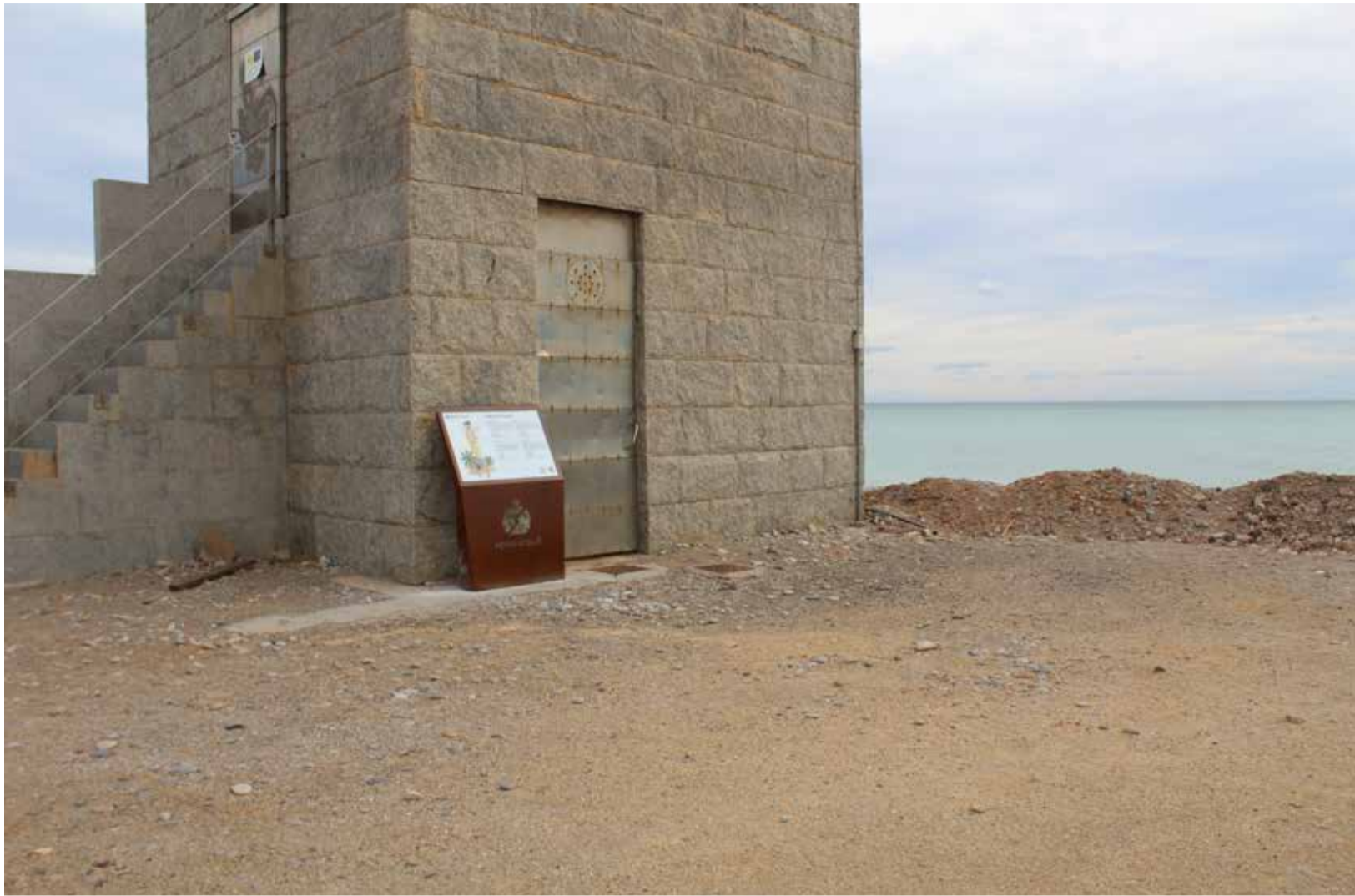
Far de Nules. / EPDA