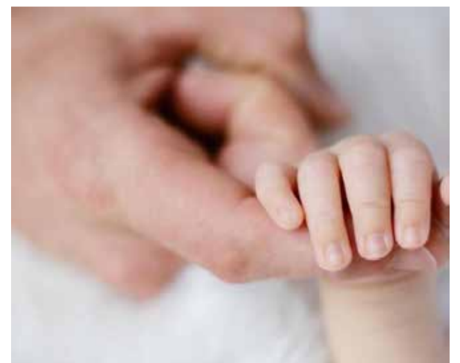
Bebé recién nacido.

El equipo de gobierno de la localidad es consciente de que el nacimiento o adopción de un niño o una niña conllevará unos gastos iniciales a los que las familias tienen que hacer frente.