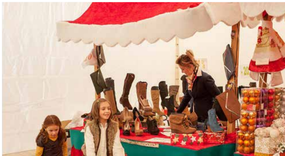
Mercadillo de artesanía en Navidad.

"Ferrero Rocher nos brinda una oportunidad extraordinaria para compartir nuestra ilusión esta Navidad con todo el país. Estas últimas semanas han dado una lección de amistad y solidaridad. Nuestra Navidad mediterránea se ha puesto en valor junto a