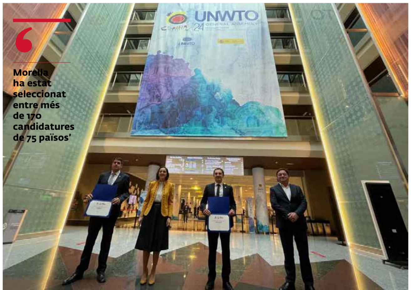
Rebent el reconeixement.

Rhamsés ha destacat que "és un immens honor rebre este reconeixement, que ho és per a tota Morella, i és també un repte il·lusionant formar part d'este projecte tan ambiciós a nivell internacional on tenim l'oportunitat de fer-nos sentir i aportar des del món rural" ha volgut agrair "el gran treball realitzat per l'equip de turisme de l'ajuntament i la corporació amb el suport de Turisme Comunitat Valenciana i, naturalment, de tot el sector turístic i la societat morellana en el seu conjunt". També ha remarcat que "es tracta d'una iniciativa molt important per afrontar problemàtiques comunes que tenim les poblacions d'arreu del món, així com formar part d'una xarxa mundial de desti-