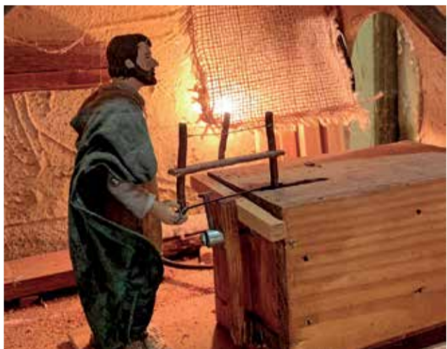
Belén de la Casa Guarner. / EPDA