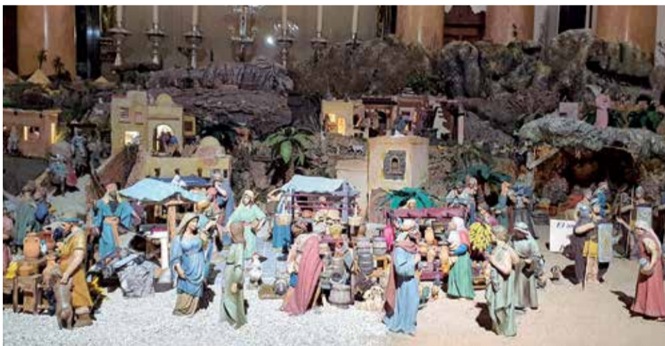
Belén de la Basílica de la Virgen de Valencia.

re del Archivo y que llama la atención de los visitantes por su ubicación. Navajas cuenta también con un Belén muy llamativo por ser de tamaño natural que se cobija bajo el singular olmo que da nombre a la plaza donde se encuentra.