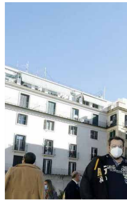
El Belén más grande del mundo, e

gen María 17 metros y el Niño Jesús 3,25 metros.