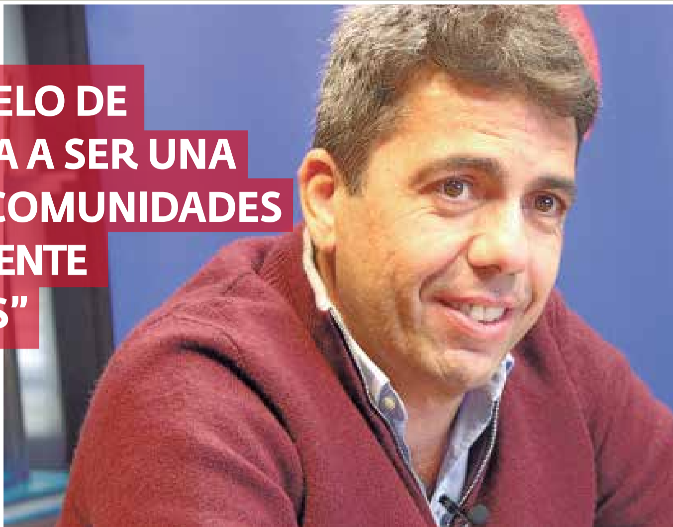
Carlos Mazón, en un instante de la entrevista.

► No veo ninguna incógnita con Toni Cantó. Fuimos capaces de negociar en Alicante en la Diputación y el Ayuntamiento cuando el era el interlocutor de Cs. Toni está haciendo una magnífica labor en la