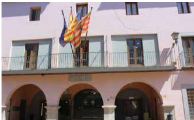
Ajuntament de Moncofa. / EPDA