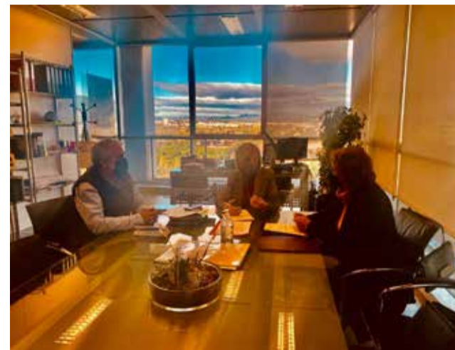
Reunió amb la Generalitat.

En la reunió s'ha avançat sobre els projectes pendents i els que seran abordats en els pròxims exercicis. L'alcalde ha mostrat la seua satisfacció per la inclusió en el projecte de pressupostos de la Generalitat Valenciana d'algunes de les demandes prioritàries del municipi sobre la remodelació integral del port, quant a infraestructures públiques