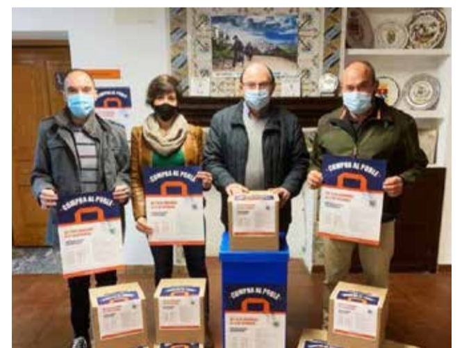
Campaña "Compra al poble!". / EPDA

mera convocatoria, en la que se recogieron «más de 14.000 papeletas, lo que significó un impacto directo de más de 140.000 euros sobre el comercio local». Participar en esta iniciativa es muy fácil y, por supuesto, está abierta tanto a vecinos del municipio como a consumidores de otras localidades.