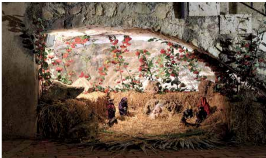
Belén tradicional de Segorbe.