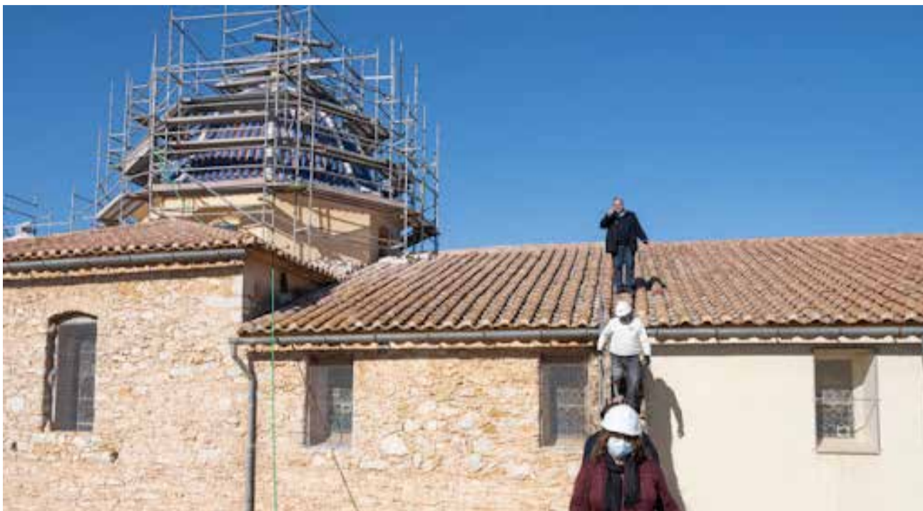
Visita a las obras.