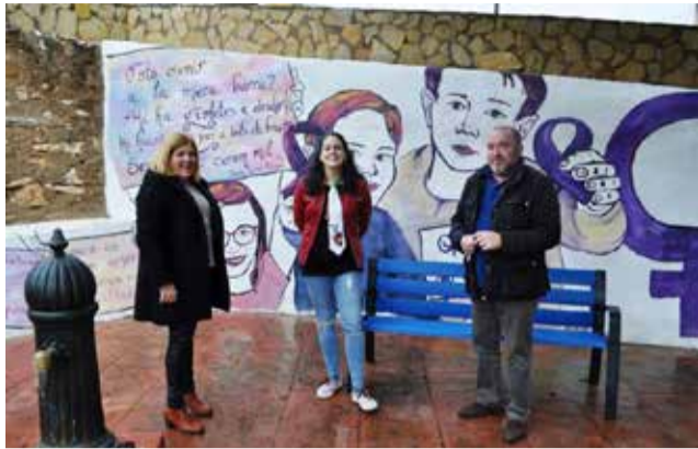
Mural en la plaza de Correntilla.