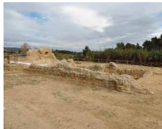
Jaciment de l'Hostalot.

de canvi de cavalls per tal de mantenir un servei postal eficient. Aquesta degué ser construïda al mateix temps que la Via Augusta, entre els anys 15 i 7 a.C. La identificació de l'Hostalot amb la posta Ildvm es reforça amb el suport de la troballa del que fins ara és el mil·liari millor conservat al territori valencià. Els mil·liaris eren columnes de pedra d'una sola peça que informaven de les distàncies mitjançant un camp epigràfic.