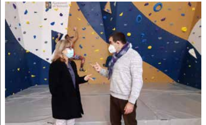
Nou rocòdrom.