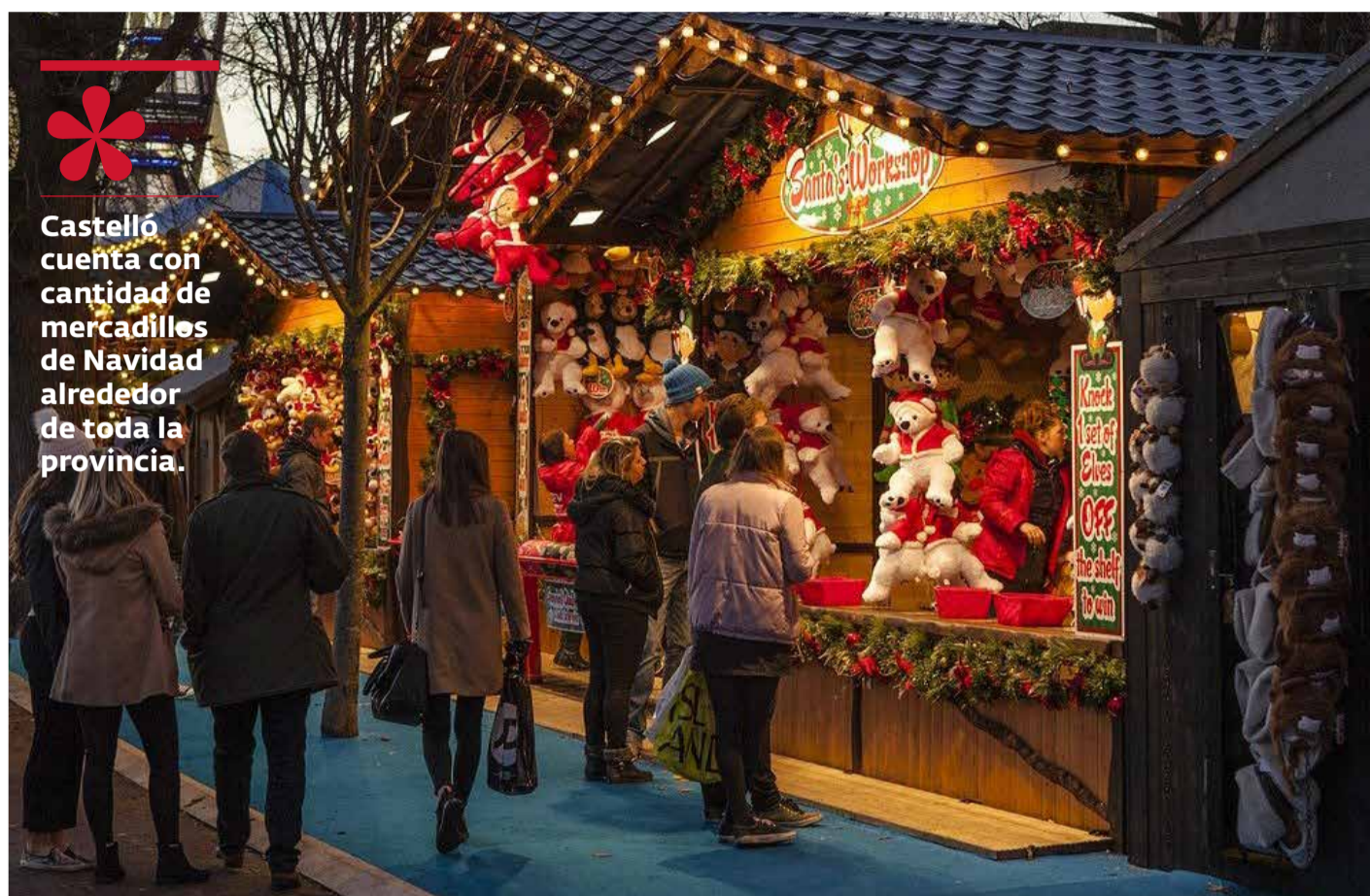
Casetas en el mercado Navideño.