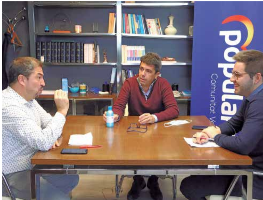
Un instante de la entrevista.

mo una de las más castigadas. ¿Cómo se va a hacer compatible este asunto entre comunidades con diferentes intereses?