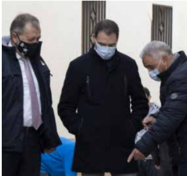
Visita a Xodos.

El presidente de la Diputación, José Martí, y el diputado de Concertación con los Ayuntamientos, Ximo Huguet, se han desplazado a Xodos, localidad en la que la institución provincial ha multiplicado por más de tres las transferencias de recursos a través de fondos y programas con respecto a 2019. En 2021 se han transferido 350.191 euros frente a los 106.520 euros de 2019. Son cifras que, según Martí, «ponen de manifiesto la voluntad de la Diputación de apoyar a los pequeños municipios de interior, para que puedan ofrecer a la ciudadanía los mejores servicios posibles, fijar población al territorio y frenar el éxodo rural». Al respecto, ha añadido que «durante la pandemia hemos intensificado el apoyo porque somos conscientes de que los ayun-