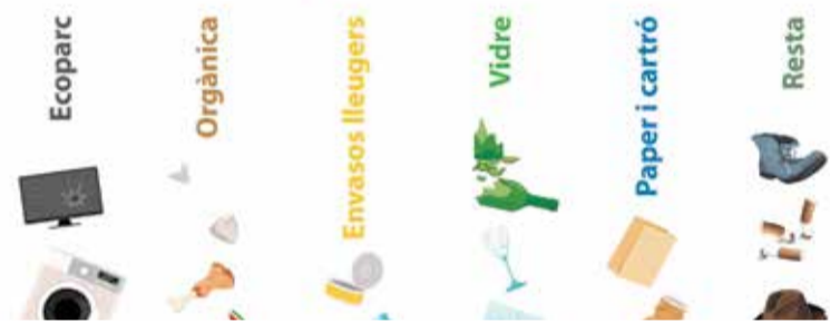
Cartel de la campaña de residuos.

Açò on va? Llança les excuses al contenidor i comença a reciclar!