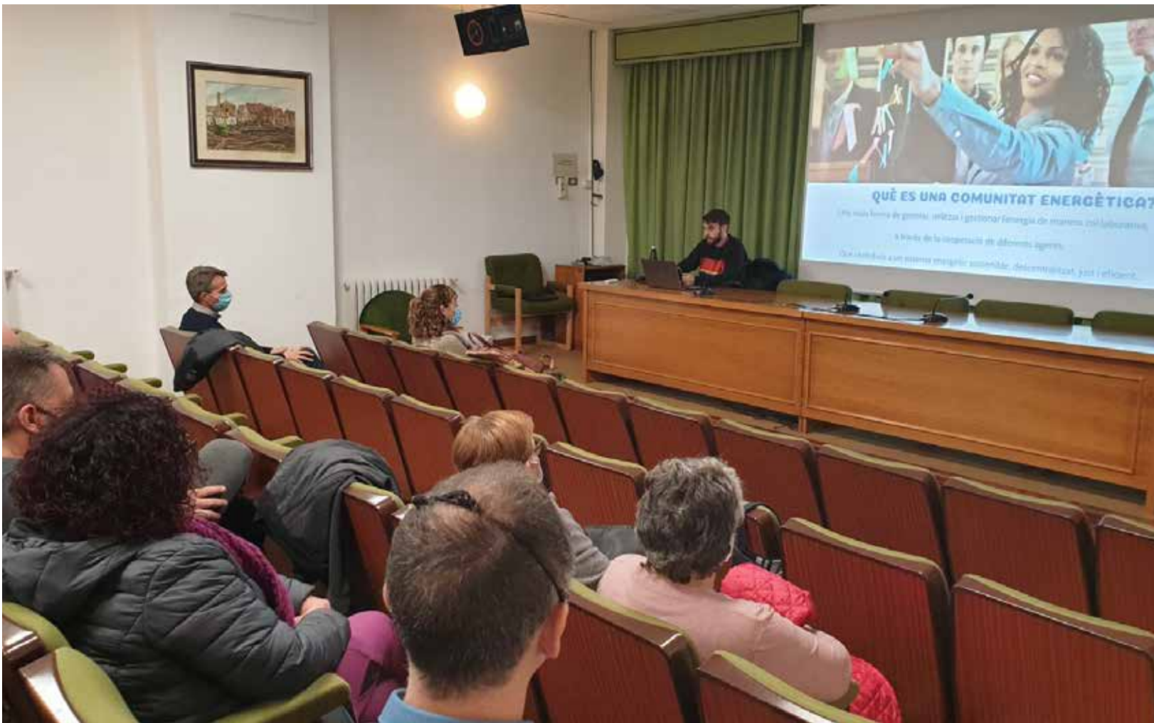
Comunitat Energètica Local a Vilafranca.