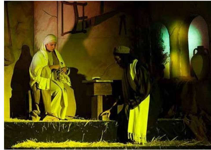
Belén viviente de Castellón.