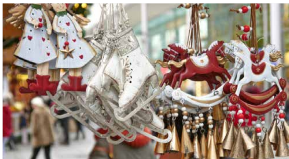
Decoración a la venta en mercadillo Navideño.

tos se colocan en las calles Mayor, San Luis Caballeros y en la Plaza de las Aulas y adyacentes.