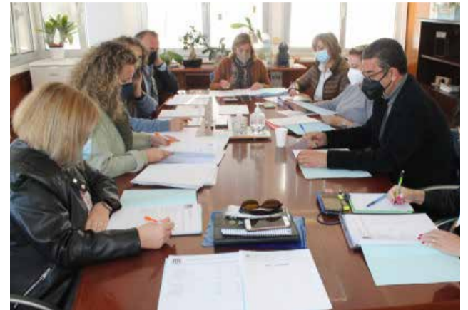
Reunión mantenida.