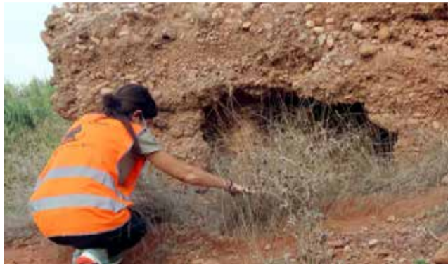
Se ha comprobado la existencia de conejos.