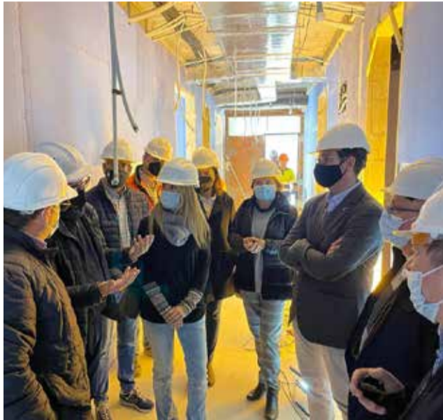
Visita a las obras.

Desde la dirección general de Infraestructuras Edu-