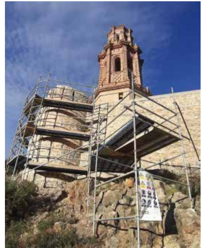
Obras en una de la torres de Jérica.

Montanejos: Proyecto de intervención arqueológica, documentación y equipamiento del castillo de La Alquería, por insuficiencia presupuestaria.