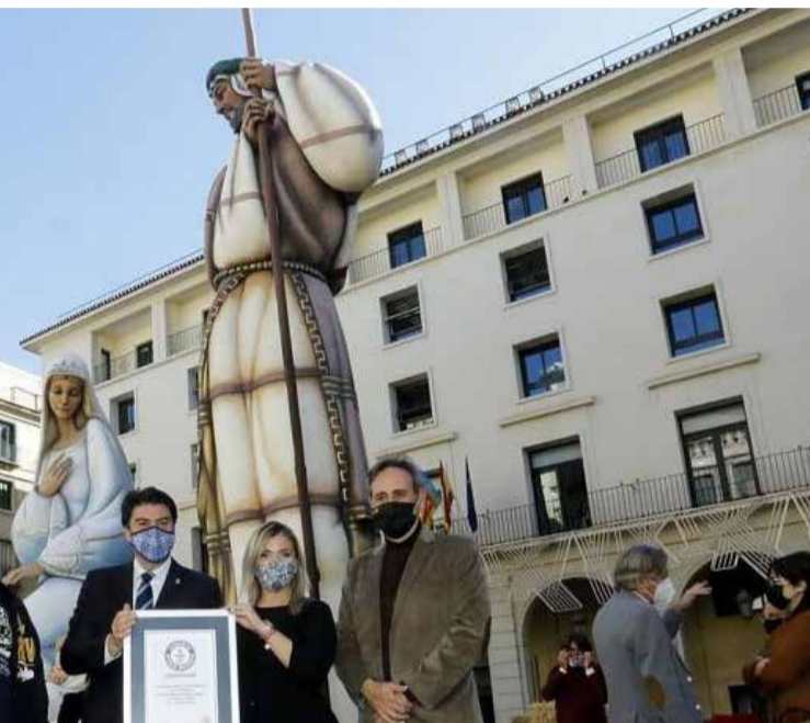
Belén de Alicante con Record Guinness.

► CONCURSO. Muchos municipios crean concursos entre la propia población local.