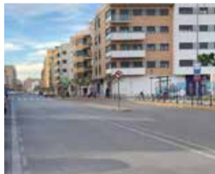
Avinguda de Betxí. / EPDA