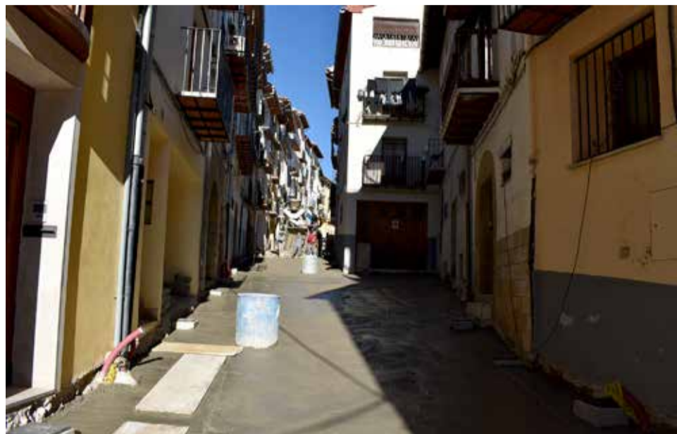
Formigonat de la renovació del carrer Zaporta.

Cal recordar que aquesta obra compta amb un pressupost de 119.000 € i amb un finançament de l'Àrea de Regeneració i Renovació Urbana i el Pla 135 de la Diputació de Castelló, a més dels fons de l'Ajuntament de Morella. Així, s'han renovat completament les instal·lacions soterrades