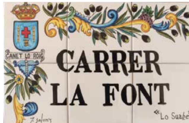
Nuevas placas. / EPDA