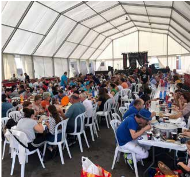
Carpa Recinte Fester Almassora.

Gràcies a la formalització d'aquestes adjudicacions, l'Ajuntament cobrirà el servei de lloguer i muntatge de carpes per a tots els esdeveniments festius de diferents àrees com a Festes, Joventut o Cultura durant els pròxims