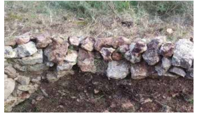
Se realizaron en tierra y roca.