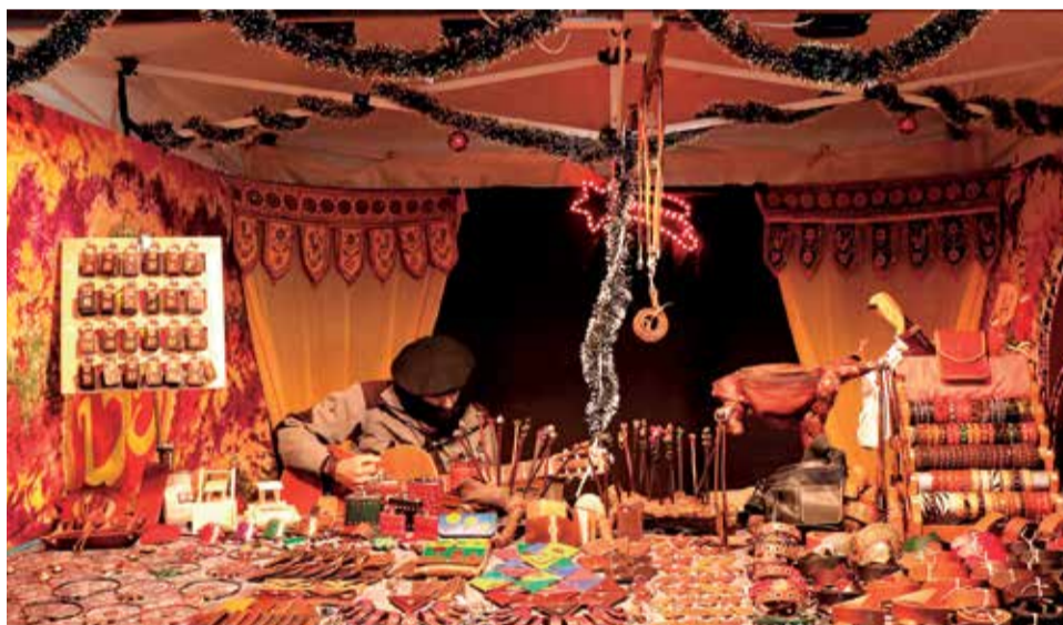
Mercat de Nadal de Sagunt.

Este nadal l'Ajuntament de Sagunt ha apostat per il·luminar els carrers i places de la ciutat amb decoracions modernes, innovadores i ressò responsables en color blanc càlid, daurat i blanc pur com a contrast, segons van destacar des del departament de Comerç i Mercats. Per a això, el Consistori ha incrementat més del doble el pressupost que anys anteriors havia destinat a tal finalitat.