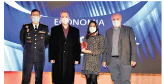
Lepicentre recibe el premio Economía.