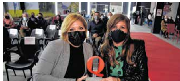
Representantes de Vallscomerç.