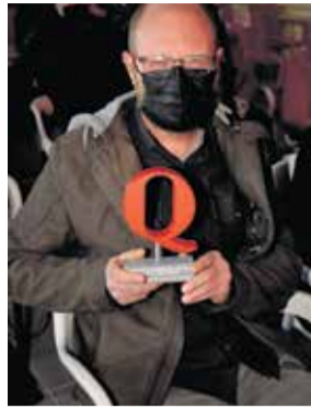
El Gat Negro.