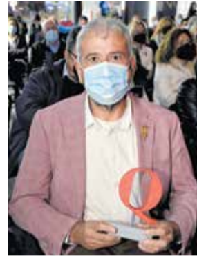
Premio a la FJFS. / P.G.