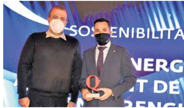
Alcalde de Canet, premio Sostenibilidad.