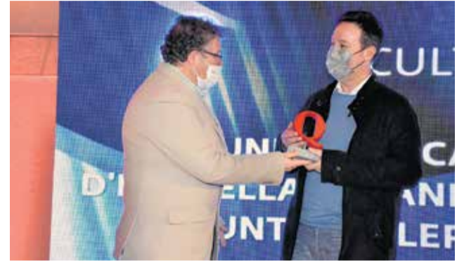
Director UM Estivella, premio Cultura. / PLÁCIDO GONZÁLEZ