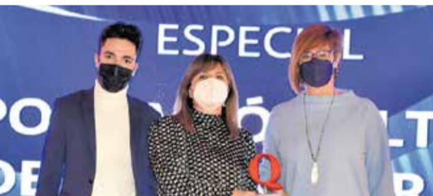
Premio a los Gay Games 2026. / PLÁCIDO GONZÁLEZ