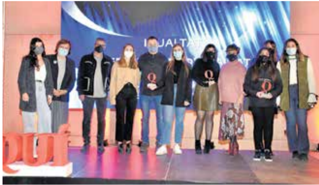
Premio al Estivella CF y al Gilet CF femeninos. / P.G.