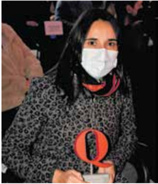
CC Lepicentre. / P.G.