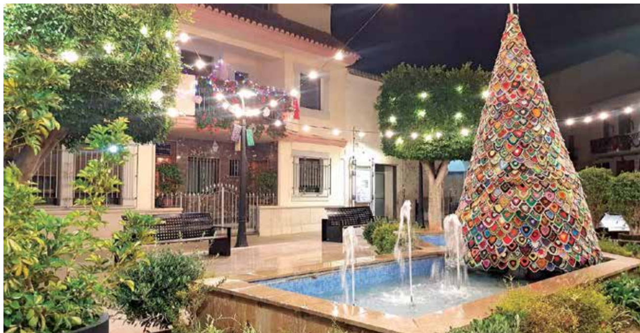
Plaça d'Estivella adornada amb llums i l'arbre de Nadal fet amb ganxillo per dones del poble.

Lendemà, 19 de desembre , a les 18:00h, la Banda Jovenil de la Unió Musical d'Estivella va fer un concert de Nadal. En ell, es va fer el lliurament del premi del II Concurs de balcons, façanes i escaparatades nadalencs. El guardó el va rebre el balcó millor adornat.