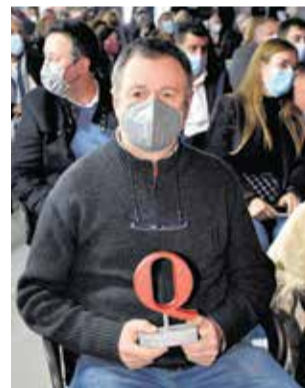
Estivella Club Fútbol.

Por su parte, en la categoría de Fiestas, este año recibían el premio ex aequo las Fiestas Patronales de Algar de Palancia, únicas en Europa por su tradición histórica, y las Juntas de Fiestas Patronales de Sagunt y Port por su organización en la iniciativa Estiu a la Fres-