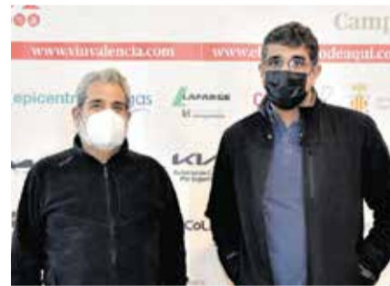
Invitados y premiados a los X Premios del Camp de Morvedre, unos instantes antes de empezar la gala.