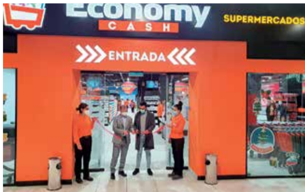
El alcalde de Sagunt inaugura el Economy Cash.

La inauguración de la ampliación de Lepilandia , vio la luz recientemente con la X edición de los premios de El Periódico DE AQUÍ, donde se