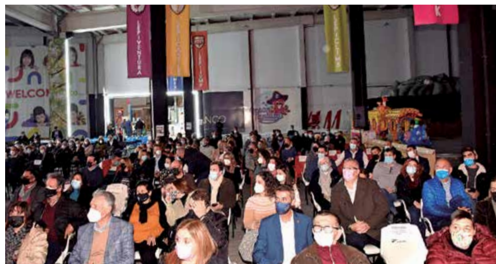
Una part del públic assistent en un moment de la gala.

Però també he de dir que som un periòdic plural, gratuït, que fem i donem un servici a la societat del Camp de Morvedre, tant al paper quinzenal, com a la web, Elperiodicodeaquí.com, una web de qualitat i sense mur de pagament. Ha quedat patent en temps tan difícils com els mesos més durs de pandèmia, sense anar més lluny. Heu de comprendre que vivim de la publicitat i que en este apartat hem de continuar lluitant i ser constants. Vos demane comprensió i col·laboració perquè este diari siga complint ixa missió de notari de tot lo que passa a la comarca, que sí, que no som perfectes, però sempre estarem a la vostra disposició, en les portes de la nostra redacció obertes per a tots i totes -que no agarrem un telèfon, vingau directament a la redacció!- i fent un treball