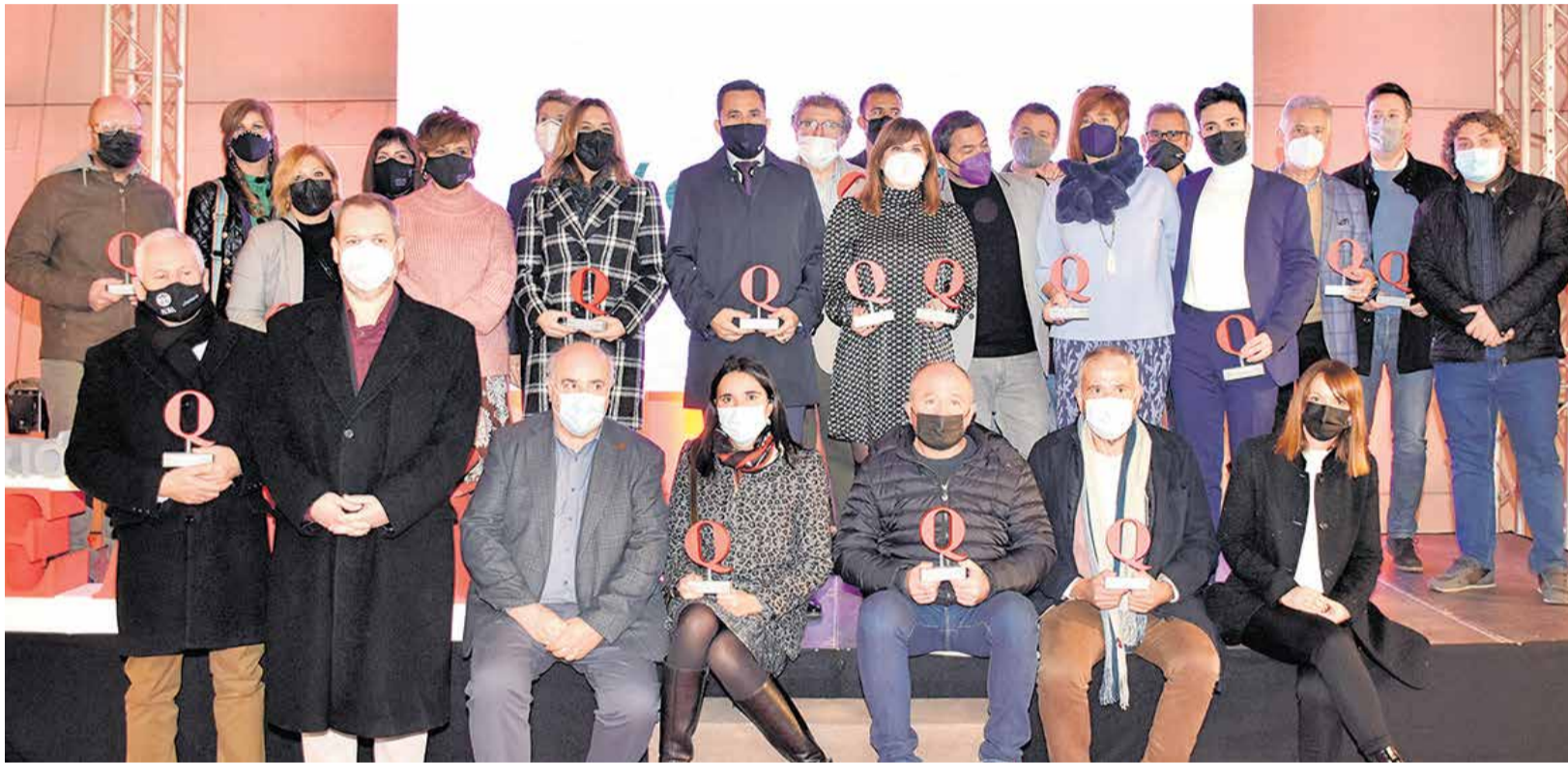
Instantánea de todos los premiados después de la gala en el Camp de Morvedre.

■ MÁS DE 300 PERSONAS ASISTEN AL EVENTO QUE CELEBRA EL MEDIO DE COMUNICACIÓN EN SU DÉCIMO ANIVERSARIO EN LAS INSTALACIONES DEL CENTRO COMERCIAL LEPICENTRE