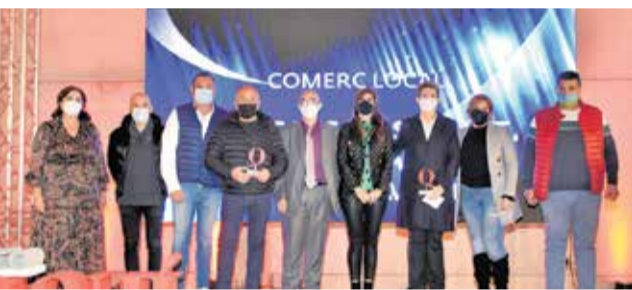
Premio a los mercados ambulantes saguntinos. / P.G.