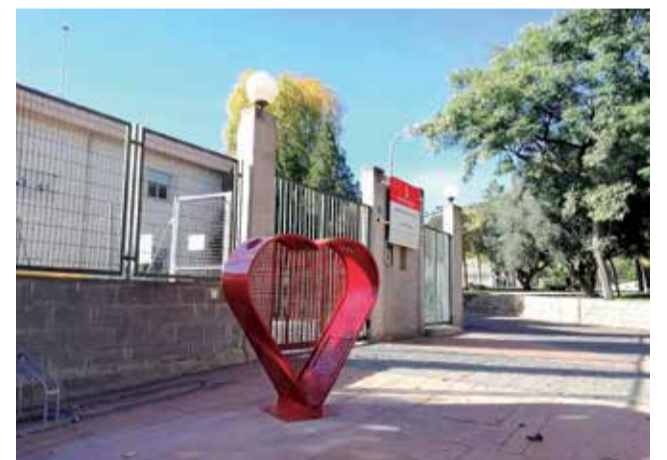
El 'Cor Solidari' a Algímia.

Comptem amb les vostres aportacions! Comptem amb la vostra solidaritat!