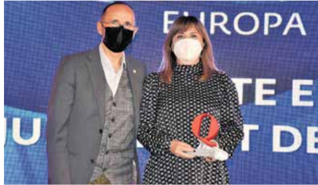
Premio Edusi, premio Europa al Ayto de Sagunt.