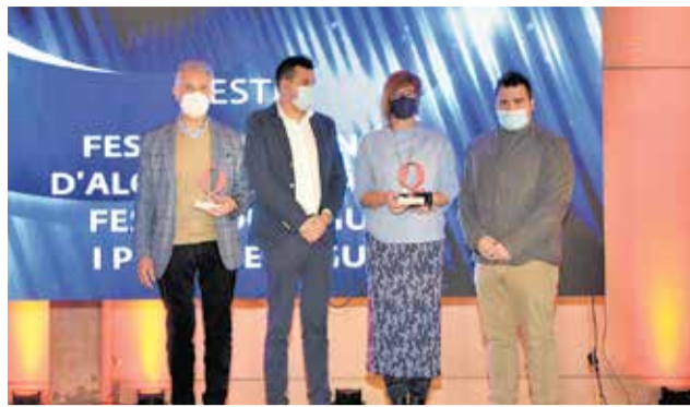
Premio Fiestas a Algar y a Sagunt. / PLÁCIDO GONZÁLEZ