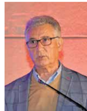
Alcalde de Algar. / P.G.