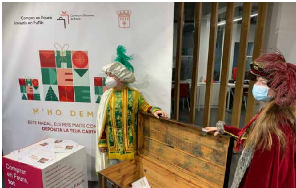
Campanya 'M'ho demane' a Faura l'any passat.

Entre les activitats que formen part d'aquesta campanya destaca per antiguitat el concurs d'aparadors nadalencs, que arriba a la seua dècima edició, i amb què, a més de crear un ambient nadalenc i festiu al poble, es tracta de dinamitzar i posar en valor el comerç de proximi-