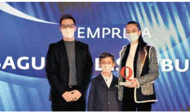
Reciben el premio a Sagunto Distribución.