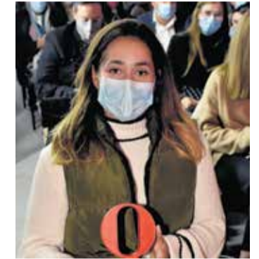
Premio al Gilet CF. / P.G.