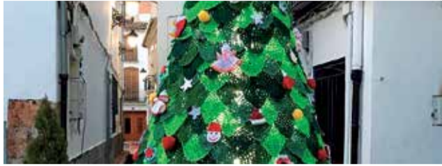
Abre de Nadal als carrers d'Algar.

El Nadal ha arribat a Algar de Palància. Des de l'Ajuntament s'ha presentat tota una diversitat d'activitats que compliran totes les mesures de seguretat establides per Sanitat. La programació finalitzarà amb la tradicional cavalcada dels Reis Mags el dia 5.