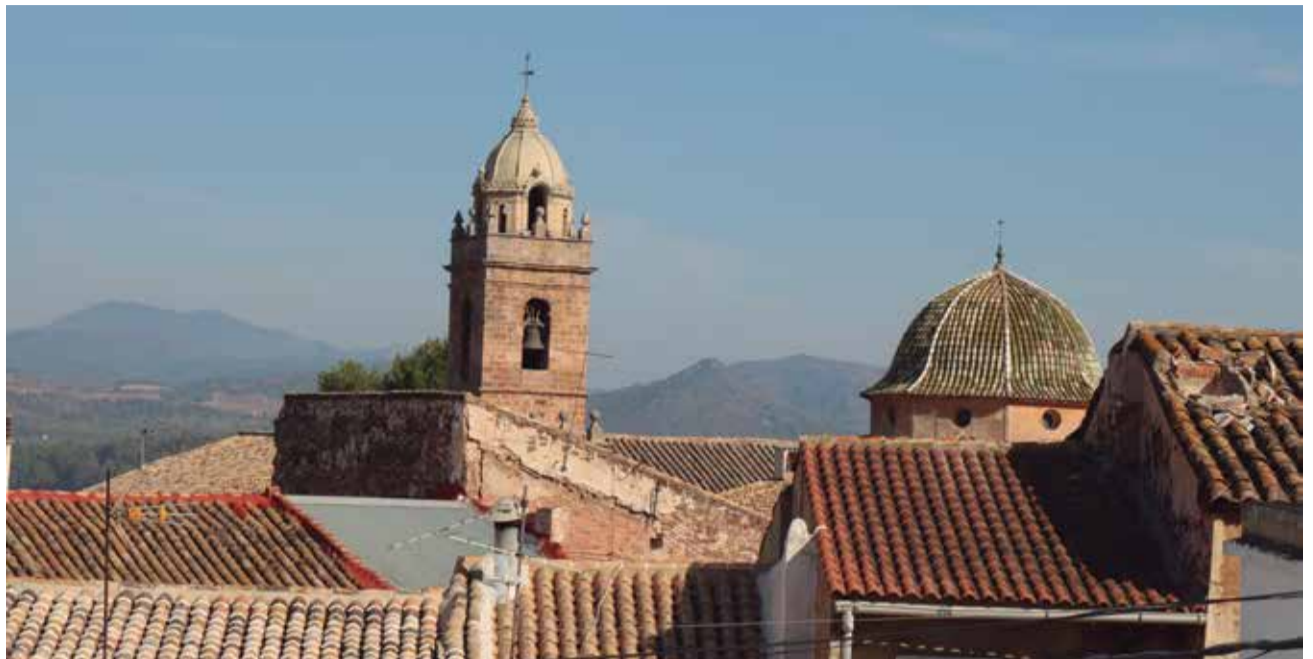
Vista panoràmica de l'Església de Torres Torres. / BORJA PEDRÓS