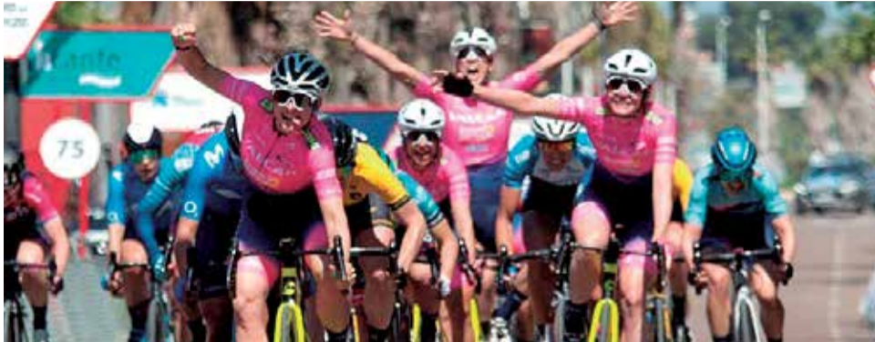
Vuelta CV Femeninas el año pasado.

La etapa Sagunt-Valencia tendrá este año un recorrido