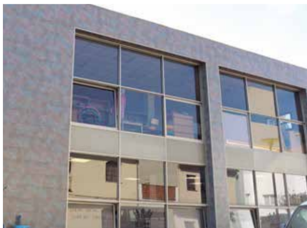
Llar del Jubilat de Torres Torres.