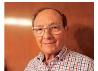
Ramón Corominas / EPDA