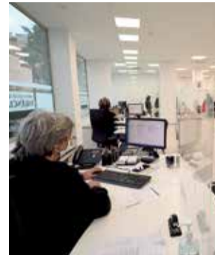
Oficina semejante.

La corporación provincial ha hecho públicas las condiciones de un contrato que asciende a los 55.000 euros anuales. Los propietarios interesados en arrendar su lo-