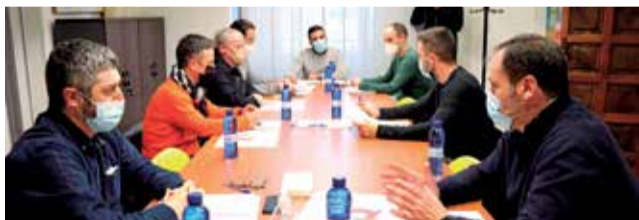
Todos los portavoces políticos y el alcalde.

■ EN UNA REUNIÓN, CADA PARTIDO TRASLADA SUS APORTACIONES PARA PLANTEAR A LA APV