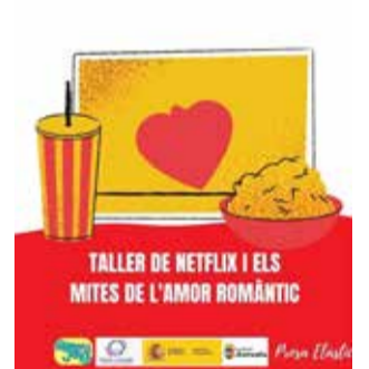
Cartel. / EPDA