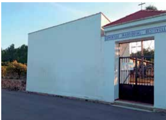
El cementerio y, a la izquierda, el terreno.

Corría el año 2011 cuando a la familia de la mujer donante, ya fallecida en ese momento, el párroco les requirió hacer la escritura para legalizar la donación ante un notario. Así se hizo, presentándose en la Notaría elegida por la Parroquia y con confianza plena que la minuta reflejaba los metros donados 718 m 2 , así como la situación geográfica, dada su relación con la Parroquia, que firmaban, y cumpliendo la voluntad de su esposa y madre.