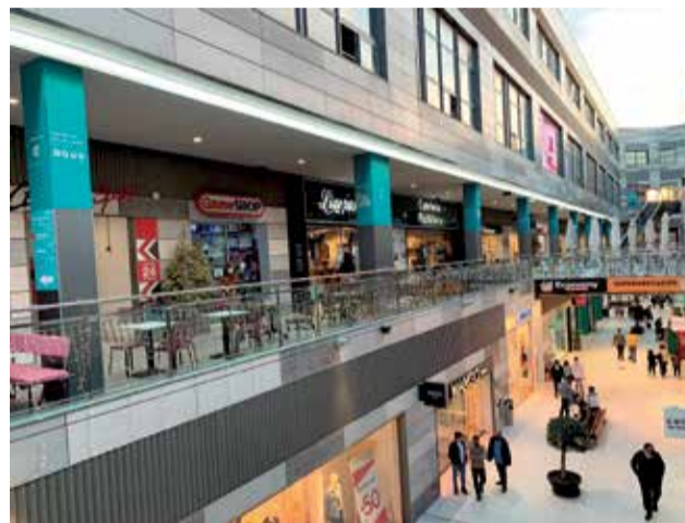
Interior de las instalaciones de Lepicentre.

Estas nuevas aperturas se unirán a las ya anunciadas hace pocas semanas como la gran apertura de Deichmann el próximo 3 de Marzo, empresa alemana especializada en el sector del calzado, con una gran variedad de zapatos de tendencia para mujer, hombre y niños, y un amplio compromiso con la calidad y el precio, que además aportará 15 puestos nuevos de trabajo a