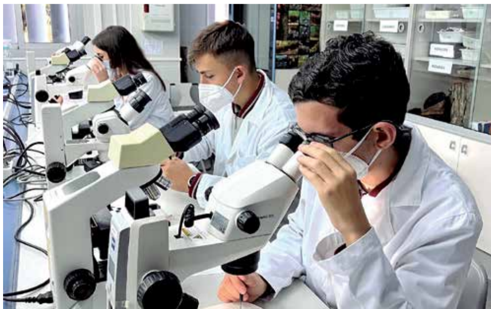
Alumnos de infantil y de secundaria en el Colegio Camarena Canet.