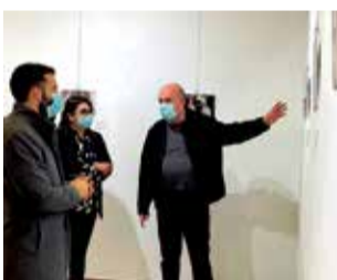
Inauguración. / EPDA