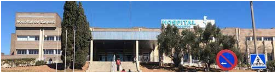
Fachada del hospital de Sagunt.