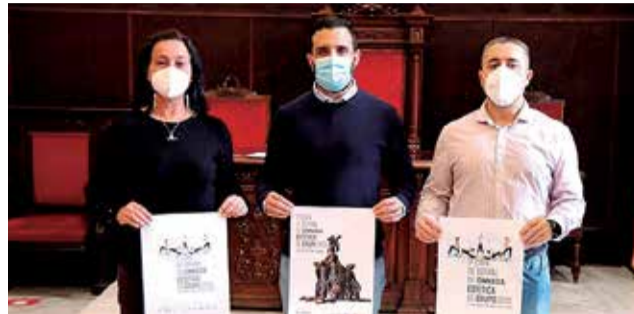
Directora de la competición, alcalde y concejal.

Este campeonato está organizado por la Asociación Española de Gimnasia Estética de Grupo (AEGEG) y el departamento de Actividad Física, Salud y Deportes del Ayuntamiento de Sagunt. Participan casi 300 gimnastas pertenecientes a 37 equipos de 19 clubes procedentes de siete comunidades autónomas y sirve para clasificarse para la World Cup I - Challenge Cup I que se celebrará en Estonia y para la World Cup II - Challenge, en Kazajistán. Se disputará en las categorías de senior femenina, masculi-