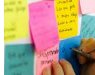
Cartel. / EPDA