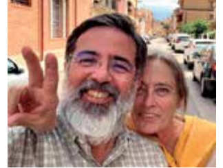
Castelló y su mujer.