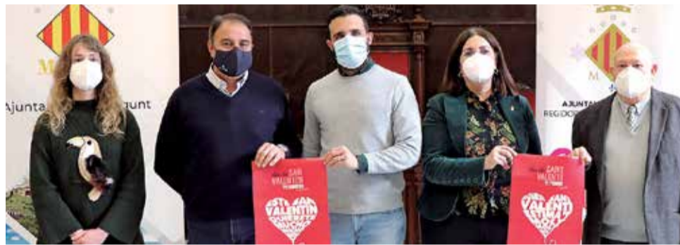
Presentación de la campaña en el Ayuntamiento de Sagunt.

También se ha preparado una cuña publicitaria tanto en castellano como en valenciano para que se publique en Onda Cero. El objetivo principal de la campaña es que la ciudadanía se conciencie de la importancia y la necesidad de consumir en el comercio local y de proxi-