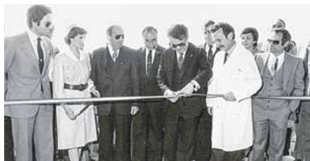
La fachada del Hospital de Sagunt, el primer parto en el hospital en 1982 y su inauguración.