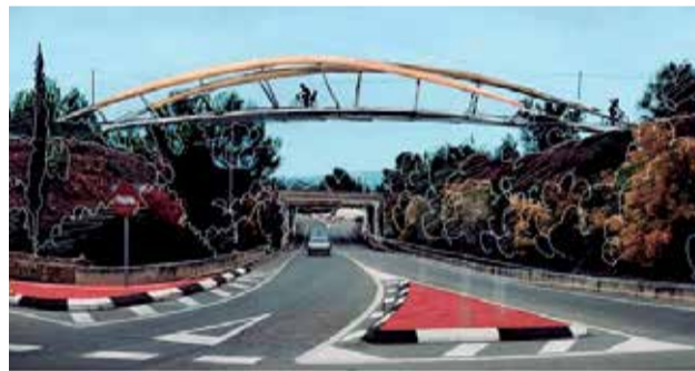
Pasarela de Albalat.

Por otro lado, desde la primavera de 2002, se encuentra en funcionamiento el trazado de la Vía Verde de Ojos