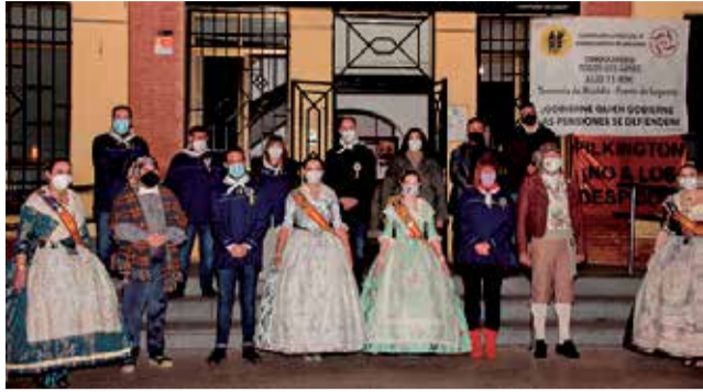
Falleres mayores, representantes y autoridades.