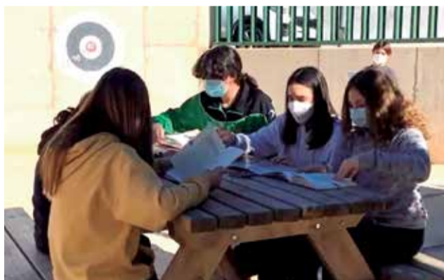
Un 'frame' del vídeo promocional.