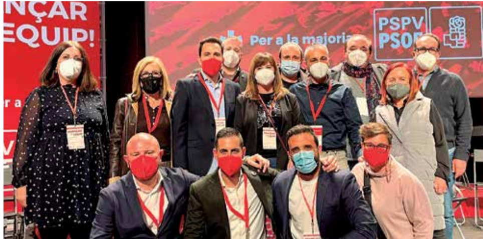
Los socialistas del Camp de Morvedre que forman parte de la ejecutiva.

Además, Toni Gaspar, presidente de la Diputació de