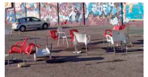
Estado en el que se encuentran los propietarios las instalaciones cada domingo.