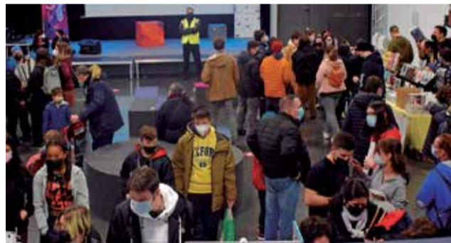
Instantánea del festival Mangetsu en Sagunt.

La programación para esta séptima edición contó con una gran variedad de actividades en las que participar, como por ejemplo concursos de baile, karaoke, dibujo y conocimientos de anime y manga, junto a talleres de caligrafía, cocina, kendo, origami, dibujo manga, además de exhibiciones de baile, random dance, judo y esgrima. Al igual que en ediciones anteriores, hubo un espacio dedicado a videojuegos, juegos de mesa, photocall, stands de venta de artículos relacionados, manga y ani-