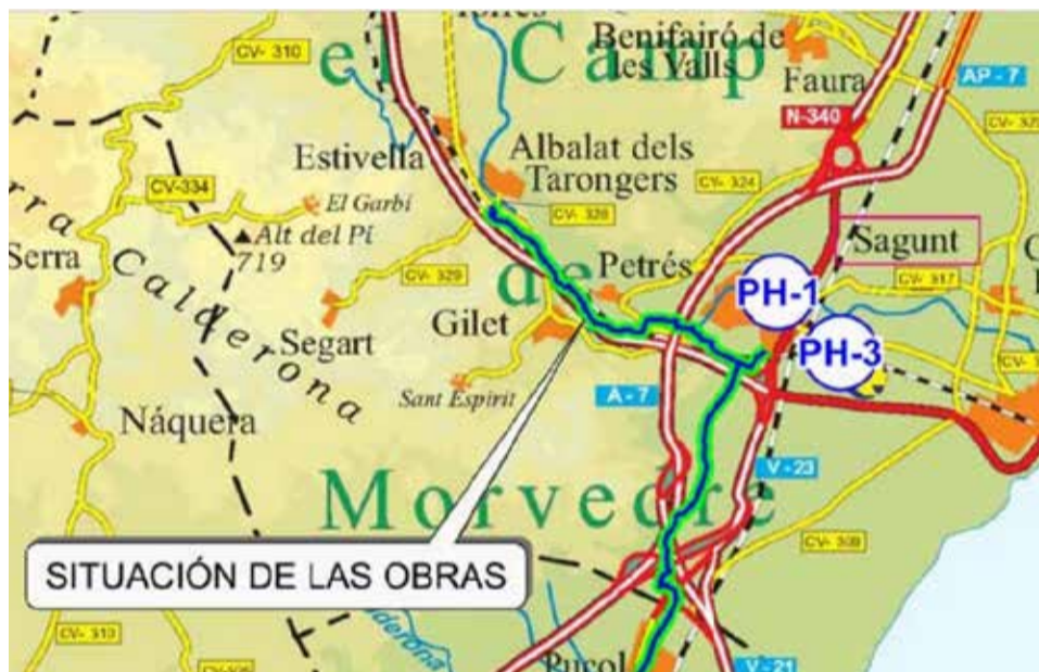
Mapa del tramo de obras de la unión de las obras de la Vía Verde y Xurra.

El conseller de Política Territorial destacó “la apuesta clara del Consell por la movilidad de ciclistas y peatones, elementos clave de una movilidad cada día más verde, más respetuosa con el medio ambien-