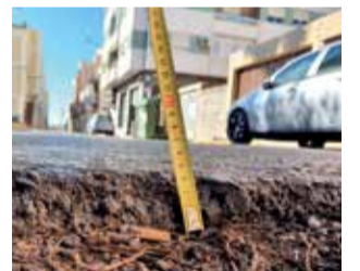
Un socavón.