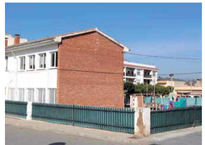
Guarderia de Torres Torres.

Eixes polítiques d'esquerra han sigut molt beneficioses. Pense que en els anys que ha estat el PP en la Mancomunitat, l'única cosa que feia era cobrar el fem. I, a més, en realitat, tot i que el meu partit siga independent, jo sóc d'esquerres. En estos pobles pense que és molt important que governe l'esquerra. També he notat canvi en les subvencions; jo, quan vaig