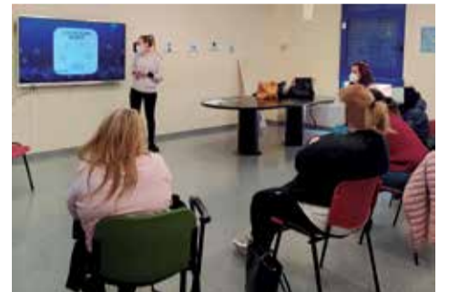
Talleres puestos en marcha.

Debido a las restricciones COVID, el grupo ha tenido que limitarse a un máximo de 10 personas. No obstante, con la relajación de las restricciones, se espera poder llevar a cabo iniciativas similares abiertas a todas las mujeres que puedan estar interesadas.