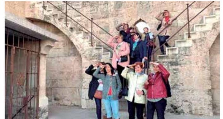
Algunes activitats organitzades a Albalat altres anys (abans de la pandèmia) pel Dia de la Dona.