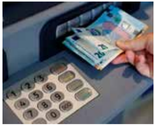
Extracció de diners.