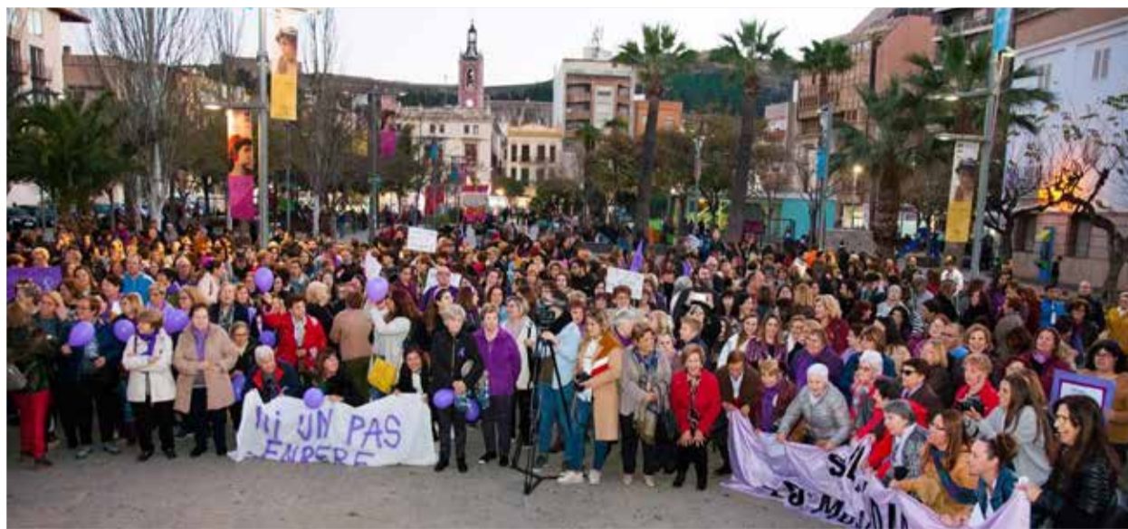
Concentración feminista por el 8M en la plaza Cronista Chabret, Sagunt.

La violencia machista sigue sin darnos tregua, cada día en nuestro país las mujeres sufrimos agresiones físicas, psicológicas o sexuales y discriminaciones por nuestra condición de mujeres. En lo que llevamos de 2022, hemos presenciado 12 feminicidios en nuestro país. En 2021 hubo 78 feminicidios y se registraron más 400.000 actos de violencia sexual. Es una realidad que no podemos soportar más. Es el momento de que el movi-