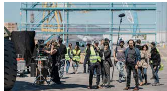
Rodaje en Sagunt de la serie ‘Perdida’.