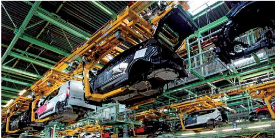
Factoría Ford de Almussafes.