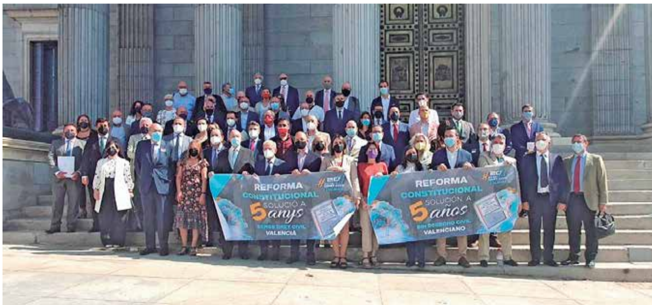
Concentración frente al Congreso de los Diputados.

Para los firmantes "es necesario que el Presidente de los valencianos, y quien aspire a serlo, se implique directamente en la recuperación