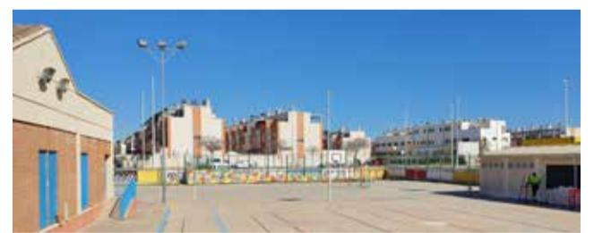
Patio del colegio la Pinaeta.

■ VOX SOLICITA LA AMPLIAR EL PATIO E INSTALAR UN SOMBRAJE: “UNA MOCIÓN YA SE PIDIÓ Y NO HA LLEGADO”