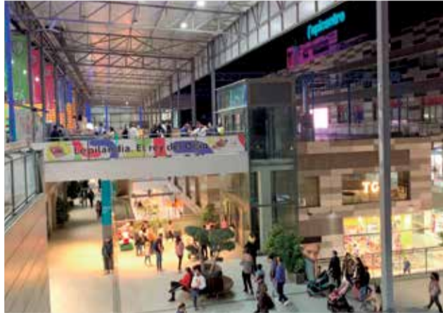
Interior de las instalaciones de Lepicentre.

La nueva tienda incorpora además una zona dedicada íntegramente al deporte para hombre y mujer, donde encontramos zapatillas de las principales marcas deportivas internacionales como Adidas, Fila, Nike, Puma, Reebok o Skechers. Los clientes también podrán encontrar una zona dedicada a las últimas tendencias en calzado y accesorios con modelos variados para ir a la última moda. El establecimiento se ha dise-