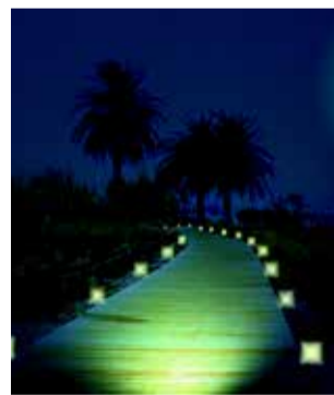
Propuesta de IP. / EPDA

En cuanto a la primera propuesta, IP alega que en los últimos años el sendero ha aumentado su concurrencia, pero “cuando llega la noche es imposible transitar” por él. “Los vecinos se ven obligados a volver por la noche en coche”, añaden. Así, IP pide “estudiar la instalación de