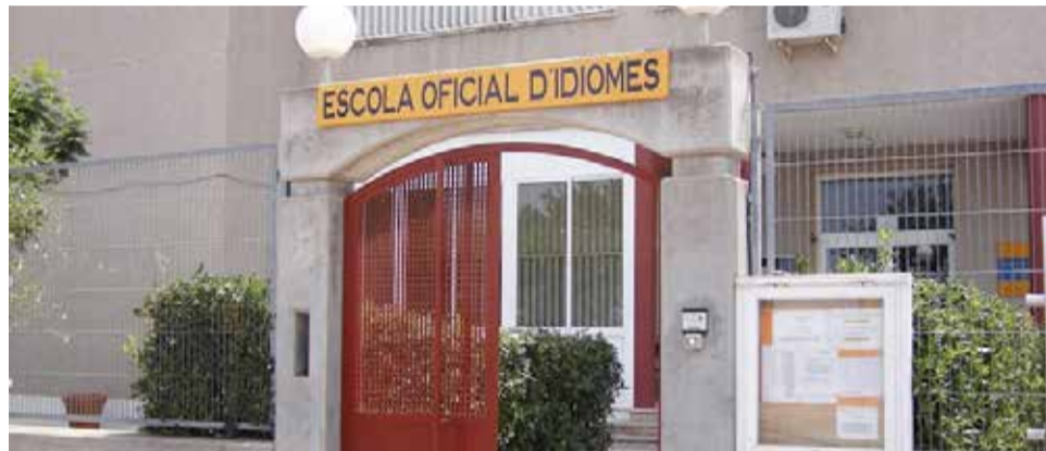
Façana de l'Escola Oficial d'Idiomes de Sagunt.

El període de matriculació telemàtica per a l'alumnat PUC lliure de tots els idiomes, excepte anglés i valencià, serà des de les 10.00 hores del dia 21 de febrer fins a les 23.59 hores del dia 28 de febrer, sense necessitat de petició prèvia de torn. L'enllaç del procediment telemàtic d'este alumnat es pot trobar a la pàgina: https://proveseoi.gva.es . En cas dels idiomes anglés i valencià de tots els nivells caldrà fer una sol·licitut