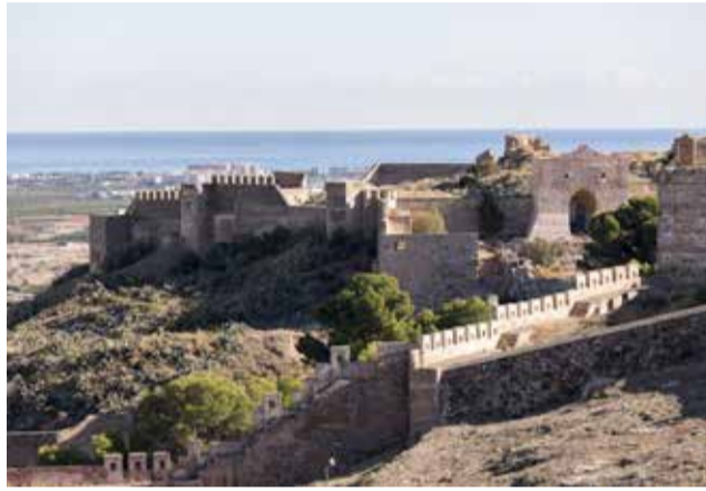
Panorámica del Castillo de Sagunt.

Según el también presidente de la Comisión de Educación y Cultura en las Cortes Valencianas, “tanto el Castell y el Teatro de época romana como la colección museística de Sagunt continúan manteniendo la titularidad estatal después de casi 40 años de haber sido aprobado el Estatuto de Autonomía. Mientras, otras comunidades han ido recuperando la práctica totalidad de su patrimonio y lo han puesto al