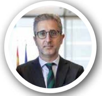
Arcadi España. CONSELLER DE POLÍTICA TERRITORIAL I OBRAS PÚBLICAS

Parc Sagunt II podrá albergar nuevas plataformas logísticas e industriales que requieran de grandes dimensiones, además de aportar su localización estratégica y desarrollar un parque sostenible medioambiental y socialmente, a la vez que se cumple la obligación de la Administración Pública de regulación del mercado inmobiliario, en cuanto a precios y disponibilidad, al aumentar la oferta de suelo industrial/logístico, según la Generalitat.