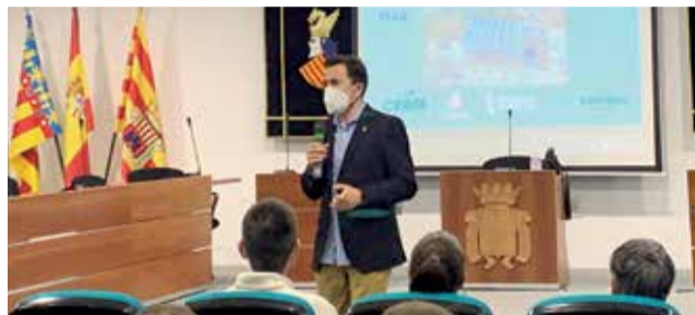
L'alcalde presenta la CERM al veïnat (esquerra) i alguns dels assistents a l'acte.

L'Ajuntament, l'associació CERM (Comunitat Energètica Racó de Mar) i Sapiens Energia convocaven este dijous, 17 de febrer, al veïnat en una exitosa xerrada al saló de plens del Consistori a què assistia l'alcalde de la localitat, Pe-