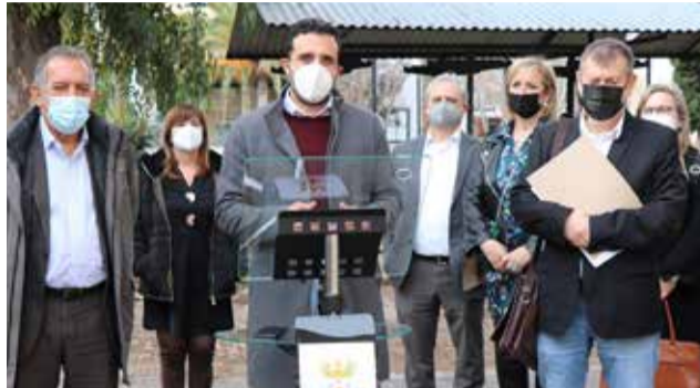
Autoridades municipales y autonómicas.

Además, Sagunt ha constituido el Consejo Territorial de la Formación Profesional, un comité consultivo, deliberativo, propositivo y de participación social vinculado a la conselleria competente en materia de educación y cuyo objetivo principal es fomentar la FP integrada la plena inserción laboral y profesional de las personas jóvenes y de la ciudadanía con nece-