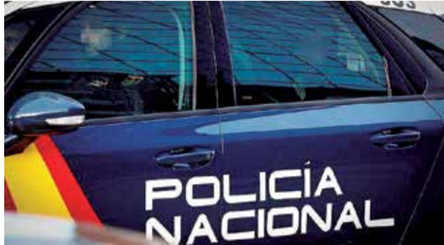
Coche de la Policía Local.

En el caso del robo de Algímia, perpetrado, recordemos, el sábado por la noche, los ladrones se habrían cortado al romper el vidrio de la ventana. Y es que, según cuenta uno de los trabajadores, había manchas de sangre en el suelo al día siguiente. Los delincuentes ni siquiera limpiaron las huellas, lo que demuestra su inexperiencia y su poca pro-