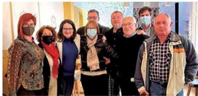
Un instante después de la reunión.

Las conclusiones que se extraen de la reunión con Oltra son positivas, según