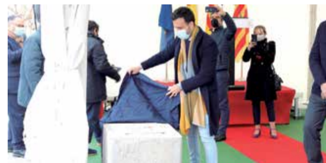
Proyecto (arriba) y primera piedra (abajo). / B. PEDRÓS