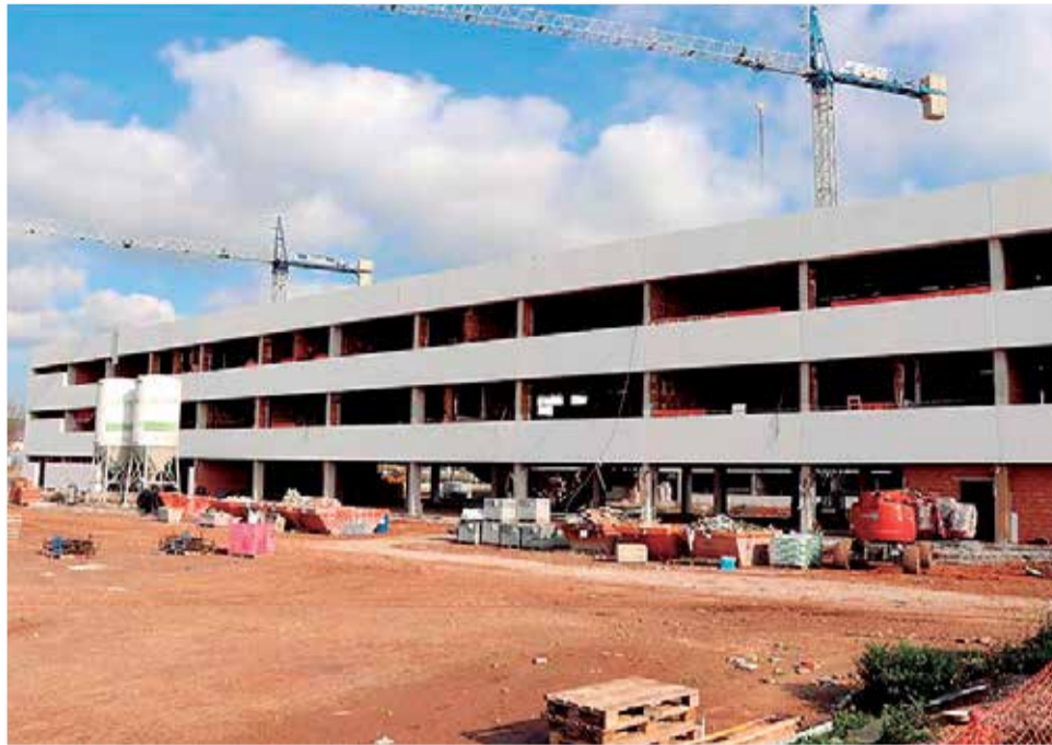
Obras del nuevo IES nº5 de Port de Sagunt.

Las inversiones gestionadas por Contratación y Patrimonio (obras públicas) ascienden a 7.359.886 euros, de