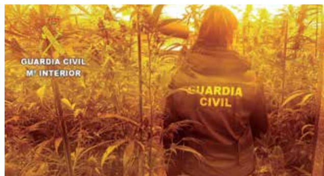
La plantación de marihuana en Albalat.

El pasado 2 de marzo de 2022, los investigadores realizaron un registro, hallando