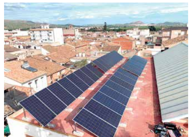
Placas en la Casa de la Cultura