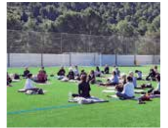
Yoga en Gilet.