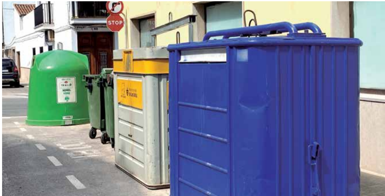
Contenidors a la localitat de Benifairó de les Valls.

Estem convençuts de la necessitat que les persones Redissem el nostre futur, canviant els plantejaments consumistes que estan guiant els interessos de molts de nosaltres. Per a això, hem de ser capaços d'entendre que el Planeta en què vivim és un i que no podem esgotar-ho com si hi haguera alguna alternativa, quan no n'hi ha. Hem de convèncer-nos que és necessari Reduir el desapropiament de recursos, que són finits i cada vegada més cars de produir. I per a això tenim opcions clares, Reparar els béns que utilitzem, lluitant contra l'obsolescència programada, que cada dia està més present entre nosaltres; Reutilitzar-los donant-los una vida més llarga, Recuperar els materials que componen aqueixos béns i que es poden tornar a utilitzar en lloc d'haver de tornar a produir-los. Reciclem les restes que ara rebutgem, depositant-les en el contenidor adequat o