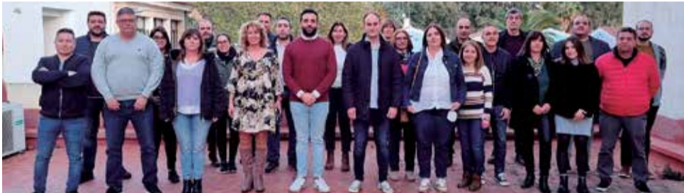
La nueva ejecutiva local del PSPV-PSOE en Sagunt.

EL PSOE RENUEVA SU EJECUTIVA LOCAL EN LA CAPITAL DE LA COMARCA Y SUMA 27 MIEMBROS