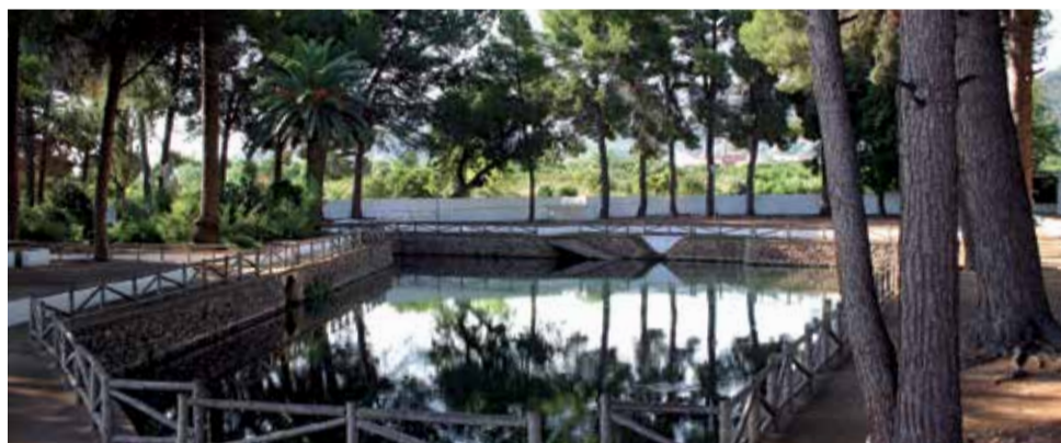
La Font de Quart de les Valls.