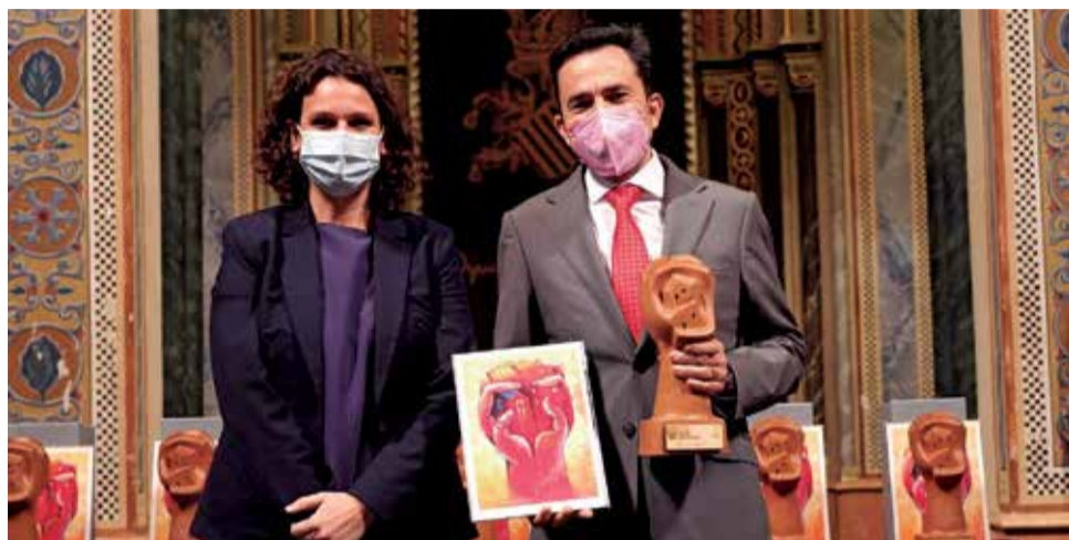
La secretaria autonómica entrega el premio al alcalde de Canet.

El alcalde daba las gracias a la FVMP por este reconocimiento en una intervención en la que desvelaba las líneas maestras de este proyecto, como son la apuesta por las energías limpias, la movilidad sosteni-