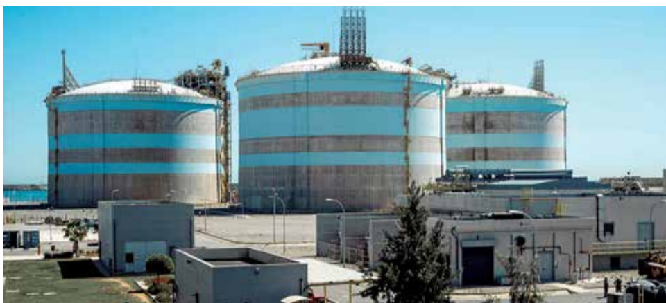
Regasificadora de Saggas, en el puerto de Sagunt.

El conflicto entre Ucrania y Rusia, el cierre del gasoducto que procede de Argelia y la coyuntura internacional están posicionando a recintos como el de Sagunt como punto de entrada estratégico para esta fuente de energía, han señalado las mismas fuentes.