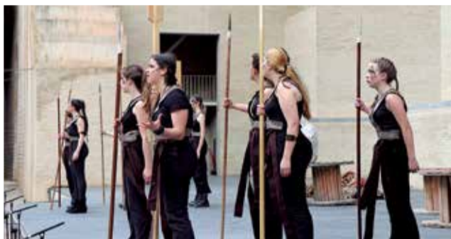
Representación en el Teatro Romano.

la antigüedad recuperan, así, su presencialidad total, con medidas de seguridad y prevención.