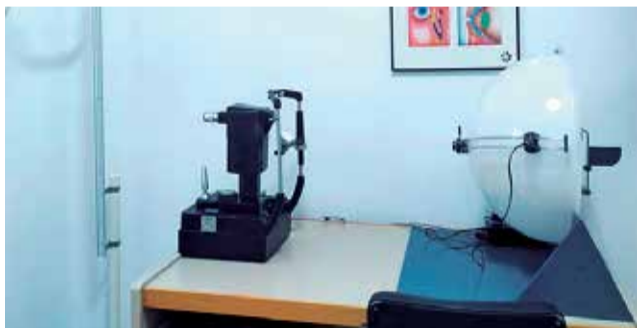
Instalaciones de CRC Diana.