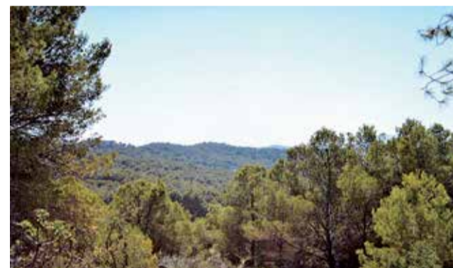
Montaña de Romeu.

Así, Lafarge expresa que mantiene su “plena disposición” para trabajar junto al Ayuntamiento de Sagunt, la Generalitat Valenciana y los grupos de interés en los acuerdos alcanzados en el Convenio de 2013 para la declaración del Paraje Natural Municipal.