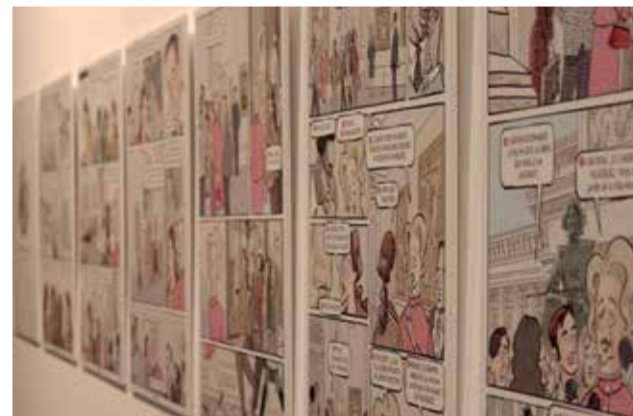
Algunas de las obras expuestas en la muestra de la Fundación Bancaja. / BORJA PEDRÓS