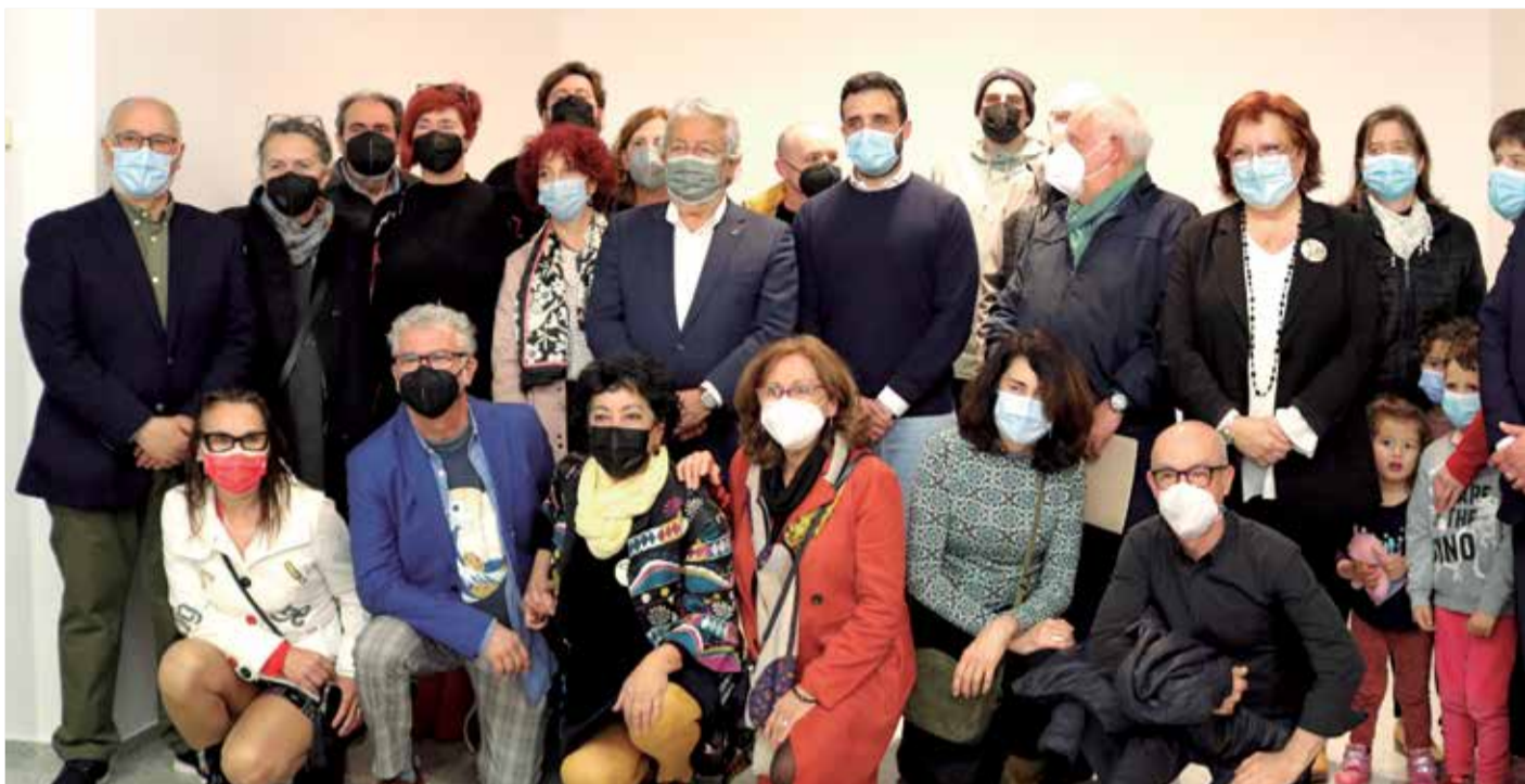
Artistas y autoridades en la foto de familia instantes después de la presentación.

Por su parte, Asun Moll, concejala de Cultura del Ayunta-