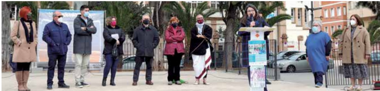
Vicepresidenta del Consell, secretaria autonómica de Cultura y autoridades municipales.

Los Ludi Saguntini promueven el conocimiento de esa gran parte de nuestra historia a través de experiencias directas con multitud de actividades. Hasta diez representaciones de grupos de teatro se han programado en el Teatro Romano de Sagunt a lo largo de las cinco jornadas entre el 4 y el 8 de abril y el 18 de junio, en la clausura del festival. Los talleres y actividades educativas dedicadas a la divulgación de la vida en