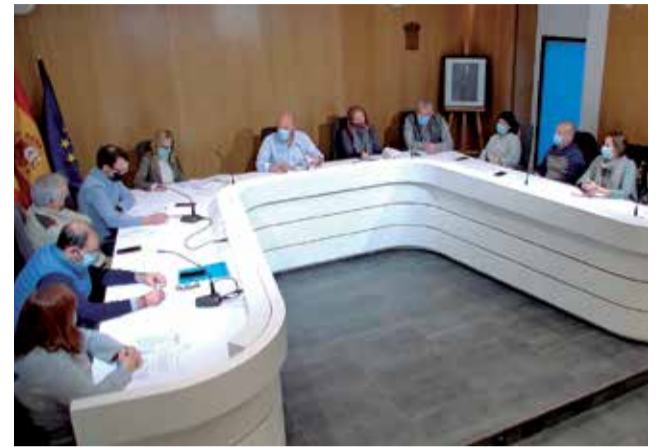
Pleno Municipal en el Ayuntamiento de Faura.