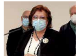
Diferentes instantes de las intervenciones en el acto de presentación de 'Artistas contemporáneos del Camp de Morvedre'.