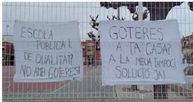
Algunas pancartas colgadas en el colegio.

La Muralla lleva varios años arrastrando este problema. Serían más de cinco años. Y no es porque el Ayuntamiento no haya puesto soluciones. De hecho, desde el Consistorio se intentó empezar las obras