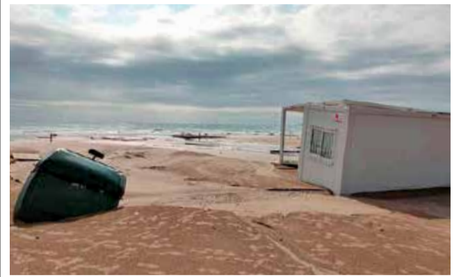
Playa saguntina tras uno de los últimos temporales.