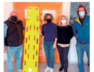
Una de las camillas.