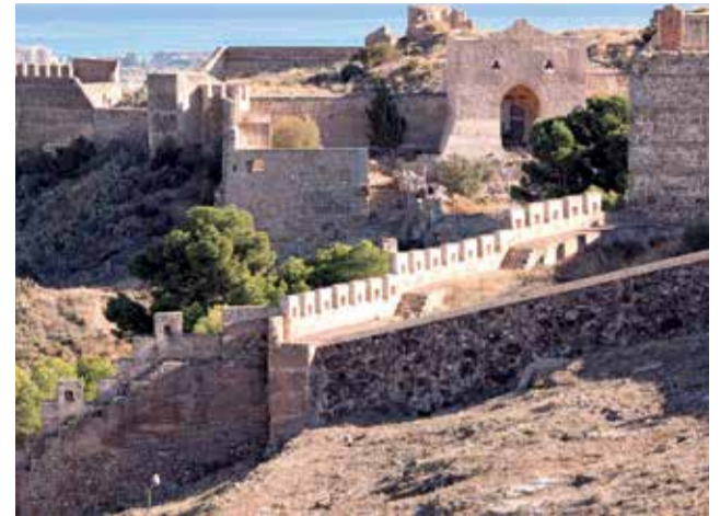
Vista del Castillo de Sagunt.

Según Maestro, “ese Plan Director que se hizo en el año 2000 contemplaba una inversión de, al menos, 16 millones para los primeros diez años. Veinte años después, el Ministerio de Cultura se ha gastado sólo cuatro millones y seguimos pendiente de ese quinto millón”.