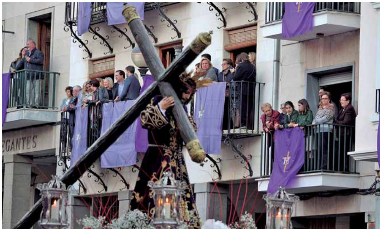
La Cofradía la Sang en una procesión de la Semana Santa saguntina.