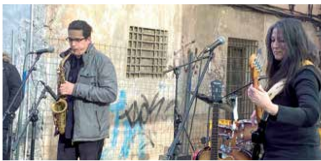
Varios instantes del día de inauguración.

“Hoy es un día para pensar en la juventud, en la gente joven y en los niños y niñas de nuestro municipio, que son los que, el día de mañana, tienen que vivir este edificio. No son ciudadanos del futuro, son ciudadanos de hoy y por eso es esencial que las administraciones pongamos los recursos necesarios para que los puedan disfru-