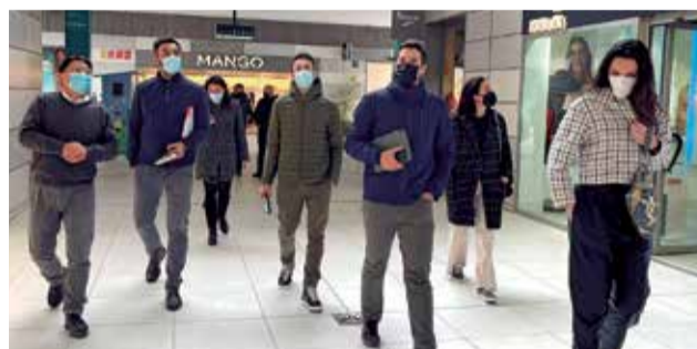
Interior de las instalaciones de Lepicentre.

Por último también hay que destacar las continuas actividades que promueve el cen-