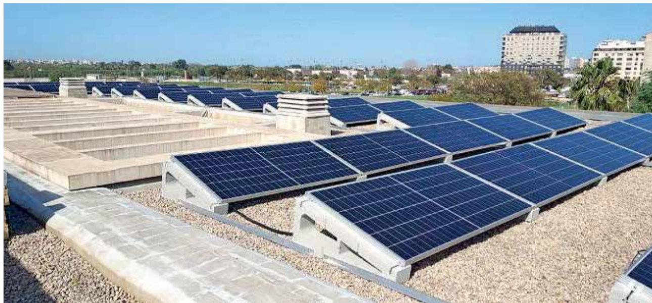
Placas solares en un edificio público de Alzira, capital de la Ribera Alta.

Crear proyectos sostenibles que ayuden a preservar el medio ambiente y hacer frente al calentamiento global es uno de los grandes retos de los diferentes municipios. Por ello, con este recorrido donde los recursos energéticos son los claros protagonistas de este reportaje nos desplazaremos a varias localidades desde Alzira, de la Ribera Alta hasta Albalat dels Sorells, Elx, la Serranía o el Camp de Morvedre.