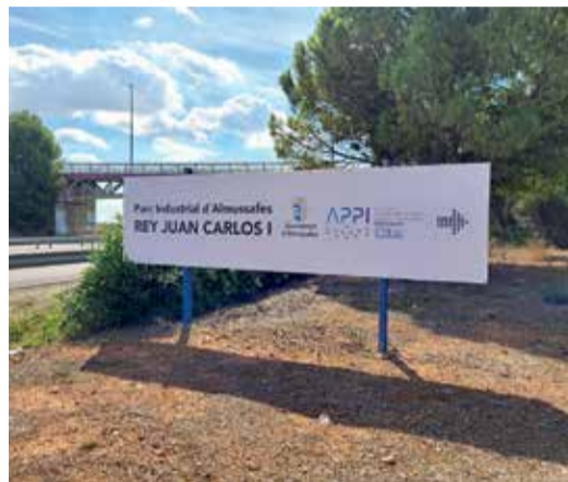
Parc Industrial d'Almussafes.

Además, la asociación se encuentra a la espera de poder conseguir los datos de los propietarios del polígono L'Ermita del Romaní, en Sollana, para iniciar los trámites de la que sería su tercera EGM.