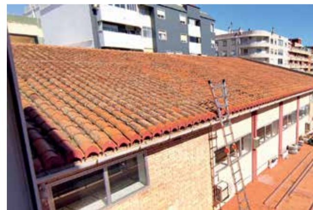
Lloc on es col·locaran les plaques solars.

L'objectiu és que a les escoles comptem amb instal·lacions d'autoconsum amb un estalvi d'entre un 30 i un 40% de mitjana