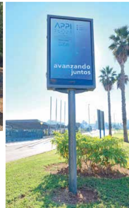
Soporte publicitario APPI.

Con el polígono de Sollana iniciarán los trámites de la que sería su tercera EGM