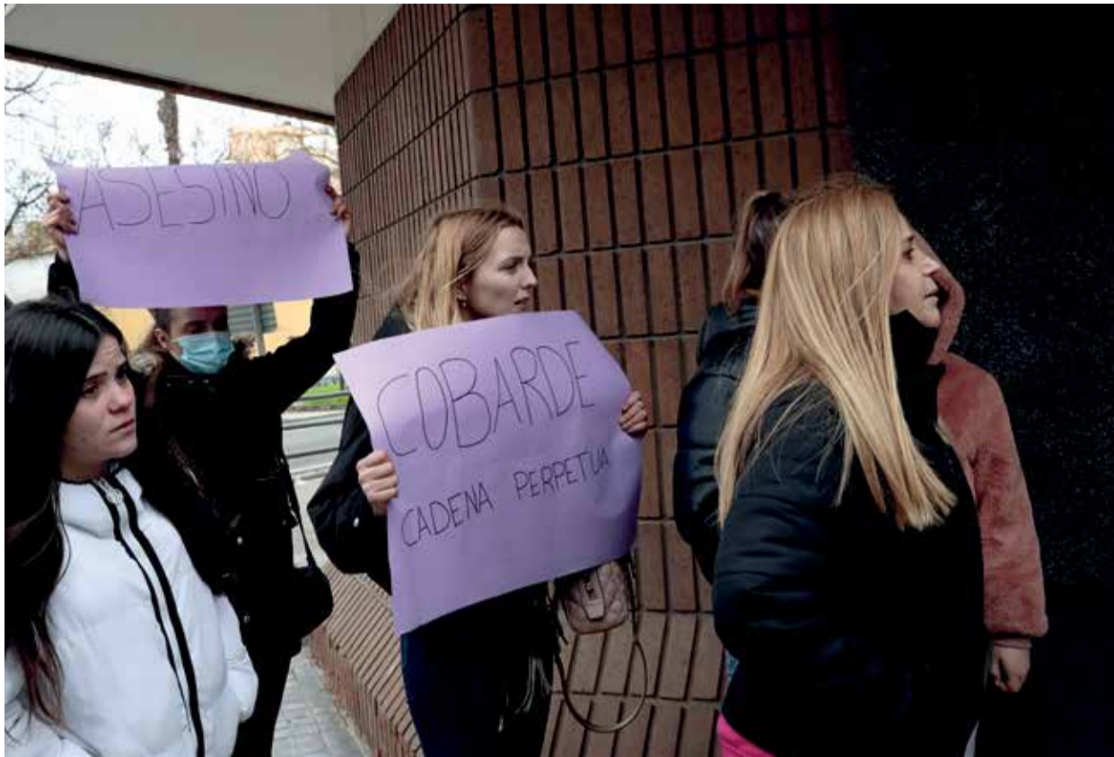
Varias mujeres concentradas en la entrada del juzgado de Sueca.

Sin embargo, el TSJCV informa de que ninguno de los dos padres informó al juzgado que veía su proceso de divorcio de la existencia de un procedimiento penal abierto en agosto, un mes antes, que se cerró con una condena para el padre