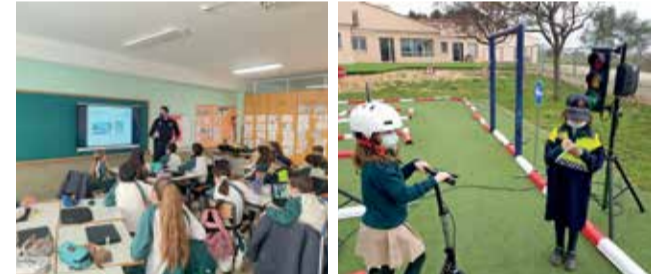
Instantànies dels diferents moments.

en pràctica totes les situacions que se'ls han plantejat al seu centre. Estes eixides, subvencionades al 100 % per l'Ajuntament, pretenen crear una ciutat molt