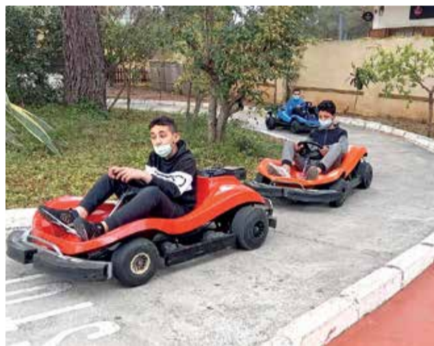
Els xiquets i xiquetes durant les jornades d'educació viària / EPDA

Les activitats tenen diferents objectius com ara conèixer i complir les normes bàsiques de circulació com a vianants o com