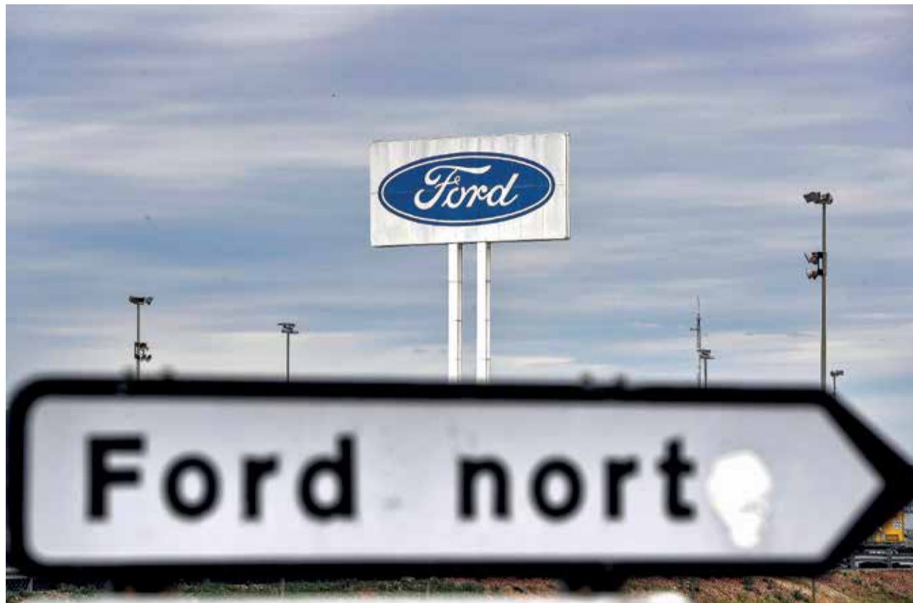
Imagen de archivo de la planta de Ford en Almussafes.

Según dijo, Ford conoce bien los plazos de esta convocatoria que tendrá una inversión pública de cerca de 3.000 millones de euros, que terminan el próxi-