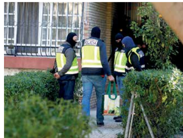
Operación de la Policía contra el yihadismo.

De esta forma ha confesado nueve envíos de dinero de entre 150 y 600 euros que sumaron un total de 2.860 euros entre el 23 de abril y el 2 de septiembre de 2020 efectuados a un supuesto intermedia-