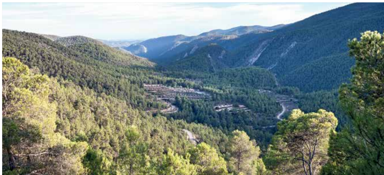
Reserva de la biosfera del Alto Túria.

Albalat dels Sorells ha emprendido con decisión el cambio del modelo energético convirtiéndose en un referente comarcal con el desarrollo de su proyecto Albalat 0'0 Emissions que ya sirve de ejemplo para otros municipios. El camino hacia el cambio de modelo energético es largo y de ello son conscientes en Albalat, por lo que han trazado una hoja de ruta