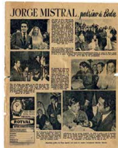
Full informatiu.

La inauguració serà el dissabte 7 de maig a la Casa de la Cultura i estarà fins al huit de juliol