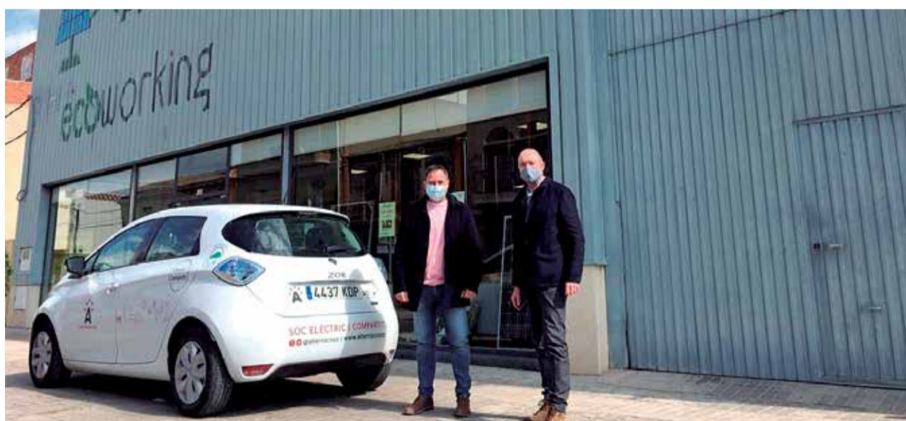
Proyecto modelo energético de Albalat dels Sorells.