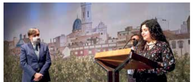
Tot el voluntariat homenatjat / EPDA