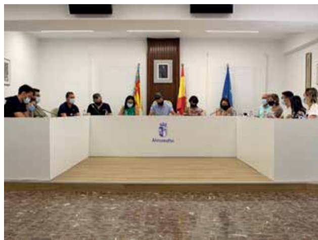
Foto arxiu d'un plenari a Almussafes.