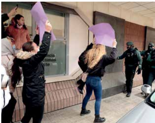
Momento de la llegada del detenido a los juzgados de Sueca.

SE MANTUVO LA CUSTODIA COMPARTIDA POR UN FALLO DE COORDINACIÓN ENTRE JUZGADOS