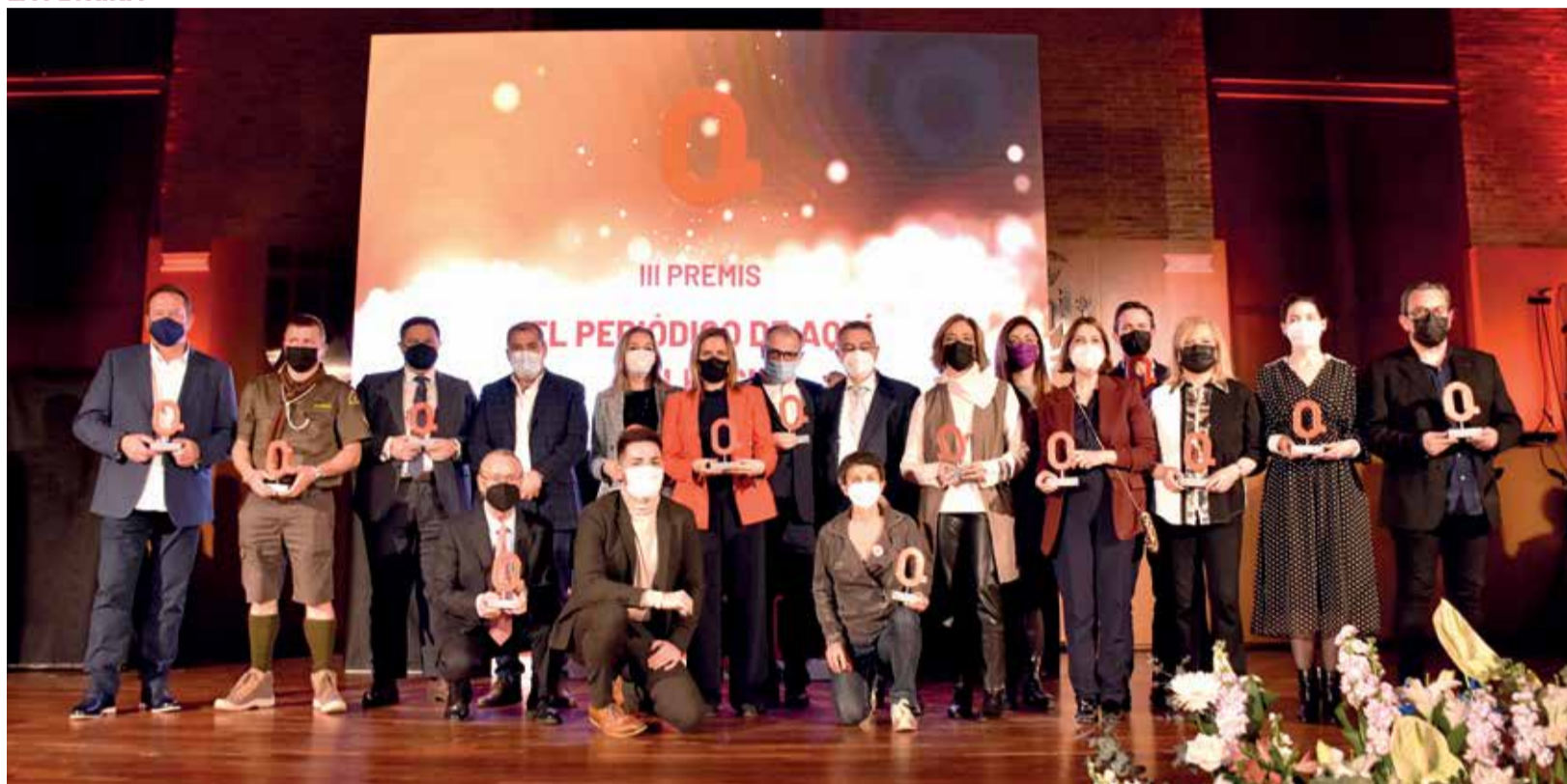
Foto de familia con todos los galardonados al final de la gala de los III Premios de El Periódico de Aquí en Valencia.

EL ACTO, QUE SE LLEVÓ A CABO EN EL COMPLEJO DEPORTIVO Y CULTURAL LA PETXINA PUSO EN VALOR EL TRABAJO QUE DIFERENTES ENTIDADES, ASOCIACIONES, ADMINISTRACIONES, EMPRESAS Y PARTICULARES REALIZAN EN LA CIUDAD