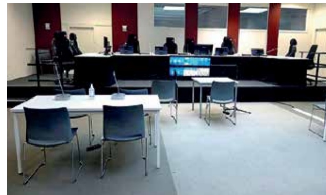
Foto archivo de una sala de juicio.

Los hechos sucedieron el 4 de noviembre de 2020 en el