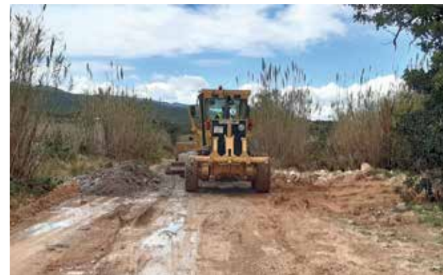
Obres en els camins afectats.