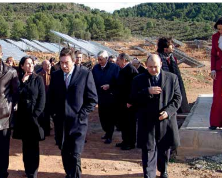
de placas solares en el Palancia.

► INNOVACIÓN. La gran evolución tecnológica ha ayudado a que sea más factible a la ciudadanía.