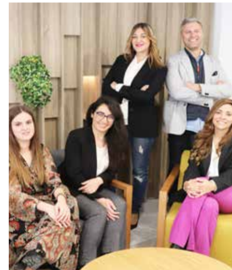
Equipo GAIN. / EPDA

El esfuerzo diario de un equipo compuesto por seis profesionales en plantilla de diferentes ámbitos y varios colabo-