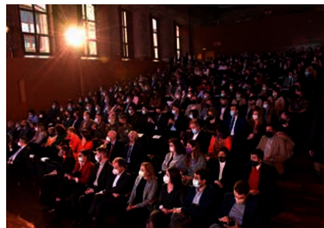
Instantáneas de la gala. / PLÁCIDO GONZÁLEZ