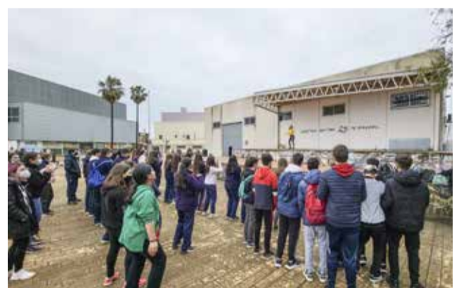
Dia de l'Esport a Guadassuar

"Celebrar el Dia de l'Esport és important i més quan es fa des de l'educació dels valors que el caracteritzen com són l'esforç, el respecte, el treball i la perseverança", comenta l'alcaldesa de Guadassuar, Rosa Almela.