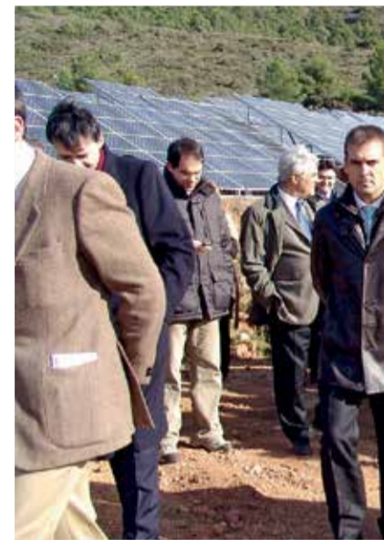
Azuébar acogió el primer parque c