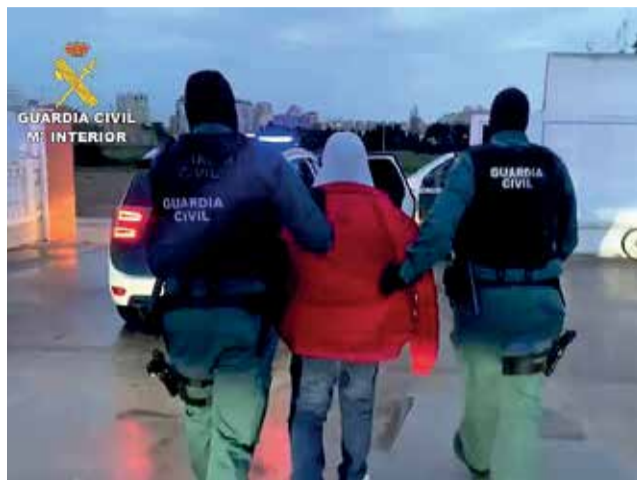
Uno de los detenidos de la operación.

El Grupo de Homicidios y Desaparecidos de la Unidad Orgánica de la Policía Judicial de la Comandancia de Valencia se hizo cargo de la investigación y a lo largo de la deno-