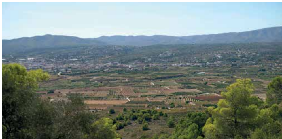
Entorn natural de Llombai.

Moltes són les possibilitats per conèixer els paratges naturals. Els veïns de Llombai poden presumir de ser l'única població que compta amb tres paratges naturals municipals protegits. Són les zones d'Els Cerros, El Tello i la Colaita. La Colaita, amb una superfície de 951 hectàrees, es troba protegit per les Directives Europees d'Habitats i Ocells que integren la Xarxa Ecològica Europea Natura 2000. Geogràficament el paratge se situa en la zona de transició entre la plana litoral valenciana i els primers massissos muntanyencs de directriu ibèrica, travessats pel riu Xúquer, que transcorre encaixat en profunds canons des de les planes manxegues fins que s'obri pas cap a la costa. En este espai predomina una "màquia" o garriga densa de coscolles, margallons i argilagues amb peus dispersos de pi blanc i carrasca, en els vessants més càlids i exposades, i una màquia formada per lletiscles i bruc en els vessants més frescos i humides. Les espècies arbòries més rellevants són el freixe de flor i l'arboç, encara que sens dubte la presència dels últims exemplars de "quejigo" o 'roure valencià' ( Quercus faginea ) existents en el municipi li confereixen una major singulari-