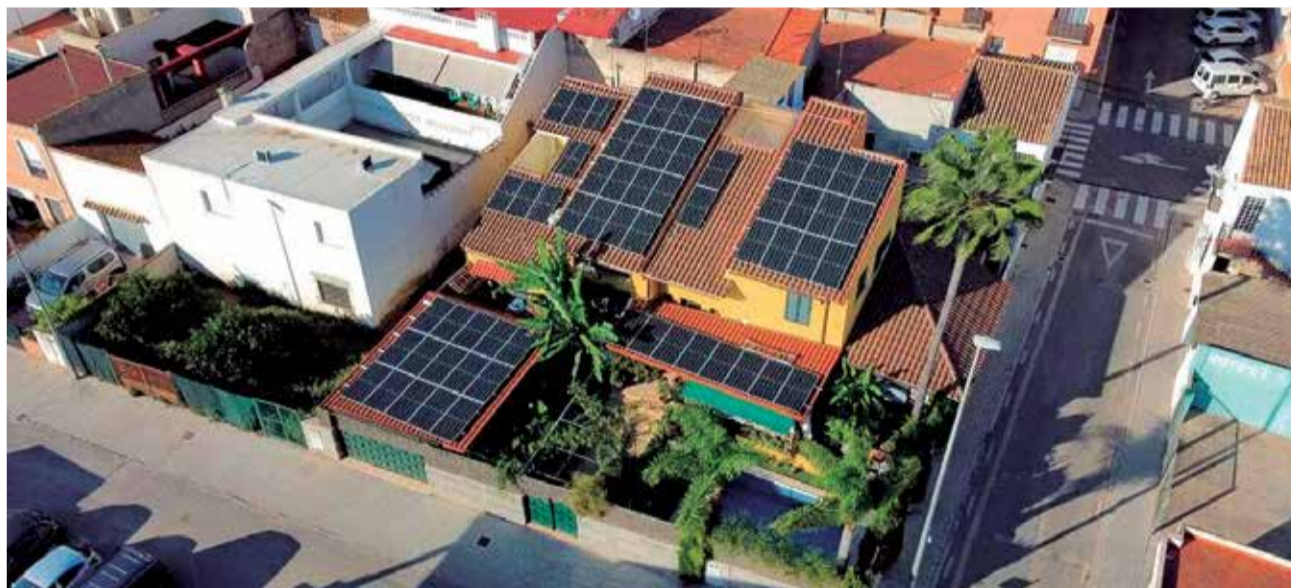
Placas solares en Canet d'en Berenguer, en Camp de Morvedre.