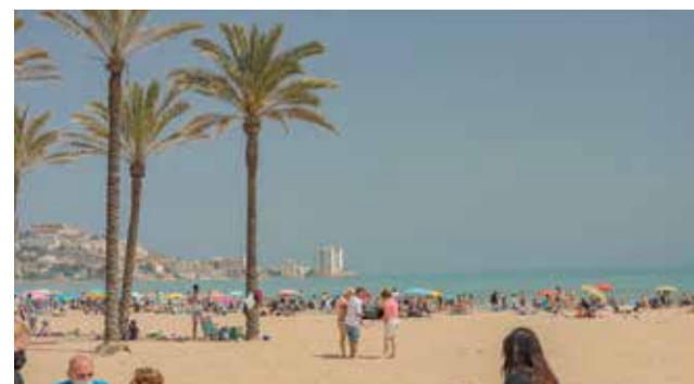
Platja de Cullera.