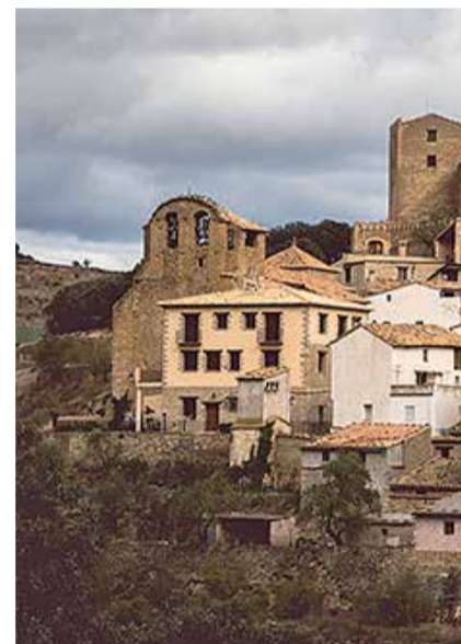
La Todolella.

Los sistemas de energías renovables tienen su protagonismo en el paisaje de la comarca del Palancia. A los siete parques eólicos existentes con más de cien generadores se han sumado últimamente otros parques de energía fotovoltaica en prin-