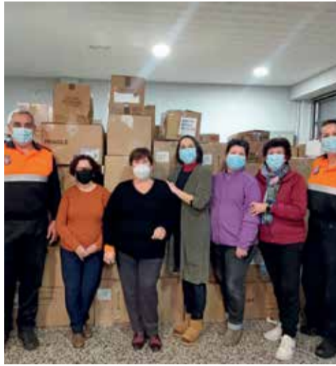
Material recaudado gracias a la colaboración de la población de Cheste.

material hasta el almacén de la Generalitat; y del personal de la Brigada, de la Oficina de Turismo y de los departamentos de Cultura, de Fiestas y de Deportes, que han participado en la recogida. Los puntos de recogida han es-