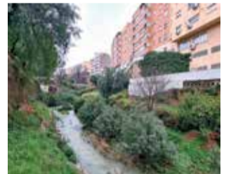
Barranco de Chiva. / EPDA