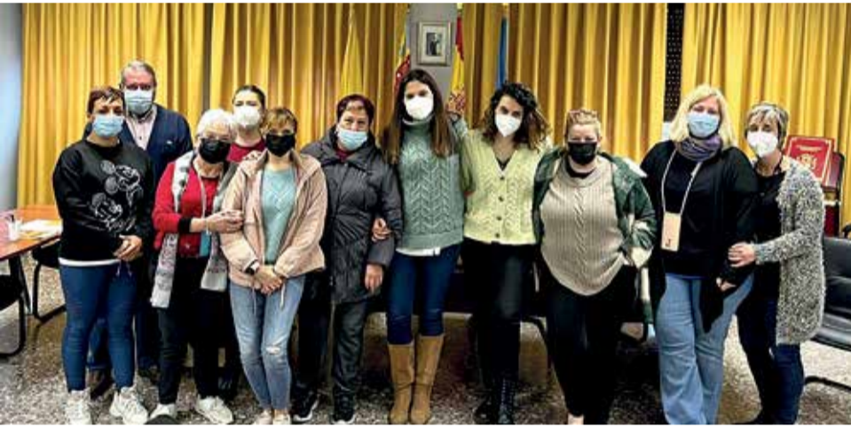
Momento de la reunión para la comisión del Plan de Igualdad de Caudete.