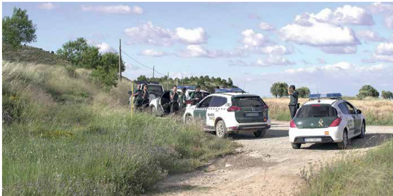
Uno de los controles de la Guardia Civil en las inmediaciones de Teruel.

Los acusadores han fundamentado sus respectivas peticiones en los testimonios hechos en la sesión de ayer por los dos agentes, que aseguraron que el procesado, al quedar acorralado en un callejón de la localidad de Muniesa, disparó su escopeta con la intención de matarles, y en las declaraciones hechas hoy por los peritos judiciales. Los médicos forenses que realizaron un seguimiento al agente que