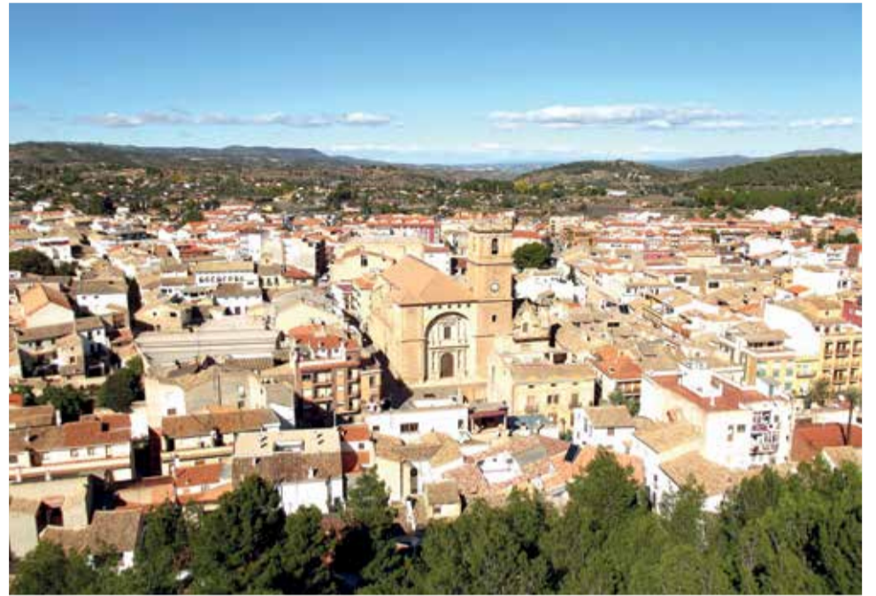
Municipio de Ayora.

Entre estas actividades se señala especialmente la relativa a la miel, que ocupa