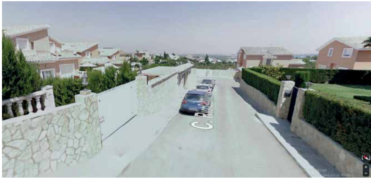
Zona de la urbanización Cumbres de Calicanto de Chiva.

La tarde del 15 de marzo, mientras agentes de la Guardia Civil de Chiva realizaban servicio en prevención de la seguridad ciudadana por la urbanización de Cumbres de Calicanto, observaron a un hombre, que vestía ropa oscura, que intentó ocultarse tras unos vehículos al visualizarlos. Parecía que inspeccionaba una de las vivien-