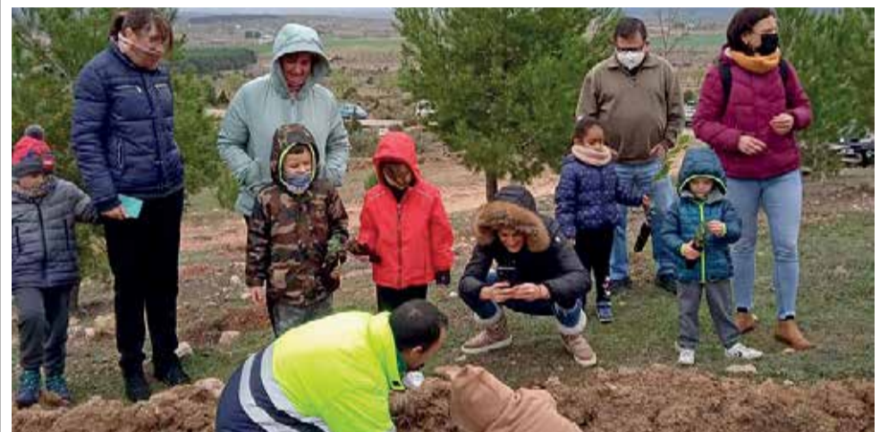
Plantación de árboles del alumnado del CEIP Maestro Aguilar.