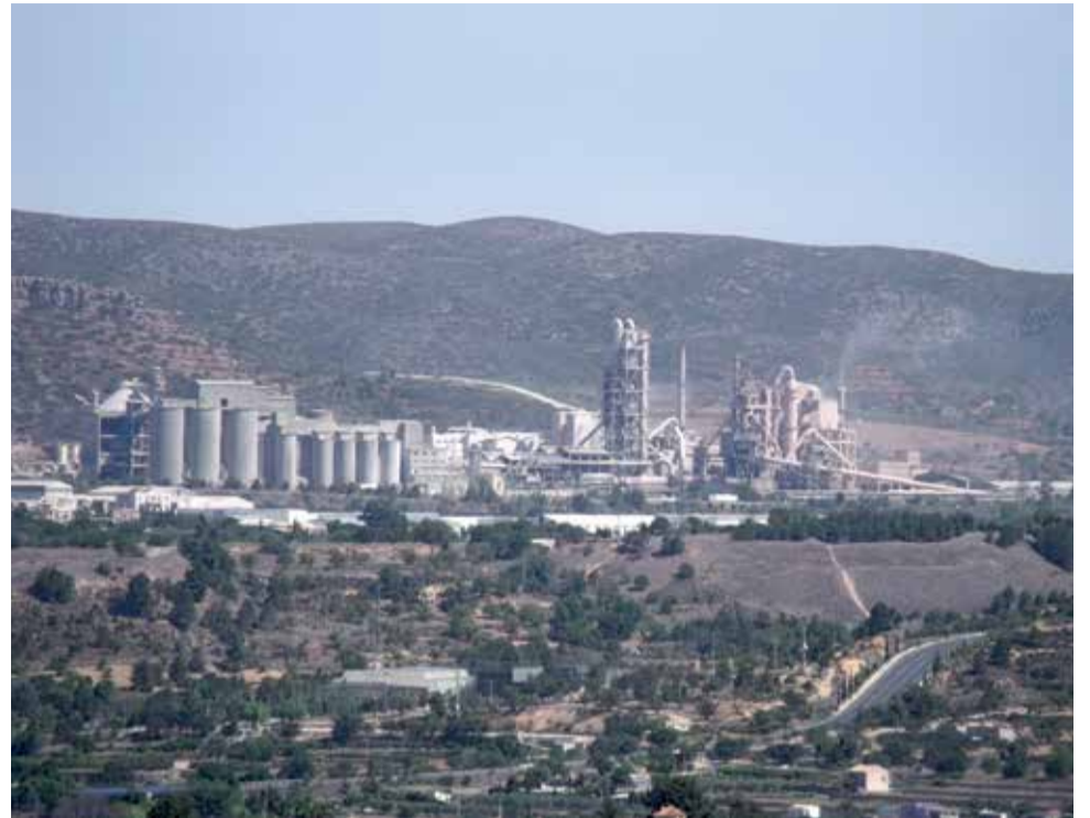
La cementera de Buñol.

A este respecto, el nuevo Plan Integral de Residuos