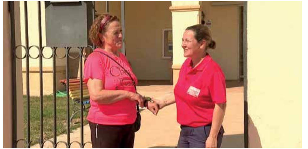
Momento de la llegada de una refugiada ucraniana a Chera. / EPDA