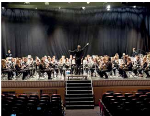
Concierto en el teatro Liceo de Cheste.

formación musical en la comarca. "Es para mí un honor presentar este concierto por varias razones. En primer lugar, porque gran parte de mi trayectoria profesional como maestra transcurrió en Buñol, durante 30 años, y muchos de mis alumnos y alumnas eran y son músicos y músicas. En segundo lugar, porque hoy celebramos un acto que se iba a realizar hace dos años, justo cuando comenzó la pandemia, y que fue el primero en cancelarse; con lo que retomamos así un proyecto músico-pedagógico que prepara a nuestros jóvenes en su carre-