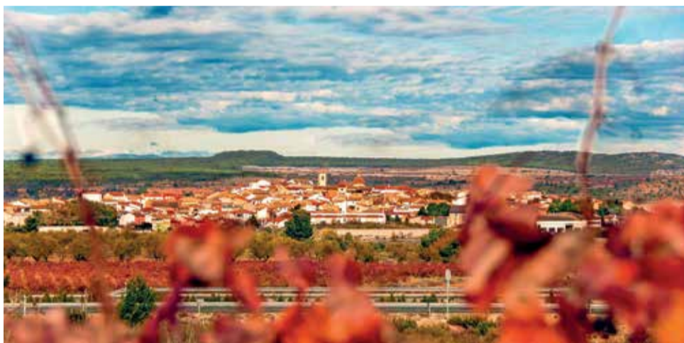
Villargordo del Cabriel.