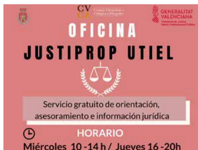
Cartel programa asesoramiento. / EPDA

Hasta la puesta en marcha de estas oficinas de proximidad, la orientación y asesoramiento previo al inicio de un proceso judicial se prestaba en las sedes donde se en-