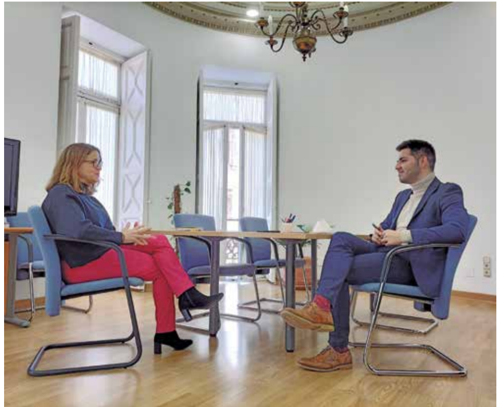
Diferentes instantes de la entrevista.

► Está teniendo una acogida muy positiva. Hay un interés