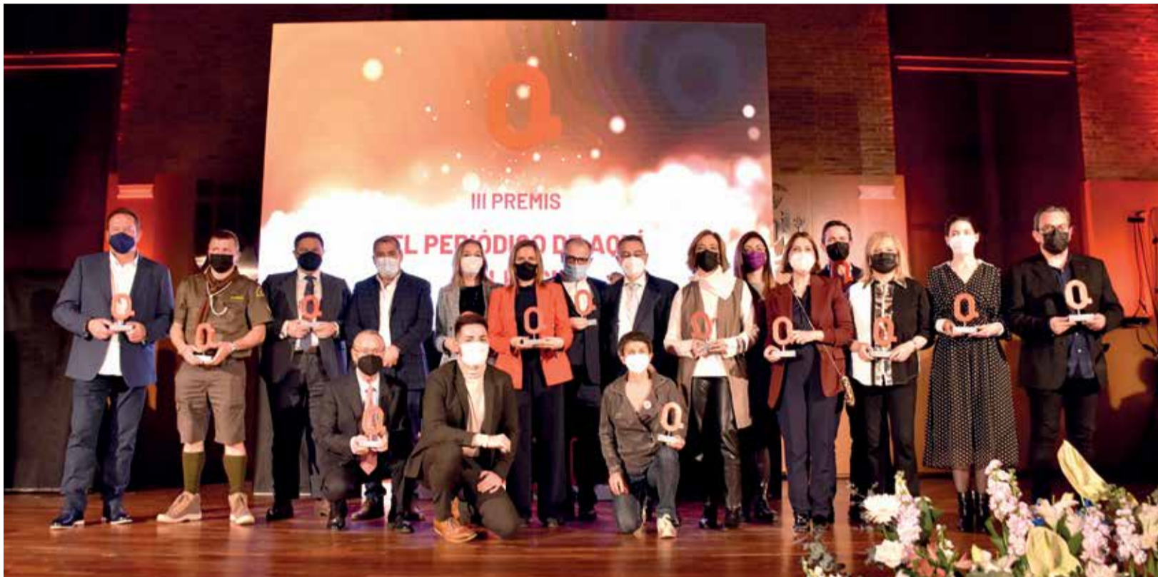
Foto de familia con todos los galardonados al final de la gala de los III Premios de El Periódico de Aquí en Valencia.

EL ACTO, QUE SE LLEVÓ A CABO EN EL COMPLEJO DEPORTIVO Y CULTURAL LA PETXINA PUSO EN VALOR EL TRABAJO QUE DIFERENTES ENTIDADES, ASOCIACIONES, ADMINISTRACIONES, EMPRESAS Y PARTICULARES REALIZAN EN LA CIUDAD