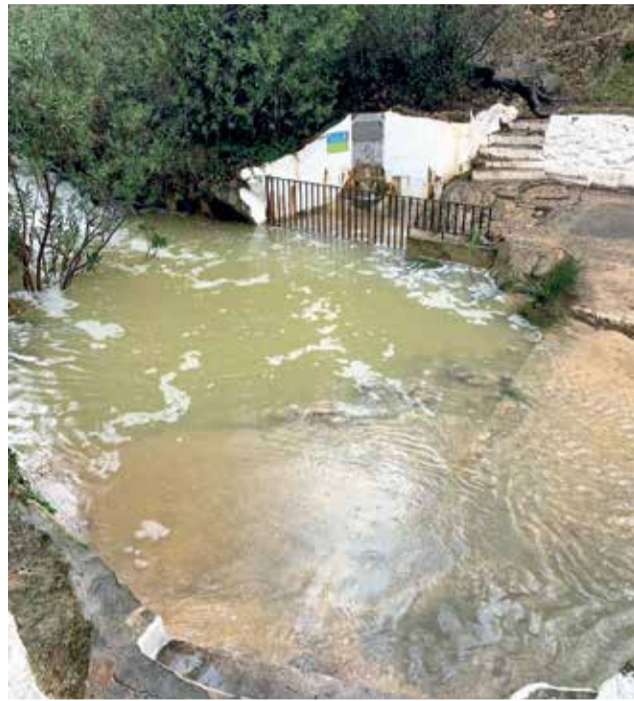
Fuente del Roquillo tras el temporal.

También se está viendo los desperfectos en caminos rurales por los desprendimientos como en el camino de Carcalín, Roma o Ciprés, que en los próximos días se irá arreglando en la medi-