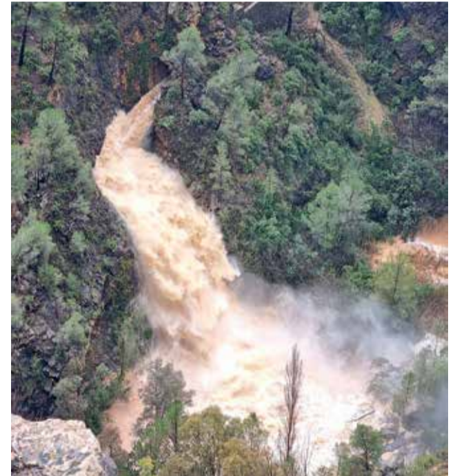
Pantano de Buseo de Chera tras el temporal.