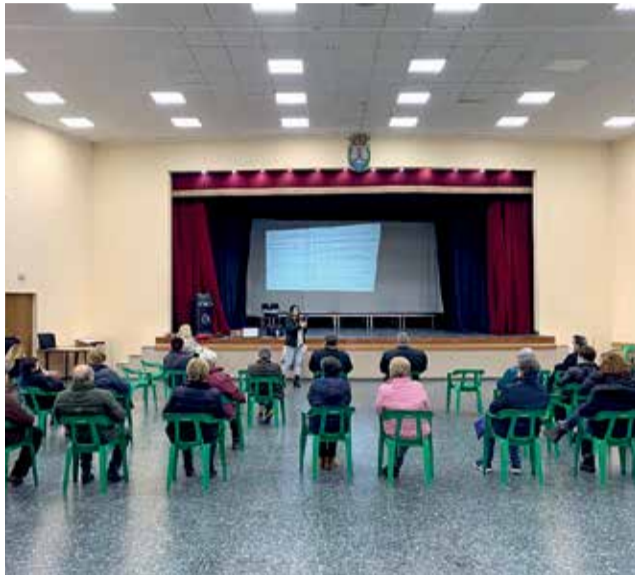
Jornada de información del Plan de Igualdad.

Supone un compromiso por parte de la corporación local, que se ha de concretar en unos objetivos y acciones a desarrollar, acotado en el tiempo, y dotado de los medios y recursos necesarios para su puesta en