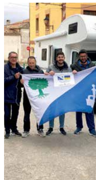
Antes del viaje.