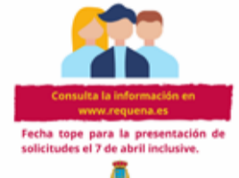
Cartel Tercer Plan . / EPDA