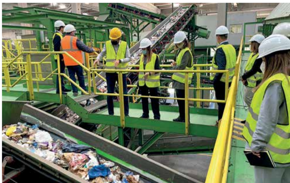
Una de las visitas a las plantas de reciclaje del Consorcio Valencia Interior / EPDA

La inscripción en las comisiones territoriales es voluntaria y