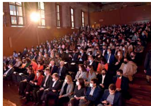
Instantáneas de la gala.