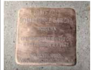
Taulell memòria. / EPDA