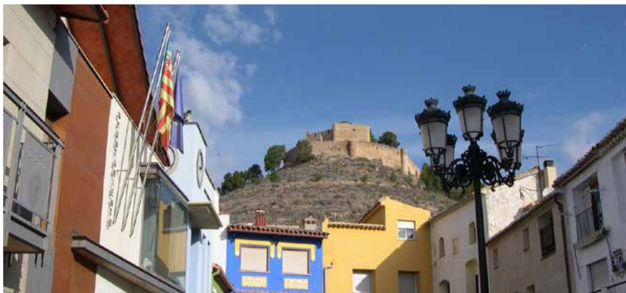
Ayuntamiento de Jalance. / EPDA

Modalidad B. Actuaciones de prevención de incendios forestales (para municipios forestales que tengan aprobado el PLPIF o un Plan Local Reducido de Prevención de Incendios Forestales (PL-