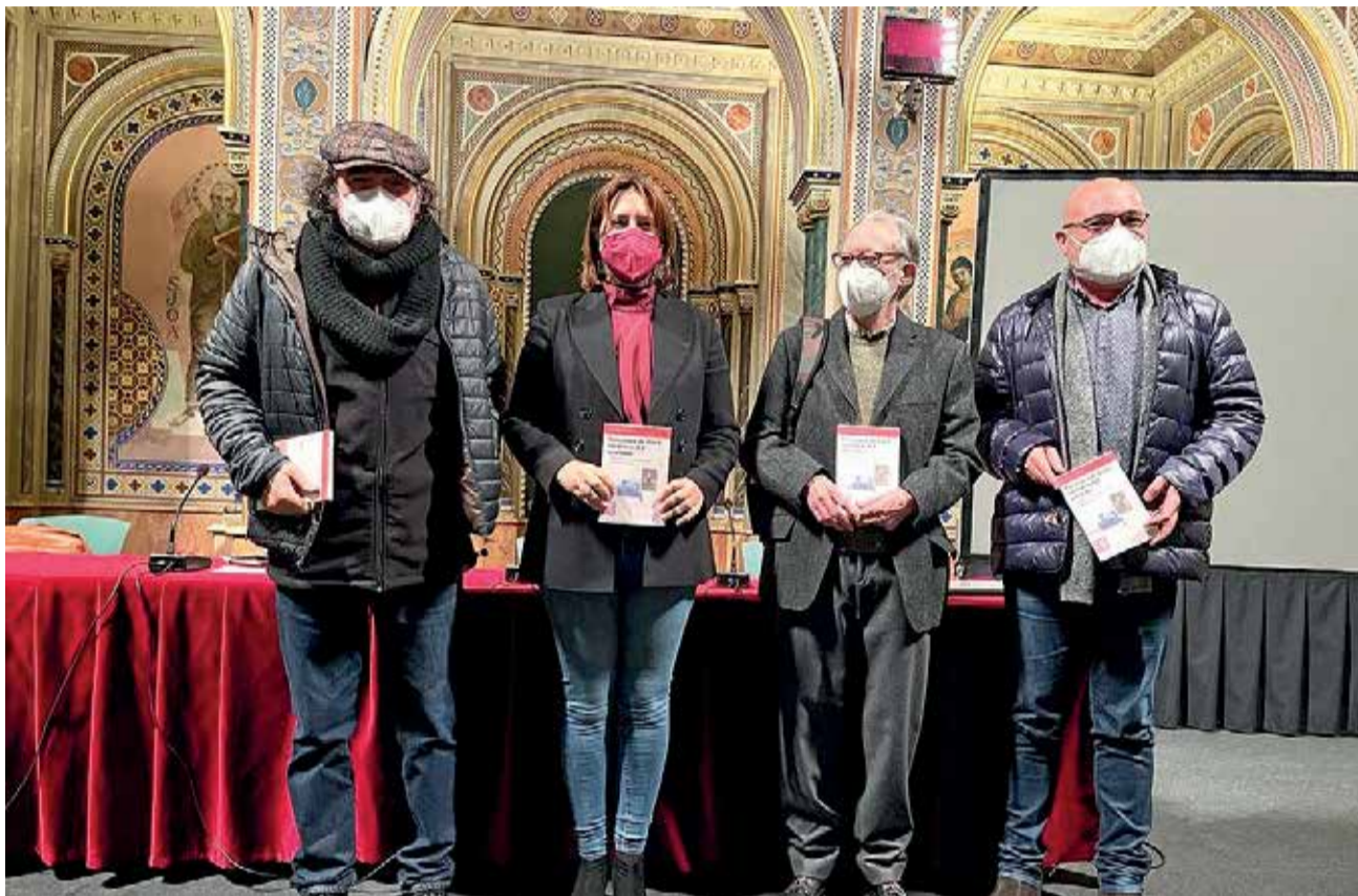
Momento de la presentación del libro en la Beneficència.

Los cinco personajes de Utiel participaron como milicianos en la guerra española. Posteriormente, en los campos de concentración fueron considerados como no españoles o "apátridas" por las presiones que Serrano