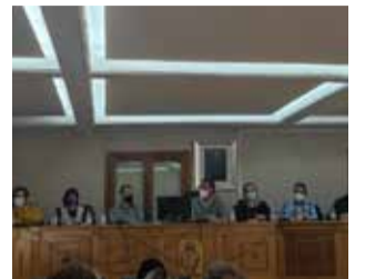
Pleno de Chiva.