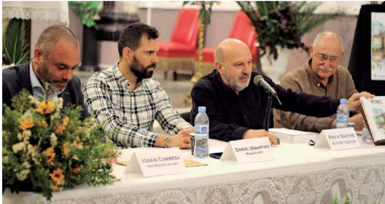
Un instant de la presentació del llibre a l'Església de Petrés.

El llibre recull diversos articles que l'autor va publicar en la revista Braçal en 2008 i 2012. Això sí, revisats i ampliat. Apunts sobre la fundació de Petrés i la carta de repoblació després de l'expulsió dels moriscos, datada el 13 de