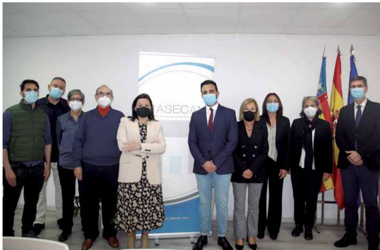
Empresarios, representantes de Asecam y autoridades de la comarca en la presentación del proyecto. / EPDA

propios de un proyecto de absorción de CO2, se trata de una actividad investigadora fundada en una visión sistémica y aplicada a la comarca del Camp de Morvedre. El fin es maximizar la regeneración de los servicios de los ecosistemas por medio de la reducción de la erosión, la reducción del riesgo de inundaciones, la mejora de la filtración del agua, la producción biótica y, por supuesto, el incremento de la absorción de CO2 y la mejora de la regulación del clima, compensando así las emisiones de las industrias asociadas de Asecam.