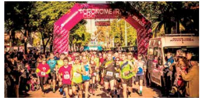
Carrera Amuhcanma en Port de Sagunt.

La VI Carrera Amuhcanma tendrá lugar en el municipio un año más con el objetivo de recaudar fondos para la investigación del cáncer de mama. Este evento benéfico será el próximo domingo 8 de mayo, y contará con una carrera infantil a las 10.00 horas y, por otra parte, a las 10.30 horas las carreras 5k y 10k. La carrera benéfica está organizada por la asociación Amuhcanma y cuenta con la colaboración del departamento de Actividad Física, Salud y Deportes del Ayuntamiento de Sagunt.