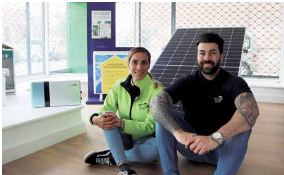
Delegada de Oficina y CEO de Ecovida Renovables.