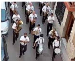
La banda de Quart.