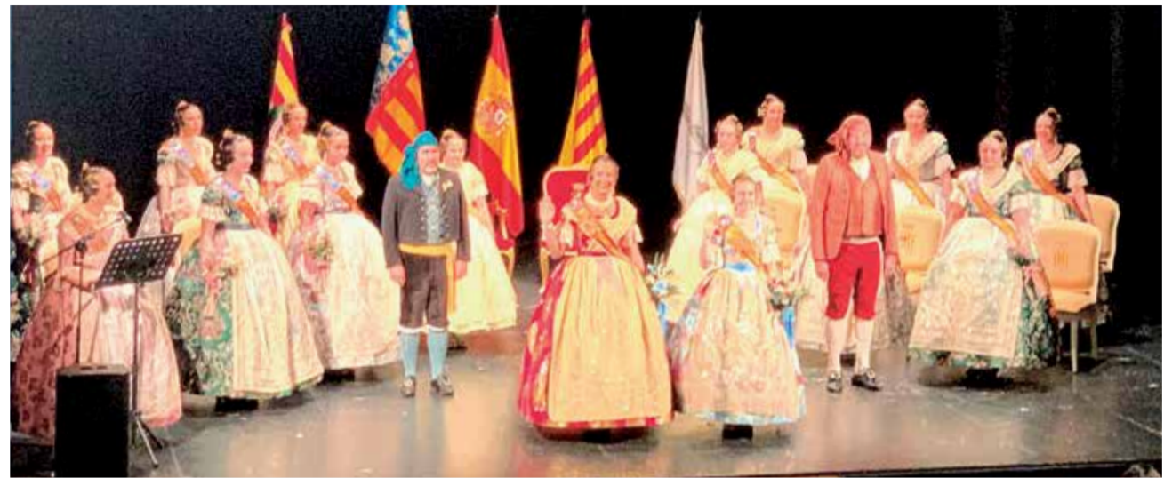
Acto de despedida de las falleras mayores del Camp de Morvedre.

El acto reunió a las 30 comisiones del Camp de Morvedre