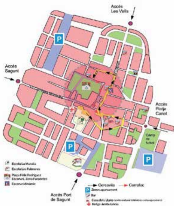
Punt on té lloc l'activitat.

L'acte començarà a les 17 hores amb la concentració dels assistents davant del CEIP La Muralla. D'allí, la comitiva iniciarà el recorregut per la localitat acompanyada per la Societat Municipal Canet d'en Berenguer, que acabarà amb la recepció dels centres educatius per part de l'alcalde i la corporació municipal.