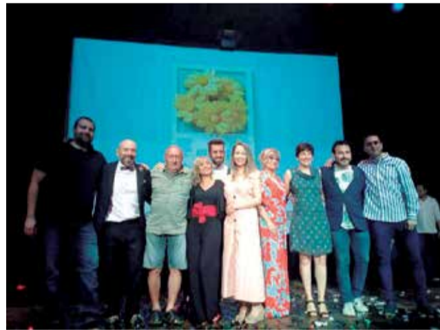
Una imatge de l'edició de 2021.

En tercer lloc, el grup de teatre "Zorongo teatro" de Bétera,