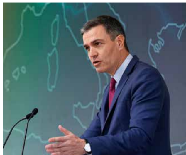
Pedro Sánchez en la presentación.

La gigafactoría de Sagunt empezará a construirse en 2023 y a producir en 2026