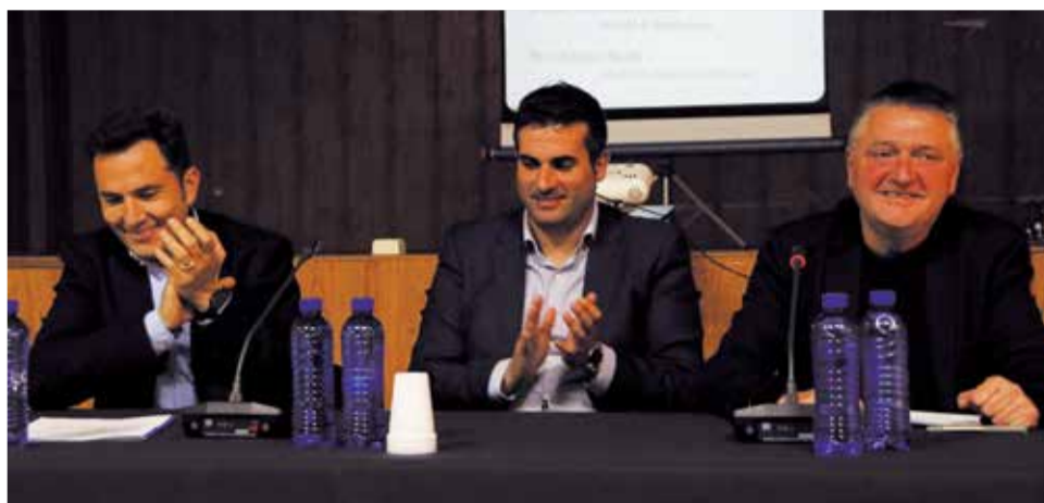
D'esquerra a dreta, alcaldes de Canet, Quart i Montanejos.

Dins del turisme cultural, es pretén donar un impuls a