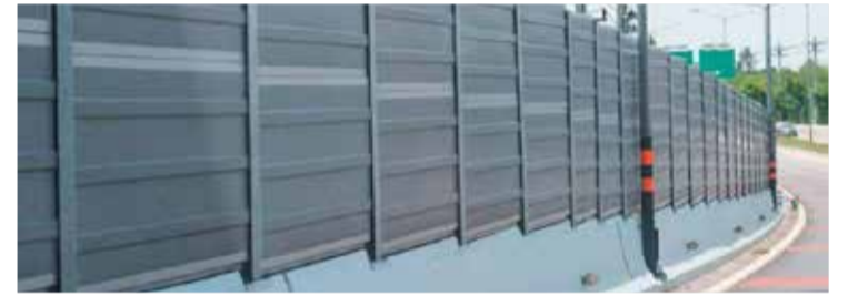
Costas saguntinas, abandono del Castillo de Sagunt, Malecón de Menera y pantallas acústicas.