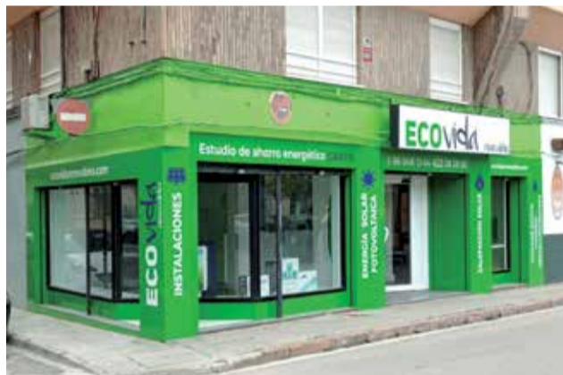
Local de Ecovida en Puerto de Sagunto.

Las placas solares o paneles fotovoltaicos de Energía Solar son el sistema perfecto para aquellas empresas o familias que desean reducir considerablemente el importe de su factura de la luz. Desde el momento en el que tus placas solares comienzan a generar energía, el cliente solo pagará