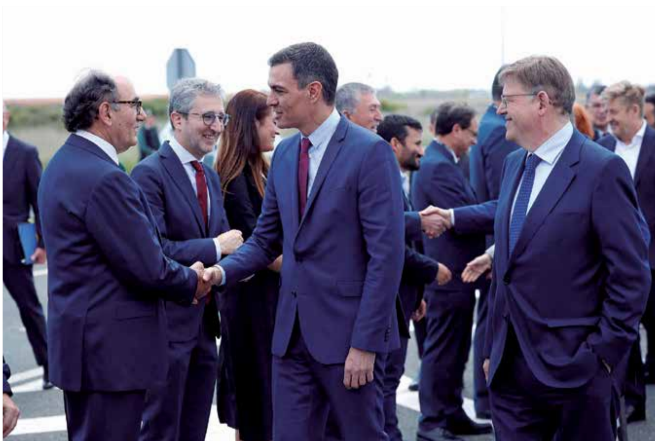
El presidente del Gobierno saluda al presidente de Iberdrola en presencia del president de la Generalitat.

Esta gigafactoría va a ser "el pilar central", pero no "el único", para convertir a la Comu-