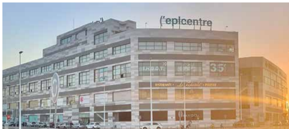
Centro Comercial Lepicentre.

Mientras tanto continúan las obras de las grandes marcas que están esperando su apertura, Perfumerías Atalaya que está montando uno de los mejores locales de cosmética de la Comunidad Valenciana con una tienda de 700 metros cuadrados y las de Ulanka, cadena de tiendas especializada en calzado, que cuenta con más de 100 puntos de venta ubicados en las principales zonas comerciales de las ciudades y con más de 75 años de historia. LLAO LLAO la franquicia española de yogur helado, granizados y batidos que