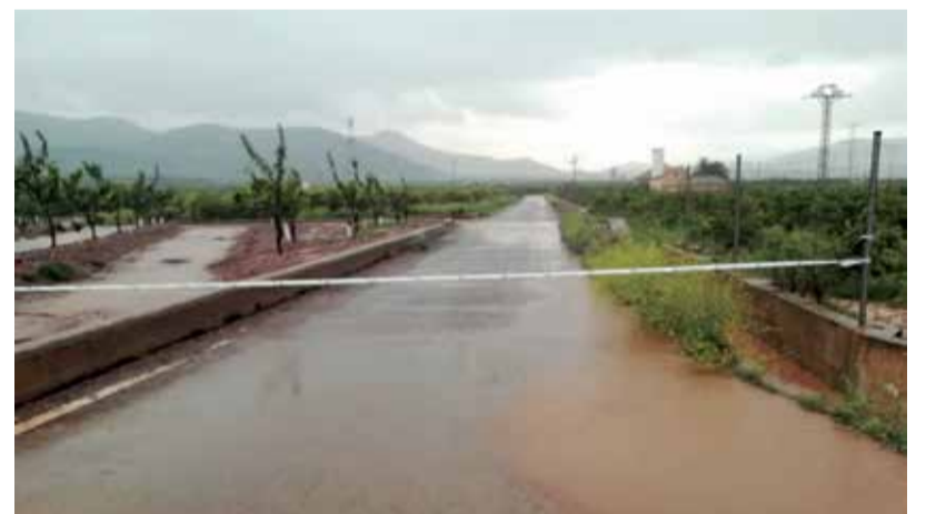
Daños ocasionados por las lluvias en varias zonas del término municipal de Sagunt.