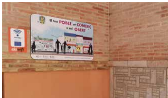
Un dels espais que compta amb connexió.

Amb la subvenció s'han instal·lat un total de 16 punts d'accés wifi que donen servei a l'edifici de la Casa Consistorial, Casa de la Cultura, Centre Met-