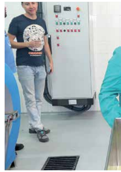
Aceite de la Serrana de Espadán, e

Aunque la producción es muy variable para un producto vecero como es la aceituna, aproximadamente unos diez millones de kilos de olivas se molturan anualmente en las almazaras que con aportación mancomunada o municipal se reparan por la amplia geografía