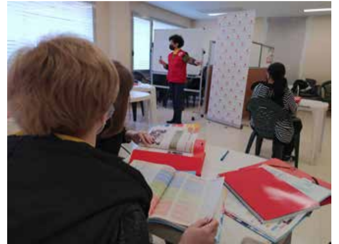
Una de les classes de castellà.

"Gràcies per la vostra immensa solidaritat. Entre tots suportarem aquesta situació i l'abordarem amb l'afecte que ens caracteritza com a poble", han afegit. "Al costat dels qui més ens necessiten" ací és on l'alcalde de Bétera, Elia Ver-