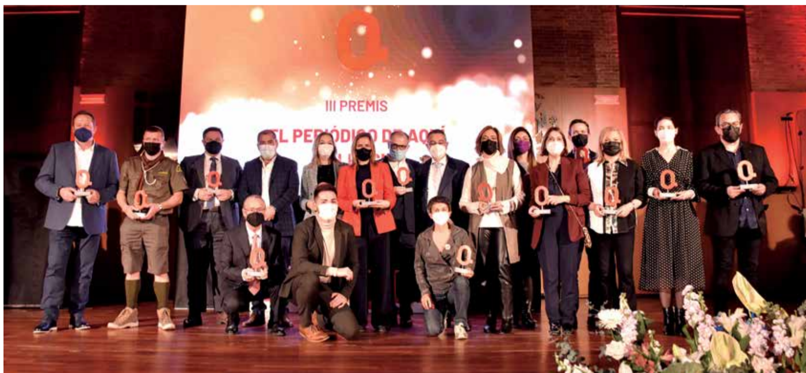
Instantánea de todos los premiados en el Complejo La Petxina de Valencia.

EL COMPLEJO LA PETXINA ACOGE LOS GALARDONES DE EL PERIÓDICO PRESENTADOS POR LA PERIODISTA MELU BORT