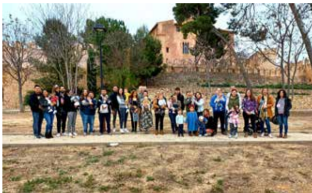
Familiars en la nova edició 'Bosc del Ciutadà'.