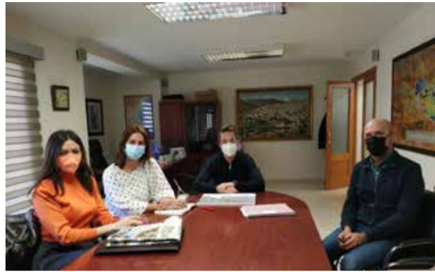
Durante la visita de la Autoridad Portuaria.