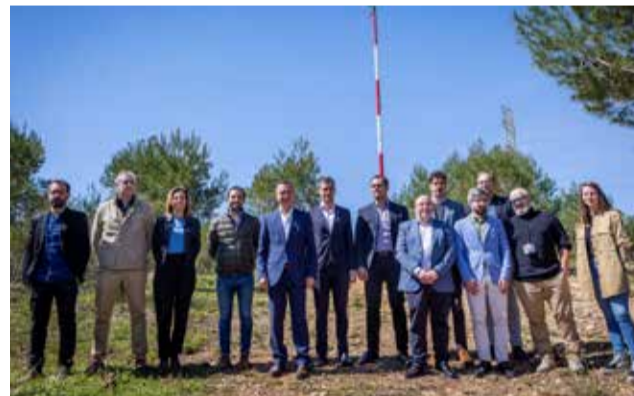
Presentación de la infraestructura.