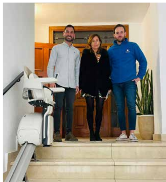
Los concejales presentando las sillas

La actuación ha sido financiada con una subvención de la Conselleria de Presidencia de 4.878,72 euros.