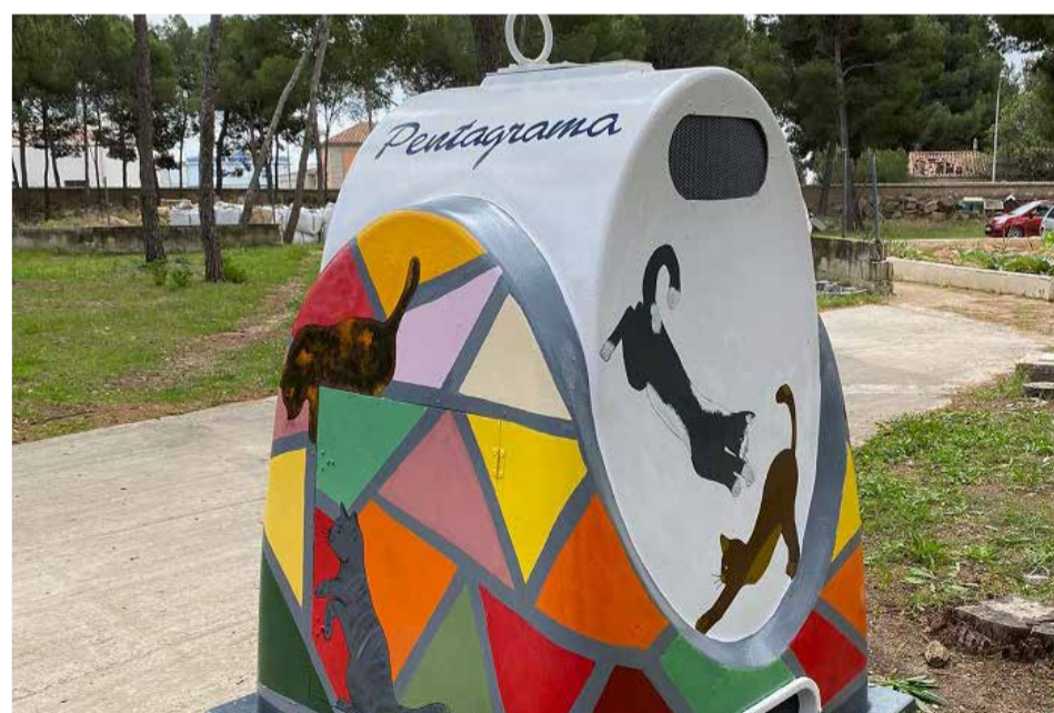
Una de las zonas para los gatos en Llíria.

Como persona amante de los animales, comprometida con el respeto y la preservación de la naturaleza, he sentido indignación en muchas ocasiones al comprobar la situación de abandono administrativo que sufren los animales que viven en nuestras calles. Todos sabemos de gatos aislados o de colonias de gatos