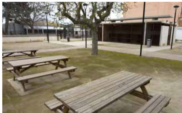
Espai recreatiu de Parc Nou.