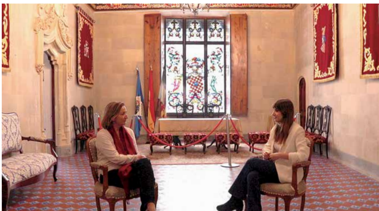
Un dels moments de l'entrevista dins el Castell de Benissanó.

► Això està passant. Teniem projectes valorats d'una determinada manera, però amb tot açò ja no té el mateix valor, i s'ha de recalcular. Per exemple, per materials que no han pogut aplegar a temps, o per els costos, que encarien les obres. Són molts els imprevistos que poden afectar un projecte.