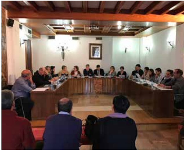
Ple de L'Eliana. / EPDA

Per part seua, i quant a la liquidesa del consistori, el romanent de tresoreria a 31 de desembre de 2021 va ascendir a 23.483.852 euros, dels quals, després de restar els saldos de dubtós cobrament i l'excés de finançament afectat a la provisió per la Planta Desnitrificadora, resulten la quantitat de 12.744.681 euros que es podrà destinar a despeses generals.