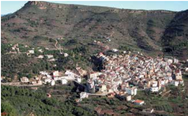
Municipio de Gátova.