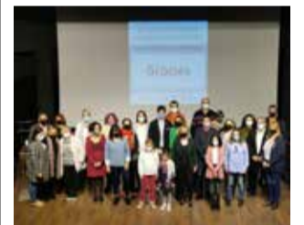
Entrega de premis