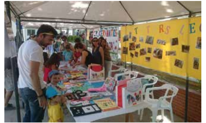
Una de les edicions de la Fira del Llibre.