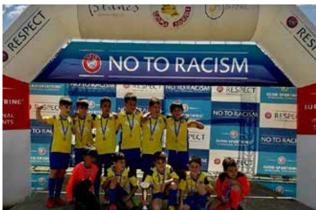
Algunos de los momentos del campeonato. / EPDA