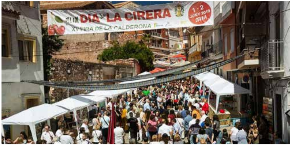
Una de les edicions de la Fira de la Calderona.