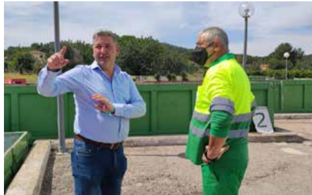
Visita del regidor a la planta.