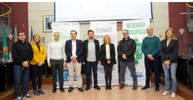
Reunió d'empreses i comerços a Bétera.

■ S'HAN DESENVOLUPAT DOS FORMACIONS ALS COMERCIANTS