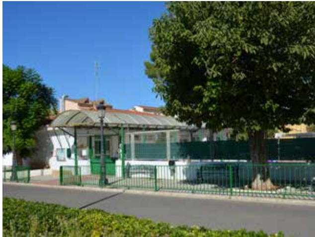
La entrada del CEIP Mozart.

Una vez obtenida, debe rellenarse el formulario de solicitud haciendo clic en la etapa educativa que vayan a cursar los alumnos y alumnas. Al realizar este proceso se obtendrá una copia de la solicitud de admisión para entregar en el colegio cuando se formalice la matrícula.