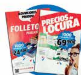
Folleto y flyers

¡Y mucho más! Nos adaptamos a sus necesidades sin ningún tipo de compromiso.