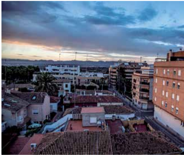
Panoràmica del municipi de Riba-roja

L'Agència funciona com una finestra al ciutadà/na a l'hora de tramitar qualsevol prestació relacionada amb l'habitatge. Es presta assessorament i informació sobre els recursos del consistori en matèria d'habitatge, es donen a conèixer les diferents ajudes econòmiques disponi-