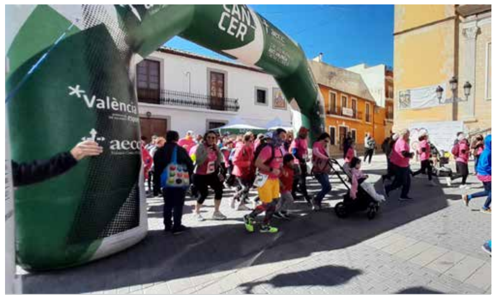
La salida de la carrera en Benaguasil

te registrado durante la carrera que busca poner de relieve la ayuda y la investigación en esta enfermedad, visibilizando la importancia de una vida sana y su prevención a través del deporte' y ha manifestado que 'hemos conseguido recaudar entre dorsales y camisetas 3.900€ que irán destinados a la investigación contra el cáncer a través de AECC Valencia'.