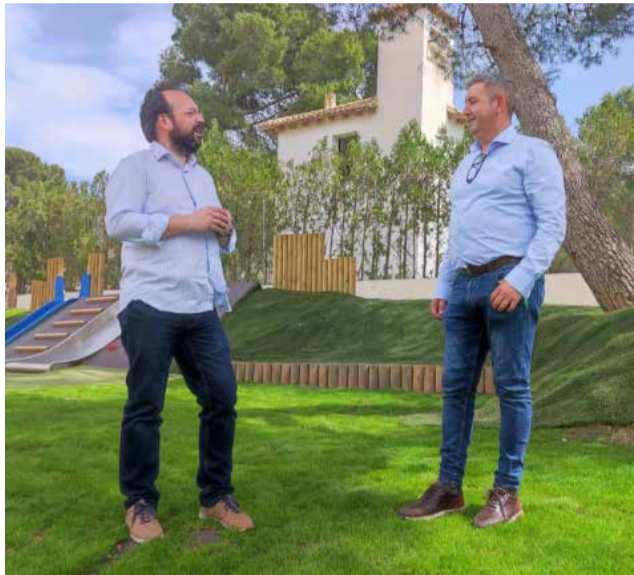
L'alcalde de Vilamarxant visitant el parc

"Cada dia treballem per aconseguir que les àrees recreatives del municipi, ja siguen en l'extraradi o en el nucli urbà, es troben en les millors condicions possibles