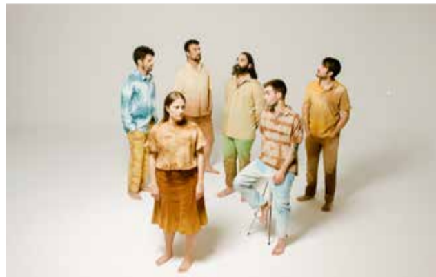
Grup El Diluvi / EPDA

Serà el 22 d'abril quan s'inauguren oficialment les festes vicentines amb l'acte de presentació