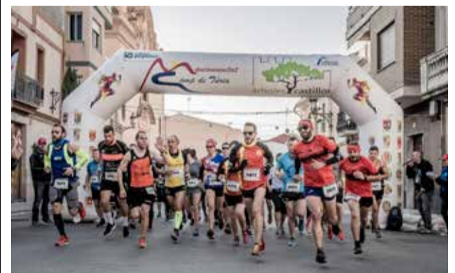
Corredores de una de las ediciones. / EPDA