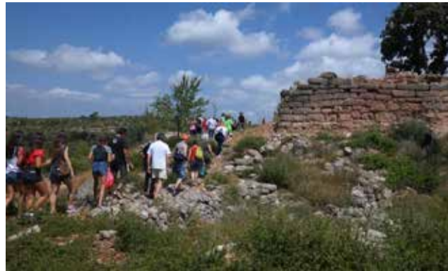
Torrejón de Gátova.

TIENE UNA GRAN ACOGIDA ENTRE LOS VISITANTES A LA ZONA