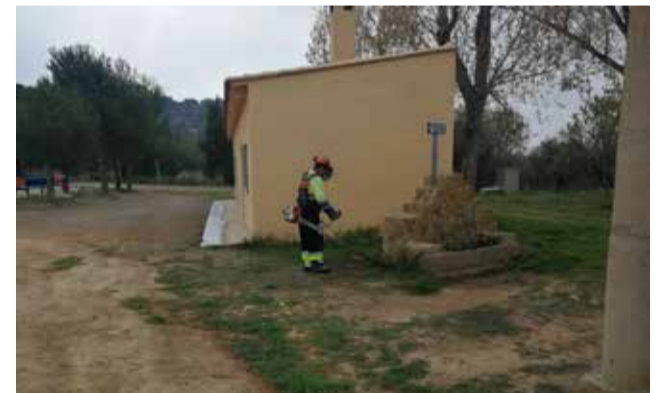
Limpieza de la zona.