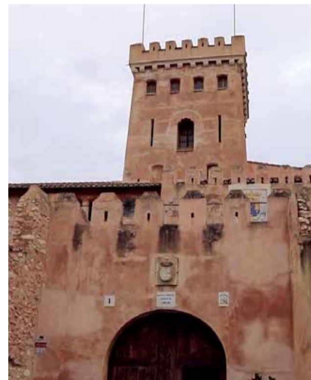
Exteriors del Castell de Benissanó.

ta tenim a la Mancomunitat Camp de Túria que és la que d'alguna manera coordina als municipis que volen acollir-se a les ajudes. Les ajudes europees són una injecció molt important, crec que no havíem tingut unes tant necessàries.