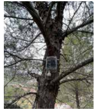
Un dispositivo.

La función de los equipos es doble; por un lado, recoger datos históricos de las condiciones de la masa forestal para la elaboración y publicación de mapas de