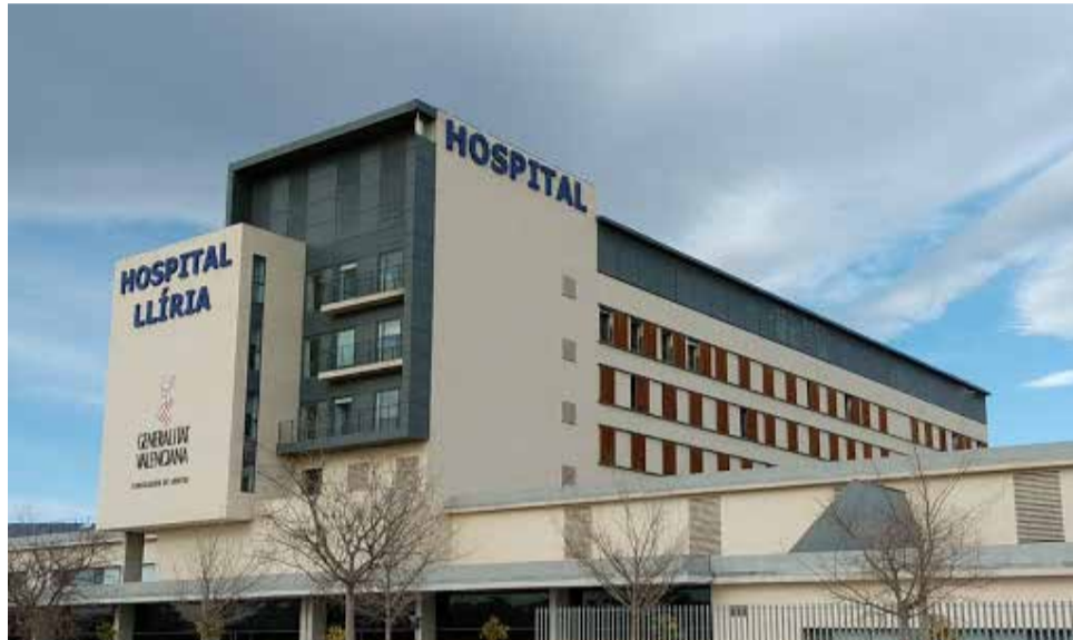
Exteriores del Hospital de Llíria

El sindicato continúa explicando que en lo que respecta a TCAE, Sanitat solamente ha previsto dos plazas, “un recorte extremo que va a seguir tensionando una plantilla agota-