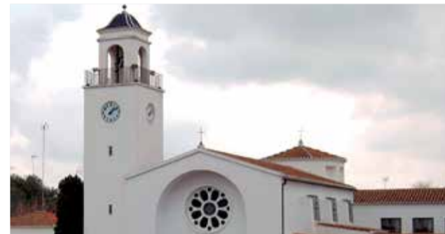
Arriba, el acto del aniversario de San Antonio.