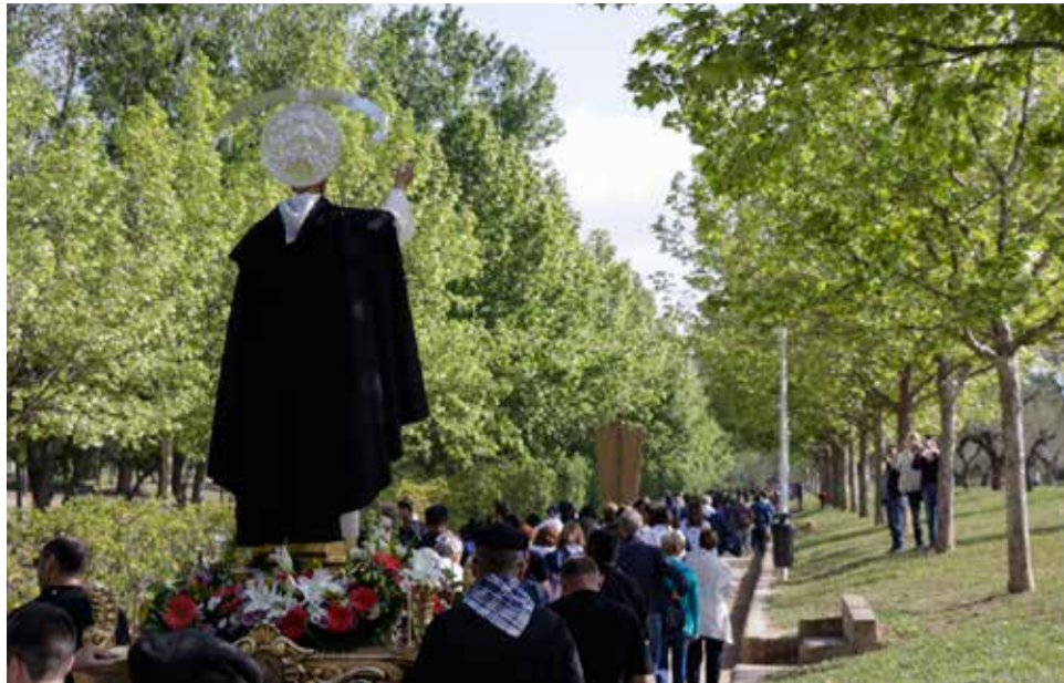
La celebració de Sant Vicent al parc de L'Eliana

El diumenge 24, després del Festival de Paelles, arribarà un dels principals plats forts dirigits a la gent jove en estes festes. A les 16.00 hores, al parc de Sant Vicent, actuarà El Diluvi, un dels grups de folk modern en valencià més destacats del panorama actual. Amb el seu recentment cinqué àlbum 'Present',