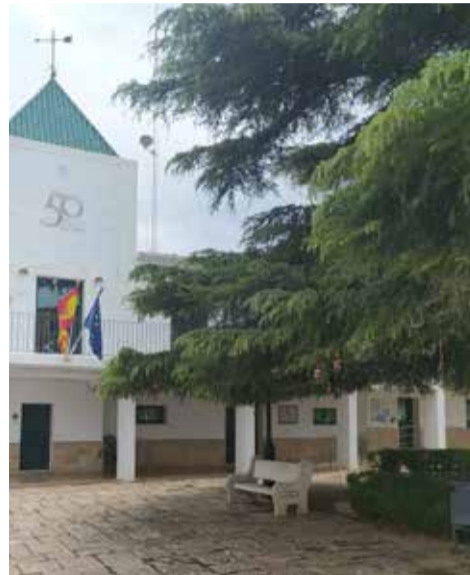
Patio del Ayuntamiento

la convocatoria del Plan de Inversiones para el Bienio 2020/2021. Con esta actuación se pretende conseguir mayor cercanía con la ciudadanía, dando así mayor am-