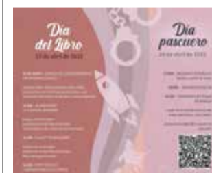
Cartel San Antonio.