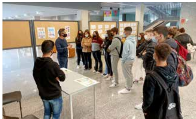
Una de las presentaciones a los alumnos

Una forma de crear sinergias entre las personas con ideas de negocio. Se han creado mesas de trabajo de colaboración entre ellos y ellas. Y para que la juventud pueda comprobar de primera mano qué es ser un emprendedor/a las personas que han montado una empresa con el apoyo de personal técnico de la Mancomunitat Camp de Túria han realizado una muestra de sus productos y han respondido las dudas de los jóvenes. Una mañana que han aprove-