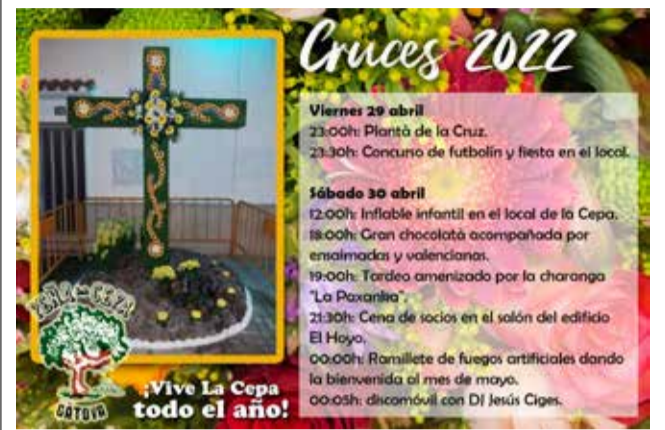
Cartel de las Cruces de Mayo.

SE COMBINA LA PLANTACIÓN DE LA CRUZ CON ACTIVIDADES DE LA PEÑA