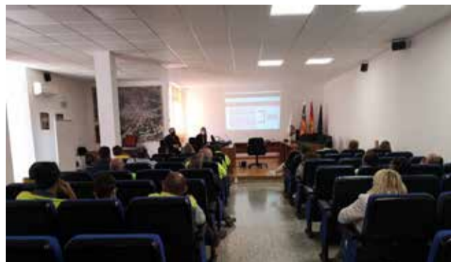
Presentació de les formacions.

■ ES VA PARLAR D'ESTEREOTIPS, LENGUATGE INCLUSIU O ROLS DE GÈNERE