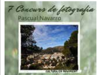
Cartel de Serra / EPDA