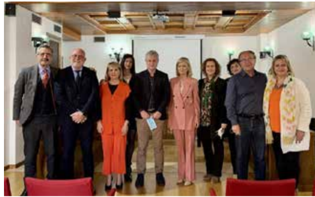
Jutges de Pau a L'Eliana.