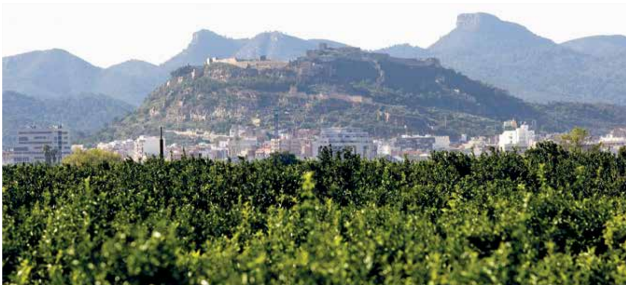
Campo de cultivo de Sagunto, capital del Camp de Morvedre.

hólicas. Es fácil encontrarlos en la mayoría de fruterías y supermercados de la zona, que apuestan por el producto local. De hecho, en 2021 se llevó a cabo el acto simbólico del primer corte de la naranja valenciana en el municipio, donde acudie-