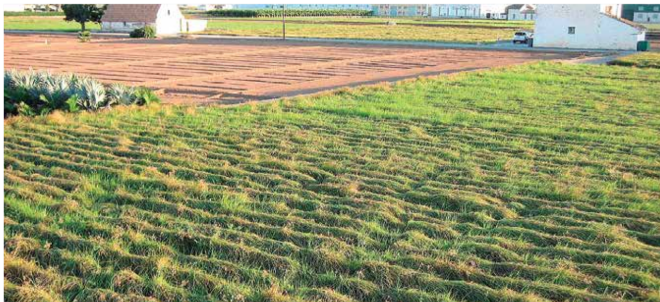
Huerta de Alboraya con cultivo de Chufa.

tecedente de la actual horchata. En la actualidad, Alboraya y Almàssera son los que conservan el grueso de la producción de este tubérculo.