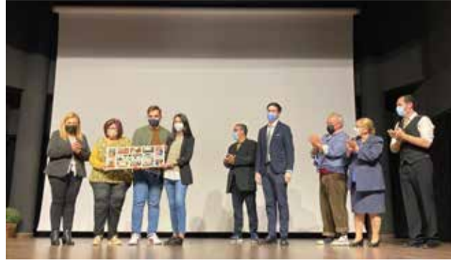
Recepció de la placa commemorativa. / EPDA