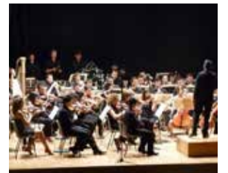
Un concert a L'Eliana.