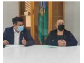
Jornada empresarial.