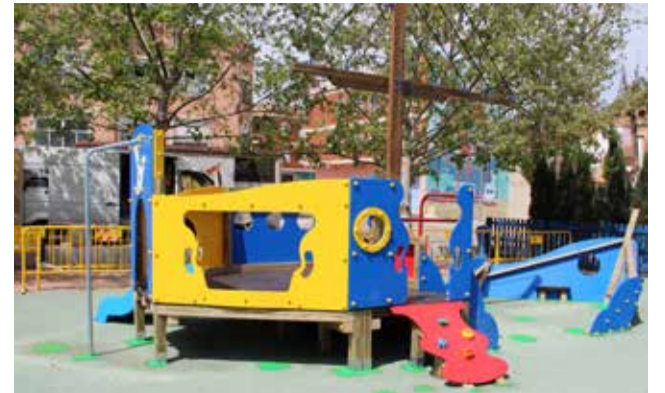
Uno de los parques reformados.