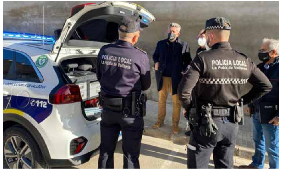
Agentes de la policía reunidos con el alcalde en una imagen de archivo

Señalan que esta situación ha llegado tras la decisión de "romper de manera unilateral" el acuerdo vigente desde 2016