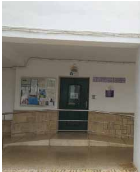
Entrada al Ayuntamiento