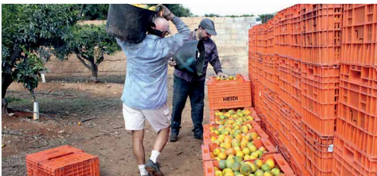
Campo de naranjas en Picassent, Horta Sud.