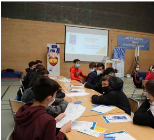
Alumnos durante un debate

También los jóvenes han estado debatiendo, han fomentado la consecución de los ODS en Benaguasil y pro-