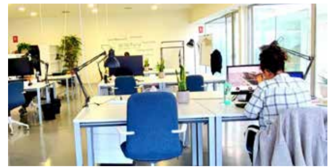
Una de les oficines de l'Ajuntament de Vilamarxant.

■ S'HAN DESENVOLUPAT DOS FORMACIONS ALS COMERCIANTS