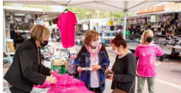
La parada solidària del Runcàncer.

■ LES SAMARRETES SOLIDÀRIES COSTARAN SIS EUROS, MENTRE QUE ELS DORSALS ES TROBEN A CINC EUROS