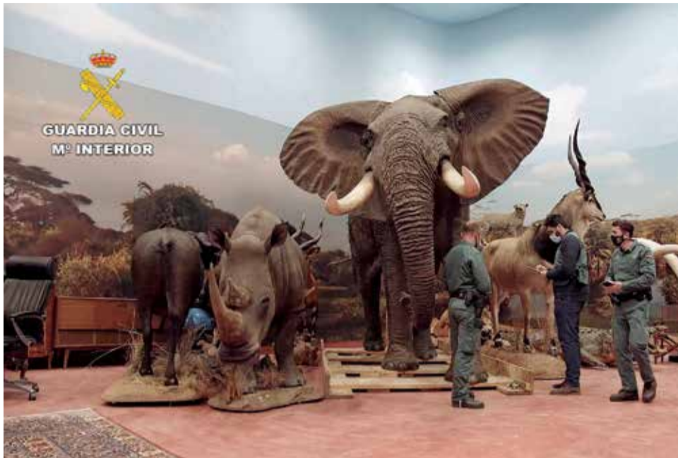
Algunos de los ejemplares incautados

Tras este hallazgo, en un recinto de más de 50.000 metros cuadrados, se ha investigado a una persona por los presuntos delitos de contrabando y otro relativo a la protección de la flora y fauna.