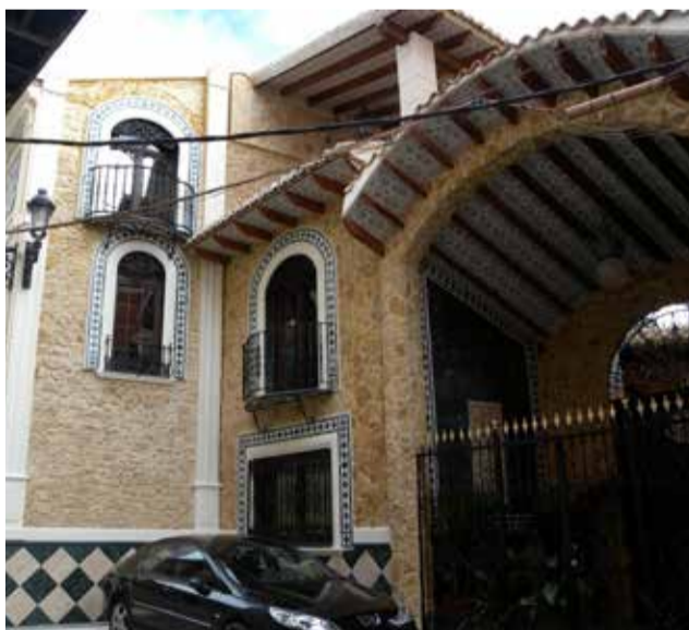
Uno de los rincones de Casinos