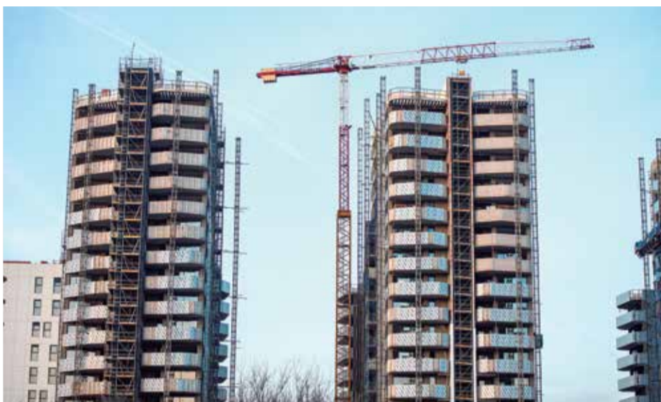
Arriba, una arquitecta técnica en su despacho. Abajo, promoción de viviendas.