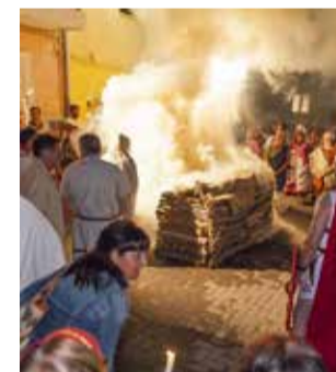
Una de les Iberfestes.

En aquest sentit, la pròxima edició de la Iberfesta comptarà amb recreacions com la boda i el soterrar ibers o el rapte del guerrer Nauiba, en les quals la participació popular resulta fonamental. Per això, en la reunió es va animar, com en anys anteriors, a totes les persones interessades a col·laborar-hi i es van presentar les vies a través de les quals poden sol·licitar la seua participació: el número de telèfon 672 794 404 i l'adreça de