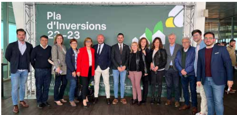
El president de la Diputació, Toni Gaspar, amb els líders municipals.

L'AJUNTAMENT DESTINARÀ AQUEST IMPORT A DIVERSES INFRAESTRUCTURES