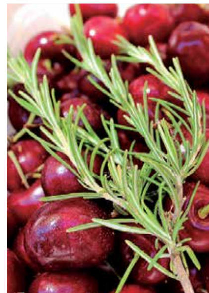
Cerezas de Serra.

de la comarca del Palancia, manteniendo un mínimo de actividad y consecuentemente contribuyendo al sostenimiento de la población.