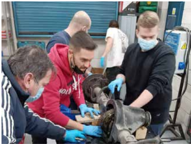
Veïns de Riba-roja treballant en un taller.

Les dades mostren que entre març de l'any 2012 i març d'enguany s'ha experimentat una millora en les llistes d'aturats a Riba-roja de Túria, amb fins a 861 persones menys sense ocupació, és a dir, un descens del 27'3% en total en l'últim decenni. Actualment, el nivell d'atur està situat en 1.420 persones sense un lloc de treball, dels