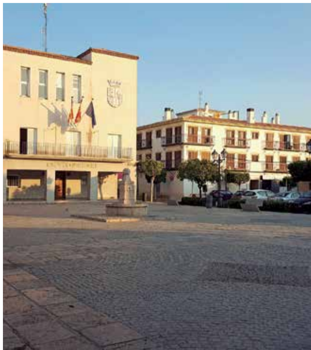
Plaza de San Antonio de Benagéber

La historia de San Antonio de Benagéber es relativamente moderna, pues el municipio nació en la década de los cuarenta y se constituyó como Entidad Local Menor el 5 de agosto de 1957, dependiente del Ayuntamiento de Paterna. Tras un arduo proceso, el 8 de abril de 1997 San Antonio de Benagéber fue segregado del término de Paterna y constituido como municipio independiente, una efeméride que la población celebra este 2022 por todo lo alto.