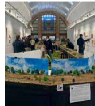
L'exposició.