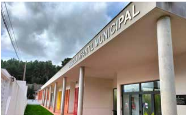
Escola municipal de Nàquera. / EPDA