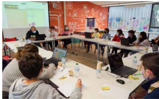
Los jóvenes participando en el Fòrum.

El I Fòrum JoveSab obtuvo una gran participación por parte de los y las jóvenes, muchos de ellos vinculados a diferentes colectivos y asociaciones del municipio. Se trató de un encuentro muy enriquecedor en cuanto a las propuestas planteadas así como por el buen ambiente entre todos los participantes, que al finalizar se trasladaron a la cancha del mercado para participar en una actividad de Tiro con Arco.