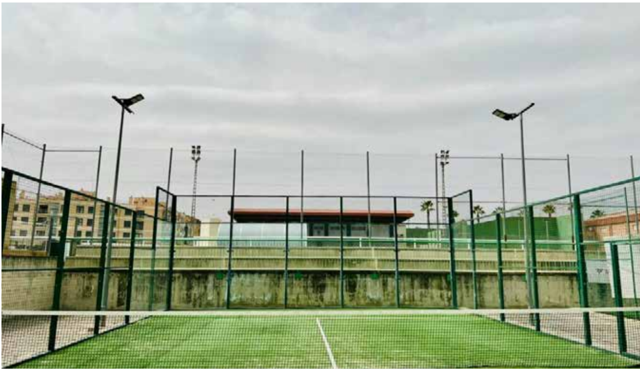
Una de las pistas del espacio deportivo municipal