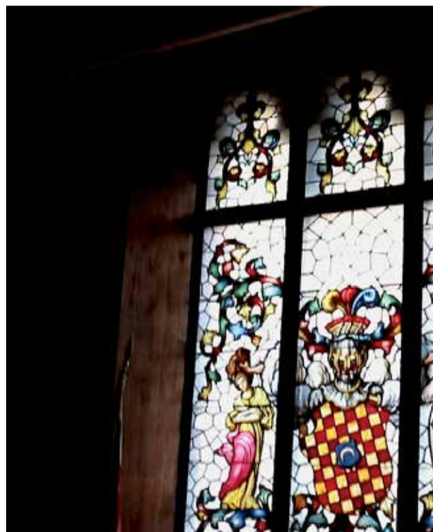
Interior del Castell. / ALBA JUAN