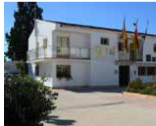
Loriguilla / EPDA