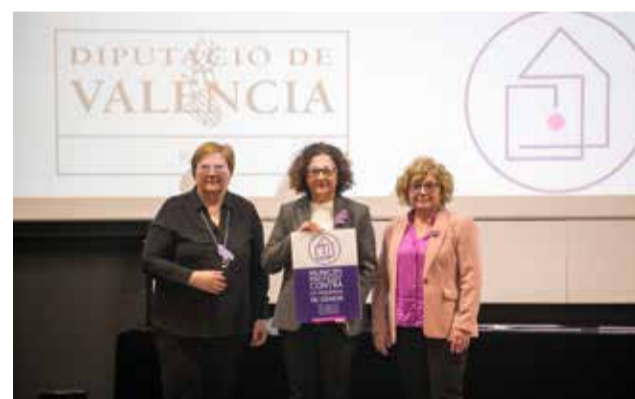
Recepción de las placas durante el acto.