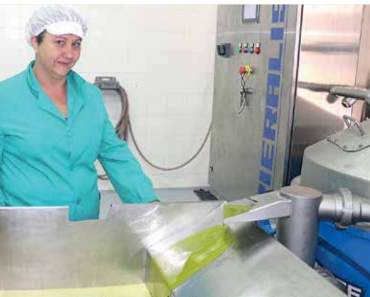
en el Palancia.

► HISTORIA. Los agricultores locales conforman la historia de este tradicional trabajo.