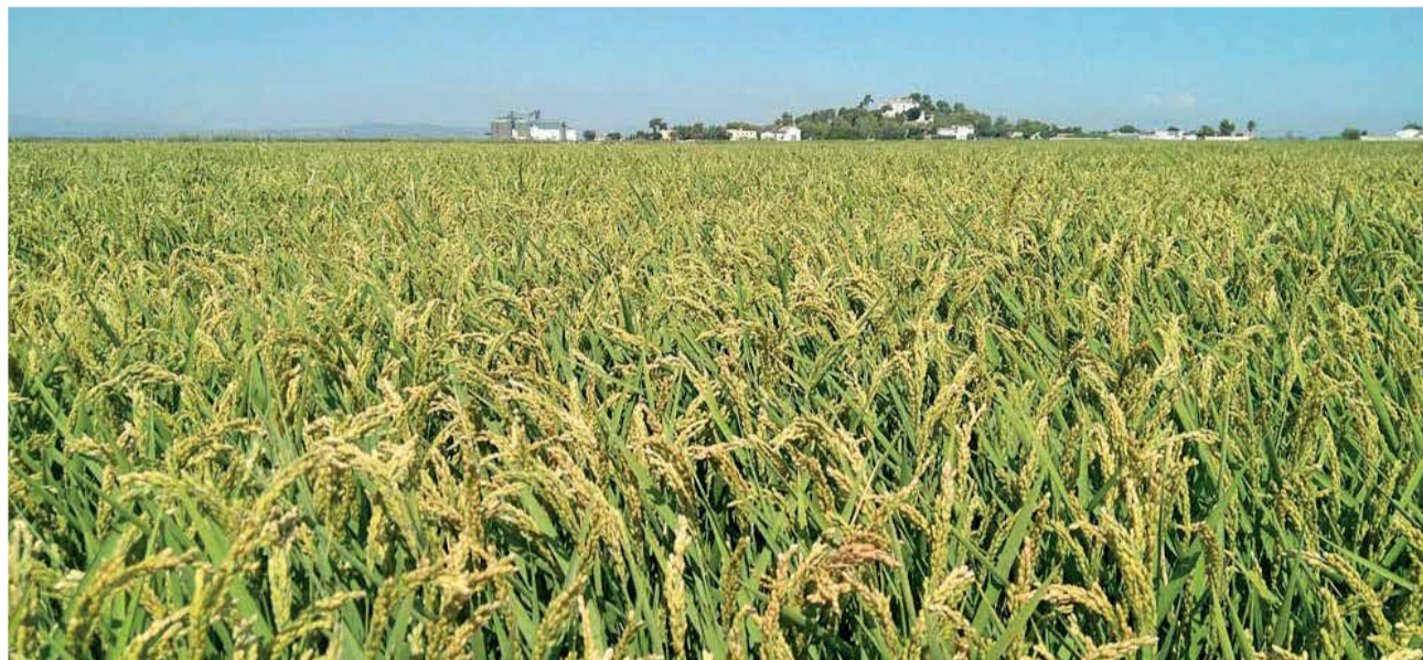
Arrozales de Sueca, capital de la Ribera Baixa.

La cultura islámica hizo expandir el cultivo de la chufa en las áreas mediterráneas de la actual Comunidad Valenciana, existiendo constancia por escrito que en el siglo XIII ya se consumía ampliamente una bebida refrescante llamada llet de xufes, sin duda alguna an-