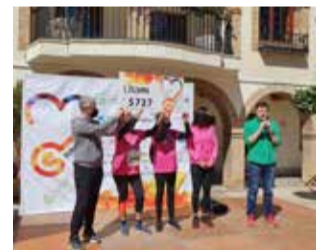
Corredors. / EPDA