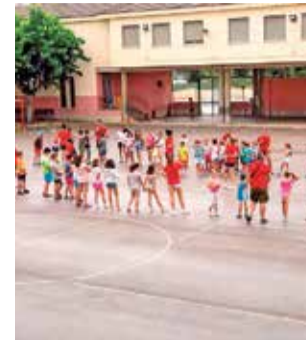
Alumnos en Mislata.

El programa incluye toda una serie de actividades diri-