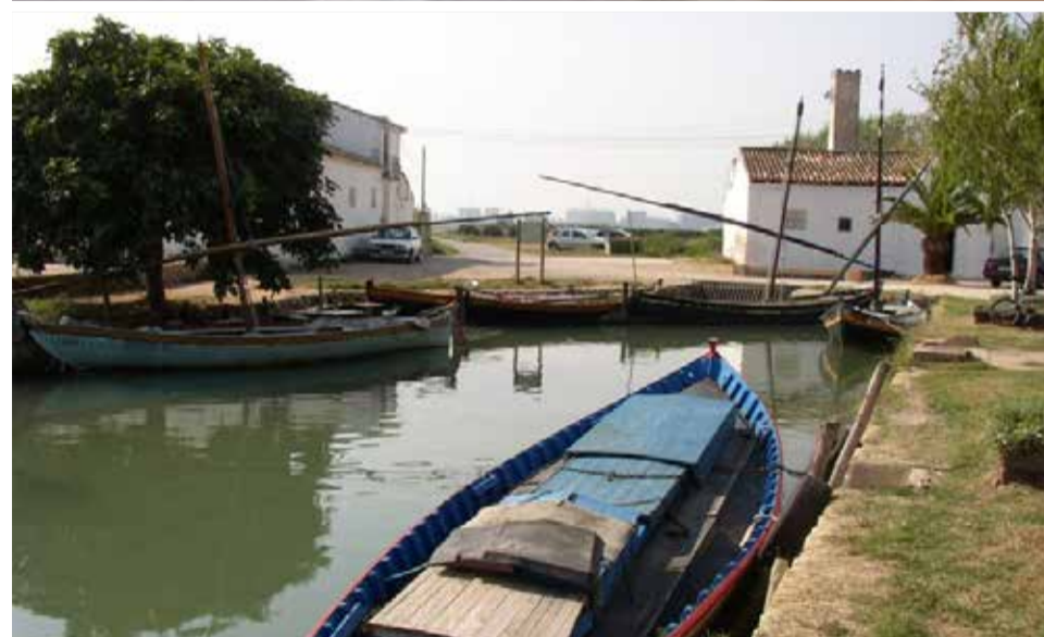
Diferentes zonas de Silla.

latura quede claro el asunto, porque como patrimonio etnográfico la Dança y la Carxofa son dos señas de identidad de ámbito cultural que une a la gente de Silla y ese ámbito cultural al final, es como el arte, es lo que acaba perdurando. Es nuestra identidad como pueblo.