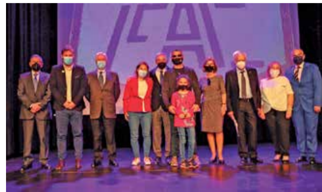
Premis Ciutadà 2022.