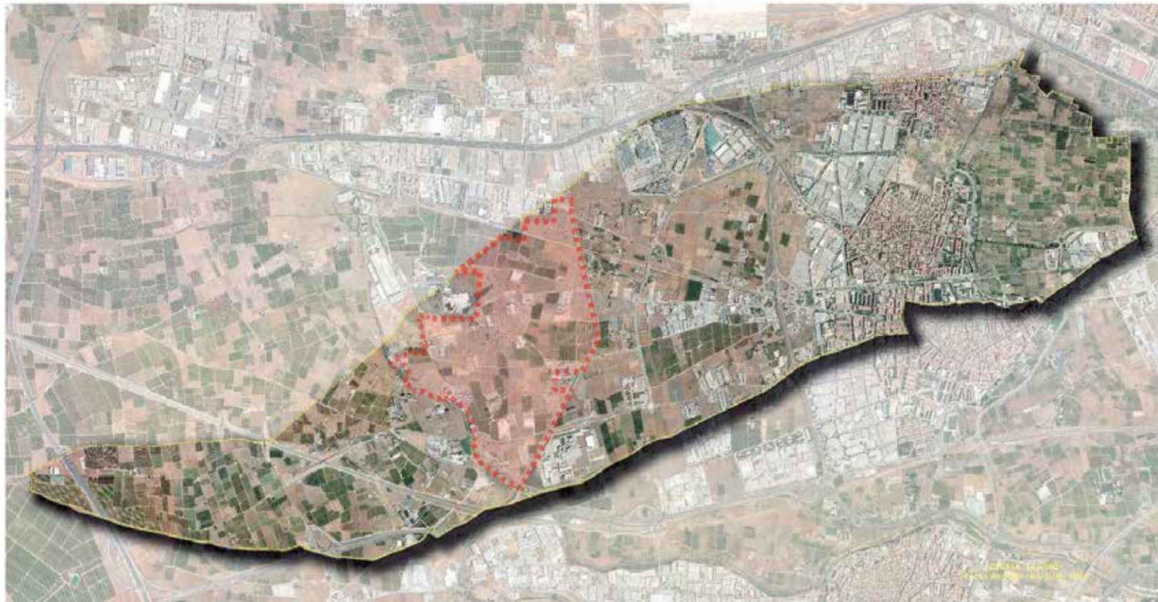
Parc Empresarial a Aldaia.