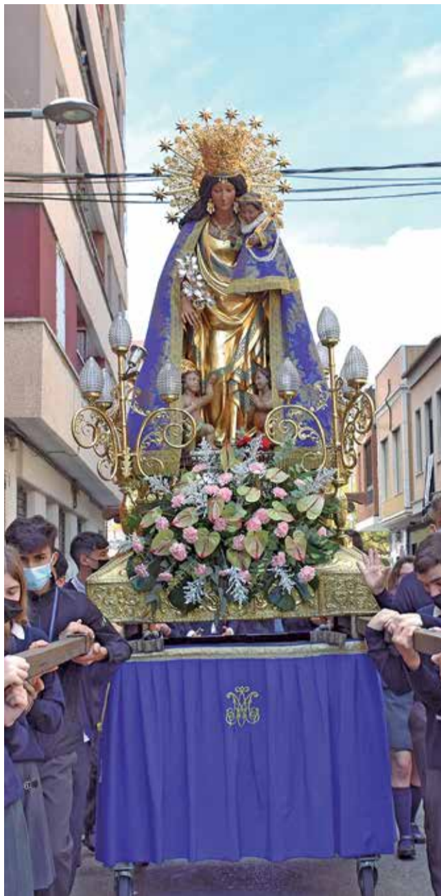
Visita de la Mare de Déu a Alfagar.

L'Ajuntament d'Alfagar ha col·laborat amb el col·legi Maria Inmaculada en l'organització de la visita de la Verge dels Desemparats al municipi