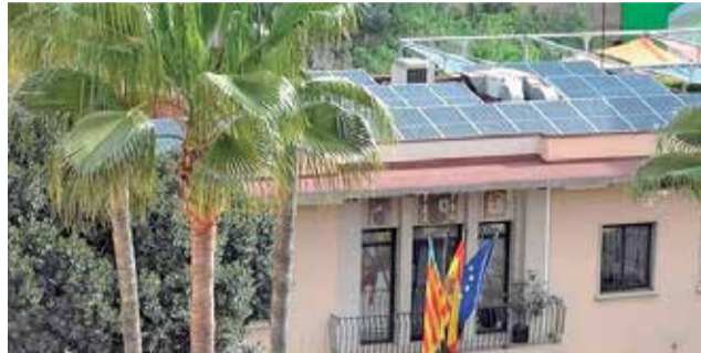
Plaques solars a Picanya.

La instal·lació està recollida dins de la modalitat d'autoconsum amb excedents compensats del Reial