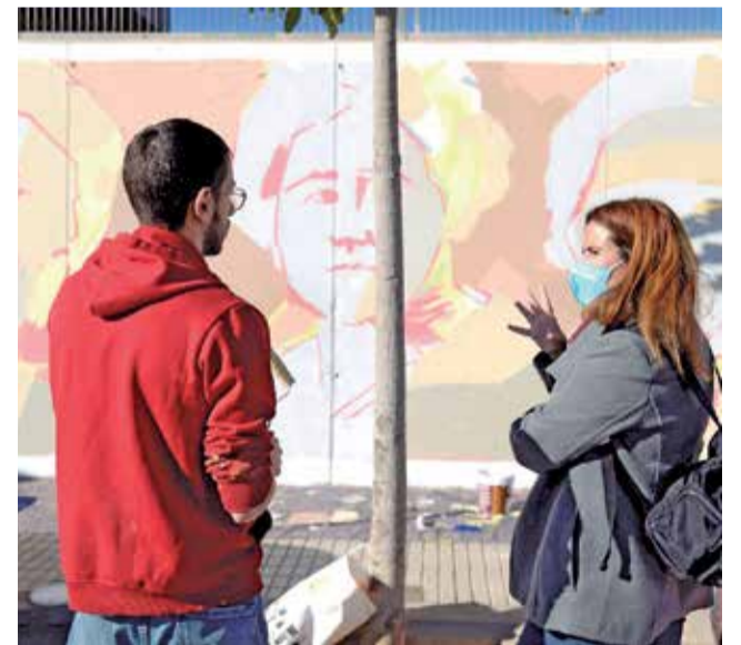
Art urbà a Paiporta.

La informació completa, així com les bases del concurs, es pot trobar al web d'#StreetArtPaiporta.