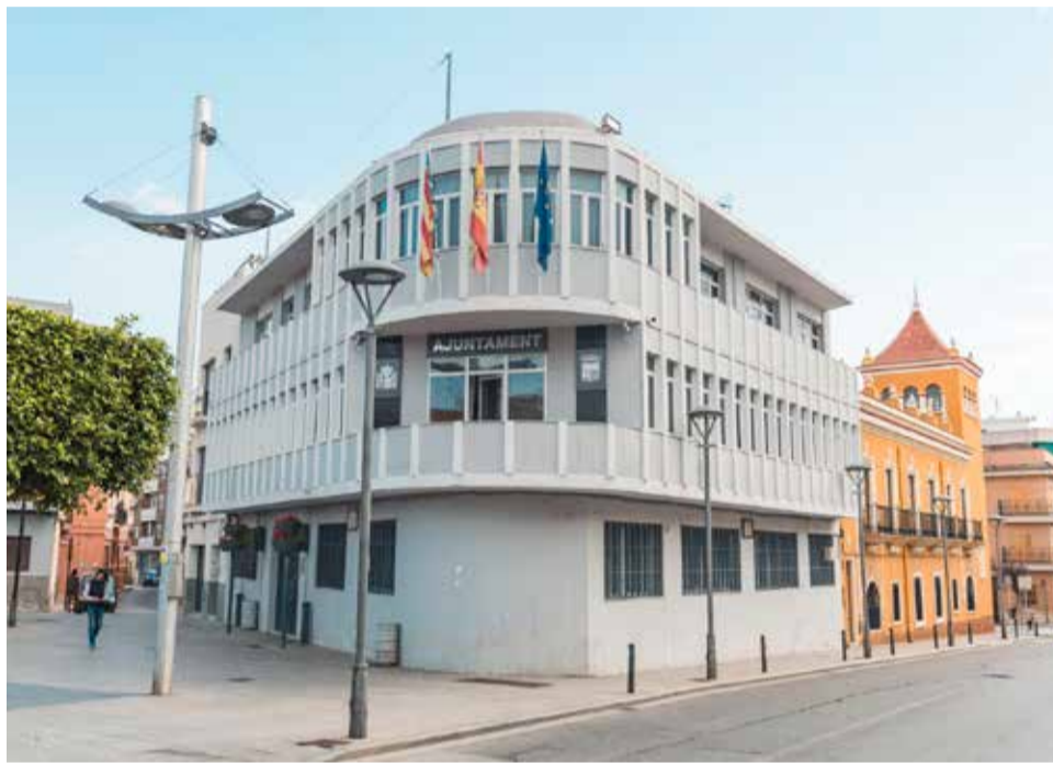
Ajuntament de Picassent.