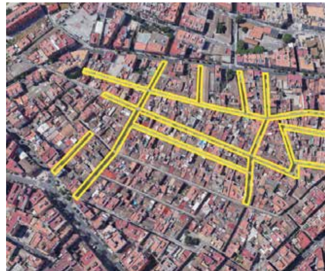
Fase III del Pla de Reurbanització en l'Alter.

Cal destacar que la intervenció, 2.693.958 euros, compta amb el cofinançament dels Fons Europeus Next Generation EU