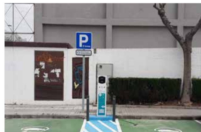
Nou punt de recàrrega.

La instal·lació del segon punt de recàrrega té un cost lleugerament superior als deu mil euros, dels quals l'Institut Valencià de Competitivitat Empresarial IVACE, subvenciona un 80%.