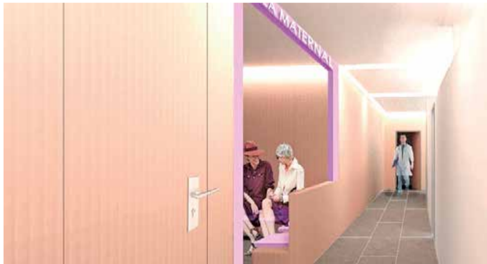
Nou centre a Torrent.

Per part seua, l'Àrea d'administrativa d'este nou centre sanitari se situarà