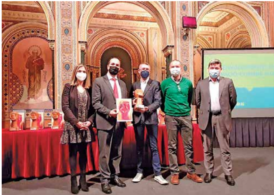
Entrega del premia a Aldaia.

En el seu parlament, Luján ha explicat que "en el període més dur de la pandèmia, amb alguns sectors econòmics sota restriccions màximes i altres directament sense poder pujar les seues persianes, ens plantejarem com podíem ajudar des de l'àmbit local, i dissenyarem el Fons de Rescat"