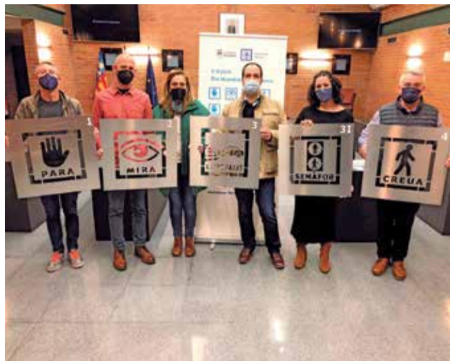
Pictogrames a Aldaia.

"Les imatges il·lustraran i recordaran de manera clara, a la primera línia dels passos de vianants, com actuar a l'hora de creuar un ca-