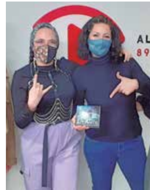
Radio Aldaia. / EPDA

Amb la visita de JazzWoman, s'ha presentat una novetat molt esperada a l'emissora local. La cantant protagonitza una col·laboració on posa veu a la nova campanya promocio-