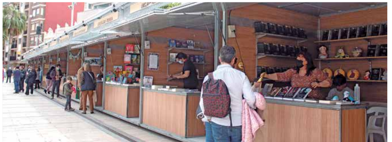
Feria del libro en Alfatar. /