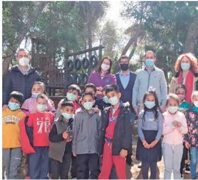
Activitats de Medi Ambient.

"L'objectiu d'aquesta iniciativa és generar una experiència d'aprenentatge fora de les aules, directament en el medi natural i amb les persones i col·lectius que treballen dia a