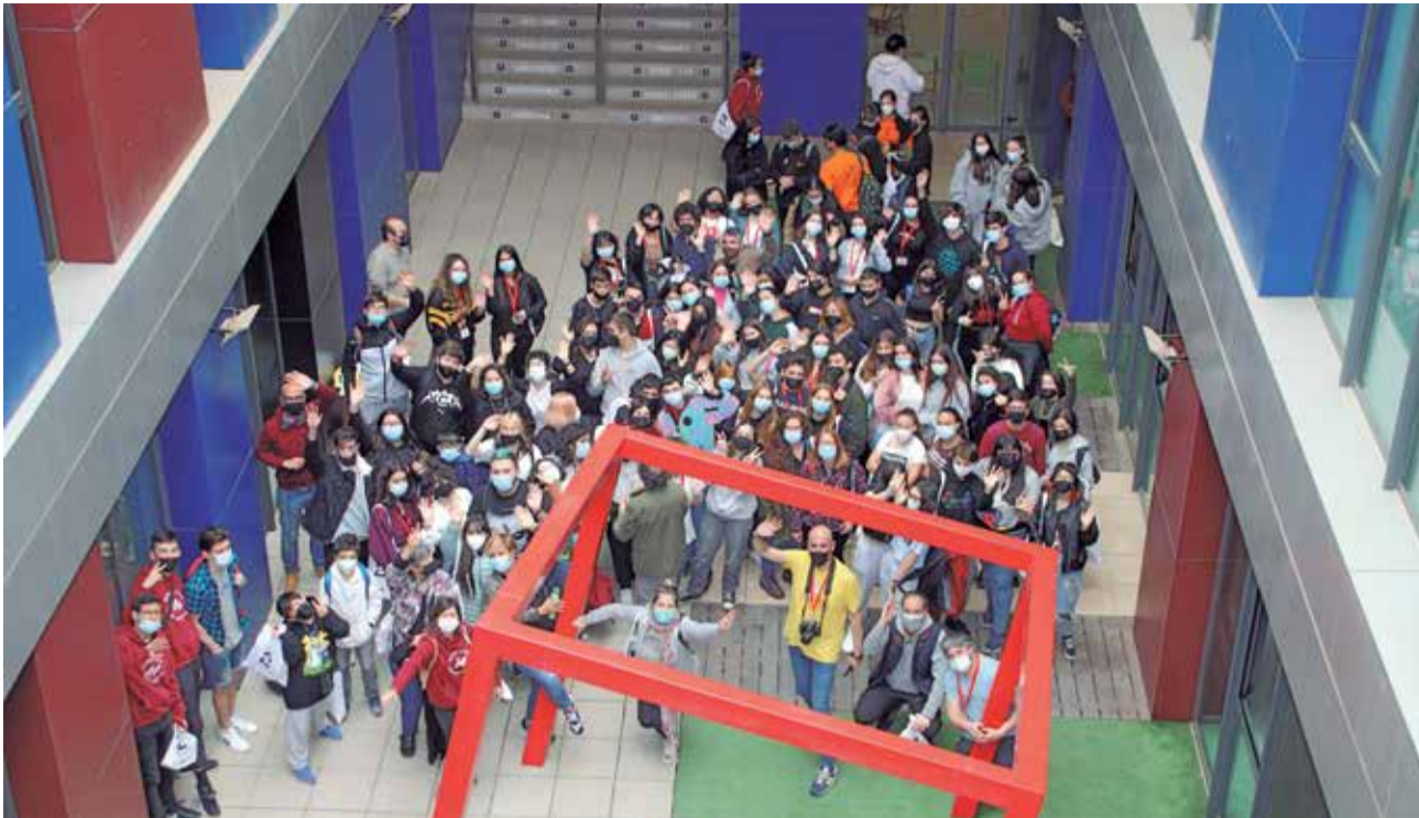
Trobadra de Corresponsals Juvenils de la Xarxa Joves.net. / EPDA