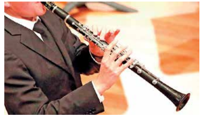
Un clarinet.