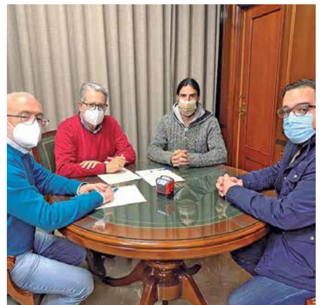
Firma del convenio en Albal.

tendientes al consumo de productos ecológicos, locales y de temporada que contribuye a difundir una dieta sana y saludable, concienciar a la ciudadanía de la necesidad de un modelo de consumo más responsable, así como colaborar con los pequeños productores locales para darse a conocer y que, sus productos, tengan salida, a un precio digno y razonable, en el ámbito de la Comunidad Valenciana.