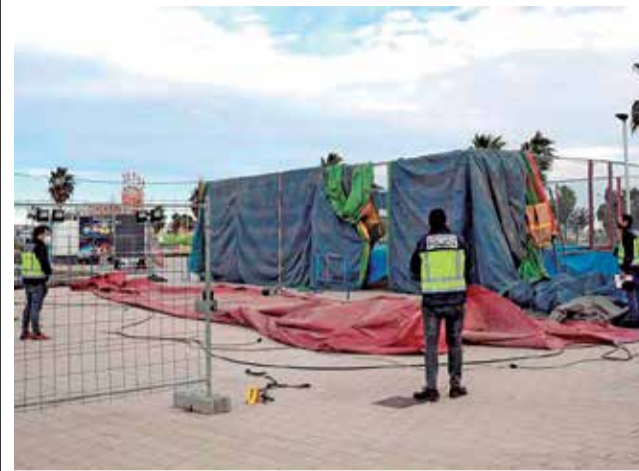
Castillo hinchable accidentado.