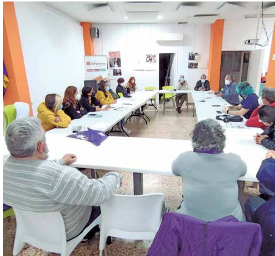
Reunión de Compromís per Paiporta.

promís, donde en ningún momento se acordó prohibir este tipo de actos o no permitir su celebración".