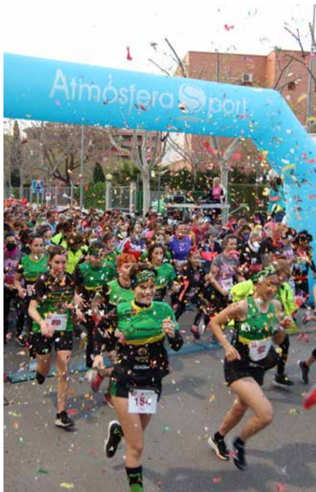
Un instant de la carrera.

La carrera va comptar amb una gran participació