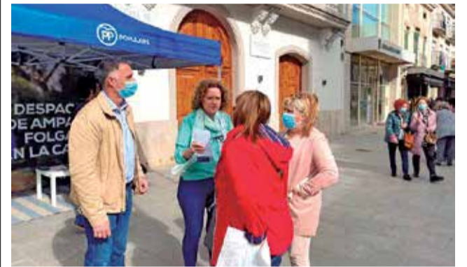
Partido Popular de Torrent.

La portavoz de los populares ha lamentado, tras haber dado cuenta el Sr. Ros al Pleno municipal del superávit generado en 2021, que no se hayan bajado los impuestos en 2021. La propuesta de los populares planteada a finales de 2021 y que ahora reafirman es la bajada del IBI, el IAE, el Impuesto de Circulación y el ICIO.