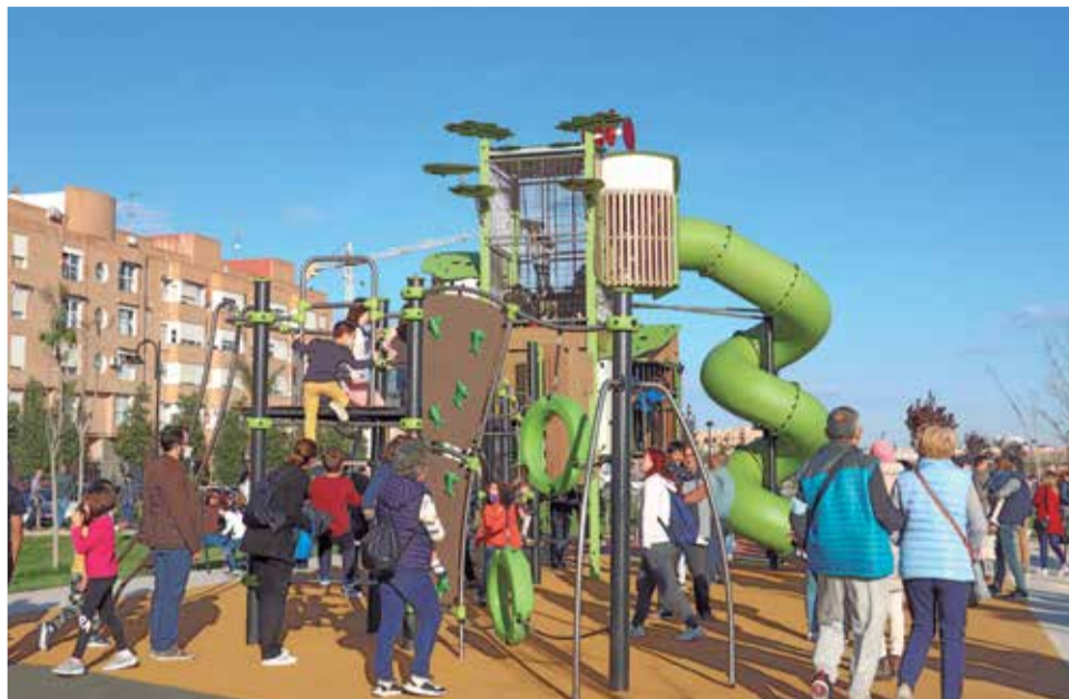
Una de las zonas de ocio del barrio.

Las nuevas instalaciones, junto al futuro equipamiento que se ha planeado, convierten a este PAI en un ejemplo de modelo de urbanización sosten-