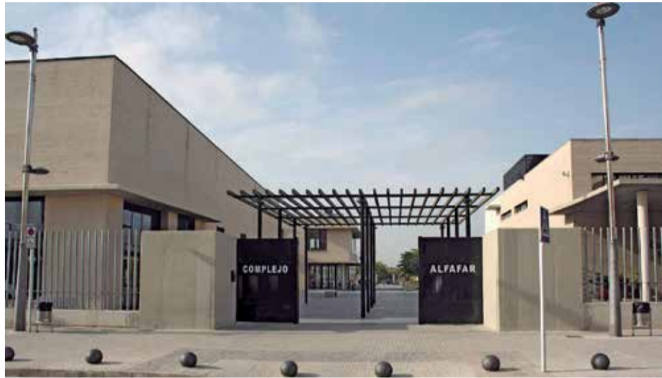
Complex esportiu Alfajar.

El pressupost per a esta convocatòria és de 4.000 euros, i les beques seran d'un màxim de 300 euros per esportista. Estes ajudes són