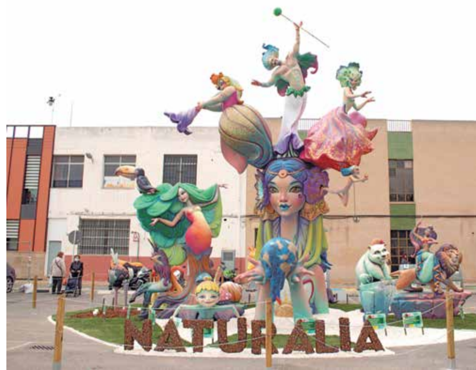
Falla El Sequer d'Alfagar.

la Igualtat. Tant en el monument gran com en la categoria infantil, el guardó ha sigut per a la Falla El Sequer. Després de l'emocionant vesprada de premis, les set comissions falleres han seguit amb els actes programats.