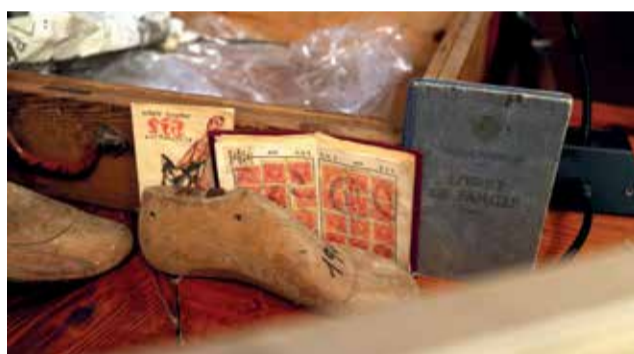
Instantáneas durante el homenaje.

española. “Mi padre fue siempre fiel a sus ideales y recordó su pueblo con cariño, ya que conservaba viejas amistades; una vez pudo volver a Cheste visitó el pueblo dos