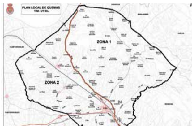
Mapa del Plan Local de Quemadas / EPDA

- Zona 1: Situada al noreste de la línea que divide el término. Comprende la Sierra del Negrete, barrancos y la