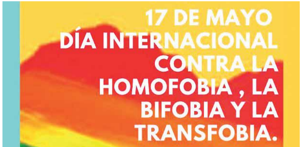
Concurso con motivo del 17 de mayo.