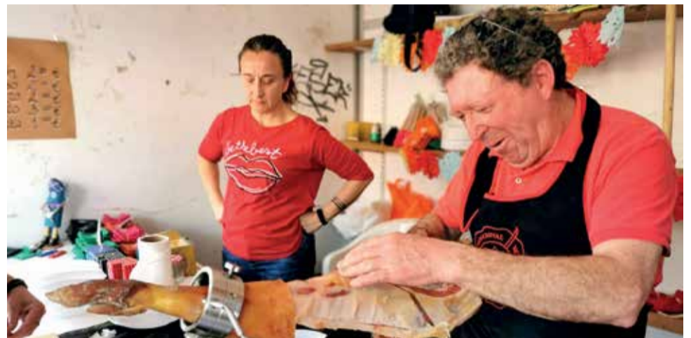
Dos comerciantes de unos de los puestos locales de la Feria.