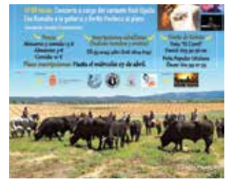
Cartel Jornada.