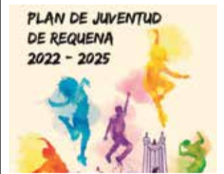
Cartel Plan Juventud.