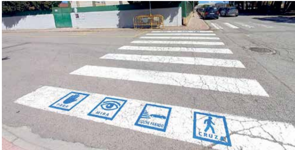
Paso de peatones con pictogramas.

Un proyecto pionero en la comarca con pictogramas específicos que agrupan seguridad vial y accesibilidad