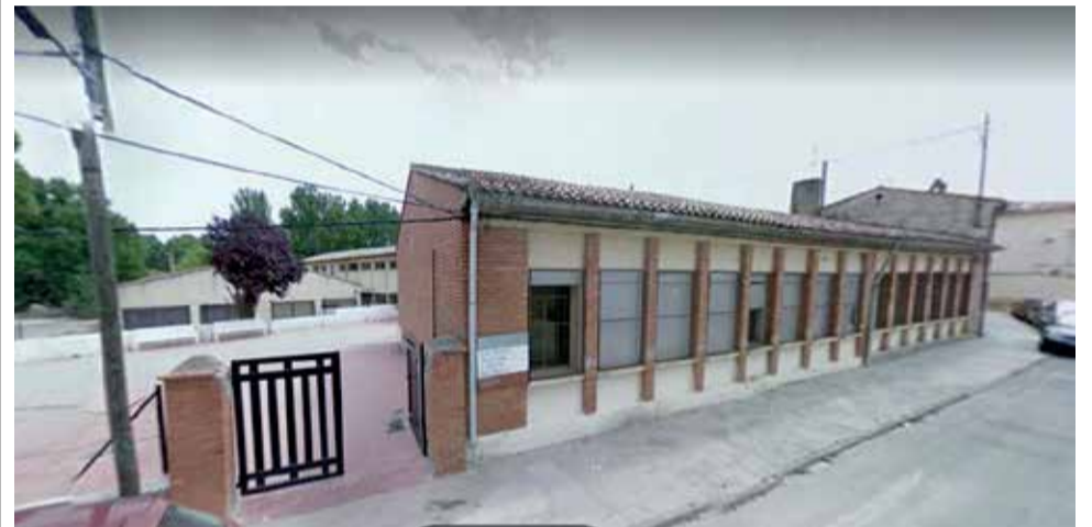
CEIP Maestro Aguilar de Camporrobles.