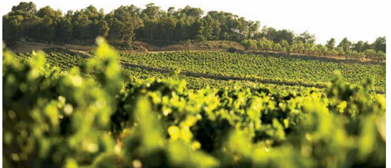
Viñedos de Requena.

Como ha señalado el conseller de Política Territorial, Obras Públicas y Movilidad, Arcadi España, "estos trabajos tienen como objetivo la conservación y revalorización de unos paisajes productivos e identitarios asociados a la cultura me-