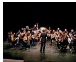
Barranco de Chiva.