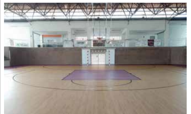
Pabellón Cubierto de Utiel.