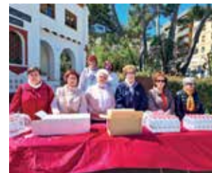
Voluntarias. / EPDA