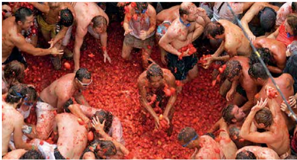
Foto archivo de La Tomatina.