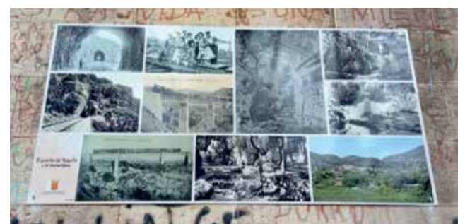
Exposición de las fotografías antiguas.

“donde los grupos de amigos van vestidos con esloganes en sus camisetas con fondos de todos nuestros lugares, que continúan siendo referente en toda la Comunitat Valenciana”. Pérez confirma que las fotografías recopiladas abarcan desde finales de 1800 hasta la actualidad. Se trata de paneles fotográficos instalados en el Parque de la Violeta, Ci-