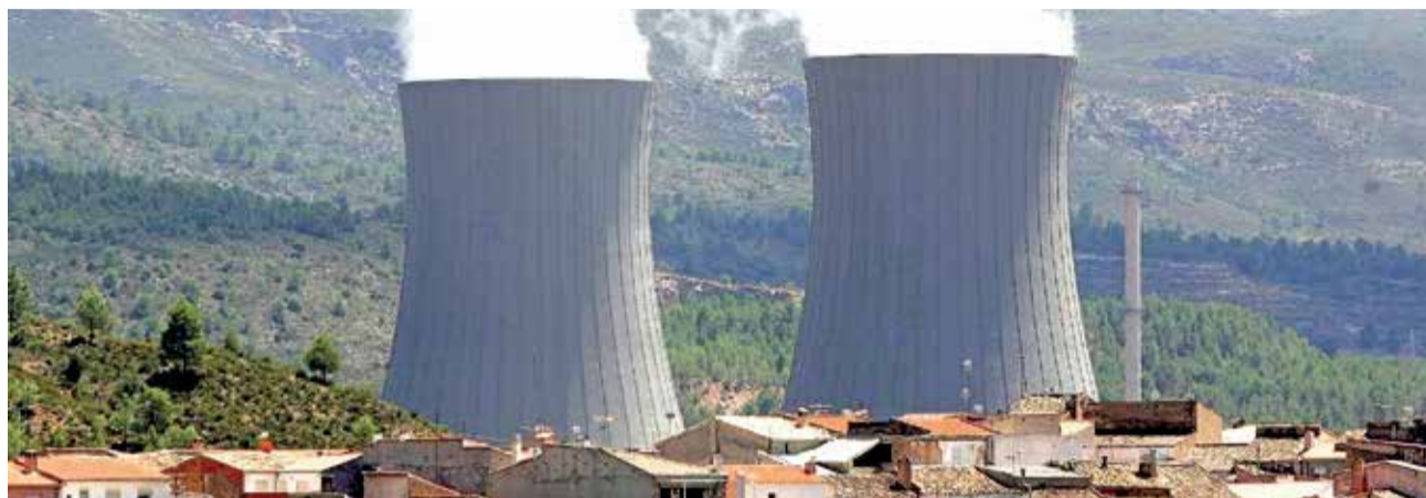
Central nuclear de Cofrentes.