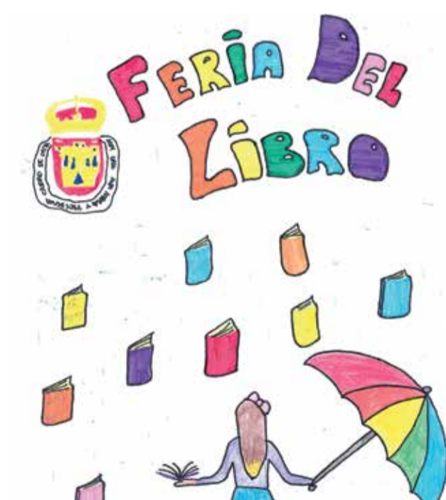
Cartel ganador.

El premio está dotado con un cheque regalo de 80 euros para material bibliográfico a canjear en los stands de la Feria del Libro o en cualquiera de las librerías del municipio. La iniciativa, puesta en marcha