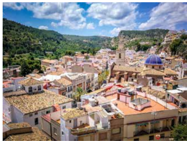
Vista de Buñol.