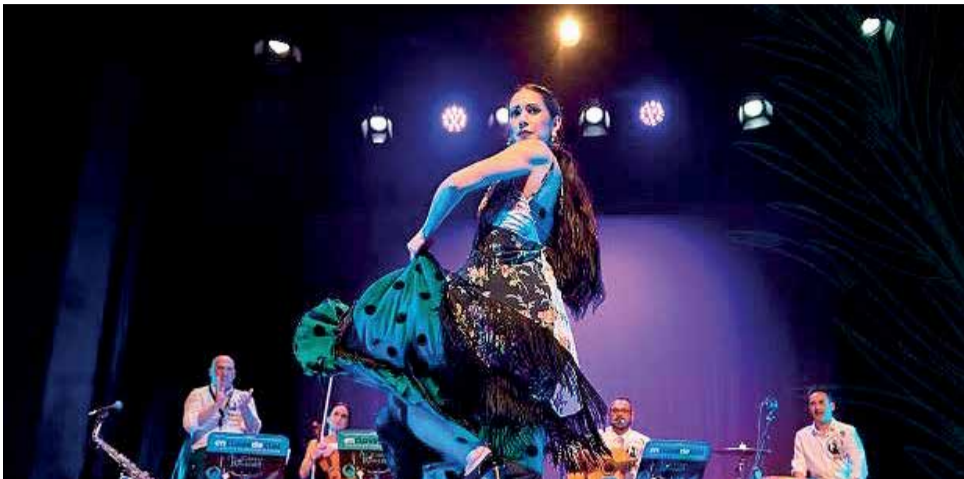
Espectáculo de "En Clave de Clot".