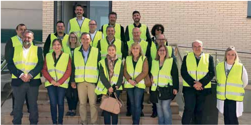
Foto de familia de los representantes públicos en Caudete de las Fuentes .