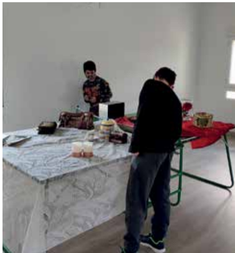
Algunas de las actividades en Venta del Moro.