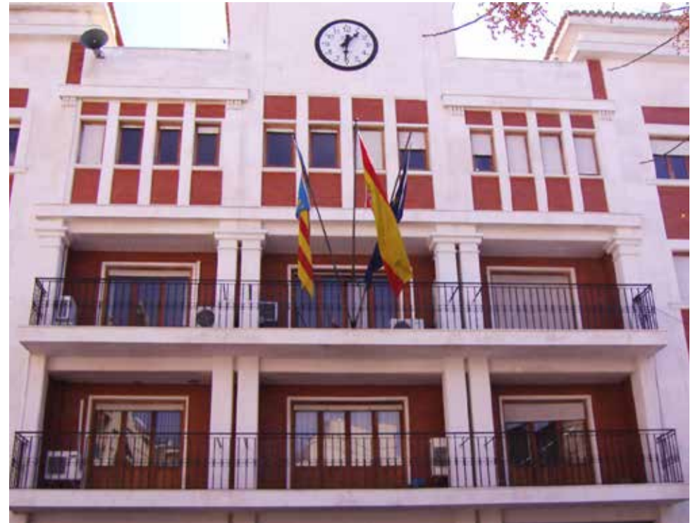
El Ayuntamiento de Chiva.

La ampliación de la vigencia surge de la experiencia adquirida durante 2021, en el que se firmaron una treintena de convenios con municipios. De ello se desprende la necesidad de mejorar parte de su contenido, concretamente, la cláusula relativa a la vigencia del convenio para ampliarla al plazo máximo que permite la ley, así