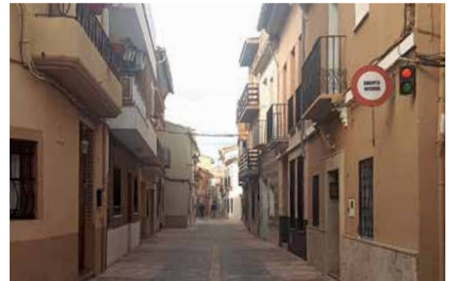
Carrer Major, peatonalitzat en 2018.