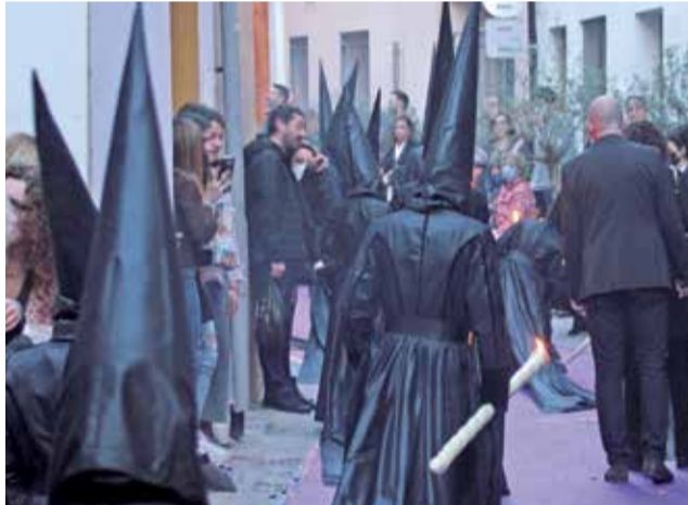
Santo Entierro por las calles de Sagunt.