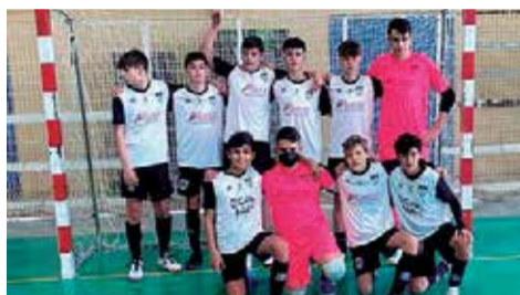
Cadete B. / EPDA