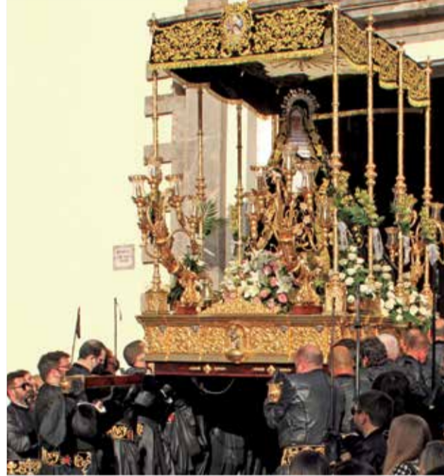
Traslado (puerta de la ermita de la Sang). / KIVI OSMA