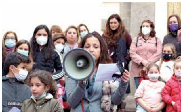
Lectura del manifiesto frente a la ermita.

Parte de la sociedad saguntina se concentró el miércoles santo por la tarde frente a la ermita de la Sang en una protesta histórica contra la negativa de que las mujeres puedan entrar en la hermandad. Una decisión que se votó en una asamblea el pasado domingo 3 de abril por 235 hombres y que ha dividido a la capital del Camp de Morvedre. Eso sí, de manera pacífica y desde el respeto para no provocar altercados en plena Semana Santa. "Por una Semana Santa inclusiva". Este era el lema de una concentración a la que acudieron más de 100 personas, entre ellos, algunos y algunas componentes de la cofradía. En el acto se leyó un manifiesto en el que se destacaba el papel de la mujer en la hermandad.