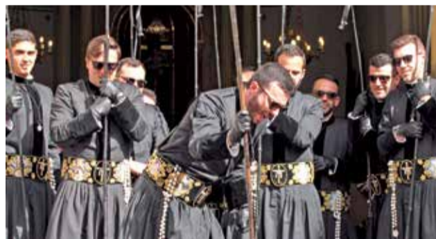
Instantánea de la Subasta.