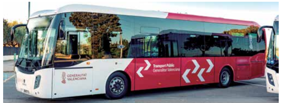
Uno de los autobuses de la Generalitat Valenciana.

Para el conseller de Política Territorial, Obras Públicas y Movilidad, Arcadi España, "la licitación de estos servicios implica un paso más en la reordenación de la red autonómica de transporte público interurbano por carretera, y da conti-