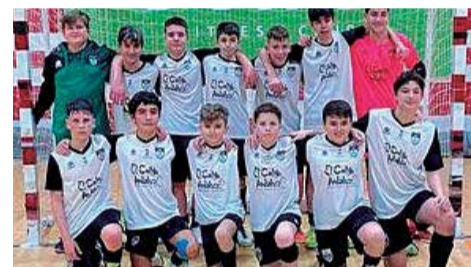
Infantil. / EPDA