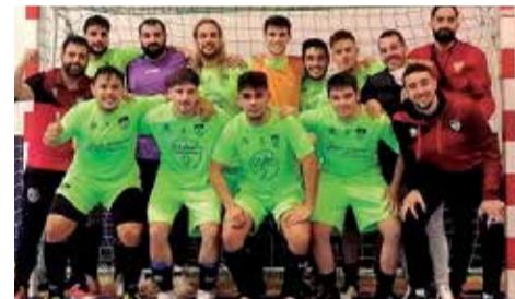
Senior masculino.