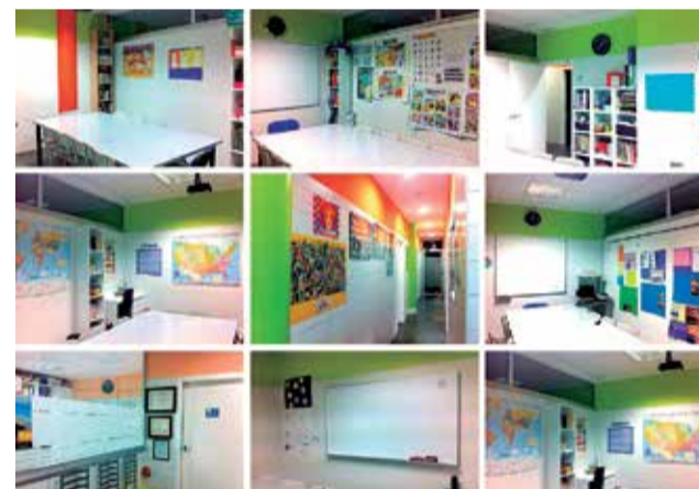
Interior de las instalaciones de ACC.

Su horario es de lunes a jueves de 9:30h a 14h y de 16h a 19:30h. Viernes, de 9:30h a 14h. Para más información, su correo es itoweb@itoweb.org y su web acc.itoweb.org .