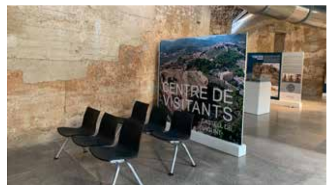
Centro de visitantes en el castillo.

Las obras de la puesta en uso del centro de visitantes del castillo de Sagunt han consistido en la eliminación de las patologías de filtraciones en cubiertas, humedades en muro interior, instalación de climatización, ejecución de la línea eléctrica, carpintería, pintura y acondicionamiento del recinto que estará destinado a la recepción de visitantes y sala de museología. El coste del proyecto ha sido de 476.119 euros.