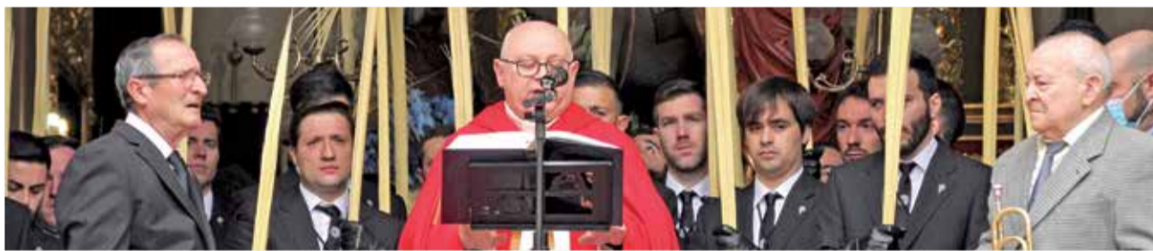
Domingo de Ramos: momento previo a la bendición de las palmas. / KIVI OSMA