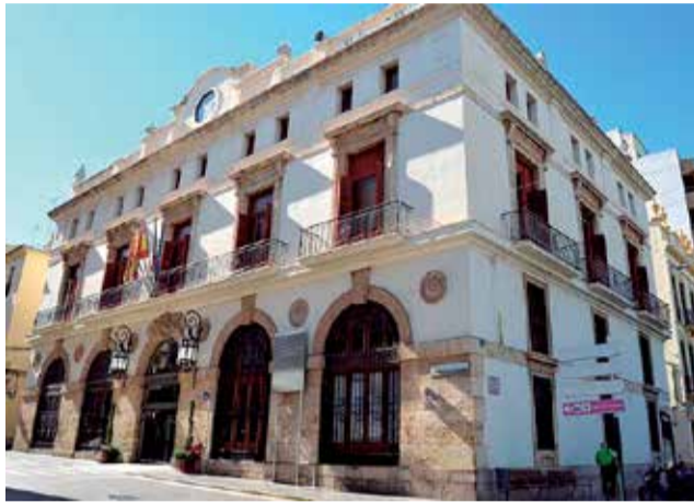
Fachada del Ayuntamiento de Sagunt.

La modernización de las instalaciones del edificio del Centro Cívico Camí Reial supone una inversión de un millón de euros y está cofinanciada en un 50% por el Fondo FEDER de la Unión Europea. El objetivo de esta nueva operación de la EDUSI, dentro del objetivo temático del programa de Economía baja en car-