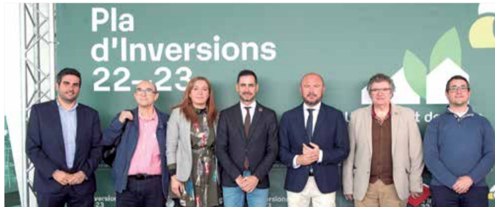
Algunos alcaldes de la comarca con el presidente y el vicepresidente.

euros de la Diputació de València en el marco del Plan de Inversiones 2022-23. Una