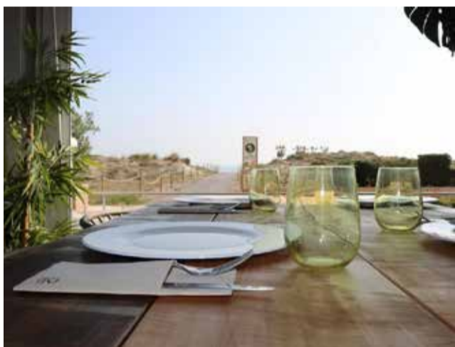
Terraza de un restaurante de Canet.