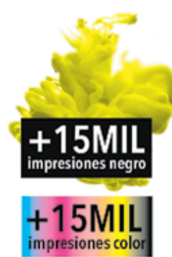
+15MIL impresiones negro +15MIL impresiones color