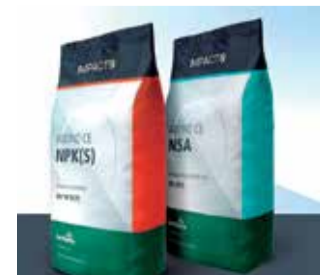
El producto.