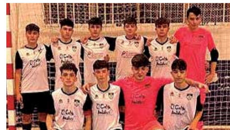
Cadete A. / EPDA