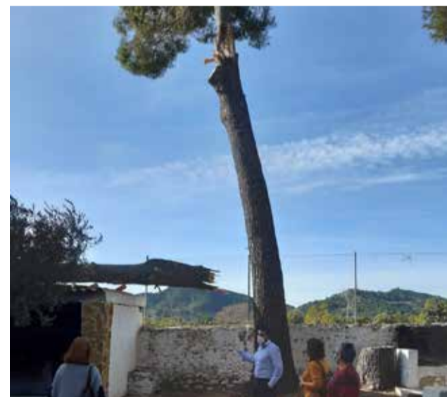
Dalt, fotos de la Font de Quart; baix, l'estat en què estava la Font abans de la rehabilitació. / EPDA