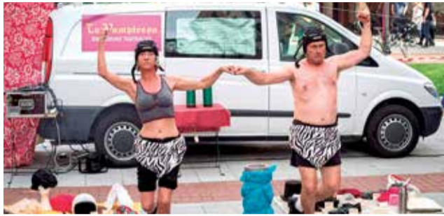
Una actuació de Faurart.

En total, durant tot el cap de setmana s'oferiran vuit espectacles que es representaran a les places Major, de l'Hostal, d'Almorig, Dr. Fle-