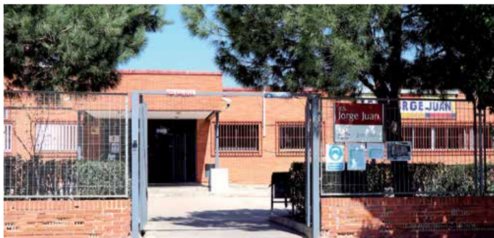
Entrada del IES Jorge Juan de Sagunt.

Para el viernes, día 29 de abril, se preparó la celebración de otra mesa redonda centrada en 'Inclusión y Formación Profesional', para abordar la inclusión educativa en la FP, des-