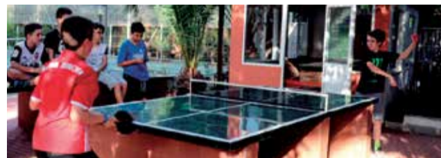
Instalaciones de la escuela de verano.