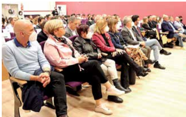
Un instante de la inauguración de la Feria. / EPDA

También se han incorporado píldoras virtuales sobre orientación, selección y formación laboral dirigidas a los y las estudiantes por parte del departamento de Promoción Económica y nue-