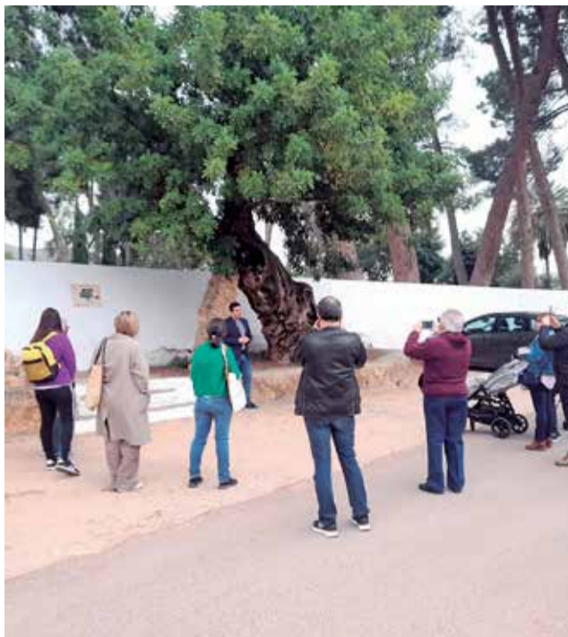
Acte de commemoració a la garrofera centenària.

d'abril. A les 11:30 es va programar un primer acte commemoratiu a la garrofera que n'hi ha fora. Una garrofera que és una de les més velles de tota la Vall de Segó. A més, precisament la setmana passada l'Ajuntament va aprovar una ordenança de protecció de l'arbrat d'interès local. La idea és anar protegint alguns arbres que es consideren importants per