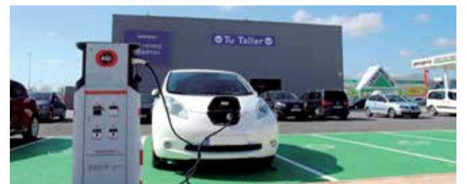
Punto de recarga en VidaNova Parc.

claro compromiso medioambiental, una voluntad de contribuir en la lucha contra el cambio climático. Esta es la razón de que nos anticipemos a una exigencia legal, que intenta imponer algunas cuestiones sobre la que ya somos muy conscientes y sobre las que venimos trabajando de manera pionera".