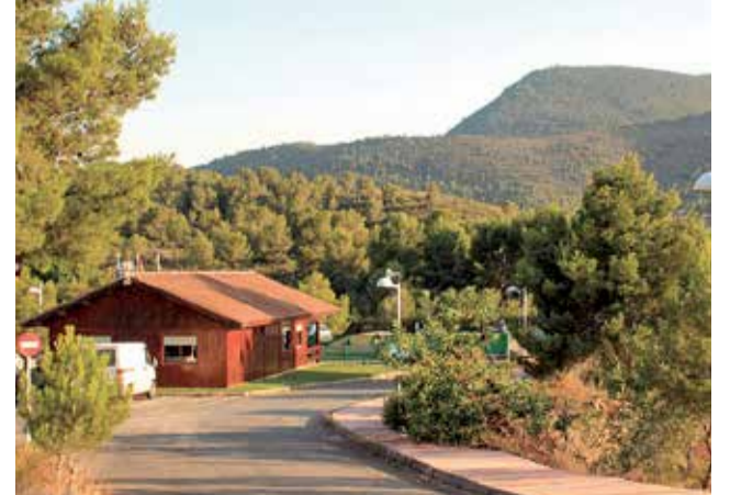
Instal·lacions del càmping.

Per altra banda, José Ramón Mateu parla en el programa que pretén iniciar prompte els tràmits per tal de fer al Garbí "300 bungalows de fusta, 3 hotels de luxe, recuperar la fonda del Garbí que està ahí 200 anys, fer un museu en la casa de Blasco Ibáñez (qui ja escrivia dalt del Garbí diverses històries)", un projecte de què va darrere des de fa molts anys.