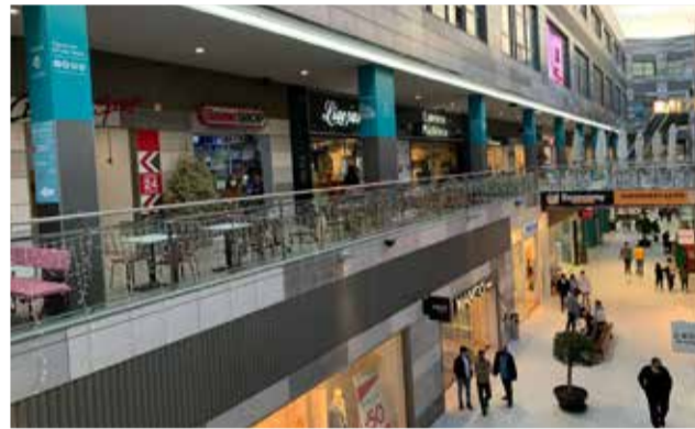
Interior de las instalaciones de Lepicentre.

Mientras tanto, continúan las aperturas de grandes marcas. En ese sentido, acaba de abrir MISAKO, empresa líder en el sector de los bolsos,