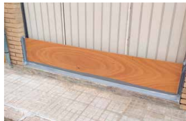
Paneles que ponen en algunas casas.