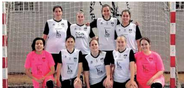
Senior femenino.

gional y subirá a la liga autonómica juvenil en la temporada que viene. El senior masculino está intentando ponerse en los play off de ascenso y tenemos el senior femenino también jugando la fase de ascenso para la liga autonómica. Ha sido un