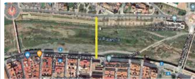
Trazado por donde iría la pasarela. / EPDA