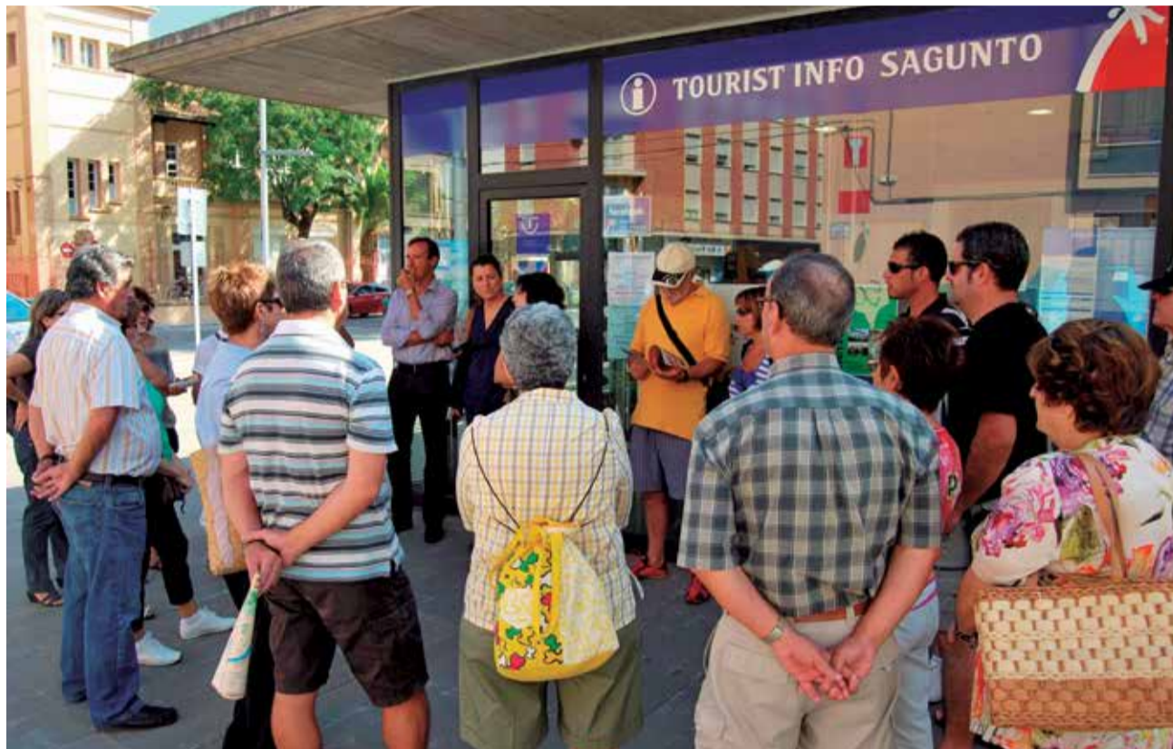
Varios turistas frente a la oficina de Turismo de Cronista Chabret.

Cabe destacar un 182% más de visitantes a los espacios arqueológicos, Via del Pòrtic y Domus dels Peixos. Dichos espacios generan un interés cada vez mayor, siendo su gestión municipal con un importante patrocinio de la empresa Naturgy, ubicada en Sagunt. En lo referente a los puntos de información, la procedencia ha sido principalmente de turistas nacio-