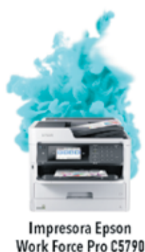
Impresora Epson Work Force Pro C5790

berolina AHORRA MÁS DEL 50% EN IMPRESIONES Y 90% DE ENERGÍA