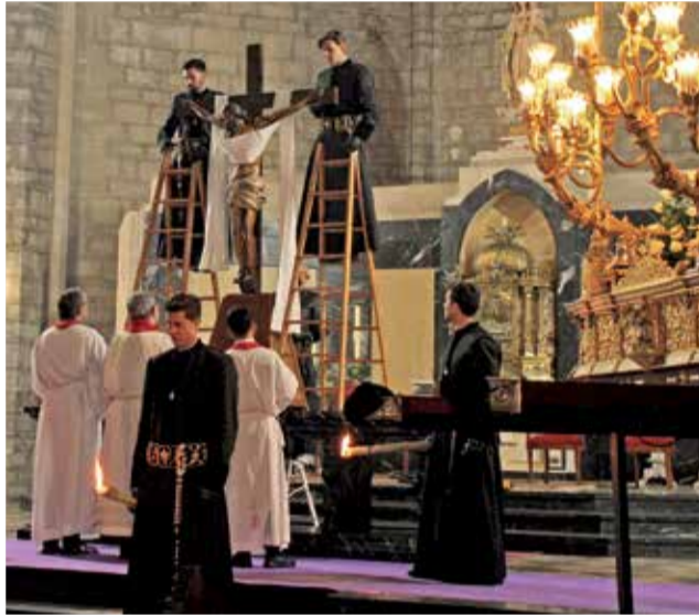
Desclavament en la Iglesia de Santa María.

En cuanto a Port de Sagunt, la Asociación Cultural de Cofrades, formada por las hermandades del Santo Sepulcro y Jesús Nazareno, así como por la Cofradía Virgen Dolorosa Madre del Resucitado, organizaba