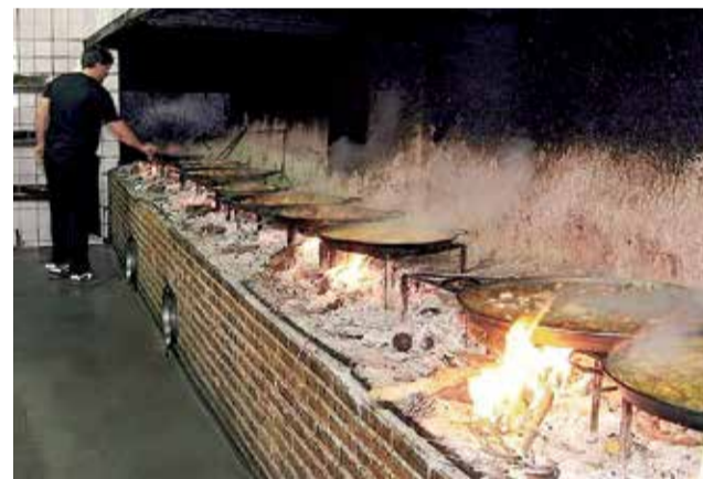
Paellas de leña en un restaurante de Torres Torres.

Pasear, hacer turismo, comprar en el comercio tradicional de estas localidades, para llevarnos un recuerdo, para consumir y hacer gasto en nuestra comarca y contribuir también a la mayor calidad de vida de quienes mantienen los pueblos vivos gracias a un comercio que quiere seguir siendo una opción de generación de riqueza y oportunidades.