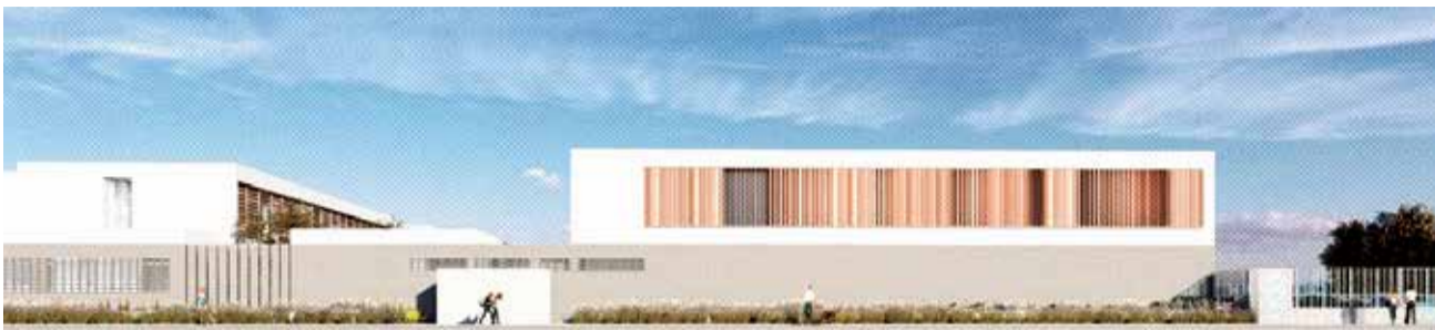
Fachada lateral del que será el nuevo IES de Canet d'en Berenguer.