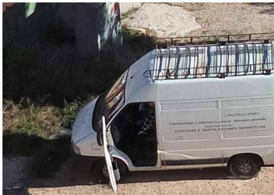
El policía local registrando el vehículo privado.