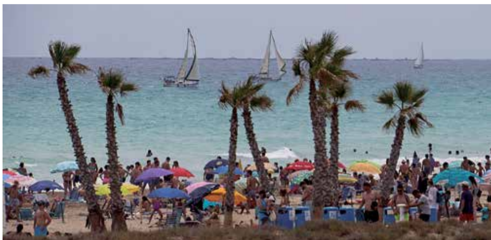
Platja del Racó de Mar de Canet d'en Berenguer.

■ ENTRE ELS ATRACTIUS, UNA ÀMPLIA OFERTA CULTURAL, ESPORTIVA I D'OCI