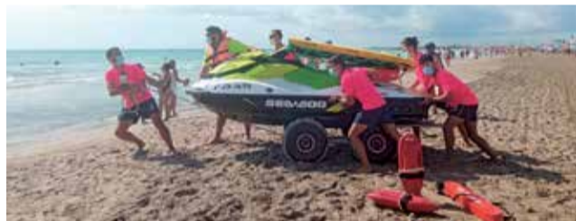
Socorristas en la playa de Canet.

La temporada s'iniciarà amb la posada en marxa del servei de salvament i socorrisme el 20 de juny fins al pròxim 23 de setembre, de 10 a 20 hores. A més s'obrirà al públic l'oficina de Turisme, amb un horari d'atenció de 10 a 14 hores i de 17 a 20 hores. La platja també comptarà amb un punt accessible que sol acollir prop de 40 persones diàries, segons les dades dels últims anys i pel qual passen cada estiu prop d'uns 3.000 usuaris. Es tracta d'un espai referent a la província de València, de més de 70 metres quadrats, coberts amb una teulada, en els quals hi ha habilitats banys, vestuaris i un magatzem per a personal amb diversitat funcional, a més del personal adscrit a aquest servei. El punt compta amb una grua hidràulica per a facilitar la mobilitat