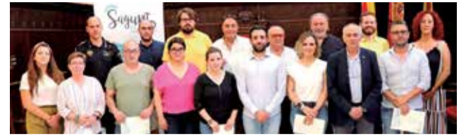
Participantes y autoridades.

objetivos de la Agenda 2030, la estrategia turística en España 2030, la estrategia turística en la Comunitat Valenciana 2025, Plan Director de destino turístico inteligente de Sagunt y el Plan Estratégico de Turismo de Sagunt 2022-2026.