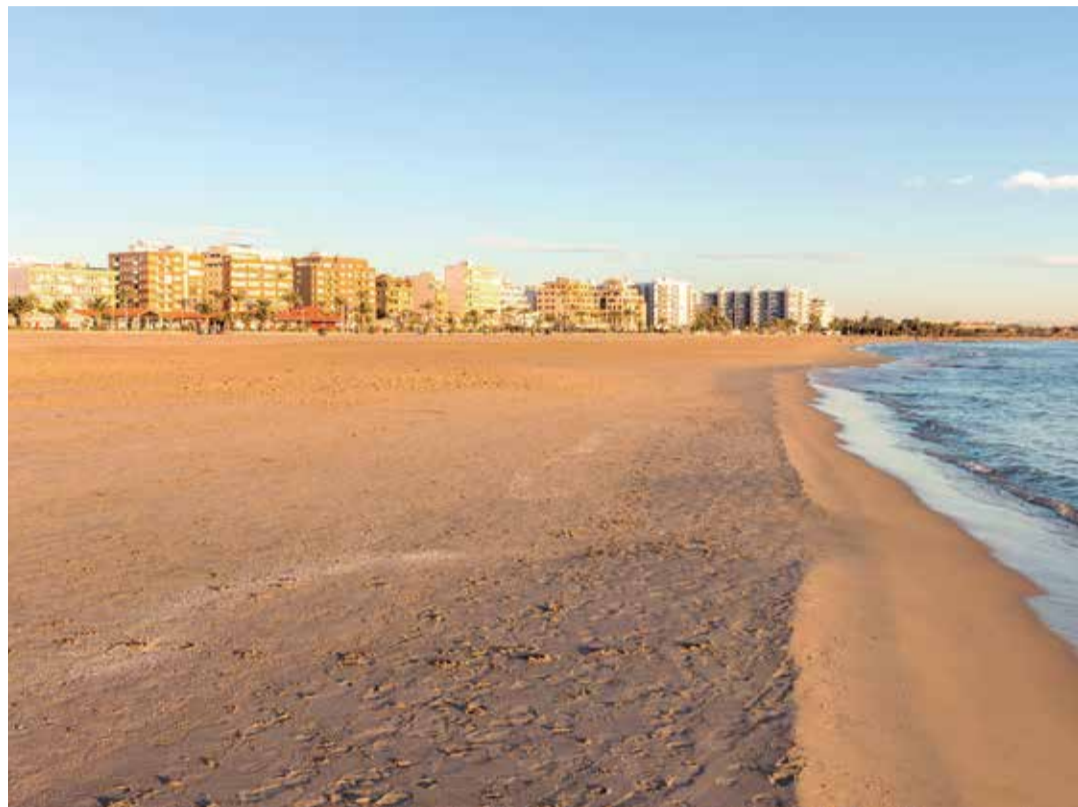
Playa urbana de Port de Sagunt.

Cuentan con vestuario, ducha, aseo, zona de sombra, sillas anfibias, muletas, gruas de transferencia y monitores de apoyo. En 2015 y en 2017, fueron elegidas como las playas más accesibles de España.