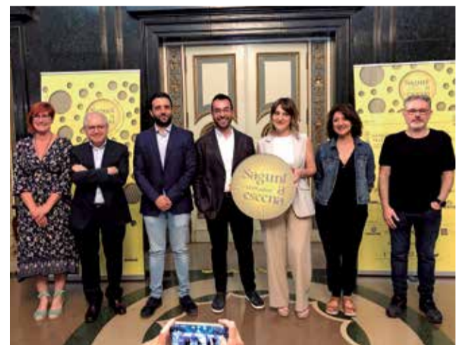
Presentación de Sagunt a Escena 2022. / EPDA