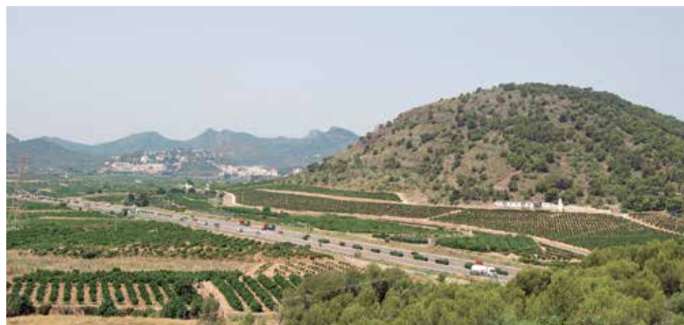
Vista de la AP-7 desde Sant Cristòfol a su paso por Sagunt.

Por otra parte, se solicitará también a la Conselleria de Política Territorial, Obras Públicas y Movilidad de la Generalitat Valenciana que apoye la petición del Consistorio ante la Demarcación de Carreteras del Ministerio de Fomento –que posee las competencias en este ámbito– y también se sugerirá que los materiales fonoabsorbentes se utilicen siempre que se trate de carreteras o via-