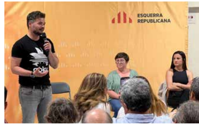
Instantània de la jornada amb Rufián intervinent.

El 28 de mayo, Benifairó acogió la presentación de Adela Alba, actual concejala de Esquerra Republicana del País Valencià, a la alcaldía en la siguiente legislatura. En el acto estuvo presente Gabriel Rufián, diputado en el Congreso y portavoz del partido en Cataluña. Alba expuso que con "11 años del PSOE no ha habido ningún proyecto ni a corto ni largo plazo" y se comprometía a "reimpulsar" el municipio.