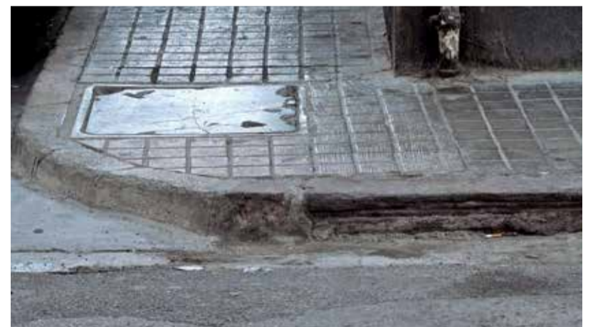
Algunas calles de Port de Sagunt en las que Discamp ha detectado problemas de movilidad.