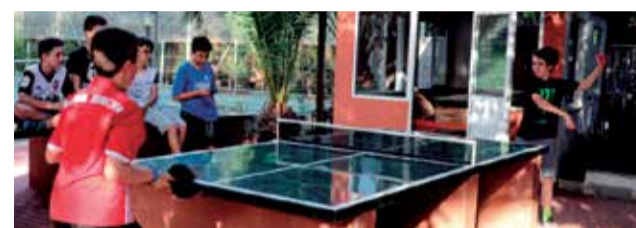
Instalaciones de la escuela de verano.