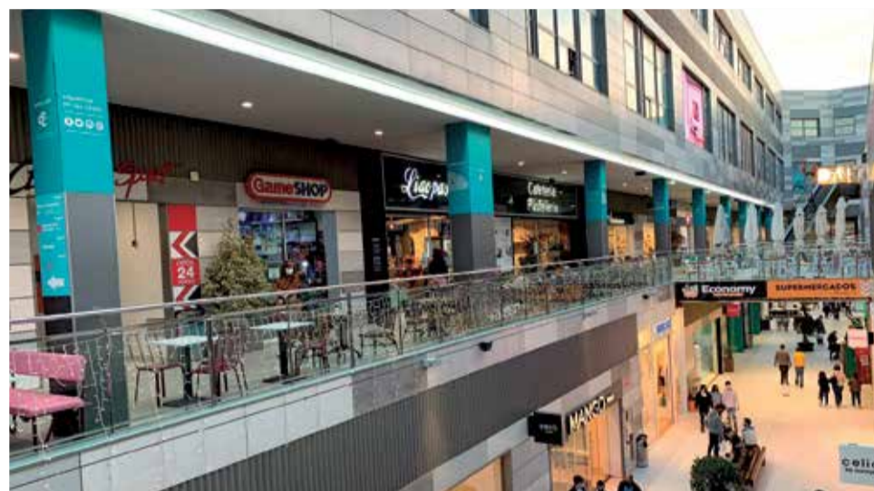
Interior del Centro Comercial Lepicentre.

El Centro Comercial se ha convertido en centro de re-