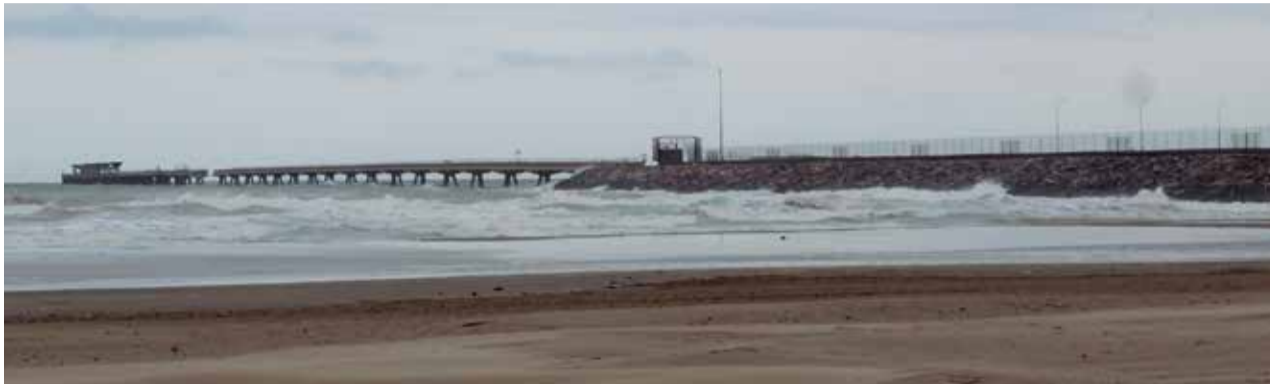
Vista del Pantalán desde la playa de Port de Sagunt.

En el texto se afirma que debido al coste de esta primera fase, la Autoridad Portuaria de Valencia utilizará el presupuesto