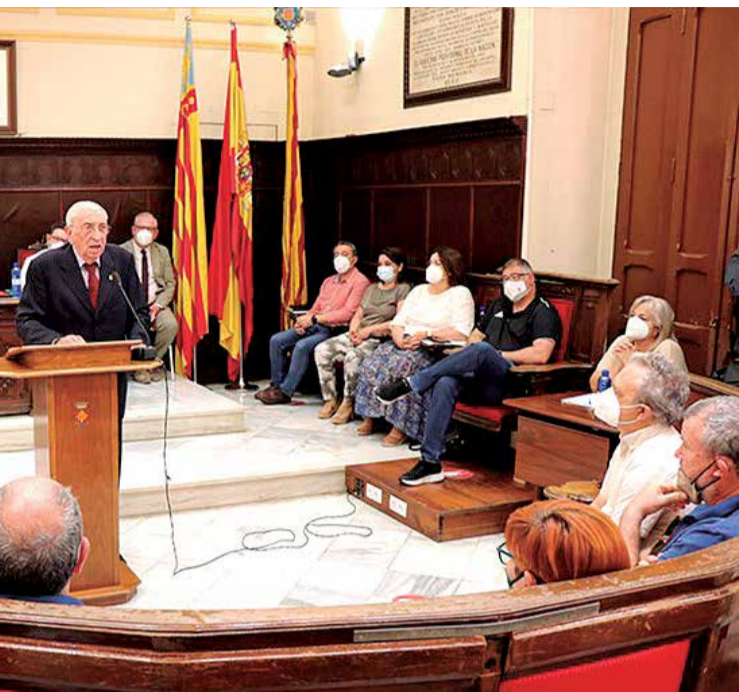
Vayà como hijo adoptivo en el salón de plenos.