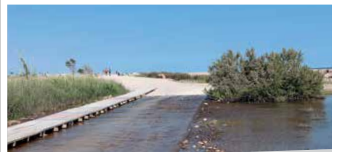
Delta del Palancia.

Además se aprobó instar a la Generalitat Valenciana a que complete las expropiaciones y desalojos pendientes en el Delta del Palancia e instar a la Confederación Hidrográfica del Júcar y a la Conselleria de Agricultura, Desarrollo Rural, Emergencia Climática y Transición Ecológica a actuar, y financiar un plan, sobre los brazos del río Palancia en el tramo final del delta, a fin de eliminar las especies invasoras “que actualmente dificultan la salida al mar del agua en caso de avenidas, y que es incompatible con el uso educacional sobre el delta”, tal y como apunta la moción.