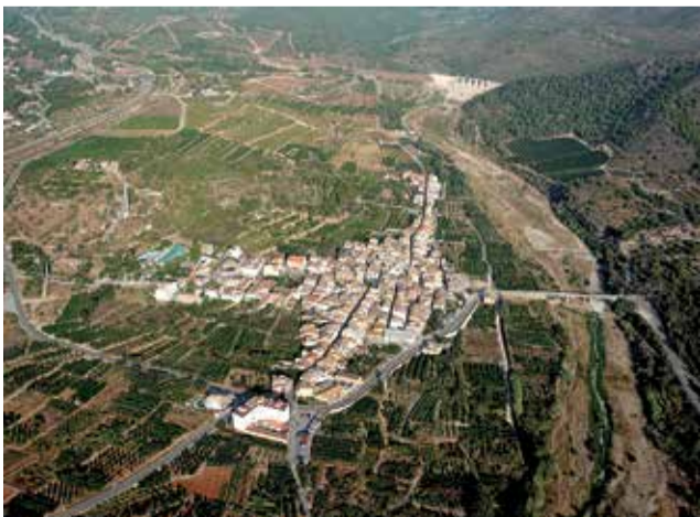
Vista aérea de Algar de Palancia.

Los proyectos innovadores que se presenten deberán dar respuesta a los retos que se planteen en la jornada y superar las prestaciones existentes actualmente en el mercado