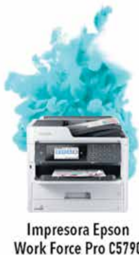
Impresora Epson Work Force Pro C5790

berolina AHORRA MÁS DEL 50% EN IMPRESIONES Y 90% DE ENERGÍA