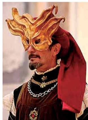
Un participante.

Durante las jornadas se ofrecen cursos para aprender danzas históricas, música medieval con instrumentos históricos, o cantar repertorios medievales.