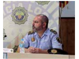
Curso. / EPDA