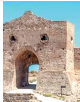
Puerta de Almenara.

Fernández recuerda que hace un año el ministro Uribe presentó una inversión de un millón de euros “de que no hemos vuelto a tener noticias”. Así, el portavoz del partido expresa: “reclamamos cifras, fechas y actuaciones concretas en un monumento que va sumando, año tras año, nuevos espacios de degradación”. “Hasta ahora, el Ministerio lo único que ha hecho es poner parches, muchos de ellos con muy mal gusto”, añade.