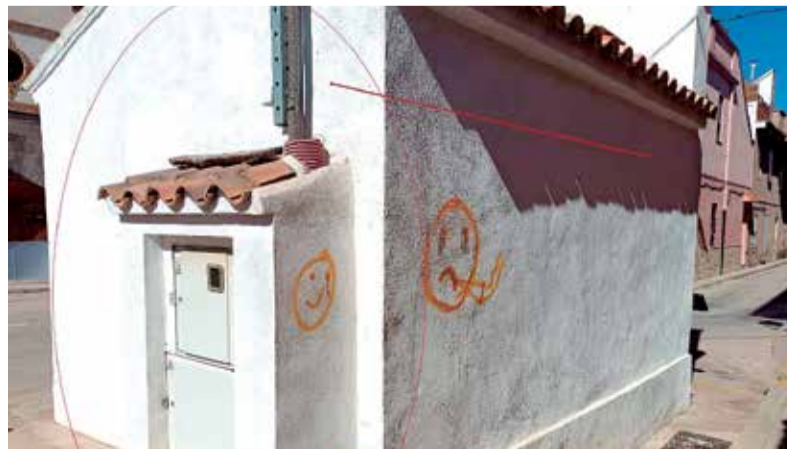
Cisterna Nova d'Estivella amb cables.

ment metàl·lic que desvirtua la visió de la construcció. Pareixia que la solució era provisional. Calia esperar. Els anys passen i, com en uns altres casos, la provisionalitat es consolida. El cas no és singular. Més cables tenim a la comarca, com ara a l'església de Petrés per a la il·luminació pública o al costat del seu castell a través d'un pal. En una part de l'església d'Algimia podem vore cables. Per la façana de la casa Perentoni de Benifairó, també en passen. L'enumeració es faria llarga però el més important és que encara hi ha temps per a conscienciar-nos i superar el problema que deteriora la visió del patrimoni. En definitiva, eixe cas i uns altres de la comarca ens han de fer de pensar que queda camí per a mantindre amb dignitat monuments. No oblidem que els cables que travessen les façanes històriques encara són una amenaça.