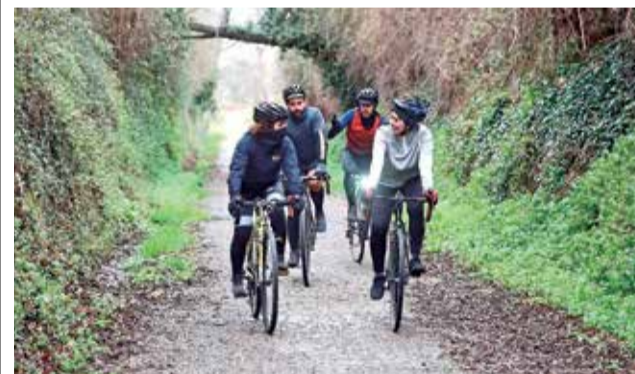
Un punt de la Via Verde Ojos Negros.

LA ACTIVITAT SERÀ EL 5 DE JUNY AMB MOTIU DEL DIA MUNDIAL DE LA BICICLETA I DEL MEDI AMBIENT