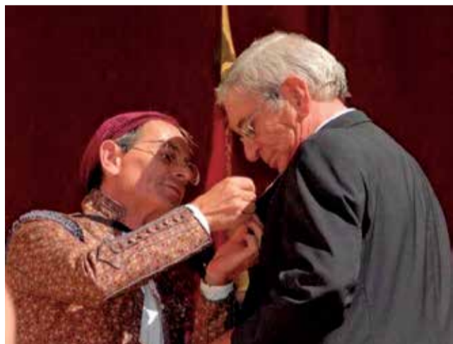
Despedida en el Teatro Romano (2008).

El Palleter (Port de Sagunt) cuando unas falleras le dijeron que querían ser falleras mayores; sin embargo, las condiciones familiares no les permitían serlo. Por ello, quisieron hablar con Vicente. “Les dije que haría lo que estuviera en mis manos y ha-