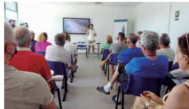
Un instant de l'audiència a Canet.

L'alcalde va reconèixer estar "molt preocupat" per la regressió que està patint el litoral; qüestió que va sustentar en els quasi 28 metres de platja que s'havia perdut a Canet des del temporal Glòria, en 2019. Per això, aposta per una "actuació integral de sud a nord, en tota la costa des de Borriana a Sagunt, d'acord amb el comportament dels sediments", i no al contrari,