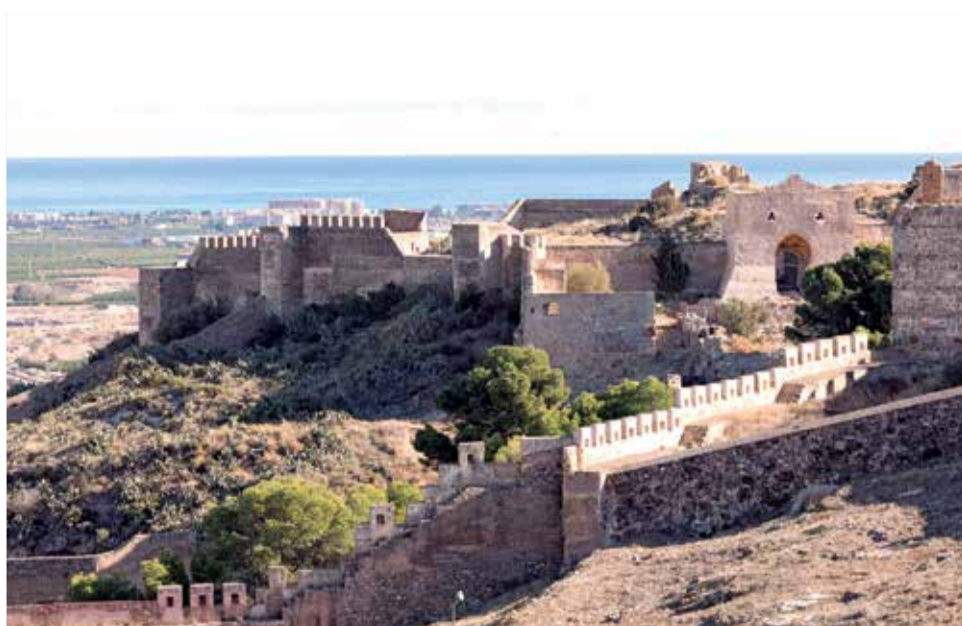
Vista del Castillo de Sagunt, con la puerta de Almenara de frente.

El Ministerio de Cultura y Deporte contará con 4.720.040,96 euros para la restauración y