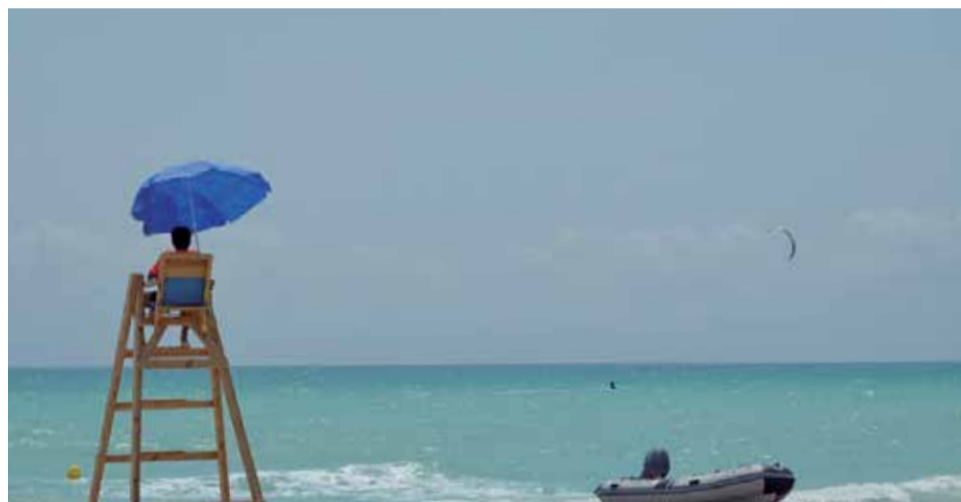
Playa del Racó de Mar de Canet d'en Berenguer.