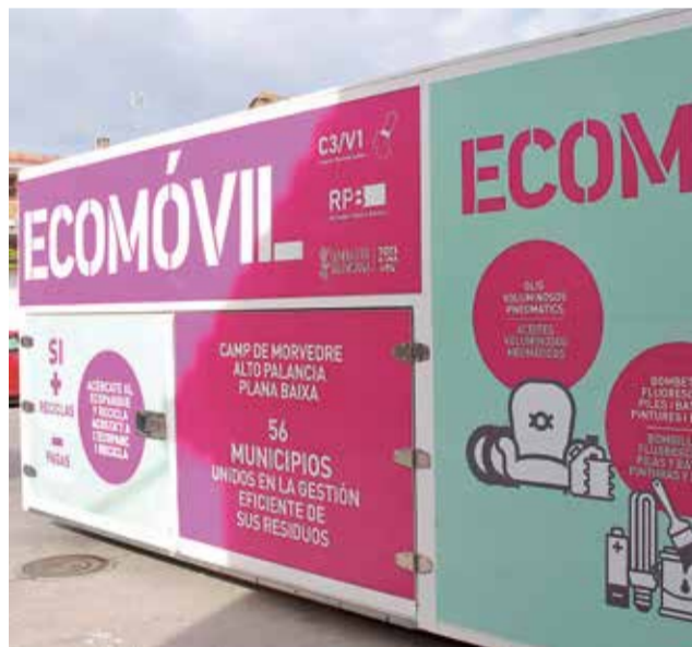
Varias imágenes de la planta de Algímia y de iniciativas recientes del Consorcio Palancia Belcaire.