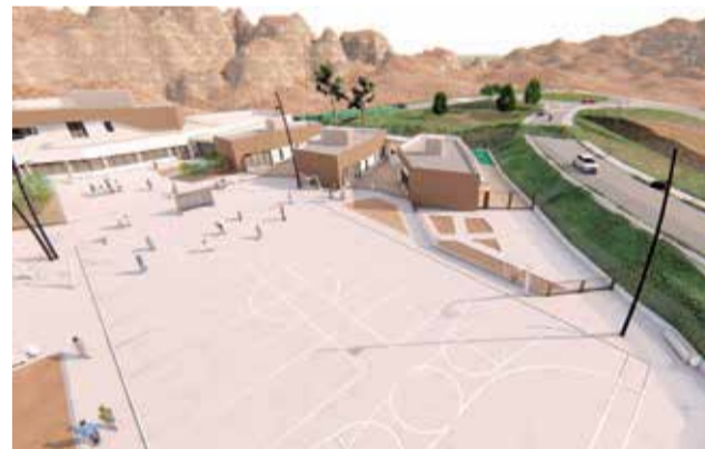
Varias imágenes del proyecto del nuevo CEIP de Gilet.

Sin normas, como un juego de piezas aleatorias e irrepetibles, como la orografía de la Sierra Calderona”, expresan desde Aecoestudio, empresa diseñadora del edificio. “Los alumnos de primaria estarán