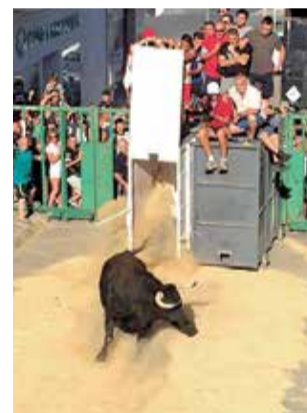
Bous per Sant Pere.

Baix d'esta informació, la programació sencera que ha preparat la regidoria de Festes de l'Ajuntament.