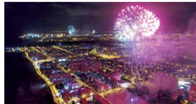
Focs artificials a Canet d'en Berenguer.

Exposicions, pólvora, música, cites esportives, festejos taurins, animació infantil i esdeveniments religiosos componen el programa de festes de Sant Pere a Canet d'en Berenguer. Un cartell per a tots els gustos i edats que arrancarà el pròxim 23 de juny amb la nit de Sant Joan, i acabarà el dissabte 2 de juliol amb el concert de la Rondalla Sant Pere, en la plaça de Félix. Nou dies plens d'actes en què veïns i visitants podran tornar a gaudir d'aquests festejos després de dos anys suspesos a causa de la pandèmia. "Hem treballat intensament per a fer una progra-