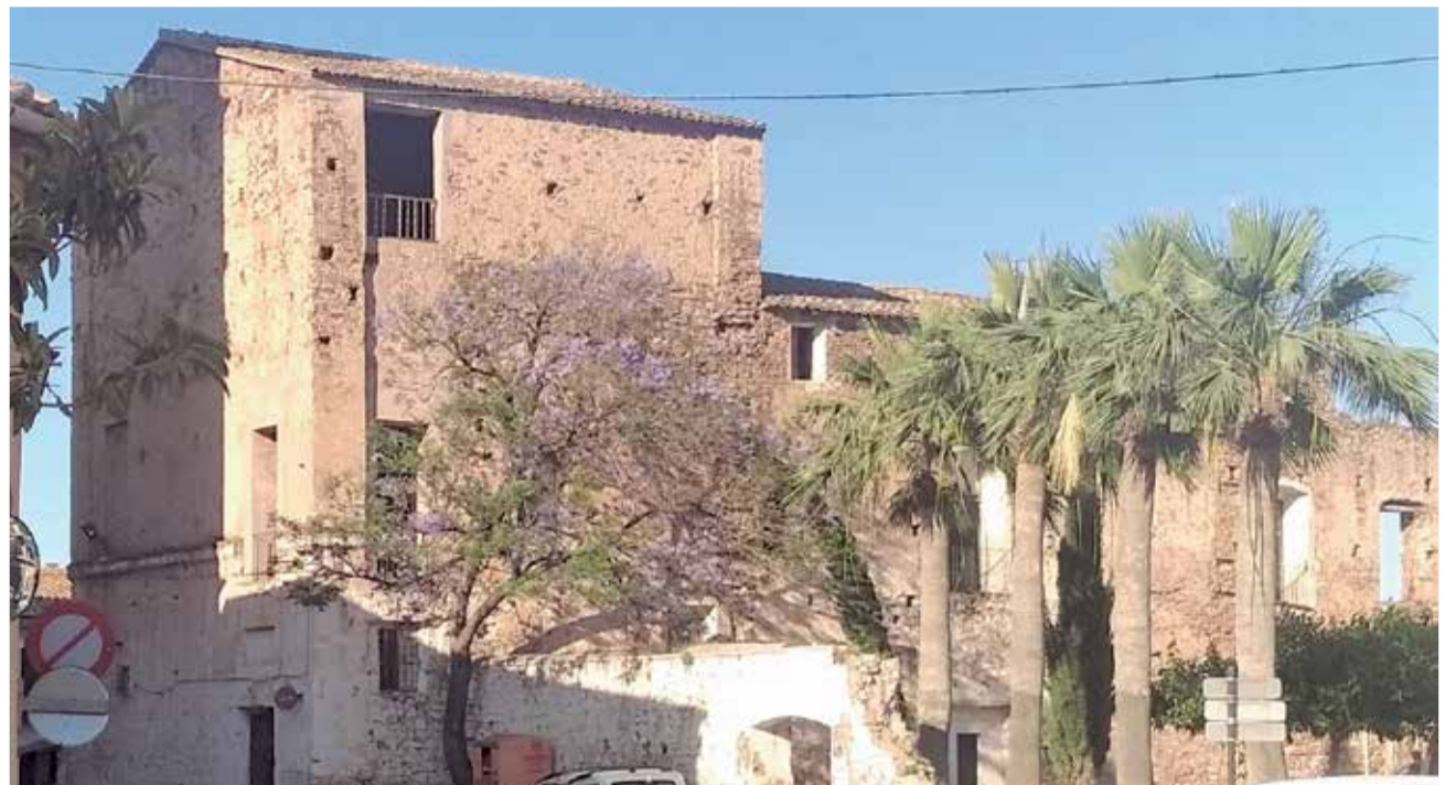
El palau dels Vives de Canyamàs (Benifairó de les Valls). / C. R. TORREJÓN

deixà donar llicències a qualsevol veí de la dita baronia i lloc per a poder vendre qualsevol heretat, cases o altres possessions de la dita baronia entre els veïns del lloc i estrangers (es refereix als de fora d'aquesta baronia). Aquesta va ser una primera simptomatologia, al meu parer, de la pèrdua de poder dels senyoriis que acabarien per desaparèixer al segle XVIII.