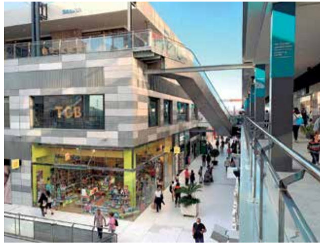
Centro Comercial Lepicentre.

Por otro lado, se esperan con mucha ilusión las marcas ya anunciadas y pendientes de apertura, como son Perfumerías Atalaya, que está montando uno de los mejores locales de cosmética de la Comunidad Valenciana con una tienda de 700 metros cuadrados, Llao Llao, la franquicia española de yogur helado, granizados y batidos que actualmente cuenta con más de 220 establecimiento a nivel nacional e internacional, abrirá sus puertas en la