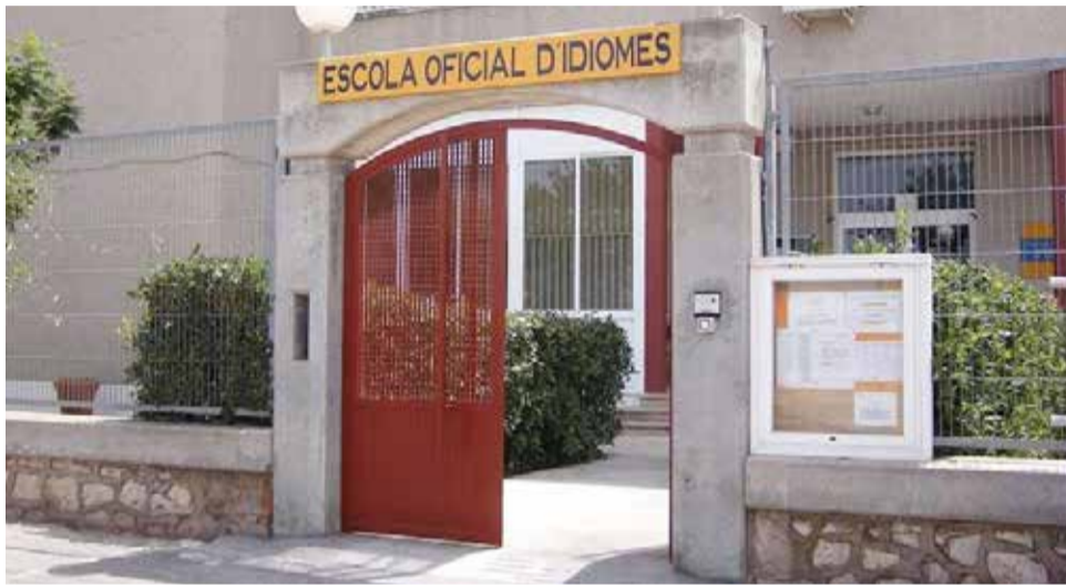
Entrada a la EOI de Sagunt.

Quien ha pasado por la Escuela Oficial de Idiomas (EOI) de Sagunt sabe el valor que tiene y representa tras 25 años de andadura. Lejos de conformarse con el éxito de esta fructífera trayectoria -que ha formado a miles de alumnos y alumnas en inglés, francés, italiano, alemán, valenciano y español para extranjeros-, el próximo curso llegará cargado de sorpresas e iniciativas. Una de ellas es el refuerzo del alemán, con la petición que ha realizado a la Conselleria de Educación para contar con un curso de formación complementaria de 60 horas para enseñar lenguaje comercial alemán, aprovechando la próxima instalación de la Volkswagen en Parc Sagunt, como han explicado a El Periódico de Aquí.