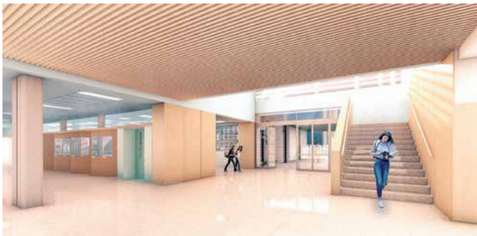
Proyecto interior del que será el nuevo IES de Canet d'en Berenguer.