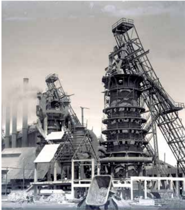
Alto Horno n. 2 (2/2/1923).

donde se abastecía de materias primas. Su reciente restauración ha hecho que el horno adquiriera una nueva funcionalidad didáctica y, por tanto, unos valores de uso dentro de un proyecto de recuperación de la me-