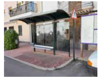
Parada de bus. / EPDA