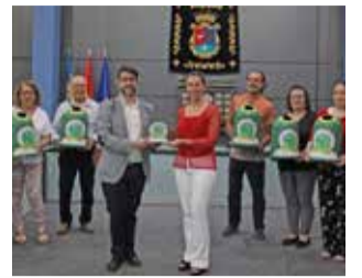
Presentación / AUTOR FOTO