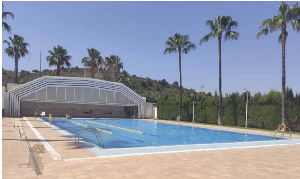
Piscina municipal de Vilamarxant.