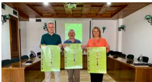
Presentació a L'Eliana.

La programació tornarà al seu format habitual després de la pandèmia, amb una proposta de cinema familiar els caps de setmana, d'autor els dilluns i dimarts i comèdia els dimecres i dijous. En total seran 25 els films que es projectaran enguany repartits en 59 sessions. Apostes que van des del cinema d'autor passant pel blockbuster, comèdia i el cinema per a tota la família. A més, també tornarà el tra-