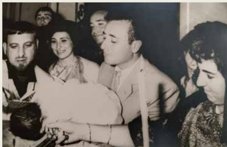
Durante el bautizo

Mi madrina destacaba por su generosidad y humanidad, y eso lo sabían su marido y sus hermanos con los que se reencontrará en la Glo-