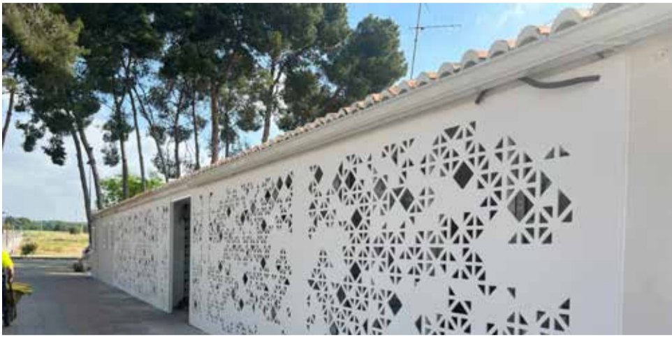
Exterior del centro de salud.