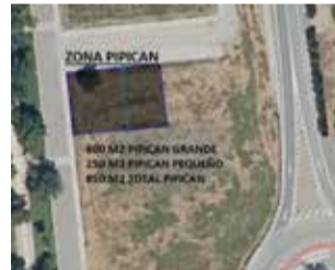
Zona del circuito / EPDA