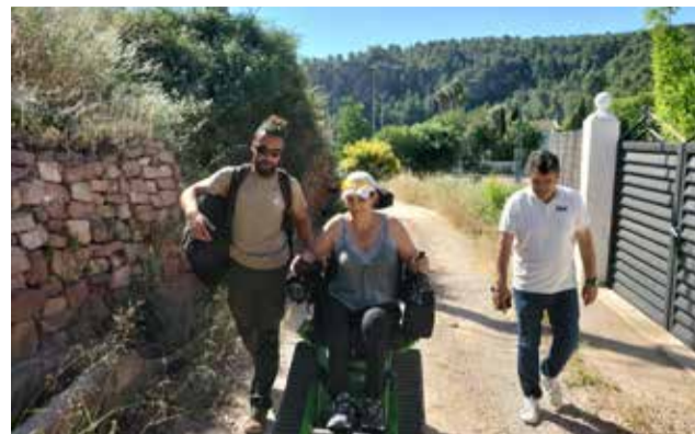
El alcalde junto con la deportista.