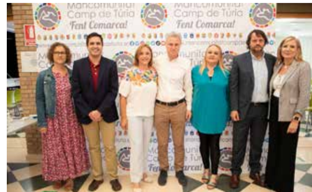
Presentación del estudio de digitalización.