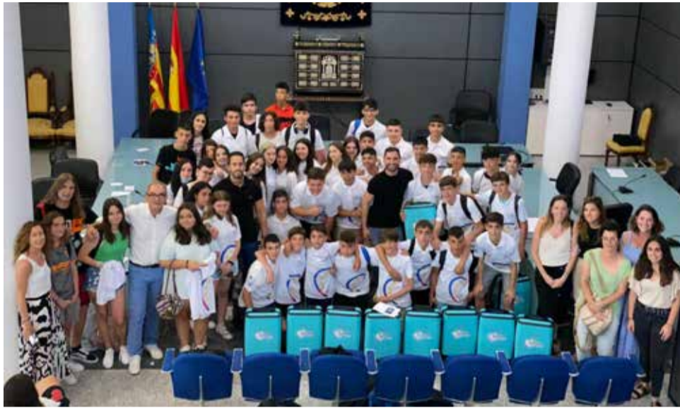
Algunos de los alumnos que han acudido

Bajo el nombre "La juventud a pleno", el alumnado ha participado en la realización de un simulacro de sesión plenaria en el Ayuntamiento en la que cada grupo de trabajo ha presentado las distintas propuestas trabajadas: alquiler de patinetes eléctricos, aprovechamiento del agua en zonas municipales, intercambios culturales en Europa, alquiler de bicicletas por el pueblo BenBici, zonas para hacer deporte al aire libre o un cine municipal.