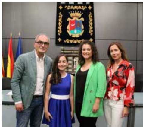
Presentación / EPDA