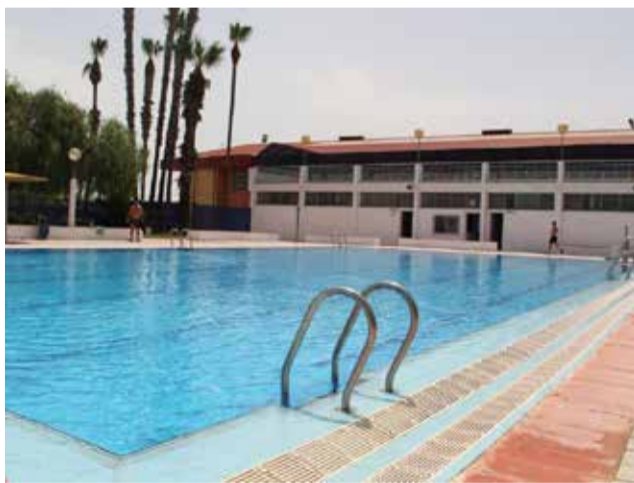
Piscina municipal de Benaguasil.