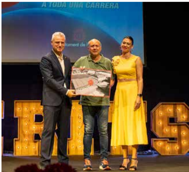
Entrega dels premis