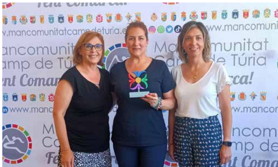
Durante la visita de la directora / EPDA

tina a las 17 asociaciones de comerciantes de Camp de Túria. La Mancomunitat Camp de Túria apoya al comercio local porque es creador de riqueza en el territorio y porque da vida a las calles de los pueblos de la comarca. “Una comarca sin comercio es una comarca sin vida, por eso es tan importante crear una red de trabajo con las asociaciones implicadas en fomentar el consumo en nuestros comercios”, ha explicado la presidenta.