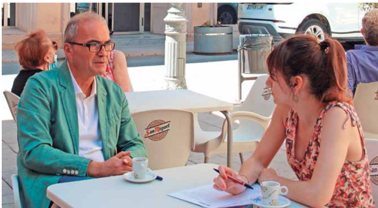
Un dels moments de l'entrevista en una cafeteria davant del Consistori.

► La sensació és que el PSOE està baixant, a l'àmbit central no planta cara als problemes i això fa que baixes escalons. Tant ell com dels socis. La situació cada dia és pitjor i solucions no hi ha. Cada volta s'intenta repartir el poc que hi ha entre els que som. No es tracta de repartir cada volta menys, sinó de generar tot el que hem perdut, perquè si