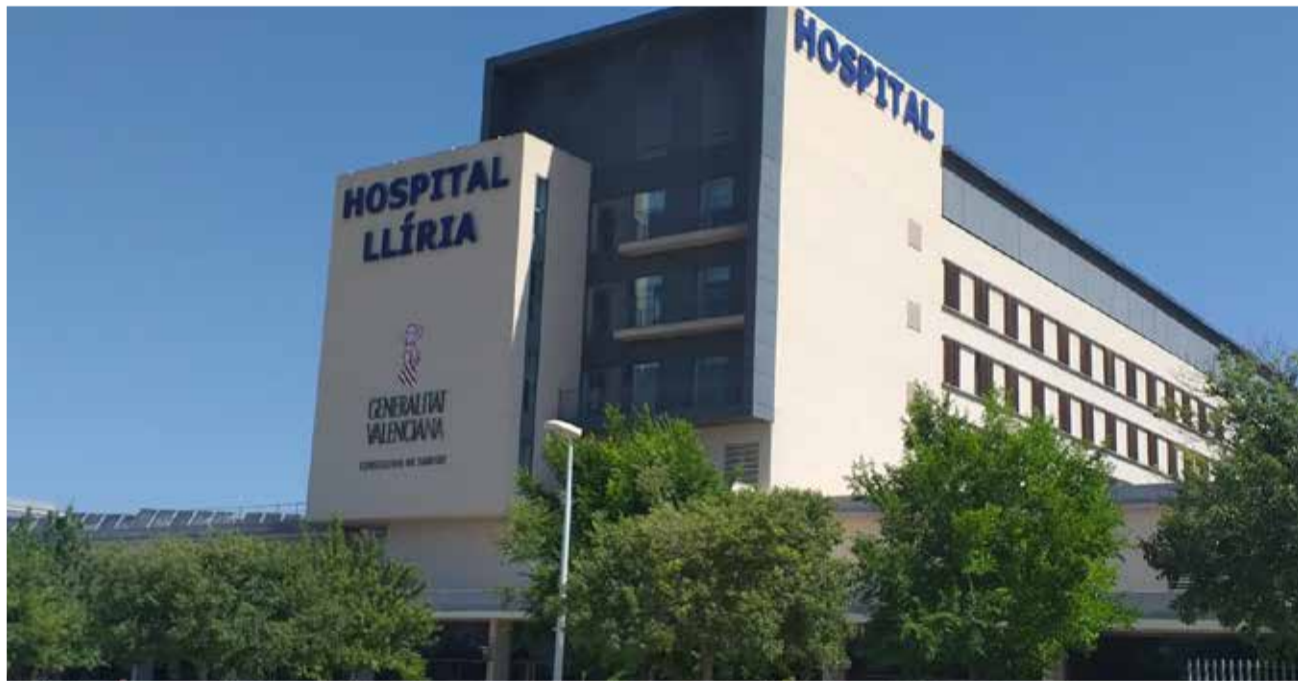
Hospital de Lliria.

El sindicato recalca que "aunque el problema lo sufre la mayoría de servicios, sobre todo pasa en el de Urgencias". En este caso señala que "son siempre recurso único en el hospital en turno de noche, domingo, festivos