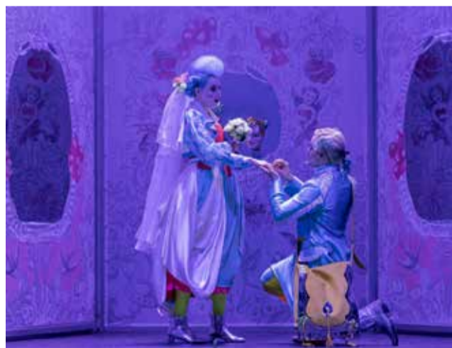
Una de les escenes del teatre.

La representació operística en tres actes es realitzarà en l'esplanada davant de l'Ajuntament a les 22.00 hores. Les inscripcions estan obertes a l'oficina de Turisme que obri les seues portes de dilluns a diumenge de 8.00 a 15.00 hores.