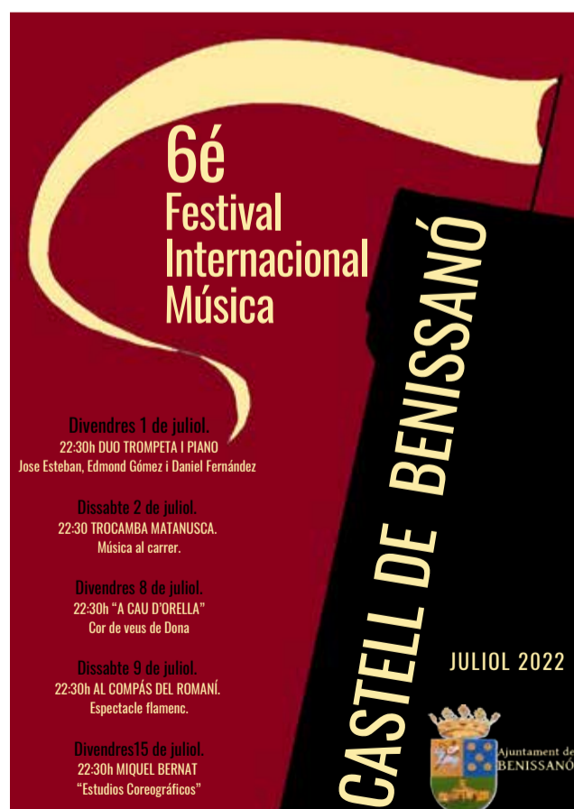
Cartell de Benissanó.