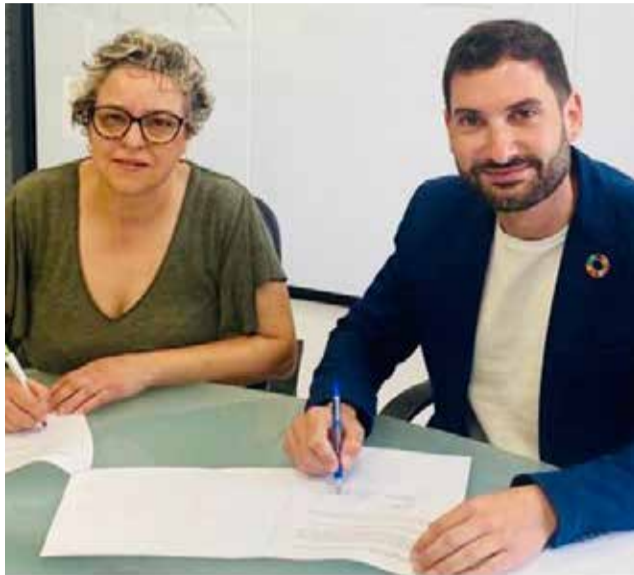
La firma del acuerdo.

El acuerdo entre ambas formaciones que coinciden en la mejora de los servicios a la ciudadanía de esta localidad supone la puesta en marcha de una serie de medidas que incluyen en materia deportiva la reforma de las pista tenis, pádel, del frontenis municipal y de la pista multi-deportes, la construcción de una nueva pista multi-deportes, mejoras en los accesos al Complejo Deportivo Municipal y nuevas luminarias, además de la adquisición de maquinaria para el Centro Deportivo Hidrotermal y la realización de un estudio de viabilidad y realización de una pista de atletismo trabajando para lograr la construcción de una pista de 250m de cuerda.