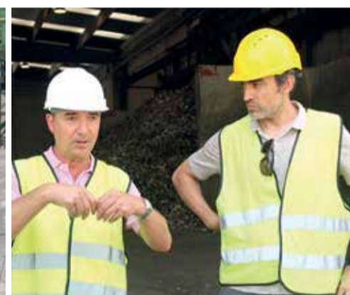
Algunos momentos durante la jornada en Caudete de las Fuentes.

bado y separación, fundamental en el tratamiento de los residuos, ya que permite recuperar los materiales reutilizables y evitar su depósito en vertedero. Con respecto a ello, entre las últimas novedades que ha incorporado la planta se encuentra la adquisición de un segundo separador óptico de vidrio, que permite recuperar, por un lado, fragmentos de este material (aptos para hacer nuevos envases)