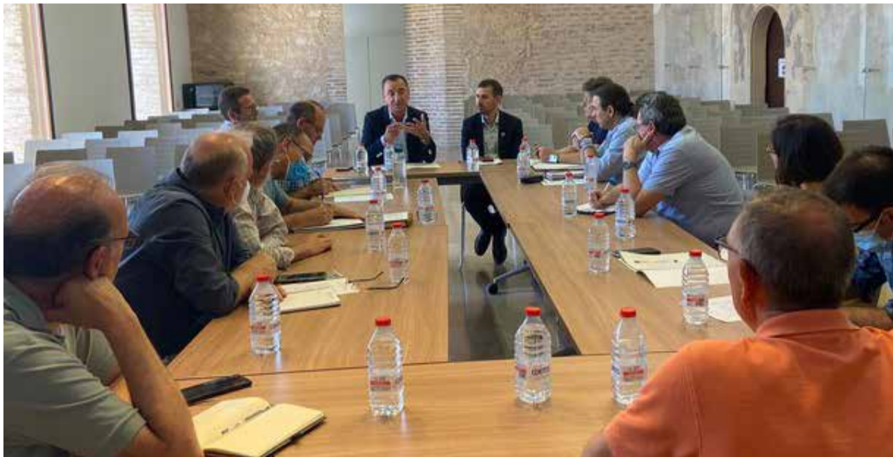
La reunió celebrada al castell de Riba-roja