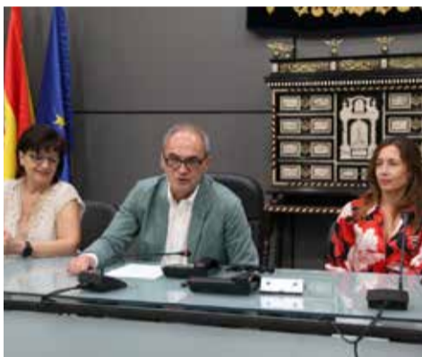
Presentación / EPDA