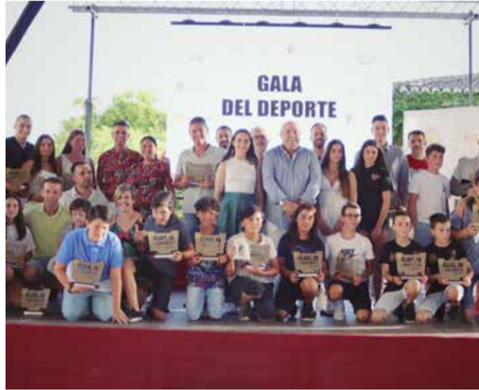
Los alumnos, durante el acto.