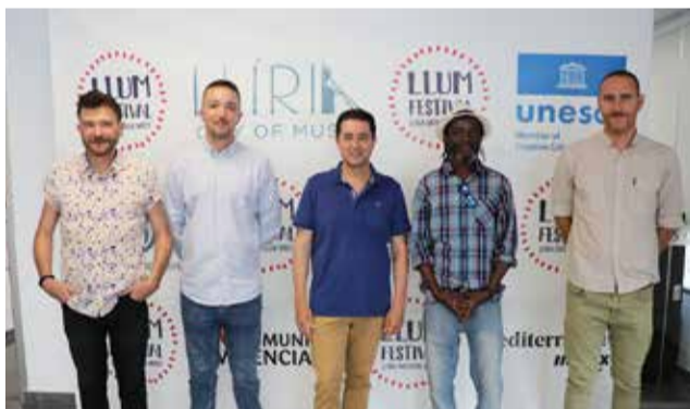
Presentación del festival.

El programa cuenta con un total de ocho conciertos en los escenarios que ocuparán lugares emblemáticos de Lliria como el