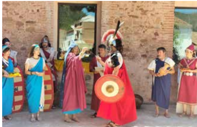
Una de les escenes de la festa.