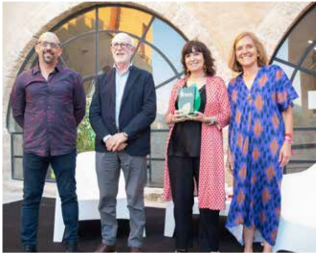
Un dels actes de Bétera