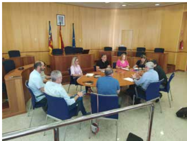
Reunió de la problemàtica.

Tots hem de ser conscients que l'aigua és un bé imprescindible i comença a ser escàs, per la qual cosa des del consistori s'insta a tota la població de Sant Antoni de Benaixeve que no malbarate aigua i faci un ús responsable d'aquesta, hui més que mai en solidaritat amb els veïns i veïnes afectats per la falta de subministrament. Des de