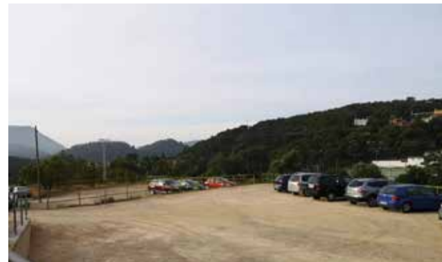
Una de les zones d'aparcament. / EPDA