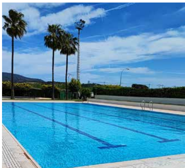
La piscina municipal de Marines

Se ha reducido tanto el consumo de agua, un bien escaso, como los tratamientos químicos necesarios para poner a punto la piscina municipal. En este sentido, se va a colocar una silla también para que las personas con movilidad reducida puedan disfrutar de estas instalaciones con todas las garantías.