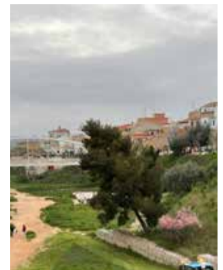
Afores de Riba-roja.

El reglament municipal afavorit pel govern del PSPV ha comptat amb el suport dels grups de Compromís, Esquerra Unida, Podem Riba-roja Pot, Ciutadans i Partit Popular, mentre que Vox ha votat abstenció. Aquest ordenament jurídic legal del municipi entrarà en vigor després de romandre en període d'al·legacions i disponible per a la consulta per part dels ciutadans i veïns de la localitat pel període de temps fixat per la llei.