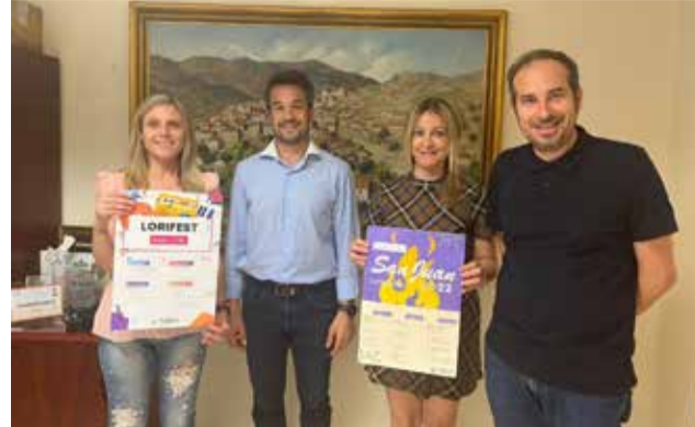
La presentación de la fiesta. / EPDA