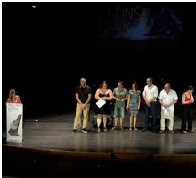
Entrega del premi / EPDA

A més de l'import en metàl·lic per al guanyador de cada categoria, ambdós premis inclouen la gravació en un estudi professional i el lliurament de l'escultura imatge del premi de l'artista local Paco Crespo. Les peces guanyadores formaran part de l'arxiu immaterial de Mú-