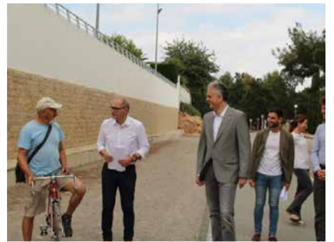
Reunión con el vicepresidente.

Tras la visita para conocer de primera mano el proyecto, la comitiva ha visitado el Parque Público de Vivien-