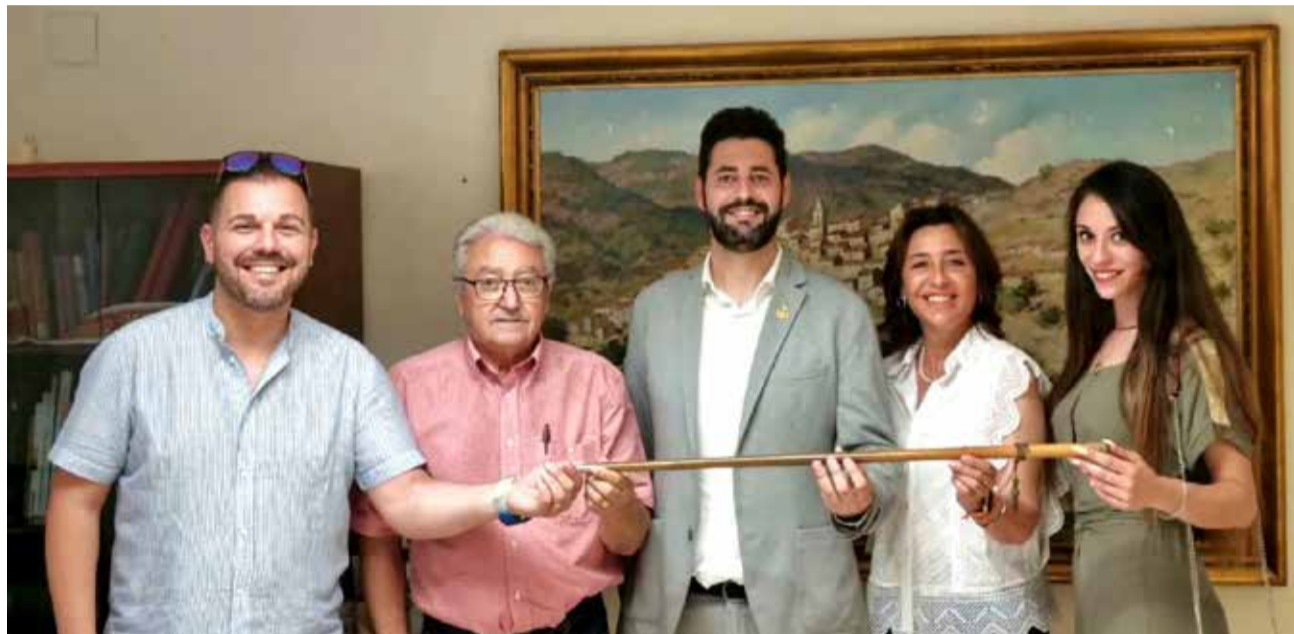
Los concejales durante la cesión de mando de la alcaldía de Loriguilla tras la moción.

Todo comenzó con la decisión de Ciudadanos de romper con el pacto de gobierno, a finales del mes de mayo. Así, señalaban en