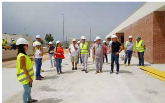
Una de les reunions de coordinació.