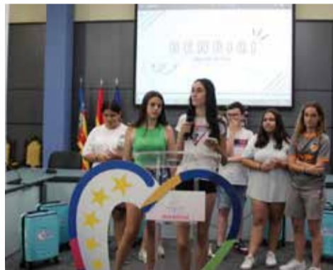
Presentación / EPDA

Tras la exposición se ha procedido a la votación, siendo el proyecto cuya iniciativa pretende poner en marcha intercambio juvenil con otras ciudades europeas la que más votos ha obtenido, y que llevará al grupo vencedor a viajar a Guardastallo el próximo mes de septiembre dentro del proyecto rEU-Discovery.