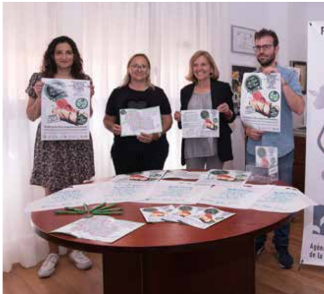
Presentación de la ruta.

Els establiments que participen enguany són: Hi5 Cafè&Fun, Gastrobar El Cantó de Cò, Nou Tropical, Tus Momentos, La Terracita, La Font, Ágora 23, Blanc i Negre y El Encuentro. Tal com s'ha establert en les Bases de participació els establiments participants oferiran de les seues tapes amb un preu fixat per a la tapa amb consumició de 3,5€, i el preu de la tapa extra de 2,5€. A fi que els ciutadans i ciutadanes identifiquen els establi-