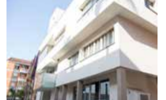
Vilamarxant / EPDA