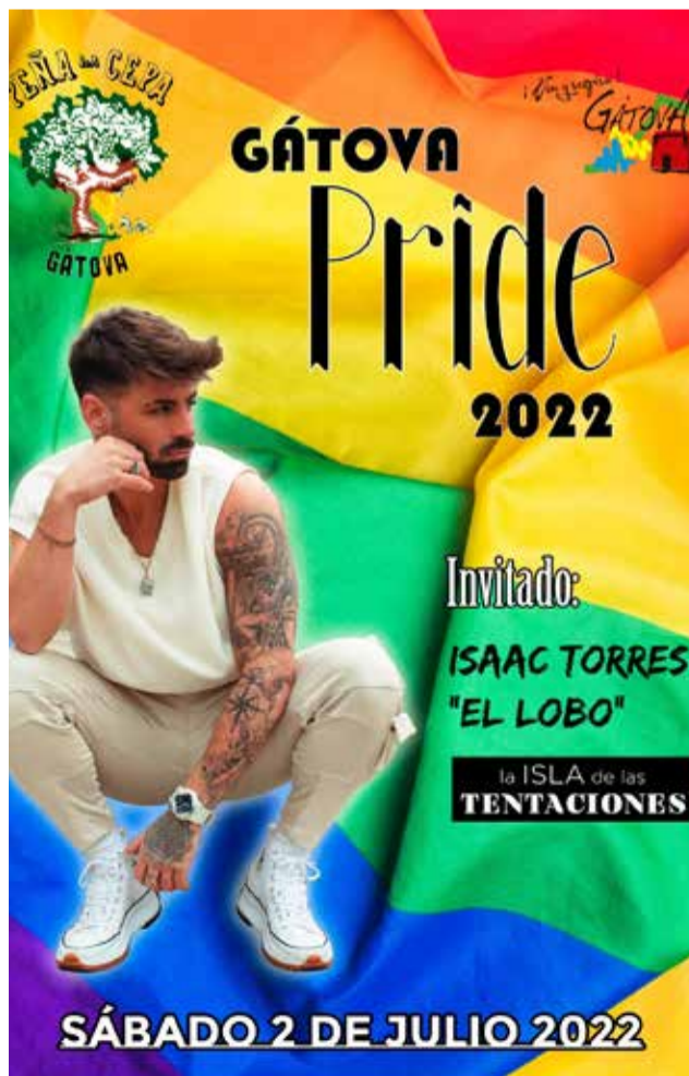
Cartel del Día del Orgullo en Gátova.