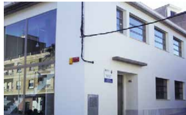
Centre de salut de Benissanó.