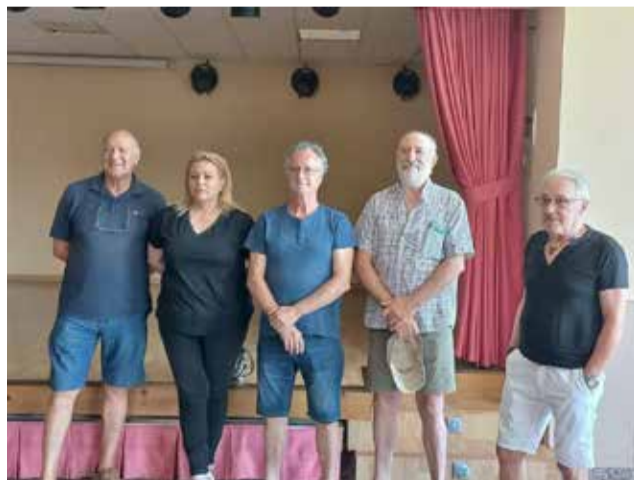
Constitución del equipo directivo.

Así, la asociación no se ha creado desde cero, sino que se ha producido una reactivación de la existente, y gran