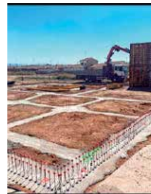
Las obras iniciadas.

El museo se está edificando en los terrenos que el Ayuntamiento de Casinos tiene en la manzana formada por las calles Tejería y San Roque -en una parte del antiguo campo de fútbol-, justo al futuro Centro de Día aprobado por la Conselleria de Igual-