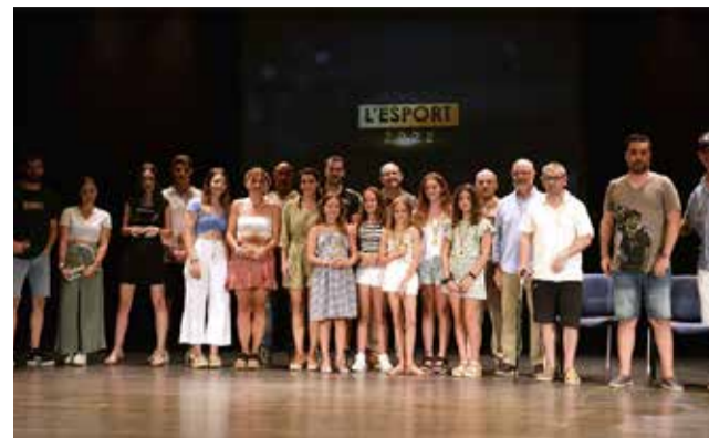
Premis de l'Esport.