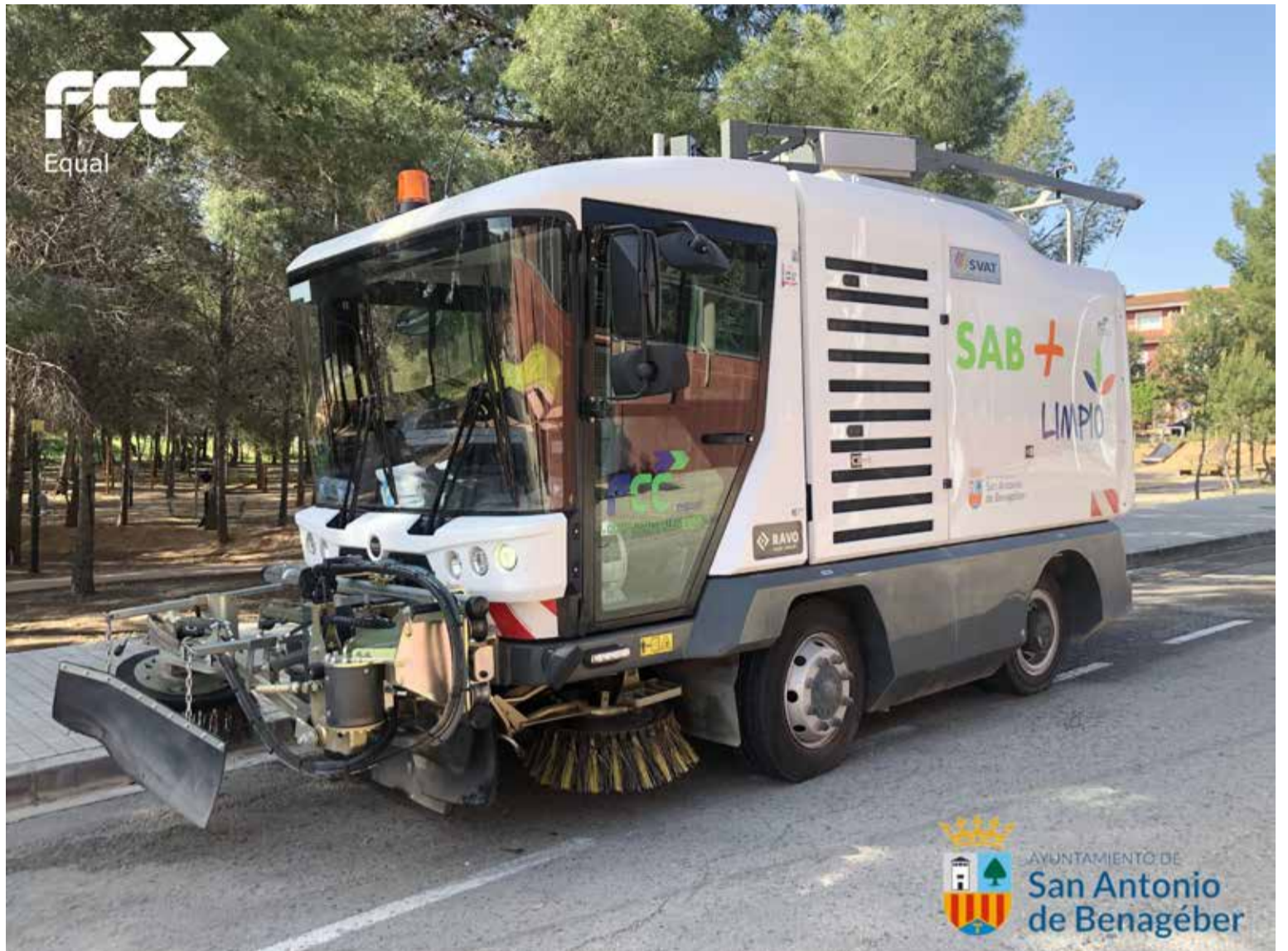
Uno de los puntos de limpieza viaria realizada por FCC Equal CEE Comunidad Valenciana, S.L.

De esta forma, no solo se busca ofrecer oportunidades laborales a los colectivos en riesgo de exclusión, sino también proporcionarles habilidades, capacidades y competencias para su desarrollo profesional. FCC Medio