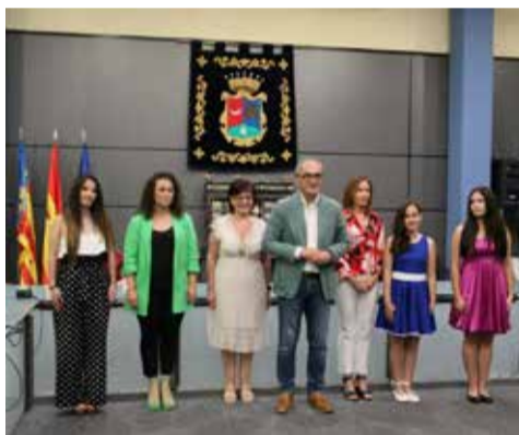
Presentación / EPDA