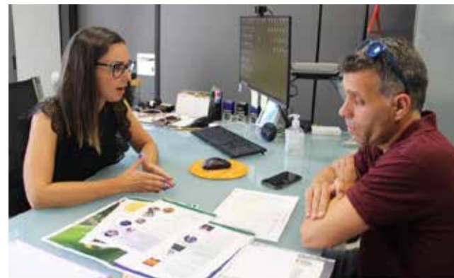
Reunión la Feria.