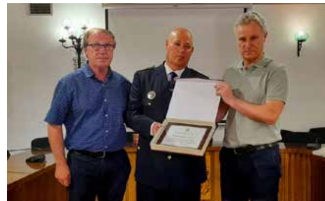
Els agents i l'alcalde.