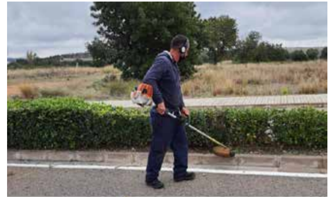
Un trabajador en labores viarias.