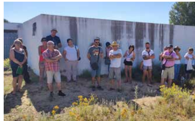
Els veïns que van acudir a la visita.