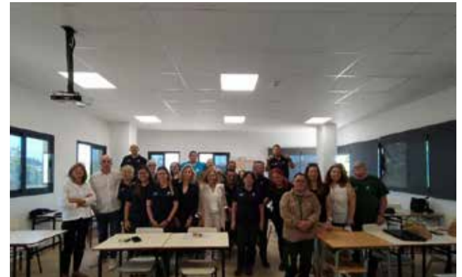
Un dels moments.