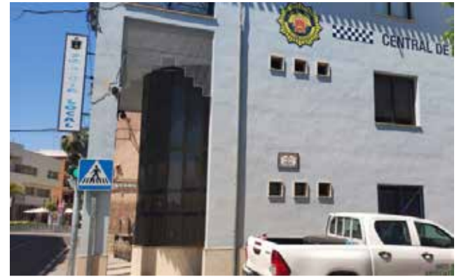
Polícia Local de Vilamarxant.