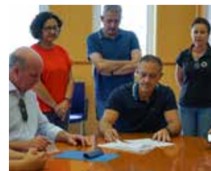
Pie de foto.