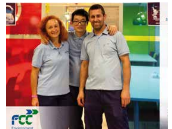
Miembros del proyecto FCC Equal.

Uno de los proyectos más destacables en el ámbito de la integración laboral de personas con discapacidad es FCC EQUAL Centro Especial de Empleo (CEE), impulsado por FCC Medio Ambiente. FCC EQUAL es un Centro Especial de Empleo en el que ya trabajan 30 personas con discapacidad severa. Se dedica a la gestión y ejecución íntegra de Centros Especiales de Empleo (CEE) y a la prestación de servicios auxiliares para personas con discapacidad. Además del propio trabajo interno del grupo, FCC se apoya y trabaja con entidades especializadas, organizaciones y fundaciones, cuyo objeto social es la integración social y laboral de las personas con discapacidad, así como la mejora de sus condiciones de seguridad y salud. De esta forma no solo se busca ofrecer oportunidades laborales a personas con discapacidad sino que también busca proporcionarles habilidades, capacidades y competencias para su desarrollo profesional en la compañía.