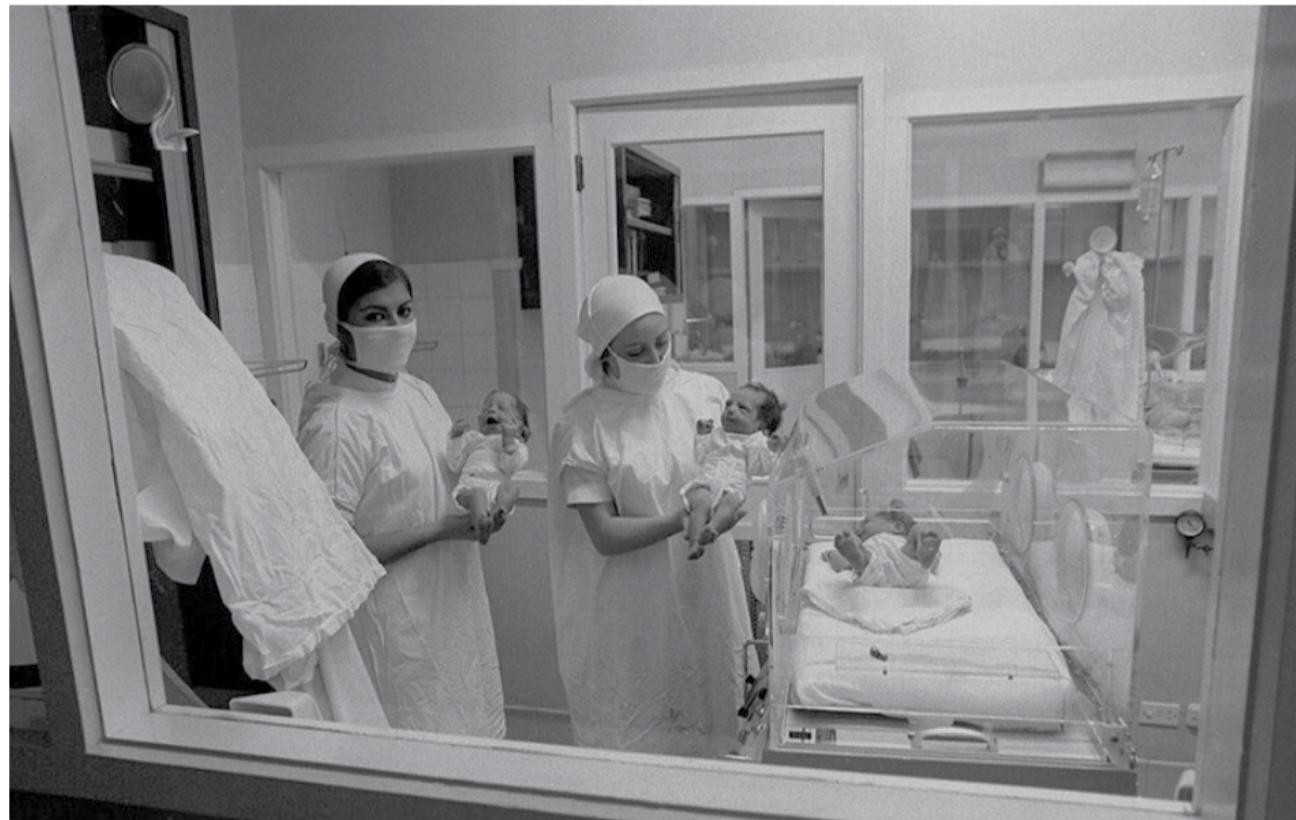
Recién nacidos durante los años 70 acompañados de matronas

Uno de los avances que se han intentado ha sido las muestras de ADN para intentar localizar a los familiares. Las bases de ADN en España son ínfimas, la que tiene el Ministerio de Justicia apenas tiene 1.000 perfiles. Pero los bases de ADN mundiales, que son principalmente estadounidenses, tienen millones de personas registradas, que deciden analizar sus cromosomas con otros fines.