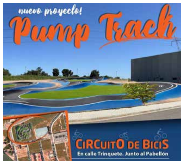
Proyecto de circuito digital. / EPDA

Por eso, desde el Ayuntamiento se muestran "orgullosos" de compartir con la ciudadanía esta buena noticia que, sin duda, hará felices a muchos niños y niñas del municipio.