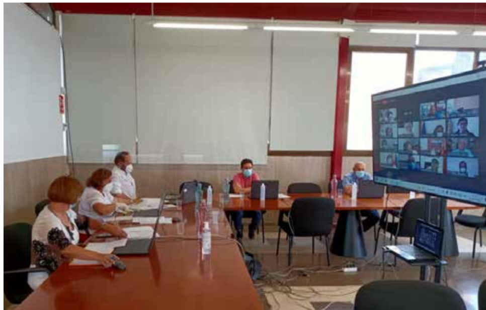
Una de las reuniones del pleno

“El Partido Popular está en contra de la Mancomunitat Camp de Túria y de los servicios que se prestan. Estamos ante una decisión política que juega en contra de sus propios vecinos y vecinas. El municipio que no apruebe los estatutos dejará de formar parte del ente supramunicipal y su ciudadanía verá como deja de recibir servicios que día a día mejoran la calidad de vida de sus vecinos y vecinas”,