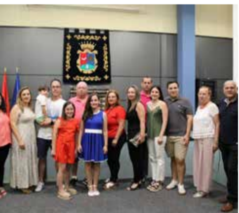
Presentación / EPDA