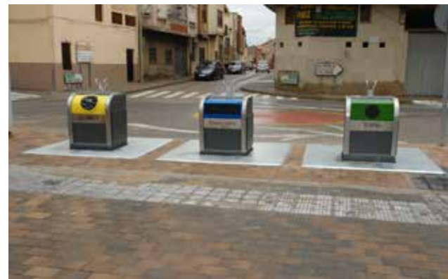
Contenedores de reciclaje.