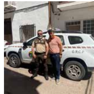
Recepció / EPDA