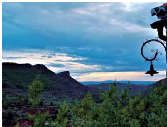
Paisaje de Gátova.