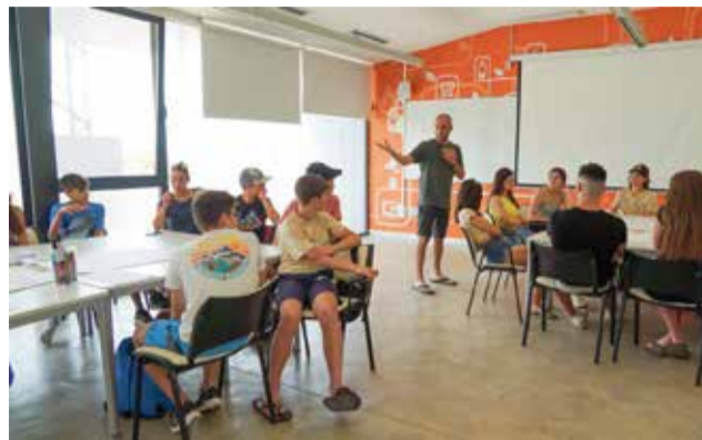
Algunos de los jóvenes participantes.