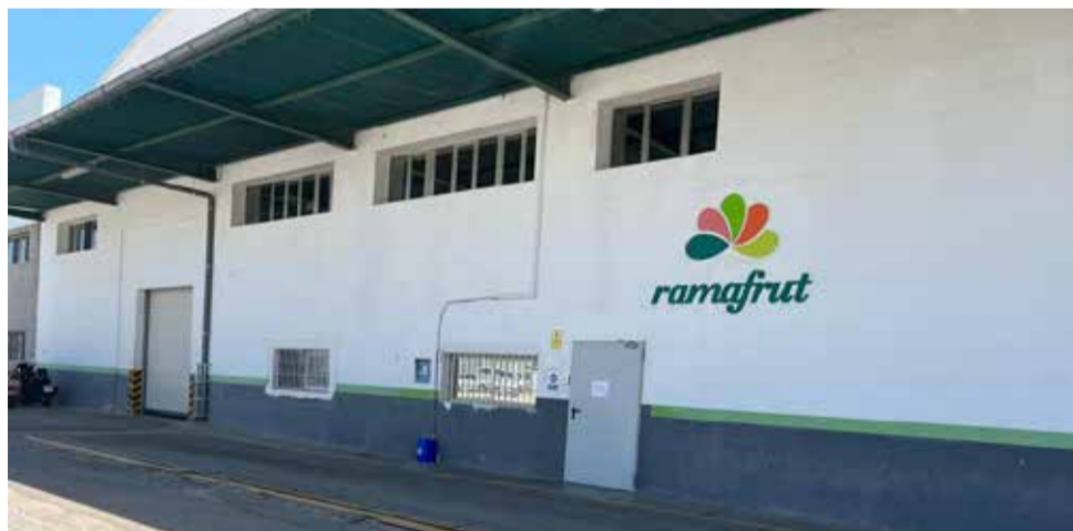
La empresa Ramafrut en Benaguasil.