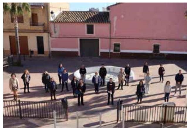
Integrantes de los talleres de 2022.

ra la realització de aquests tallers. El alcalde de la localitat ha explicat que els dos tallers concedits - confecció i publicació de pàgines web, i activitats de gestió administrativa - permetran la formació i les pràctiques remunerades de vint persones (diez per cada taller) durant dotze mesos, i suposen una aposta per part del equip de govern per