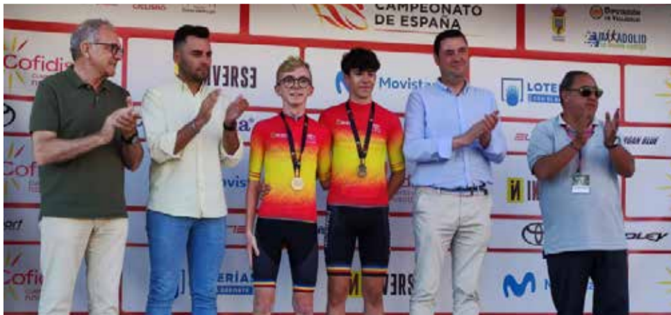
El campió després de la competició. / EPDA