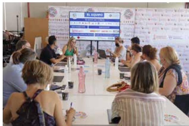
Mesa de Comerç. / EPDA

La Mesa de Comerç va servir per a desgranar totes les accions que s'havien desenvolupat al costat de la marca ComerçActiu des de l'any 2020 fins a l'actualitat. De la mateixa manera, es va avançar en noves subvencions que s'estan treballant per a continuar fent costat a dinamitzar