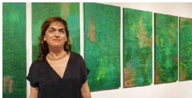
La artista, junto con algunas de las piezas que se pueden encontrar en la exposición.

El tema que articula las cuatro series que comprenden esta muestra es el paisaje, o mejor dicho, la relación profunda, íntima, autobiográfica que la artista