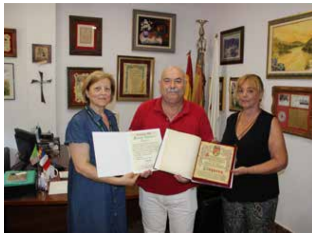
Recepció a l'Ajuntament.