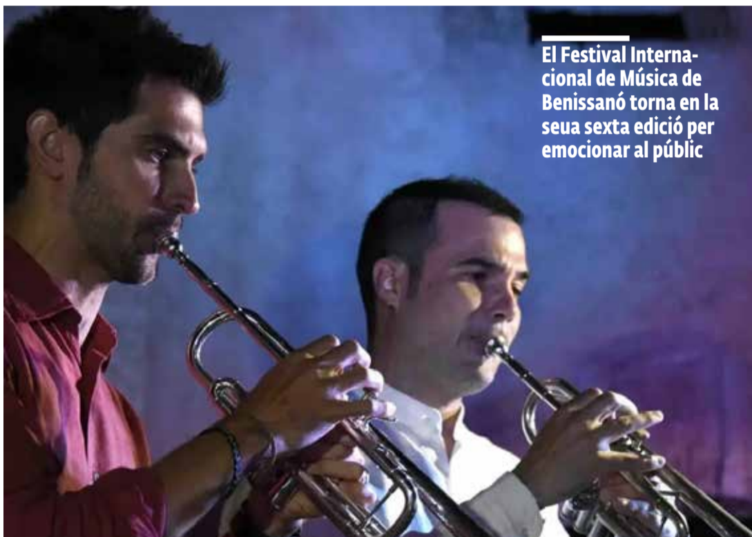
El Festival Internacional de Música de Benissanó torna en la seua sexta edició per emocionar al públic

Són alguns dels qui van participar en estos espectacles, que cada any que passa tenen més interès per este esdeveniment, que cada any es realitza en estiu.