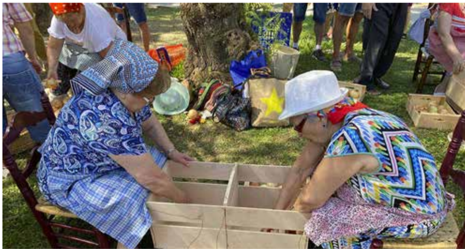
Unes dones en la Fira de la Ceba.

La fira de la ceba s'iniciava amb un esmorzar popular on s'han provat estos platsplats i altres que tenien com a ingredient la ceba. També s'han fet conferències on s'han destacat els beneficis bio saludables de la ceba o com ha evolucionat el treball en els