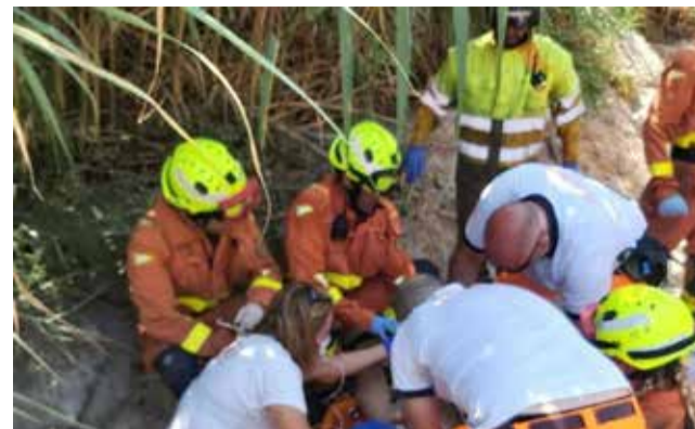
Las labores en el río.