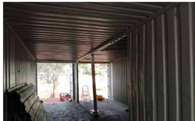
Interior del futur local social.