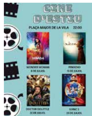
Cartel de cine.