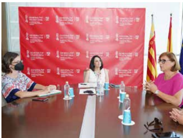
La reunión con la presidenta.

El PGOU marcará el desarrollo del municipio en los