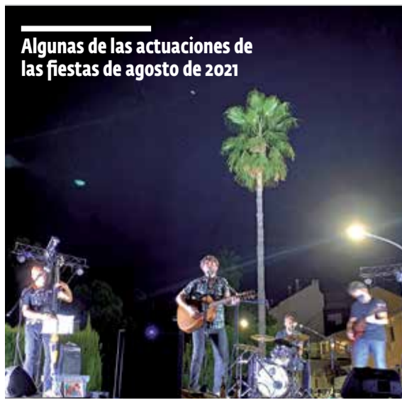
Algunas de las actuaciones de las fiestas de agosto de 2021

SE REALIZAN TORNEOS, DISCOMÓVILES O CINE DE VERANO