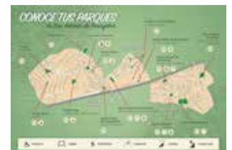
Mapa de parques. / EPDA