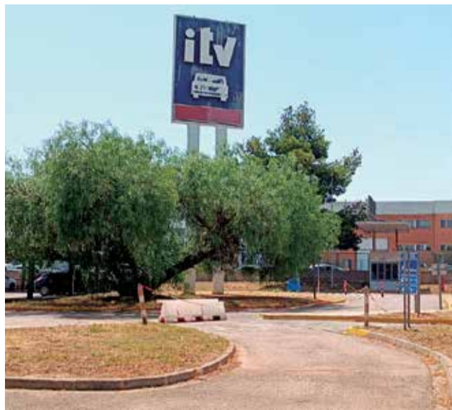
Exteriores de las revisiones de ITV.

El acuerdo de cesión de los terrenos fue rubricado entre ambas partes -Ayuntamiento de Riba-roja de Túria y Seguridad y Promoción Industrial (Sepiva)- en mayo de 1988 y en él se establecía una vigencia de 33 años por un bien de propiedad municipal calificado como suelo urbano industrial edificable, según la nomencla-