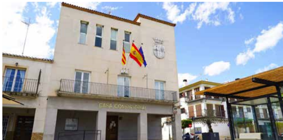
Ayuntamiento de San Antonio de Benagéber.

EL OBJETIVO ES AVANZAR HACIA LA IGUALDAD CON ACCIONES TRANSVERSALES