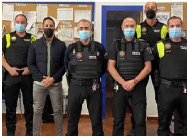
Agentes de Benaguasil.

Desde el Gobierno Municipal se lleva a cabo el cumplimiento de un compromiso de legislatura con la ciudadanía en esta materia y también, de uno de los puntos de acuerdo que planteó el equipo de go-