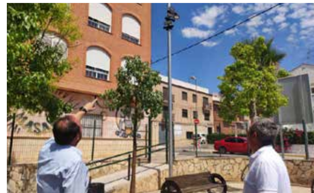
L'alcalde visitant les il·luminàries / EPDA