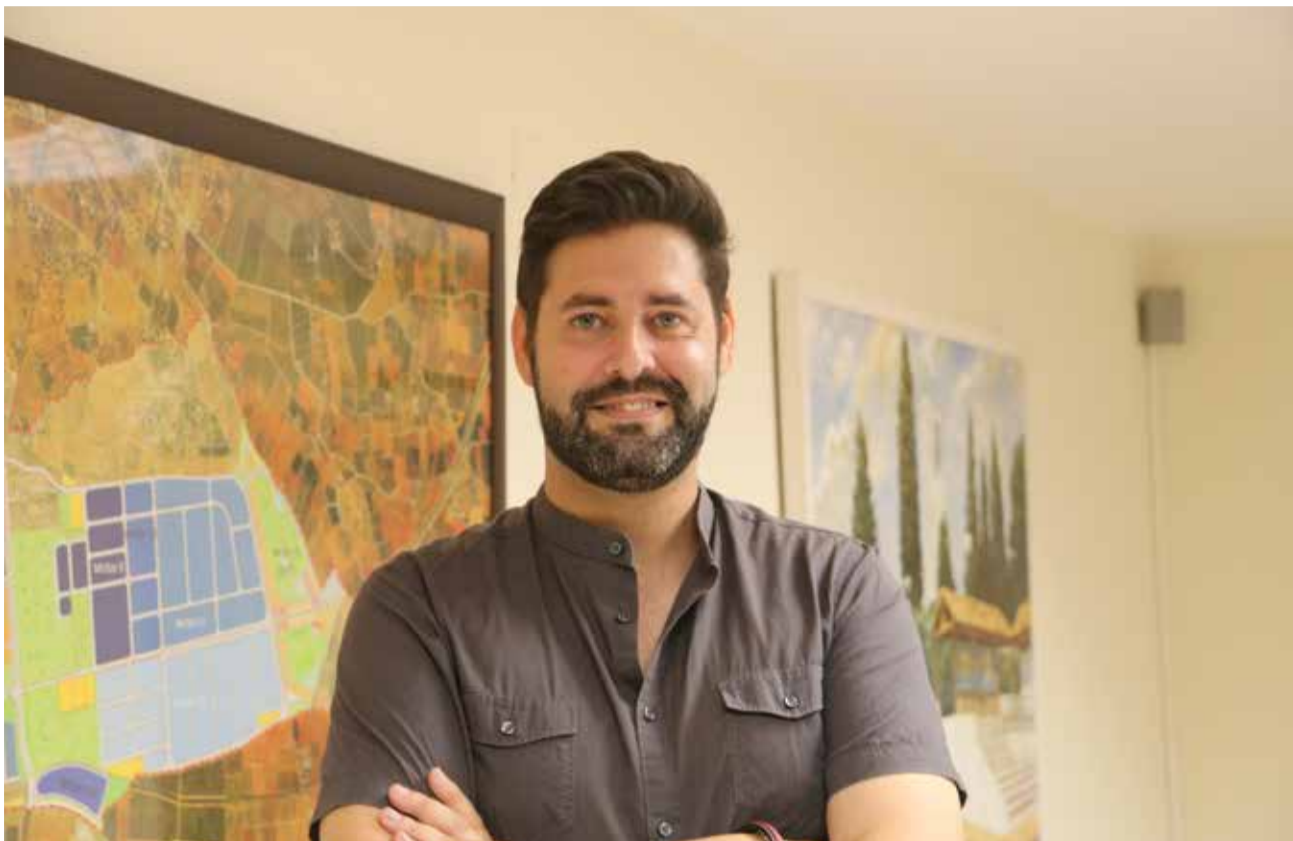
Diferentes instantes de la entrevista.

Alfaro heredó una alcaldía de hace cuarenta años, en la que el alcalde era todopoderoso, el último en la firma y el primero en la foto"