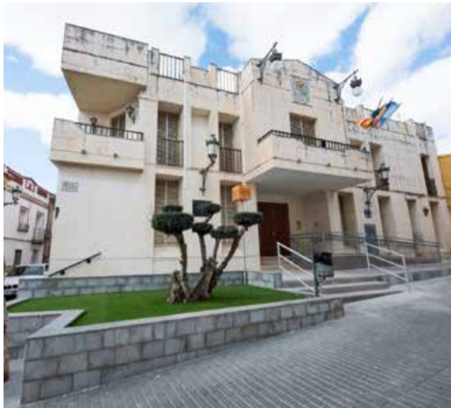
Consistori de Benissanó. / EPDA

L'objectiu que ens hem marcat des del primer dia ha sigut en tot moment mantindre l'equilibri en poder inver-