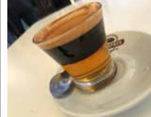
Un cremaet / EPDA