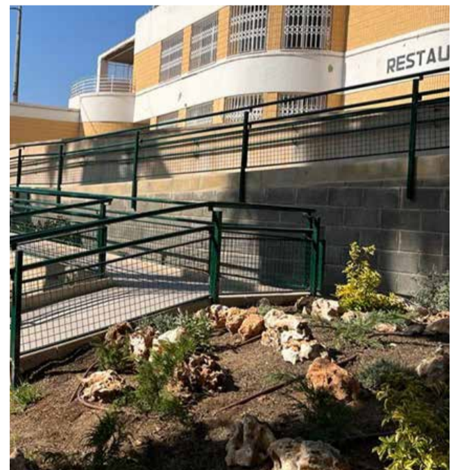
Entrada al complejo deportivo.

Con esta actuación que, se enmarca dentro del Plan de Inversiones de la Diputación de Valencia, el Ayuntamiento da otro paso importante en la eliminación de barreras arquitectónicas en el municipio y hace plenamente accesible el complejo deportivo.