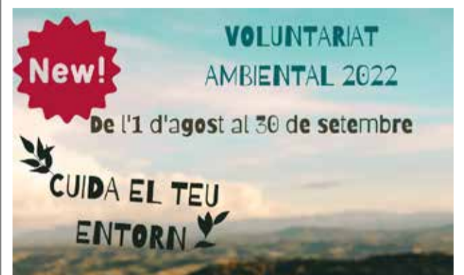
Cartel de la iniciativa. / EPDA