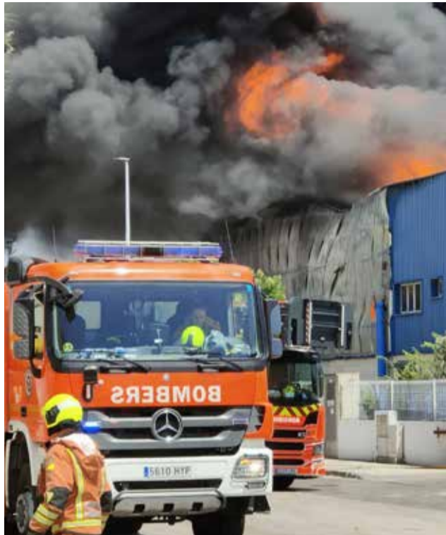
Inicio del incendio en Riba-roja.

El incendio se declaró por causas no precisadas, alrededor de las 12.30 horas en la nave situada en la calle Foga-