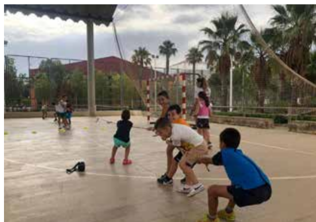
Niños jugando en Benaguasil.

Desde el Ayuntamiento han subrayado que la escuela de verano «es ya un acontecimiento deportivo y social, que congrega cada año a más niños que eligen pasar el verano haciendo cosas divertidas y saludables, y que ayuda a los padres que, por motivos de trabajo y una vez acabado el curso escolar, no tienen con quién dejar a los niños».