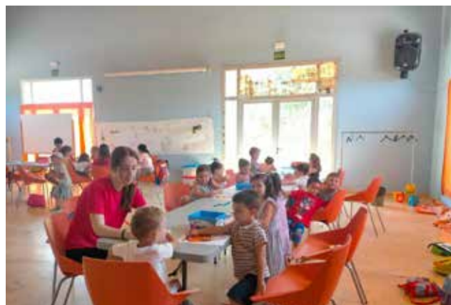
Talleres de la escuela de verano / EODA