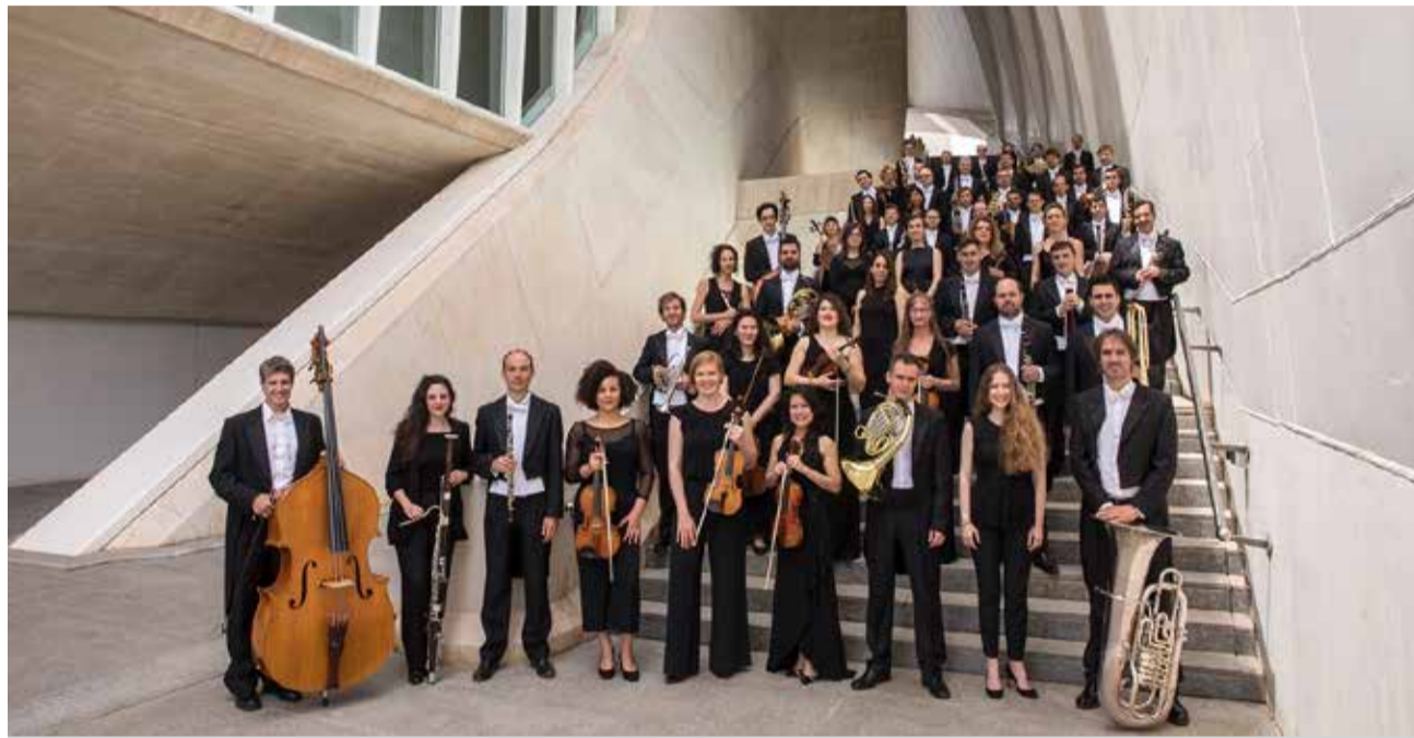
Formación musical sinfónica.