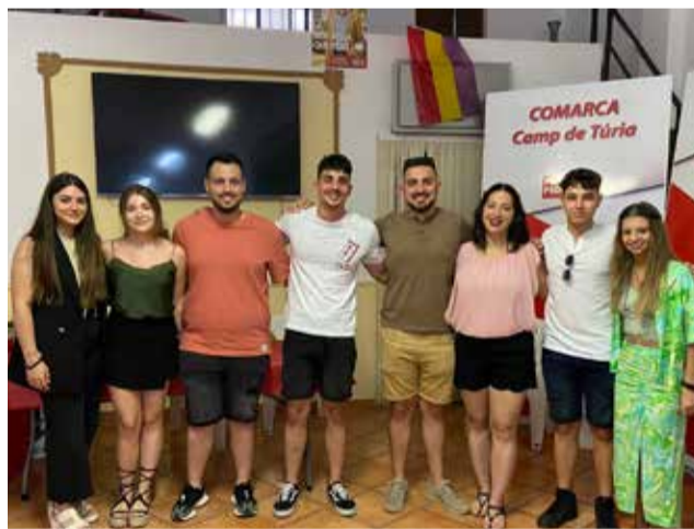
Executiva local de Joves Socialistes.