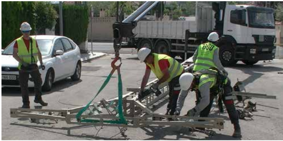
Unos obreros trabajando en la mejora de la red.