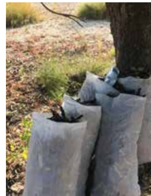
La garrofa.

Fins a finals d'agost, la policia, en col·laboració amb l'equip ROCA de la Guàrdia Civil, intensificarà els controls i inspeccions per a comprovar la procedència, pertinença i volum de producte, d'acord amb el que figura en els documents de traçabilitat que disposen els recol·lectors autoritzats. Entre aquests documents figura el REGEPA, Re-