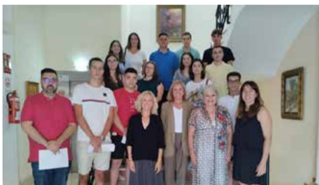
Los alumnos en el Consistorio.