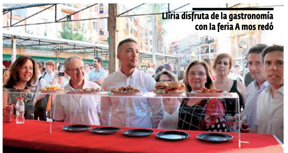
Llíria disfruta de la gastronomía con la feria A mos redó

Una actividad pensada para niños y mayores que gira alrededor de la gastronomía.