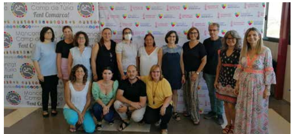
Tots els membres després de la visita a l'edifici de la Mancomunitat.