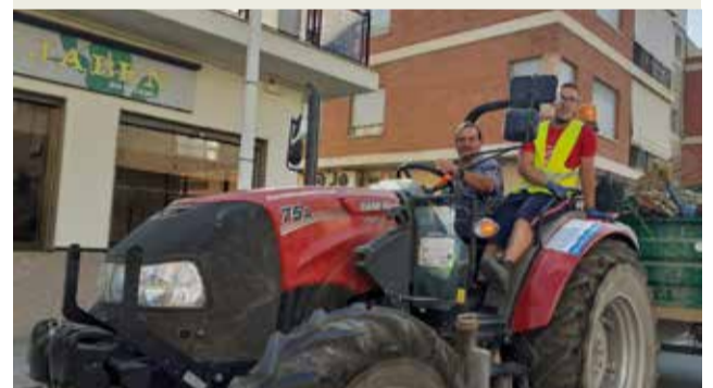
► L'ajuntament de Casinos ha realitzat la poda de les palmeres del poble