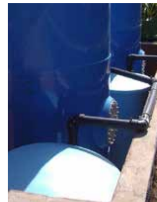
Un modelo.

El agua osmotizada que se bebe en Loriguilla tiene un índice de Langelier muy bajo (negativo), lo que indica que es corrosiva. Por este motivo, cuando se deja el agua parada en tuberías y acometidas antiguas del municipio y se abre el grifo pasado un tiempo, esta adquiere un color marrón que se produce por todo lo que ha ido arrastrando de las conducciones.