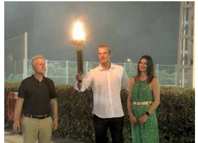
L'esportista durant la inauguració.

Així, i durant els pròxims dies, el Poliesportiu Municipal acollirà en les seues renovades instal·lacions competicions, exhibicions i tornejos de fins a 12 modalitats esportives diferents. Aquesta primera setmana se celebrarà la fase de grups mentre que la segona