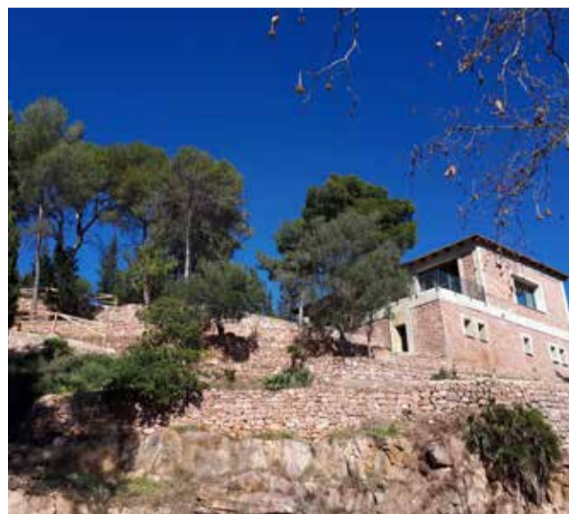
La Llar de Serra, en las afueras del municipio

La concesión administrativa tiene una duración de 30 años y la empresa adjudicataria adecuará las instalaciones para su uso como camping y actividades complementarias. Además, I Respira SY SL ha firmado acuerdos de colaboración con otros comercios y empresas locales para poder trabajar en red con el tejido empresarial del municipio.