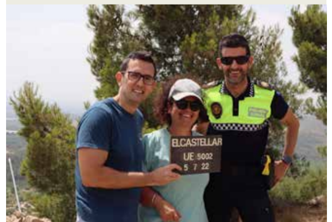
► Durant el mes de juliol han començat les excavacions arqueològiques al Castellar, gràcies a la inversió de l'Ajuntament de Casinos i el Ministeri de Foment del Govern d'Espanya. Segons informa el Consistori de Casinos, Es preveu excavar la meitat de tot el jaciment.