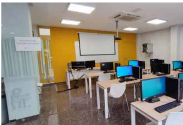
Una de las aulas donde se realiza la formación.

■ ES LA PRIMERA VEZ EN LA HISTORIA DEL MUNICIPIO QUE SE CONSIGUEN DOS AÑOS SEGUIDOS