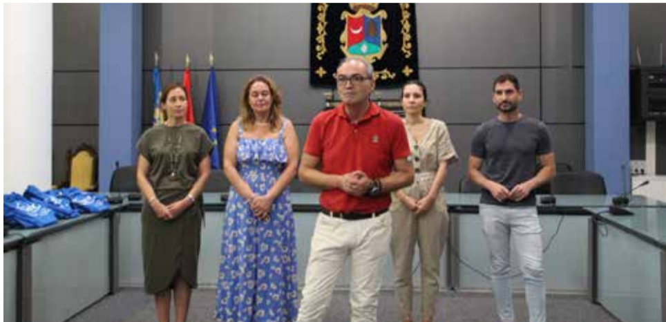
El alcalde durante el acto junto con los concejales de Benaguasil.

SE TRATA DE UN PROGRAMA MUNICIPAL PARA EJERCITAR LA MEMORIA Y EL CUERPO