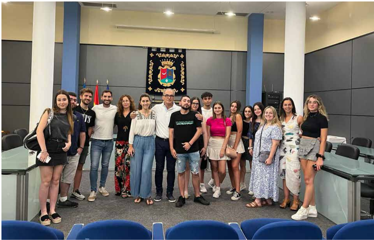
Estudiantes durante la recepción en el Ayuntamiento.