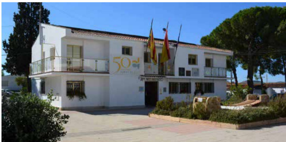
Consistorio de Loriguilla.