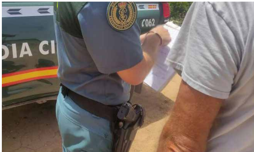
La Guardia civil durante la detención.

De esta forma, se investiga por un delito de maltrato animal a un hombre de 32 años y de nacionalidad española.