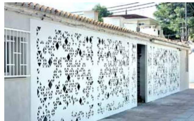
Centro de salud.