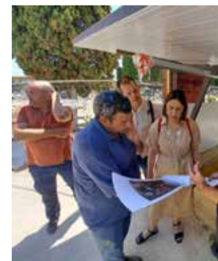
Trabajos en una fosa.

Las nuevas técnicas en obtención de ADN han impulsado el proyecto de nuevo, y por eso los encargados de los trabajos buscan familiares de algunos de los fusilados pa-