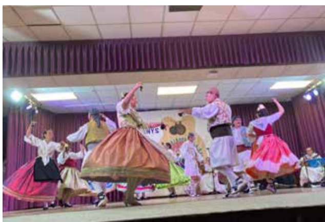
Durant l'actuació.