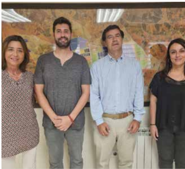
El equipo de gobierno en la reunión.

Esta relación se inició el pasado año 2021, a través de unas jornadas informativas desarrolladas por FEPEVAL en colaboración con IVACE para dar a conocer los beneficios de la Ley 14/2018 de gestión, modernización y promoción de las áreas industriales de la Comunitat Valenciana, así como las ventajas que supone la constitución de Entidades de Gestión y Modernización.