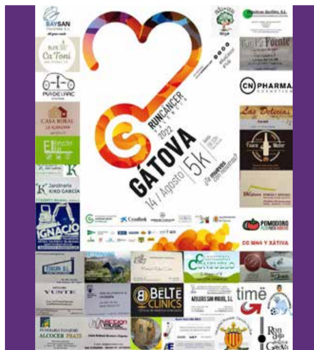
Cartel de Gátova. / EPDA