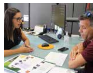
Reunión. / EPDA