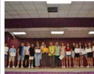
L'acte. / EPDA