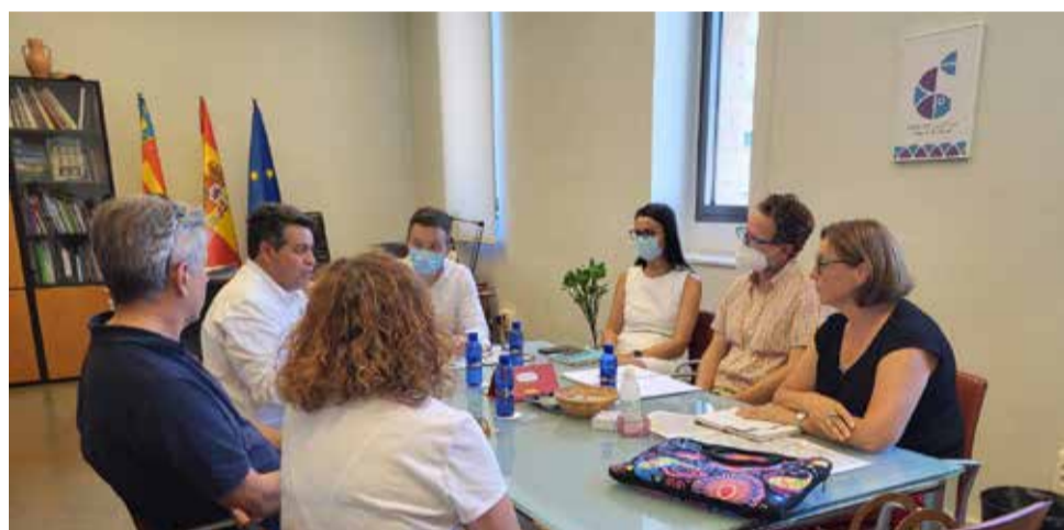
Reunió para solucionar la problemática. / EPDA