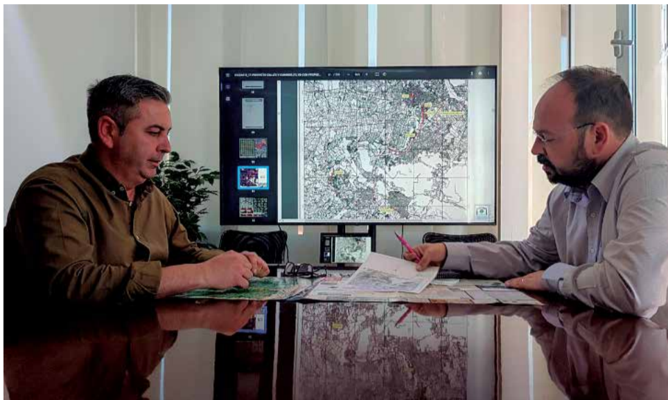
Reunió per posar en marxa el projecte.

"Sabem que el treball és extens i que es prolongarà en el temps però estem con-