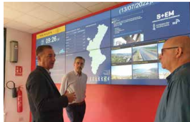
El alcalde en la reunión.