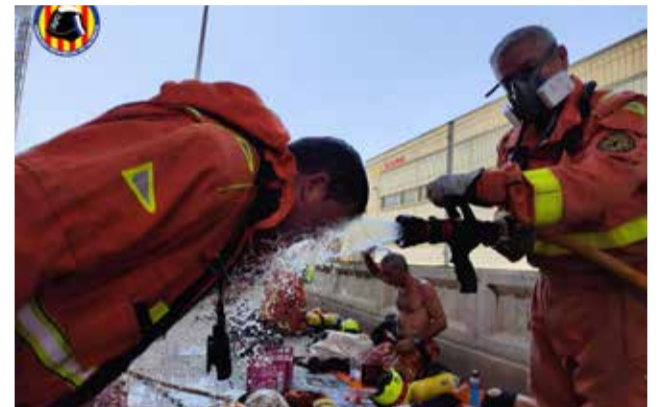
Los bomberos en la labor de extinción.

bién a su Unidad de Recarga de Aire, un equipo remolcable de recarga de botellas de aire, con capacidad de hasta 30 botellas.