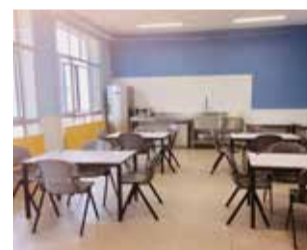
Comedor municipal.