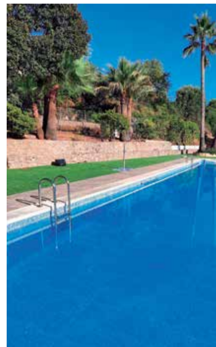
Piscines d'Algar de Palància (esquerra)

serà necessari que, quan s'anuncie, s'apunte un número mínim de persones. Un mínim que serà de 15 persones. En cas d'haver-ne, l'any passat les classes se feien dos dies a la setmana de 10 a 11 hores del matí. Quant a l'horari de bany lliure a Algar serà de dilluns a dissabte d'11 a 14 i de 16:30 a 19:30 i diumenges i festius d'11 a 14:30 i de 16:30 a 19:30. Pel que fa als preus, el bono per a xiquets de 5 a 12 anys és de 20 euros. Per a adults 18 euros (10 banys), 30 euros (15 banys), 35 euros (20 banys), 45 euros tota la temporada. Les tarifes diàries seran: xiquets (1,50 euros en