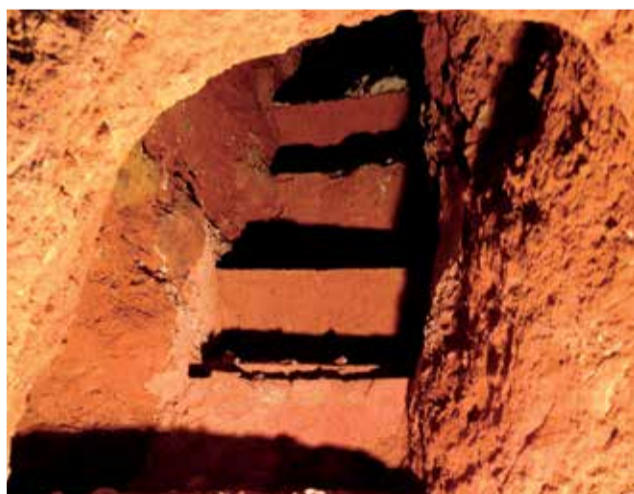
Refugi de Quart de les Valls.

ta els van presentar el projecte i l'objectiu de poder rescatar el refugi de la plaça del Pòpulo amb l'ajuda de les institucions, complementant-lo amb un centre d'interpretació que parlara dels refugis i els refugiats que van arribar a la localitat durant el conflicte.