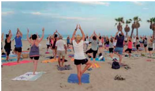
Una de les activitats d'esport a la platja.

■ L'AJUNTAMENT PRESENTA LA PROGRAMACIÓ ESPORTIVA AMB LA NOVETAT DE TENNIS I VOLEIVOL DE PLATJA, TANT PER A ADULTS COM PER ALS MÉS MENUTS DE LA LOCALITAT