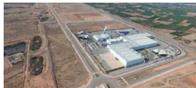
Parc Sagunt II.

Según Muniesa, “mientras aparecen noticias en que se habla de que excedentes de Ford o de Seat se postulan como destinatarios de esos potenciales empleos, hace que esa necesidad de formación se torne esencial y más cuando esta semana pasada se anunciaba en prensa que Almasse-