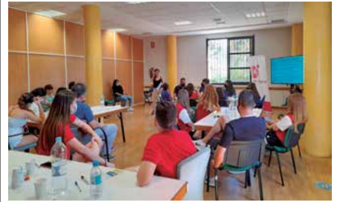
Instantánea del debate.