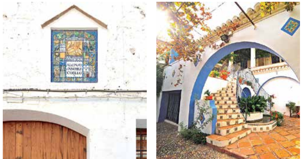
Iglesia y Palacio de los Vives de Cañamàs, Casa Coello y Casa Guarnier.