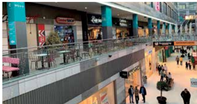
Centro Comercial Lepicentre.

Así, comienza un verano lleno de actividad, moda y restauración en el Centro Comercial, donde los más pequeños de la casa podrán disfrutar de las actividades de Lepilandia, que desde el 23 de junio abrirá por las mañanas y en el mes de agosto está preparando una "Escoleta d'estiu" según ha informado la gerencia de LEPI-LANDIA.