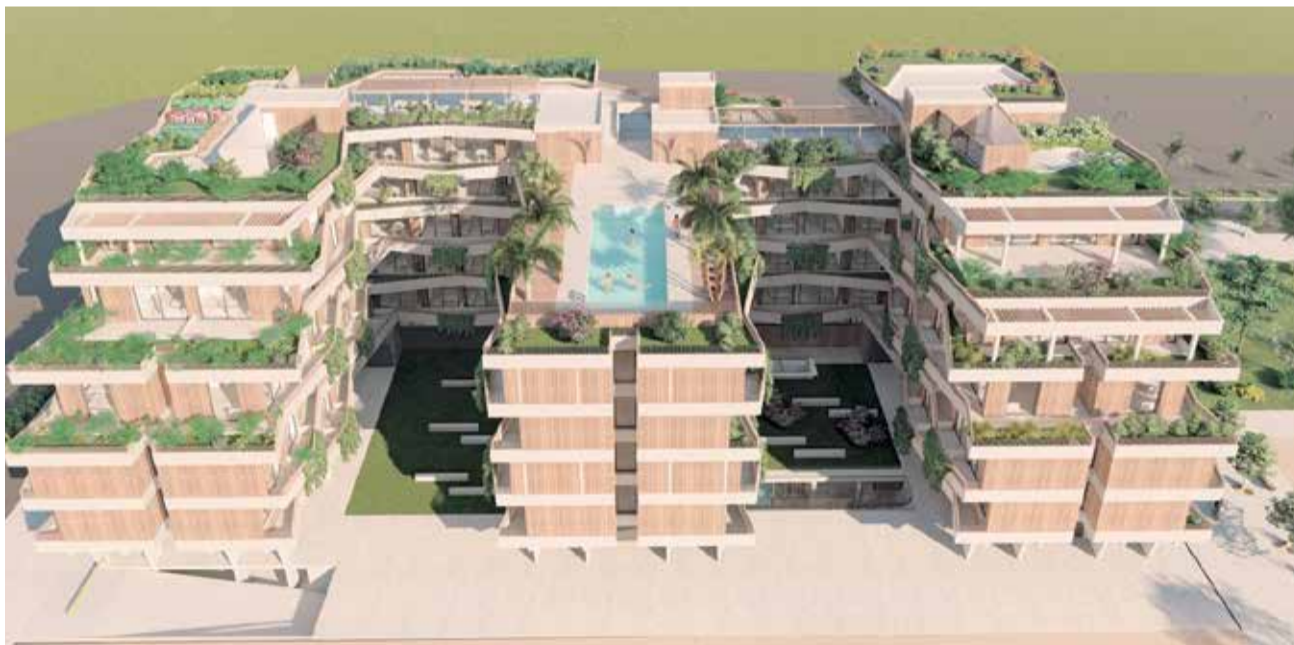
Maqueta alzada del proyecto del hotel The Coolaborative con el que contará Sagunt.

nes, como para las personas que necesiten establecerse por una temporada más larga por razones profesionales", ha confirmado Planes.