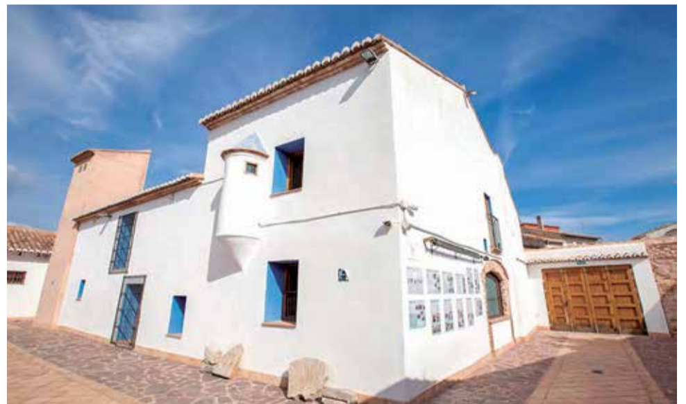
El Molí Nou, representante de la actividad agrícola de Quartell.

La actividad cultural también ocupa un lugar importante en la localidad de Quartell. El auditorio Joaquín Rodrigo alberga uno de los certámenes de teatro en valenciano más importante de la Comunitat con la participación de prestigiosas compañías de teatro. Así mismo, el Ayuntamiento también ha consolidado el festival de guitarra.