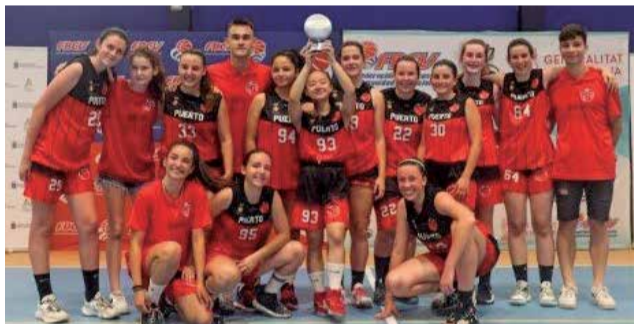
Cadete del Club de Baloncesto Femenino.