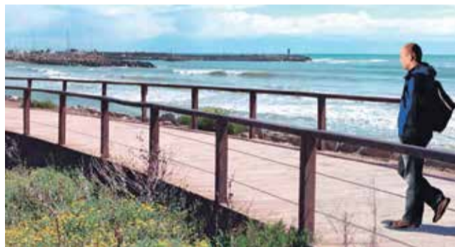
La propuesta para el Delta del Palancia.

que “en primer lugar se deben seguir unos principios rectores, destacando el Delta y la ribera del río como pulmón verde, el respeto a las dinámicas fluvial y lito-