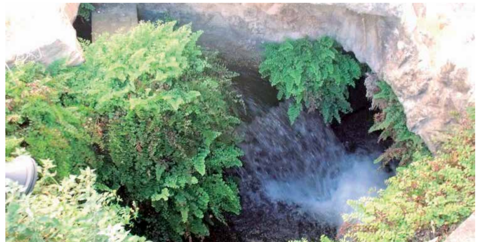
Ruta del agua de Quartell.