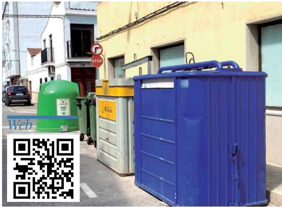
Contenidors a la localitat de Benifairó de les Valls.

Dins d'aquesta actuació de prevenció del desaprofitament alimentari es definirà i dissenyarà una campanya per a posar el punt de mira en aquesta fracció de residus i en