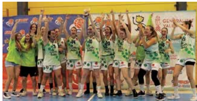
Senior del Club de Baloncesto Femenino.