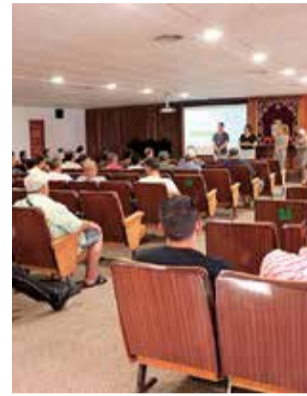
Presentación. / EPDA

La subvención concedida por el Servicio Público de Empleo Estatal (SEPE) es de 303.296 €, a lo que se le suma la aportación municipal de 84.750 €, dando lugar a un presupuesto total 388.046 € que irá destinado a la ejecución de obras en caminos rurales y otras intervenciones. Las actuaciones medioambientales, que se han iniciado el 1 de julio, se realizarán en caminos de las partidas de Montíver, de Gausa