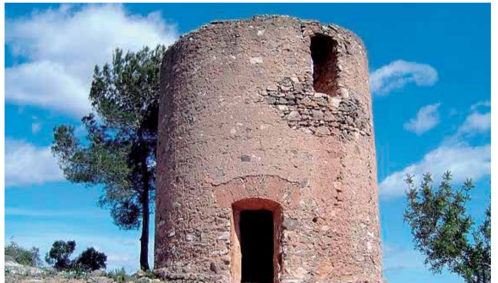
Molí de Vent de Quart de les Valls, un dels símbols del municipi.