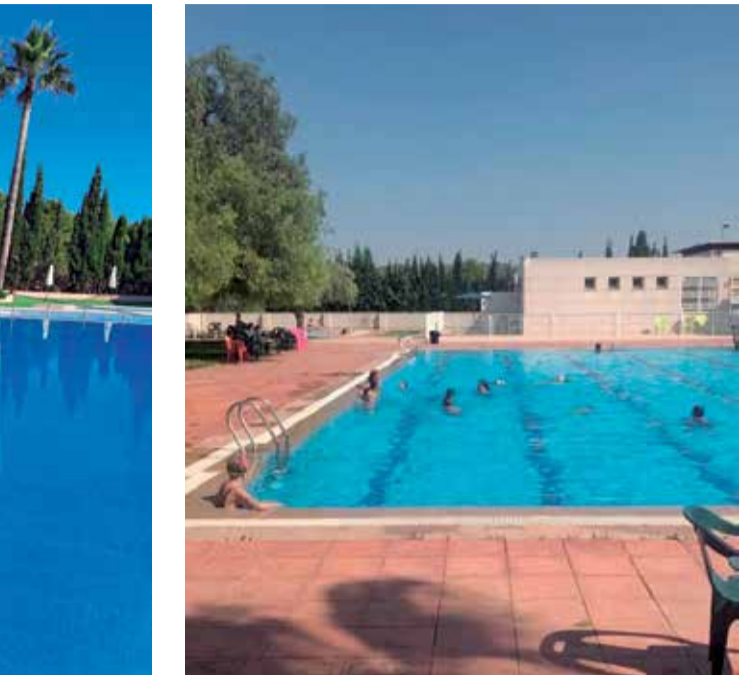
ra) i d'Albalat dels Tarongers (dreta).

9 a 14 hores i la piscina està oberta des del 24 de juny.