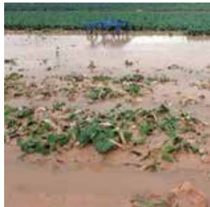
Cultivo dañado.

Para poder hacer frente a las consecuencias de estas adversidades, la moción insta también a reclamar al Ministerio y a la Conselleria de