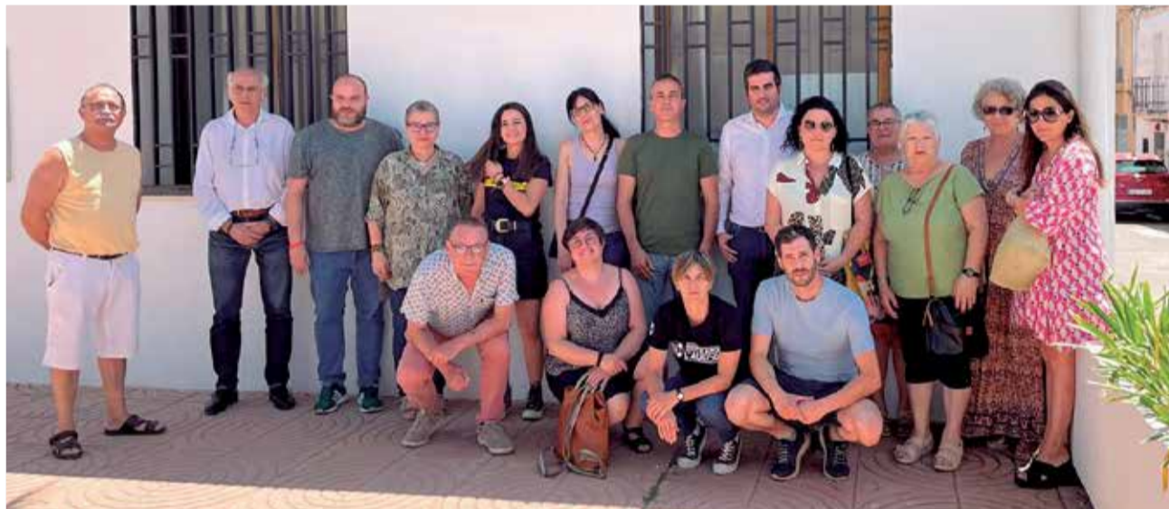
Algunes persones que assistiren a la jornada de portes obertes del refugi antiaeri de Quart.