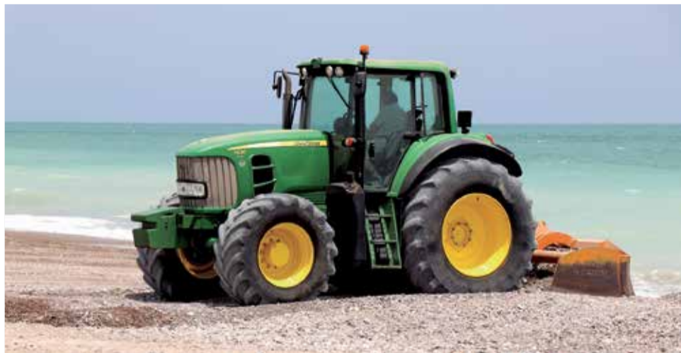
Un tractor llevando a cabo actuaciones de nivelación de la playa de Corinto.