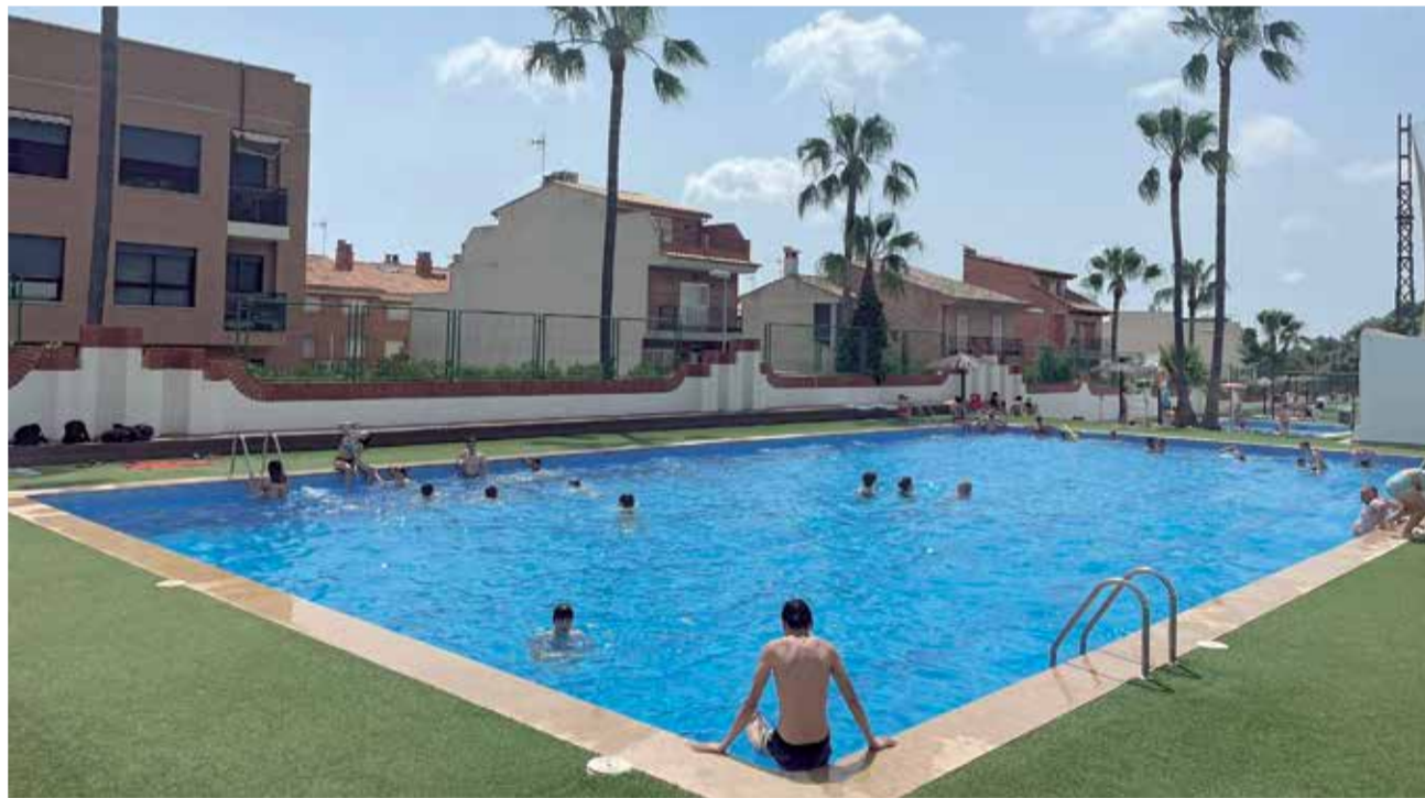
Piscina municipal de Faura.

L'horari de bany lliure de la piscina municipal de serà de 10 a 14 i de 16 a 20 de dilluns a diumenge. Quant als preus, el bono de 10 entrades té un preu de 20 euros per a persones d'entre 12 i 65 anys; de 15 per a menors de 12 i majors de 65. Els passes es poden demanar des del 16 de juny a l'Ajuntament de