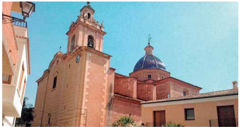
Casa Condal de Faura y parròquia de Santos Juaanes. / EPDA