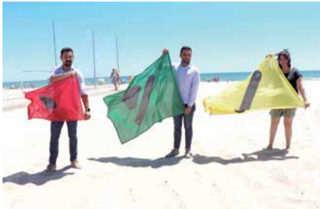
Alcalde y concejales con las banderas.

Por lo tanto ahora las banderas en lo que respecta al estado en el que se encuentra el mar y sus colores son verde,