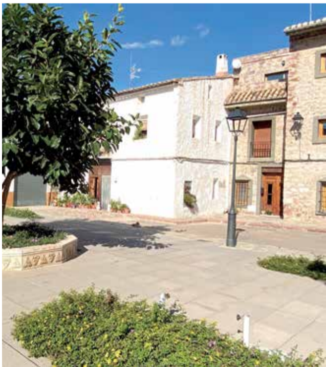
Plaza mayor de la antigua vila musulmana.