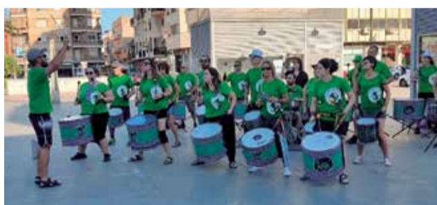
Dos instantáneas de la conmemoración.