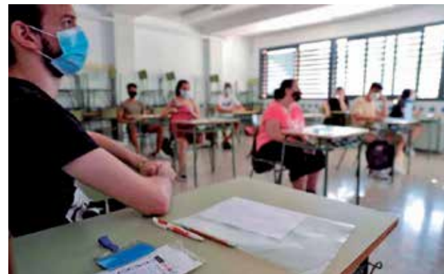
Varios estudiantes en un aula de bachillerato.