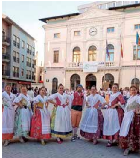
Balls tradicionals en la programació d'un altre any.

La música serà una constant també el mes d'agost amb concerts de rock, gypsy jazz, flamenc fusió o ritmes del Carib. A més, destacaran altres cites com la II Mostra de Curtmetratges, circ i màgia o la IV edició de les Nits de Patrimoni".