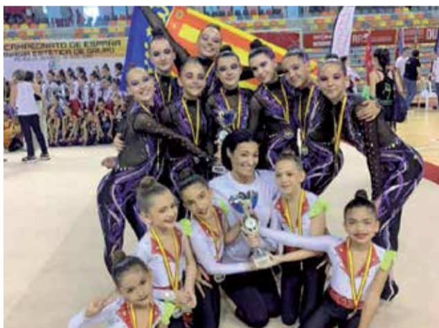
Club de Gimnasia Rítmica en el campeonato.