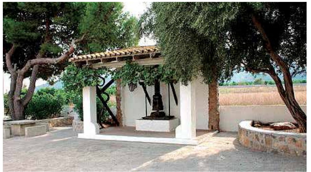
La prensa de Quart de les Valls.

Si te interesa la gastronomía , durante todo el año podrás disfrutar con los conocidos almuerzos que te ofrecen nuestros bares, así como también de poder disfrutar de buenas comidas y cenas con productos frescos de la zona. En septiembre se celebra la semana cultural de Fiestas Patronales, en que no faltará el 'comboi' valenciano, aunque, eso sí, respetando las medidas de seguridad.