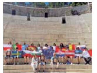
Los estudiantes.