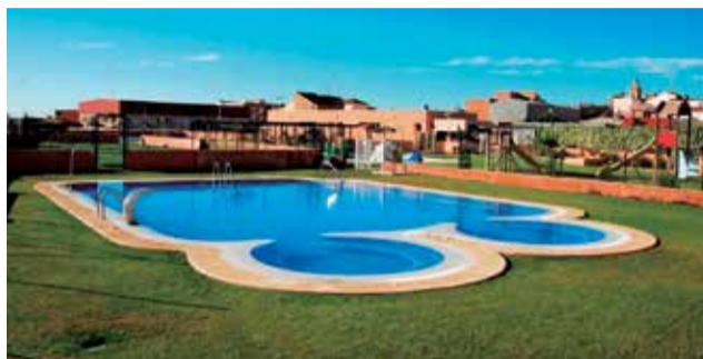
Piscina de Quart de les Valls.

ge 26 de juny. Enguany, l'horari és d'11 a 19:30 hores de dilluns a diumenge. A més, des de l'Ajuntament informen que el passe de temporada és de 35 euros per a adults i de 25 per a jubilats i xiquets. La piscina romandrà oberta fins l'11 de setembre, sent una de les de la comarca que més tard tancarà.