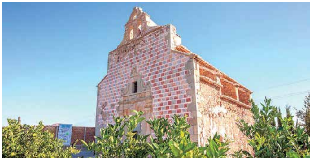
Iglesia de Benicalaf, templo de la antigua aldea ahora extinta.

Además, Benavites incluye en su término municipal parte de la marjal de Almarjà-Almenara , uno de los paisajes naturales más singulares y de mayor belleza que se pueden visitar en la localidad. Se trata de un humedal incluido en la lista del Convenio de Ramsar por su alto potencial medioambiental y ornitológico.