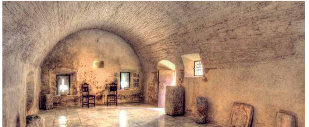
Interior de la Torre de Benavites, el símbolo por excelencia del municipio.