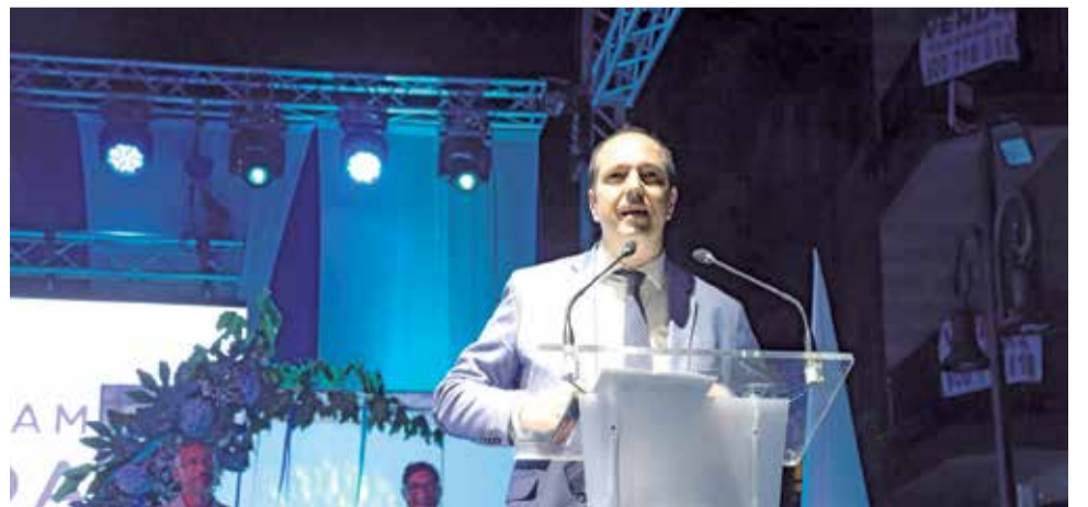
Diferents moments de la Fashion Night a Aldaia.