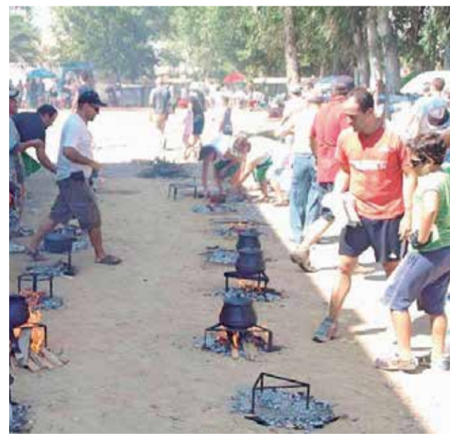
Concurso de allipebre.

En les pròximes setmanes es donaran a conèixer les dates i el calendari d'esdeveniments de les festes populars de Catarroja 2022 en un any que s'espera molt especial. El retrobament amb les festes ens porta una programació molt transversal que engloba pràcticament totes les opcions d'oci per a molt diverses edats, des de la cultural, tradicional, gastronòmica o musical.