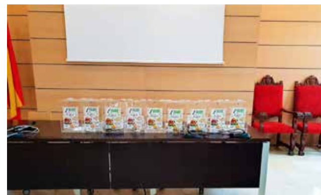
Ruta de la tapa. / EPDA

Con esta acción, l'Ajuntament d'Alfafar busca promocionar y dinamizar la actividad de restauración del municipio y visibilizar el sector de la hostelería en Alfafar.