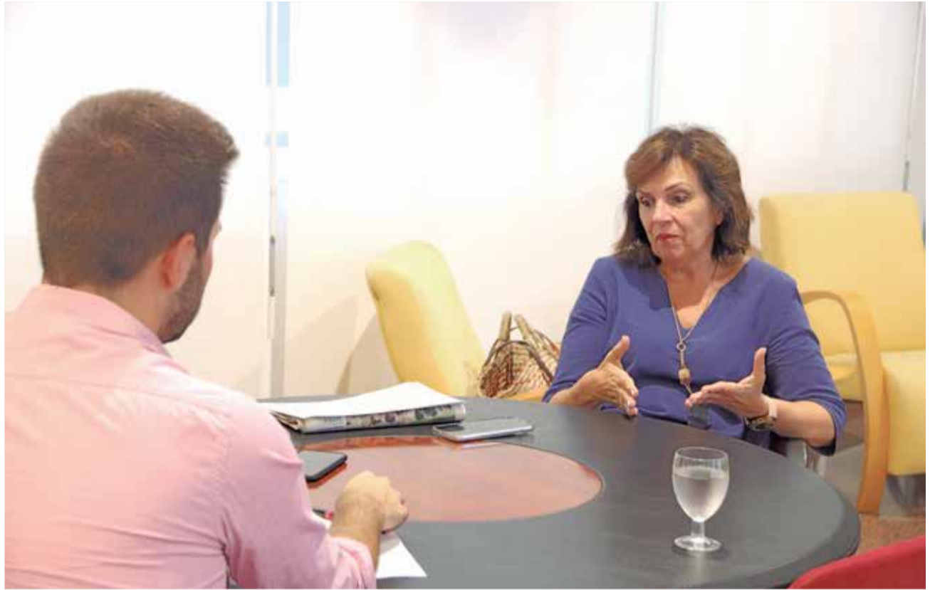
Diferentes instantes de la entrevista.

► Desde hace muchísimos años apostamos por las ayu-