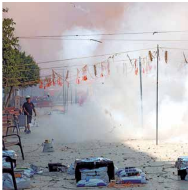
Diferentes actividades pirotécnicas en el municipio de Mislata.