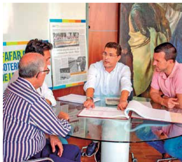
Visita de diferentes autoridades al Ayuntamiento de Alfafar.