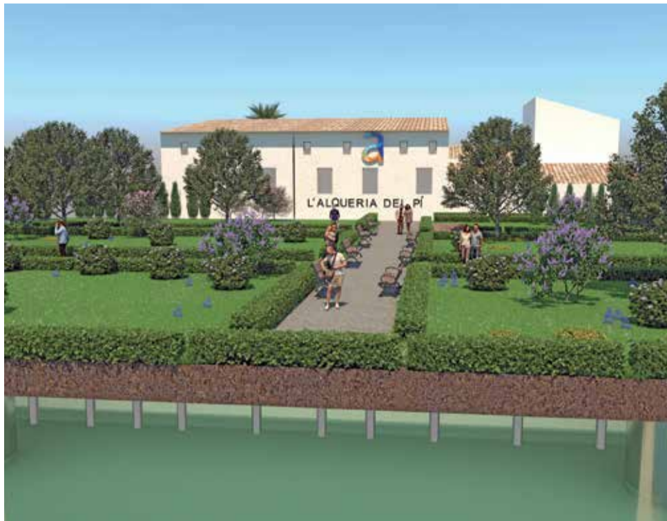
Entorno del Centro Cultural l'Alqueria.

En la segona fase de desenvolupament se realitzarà l'urbanització i ajardinament, i se treballarà en la gestió, reutilització i aprofitament de les aigües recollides amb l'actuació de la primera fase per a realitzar riego sostenible en esta zona verda.