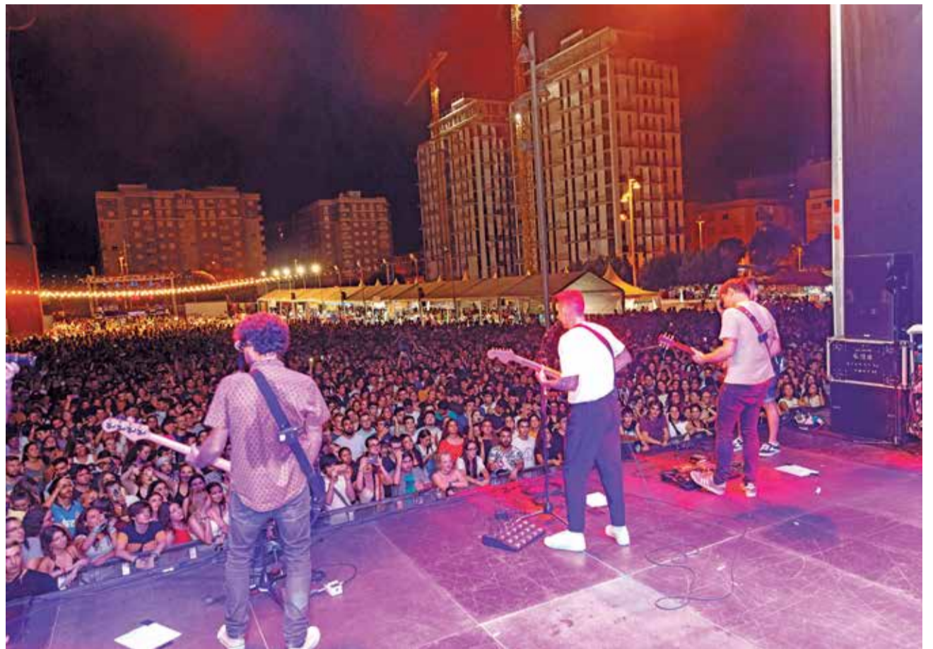
Conciertos en las fiestas de Mislata.

Otra de las actividades programadas será el reparto de