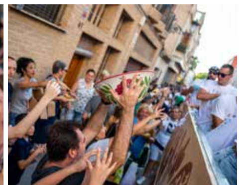
Cavalcada de la Ceràmica a Manises.