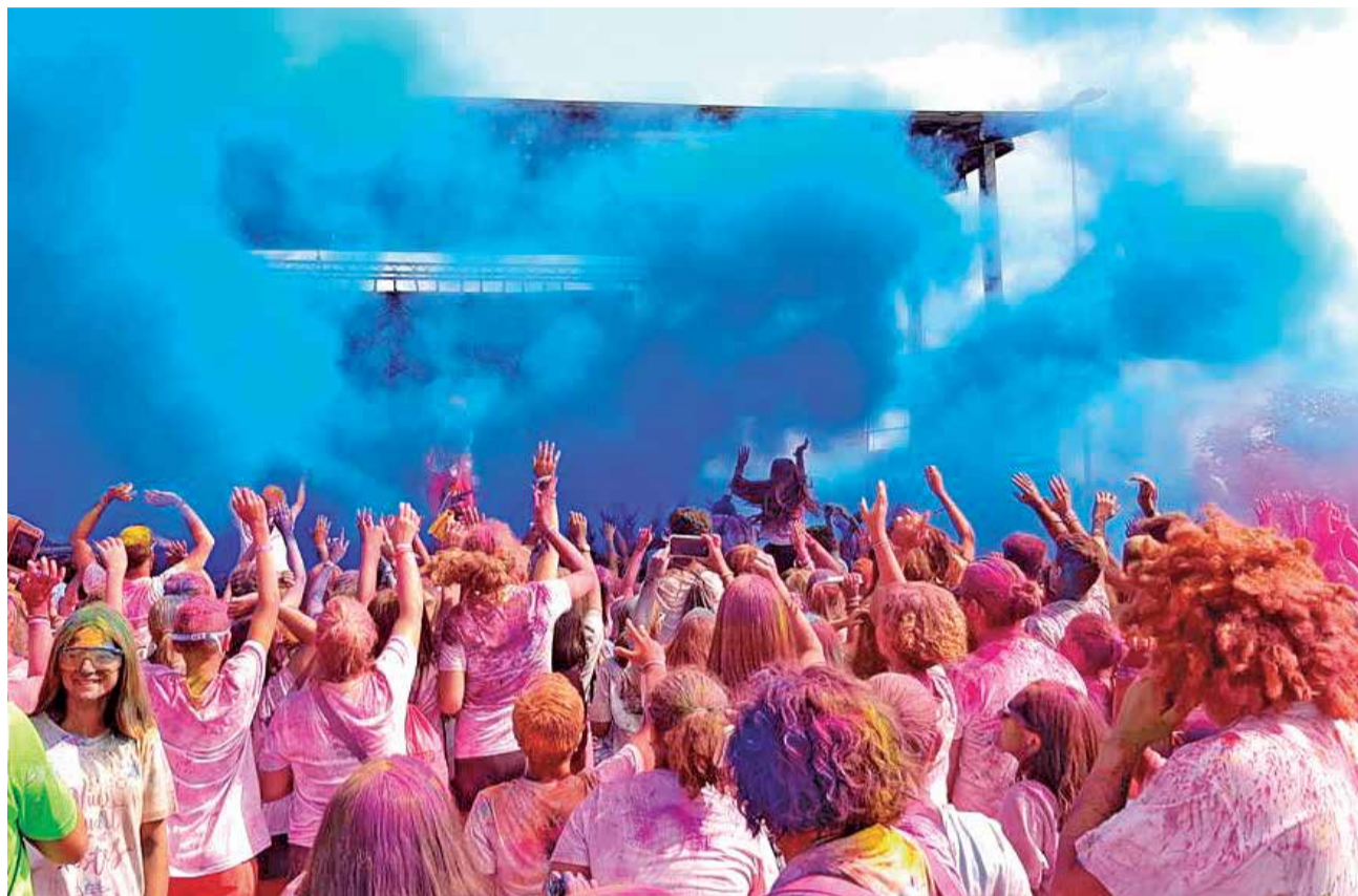
Una de las actividades realizadas en las fiestas de Quart.

Y, como marca la tradición, el pistoletazo de salida oficial lo pondrán las 21 salvas que se dispararán a las ocho y media en la puerta del Ayuntamiento. A las once de la noche, en la Plaza de la Iglesia, els Clavaris de la Mare de Déu de la Llum, els Clavaris del Santíssim Crist dels Afligits y les Clavariesses de la Mare