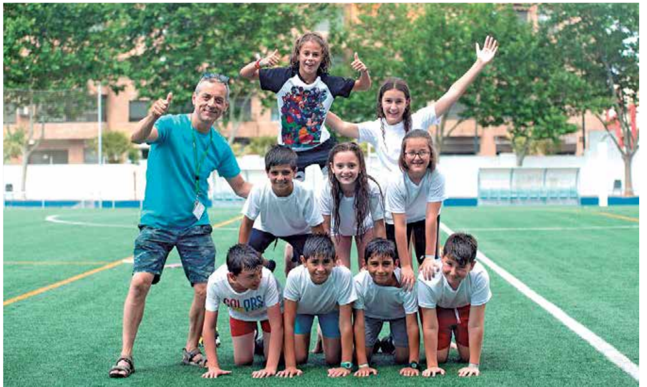
Participants del Campus d'Estiu.

En total 830 xiquets i xiquetes, de totes les edats, estan gaudint de les millors activitats lúdiques