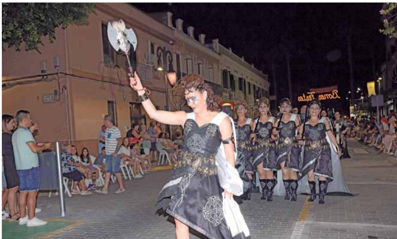
Desfilada de Moros i Cristians a Aldaia.

Durant més de tres hores es guanyaren els aplaudiments del públic que, junt a les marxades de les bandes i xarangues, arredoniren la festa gran i més esperada des de 2019 -quan la pandèmia va obligar a retardar les celebracions.