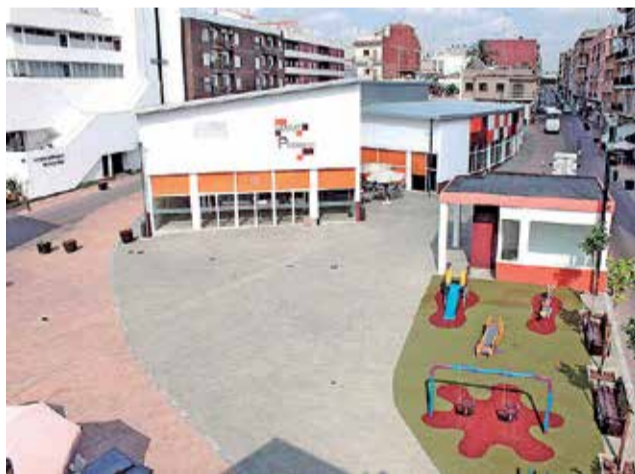
Mercado municipal de Picassent.