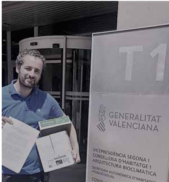
Recogida de firmas.

Para ello tiene a ingenieros trabajando en el trazado antes de aprobarse e incluso antes de que esté redactado. Pretenden que en un año esté para licitar.