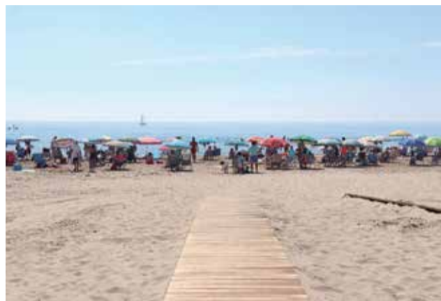
La playa de Port de Sagunt, a rebosar.

Respecto al turismo nacional, el municipio mantiene el turismo de proximidad, aunque se aprecia un importante aumento de los turistas procedentes de Castilla y León y Madrid, destinos donde la delegación de Turismo del Ayun-