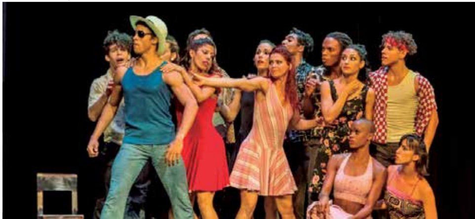
Tocororo Suite, Acosta Danza.