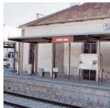
Estació d'Estivella en l'actualitat. /