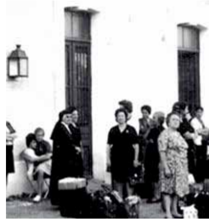
Estació d'Estivella en els anys 50. /