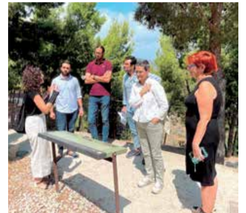
Varias instantáneas de la visita de los técnicos del Ministerio al castillo.