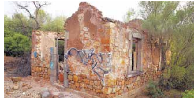
Casa de treballadors ferroviaris (Estivella).

hores d'ara representa un estil determinat. Tanmateix el seu futur en la comarca no és bo. Primerament perquè no estan valorades pels seus propietaris (fonamentalment Adif). En segon lloc perquè la ciutadania, tot i estimar el que va significar l'estació, no és conscient del seu valor. Així que és moment, abans que siga tard, de no deixar perdre les estacions en desús i de regenerar les que encara ho estan. En eixe context, no es pot perdre de vista que la nova via verda és hereva del ferrocarril miner de Sierra Menera i que s'ha de completar fins al Port per a entendre-la. En definitiva, mirem les estacions com el que són, part del nostre passat, i pensant que el seu futur implica consolidar-les com a elements patrimonials que cal preservar.