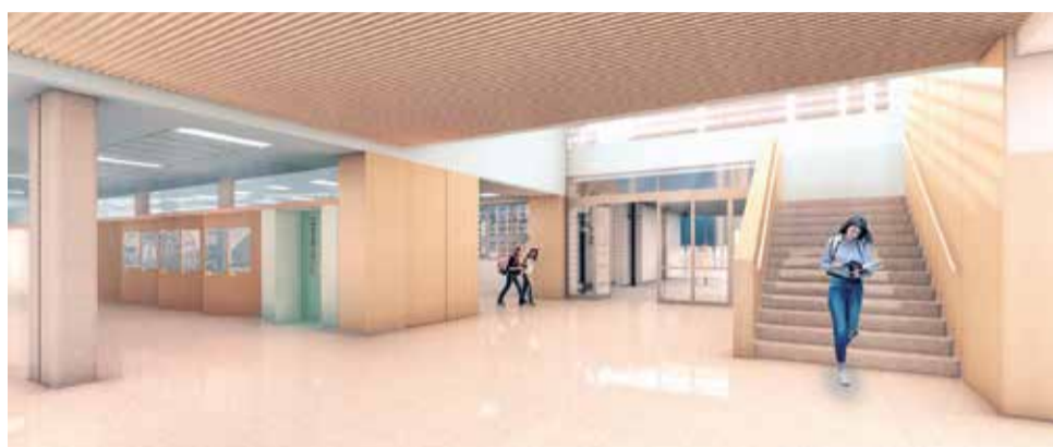
Previsualització de l'interior del nou IES de Canet d'en Berenguer. / EPDA

"L'IES de Canet és un dels projectes més importants per a aquest equip de govern i un dels objectius més remarcable d'aquesta legislatura, ja que permetrà augmentar l'oferta educativa del nostre municipi i proporcionar una forma-