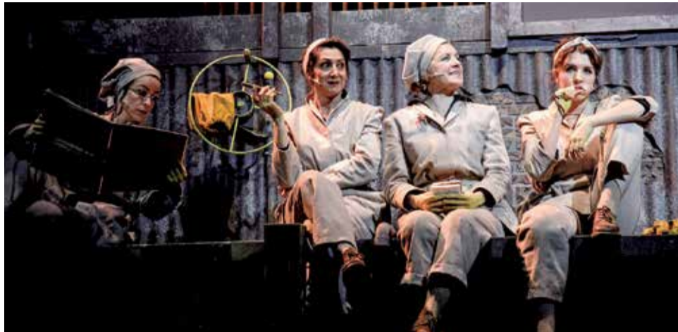
Ladies Football Club, Barco Pirata.

Finalment, la programació del Teatre Romà d'aquesta edició conclourà el 27 d'agost amb el teatre musical 'Ladies Football Club', de Barco Pirata, amb la direcció de Sergio Peris-Mencheta. Onze actrius donaran veu a una de les històries menys conegudes de l'esport, la creació i prohibició dels primers equips de futbol femení a Europa.