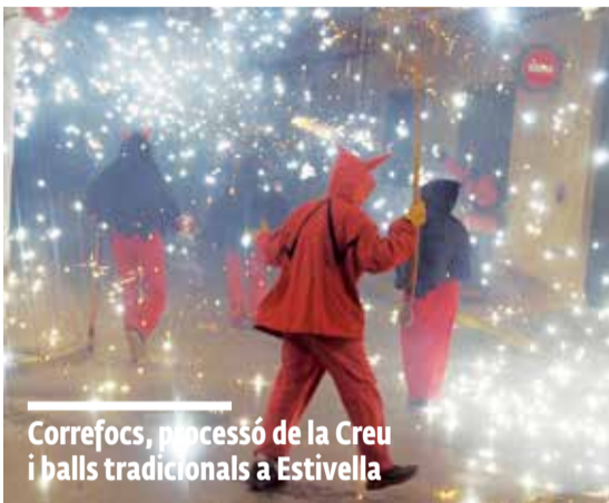
Correfocs, processó de la Creu i balls tradicionals a Estivella

DESPRÉS DE DOS ANYS, EL MUNICIPI REPRÉN LA NORMALITAT