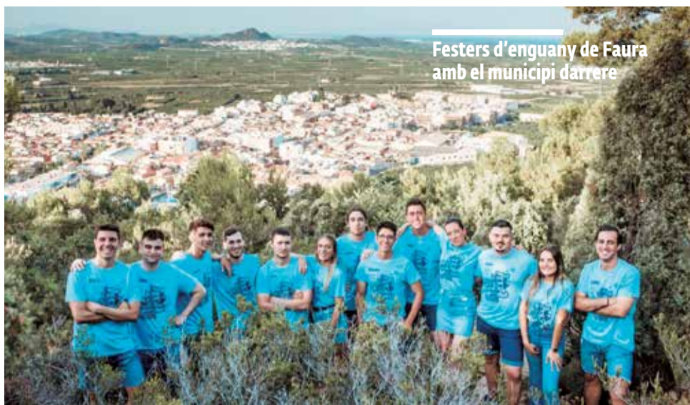
Festers d'enguany de Faura amb el municipi darrere