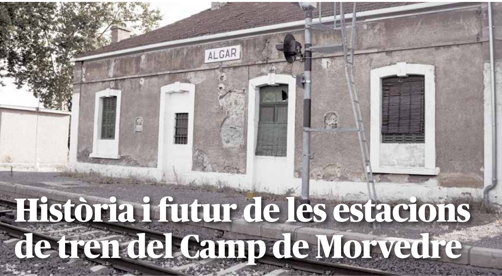
Estació d'Algar de Palància.