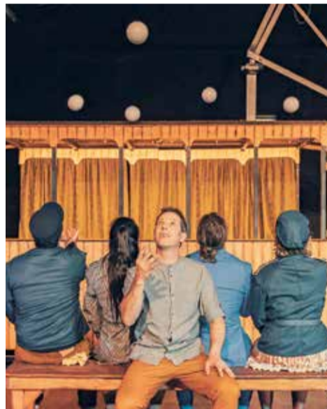
Tramvia nº 12, La Finestra Nou Circ. / EPDA