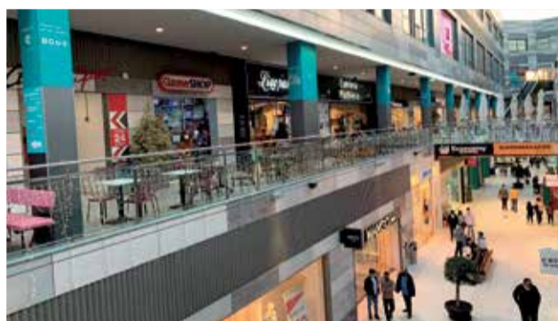
Centro Comercial Lepicentre.

También siguen recogiendo solicitudes para los castings de LEPICENTRE TALENT, que se reactivarán en septiembre, donde jóvenes y mayores demostrarán todo el talento que llevan dentro. Lepicentre Talent se ha convertido en un concurso consolidado y muy esperado por el público donde cada vez el nivel de los participantes es mayor. En las bases del concurso se especifica que el ganador obtendrá a un premio