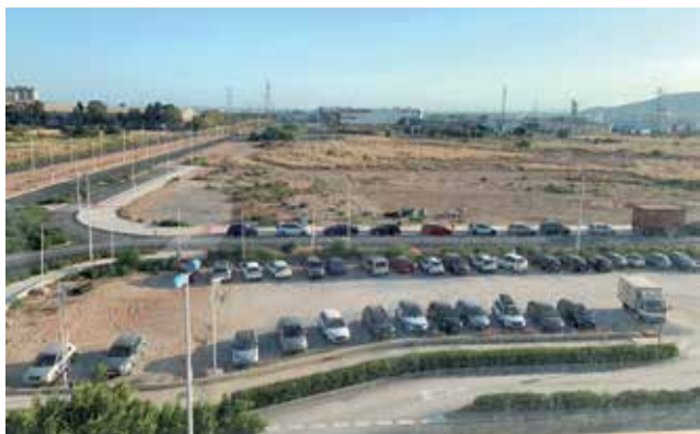
Lugar donde estará ubicado el Palacio.

En total, está previsto que la Conselleria de Justicia invierta 13,7 millones de euros en la construcción del nuevo palacio de Justicia de Sagunt.