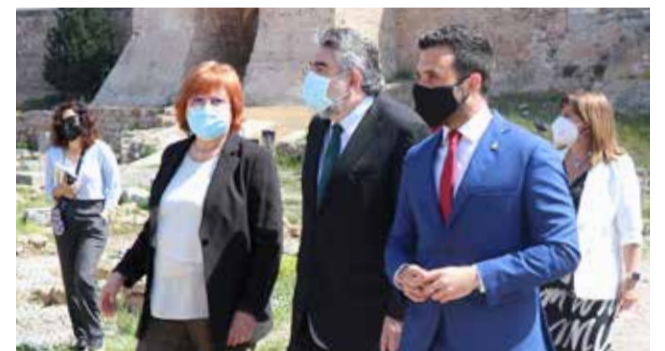
Visita del exministro Uribes en abril de 2022.

El ahora exministro de Cultura, José Manuel Rodríguez Uribes, anunciaba en abril del año pasado en una visita histórica para la ciudad 1,1 millones de euros. Una inversión necesaria para trabajar en los accesos al castillo, en los senderos, en la señalética (de la cual se carece por completo en la actualidad), en la rehabilitación de la puerta de Almenara o en reforzar algunas partes de la muralla. Además, el ministro traladaba la posibilidad de que la Universitat Politècnica de València construyese en Sagunt un centro de estudio permanente de investigación arqueológica. Uribes, además, se comprometía a que las inversiones para el monumento fueran constantes en los próximos años.