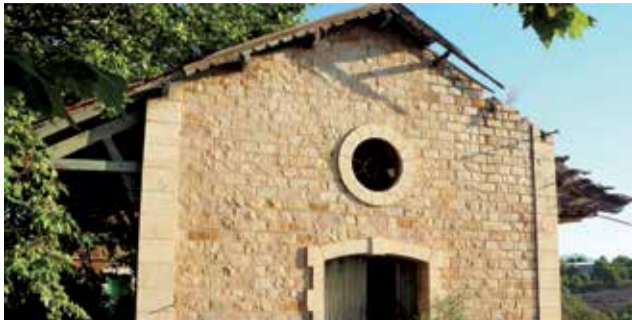
Estació d'Algar de Palància.

Unes altres estacions que s'originaren posteriorment a la comarca són les relacionades amb la siderúrgica per a traslladar el ferro des d'Ojos Negros fins al Port de Sagunt. La companyia va considerar que resultava més rendible econòmicament una nova línia que aprofitar la d'Aragó, com es plantejà en un primer moment. Al llarg del trajecte en el Camp de Morvedre, es van fer estacions a Algímia d'Alfara i Gilet, a més de la del Port de Sagunt. Suposava 25 quilòmetres del total del trajecte. Totes elles tenien una història i representaven un destacat passat econòmic. L'estació d'Algímia d'Alfara és una casa privada. L'estació de Gilet fou engolida per l'autovia. La línia va desaparèixer. Ara s'ha transformat en una ruta verda destacada on encara queda per recuperar estacions i diverses construccions. Però, entre totes elles, cal destacar especialment el cas de la desapareguda estació del Port de Sagunt. Era la que donava raó de ser a la línia del tren. Per eixe motiu, en este destacat projecte de crear íntegrament la Via Verda