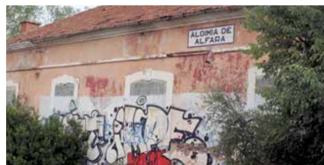
Estació d'Algímia d'Alfara.