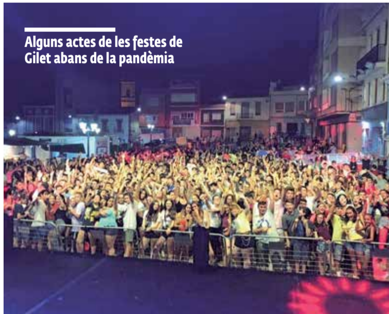
Alguns actes de les festes de Gilet abans de la pandèmia