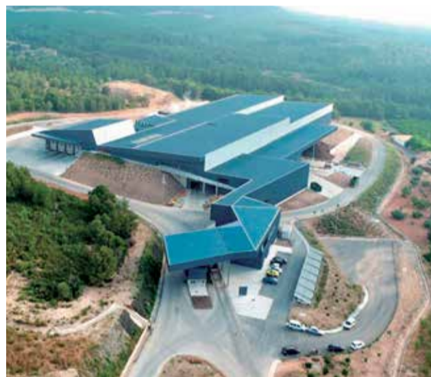
Varias imágenes de la planta de Algímia y de iniciativas recientes del Consorcio Palancia Belcaire.

más de 101.600 toneladas de residuos, de las que algo más de 40.000 acabaron en el vertedero. De esta manera se ha reducido el porcentaje de rechazo al 39 %, a falta de incorporar los datos de Ecoembes y completar las estimaciones del plan zonal. Cabe recordar que el Real Decreto 646/2020 sobre la eliminación de resi-