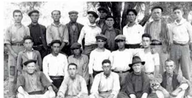
Grup d'obriers auxiliars (1929).