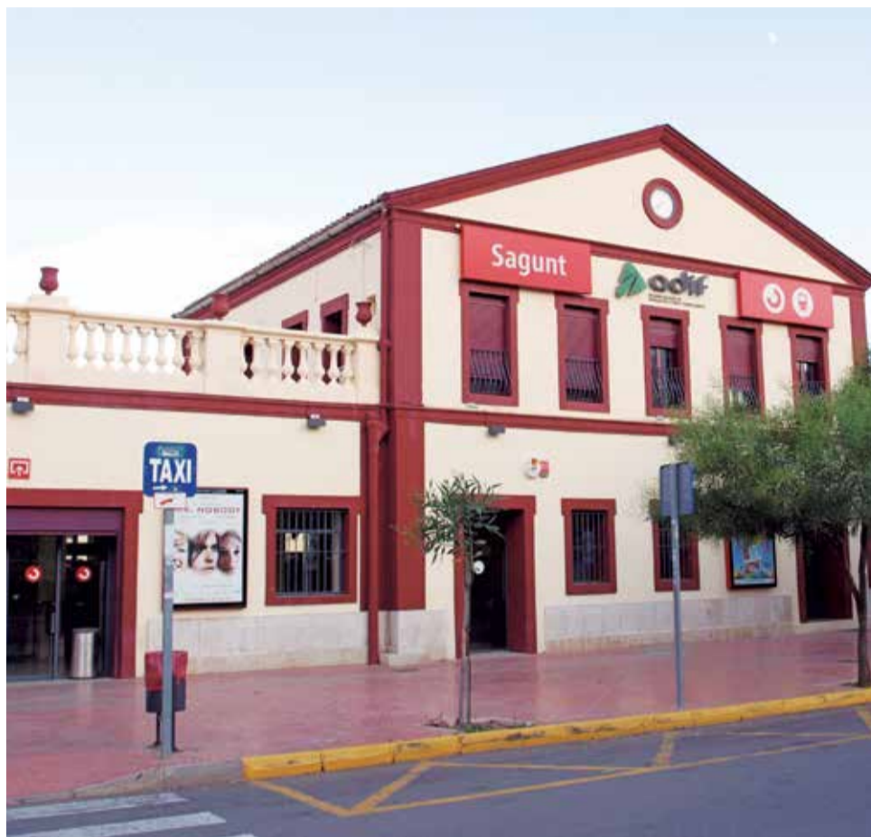
Estación de tren de Sagunt.

El contrato para la ejecución de estas obras en el tramo Monreal-Sagunt ha sido adjudicado a la empresa Enclavamientos y Señaliza-