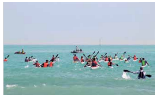
Activitat en la mar de Canet d'en Berenguer.

D'altra banda, però dins de la commemoració del Dia Internacional de la Joventut, el Departament ha organitzat un repte fotogràfic en Instagram, on els i les participants poden pujar una fotografia que represente la joventut. La foto millor valorada rebrà un obsequi d'un sopar per a dos en una de les foodtrucks del GastroCanet.