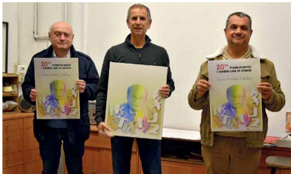
Un moment durant la presentació del Premis Vicent Andrés Estellés.