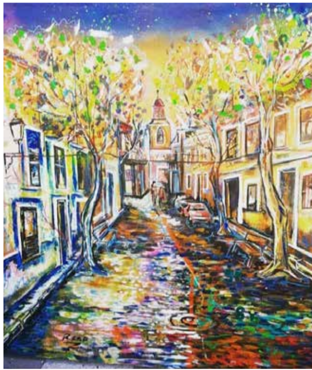
Una de las obras presentadas a concurso.

limpiadas, que aquell any se celebraren a Londres. Això va ser una experiència meravellosa, perquè nosaltres vam fer tot el decorat i pintar tots els camions que eixien”, conta l'alberiqueny.