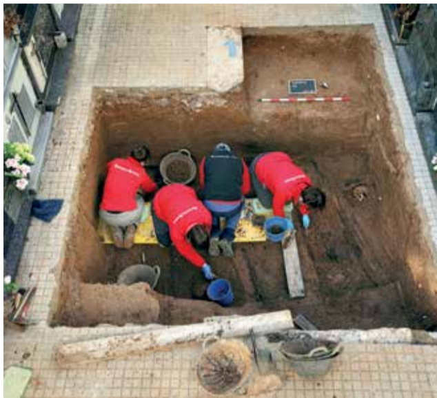
Durante la excavación de la fosa de Paterna.

Cualquiera de los familiares de estas dos personas puede ponerse en contacto con los responsables de los