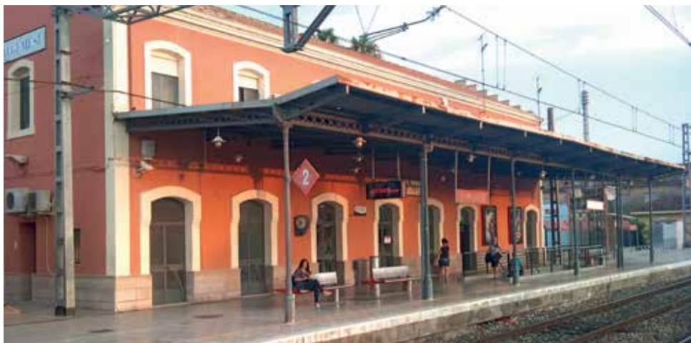
Estación de Algemés.