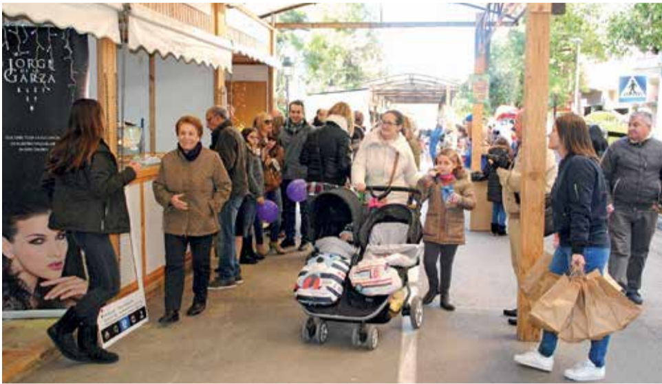
Foto arxiu d'una de les edicions de la 'Fira del Comerç al Carrer'.