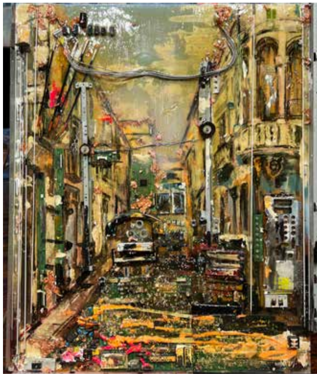
Obra de Rubén Catalá.