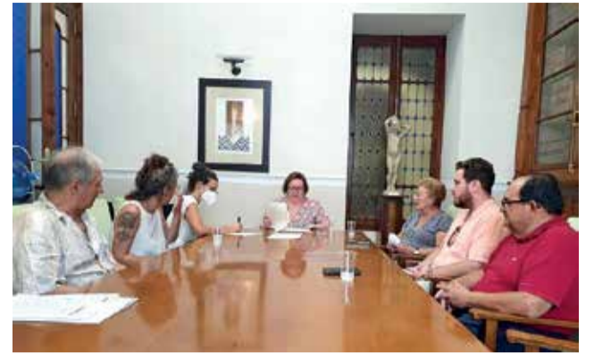
Un moment de la reunió.