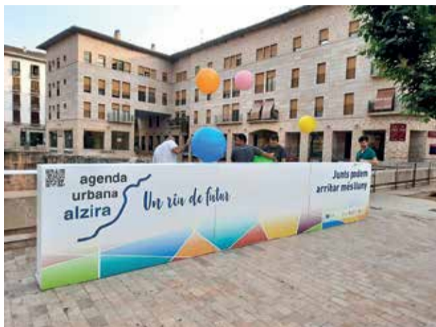
Presentació de l'Agenda Urbana d'Alzira.

Els projectes que es valoren són: Alzira Futur Cli-