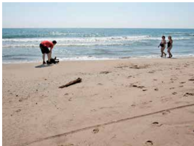
Una playa de Cullera.

Desde el pasado jueves 21 de julio comenzó la puesta en marcha de esta ordenanza. Son los mismos operarios de playas quienes pasarán todos los días a primera hora de la mañana para retirar las pertenencias, sombrillas, sillas o mesas, las cuales están ocupando la arena para reservar el sitio a los bañistas que no lo estén utilizando ni se encuentren en