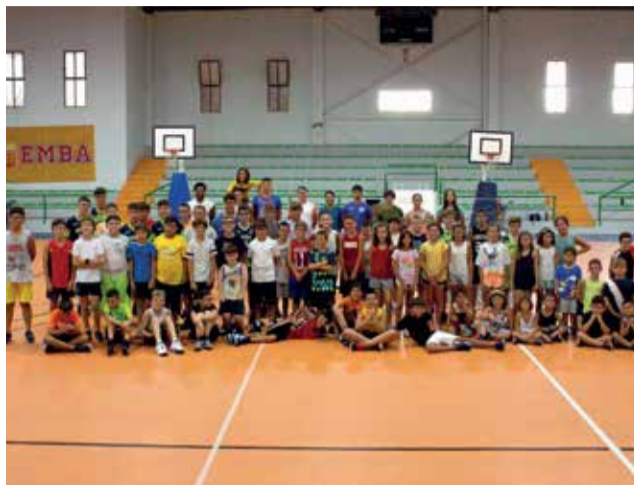
Els xiquets i xiquetes durant les activitats del campus d'estiu a l'Alcúdia.

A més, el 14 de juliol també van tindre dia de disfresses i la nit del 28 de juliol es va projectar a l'Àgora la pel·lícula Zootopia per a tota la gent de l'Escoleta i les