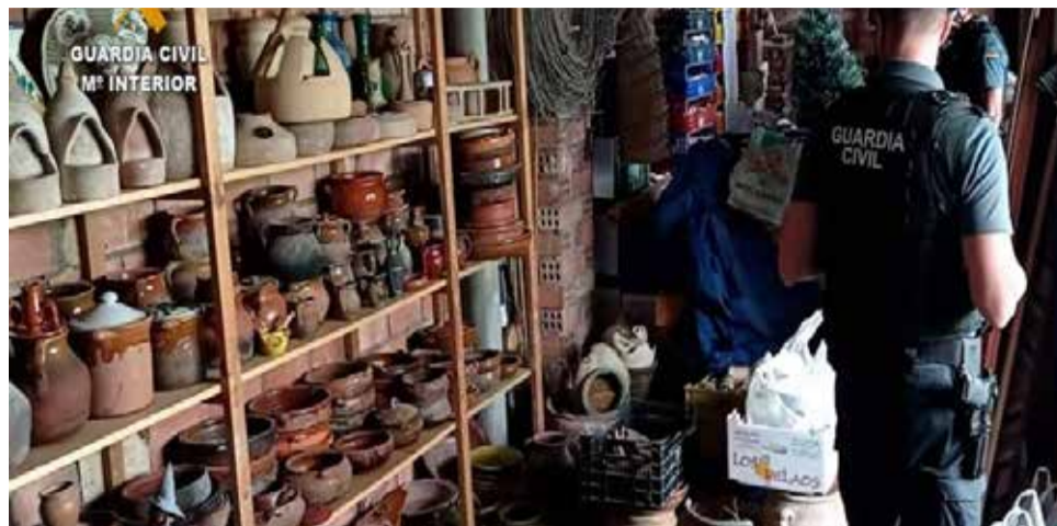
Material recuperado de Guadassuar. / EPDA