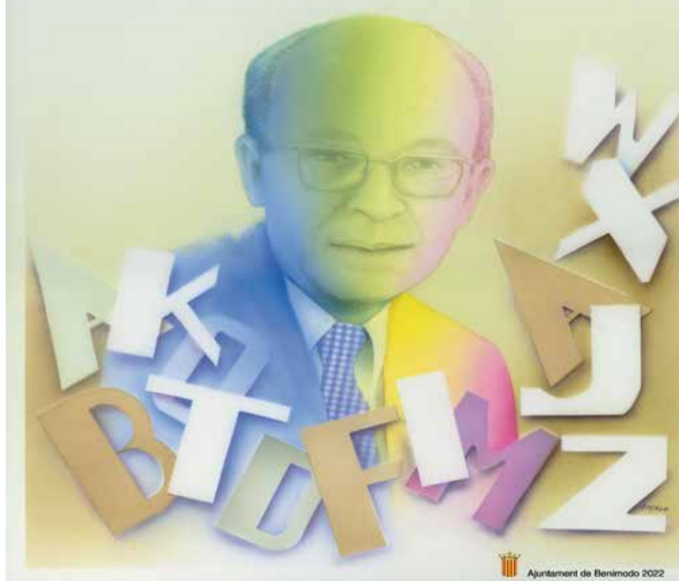
Obra de Rafael Martínez Primo.