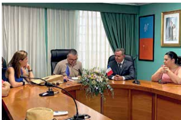
Durant l'acte institucional