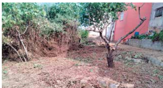
Treballs realitzats per la brigada forestal.

Esta actuació està composta per un total de quatre peons forestals i una capatàs, la brigada EMERGEI ha sigut contractada a través d'una subvenció de 50.000 €, concedida per la conselleria d'Economia Sostenible, Sectors Productius, Comerç i Treball destinada a la con-