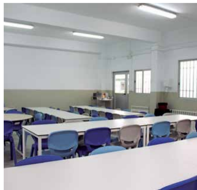
La cocina y el comedor equipado para dar servicio a más de 100 niños cada día.

asegura Consuelo. "Nos dio mucha tranquilidad, porque desde el principio se hicieron cargo de todo, nosotros simplemente pusimos el espacio y en Ricochef se encargaron de buscar proveedores, cocinero, moni-