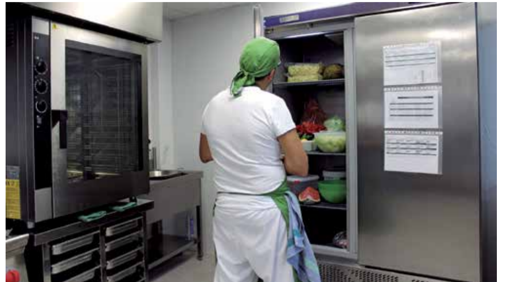
Izquierda, los fuegos de la cocina. Derecha, una de las neveras con productos de kilómetro cero

EL CENTRO EDUCATIVO OBISPO PONT HA RENOVADO Y MEJORADO SUS INSTALACIONES CON LA CONSTRUCCIÓN DE UNA COCINA Y COMEDOR