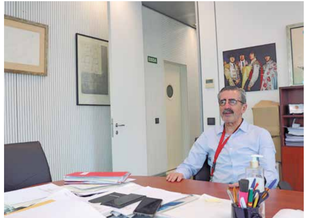
Un instante de la entrevista. / ISABEL SÁNCHEZ

► Háblenos de la nueva Unidad Técnica de Análisis de Incendios que quieren crear. ¿Cuál es el objeto de su creación? ¿De qué organismo dependerá?