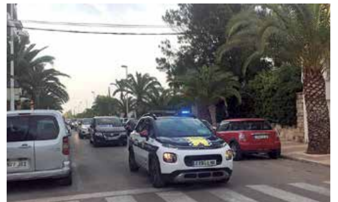
Circulación en la playa de Moncofa.

Así, los tres tramos de potencia de los tractores tendrán importantes reducciones, de hasta 33 euros en el caso de los que tengan motores por encima de los 25 caballos de vapor fiscales (CVF).