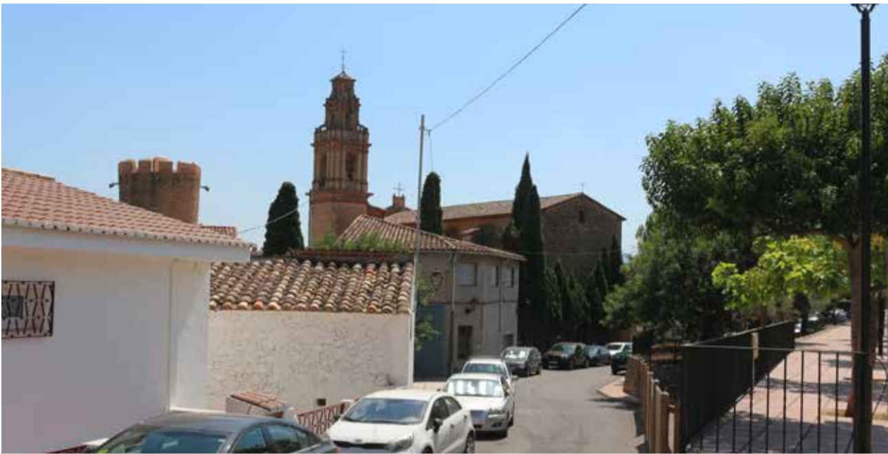
Argelita recibirá 6.940 euros entre la Generalidad Valenciana y la Diputación.

■ LAS CANTIDADES TOTALES LAS APORTAN AL 50% ENTRE LA GENERALITAT VALENCIANA Y LA DIPUTACIÓN PROVINCIAL DE CASTELLÓN