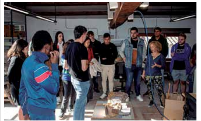
Visita dels restauradors a la Fàbrica de Giner.