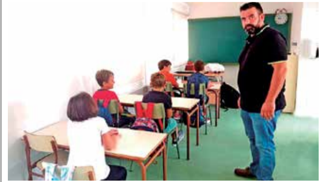
El alcalde visita el centro escolar.