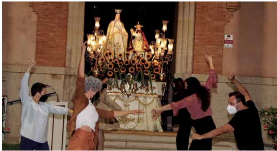
Fiestas patronales de Les Alqueries, en una imagen de archivo / EPDA

Entre las novedades está el espectáculo Operación Homenaje, un tributo al mítico concurso Operación Triunfo, The Talent o tardeo remember. También llega la segunda edición del festival Mou la Llengua con los grupos