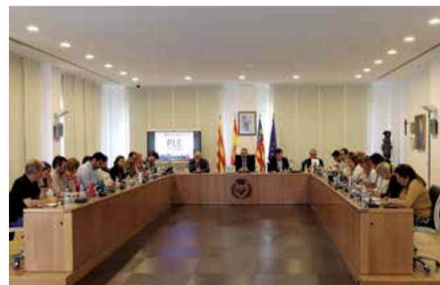
Pleno municipal del mes de septiembre.

Por otro lado, se ha aprobado la concesión de la medalla a la constancia a los agentes de la Policía Local que