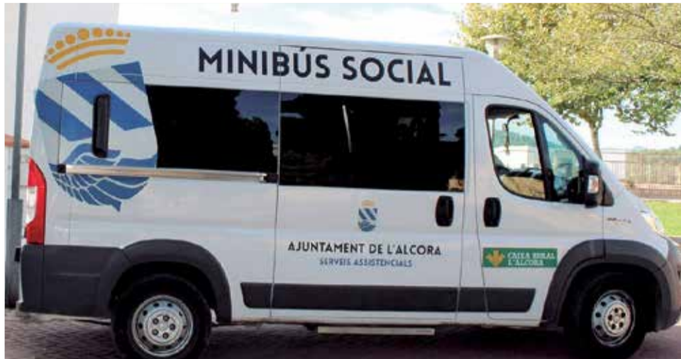
Servei municipal de Minibus Social de l'Alcora.

Com explica el regidor de Mobilitat Urbana, Ricardo Porcar, en aquest servei de transport social tenen preferència les persones amb reducció de mobilitat de qual-sevol edat, tant permanent per malaltia com a temporal per accident, també les dones embarassades i, per