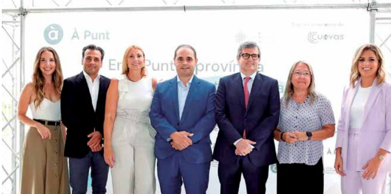
Presentació de la campanya d'antennització a Castelló en la sede provincial.

Els objectius d'esta campanya no són uns altres que arribar a tots els llocs de la província amb una major qualitat i "donar veu i visibilitat a les persones i col·lectius que representen el territori", va destacar el director general d'À Punt, Alfred Costa, en la presentació d'esta campanya, ja que, com va marcar Costa, en À Punt "es preocupen i ocupen per la província". Així mateix, la president del consell