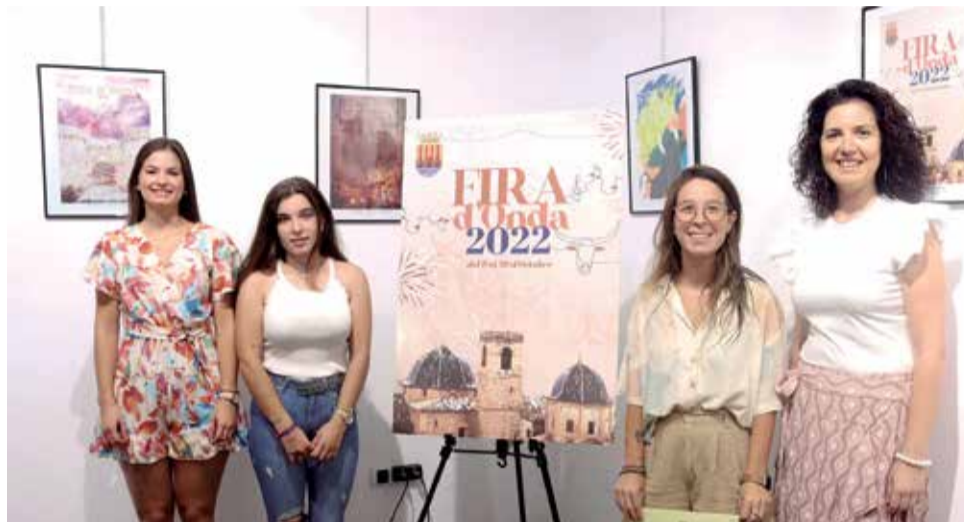
Cartel anunciador de la Fira d'Onda 2022 diseñado por Eva Vida.

El gran protagonista de las fiestas tiene por nombre Almirante y es de la ganadería Victoriano del Río, de número 123 y Guarismo 7. Le acompañará en la tarde del sábado