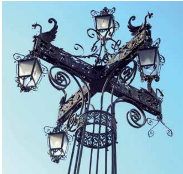
La farola de Castelló.

Por ello, Som Castelló (Som CS) exige al consistorio la reposición inmediata de esta luminaria para completar una de las señas de identidad castellonenses. La formación municipalista considera que “un año y medio” es tiempo suficiente para el equipo municipal de gobierno haya actuado sobre uno de los enclaves más característicos de la ciudad, así como poder realizar un estudio detallado de la situación actual del obelisco