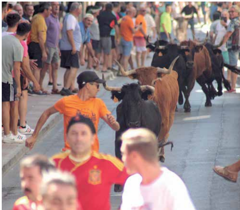
Encierro de vacas y toros en las fiestas patronales de La Vilavella.