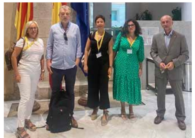
Representantes de la Asociación en Les Corts.

tado las necesarias medidas de protección ante los efectos del puerto de Burriana, que ha sido el factor principal de la regresión de este litoral, que en algunos puntos el mar ha avanzado tierra adentro más de 150 metros respecto a la línea de costa anterior a la construcción del puerto.