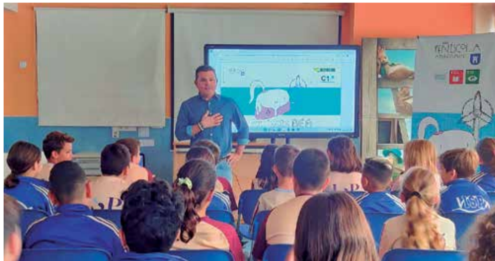
Programa "Educación para la Sostenibilidad" en las aulas del colegio.

Cada unidad didáctica, se completa con diversos, ejercicios, experimentos, actividades de dibujo, pintura, escultura, redacción, artes escénicas o cine fórum y el curso cuenta, además, con salidas externas, visitas y excursiones