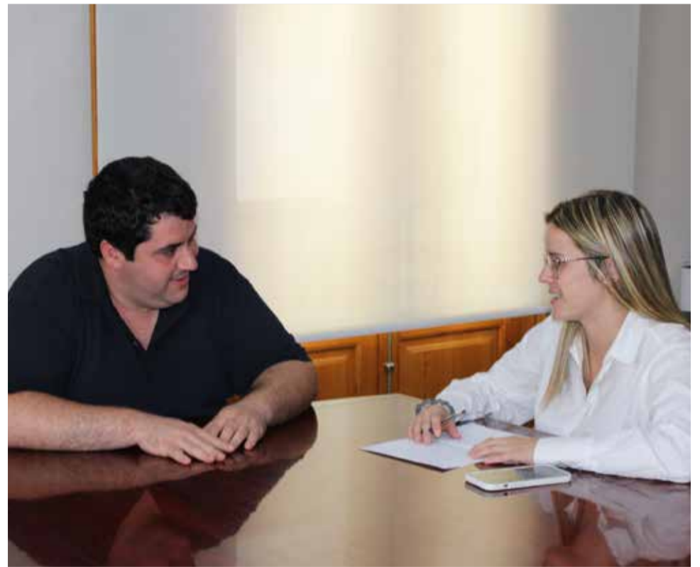
Uno de los instantes de la entrevista.

► Y las fiestas también promueven la economía local. Este mes de octubre,