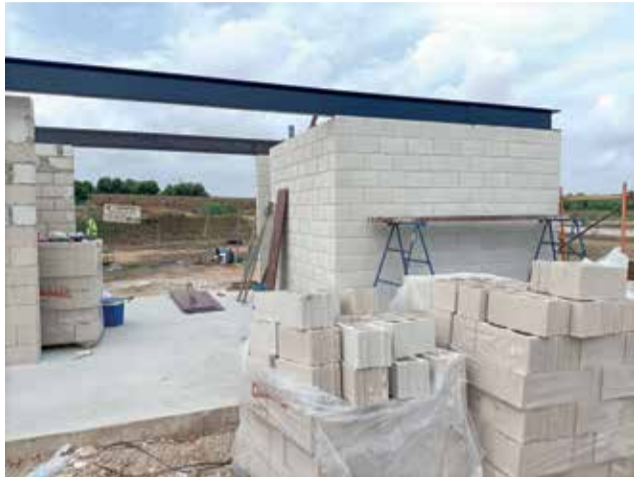
Obres del nou magatzem al Parc Rural.

La intervenció urbanística, empresa a la fi del passat mes de juliol, permetrà que en unes poques setmanes, el Parc Rural dispose d'un nou edifici de planta baixa amb una configuració rectangu-