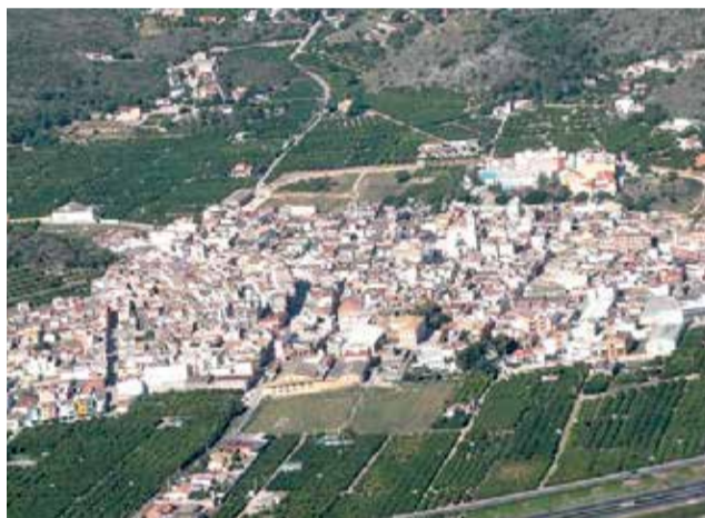
Vista de Corbera.

Així, estan previstes la realització de taules de treballs, grups de discussió, trobades ciutadanes i entrevistes, a les quals es convidarà a participar representants del teixit associatiu, empreses i comerços, entitats socials, personal municipal i càrrecs electes; tot això amb l'objectiu de "cons-