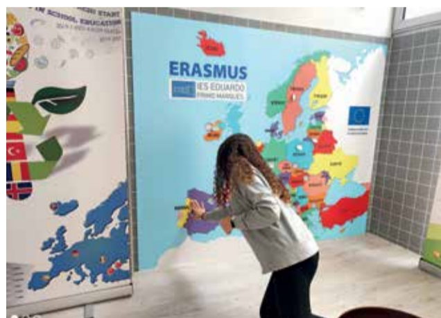
Dia Europeu de les Llengües a l'IES Eduardo Primo.

Els 46 estats membres del Consell d'Europa animen més de 700 milions de ciutadans europeus a aprendre més llengües a qualsevol edat, dins i fora de l'escola. Convençuts que la