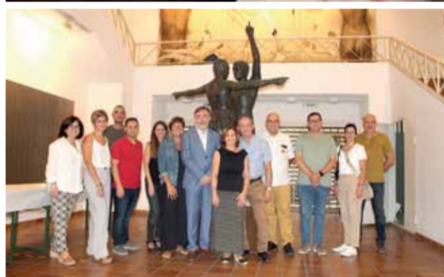
Diferents moments del XIV congrés a l'Alcúdia.