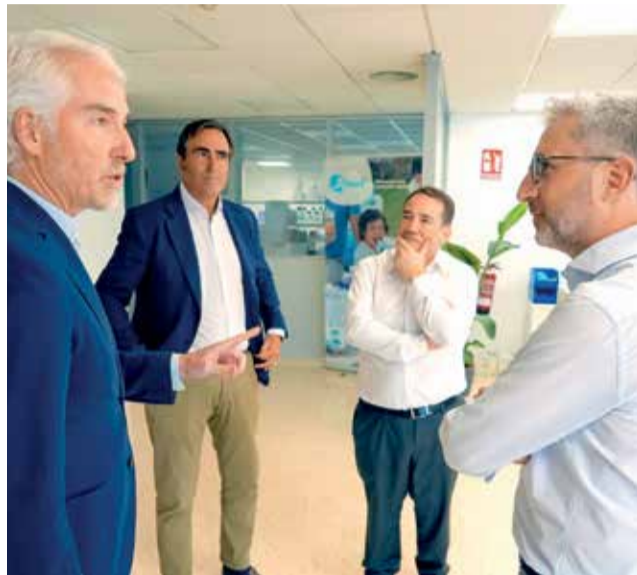
Arcadi España visitant l'empresa de Carlet.

“Estem impulsant una Generalitat emprenedora, que aposta per la reindustrialització de la comarca de la Ribera Alta i la protecció de l'ocupació en un moment complicat com l'actual, amb un increment important dels costos energètics, les matèries primeres i la logística, que requereix un suport ferm del Consell”, ha assenyalat el conseller.