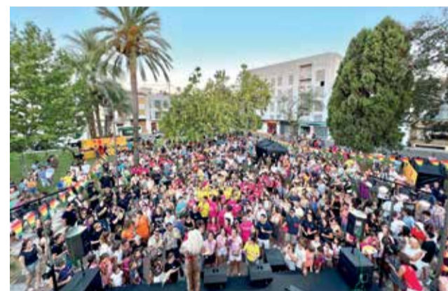
Guadassuar en festes.

Les festivitats del Santíssim Crist de la Penya i de la patrona, la Mare de Déu de la Misericòrdia, van obrir el calendari festiu el 6 i 7 d'agost respectivament, on van reunir més de 700 persones per a gaudir de dos nits seguides de sopars a la fresca amb espectacles en directe, com van ser 'Operación Homenaje el Musical' i l'actuació de l'orquestra Modena. El dissabte 13 d'agost, per la vesprada es va viure la tradicional cavalcada i ofre-