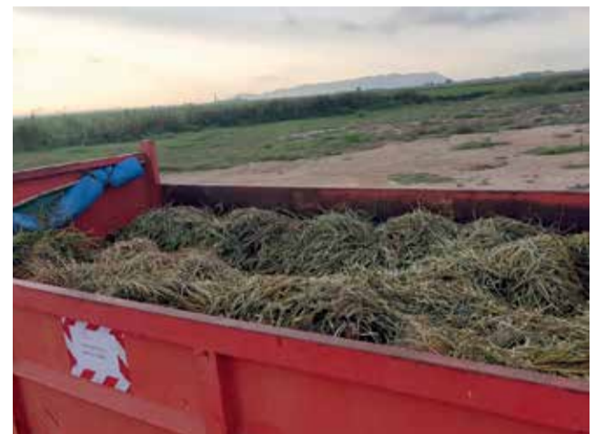
Sega de l'arròs.

Els treballs de posada a punt del terme han consistit, entre altres, en l'asfaltat de diferents trams de cam-