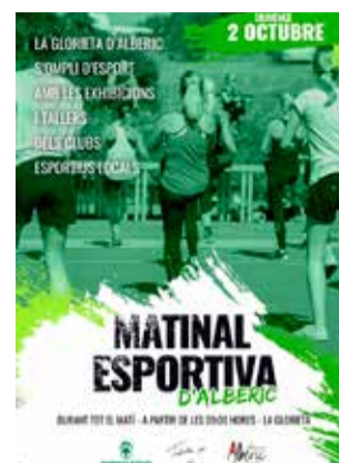
Cartells Matinal Esportiva a Alberic.