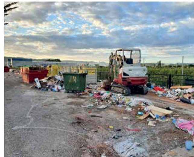
Imatge d'un dels abocadors.

L'incivisme d'algunes persones ha obligat a l'Ajuntament de Carcaixent a implantar càmeres de vigilància en els punts de concentració dels contenidors, amb l'objectiu de controlar les males pràctiques, identificar les persones causants i sancionar les infraccions per abocaments incontrolats. Des de fa mesos l'Ajuntament de Carcaixent s'ha vist obligat a augmentar les tasques de neteja en els punts de concentració de contenidors, a la vista dels residus abocats per terra, que invadeixen els vials i les voreres. Són nombrosos els serveis extraordinaris que s'estan realitzant, implicant-se mitjans diversos municipals i serveis externs (Brigada d'Obres i Serveis, Empresa municipal Procarsa, empresa concessionària del servei de recollida de residus, empreses de retirada de residus contractades). Estes tasques representen unes despeses extraordinàries que paguen la totalitat de la ciutadania per culpa de les males pràc-