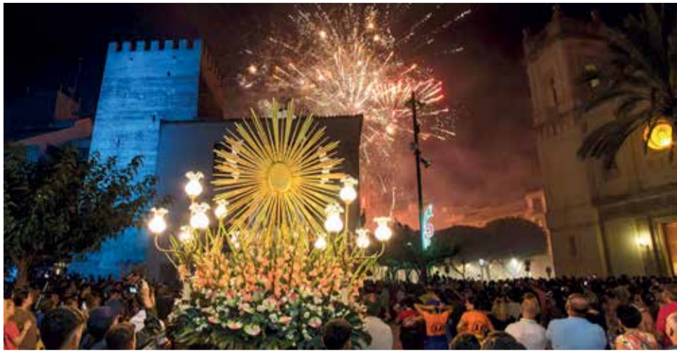
Procesión del Fuego de Benifaió.