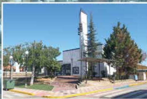
Una gran història