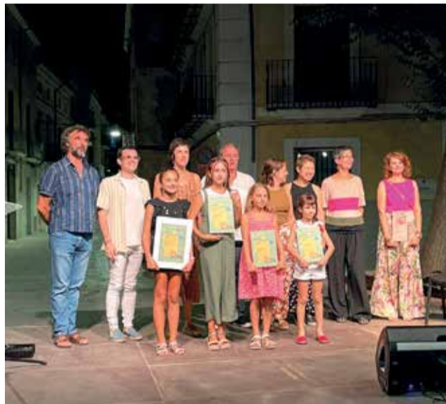
Galardonats i galardonades.

I els premis de poesia infantil Ausiàs Marc, on de nou aquest 2022 han participat tots els col·legis d'educació primària de Castelló, amb una elevada participació i una molt