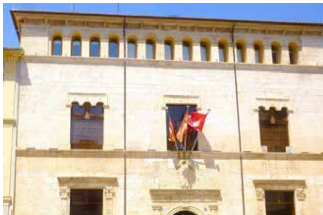
Ajuntament d'Alzira. / EPDA

Anell verd i riu de futur. La ciutat d'Alzira vertebrada la infraestructura verda existent al seu al voltant a través del projecte Anell Verd i potenciant la connexió amb poblacions properes com Carcaixent, Alberic, Guadassuar, Algemesí o Benimuslem a través d'una mobilitat sostenible, respectuosa amb el me-