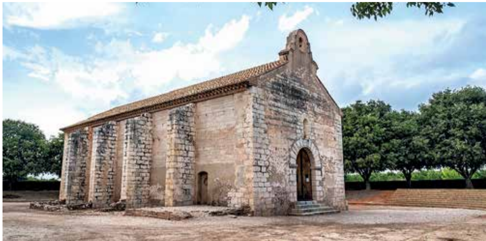
Ermita de Sant Roc de Carcaixent.