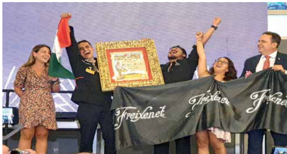
Guanyadors de la nova edició del Concurs Internacional de Paella Valenciana de Sueca.

► El balanç és molt positiu, molts restaurants s'han quedat fora perquè no han cabut dins del total de participants, un balanç on les empreses han augmentat de manera exponencial en número i en recursos econòmics donant suport al nostre concurs. I un balanç de presentació de treball i de mitjans disponibles en el qual pense que el llistó de la 61 edició del Concurs Internacional de Paella Valenciana de Sueca ha quedat alt, ha tingut una repercussió mediàtica molt important, hem eixit en tots els mitjans parlant d'aquest plat tan tradicional i nosaltres com a ajuntament ho finalitzem amb satisfacció i alegria. Volem agrair sobretot a tots els participants i a tots els que s'han quedat fora perquè se superava el contingent del total i no hi ha hagut cabuda a totes les empreses que han estat donant-nos suport i sobretot a