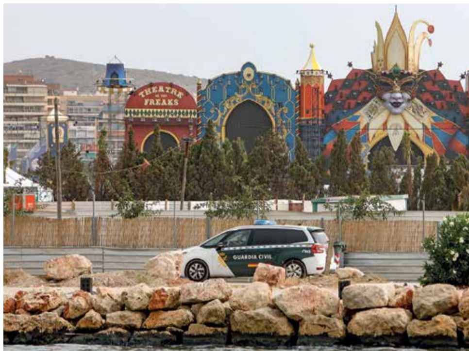
Exterior del recinto del escenario principal del Festival Medusa de Cullera.