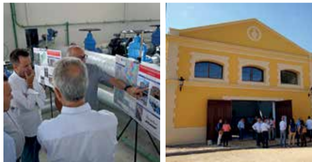
Una de les reunions amb la conselleria.

Les obres de modernització del regadiu dels sectors 3 i 5 d'Alberic adjudicades per la Conselleria d'Agricultura, Desenvolupament Rural, Emergència Rural, Emergència Climàtica i Transició Ecològica de la Generalitat Valenciana en novembre de 2020, les quals tenien un termini d'execució de dos anys, arriben a la seua fi. Amb una inversió superior