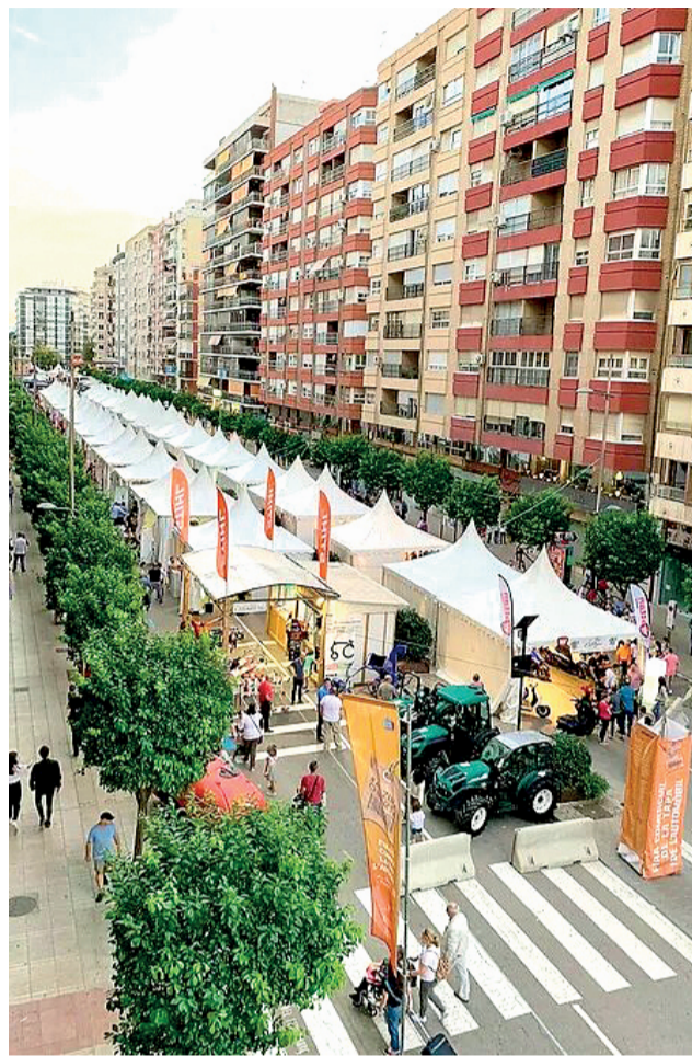
Fira del Comerç d'Alzira.

A les edicions anteriors, el públic assistent ha aco-