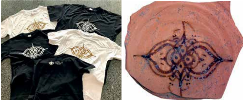
El símbol en un plat trobat en una de les intervencions arqueològiques.