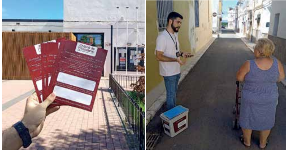
Fulletts informatius repartits per tot el municipi de Senyera.