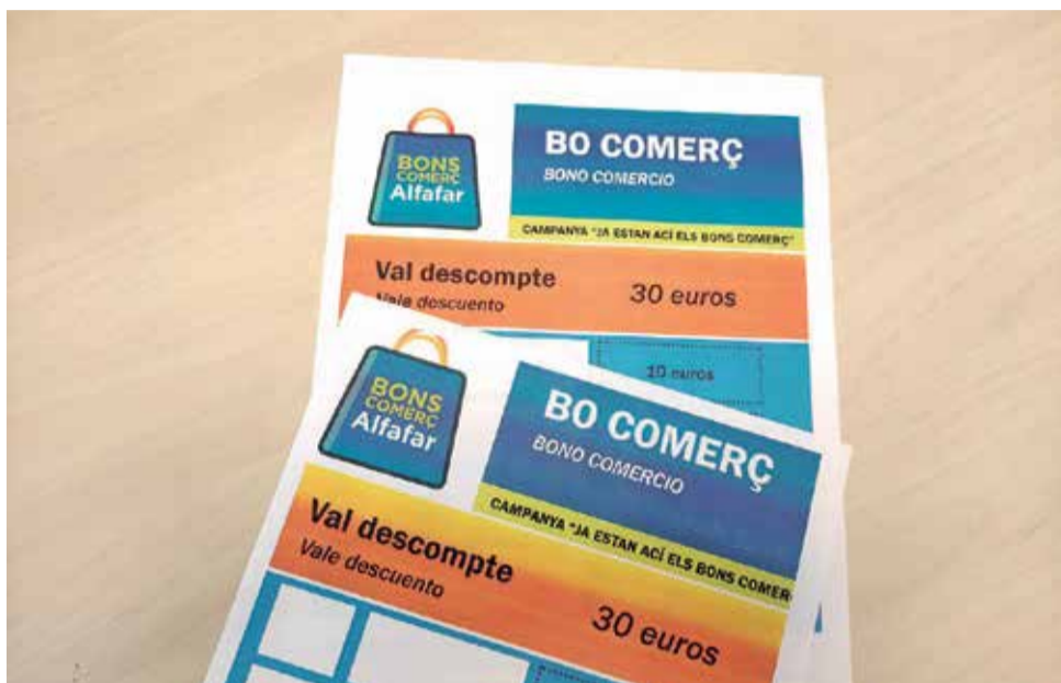
Bo descompte a Alfatar.

ESTA EDICIÓ PORTA EL NOM DE "JA ÉS NADAL AL COMERÇ LOCAL D'ALFAFAR"