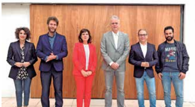
Inauguración en Quart de Poblet.