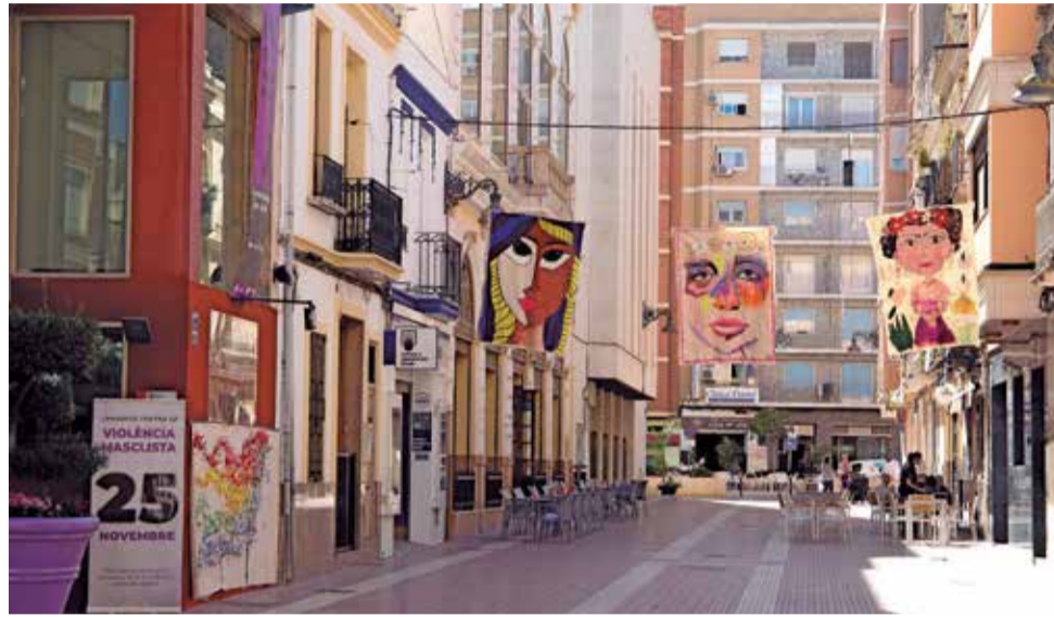
25N en Mislata.

La programación cuenta con la colaboración de las asociaciones de mujeres de Mislata que, junto con la concejalía de Políticas de Igualdad, han organizado las diversas actividades que