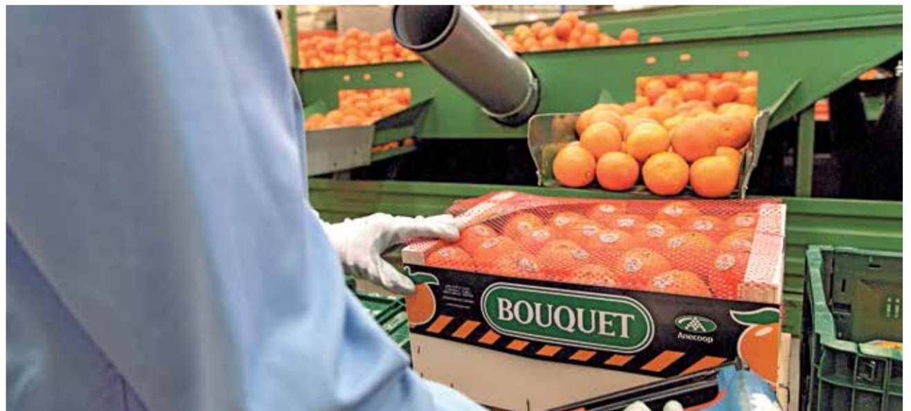
Cítricos BOUQUET de Anecoop.

modelo empresarial que tiene muchos puntos a favor para ser escogido como fórmula de crecimiento y, algo muy importante, sostenibilidad: su permanencia en el territorio garantiza la localización de la actividad, contribuye a la pervivencia del entorno rural y de la vida en los pueblos gracias a la creación de empleo y el apoyo a los pequeños productores y sus familias, además de beneficiar el mantenimiento de los ecosistemas.