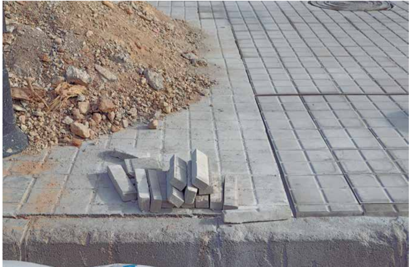
Una acera en Aldaia.

L'alcalde d'Aldaia explica que l'objectiu és implicar al veïnat: "amb les noves tecnologies tenim moltes possibilitats per a arribar més i millor a les necessitats que van sorgint en el nostre municipi. Esta eina s'ha ideat precisament per a fer partícip a totes i tots en el nostre benestar".