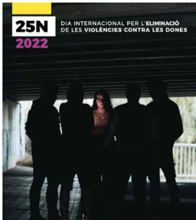
Nova campanya a Picassent.

Des de l'àrea, s'aposta per visibilitzar i denunciar situacions que en moltes ocasions es normalitzen i s'invisibilitzen, però que constitueixen diferents manifestacions de la violència contra les dones: des de comentaris lascius, xiulits, assetjament i persecució, fins a formes més crues que poden arribar a la violència sexual o el feminicidi. La campanya persegueix diferents objectius: fer reflexionar als homes que realitzen aquest tipus de