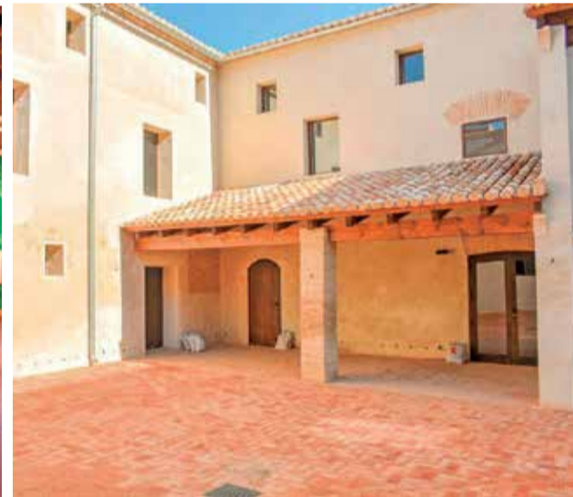
Diferents punts de l'Alqueria del Pi a Alfatar.

va ser construïda entre els segles XVII i XVIII y és exemple de la tradicional tipologia arquitectònica agrícola de l'època, casa-pati-cambra. Formada per un edifici principal més antic i tres annexos de diferents