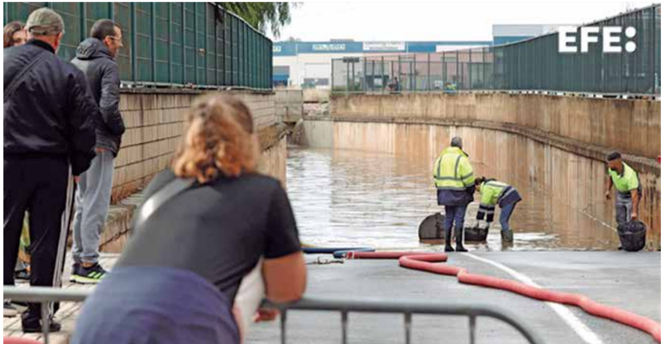
Varias personas observan a los operarios tratando de achicar agua en un paso de Xirivella.

El president de la Generalitat, Ximo Puig, durante su intervención en la cumbre municipal denominada 'Alianza valenciana contra la inflación', aseguró que "son medidas de carácter coyuntural, de apoyo y respaldo, pero todos somos conscientes de la situación estructural que vivimos y de que la lucha con-