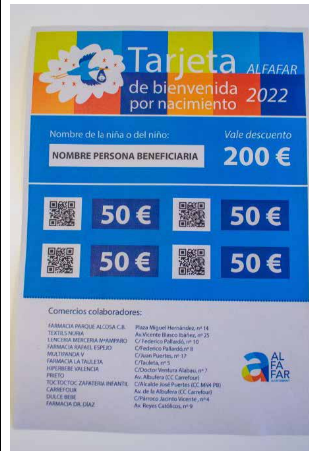
Bono bebé.

Amb la celebració del 70 aniversari del Mercat Municipal, l'Ajuntament d'Alfatar pretén continuar impulsant el comerç local, així com commemorar espais històrics i de rellevància per al municipi.