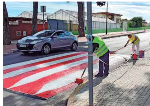
Actuaciones en Torrent.