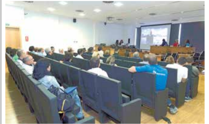
Reunió a Picassent.