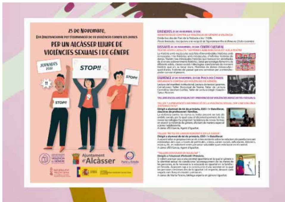
Imagen de la nueva guía.

D'aquesta manera, a més de les accions esmentades, Alcàsser prepara unes jornades per al 25N amb activitats que implicaran a tota la població.