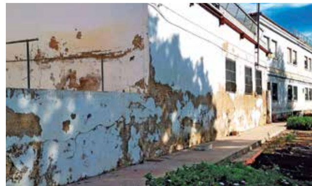
Escuela de Capataces Agrícoles. / EPDA