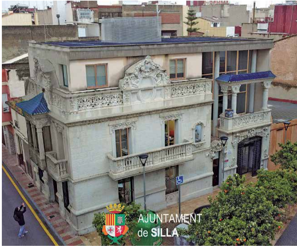
Fachada del Ayuntamiento de Silla.

► Estamos trabajando junto a la Conselleria de Política Territorial, Obras Públicas y Movilidad un proyecto de un itinerario ciclopeatonal para conectar Picassent, Alcàsser y Silla entre sí y con sus áreas industriales, así como con València con el objetivo, de que la movilidad