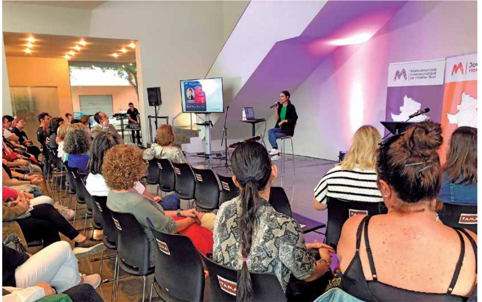
Jornades del 25N a Aldaia.

El divendres 25 de novembre, Dia Internacional per a l'Eliminació de la Violència contra les Dones, comptarà