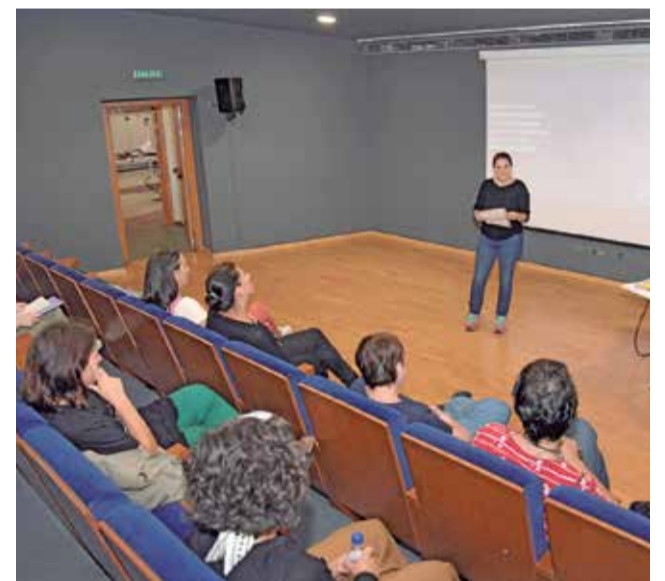
Presentación de la campaña.

La programació, que es presenta enguany baix el lema 'Prostitució és violència', està disponible al web paiporta.es/25n, i està completada per més xarrades, una exposició fotogràfica, la marxa contra la violència masculista i la trobada amb l'escriptora i activista Amelia Tiganus, programada per al 15 de desembre a L'Auditori municipal.