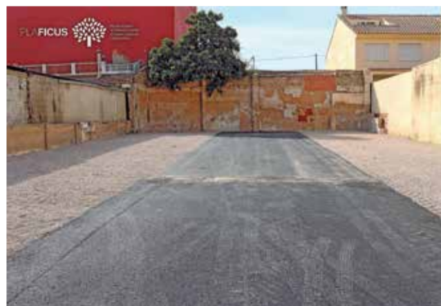
Actuaciones en Torrent.

De esta manera el Ejecutivo trata de poner solución a los problemas de aparcamiento.