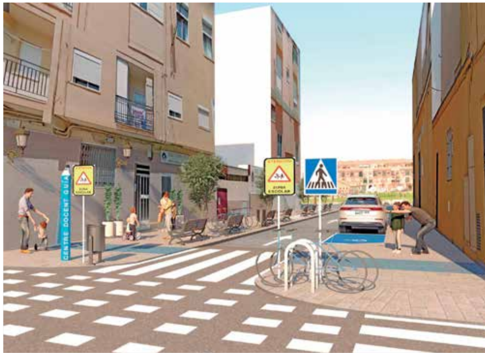
Recreació d'un carrer a Alfafar.

El pla de Camins Escolars inclou actuacions en nou centres escolars del municipi, com són: Col·legi Vamar, Col·legi Maria Immaculada, IES 25 d'Abril, CEIP Orba, Escola d'Infantil Rabisancho, CEIP la Fila, Centre Docent Guia (primària i secundària) i Remedios Montaner.