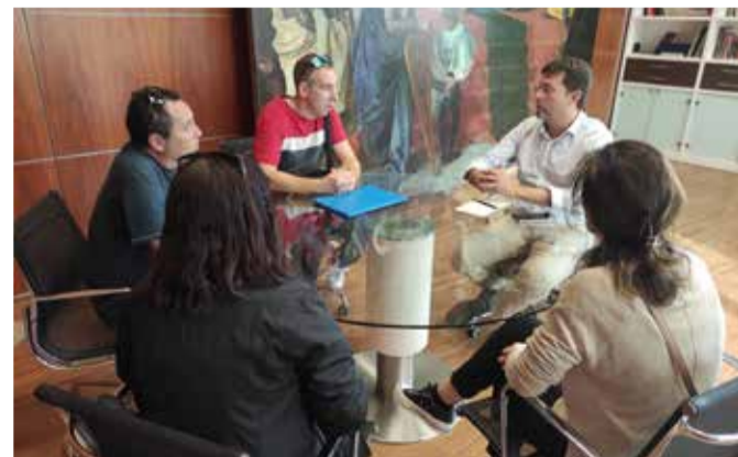
Reunió a Alfatar.

A la reunió, el primer edil d'Alfatar també els ha explicat el pla de treball per continuar amb l'exigència per al soterrament de les vies al seu pas per Alfatar, elevat la queixa de la localitat al Govern estatal i reclamant la inclusió del soterrament a l'alçada d'Alfatar al projecte de la ciutat de València.