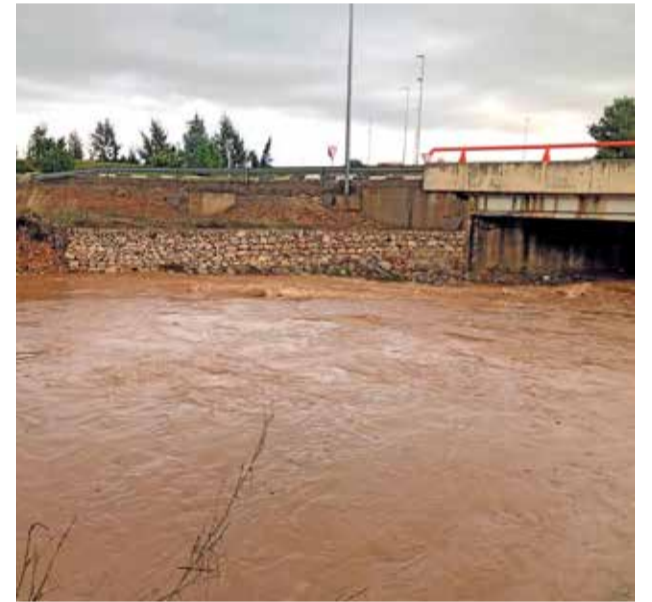
Las lluvias inundan diferentes puntos en Aldaia.

desviar el cauce del Barranquet y evitar de forma considerable así la acumulación de aguas al casco urbano de Aldaia que provocan históricamente episodios como el vivido este fin de semana en