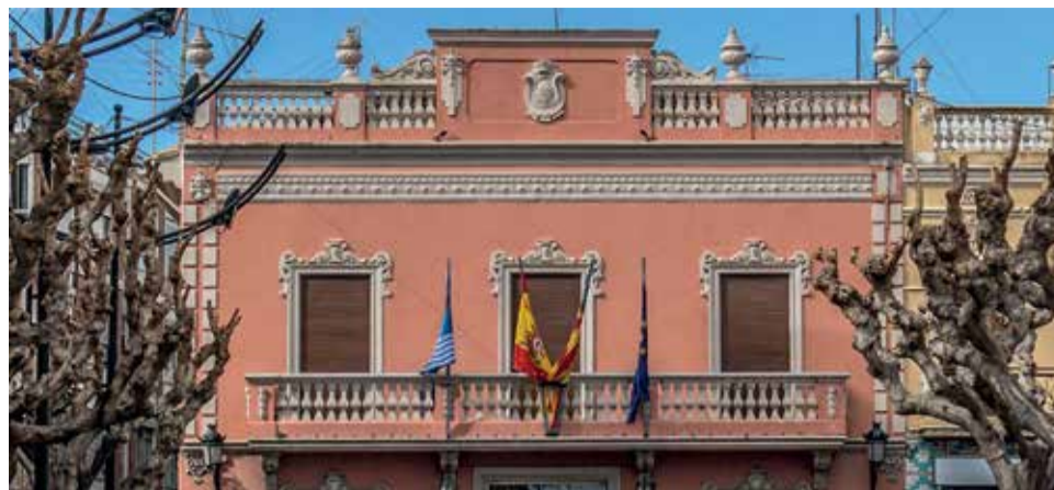
Ajuntament de Albalat de la Ribera.