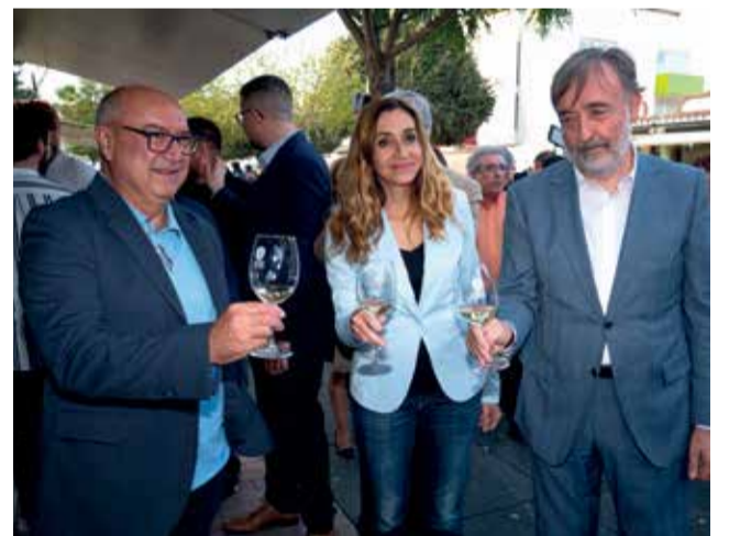
Diversos moments durant la Fira de l'Alcúdia.