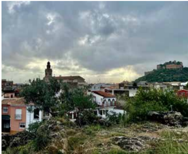
Panoràmica de Corbera.

Estos projectes es faran gràcies a dues subvencions gestionades des de les regidories d'Urbanisme i Benes-