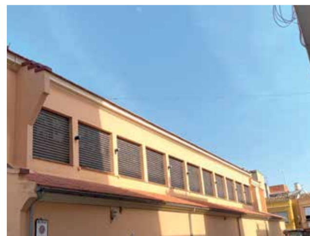
Mercat Municipal de Benifaió.

las actuaciones de mejora de este emblemático edificio. Ya se encuentra en proceso de licitación la adjudicación de las obras de retirada, sanea-