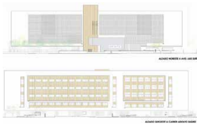
Imatges virtuals i el pla del que serà la nova seu judicial d'Alzira.

usuaris. Comptarà amb 41 sales per a diversos usos i 49 despatxos; totes les dependències comptaran amb llum natural -no ocorre en l'actual edifici-, i l'edifici estarà dotat amb els més moderns sistemes de seguretat i confort tèrmic, a més que serà completament sostenible.