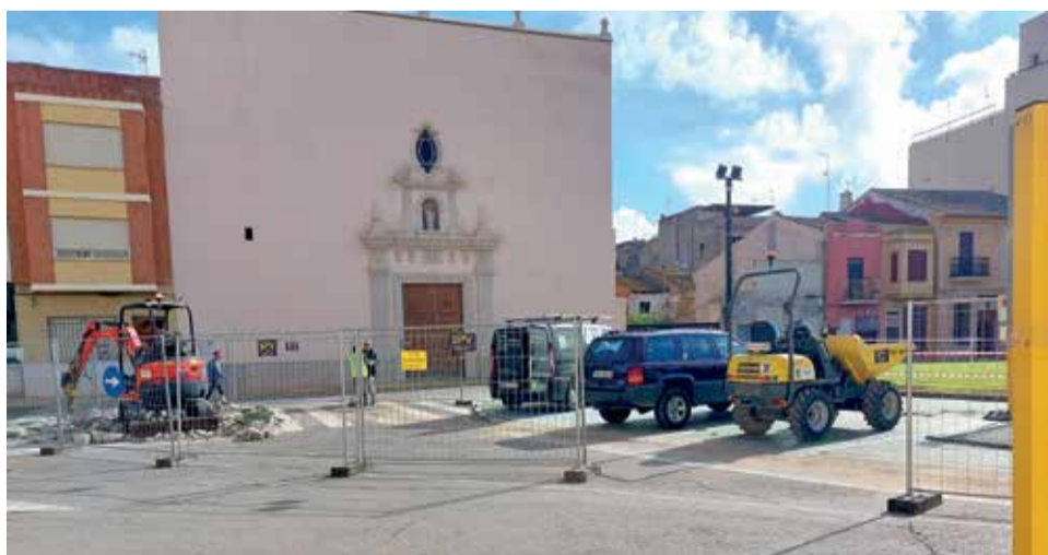
Plaça Major d'Almussafes.

pas de vehicles en les zones centrals, així com irregularitats i desnivells en la seua unió amb les rigoles, unit a la necessitat de millorar parcialment la seguretat i accessibilitat de la Plaça Major han portat a l'Ajuntament d'Almussafes a emprendre una intervenció de reforma d'aquest espai urbà de 934,46 metres quadrats de superfície, emplaçat en ple centre del centre històric i delimitat pels carrers Major, Metge Bosch, Castell i Sant Cristòfol. "Lògicament aquest projecte se circumscriu al PERI Pla Especial Torre Racef i en tractar-se d'una àrea de vigilància arqueològica, l'actuació en procés d'execució respecta exhaustivament tots els preceptes de la Llei del Patrimoni Cultural Valencià, amb els límits que estableix quant a les excavacions necessàries per a escometre la