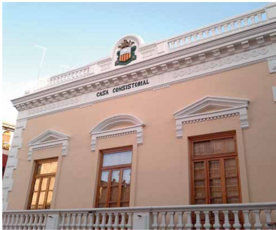
Ayuntamiento de Algemesí. / EPDA

► Respecto a las inversiones, la reforma del parque de Salvador Castell que está casi a punto y la piscina de verano. El resto de proyectos que he comentado antes no terminarán nunca porque siempre encontraremos adversidades. Pero hay que seguir peleando por lo que queremos conseguir y estar preparados para