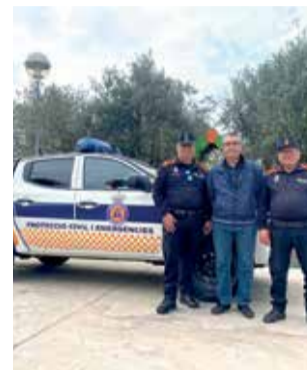
Nou vehicle.

El vehicle, lliurat pel consistori a Protecció Civil i Emergències de Montserrat, és una camioneta Mitsubishi de segona mà, preparada per a circular per camins rurals. El vehicle tot terreny disposa d'una bomba d'aigua i d'un dipòsit de 550 litres que permet actuar en cas d'incendi, mentre arriba el cos de Bombers. A més a més, compta amb un desfibril·lador extern