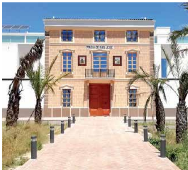
Masia de Sant Josep

La propietat va anar passant de pares a fills fins que en maig de 2004 va ser venuda i posteriorment abandonada. Catalogada Bé de Rellevància Local, l'Ajuntament