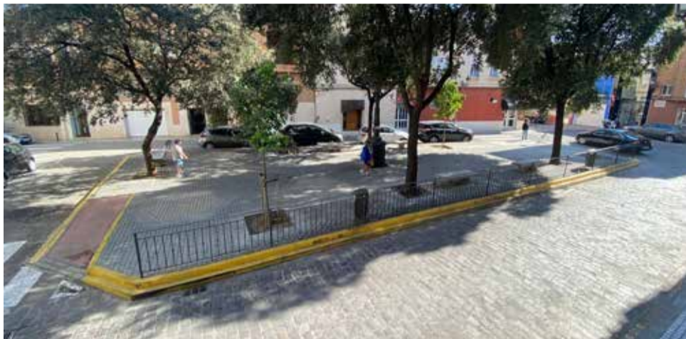
Plaça de Sant Domènec de Sueca / EPDA

La remodelació, que es durà a terme amb materials nobles i una il·luminació concorde a l'espai, afec-