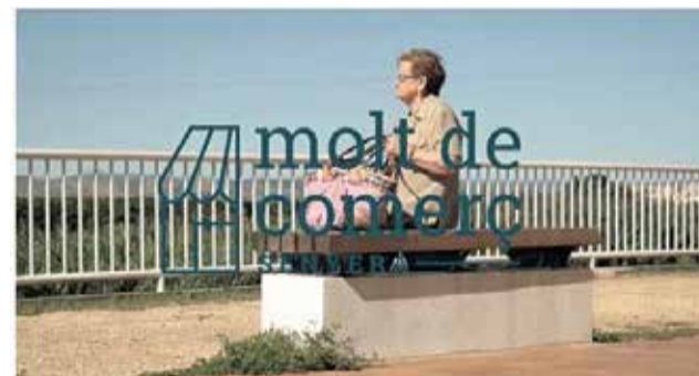
Imatge de la campanya a Senyera. / EPDA

Es va portar a cap també una campanya de sensibilització comercial ciutadana per generar sinergies, simpatia i impulsar entorns de participació i col·laboració dins del municipi, a través del material audiovisual, elaborant un vídeo i cartelleria que subratllen la importància del comerç minorista del municipi. Amb esta campanya l'Ajuntament reitera el compromís per millorar