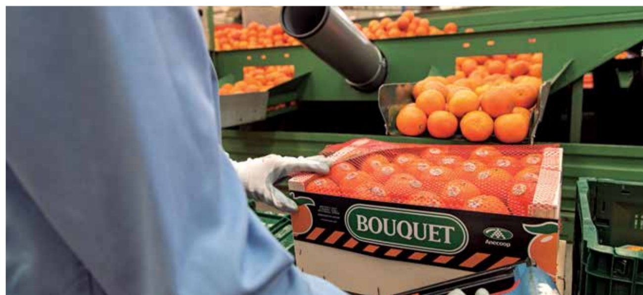
Cítricos BOUQUET de Anecoop.

Combaten el desarraigo y la despoblación contribuyen-