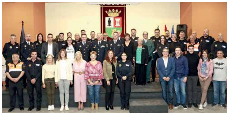
Galardonados/as en el Día de la Policía Local de Benifaió.