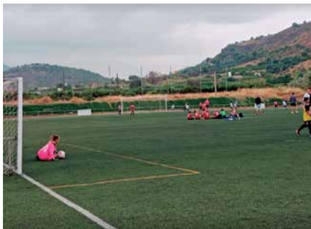
Campo de fútbol Xulla.

El portavoz del PP también denuncia las reclamaciones desde hace años ante