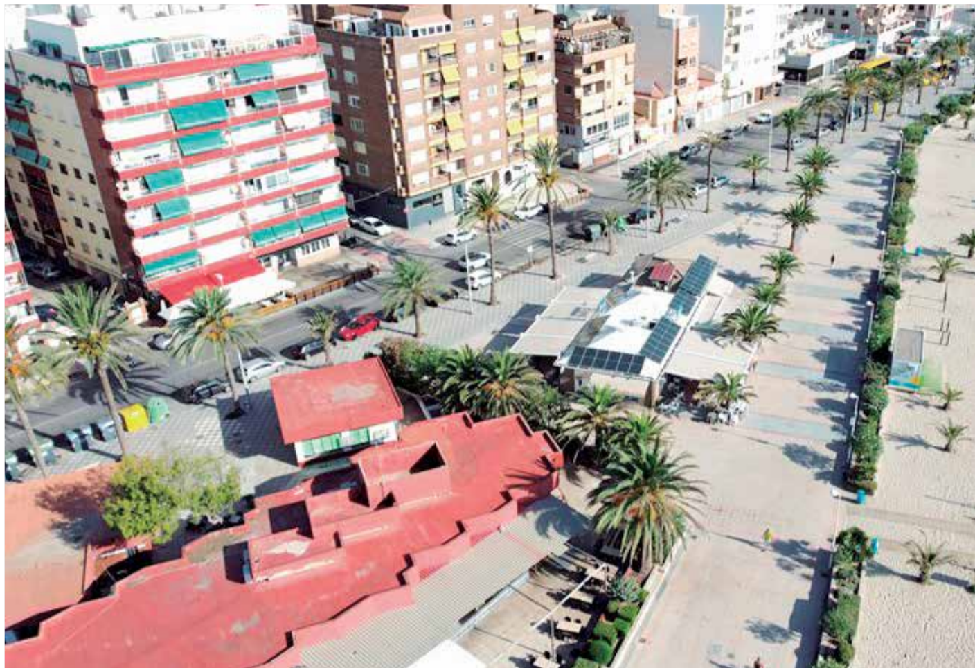
Vista aérea del paseo marítimo de Port de Sagunt, lugar donde tendrán a cabo las actuaciones propuestas por el Ayuntamiento.

Del mismo modo que se han planteado las necesidades de aparcamiento, puesto