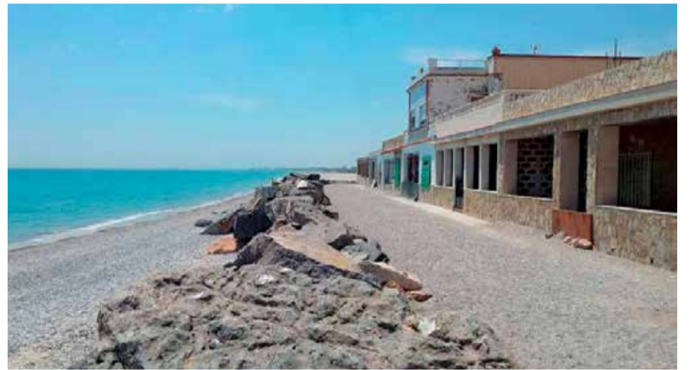
Un punto de la costa de Sagunt, sin inversiones en 2023, según el anteproyecto.

Por su parte, Compromís y Partido Popular presentaron una enmienda para que se añadiera la petición de 2 millones de euros con cargo a este