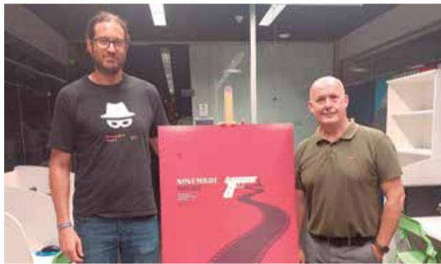
El concejal de Juventud presenta el cartel.

Entre los diferentes títulos cinematográficos destacan Ariaferma (viernes 4), La hija (sábado 5), Titane (viernes 11), Jinetes de la justicia (sábado 12), Vitalina Varela (domin-