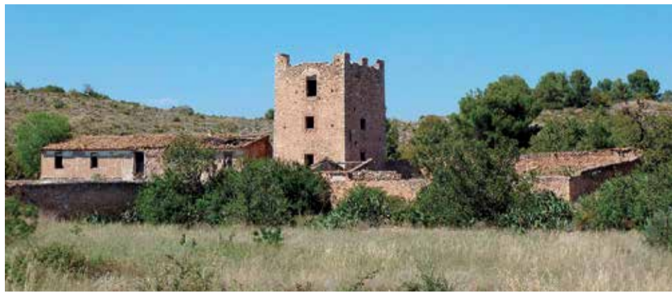
Alquería de l'Aigua Fresca de Sagunt.