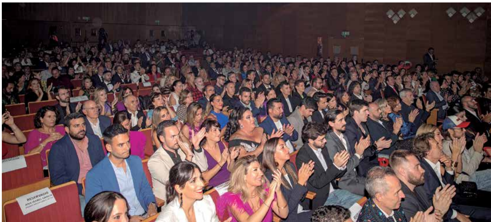
Algunos de los invitados a la gala de los VI Premios de AquíTV.