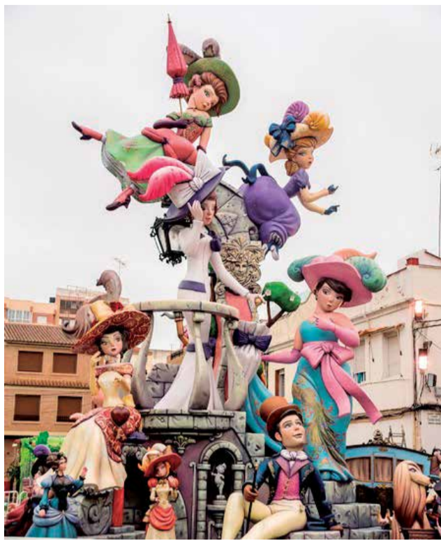
Falla Plaza Rodrigo, ganadora mayor en 2022.

En cuanto a las secciones, el único cambio con respecto al año pasado lo sufre la falla grande de Gilet: ha pasado de la sección especial, categoría a la que perteneció por su 50 aniversario, a sección tercera. De esta manera, La Marina, Plaza Rodrigo, La Victoria y El Palleter se mantienen en sección especial. Además, en los monumentos mayores también está en esta categoría Eduardo Merello y, en los infantiles, La Palmereta. Por otro lado, la sección segunda sigue siendo la más monumentos aglutina, tanto en grandes como en infantiles.