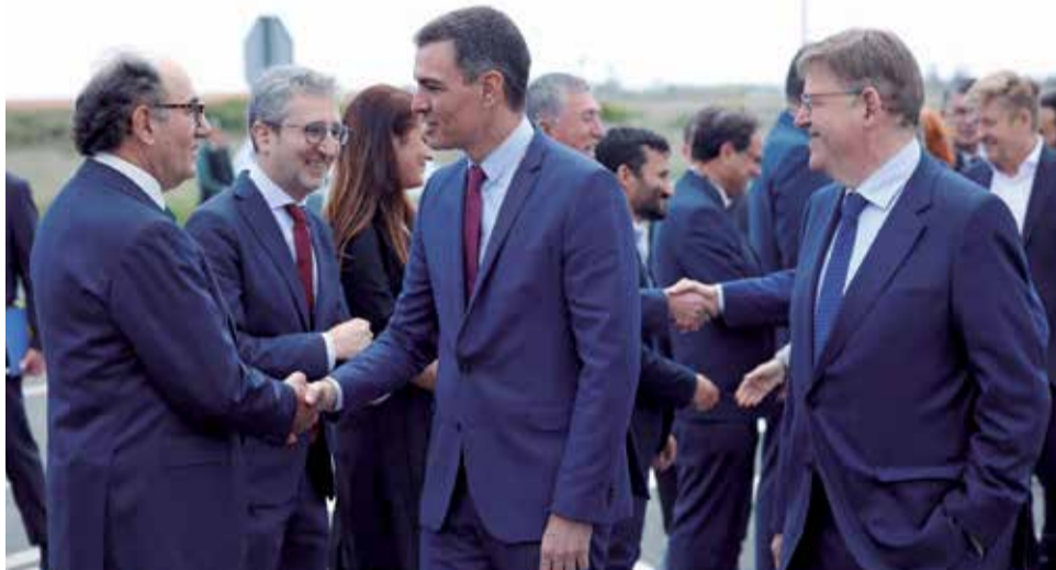
Autoridades el día de la presentación del proyecto de Volkswagen en Sagunt.

Seat lidera el reparto de estas ayudas públicas al recibir cerca de 397,4 millones de euros, un 45 % de los 877,2 millones de euros que se dis-