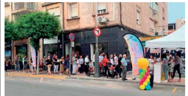
Fiesta del comercio local en 9 d'Octubre.

"Considero que es importante para el comercio de proximidad la unidad política en torno a la importancia y la relevancia que tiene el comercio para nuestra ciudad", puntualizó la concejala.