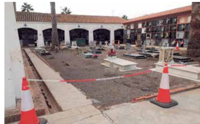
Zona vallada del cementerio de Port de Sagunt.