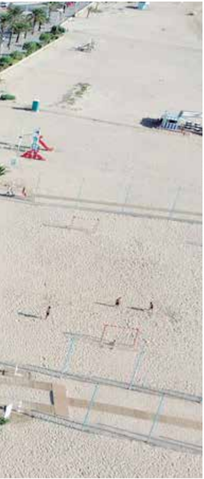
amiento. / EPDA