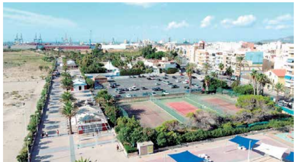
Paseo marítimo mirando en dirección sur.

Las obras mejorarán el espacio público del paseo, la conexión del puerto marítimo con el delta del Palancia y, en el futuro, con el nuevo proyecto del Pantalán