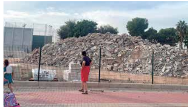
Parcela donde se depositan los materiales.

al colegio. Asimismo, se protegerá el perímetro del lado del colegio, por ejemplo, colocando acopios de materiales a emplear en la obra en paralelos a la valla. Finalmente, los materiales no po-