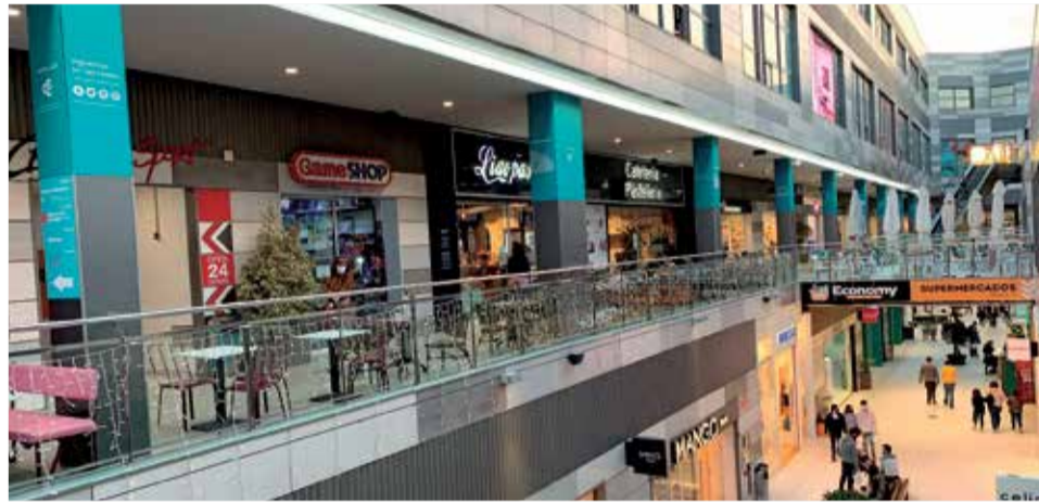
Centro Comercial Lepicentre.

La otra nueva apertura se encontrará en el parque de medianas situado junto a McDonalds y Sprinter. Se trata de la marca holandesa Action, que centra sus línea de negocio en 6.000 productos no alimentarios a bajos precios, 1.500 de ellos a menos de 2 euros. Su catálogo de productos consta de 14 categorías, entre las que se encuentran: decoración, bricolaje, juguetes y entretenimiento, papelería y tiempo libre, multimedia, menaje,