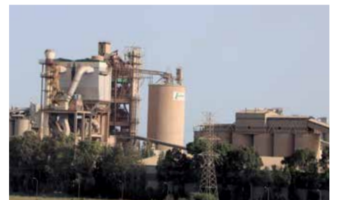
Planta de Lafarge en Sagunt.

carbono, la planta ha llevado a cabo un proceso de adaptación de sus instalaciones, sistemas y procesos, potenciando el uso de materias primas alternativas para la fabricación de cemento.