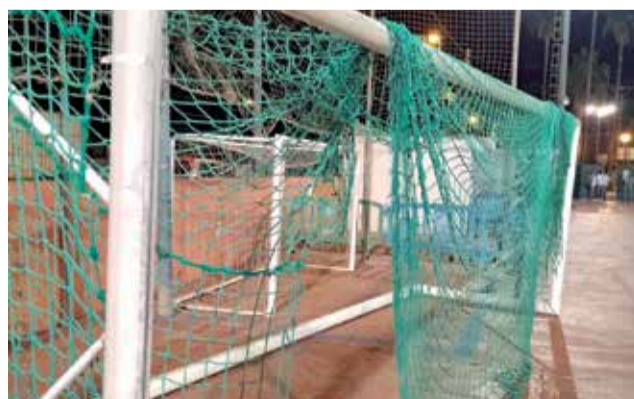
Portería del estadio con la red rota.

"Nos sorprende -continúa- la petición de modificar los horarios: en el registro de entrada que presentó el club al Ayuntamiento pedían acabar ampliar la apertura hasta las 10:30 y así se concedió".