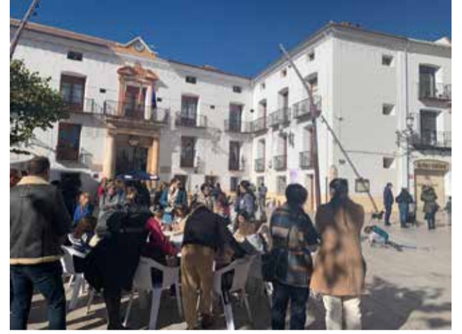
Jornada conmemorativa en Utiel.

Bajo el lema “La infancia cuenta” la plaza del Ayuntamiento de Utiel acogió una jornada especial dirigida especialmente a niños/as a partir de 6 años en la que, a través de diferentes actividades lúdicas y educativas, se visibilizaron algunos de los principales artículos recogidos en la Convención de los Derechos del Niño. La actividad “La