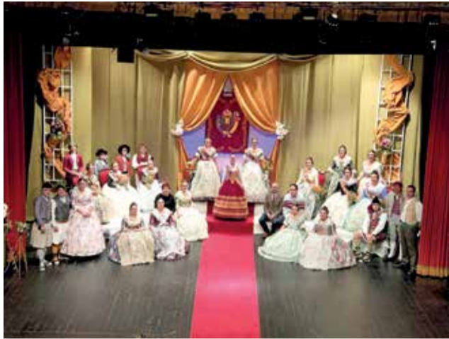
Un momento durante la proclamación.

Un evento en el que se dieron cita cientos de representantes del mundo fallero: integrantes de las tres comisiones falleras mayores e infantiles de Utiel, de Juntas Locales Falleras de