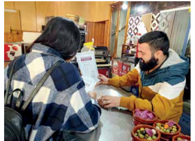
Reparto en locales de Cheste.

Concretamente, la cartelería y pegatinas que se han instalado en los establecimientos de la localidad chestana centran su mensaje en concienciar a la población de no tirar colillas al suelo ni residuos sólidos a