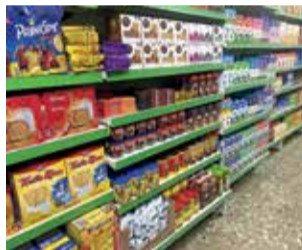
'Superalba' de Chera.

“Los comercios locales son fundamentales para que, los que vivimos en nuestros pueblos, podamos tener un nivel de vida digno, por ello hemos de apoyarles y procurar hacer las compras en nuestras tiendas, hornos, farmacias etc,