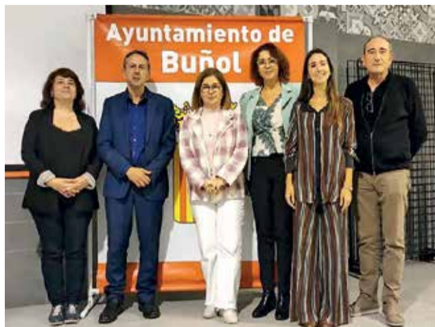
Un momento durante la presentación del plan.