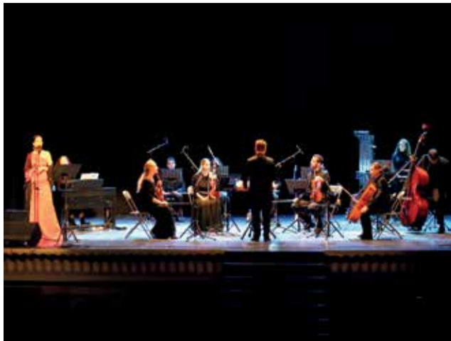
Un momento de la actuación en Cheste.

Durante el concierto se escucharon obras como El café de chinitas, Las morillas de