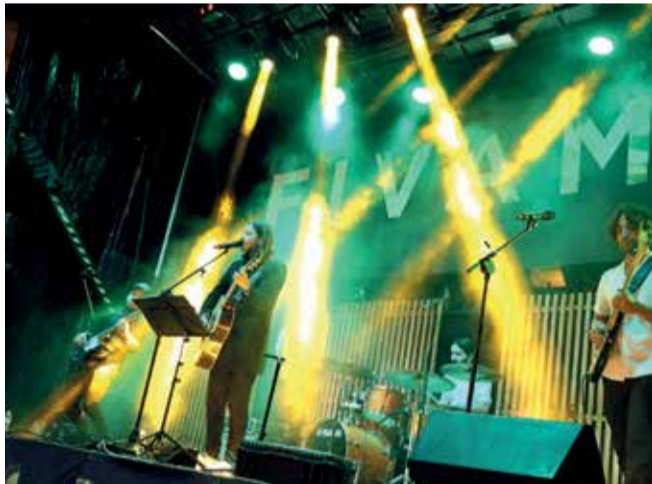
Diferentes momentos durante la Feria Valenciana del Moscatel en Cheste.

de la de numerosos concejales y alcaldes de poblaciones vecinas. Además, han querido acompañarnos los representantes de las bodegas, del Consejo Agrario y de las asociaciones de nuestra localidad. Por último, quiero agradecer a las bodegas y expositores gastronómicos la confianza depositada en nosotros colaborando con este evento, así como a todas las personas implicadas en que esta Feria haya salido adelante".