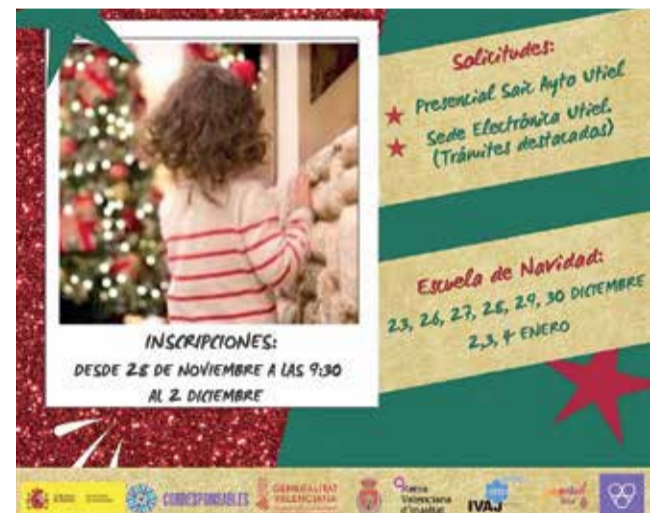
Cartel de la Escuela de Navidad de Utiel.

Este año los niños y las niñas de Utiel podrán disfrutar de unas vacaciones de Navidad con actividades especiales de carácter lúdico y educativo gracias a la puesta en marcha de la I edición de la “Escuela de Navidad de Utiel”. Bajo el nombre “Arco Iris”, este año la concejalía de Infancia y Juventud del Ayuntamiento de Utiel ha organizado una escuela de Navidad para que, durante este periodo de vacaciones, los niños de infantil y primaria, con edades comprendidas entre 3 y 12 años, puedan disfrutar de diferentes actividades, talleres, manualidades con temática navideña. Una iniciativa incluida en el Plan Corresponsables con la que el Ayuntamiento de Utiel quiere facilitar la conciliación laboral y familiar a los padres durante estas vacaciones navideñas al igual