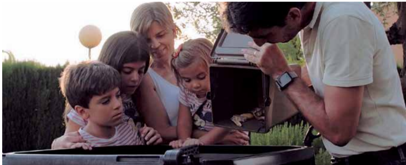
Programa de compostaje Consorcio Valencia Interior.