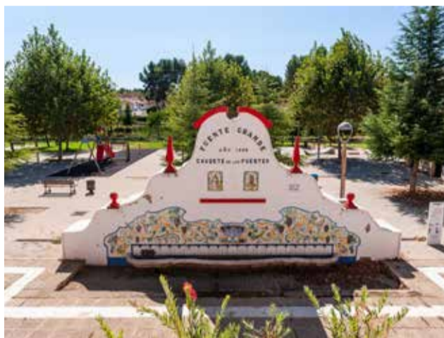
Caudete de las Fuentes