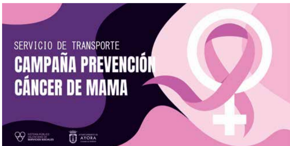
Cartel de la campaña del servicio de transporte de Ayora.

La salida del servicio de transporte dependerá de la existencia de un número mínimo de reserva de plazas.