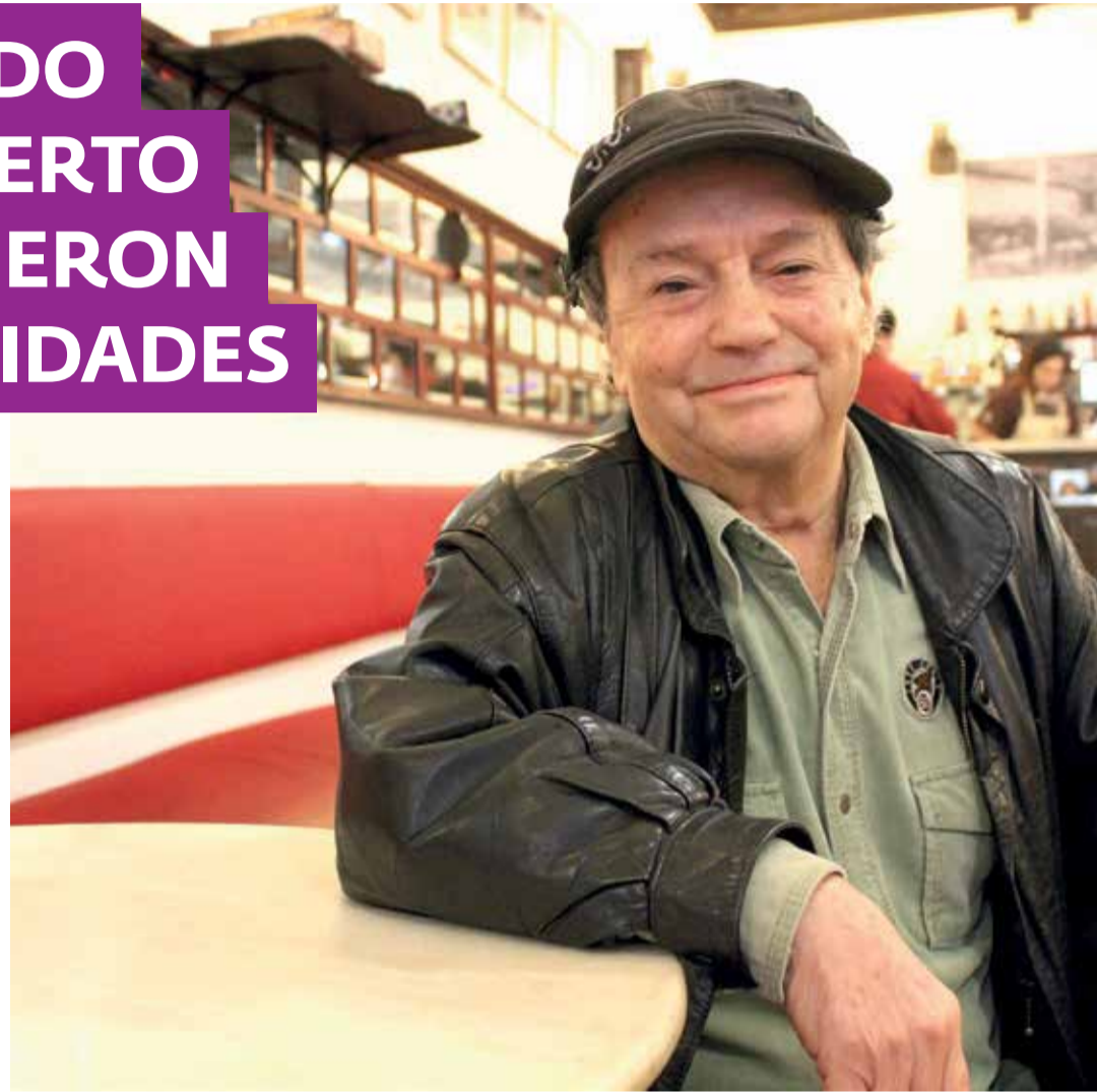
Joselito en el Café - Salón Pérez de Utiel, próximo al escenario donde hizo su debut artístico

► Lo que ganaba con la Columbia Pictures o en Francia por cada show eran 5.000 dólares de la época y hacia unos cuatro o cinco shows al día. Siempre había mucha cola de gente, fácilmente ganaba diariamente 20.000 dólares de aquel tiempo en los años 1956-57-58. Con 13/14 años ganaba todo ese dinero y eso en España era imposible. Además, a Franco le venía muy bien porque, aunque nunca trabajaba allí, cada tres películas declaradas en Hacienda le llegaban de divisas del extranjero a España 3.000 millones de pesetas. En aquel momento para el régimen español le venía muy bien porque después de la posguerra es cuando más falta hacía el dinero. Era el niño mimado, aunque nunca sa-