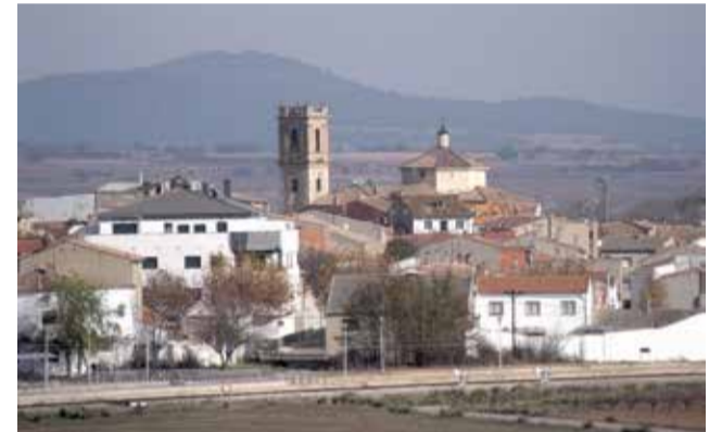
Vista de Camporrobles.

Estos presupuestos recogen el apoyo y servicios que presta la Mancomunidad del Interior Tierra del Vino en todas sus áreas: Servicios Sociales, Servicios Psicopedagógicos, Centro Ocupacional, atención a la infancia, unidad de conductas adictivas, Igualdad, Juventud, Oficina de Atención a las Víctimas de Violencia de Género, Servicios Técnicos y ADL, Perrería Comarcal, Servicio de Maquinaria y como novedad este año Educador Ambiental,