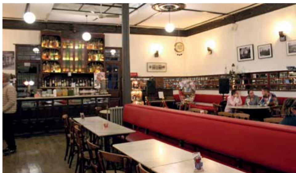
Cafetería de Utiel, Salón - Pérez.

tus cartas y tú no has guardado ninguna" (entre risas).