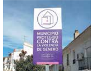
Letrero en Macastre. / EPDA