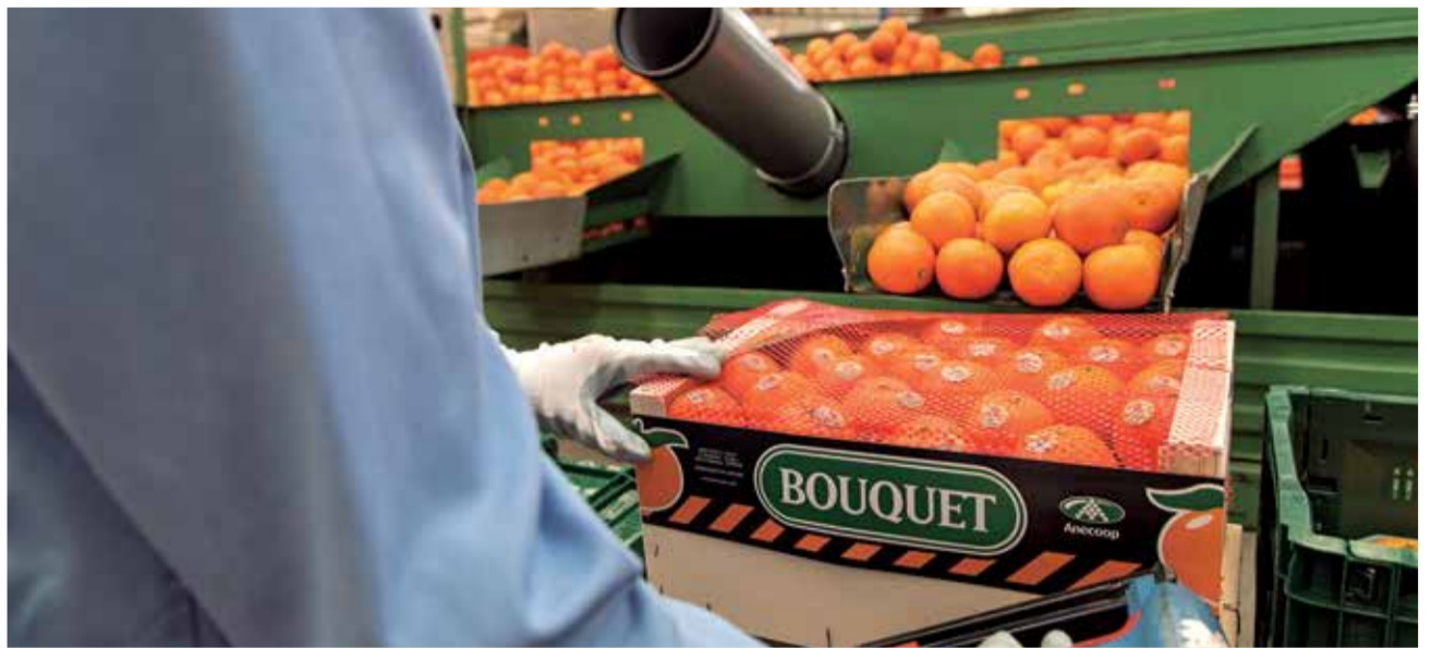
Cítricos BOUQUET de Anecoop.

Su consumo contribuye a la sostenibilidad de la agricultura, limitando el abandono de las tierras de cultivo, afianzando la población al medio rural y asegurando a los jóvenes agricultores un futuro estable, consolidado y adaptado a los nuevos tiempos.