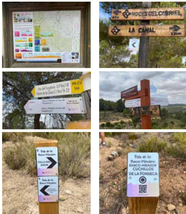
Señalizaciones de la ruta de los Bancos-Miradores.

Esta ruta es de carácter circular, tiene 20,8 km de distancia y un desnivel acumulado positivo de 622 metros aproximadamente y se propone su inicio y final en las Casas de Moluengo, su recorrido coincide en gran parte con el sendero homologado PR-CV 344 Fuente de la Oliva. Para su señalización se han utilizado diferentes tipos de soportes aprovechando al máximo los soportes ya existentes durante el recorrido con el fin de no masificar demasiado el entorno. El objetivo principal de esta nueva ruta es la de disfrutar e interpretar los paisajes de verdadera belleza y valor