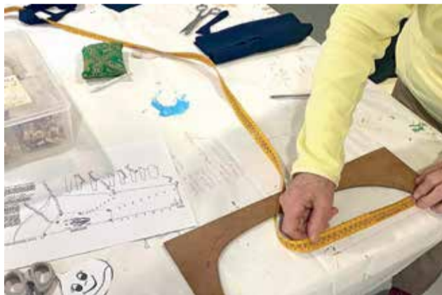
Durante el taller de costura.