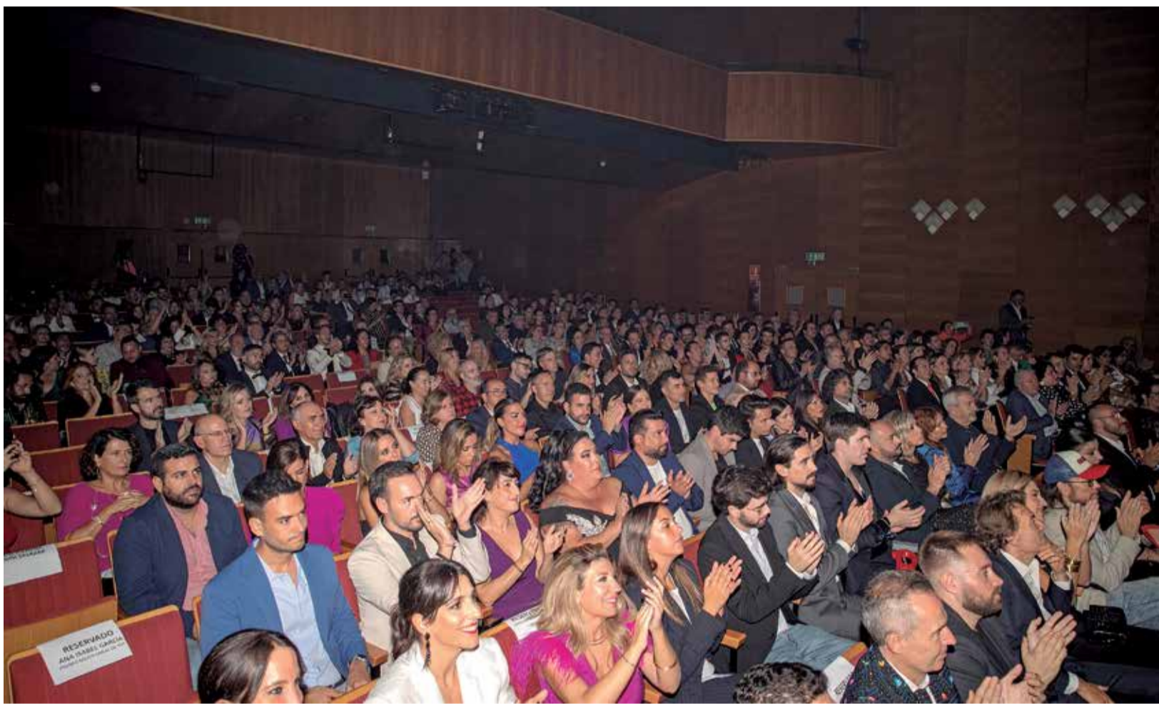
Algunos de los premiados e invitados a la gala de los VI Premios de AquíTV.