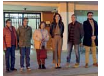
Durante la visita. / EPDA