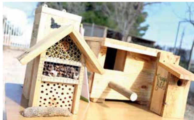
Alguno de los refugios naturales.