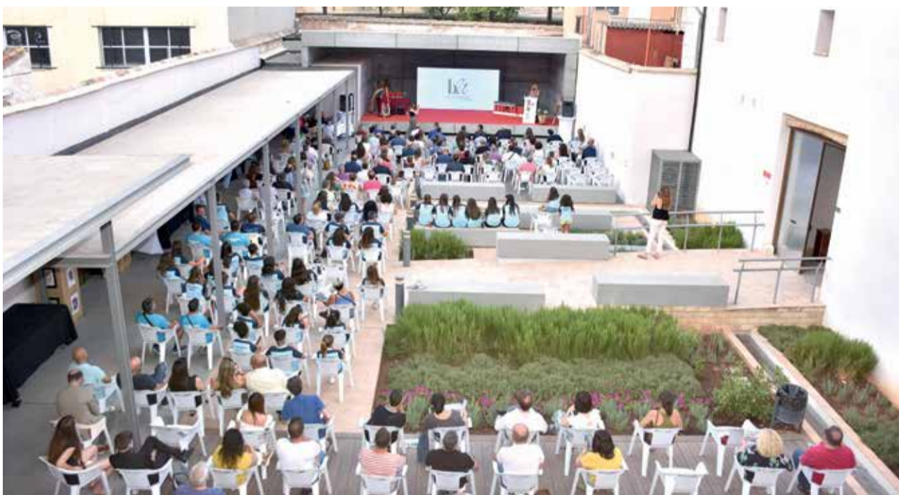
La Casa Alamanzón de Utiel.