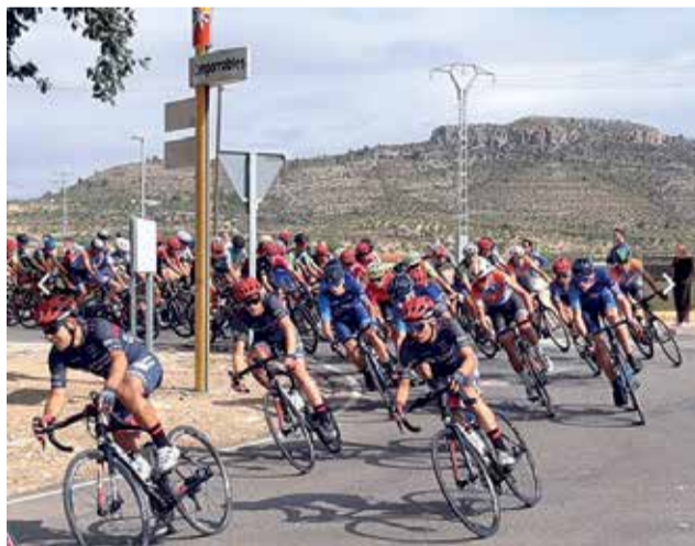
Foto archivo de la Vuelta Ciclista de Camporrobles.

Además, este Club lleva organizando desde 1983 la Vuelta Ciclista a Camporrobles, en la que han desfilaro cientos de ciclistas, algunos de ellos, que han llegado a convertirse en profesionales. En esta XXVII Vuelta Ciclista a Camporrobles, co-