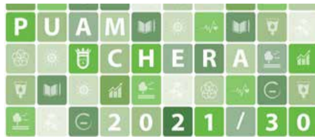
PUAM de Chera.

2030 Aprobado inicialmente en sesión ordinaria de Pleno de este Ayuntamiento, de fecha 17 de junio de 2022, el Plan Urbano de Actuación Municipal de Chera, se expone al público por plazo de treinta días hábiles desde la publicación de este anuncio en el BOP de Valencia nº 140 de fecha 22/07/2022, a los efectos de la presentación de cuantas propuestas, sugerencias, observaciones, reclamaciones y alegaciones se estimaren necesarias sobre su contenido, con la fina-