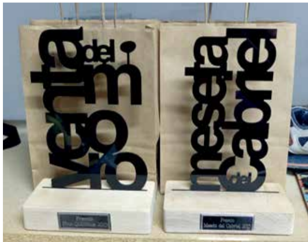
Galardones de los premios “Meseta del Cabriel”./ EPDA

El evento de carácter cultural, turístico y festivo surge fruto de la preocupación de un grupo de utielanos por crear un acto que agrupara a la ciudadanía con el fin de potenciar la ciudad e iniciar un movimiento de revitalización en un contexto de atonía económica y estancamiento demográfico azotado por