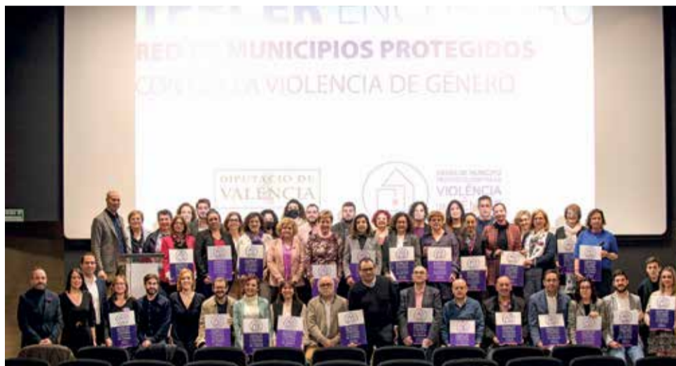
Alcaldes y alcaldesas de los diferentes municipios que participan.