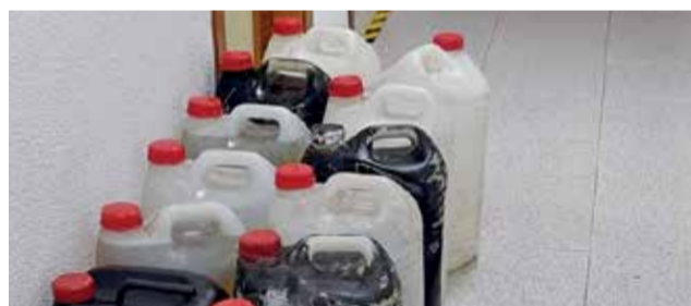
Material incautado por la Policía Local.

municipio alertando de que había personas sospechosas que estaban robando gasoil de un camión. Tras llegar al lugar, los ladrones se dieron a la fuga. Hubo una persecución, en la que se finalizó identificando a estas personas, que actualmente se encuentran identificadas y en búsqueda. Se requi-