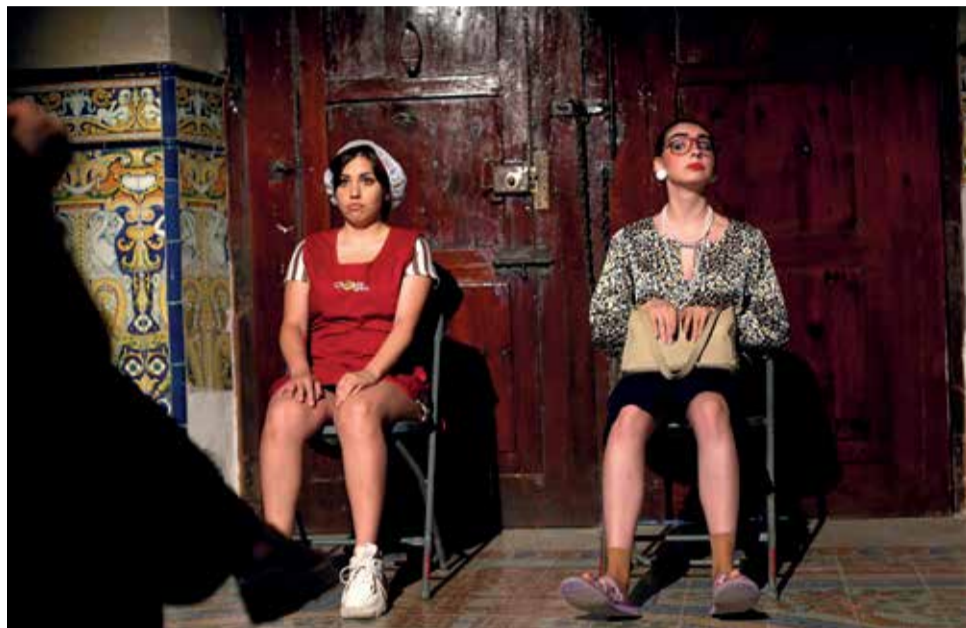
Un momento de la actuación de Cheste Inusual.