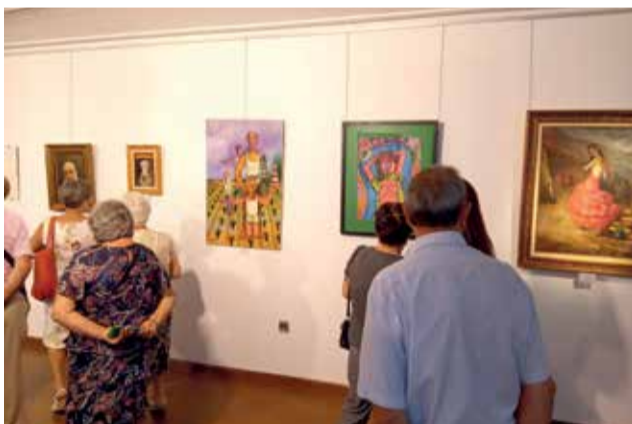
Diferentes momentos durante las actividades multidisciplinares de Utiel.

goteo de visitantes durante las 5 horas de celebración de las jornadas de puertas abiertas.