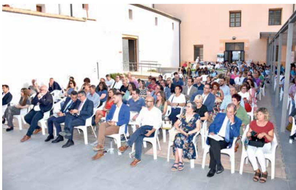
Uno de los momentos de la gala.

La gala comenzó con un photocall en el Patio del Museo Municipal - Casa Alamanzón, hasta llegar a la sala oficial que acogió más de 200 perso-