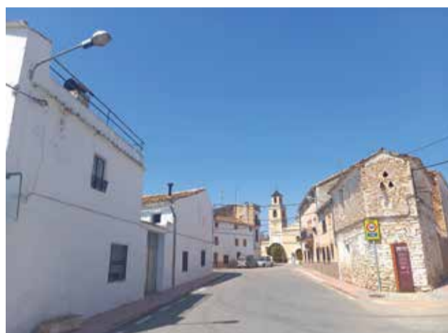
Algunas de las mejores en el alumbrado de las pedanías de Los Corrales y Las Casas .

ca en Las Casas y Los Corrales asciende a 146.022 euros que se destinarán a la instalación de lámparas de tecnología LED en más de 400 puntos de luz en diferentes sectores de ambas pedanías.