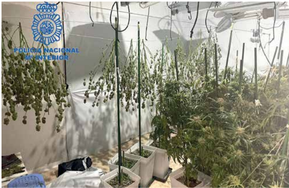
Imagen del cultivo de marihuana facilitada por la Policía Nacional.

Las investigaciones, llevadas a cabo por la Unidad de Drogas y Crimen Organizado (Udyco) de la Brigada Provincial de Policía Judicial de Valencia, se iniciaron a mediados del mes de junio, cuando los agentes tuvieron conocimiento, a través de los canales habilitados por la Dirección General de la Policía para la colaboración ciudadana, de que dos hermanos podrían estar dedicándose al cultivo y venta de marihuana.