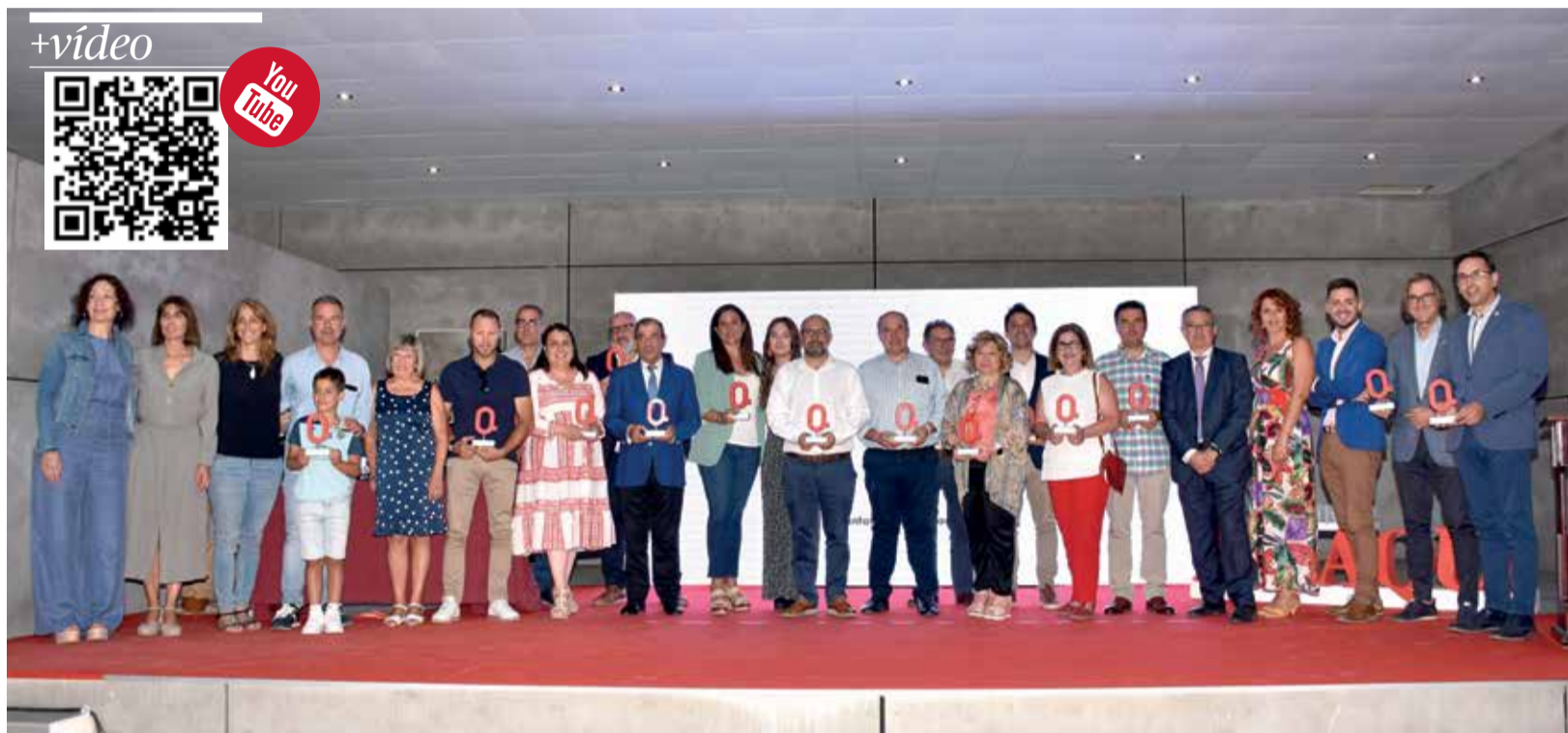
Instantánea de todos los premiados después de la gala en la Casa Alamanzón de Utiel.

SE PREMIÓ LA TOMATINA, LAS BODEGAS SUBTERRÁNEAS DE UTIEL Y EL PRIMER CORTE DE LA MIEL DE AYORA, ENTRE OTROS