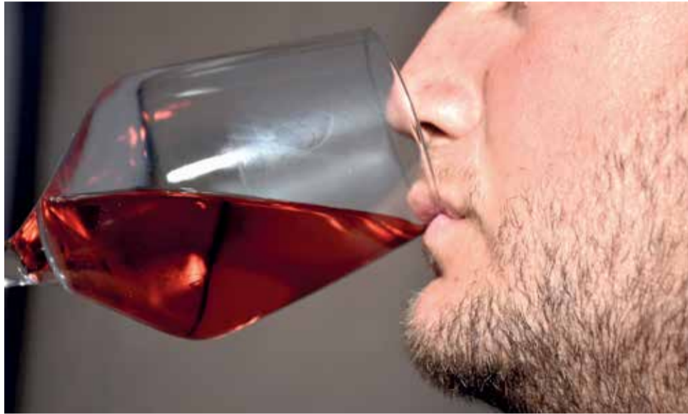
Un momento de la gala de los premios de El Periódico de Aquí.

El artículo analiza los cambios y continuidades entre los periodos ibérico y romano en términos de poblamiento y hábitat rural, ya que este asenta-