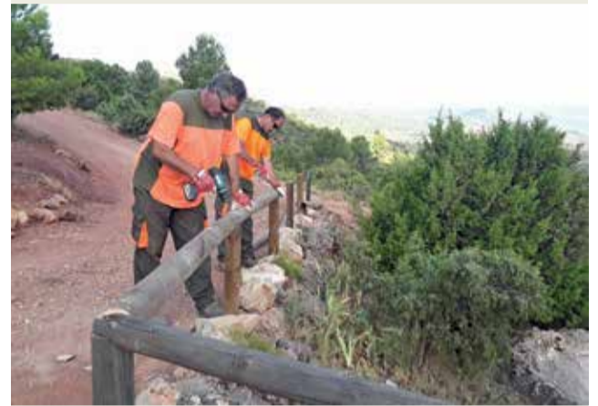
► El Ayuntamiento de Villargordo del Cabriel ha anunciado que la Brigada del Parque Natural de las Hoces del Cabriel está haciendo trabajos de reconstrucción en la Fuente del Junco. Sobre todo en algunos desperfectos de algunas barandillas de seguridad.