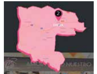
Cartel anunciador.