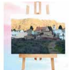
Cartel anunciador.