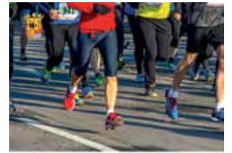
V Carrera Popular