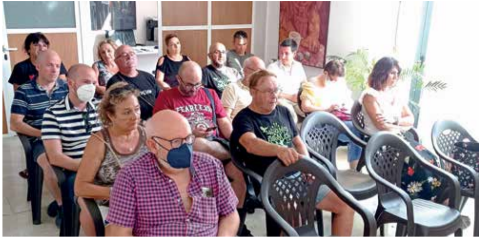
Durante el pleno de julio de Buñol.