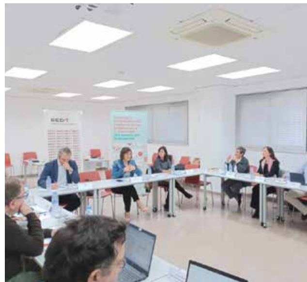
Cámara de Comercio de Castelló.

El debate ha estado muy centrado en el paradigma actual y el futuro, en especial en el límite 2030, algo en lo que han coincidido todos los actores, cada uno en su ámbito, como el diseño de prendas de ropa a partir de redes de pesca recuperadas del mar Mediterráneo, la biomedicina, le