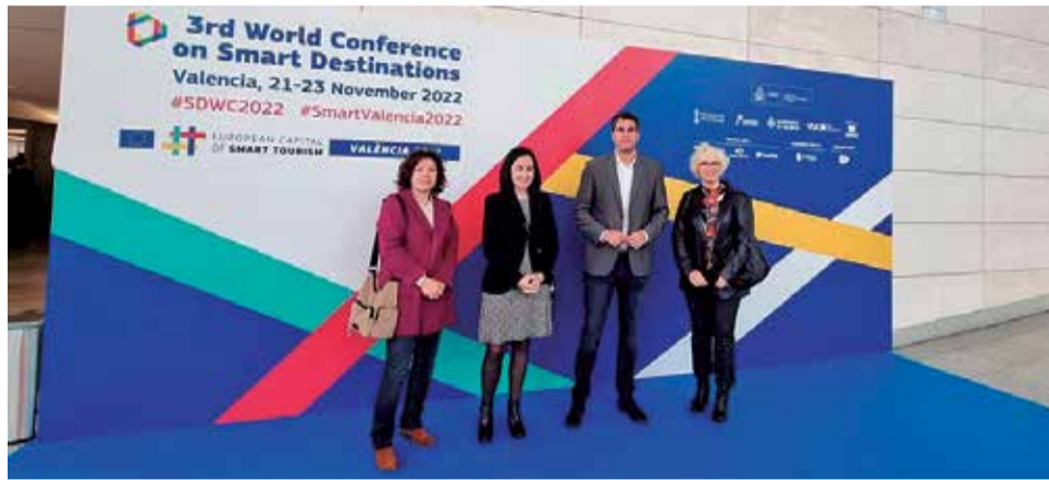
Comissió Plenària de la Xarxa de Destins Turístics Intel·ligents.

Rhamsés ha destacat que "es tracta d'un congrés molt important i aprofitar les noves tecnologies per a millorar com a destinació turística". L'edil ha explicat que