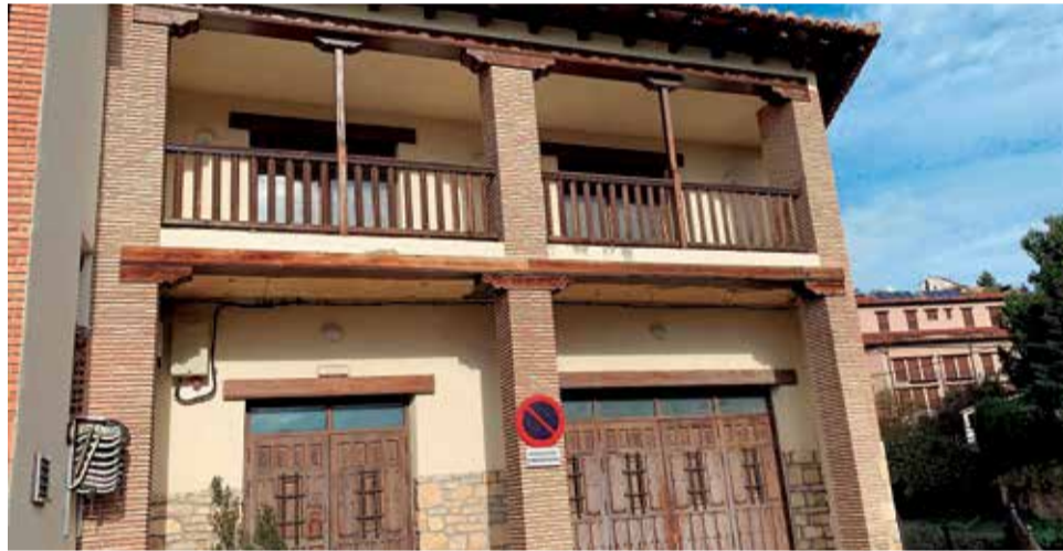
Izquierda, fachada del negocio en el municipio turolense. Derecha, uno de los negocios de la población turística.