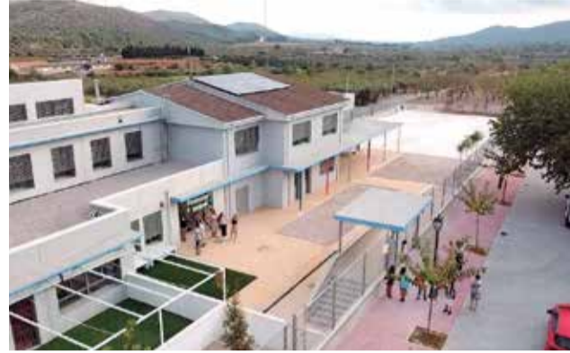
Escola municipal de Santa Magdalena.