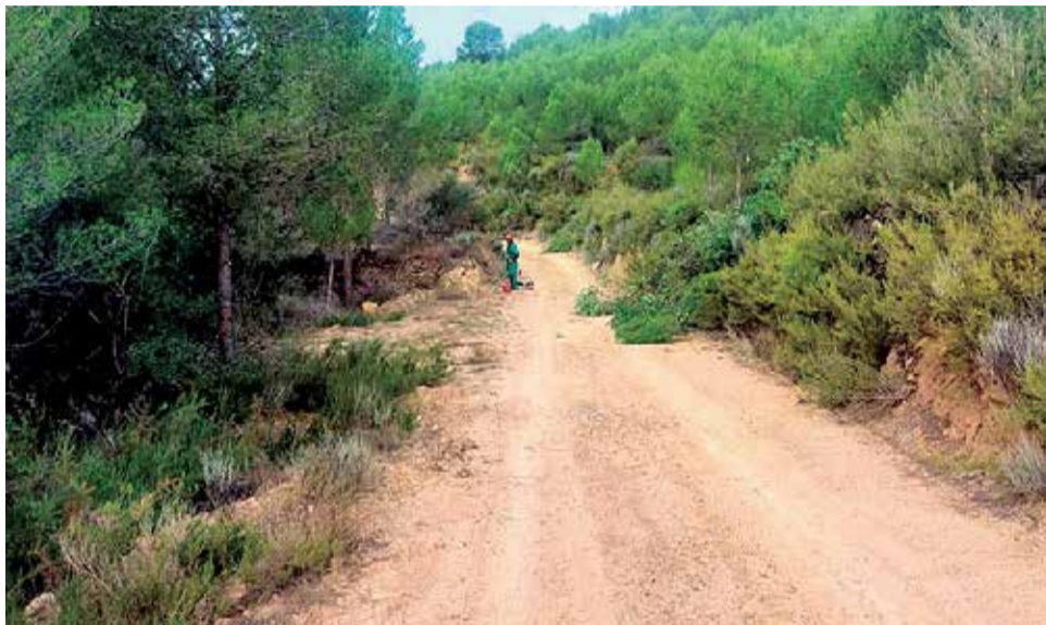
Arreglos y limpieza de los caminos rurales del término municipal.

De este modo, este trabajo se une a la identificación cartográfica de núcleos urbanos y construcciones aisladas de nuestro término municipal de la localidad.