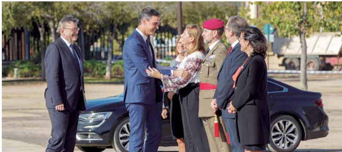
Inicio de la I Cumbre Hispano-Rumana el auditorio y Palacio de Congresos.

Sánchez señaló que la azulejera es una industria “clave”