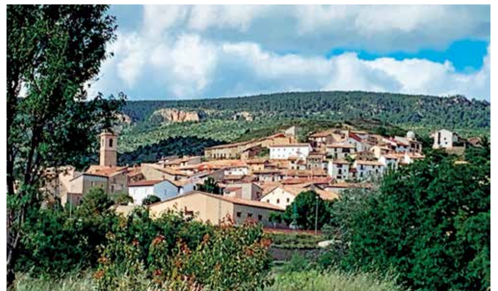
Nogueruelas está ubicado en un entorno privilegiado.

La población cuenta con servicios, hotel, consultorio médico, horno, escuela.