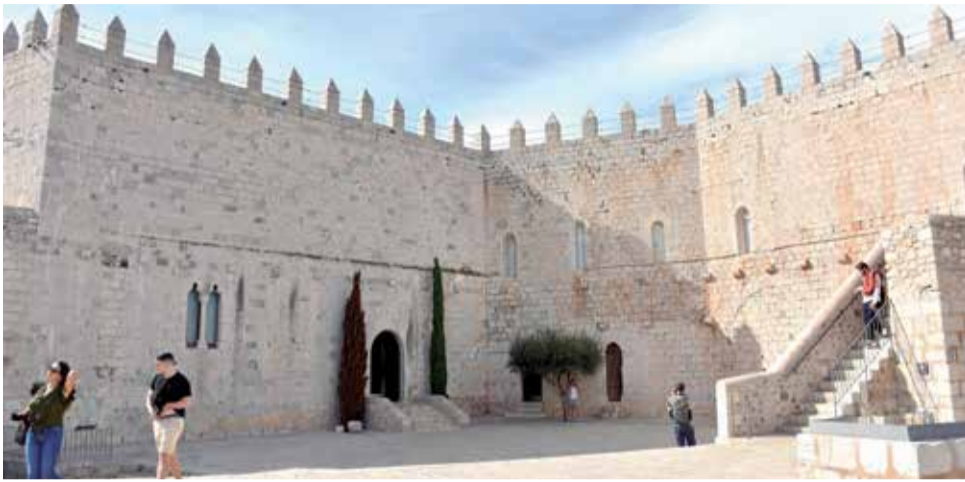
Castell del Papa Luna de Peníscola.