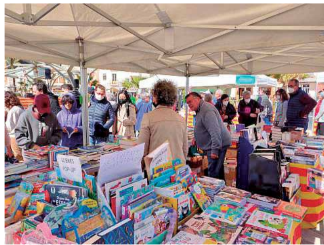
Fira del llibre a Vinaròs.

La mostra es va presentar com una acció de promoció