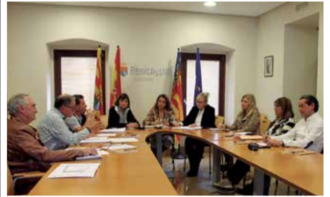
Órgano Gestor Playas. / EPDA