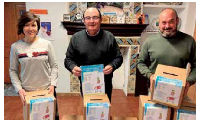
Presentación de la campaña.