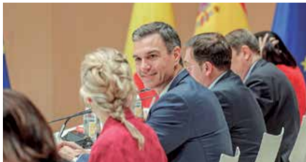
El presidente del Gobierno, Pedro Sánchez.

En este sentido, desde Ascer agradecieron la predisposición que tuvo el presidente del Gobierno para mantener