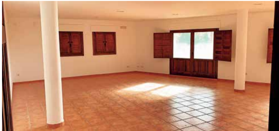
Interior del local que ofrece el Ayuntamiento de Nogueruelas.

Ante ello, el Ayuntamiento de Nogueruelas ha lanzado una atractiva oferta para emprendedores o familias que quieran hacerse cargo del negocio abonando un alquiler testimonial. Los interesados podrían de este modo abrir una tienda con carnicería en un local de unos 90 metros que tiene el propio Ayuntamiento y que dispone de un almacén de en torno a 80 metros anexo. El espacio tiene su entrada principal por la plaza del pueblo, aunque da también a la carretera. En la planta superior cuenta con dos apartamentos, de una y dos habitaciones, que están libres y que se destinarían a la familia que quisiera tomar las riendas del negocio si necesita alojamiento.