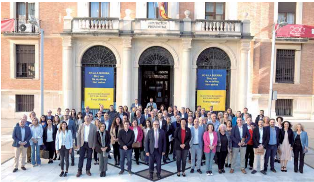
Cinquena cimera d'alcaldesses i alcaldes de la província de Castelló.