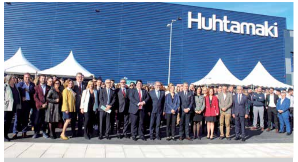
Acto inaugural de la multinacional Huhtamaki.

En este sentido, desde el Ayuntamiento de Nules se señala que, "esta inauguración es muy importante tanto para Nules como para el resto de nuestra provincia, puesto que la inversión y la ampliación realizados por Huhtamaki permitirá la creación de nuevos puestos de trabajo. De hecho, el consistorio ha apo-