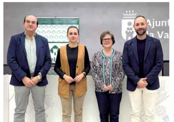
Presentación del bono comercio local.

tación municipal de 25.000 euros y que tanto el año pasado como este se ha ampliado a 42.000 euros para llegar a más valleros y valleras". En este sentido, ha añadido que en estos tres años se han puesto en circulación 218.000 euros "que han revertido directamente en el tejido económico de la ciudad".