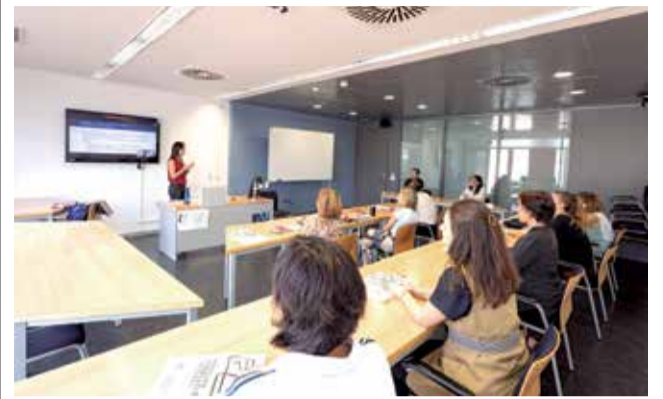
Microcredencials com a fórmula d'aprenentatge.