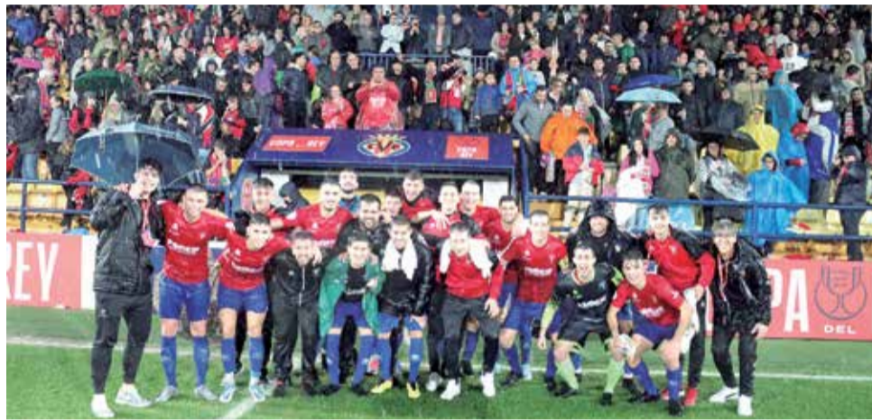
Los jugadores del Alcora junto a sus aficionados en el Mini Estadi. / TWITTER CD ALCORA

En cambio, los franjiverdes, sí. Pero el resultado no