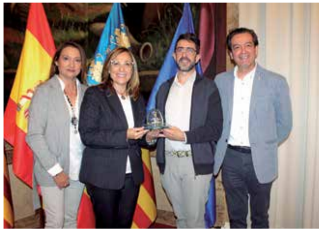
La alcaldesa de Benicàssim reibe el premio.

Ecovidrio ha hecho entrega al Ayuntamiento de Benicàssim del galardón Iglú Verde por superar el reto