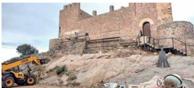
Castillo de Gaibiel.

El Ayuntamiento de Gaibiel ha iniciado una nueva actuación sobre el castillo con la que se pretende consolidar los lienzos de la fachada sur por la que se accede a la fortificación. Las obras, que comenzaron hace unos días,