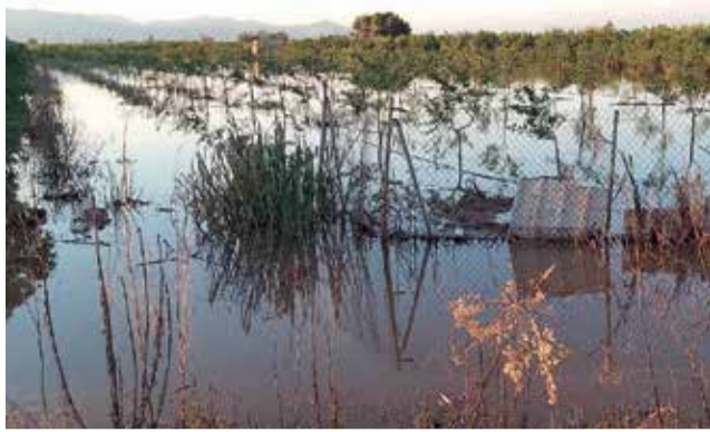
El campo de Nules afectado por la lluvia.