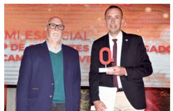
Premio a los cronistas e investigadores de Morvedre / P.G.