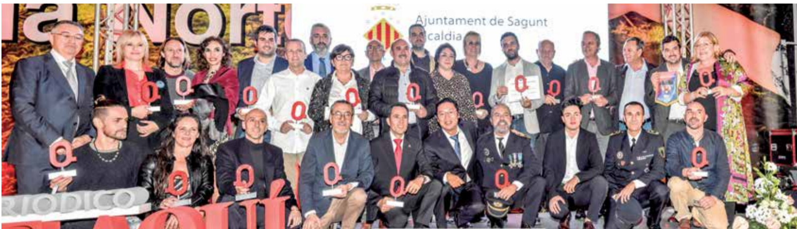
Foto de familia de los galardonados en la decimoprimer edición de premios.

EL PERIÓDICO DE AQUÍ REÚNE EN LA CAPITAL DEL CAMP DE MORVEDRE A MÁS DE 400 INVITADOS EN UNA GALA QUE RECONOCE EL TRABAJO DE PERSONAS Y ENTIDADES DE EN CADA UNA DE LAS CATEGORÍAS ESTABLECIDAS POR LA ORGANIZACIÓN