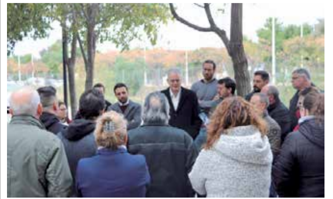
Reunión con los vecinos de la Pinaeta.