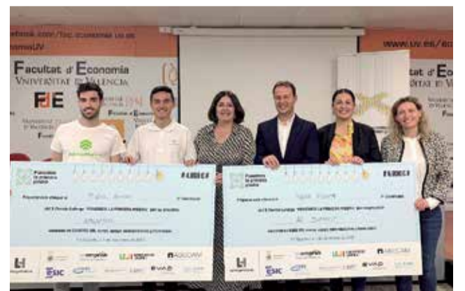
Entrega de los premios de Lafarge.

La iniciativa, surgida de la fábrica de LafargeHolcim en Sagunt, está destinada a apoyar a emprendedores y pequeñas empresas de la Comunitat Valenciana que estén poniendo en marcha un proyecto empresarial enfocado a aspectos como la sostenibilidad, la innovación, la tecnología o el impacto social.