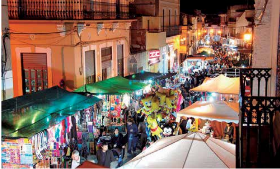
Fira de Faura en un altre any.

L'exposició, que estarà oberta fins a dijous, 8 de desembre, es podrà visitar dissabte, de 17 a 19 hores; diumenge, a partir de les 11 i durant tot el dia; i dimarts i dijous d'11 a 14 i de 17 a 19 hores. Dilluns, 5, i dimecres, 7 de desembre, serà visitada per tot l'alumnat del CEIP Sant Vicent Ferrer.