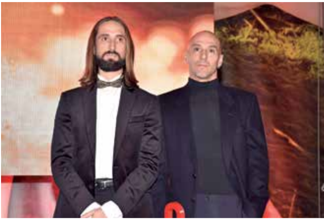
Premio a Hort-Art. / P.G.