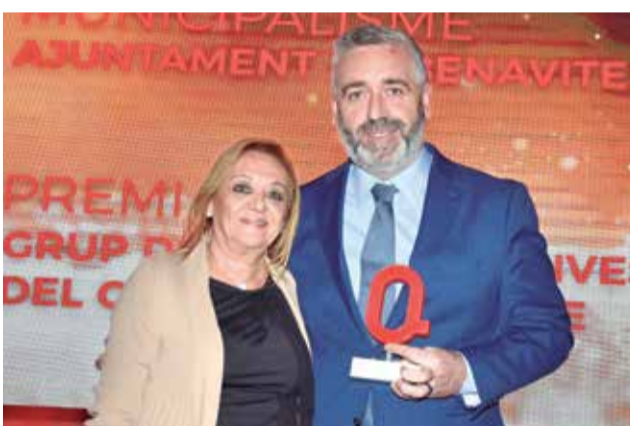
Premio al Ayuntamiento de Benavites.