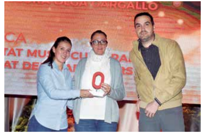
Premio a la banda de Albalat dels Tarongers. / P.G.