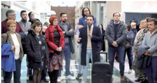
Corporación municipal en la jornada.

■ A FALTA DE LA MUSEALIZACIÓN, EL EDIFICIO DE LOS AHM ACOGIÓ UNA JORNADA DE PUERTAS ABIERTAS