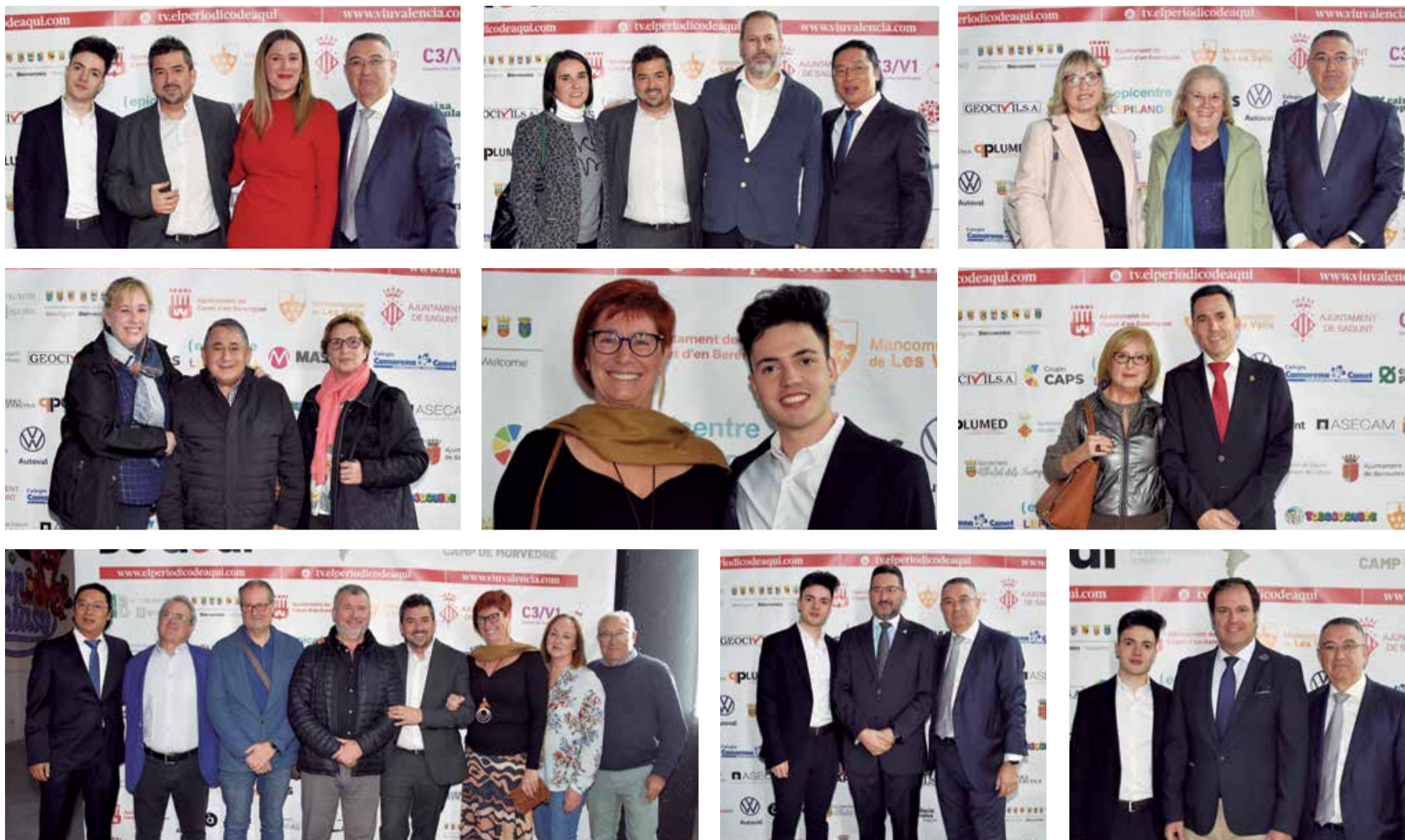
Varios instantes del photocall de los XI Premios de El Periódico de Aquí en el Camp de Morvedre.