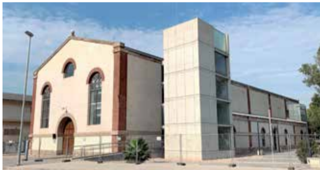
Interior y exterior de la nave de talleres. / BORJA PEDRÓS