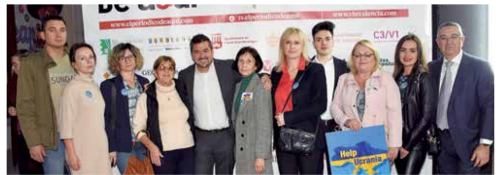
Varios instantes del photocall de los XI Premios de El Periódico de Aquí en el Camp de Morvedre.