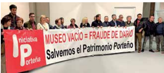
Protesta de Iniciativa Porteña en la jornada.