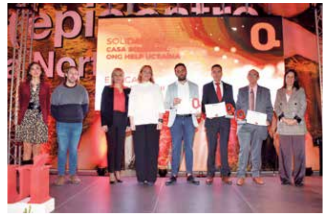
Premio relacionado con la guerra de Ucrania. / P.G.