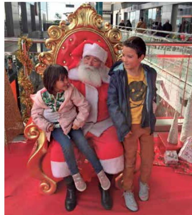
Papa Noel en Lepicentre, donde estará este año.

El Centro Comercial se ha convertido en centro de referencia del Norte de Valencia, con las marcas líderes del retail como: Lefties, Pepco, H&M, JD Sports, Stradivarius, Mango, Celio, Ulanka, etc; la mejor restauración por variedad y calidad, como: Sana, Tagliatella, Kyoto, TGB, 100 montaditos, Asoko, etc., la mejor zona de ocio infantil del Norte de Valencia con LEPILANDIA el mejor espacio deportivo con el gimnasio Central Sport. También cuenta con el supermercado líder en calidad y precio, el Economy Cash, situado en el la planta -1 del Centro Comercial.