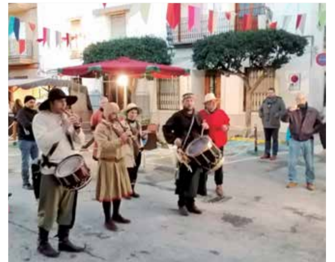
El mercat de Nadal un altre any a Canet.

Un altre dels atractius de les festes nadalencques és, sens dubte, el Betlem de Canet, que obrirà les portes el pròxim 8 de desembre fins al 9 de gener. Es tracta d'una gran exposició d'artesanía, amb un cridaner naixement i espectaculars escenes bíbliques que alberga vora 400 figures i que es podrà gaudir a la Casa dels Llano.