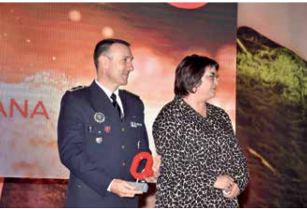
Premio Seguridad Ciudadana a P. Local Sagunt. / P.G.