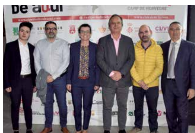
Varios instantes del photocall de los XI Premios de El Periódico de Aquí en el Camp de Morvedre.