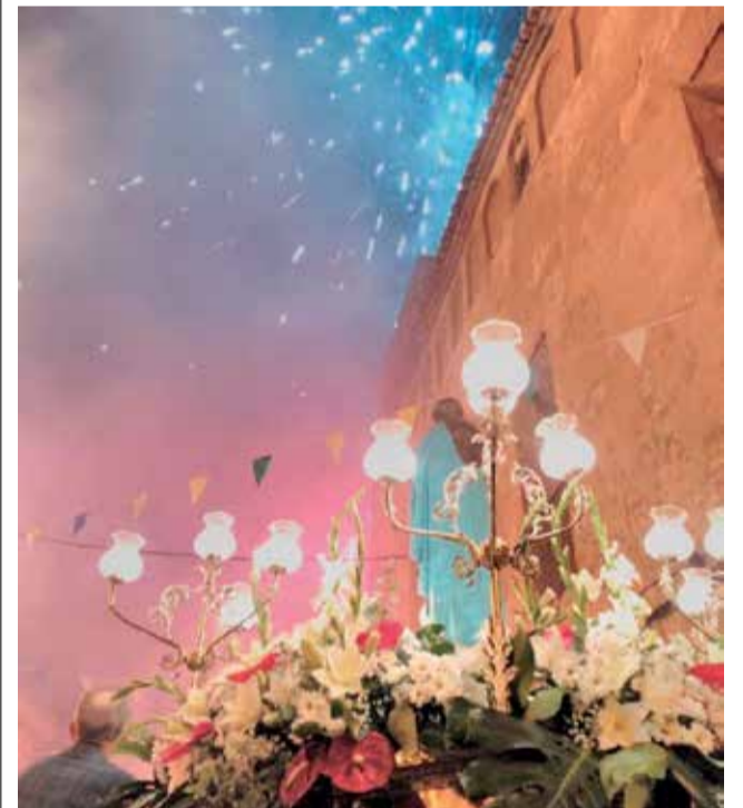
La patrona d'Albalat, la Puríssima Concepció.