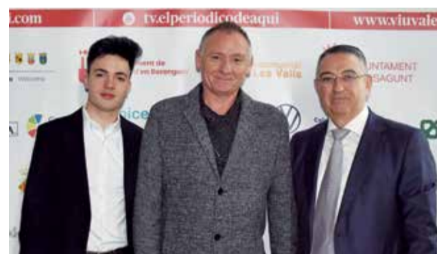
Varios instantes del photocall de los XI Premios de El Periódico de Aquí en el Camp de Morvedre.