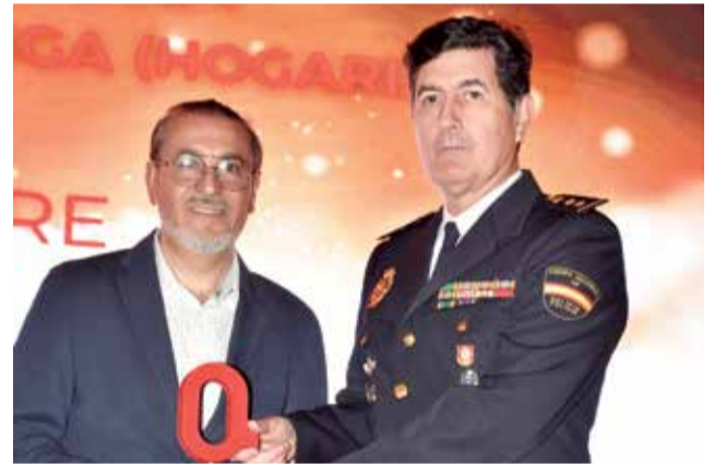
Comisario de la policía nacional, a Club de Lluita.