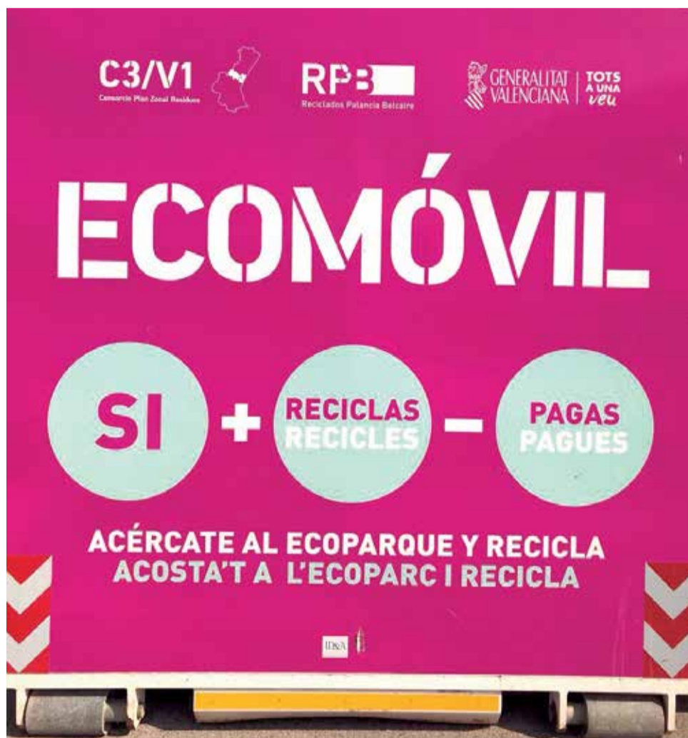
Campaña de reciclaje Ecomóvil promovida por el Consorcio Palancia Belcaire.

Este año el donativo irá destinado al proyecto denominado In-Sostenible, Camí hacia la sostenibilitat, de la entidad Fons Valencià para la Solidaritat, que tiene como objetivo divulgar los ODS a los municipios consorciados, incidiendo principalmente en el ODS 12: Producción y Consumo Responsables.