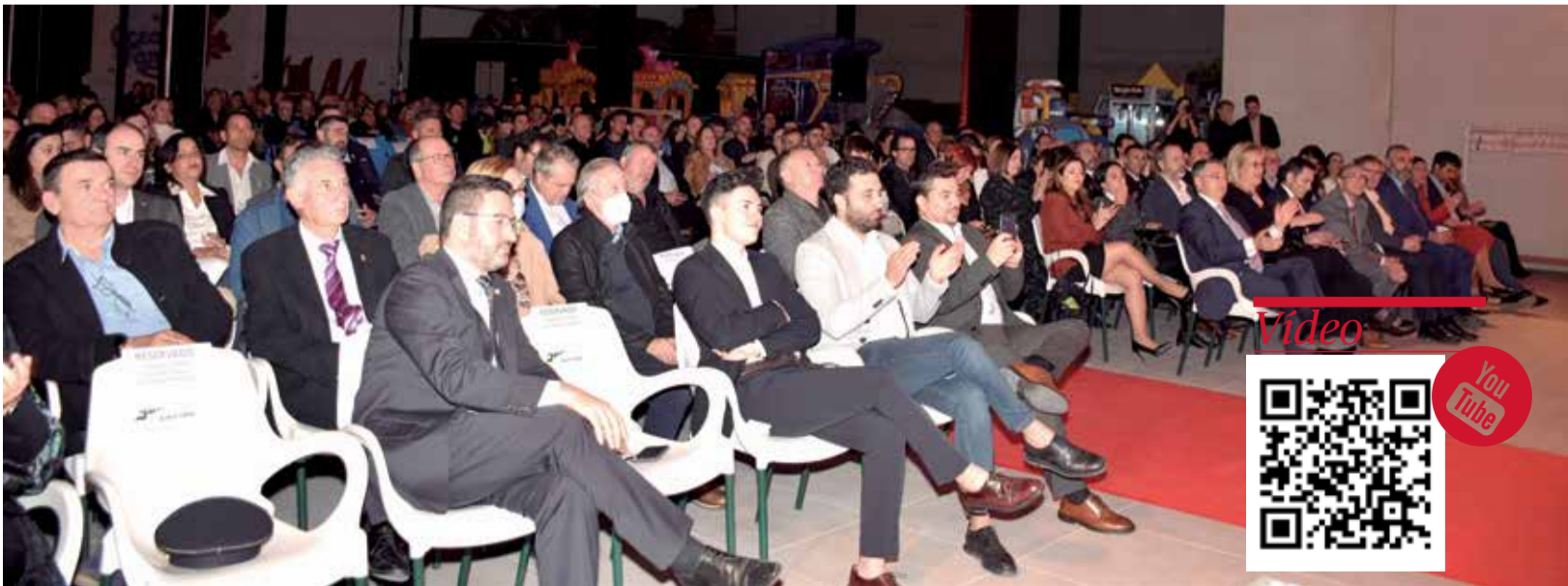
Un momento de la gala durante la entrega de premios.

Coincidiendo con que la gala tuvo lugar en la semana