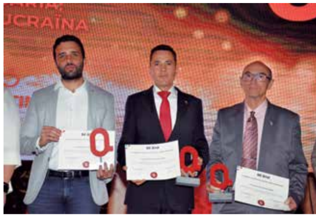
Premio a la 'Casa Solidaria'.