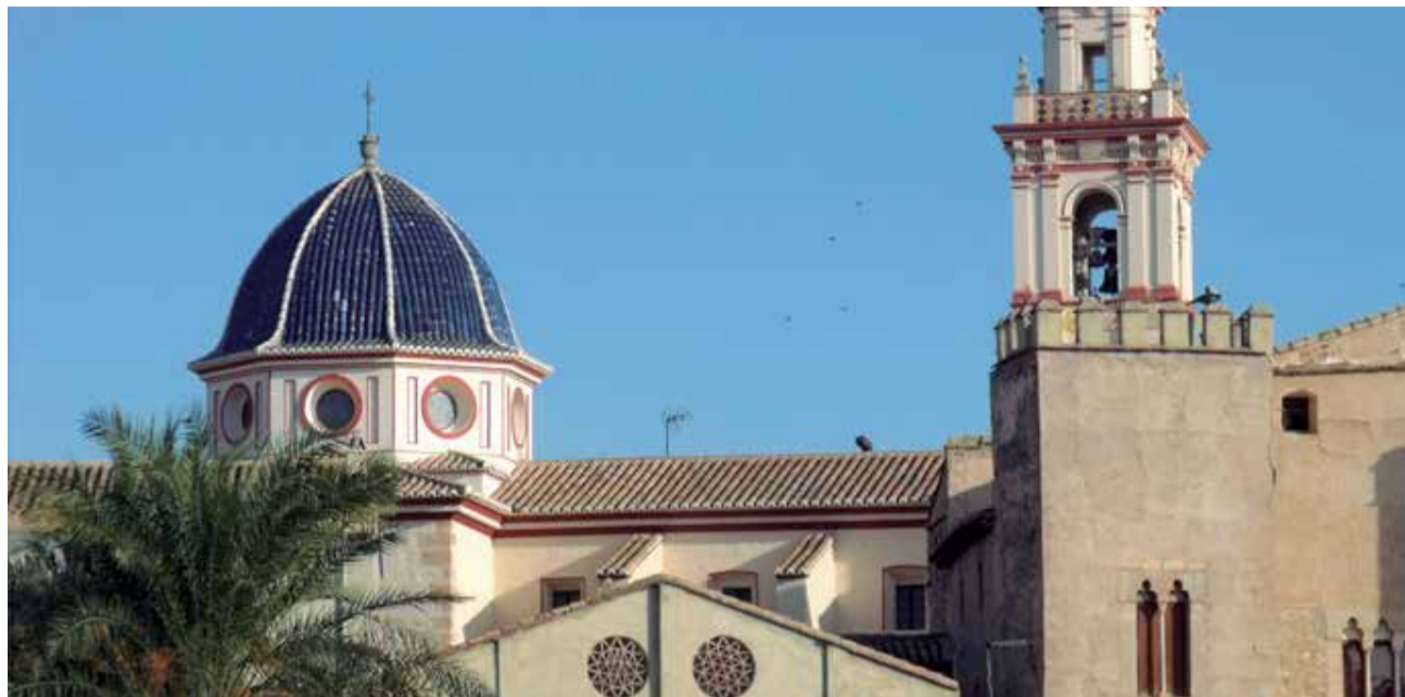
Església d'Albalat dels Tarongers.