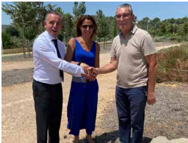
Representants de Dourdan i l'alcalde de Montserrat.

El 24 pel matí es va fer una reunió a la Casa de la Cultura, a la qual van assistir representants de l'equip de govern, membres dels dos Comitès d'Agermanament i membres de la direcció de l'IES Alca-