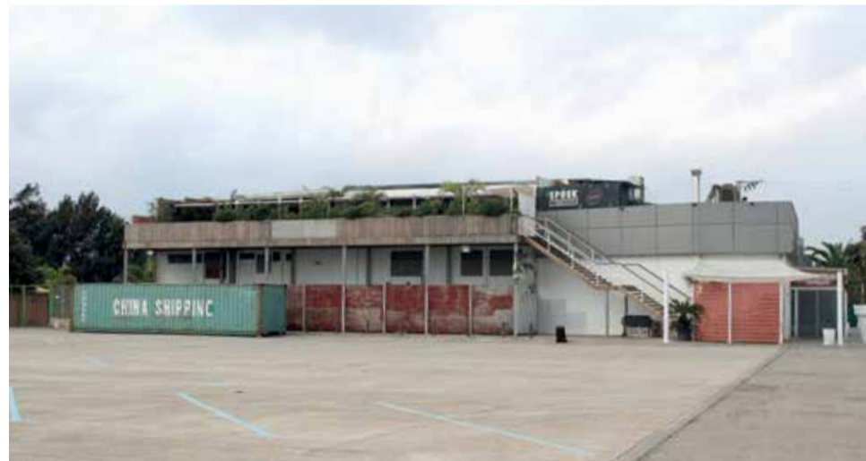
Estado actual de la discoteca Spook.