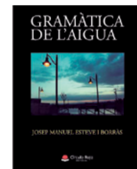
'GRAMÀTICA DE L'AIGUA'