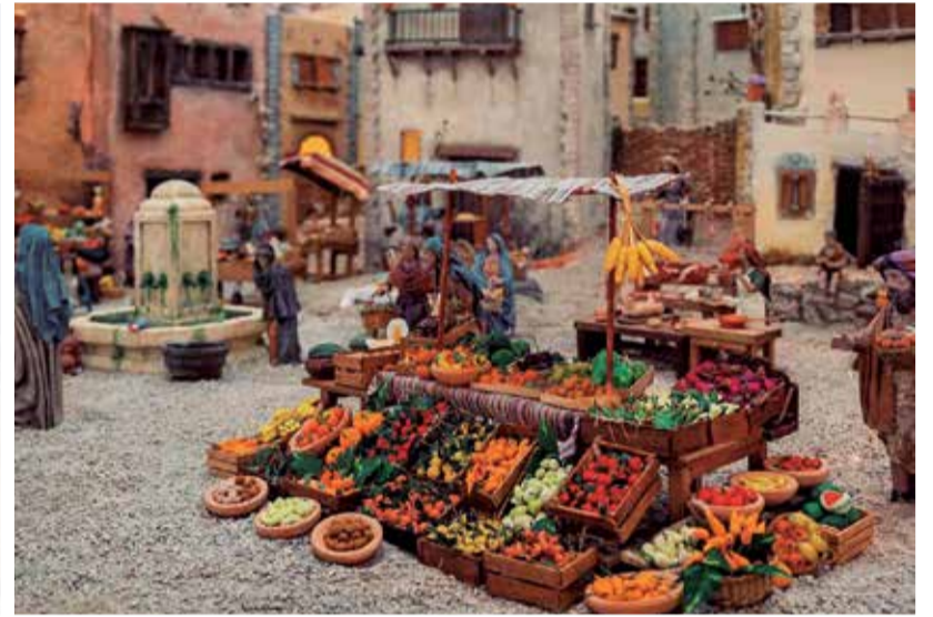
Belén del Mercado Central de Valencia.