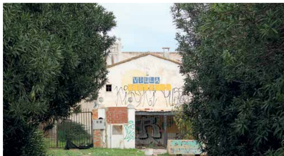
La abandonada Villa Adelina. / LAURA FLORENTINO

mo la atracción de gente conflictiva, ocasionan cada vez más problemas de peleas y mal ambiente. Muchos de los trabajos de puerta de discotecas se les empieza a encomendar a individuos agresivos