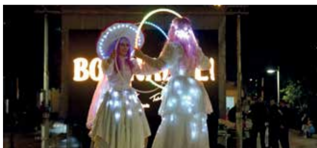
Benvinguda al Nadal.

municipi amb un got de xocolata calent i un tros de l'emblemàtica mona d'Alberic. Tot seguit al berenar era moment d'encendre les llums, però el so de la música nadalenca avançava una sorpresa: la presència de dos àngels que, pujades en zancos, oferien a les persones assistents un espectacle lluminós de