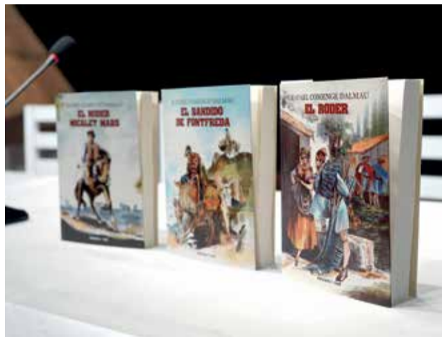
'El Roder' de Rafael Comenge Dalmau.

Amb un any que ha estat ple d'activitats com ara xerrades, conferències, actuacions teatrals al carrer, exposicions, etc., les veïnes i veïns d'Alberic han tingut l'oportunitat, este 2022, de descobrir més sobre la figura de Rafael Comenge Dalmau. Una de les persones més influents en l'àmbit polític i social nascudes en este poble riberenc que, fins i tot, dona nom a un dels col·legis d'Alberic: CEIP Rafael Comenge. El passat divendres 25 de novembre, el Teatre Liceu ac-