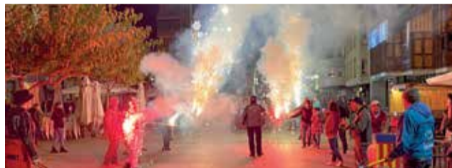
Durant la Passejada en Foc de Benifaió.

Benifaió vivió el pasado sábado 3 de diciembre una Noche de Fuego con la "Passejada en honor a la patrona Santa Bàrbara". Un acto organizado por Las Peñas El Coet y El Xiflec, con la colaboración del Ayuntamiento de Benifaió, Clavarios