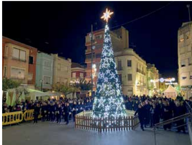
Decoración de Navidad en Benifaió.

juntos demos la bienvenida a la Navidad con el encendido de las luces, este año cómo ya es costumbre de la mano de la ganadora del concurso escolar de postales navideñas".