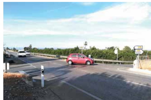
La carretera que uneix Alzira i Corbera.