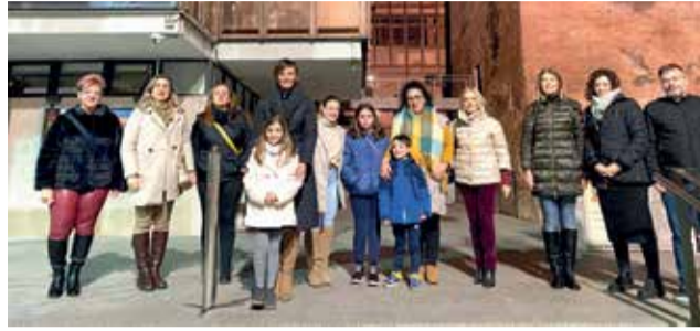
La corporación con la ganadora de la postal.