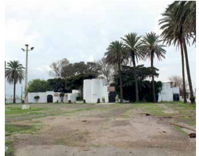
Discoteca Heaven en El Perelló, actualment en funcionament.