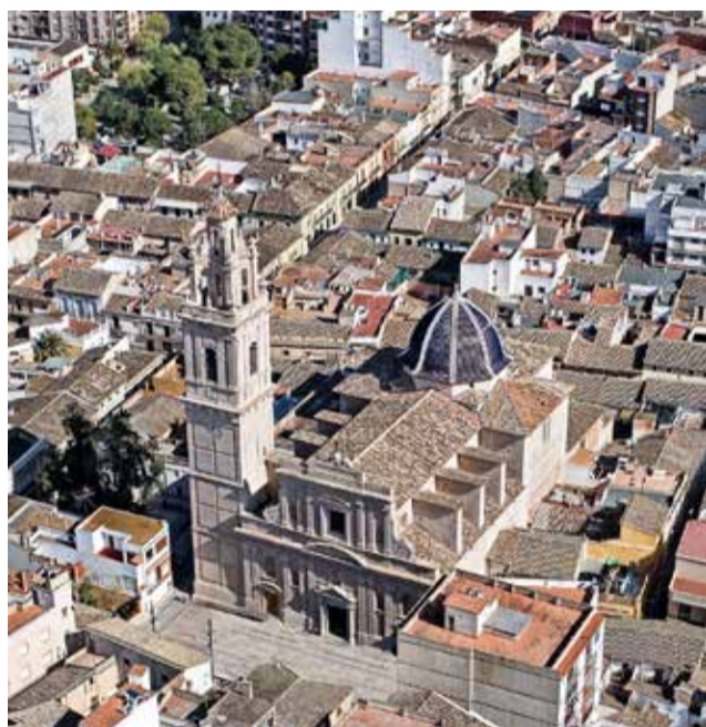
La localitat de l'Alcúdia.