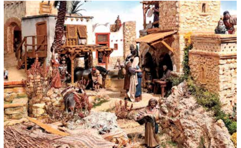
Miguel Alcocer monta el belén de la parroquia de de Llíria.

ca de todos esta divertida y entretenida actividad. Uno de los ejemplos es el caso de Carcaixent, cada Navidad montan esta puesta en escena de manera tradicional para atraer las miradas todas sus vecinas y vecinos y hacer que disfruten de un pasatiempo en familia con los más pequeños.