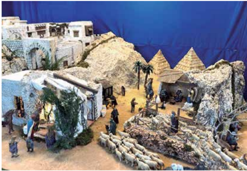
Belén tradicional de la localidad de Carcaixent.

En el caso de la comarca de la Ribera son muchas las localidades que buscan recrear el mejor Belén y estar en bo-