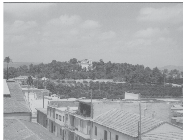
La Muntanyeta de Alberic.

► Uno de los proyectos que me gusta destacar es