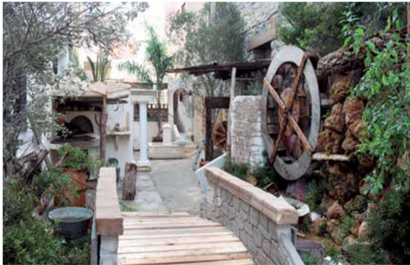
Belén tradicional de Altura.