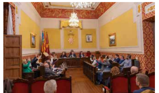
Aprovació dels pressupostos a Cullera.

"Esta corporació treballa molt, ens movem, truquem a moltes portes i portem recursos al nostre poble", ha declarat Mayor. La partida pressupostària destinada a Serveis Socials puja també per huiet any consecutiu. Un increment que afirma Cullera com el municipi líder en inversió social per habitant de la Comunitat Valenciana i un dels primers de tota Espanya. I tot això mantenint els impostos congelats.