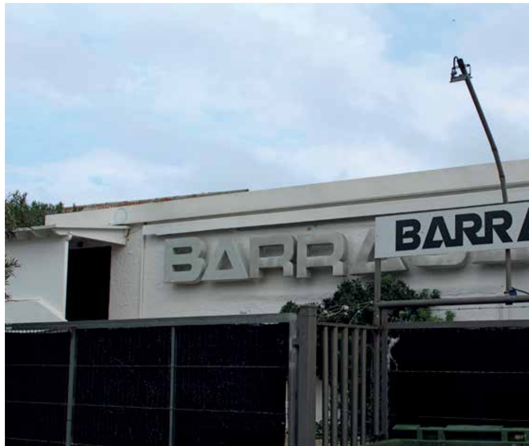
La discoteca Barraca, actualmente en uso.

La pérdida de pureza de la droga y otros factores, co-