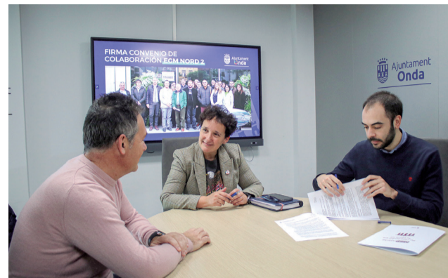
Firma del convenio en el Ayuntamiento.