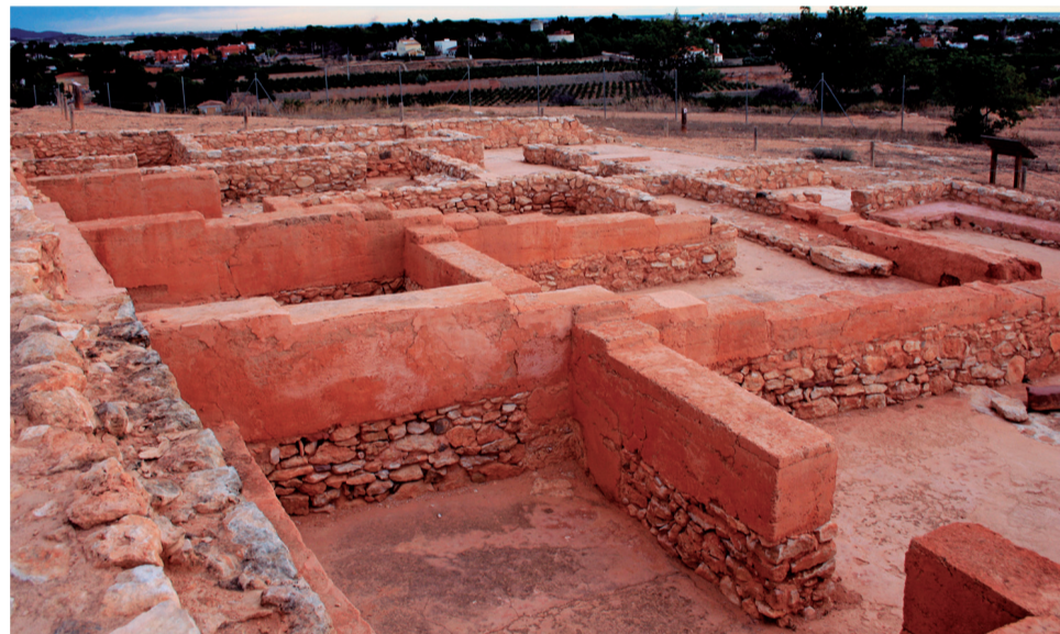
Yacimiento del Tòs Pelat de la ciudad de Moncada.

En la comarca de Camp de Túria, se pueden encontrar vestigios de los íberos, como es el caso de El Puntal dels Llops. Se trata de un poblado del siglo V a. C. situado en plena Sierra Calderona, en el término municipal de Olocau.