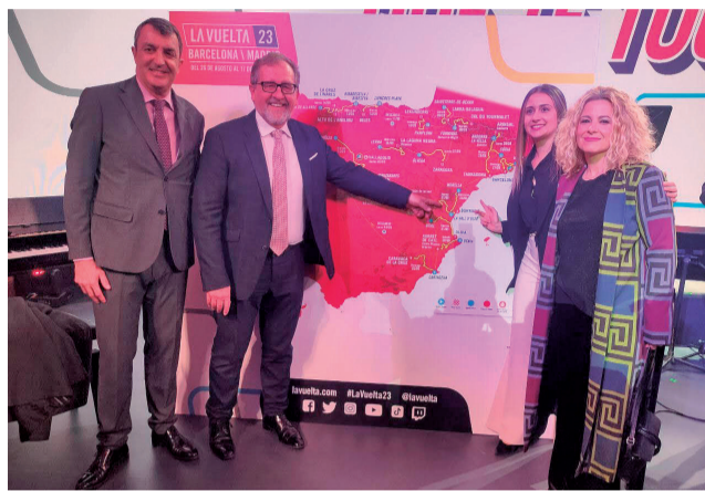
Presentació de 'La Vuelta 23'

L'organització de 'La Vuelta 23' explica que la de Morella és una sortida inèdita que es produeix "en una mar de muntanyes on destaca destaca l'imponent castell que corona el pujol sobre el qual se situa la localitat, la posició estratègica de la qual va ser aprofitada per diferents civilitzacions".