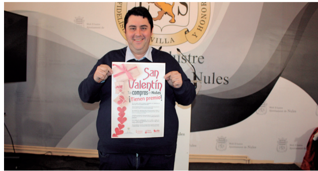
El alcalde de Nules presenta la campaña.

ra las pequeñas empresas. Además, su funcionamiento es muy sencillo y accesible para todos aquellos vecinos que apuesten por realizar sus compras en los establecimientos de la población y así apoyar la economía local.