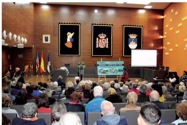
Presentación del proyecto ante los vecinos.

► El área de Contratación del Ayuntamiento de Almassora ha propuesto la adjudicación a la empresa Eiffage Energía Sistemas para la adecuación del local de Fátima y su conversión en oficinas vecinales por valor de 159.985,21 euros.