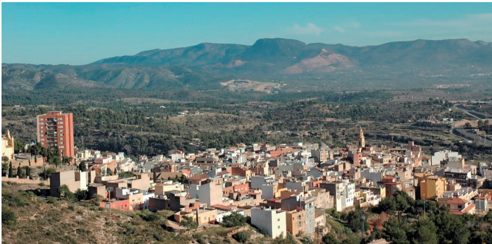
Vista panoràmica del municipi de l'Alcora.