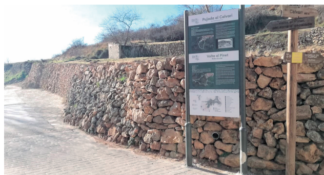
Nous panells a la localitat de Vistabella.