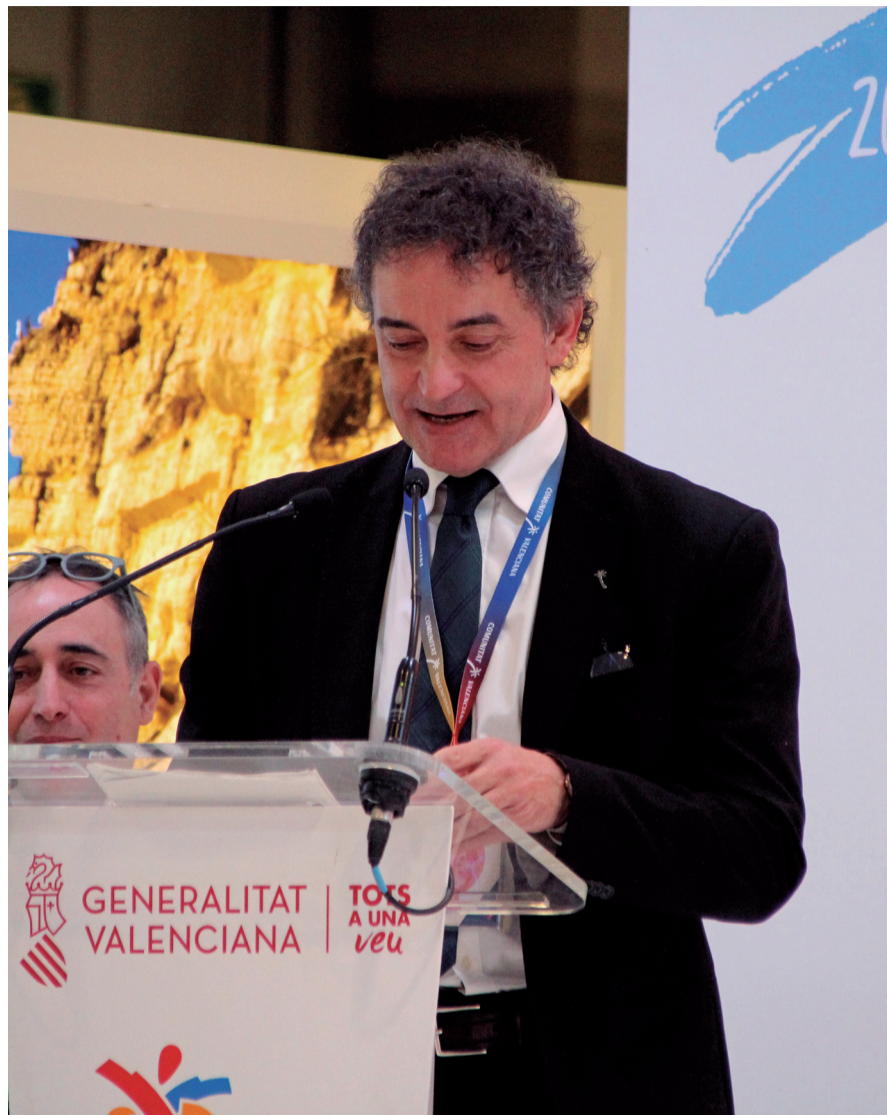
Francesc Colomer en Fitur 2023.

► Nosotros no somos de dar grandes cifras, ni de contar cabezas, pero las cifras nos muestran una recuperación muy positiva, con datos ya muy similares a los de 2019 (el último año completo en condiciones normales antes de la pandemia). Hemos sabido recuperar a los turistas internacionales, que han superado los 8 millones y que realmente mostraron un comportamiento muy fiel incluso en los peores momentos. Nunca dejaron de seguirnos a través del mercado online ni de tenernos presentes en sus búsquedas. Además el mercado nacional, y el doméstico, se ha visto también muy re-