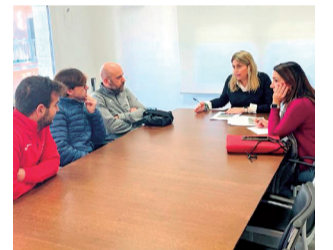
Reunión dirección.