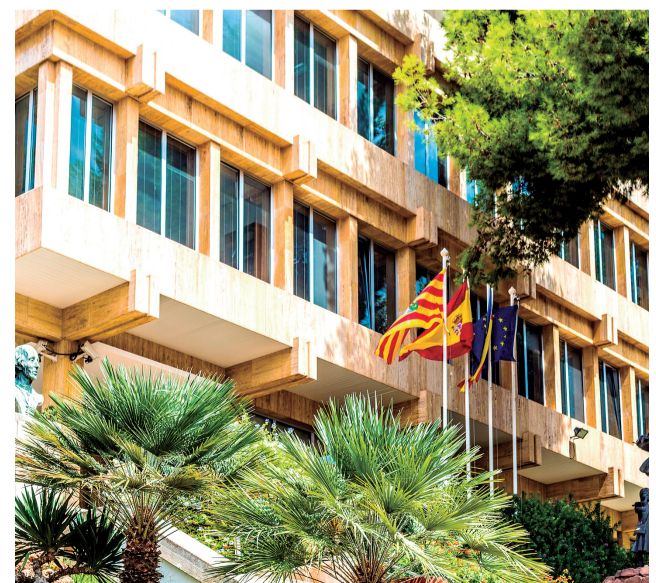
Ayuntamiento de Benicàssim. / EPDA

poración de remanentes en el mes de marzo. Estas iniciativas, una vez evaluadas técnica y económicamente, serán cubiertas por los remanentes de tesorería que estará activo a partir del mes de marzo. Se podrán presentar ideas asociadas a cualquier ámbito de actuación de competencia municipal, cada propuesta deberá ser presentada en un único formulario. Recibidas las propuestas, serán valoradas tanto técnica como económicamente por parte de los servicios municipales para concluir su viabilidad.