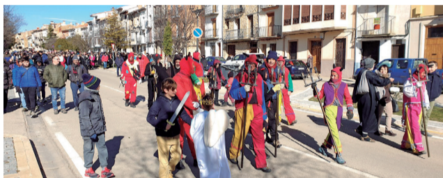
Vilafranca viu les festes de Sant Antoni.

intentar frenar la seua entrada perquè no es vestira la barraca. Després de la representació de la vida del Sant i del sàinet 'Tot el que relluis', va arribar l'encesa de la barraca a la qual no va faltar la Diablera.