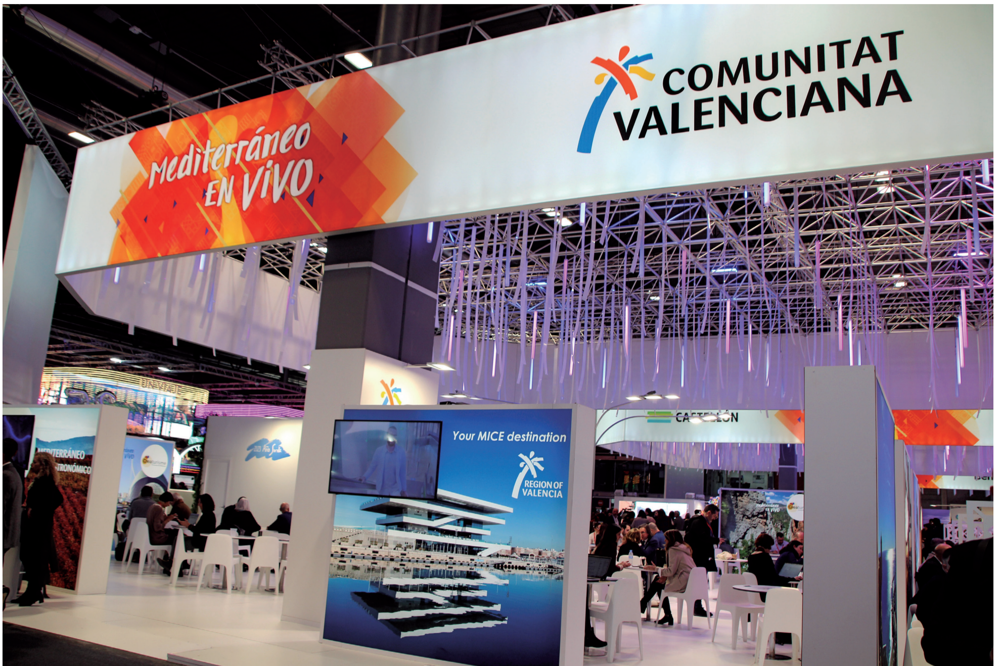
Stand de la Comunitat Valenciana en Fitur.