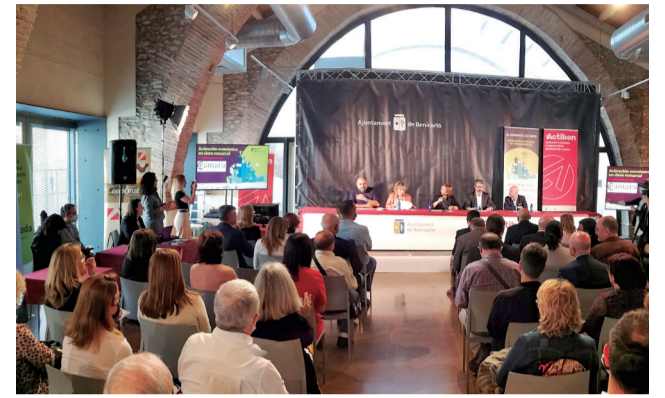
Jornada empresarial en Benicarló.