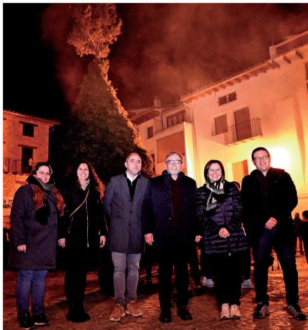
La Santantonà de Forcall.