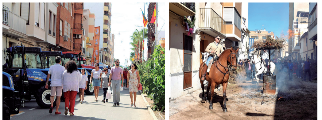
Diferentes instantes de las Fiestas de Interés Turístico, así como la plaza mayor.