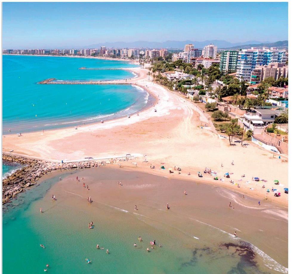
Vista general de la playa de Benicàssim.

► La voluntad del grupo Popular ha sido mantener una estabilidad en esta legislatura, pero las continuas faltas de respeto notorias hacia nuestro grupo por parte de Ciudadanos, las deslealtades hacia el equipo de gobierno del