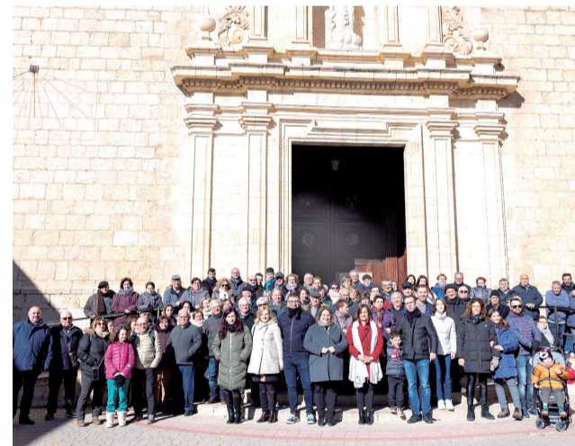
Jornada d'unió i amistat en Sant Antoni.

Paüls i Albocàsser també comparteixen passat càtar. De fet, des d'Albocàsser s'està empenent, des de fa uns anys, l'itinerari Cultural Europeu Camins dels Càtars que recorre mitja Europa seguint els camins migrants dels càtars. "La intenció és que Sant Pau siga la capital de l'itinerari.