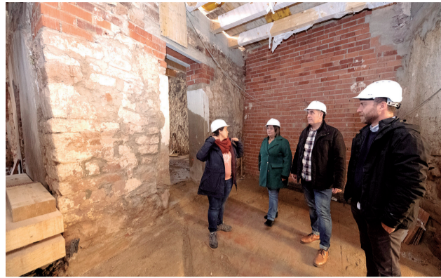
Visita de la diputada de Cultura.