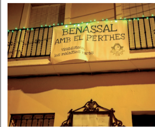
Ajuntament. / EPDA