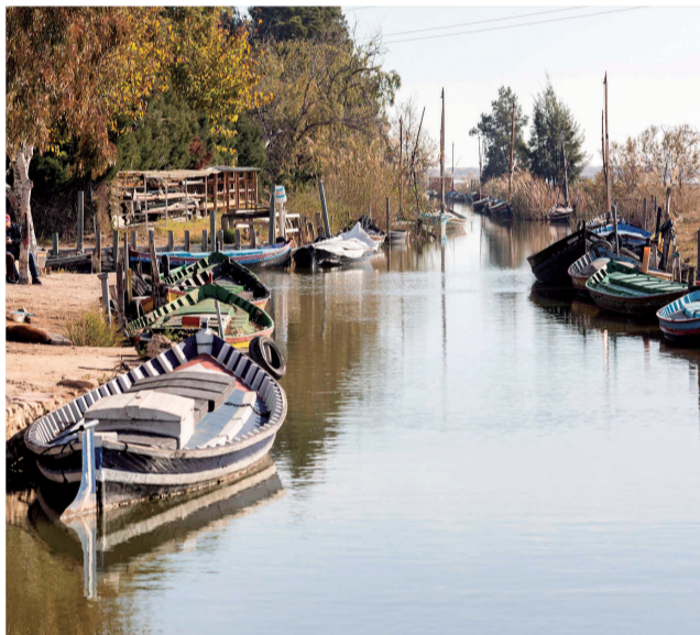
El Parque Natural de l'Albufera.

La primera de las visitas está prevista para este sábado 28 de enero y continuarán una cada mes, excep-