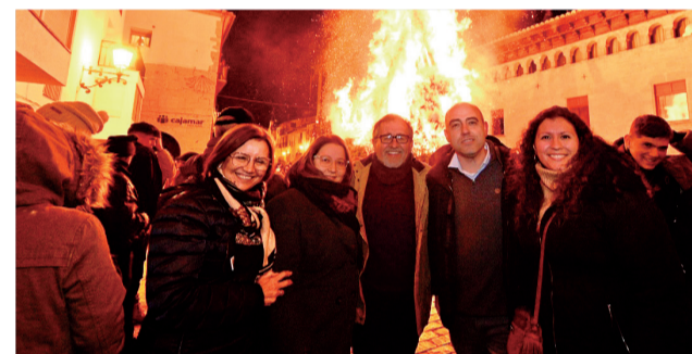
La Santantonà de Forcall.