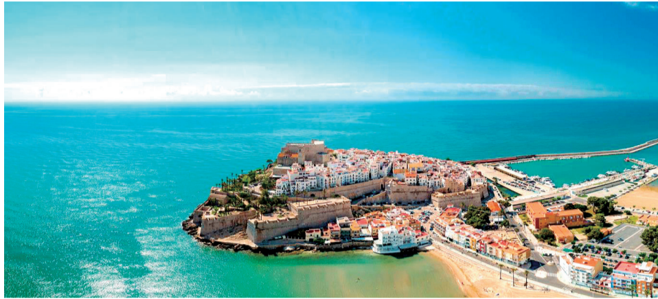
General de la playa y la ciudad de Peñíscola.

Así pues, la delegación peñiscolana participó en el acto de bienvenida a nuevos asociados que llevó a cabo la SFC en el auditorio central de este espacio en feria, donde se celebró la implantación de la entidad en todas las comuni-