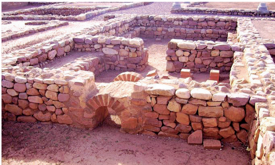
Villa Romana de Benicató, un yacimiento ubicado en la localidad de Nules.

Cada vez son más los municipios de la Comunitat Valenciana que optan por dar a conocer su riqueza patrimonial mediante atractivas propuestas que van desde visitas guiadas a rutas teatralizadas que trasladan al visitante a otros momentos de la historia. A continuación, se han seleccionado algunas de estas iniciativas que se realizan en distintos municipios de las comarcas valencianas.