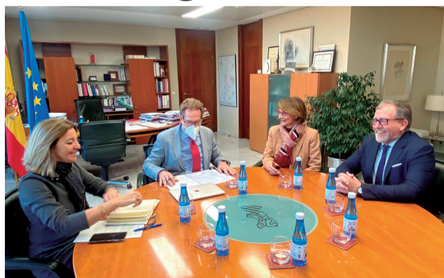
Reunió entre les tres institucions.

Superar amb èxit l'exigent procés de certificació que correspon a l'Institut de Salut Carles III, dependent del Ministeri de Ciència i Innovació, comporta entrar en l'elit de la investigació biomèdi-