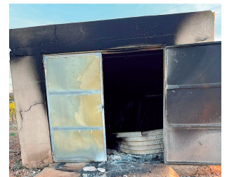
Caseta quemada.