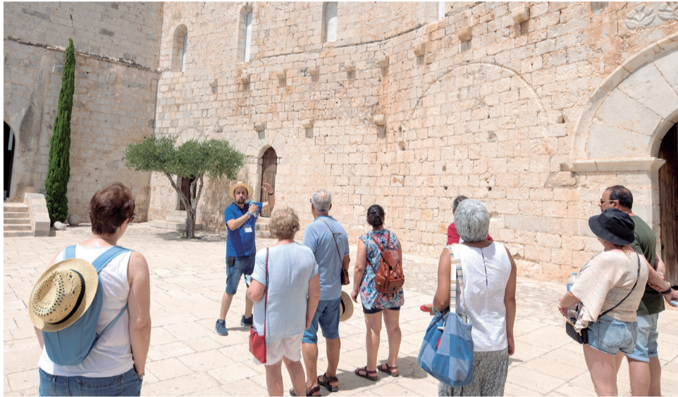
Los turistas visitan el Castillo del Papa Luna de Peñíscola.