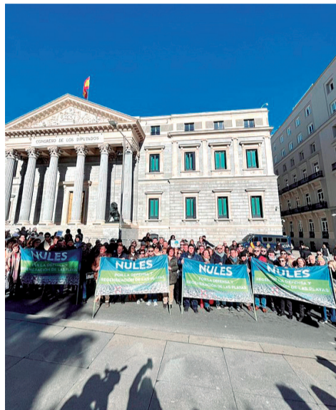
Manifestación en Madrid.

Después de muchos años de protesta, más de 40 poblaciones de todo el país alzaron la voz en Madrid para que la situación de la costa cambie de forma inmediata. El Ayuntamiento de Nules consiguió movilizar un total de cuatro autobuses, siendo el municipio que más gente acudió a la manifestación.