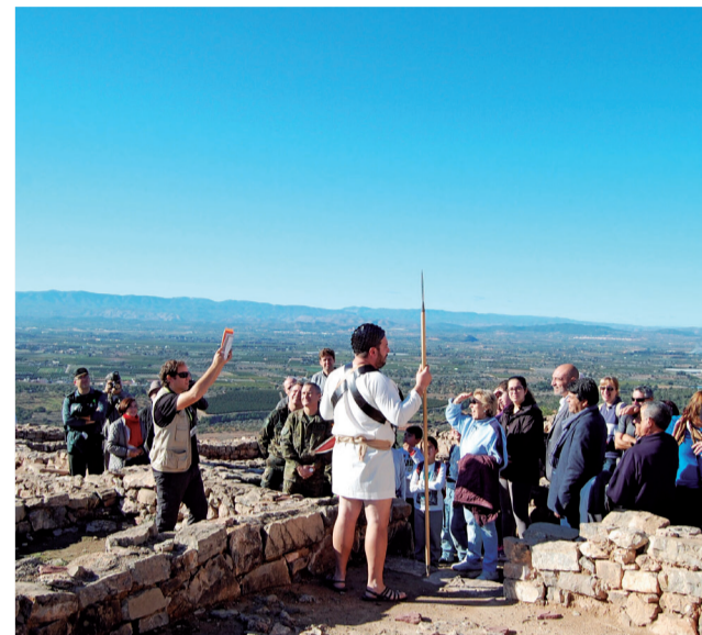
Vestigios íberos de El Puntal dels Llops. / EPDA