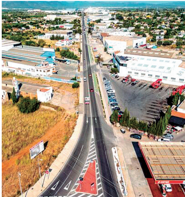
Antiguo polígono de la carretera de Onda.

El Ayuntamiento de Vila-real dio luz verde el pasado mes de octubre al nuevo PAI del clúster de la innovación cerámica en una sesión plenaria en la que, además de aprobar