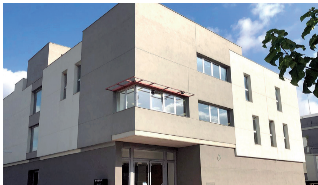
Edificio social de Santa Magdalena.

La localidad de Santa Magdalena, según ha avanzado el