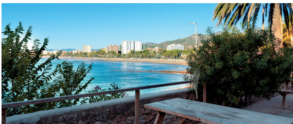
Vista panorámica de la playa de Benicàssim desde el mirador.