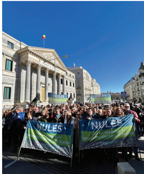
Manifestación en Madrid.