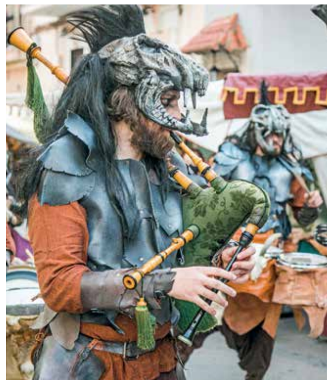
Diferents instantànies del Mercat dels Borja de Llombai.