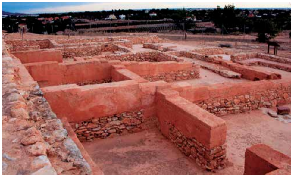
Yacimiento del Tòs Pelat de la ciudad de Moncada.

Cada vez son más los municipios de la Comunitat Valenciana que optan por dar a conocer su riqueza patrimonial mediante atractivas propuestas que van desde visitas guiadas a rutas teatralizadas que trasladan al visitante a otros momentos de la historia. A continuación, se han seleccionado algunas de estas iniciativas que se realizan en distintos municipios de las comarcas valencianas.