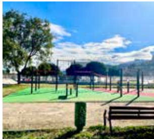
Calistènia a Corbera.