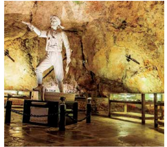
Cueva del Dragut de Cullera.