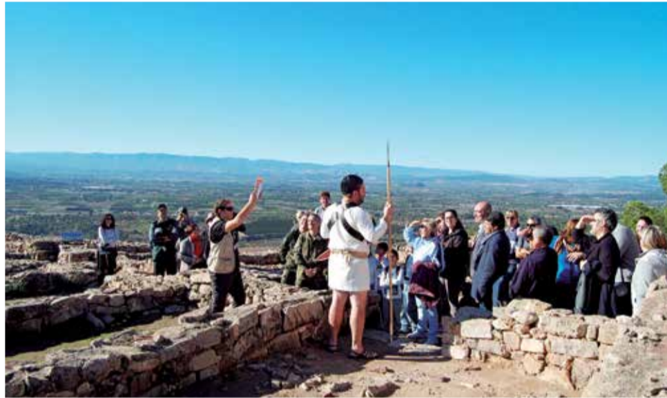
Vestigios íberos de El Puntal dels Llops en el término de Olocau.

El Tòs Pelat estuvo ocupado desde el siglo VI al IV a.C. La ciudad u oppidum tuvo una extensión de 3 hectáreas y en ella pudieron llegar a vivir unas 600 personas. Aunque queda mucha superficie para excavar se sabe que hubo calles y plazas y que, en el barrio de