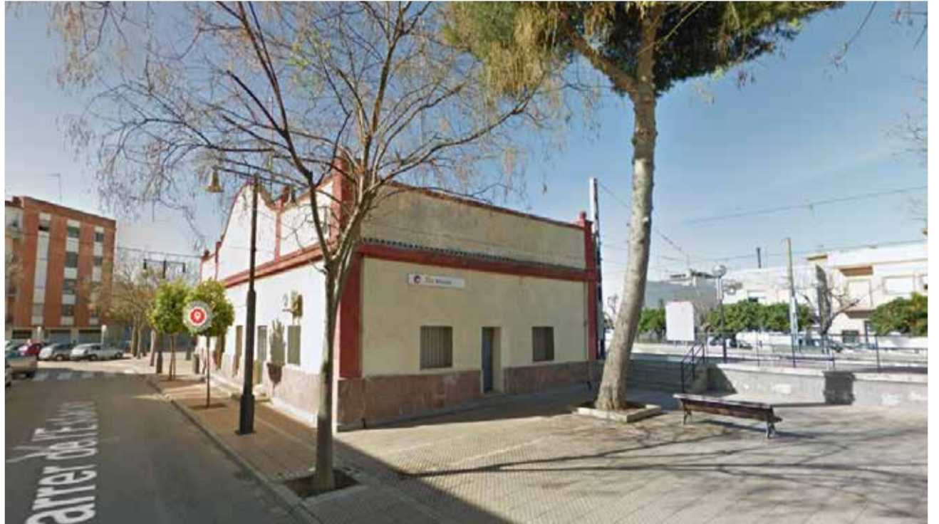
Estació de Metrovalencia de l'Alcúdia.

teix. Esta actuació facilitarà el creuament de les vies a les persones amb mobilitat reduïda, així com a aquelles que duguen carros de bebè o de compra. Esta accessibilitat és una reivindicació antiga del poble de l'Alcúdia.