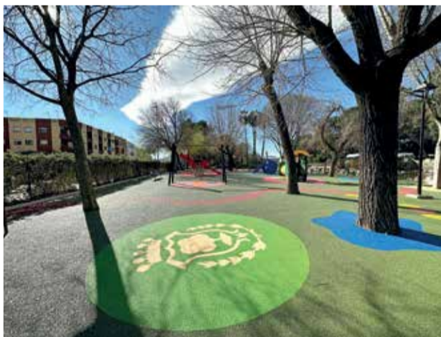
Algunes de les actuacions als parcs infantils.