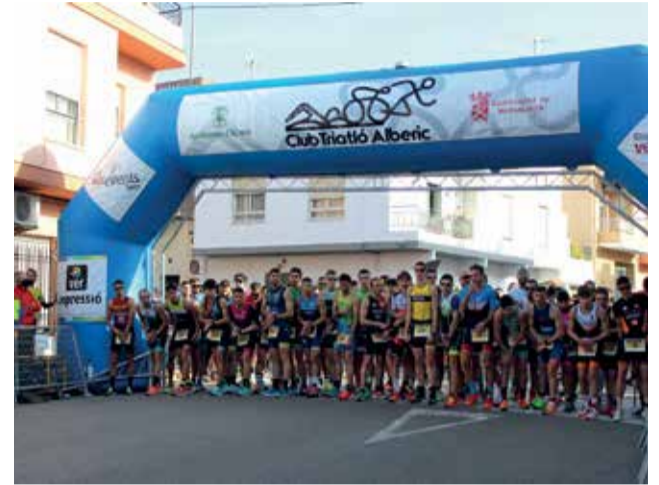
Club Triatló d'Alberic.

Abans de passar el testimoni al següent company, cadascun dels participants haurà de completar 2.000 metres de carrera a peu, 6 quilòmetres de ciclisme i