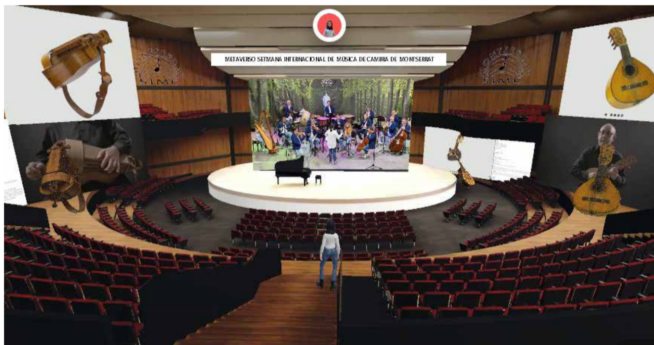
Imatge digitalitzada de la "Setmana Internacional de Música de Cambra de Montserrat".

Davant del repte, l'administració local, posà a la seua disposició tota la maquinària administrativa. Han estat molts treballadors i treballadores als que cal agrair el seu esforç i de vegades paciència resoluciva, des del departament d'intervenció fins als operaris d'obres, qui han fet possible que en 2023 es puga celebrar la 42 edició del Festival. En 1996 la direcció artística de la SIMC passa de