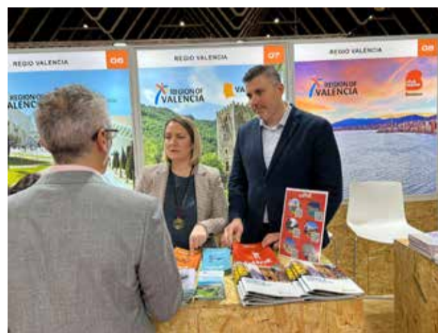
Fira de turisme a Països Baixos.

Cal assenyalar que el mercat dels Països Baixos està en alça i que hui dia és un dels principals emissors de turis-