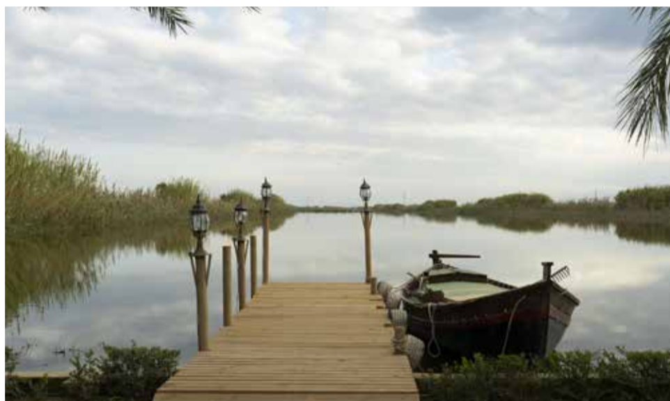
El Parque Natural de l'Albufera es una explosión de biodiversidad y paisajes.

del primer barroco valenciano, dejando su huella en la Catedral de Valencia entre otras. Es la estancia más exquisita de la Iglesia Parroquial San Juan Bautista, que junto al Convento de Carmelitas Descalzas, la ermita del Socós o la vetusta Torre de Anibal o del Molino, ade-