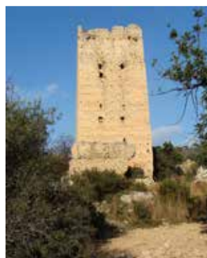
Torre Aledua.