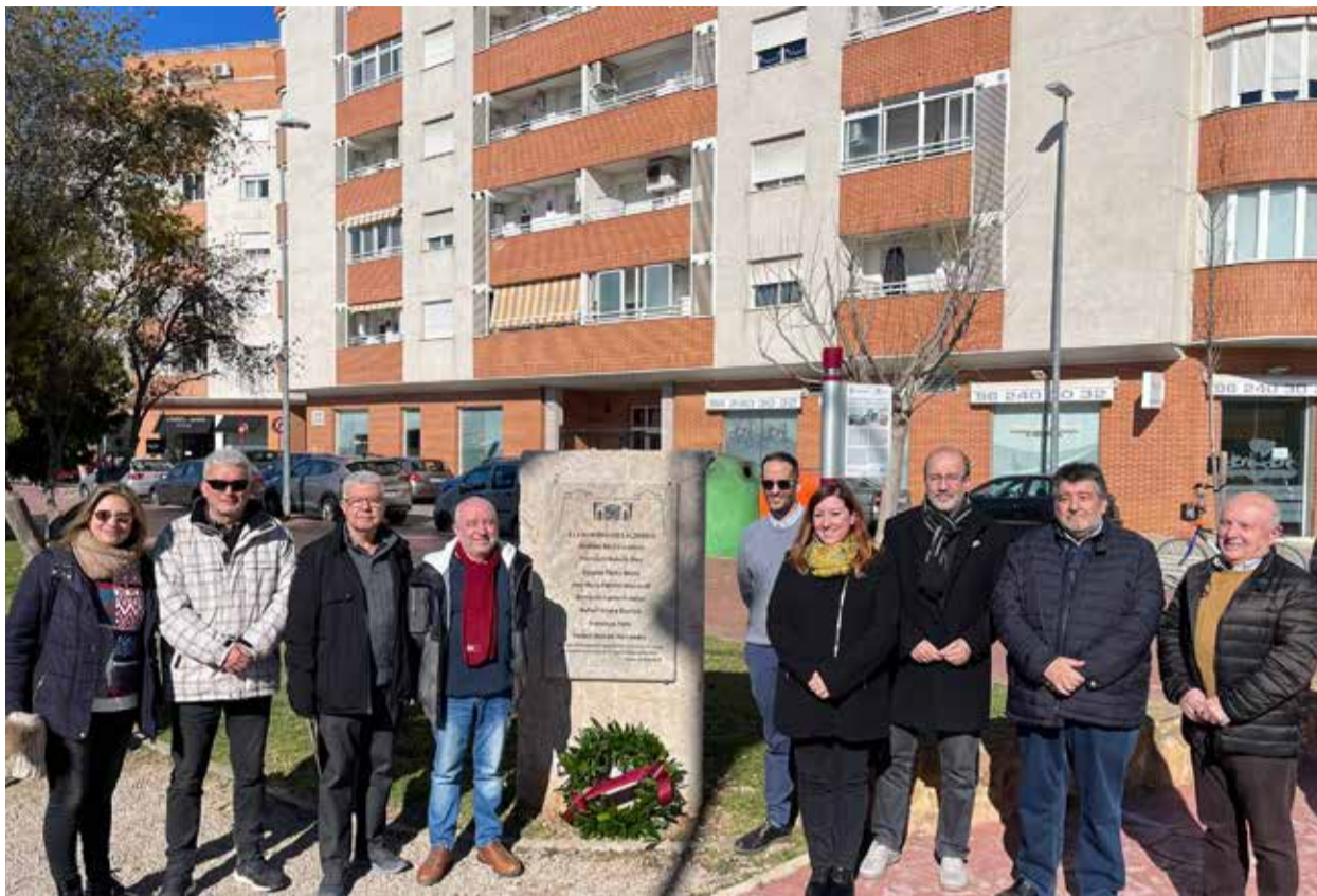
Representants municipals junt al memorial per a les víctimes alzirenys de l'holocaust.

Volem honrar en este acte la memòria de totes les persones deportades i, particularment, la dels alzirenys que lluitaren ací i fora de les nostres fronteres per no perdre primer i per recuperar després la demo-