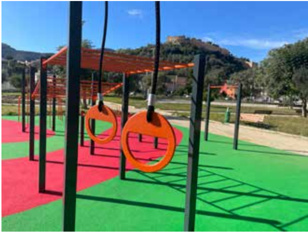
Les noves instal·lacions de calistènia a Corbera.