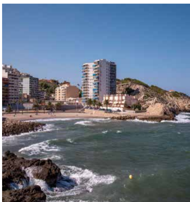
Vista aérea de Cullera.