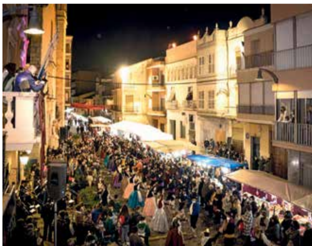
Diversos moments durant la Fira a Guadassuar.