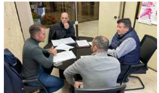
Reunió amb el club de Tir Olímpic.

A més de tractar el tema del memorial, els membres del club han presentat a l'Ajuntament el projecte per a l'ampliació i millora de les instal·lacions del club. Destaca a este projecte la creació d'una pista homologada de tir pneumàtic o aire com-