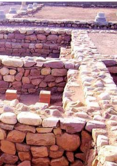
en la localidad de Nules.