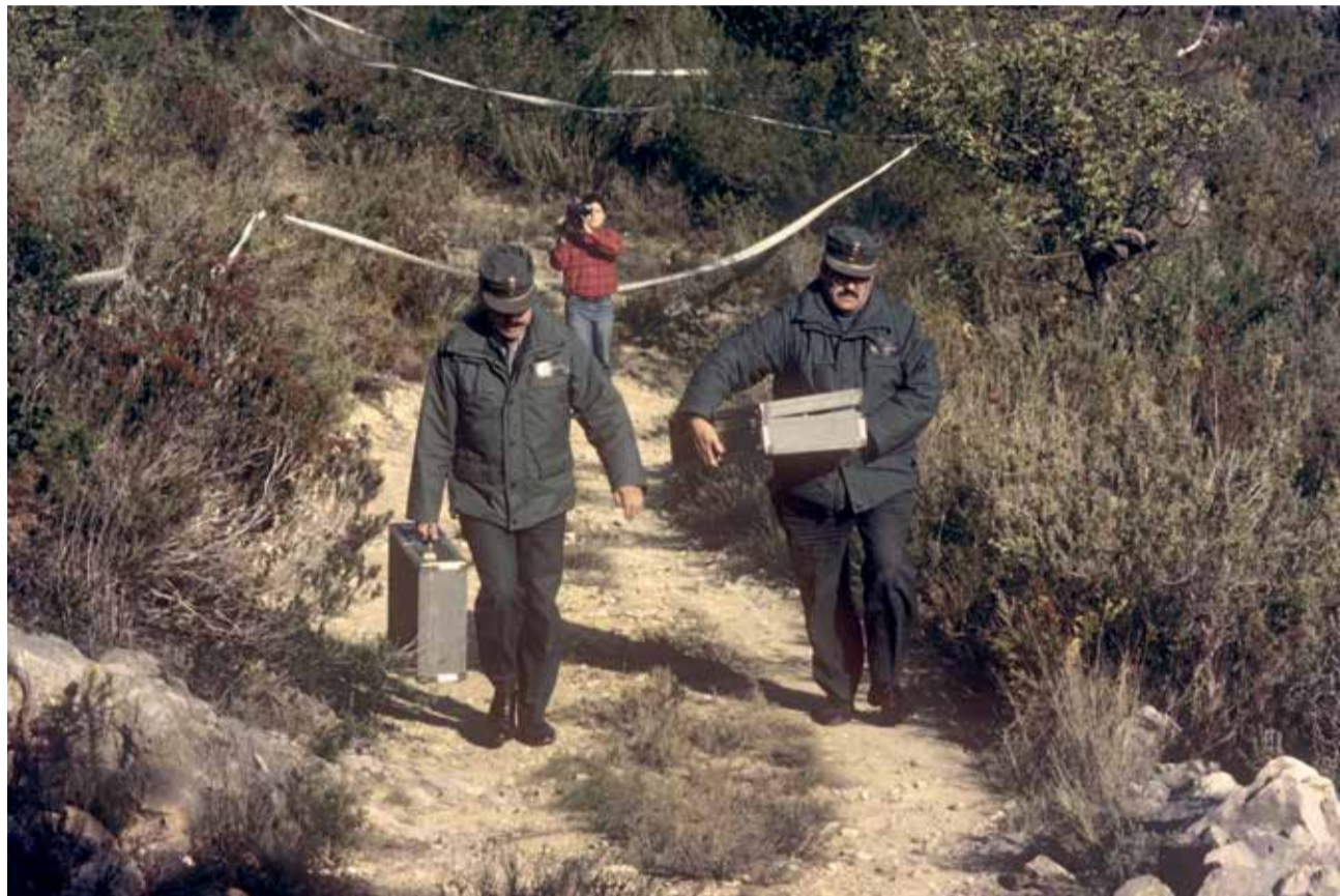
Miembros de la Guardia Civil recogen los restos encontrados junto a la fosa excavada en Tous.

22.05.2011/ Ricart habría cumplido su pena. Sin embargo, la Audiencia de Valencia acuerda aplicarle la doctrina