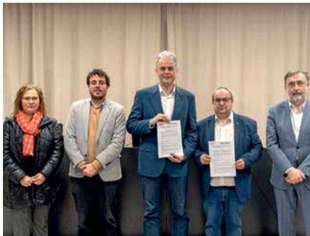
Tras la firma del convenio.

Por su parte, el presidente de la Mancomunitat ha destacado este convenio que "refuerza la oficina que lleva