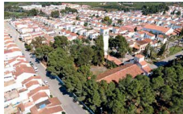
Vista aèria de Tous.