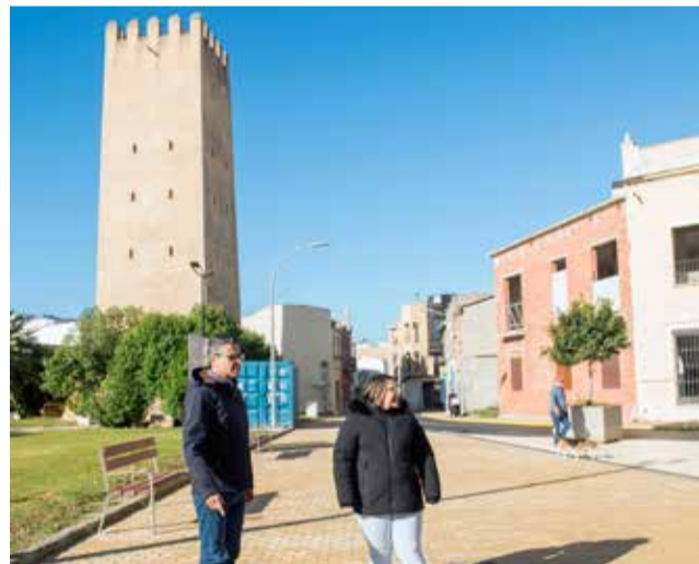
Plaça Major d'Almussafes.

Després de dos mesos i mig d'obres, la plaça Major d'Almussafes, principal eix del centre històric de la població i integrada en el PERI Pla Especial Torre Racef, estrena aquesta setmana nova imatge. L'executiu local acaba de donar per finalitzada la intervenció urbanística, que ha incorporat la remodelació de la vorera, l'eliminació tant de l'aparcament com de la illeta central i l'accessibilitat de la plaça on se situen la torre àrab i l'església parroquial Sant Bartolomé, dues dels principals monuments històrics de la localitat. Un pressupost de 57.051 euros, cofinançat amb la subvenció de 50.000 euros amb càrrec al Pla d'Inversions per al bienni 2020-2021 de la Diputació de València i la resta de l'import, 7.000 euros, amb fons propis, ha permès executar la totalitat del projecte, adjudicat a