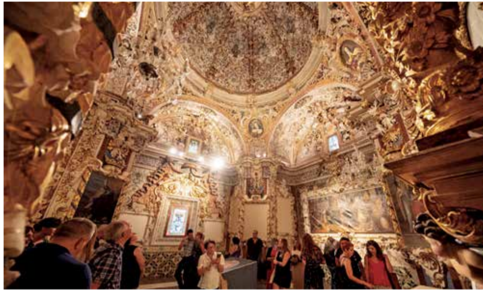
Capilla barroca en el municipio de Caudiel.