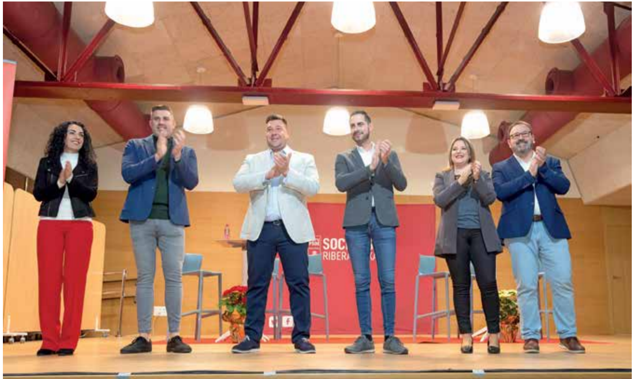
Diferentes representates políticos durante la presentación de su candidatura.

► Es un reto muy complicado, ya que ha día de hoy somos la fuerza con menor representación, de todos modos, aceptamos el reto y trabajaremos muy duro para intentar revertir la situación.