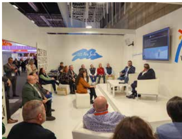
Diferentes instantes de las presentaciones de Cullera en la feria de turismo, Fitur.

las empresas no han obtenido los resultados económicos que esperaban debido al alza de los precios y la inflación derivados todos ellos de la guerra en Ucrania podemos decir que este récord nos da mucho empuje de cara a este 2023 y esperamos que los datos se consoliden y mejoren".