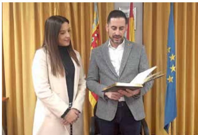
Diferentes momentos de la visita de Carlos Fernández Bielsa junto a la alcaldesa Vanesa López.

“Agradecemos a la Diputación de Valencia su atención a todas las necesidades de nuestro pueblo y por todas las inversiones económicas que están depositando en municipios como este y así frenar la despoblación que sufrimos”, indicaba el consistorio.