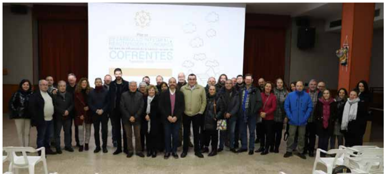
Participantes y asistentes a la jornada de Cofrentes.

cese de actividad de la Central Nuclear de Cofrentes.