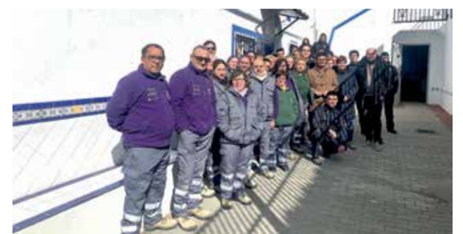
Alumnado del taller de empleo.

sarrollará varias líneas de actuación, entre ellas la mejora de la parcela del propio centro formativo municipal donde se incorporará un túnel invernadero además de tareas de conservación de arbolado y jardinería en diferentes zonas de Utiel y pedanías.