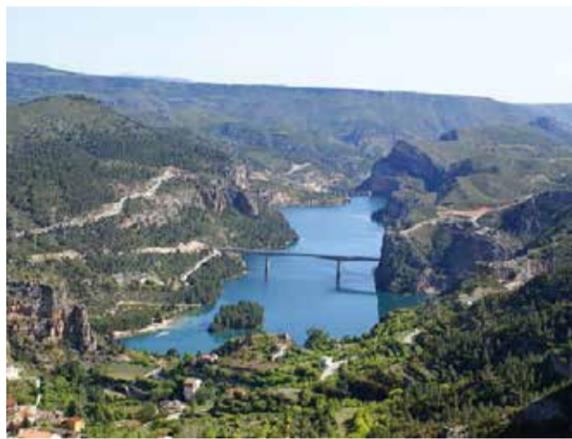
Cortes de Pallás.

En función de la población y con criterios correctores en favor de los ayuntamientos con menos recursos, el reparto en la comarca dejará 260.000 euros en Chiva, con una población cercana a los 16.000 habitantes; 200.000 en Buñol, con 9.500 habitantes; y 195.000 en Cheste, con