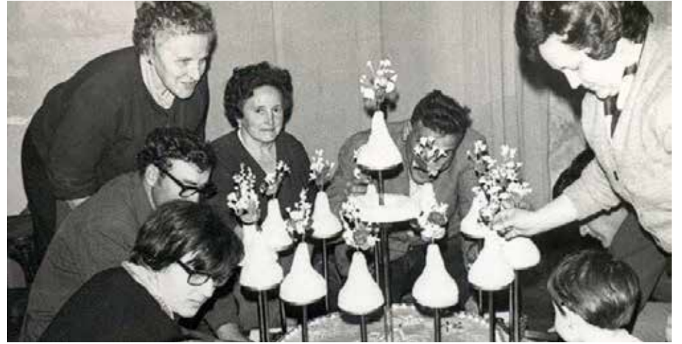
Instantánea antigua de la Candalaria.