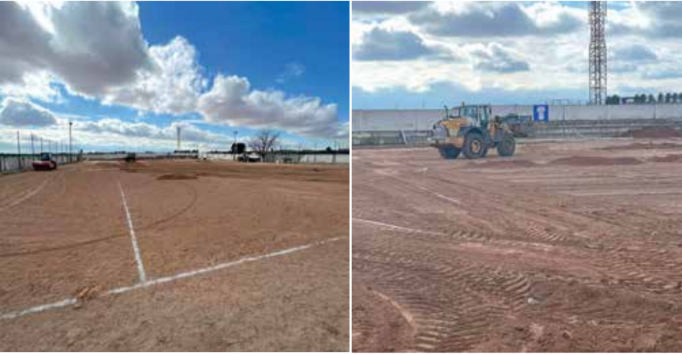
Obras en las instalaciones del campo de fútbol.