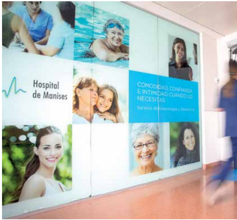
Instalaciones del Hospital de Manises.

Otro de los indicadores de calidad que los centros sanitarios contabilizan es la calidad en la atención recibida. En este sentido, las quejas telefónicas se han reducido un 34% en el año 2022 si se compara