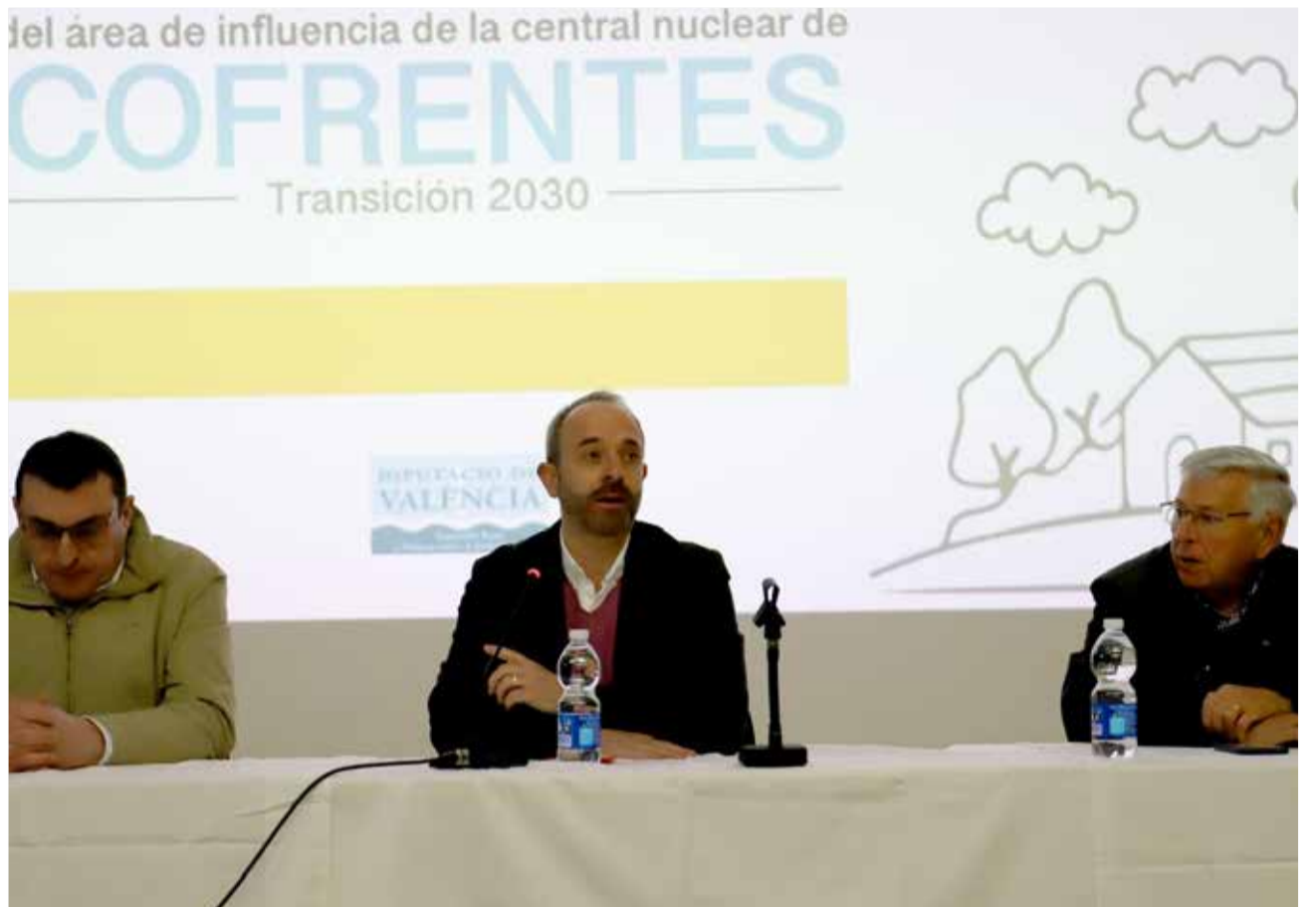
Ramiro Rivera, diputado de Desarrollo Rural y Políticas contra la Despoblación en Cofrentes.

El Ministerio para la Transición Ecológica y el Reto Demográfico del Gobierno de España ha programado para el 30 de noviembre de 2030 el