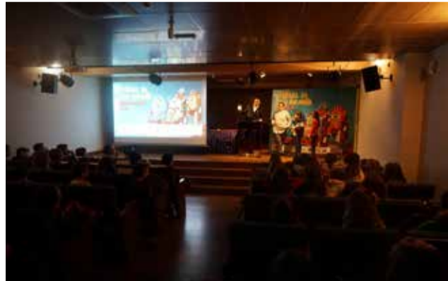
Direfentes momentos durante el 'Pequecinema' de Utiel.

"Pequecinema" contó también con la realización de un taller de animación con la técnica "cut out", una variante del conocido "stop motion" que utiliza figuras planas cuyo movimiento es el resultado de la toma de varias fotografías (quizás el ejemplo más famoso de esta técnica es la conocida serie de animación para adultos "South Park"). Más de 20 niñas y niños desarrollaron y aprendieron durante