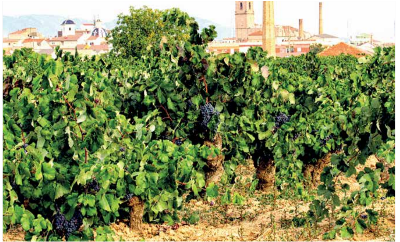
Viñedo en Utiel

Durante el encuentro, se tratarán temas como el modelo de Territorio Rural Inteligente, las comunidades