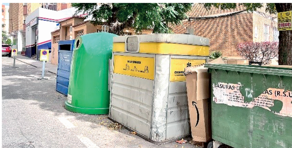
Diversos contenedores en la ciudad de Buñol.

El proceso de desarrollo del Plan Local de Gestión de Residuos será participativo, incentivando la colaboración de la ciudadanía a través de encuestas, entrevistas y sesiones informativas que se irán comunicando a través de las redes sociales y página web