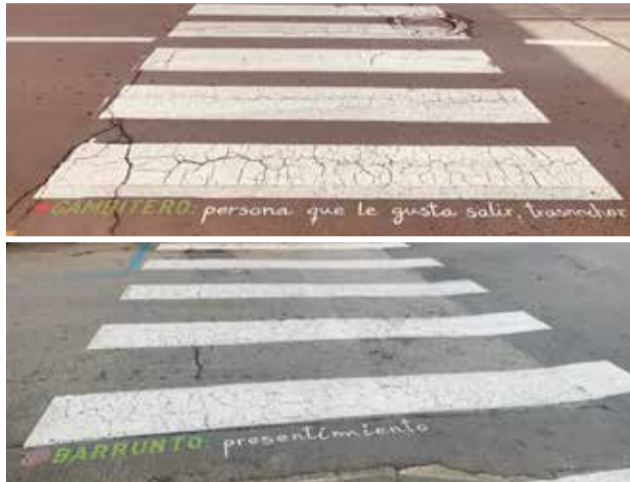
Algunas de las nuevas señalizaciones.

En total 30 pasos de peatones estarán señalizados con vocabulario típico de Utiel para de este modo visibilizar palabras propias del diccionario utielano que siguen manteniéndose como señal de identidad del municipio y especialmente de la cultura y tradición oral de sus vecinos. Entre el listado de palabras típicas utielanas encontramos "barrunto" como sinónimo de presentimiento; "gambitero" para referirse a la persona que le gusta salir o trasnoch; "estérico" para definir