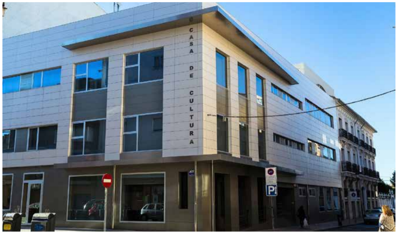
Casa de la Cultura de Utiel.

En la categoría de Comercio se premiará a la Asociación de Comerciantes de Buñol por la labor que llevaron a cabo durante la pandemia y por la creación de varias cam-