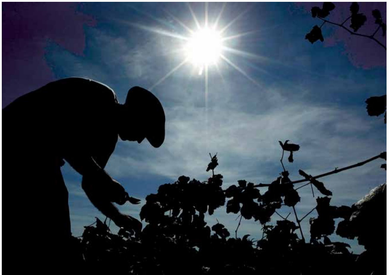
Un temporero trabaja en un viñedo en la zona de Utiel-Requena.

“Desde la Asociación de Elaboradores de Cava de Requena desconocemos los motivos que han empujado al pleno de la DOP Cava a recurrir la sentencia de noviembre, más aún cuando el TSJ de Madrid se muestra tan claro y rotundo en cuanto a la ausencia de confusión entre CAVA elaborado