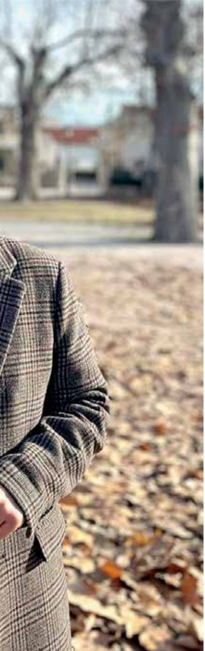
SOE. / EPDA

que trabajan y centrándonos en ello. Hemos trabajado desde la Mancomunidad del Interior Tierra del Vino en un plan de gobernanza y dinamización turística que tanto necesitaba nuestro municipio y que está creando una verdadera identidad como Tierra Bobal como lo que somos como comarca y como el destino que queremos vender al exterior. Estas instituciones están facilitando muchos recursos en municipios de La Plana de Utiel-Requena que es algo que anteriormente y desgraciadamente no pasaba y por suerte actualmente ha cambiado y queremos seguir trabajando en esa línea.