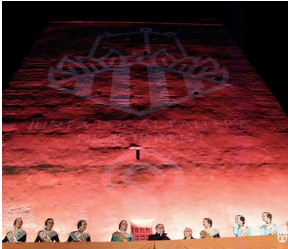
Falleras mayores de Torrent.

El acto dio inicio con un espectáculo de luces proyectado sobre el icónico monumento, el cual rindió homenaje a dos acontecimientos de gran relevancia para el mundo fallero de Torrent que se conmemoran este año: el 50º aniversario de la revista de El graner y el centenario de la falla