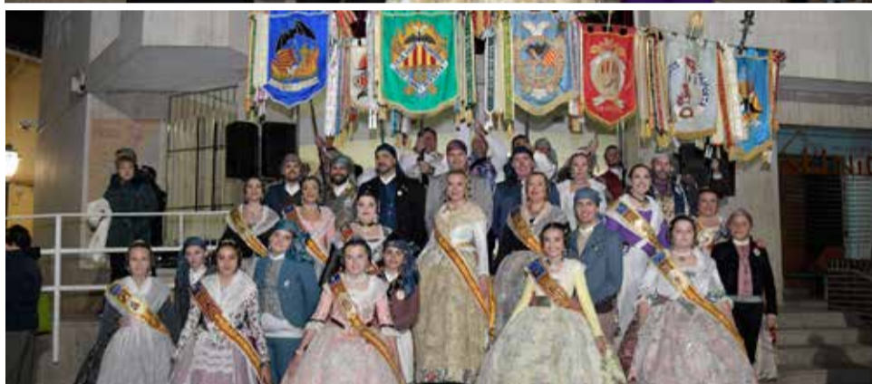
Falles a Paiporta.

El 17 de març, la Junta Local Fallera farà el tradicional recorregut per les comissions i els amants dels petards podran gaudir de la mascletà de la Falla Jaume I. Aqueix mateix dia les flames cremaran amb antelació la falla de l'associació Aldis Paiporta, a les 20.30 hores.