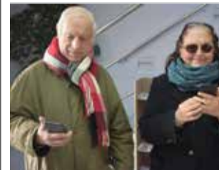
Majors. / EPDA