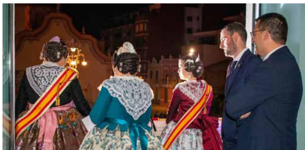
La Crida dona el tret d'eixida a les Falles d'Alfafar.