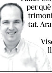
Visca Aldaia i visquen les Falles!

Ara toca tornar a demostrar per què les Falles són la millor festa del món, i per què han rebut el distintiu de Patrimoni Immaterial de la Humanitat. Ara sí, va de bo!