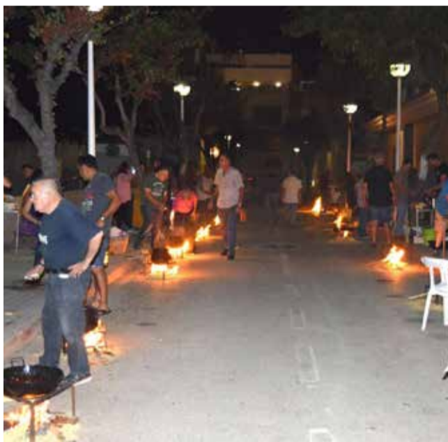
Una edició del concurs a Sedaví.

Iniciat l'any 2007, i a diferència d'altres concursos simi-