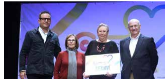
RunCàncer a Sedaví.

El circuit començarà a Paterna el 26 de març i continuarà a l'abril a Jarafuel, Atzeneta d'Albaida, Benetússer, Ènguera, Bunyol i Sueca entre altres localitats, per arribar al nostre municipi el mes d'octubre.