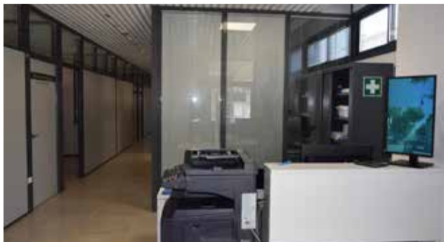
Edificio multiusos en Sedaví.

do ello con una persona encargada de registro, dos unidades administrativas, tres trabajadoras sociales, psicóloga, educadora social, agente de igualdad, asesora jurídica, psicóloga y educadora del equipo específico de atención a la infancia y adolescen-