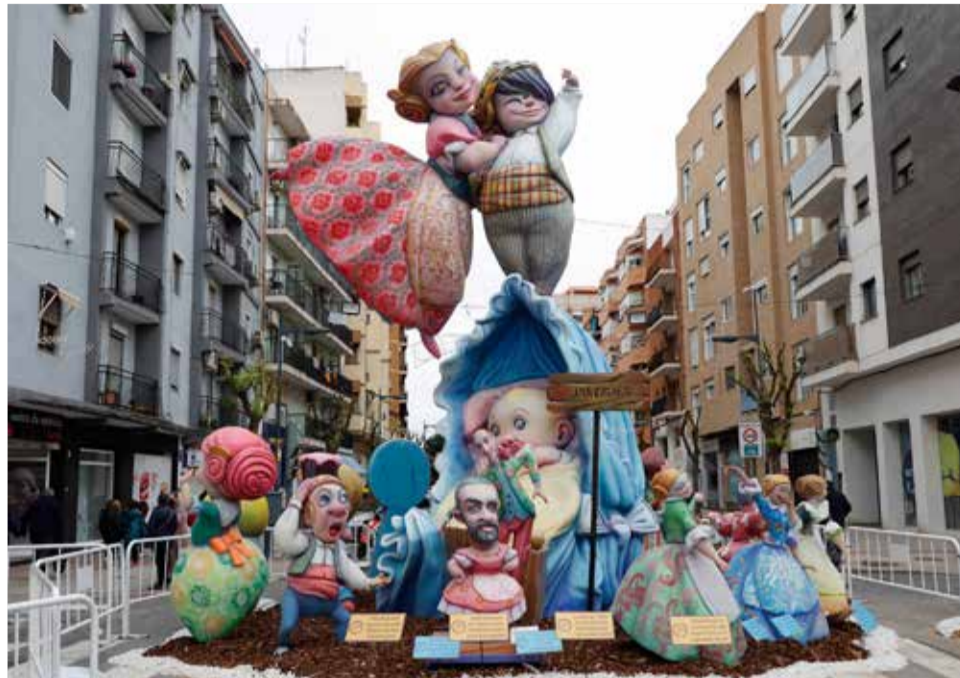
Una falla de Mislata.

de las once comisiones que conforman el colectivo fallero de Mislata. Las Fallas de 2023 ya han tomado la ciudad, con el pistoletazo de salida de la visita de la Fallera Mayor Infantil de València, Paula Nieto Medina, y la presentación de la imagen de las próximas Fallas el pasado 12 de febrero.