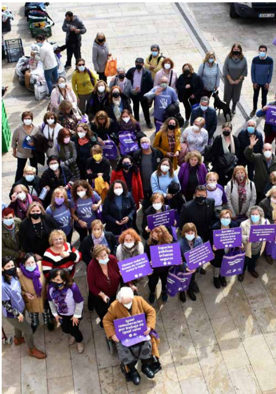
Acte del 8M al 2022.

El dia 7 de març tindrà lloc la tradicional marxa a peu per la igualtat. Esta activitat començarà a les 9.30 hores en la plaça de l'Ajuntament i, després de recórrer els carrers del municipi, finalitzarà