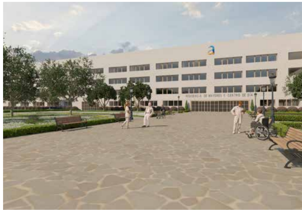
Nova residència.

Posteriorment, després de revisar les ofertes per la mesa de contractació i adjudicar el