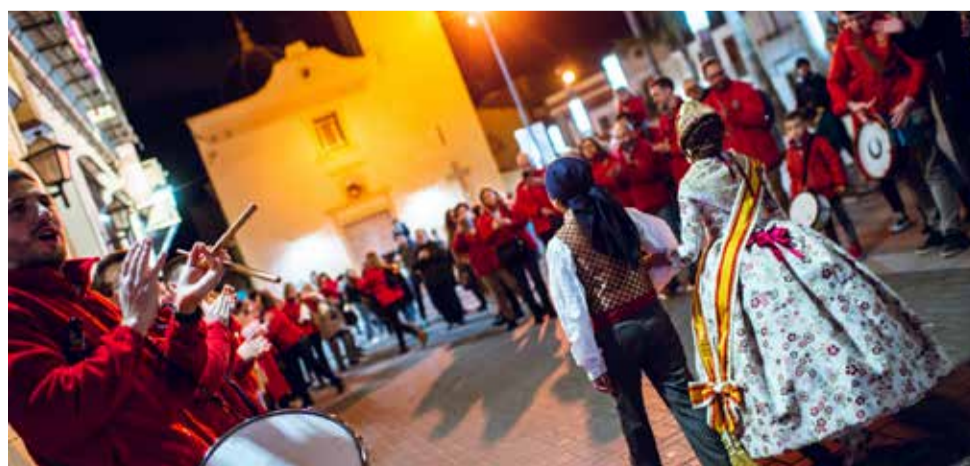
La Crida da inicio a las Fallas de Alcàsser.