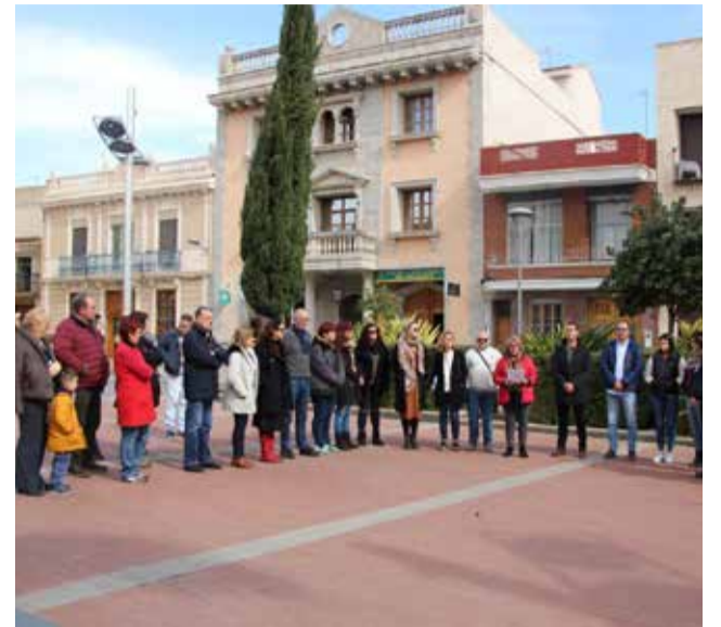
Concentració a Picassent.

És per això que, en vista de que estes circumstàncies tan difícils continuen, els picassentins i les picassentines ens solidaritzem amb el poble ucraïnès, amb tots els que viuen ací i també amb els que es queden allà, lluitant d'una manera o d'una altra per la llibertat».