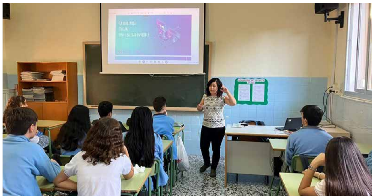
8M al centres educatius.

La Unitat d'Igualtat de la Mancomunitat ha desenvolupat material didàctic amb diferents activitats per fomentar i conscienciar al voltant de la igualtat entre dones i hòmens. El material està pensat per edats, per arribar a la major part possible de l'alumnat de la comarca. S'hi inclouen diferents acti-