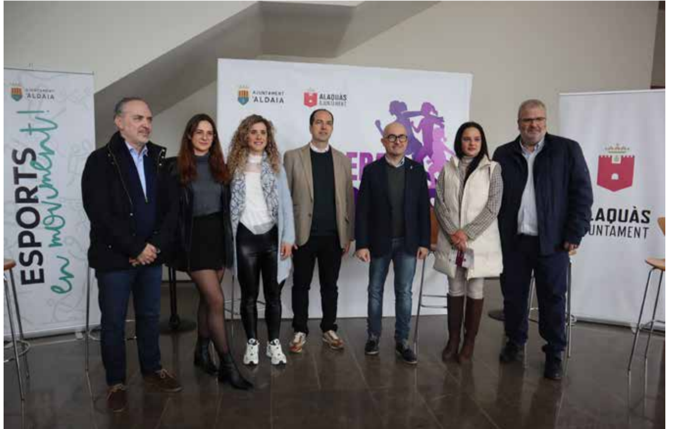
Presentació de la carrera.

Les dos localitats han llançat hui 15 de febrer una convocatòria massiva a tota la ciutadania, buscant la participació de dones de totes les edats en aquesta activitat lúdic-esportiva. Lesdeveniment vindrà acompanyat d'un lliurament de premis en diferents categories, sent una d'elles un premi especial a la falla més participativa, donada la proximitat d'estes festes.