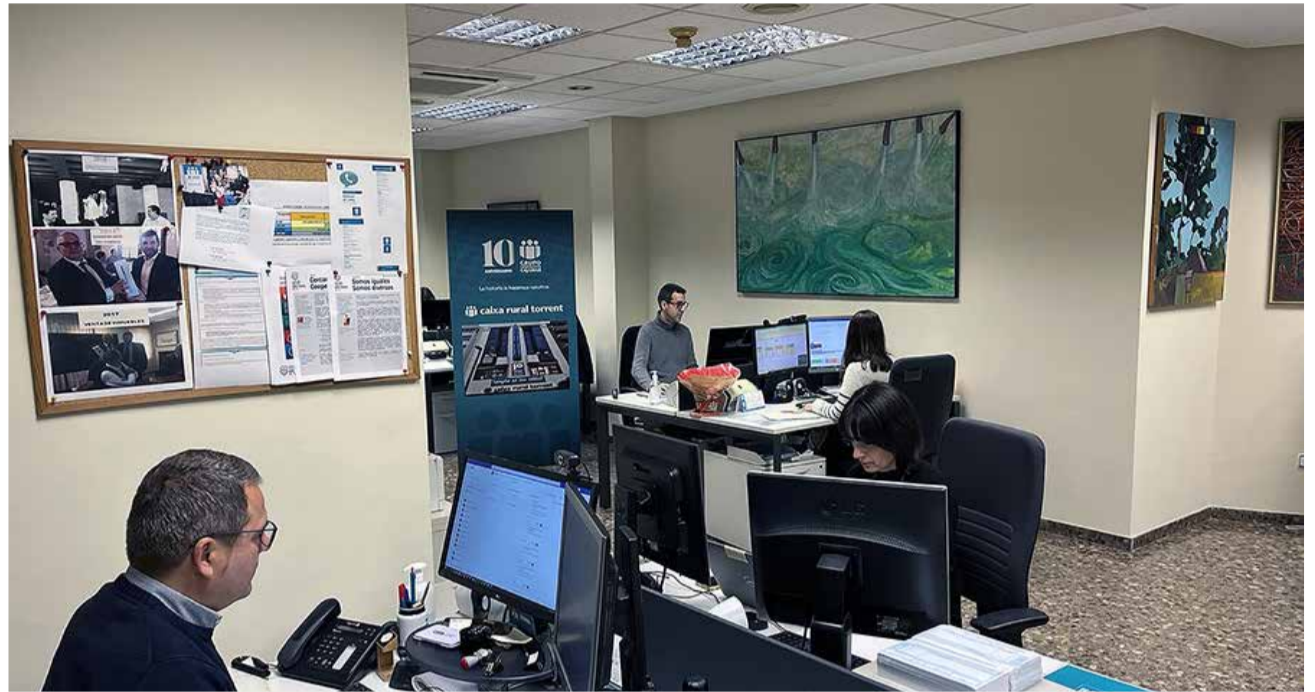
Una oficina de Caixa Rural Torrent.

El reconocimiento pone en valor la lucha por las desigualdades de género