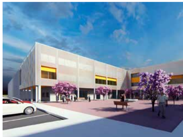
Centre al barri d'Orba.

Després de la seua aprovació, el centre municipal situat en el barri Orba es denominarà Centre Municipal Clara Campoamor; el parc de l'avinguda Torrent prendrà el nom de Parc Ana Lluch; la plaça situada davant l'edifici Sanchis Guarner serà nomenada plaça