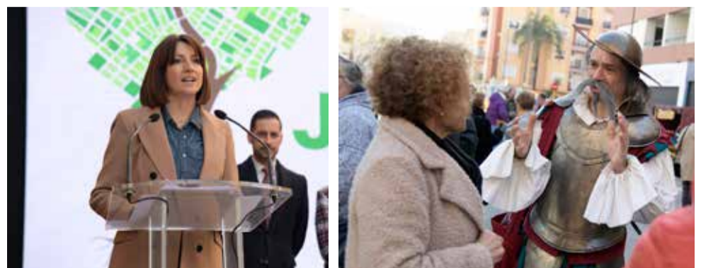
Diferentes instantes de los actos organizados en Paiporta.