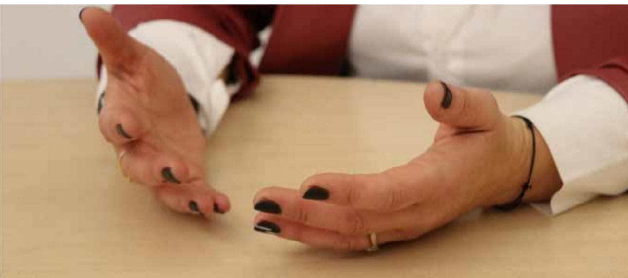
Diferentes instantes de la entrevista.

he buscado las mejores alternativas teniendo en cuenta el interés general. Pero es cierto que no se avanza al mismo ritmo porque cada formación tenemos una forma de llegar a consensos, de medir las prioridades. Me hubiese gustado avanzar en temas de accesibilidad y de inclusión real o tener una ordenanza abolicionista de la prostitución. Nos hubiera gustado tener más avanzada la financiación europea para diferentes proyectos o haber presentado mucho antes el plan de instalaciones deportivas, pero como te de-