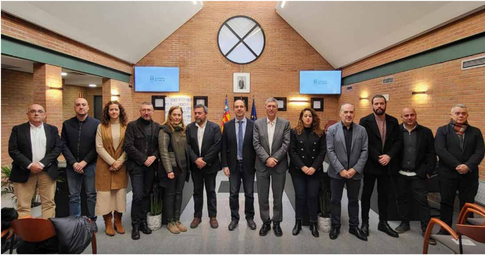
Visita de Climent a l'Ajuntament d'Aldaia.