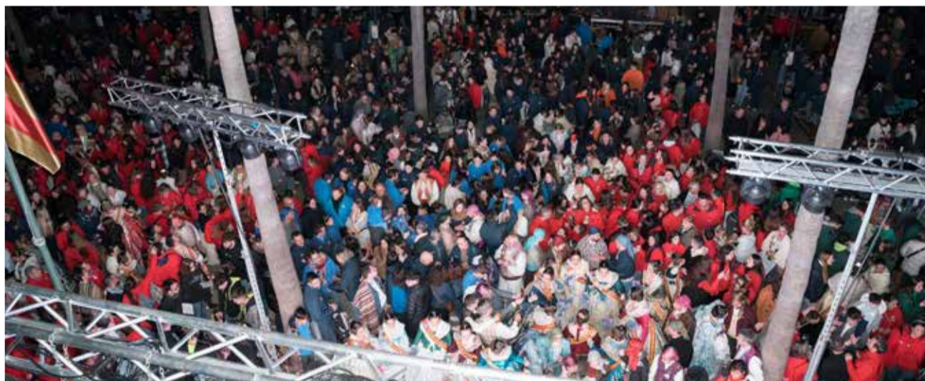
Diferents instants de la Crida d'Aldaia.