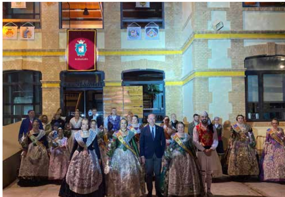
Acto de la Crida en Massanassa.

to de la Junta Local Fallera, manifestó que ambas son unas "dignas representantes para nuestro pueblo". A su vez, Comes agradeció el trabajo que realizan las cuatro fallas del municipio (Falla El Divendres, Falla Poble Massanassa, Falla L'Alqueria y Falla Jaume I) porque "hacen posible que los vecinos y vecinas