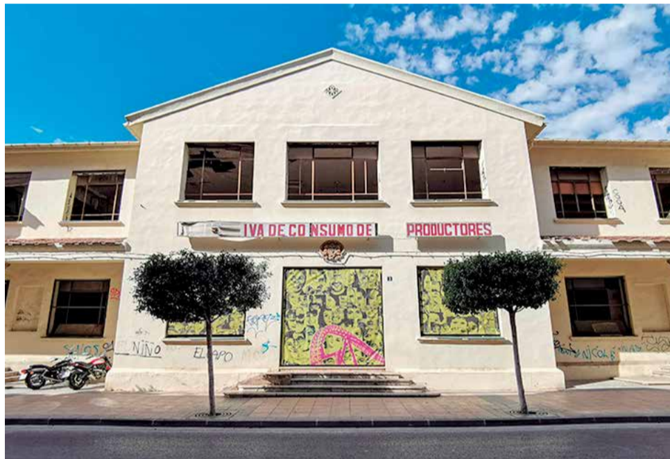
Antiguo Economato, edificio que albergará el futuro CEAM.

Por último, ha añadido que "no podemos esperar más, vamos a seguir insistiendo cada vez que podamos. Vamos a seguir peleando para que la Conselleria de por fin el visto bueno al proyecto y que con ello sea una realidad en el menor tiempo posible. Se deben licitar ya las obras, no podemos esperar más".