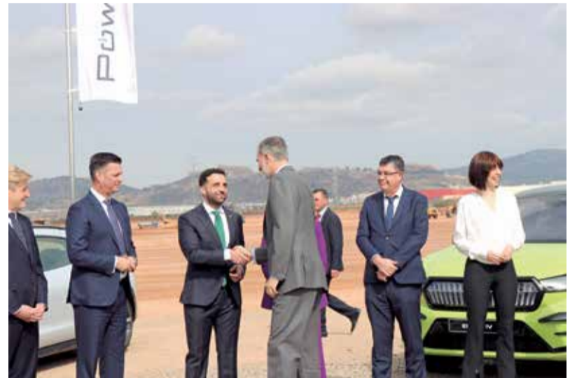
El rey Felipe VI saluda a las autoridades políticas a su llegada.