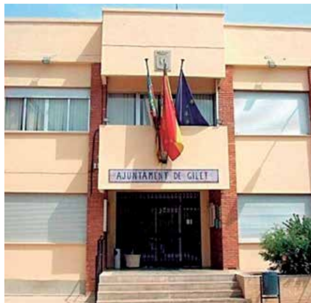
Fachada del ayuntamiento de Gilet.

"Nuestro pueblo necesita una fuerza que represente