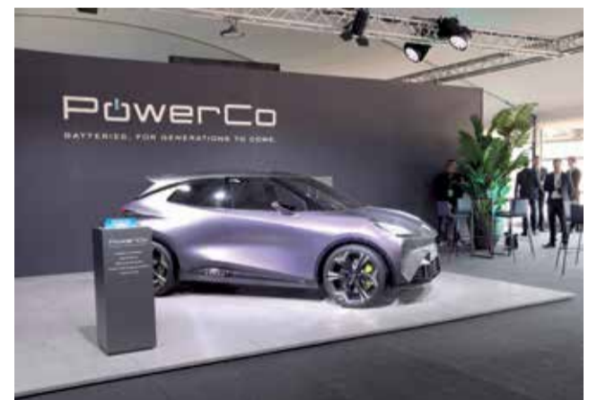
Un vehículo de Volkswagen.