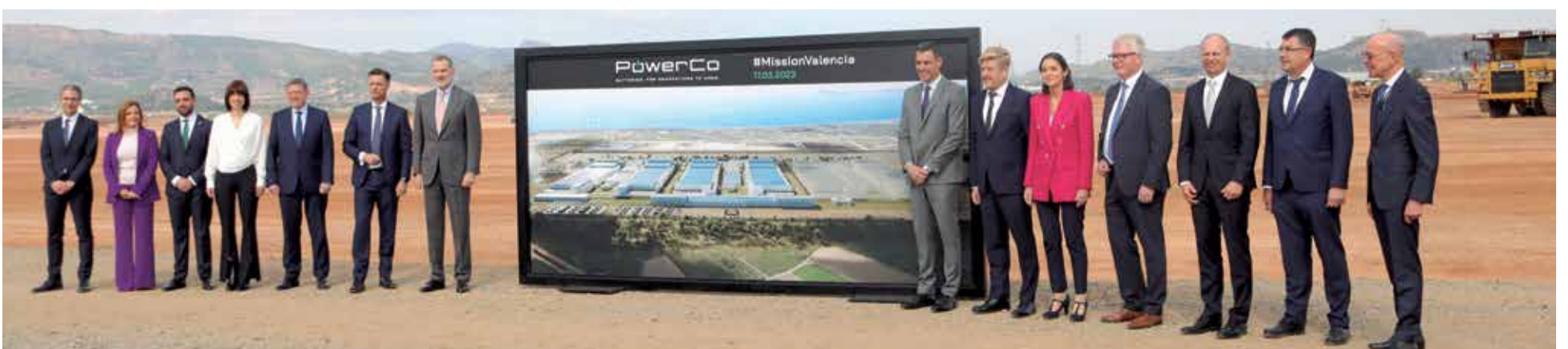
El rey Felipe VI y el presidente del Gobierno, Pedro Sánchez, en los terrenos de Parc Sagunt, junto a otras autoridades políticas y de la compañía Seat-Volkswagen.