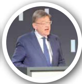
Ximo Puig.

La inversión de Volkswagen resume la política industrial del Ejecutivo, orientada a avanzar en un mundo libre de combustibles fósiles para 2030"