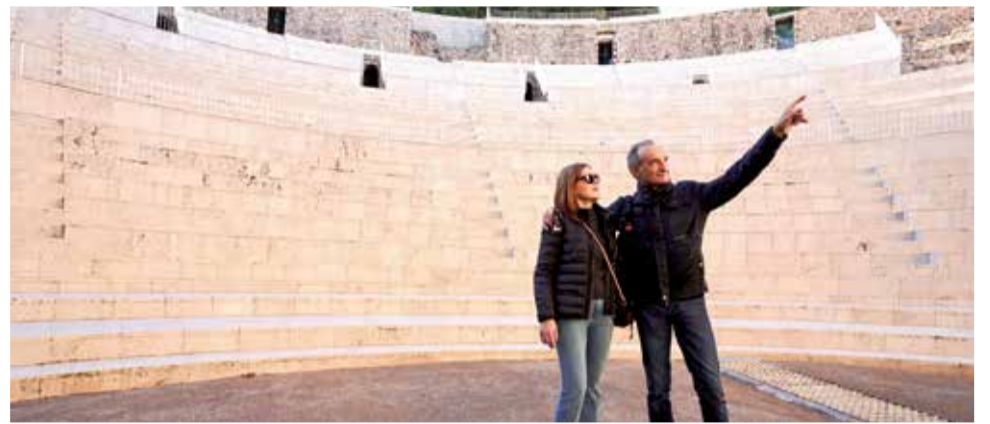
Una pareja de turistas visitando el teatro romano de Sagunt.

NATALIA ANTONINO: "SOMOS UN DESTINO QUE ESTÁ ENTRE LAS PRIMERAS OPCIONES PARA PASAR LAS FIESTAS Y ASÍ LO DEMUESTRAN LOS DATOS"