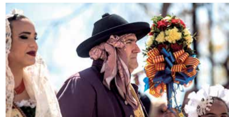
Imatges de diferents moments de les Falles 2023 a Sagunt.