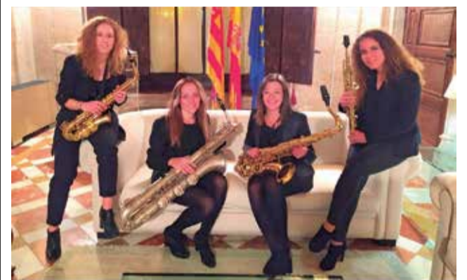
Del cinema al jazz, integrants.