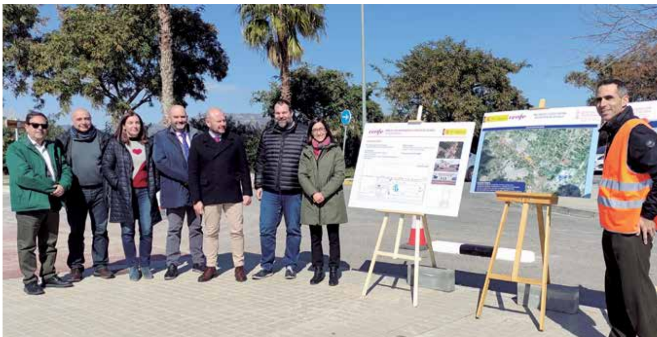
Presentació del projecte junt a l'estació de tren de Les Valls.