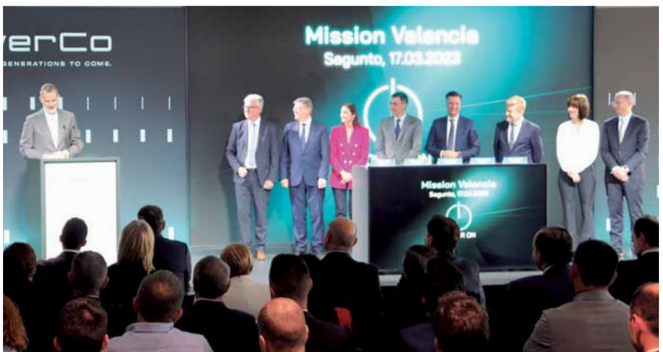
Un instante de la intervención del rey Felipe VI en el acto de inauguración de las obras en Sagunt.