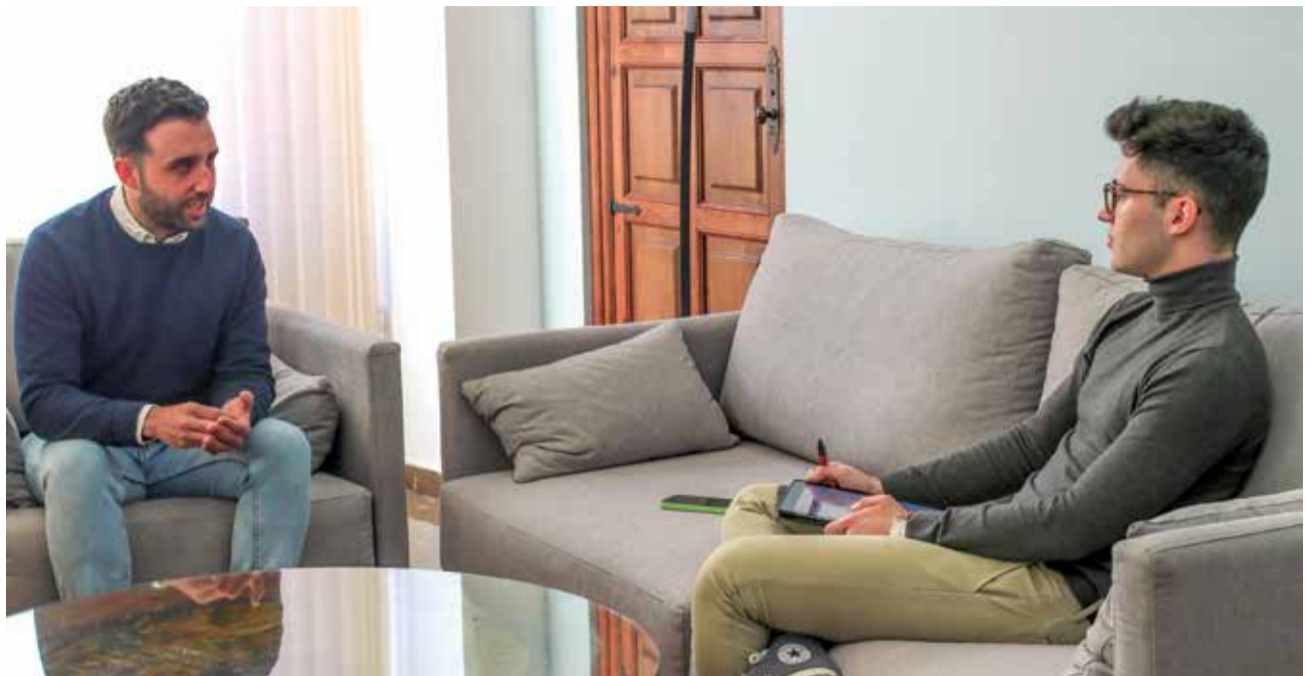
El alcalde, Darío Moreno, siendo entrevistado en su despacho del ayuntamiento de Sagunt.

El estado de las calles y la limpieza es importante, pero tenemos que ir más allá y pensar a lo grande; los próximos cuatro años tienen que ser clave en el desarrollo de nuestro municipio”