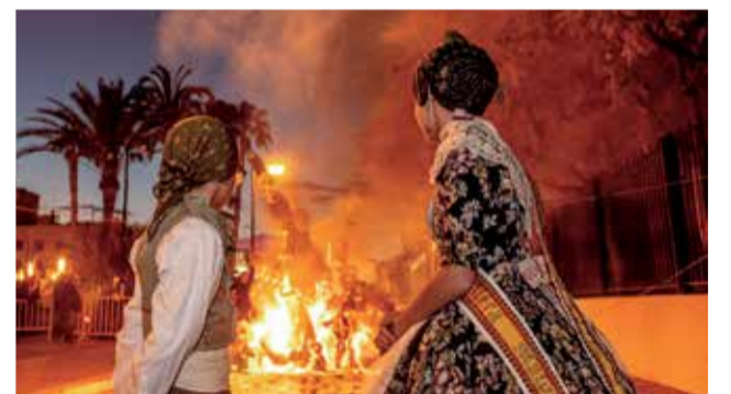
Imatges de diferents moments de les Falles 2023 a Sagunt.