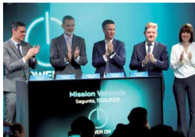
Autoridades, con las celdas de batería.