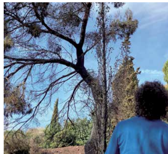
Moment d'anàlisi de la zona afectada.

L'Ajuntament de Benifairó va denunciar en un comunicat la "irresponsabilitat" de tirar petards i jugar amb foc en un entorn com el de l'ermita. "Se'ns ha cremat part del nostre poble. Hem tingut el cor en un puny per la rapidesa amb què les flames han avançat", deia el text. A més, sentenciava "que estes gamberrades servisquen per a parar els actes vandàlics que destrossen els que és de totes i tots".