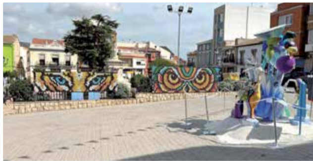
Diverses imatges dels monuments fallers de la comissió de Gilet.