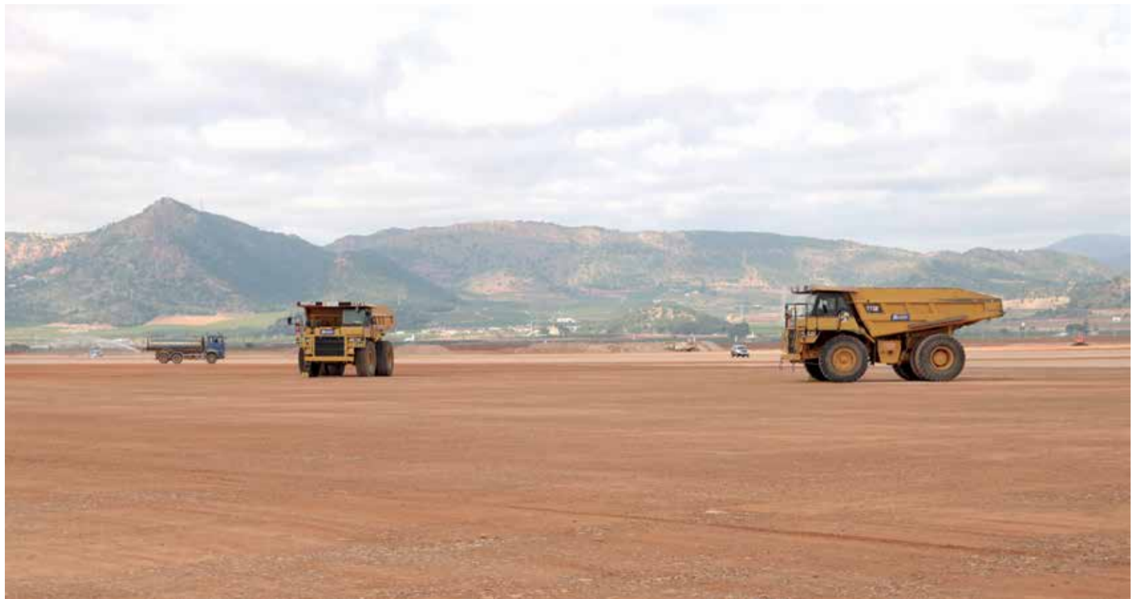
Terrenos ubicados en Parc Sagunt II donde se levantará la futura gigafactoría proyectada por el grupo Volkswagen.