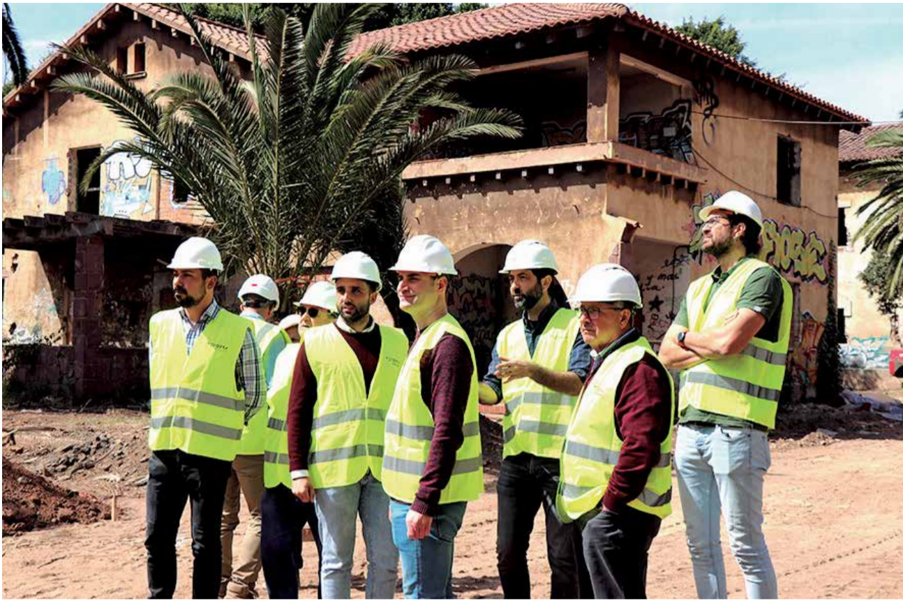
Alcalde y concejales de Compromís e Izquierda Unida visitan el estado de las obras de la Gerencia.