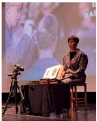
Un acte. / EPDA

ACCIONES COL·LECTIVES D'ARTISTES DE LA COMARCA, EXPOSICIONS I CINEMA CONFORMEN LA PROGRAMACIÓ