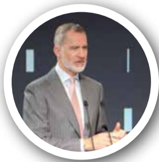
Felipe VI.

Felipe VI destacó la envergadura del proyecto de construcción de la gigafactoría de Sagunt por su volumen de actividad económica y de empleo en un país que quiere convertirse en "hub" de movilidad eléctrica en Europa y crear un ecosistema completo de fabricación de vehículo eléctrico. El monarca