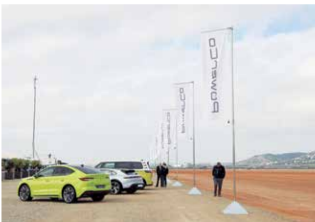
Vehículos de Volkswagen en Sagunt.