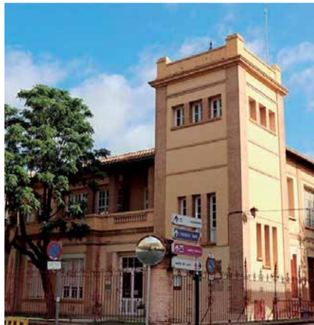
Colegio de Cronista Chabret de Sagunt.

La realización de este trámite es especialmente importante para las familias que vayan a matricular a sus hijos e hijas por primera vez en las aulas gratuitas de 2 años y en Infantil de 3 años, es decir,