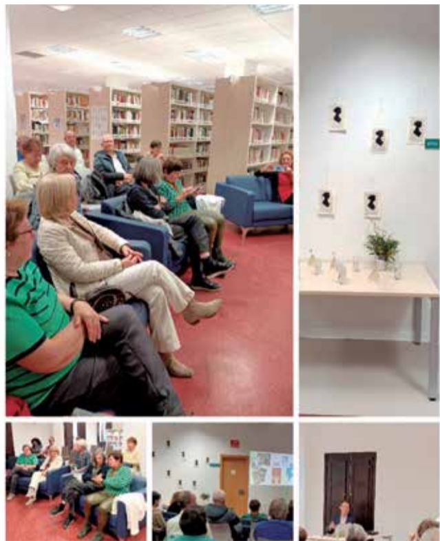
Conferència 'Jane Austen, dona i escriptora'.

veïns i veïnes, empreses, associacions i entitats, ens ha permès dissenyar i realitzar una programació rica i diversa, que ha servit de punt d'unió per a continuar reivindicant els nostres drets".