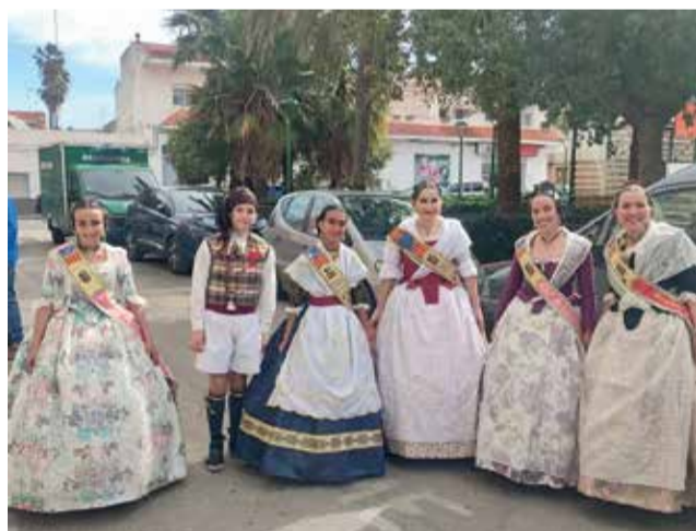
Representantes de la falla con las 'regines'.