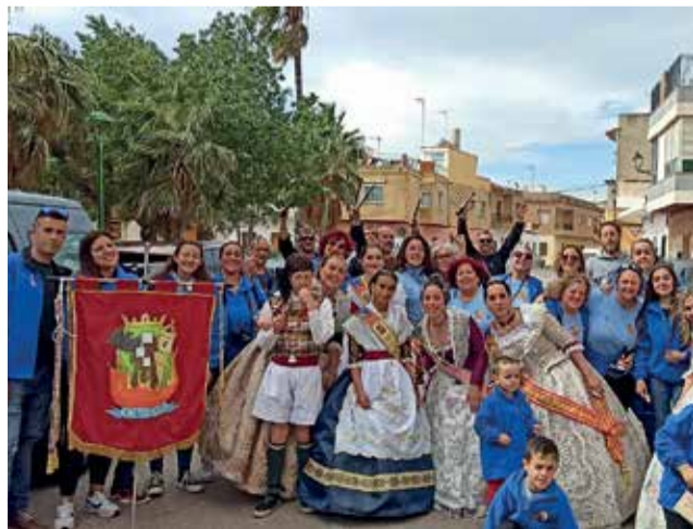
Falla de Catadau.