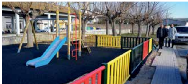
Parc nou a Alberic.

formació de la substitució dels actuals equips d'enllumenat per equips LED al Poliesportiu La Muntanyeta (pista, frontó i pistes de tennis), el Poliesportiu Bernat Martínez, el Camp Futbol Municipal, pistes esportives del Col·legi Convent, pistes esportives i gimnàs Col·legi Rafael Comenge i el camp de futbol Vicente