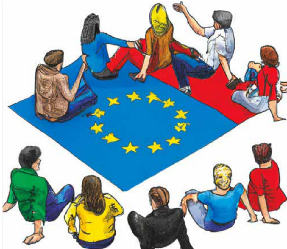
Pie de foto

La solidaritat és un valor fonamental a Europa, i ha sigut especialment important durant la pandèmia del COVID-19. A nivell europeu, s'han pres una sèrie de mesures per a ajudar als països i a les persones més afectades per la crisi. Ací hi ha algunes accions solidàries que s'han dut a terme a Europa durant la pandèmia: Fons de Recuperació