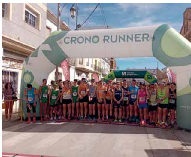
XXI Volta a Peu de Catadau.

Aquesta prova, que està emmarcada en l'XI Circuit Caixa Popular Ribera de Xúquer, va comptar amb la participació de 600 atletes dividits en diferents categories, 432 participants en la categoria Absoluta i 167 en les categories inferiors.