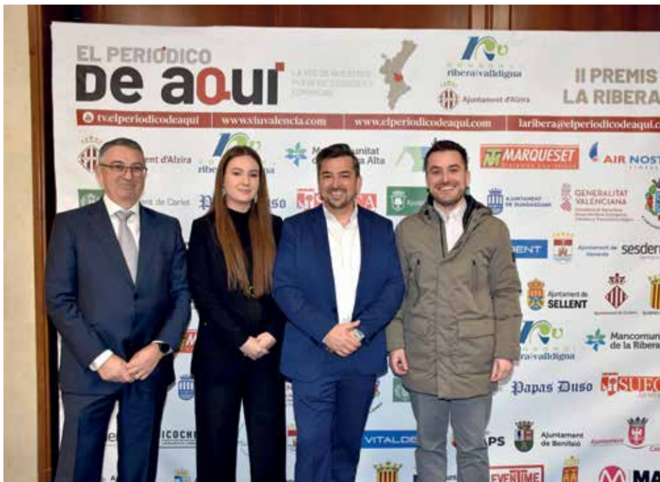
Instantáneas en el photocall de la gala del Gran Teatre de Alzira.