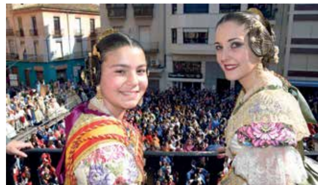
Falleres Majors de Sueca.

en este tipus d'accions inclusives. Unes festes falleres que esperen molta participació tras dos anys de pandèmia i ja sense restriccions. Sueca forma part de la història de esta gran festa i al 2023 seran especials perquè la Junta Local Fallera celebra el seu 50 aniversari en un any marcat per la renaixença de les festes josefines.