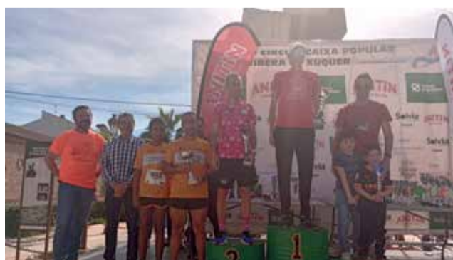
Pódium guanyador local Veterà B Masculino.