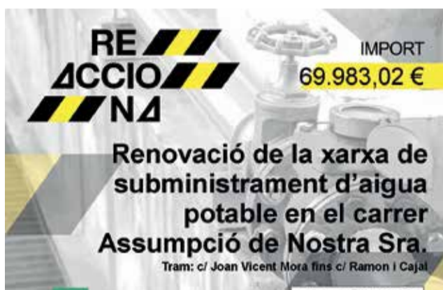
Renovació al carrer Assumpció de la Nostra Sra.

Comencen les obres de renovació de la xarxa de subministrament d'aigua potable en el carrer Assumpció de Nostra Senyora subvencionades per la Diputació de València dins de l'estratègia REACCIONA per a actuacions de millora del cicle integral de l'aigua. El dilluns 27 de febrer han començat les obres de renovació de la xarxa de subministrament d'aigua potable en el carrer Assumpció de Nostra Senyora que havien estat adjudicades per la Junta de Govern Local en sessió d'11 de gener de 2023. Les obres, adjudicades per l'import de 73.000'00 euros, estan subvencionades per la Diputació