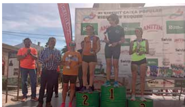
Pódium guanyadora local Veterà B Femenina.