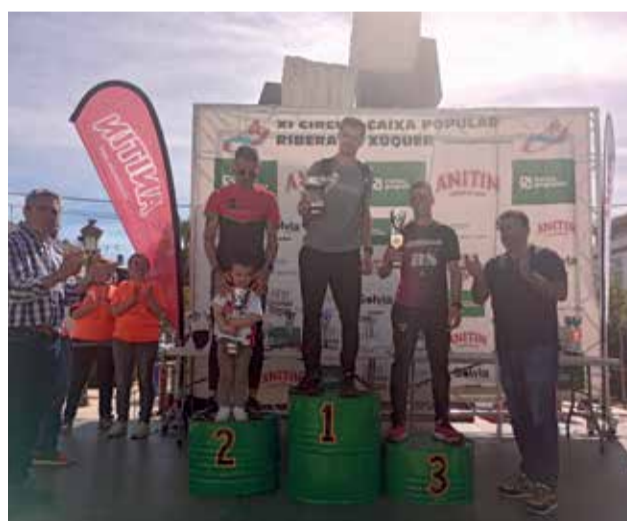
Pódium categoria Absoluta Masculina.