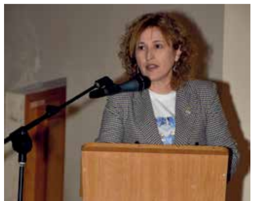
Diferents moments durante el acto de homenaje.