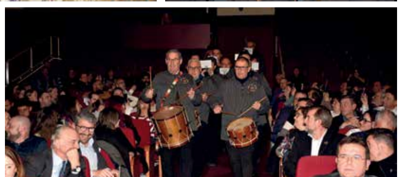
Instantáneas con los diferentes premiados y premiadas en la gala del Gran Teatre de Alzira.