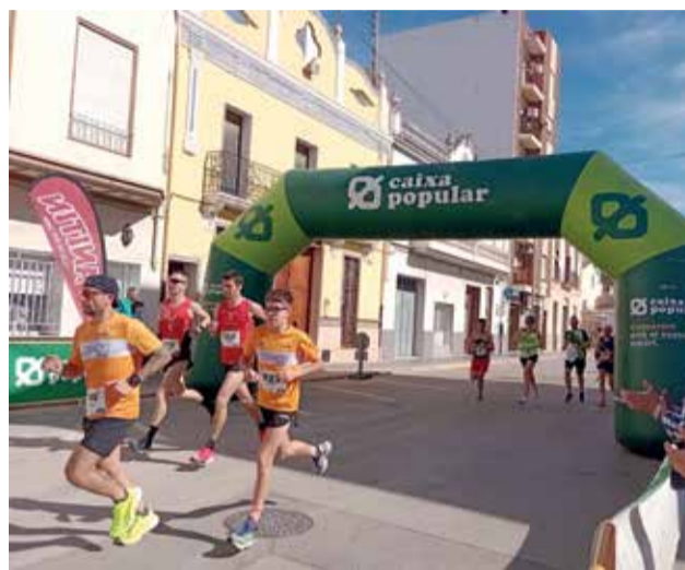
Eixida XXI Volta a Peu de Catadau. / EPDA