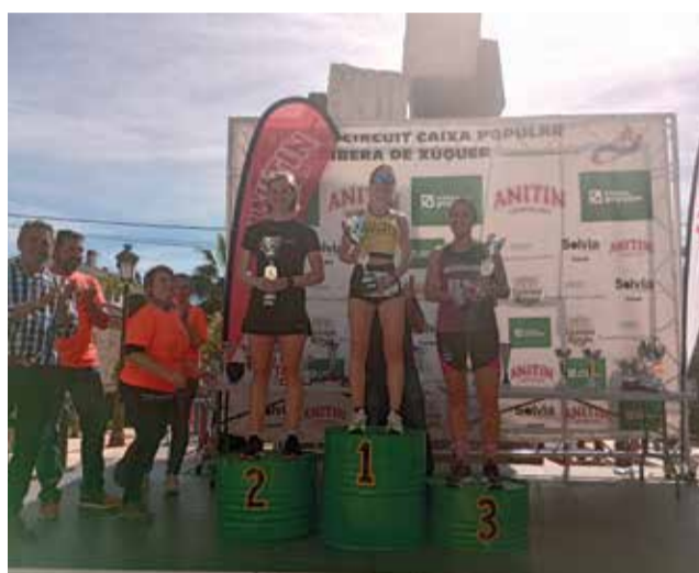
Pódium categoria Absoluta Femenina. / EPDA