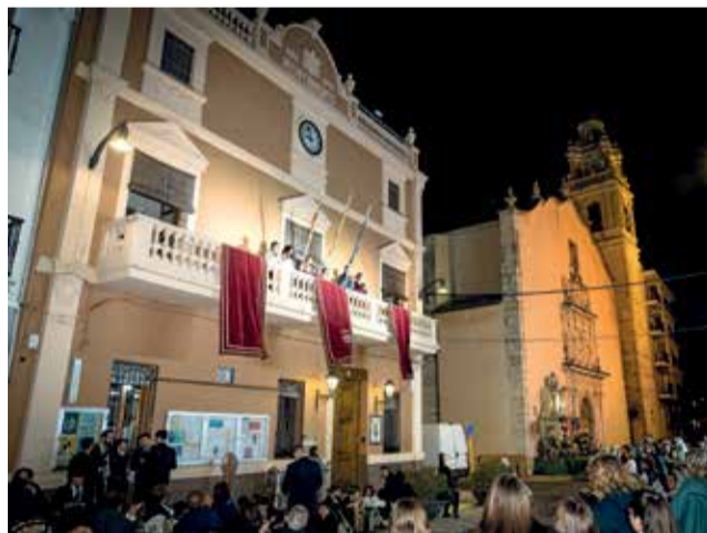
Un moment durant la Crida a Gudassuar.

La comissió de la Falla la Barraca va ser rebuda a l'Ajuntament de Guadassuar, per la corporació municipal, el divendres 3 de març per realitzar l'entrega dels ninots indultats d'enguany. L'acte, que dona pas a la programació fa-