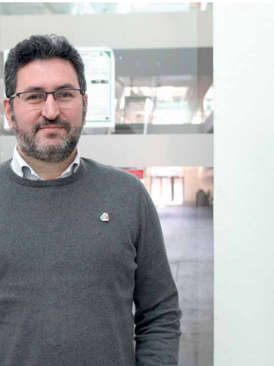
ria de Agricultura y Transición Ecológica.

en frío de los productos cítricos que entran de Sudáfrica, lo que viene siendo lo mismo que nos piden a nosotros cuando exportamos. La Unión Europea debe activar normas de reciprocidad, lo que a nosotros nos piden para afuera que a ellos se lo pidan cuando quieren importar. Los tratados de libre comercio no están mal, pero están mal diseñados, deberían separarse en mi opinión. Al final la agricultura termina siendo la moneda de cambio siempre. El sector valenciano ha perdido siempre en estas cuestiones. El gran reto es que el agricultor reciba un precio justo. Está siempre sobre la mesa y siempre lo están pidiendo. Nosotros no tenemos una agricultura excesivamente subvencionada. Mucha gente cree que el agricultor se mantiene gracias a las subvencio-