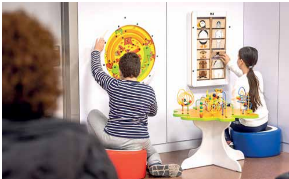
Zona lúdica para los niños en consultas externas de pediatría.

Además, el centro sanitario ha sido galardonado en dos ocasiones por los premios Best Spanish Hospital Awards (BHS) como mejor hospital general y de referencia a nivel nacional en el área materno-infantil. Estos galardones tienen como objetivo evaluar la calidad asistencial y funcionamiento de los centros sanitarios y sus áreas médicas específicas. En este sentido, cabe recordar que el Hospital de Manises fue galardonado también con el premio TOP 20 en la Gestión Hospitalaria Global y en las Áreas de la Mujer, que contempla la especialidad de Pediatría, entre otras. Este galardón pone en valor la labor asistencial y el trabajo realizado por los profesionales del centro en la atención a pacientes.