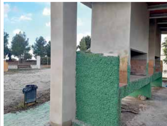
Paellers de La Cárcama.

Las personas interesadas en solicitar el uso del refugio de La Cárcama deben presentar una instancia normalizada con los datos de la persona solicitante, indicando el día de uso, el número de personas que ocuparán el refugio y la actividad a desarrollar. Una vez registrada la solicitud, el Ayuntamiento comunicará si está disponible. Para finalizar la reserva deberá realizarse un ingreso de 3 euros por persona y día y una fianza de 2 euros por persona y día. Todos los residuos generados durante la estancia deberán ser recogidos por las personas usuarias.