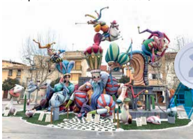
Segundo premio Falla Plaza de San Juan.