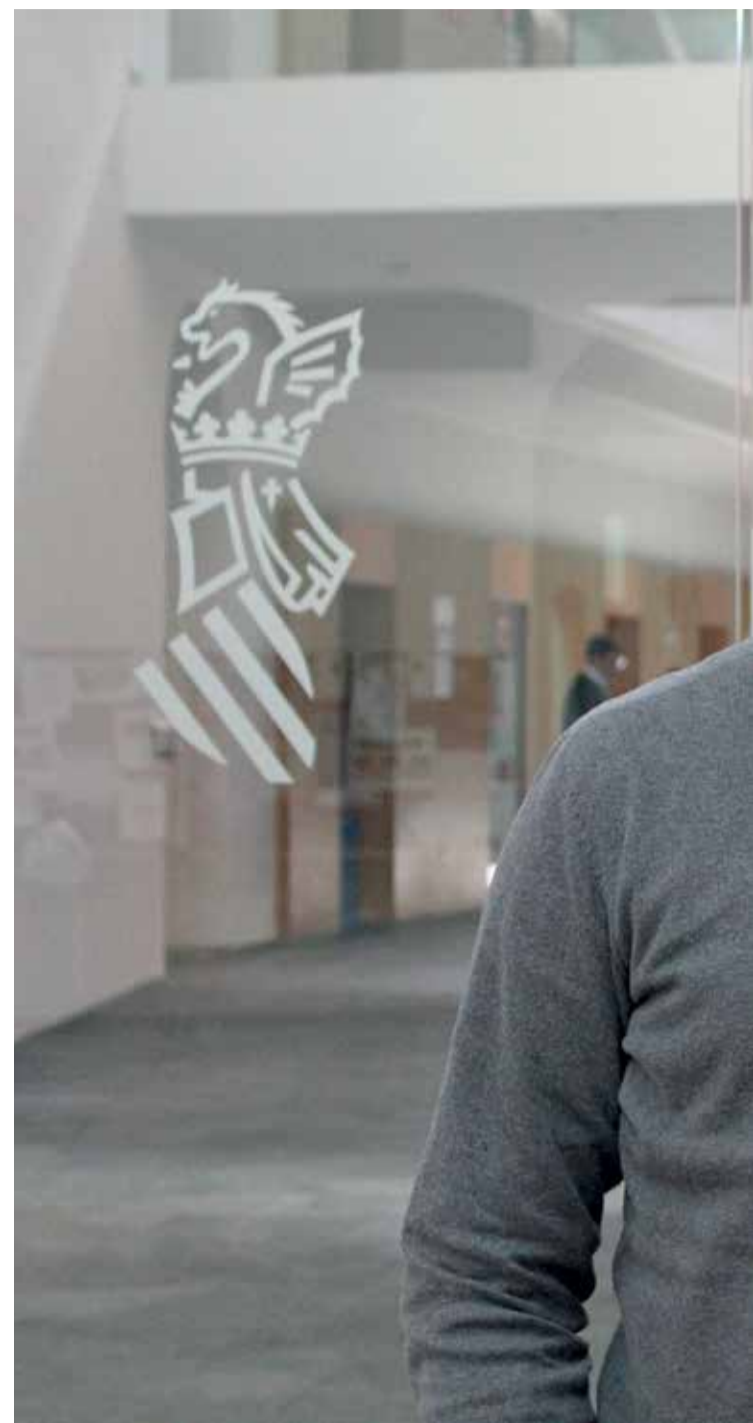
David Torres, director general de Desarrollo Rural en la conselleria de Agricultura y Transición Ecológica

tos a que otras regiones que no puedan llegar podamos ayudarle. No es una moda, es una realidad. Podemos estar a favor o en contra de lo que diga Europa, pero la cuestión es que lo dice y tenemos que cumplirlo. Debemos intentar que nuestros productores tengan las mejores herramientas para que cuando vayan eliminando esos productos, nosotros tengamos esas alternativas. Queremos cumplir con esa reducción de hasta el 50 % de productos de síntesis, lo estamos haciendo bien, y estamos adelantándonos. Pensamos que en la proximidad está también el paso para avanzar en la producción ecológica. Es una visión de mejorar nuestro entorno.