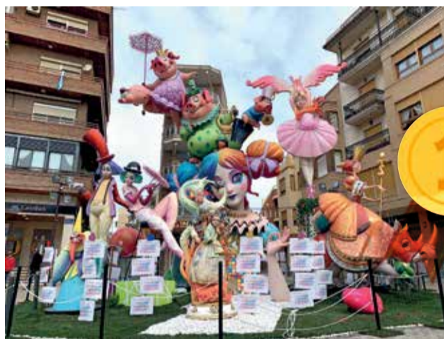
Primer premio Falla Plaza Puerta del Sol.