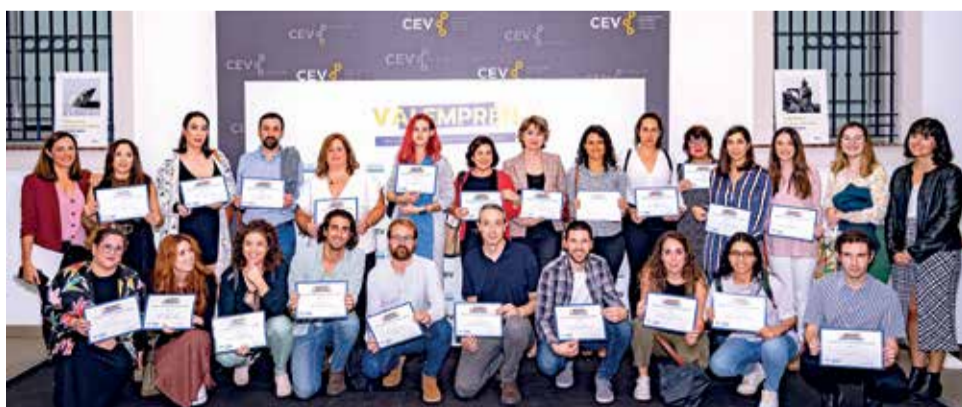
Participantes de la última edición de Valemprén.

Según la asociación, más del 30% de los participantes son actualmente empresas en activo. “Valemprén va dirigido a aquellos que solo tienen la idea de negocio, de cualquier tipo de sector y actividad, y para emprendedores de cualquier edad. El objetivo es fortalecer el ecosistema empresarial en toda la provincia”, declara Navarro. Todas las formaciones serán impartidas por empresarios y empresarias en activo Valemprén cuenta con un factor diferen-