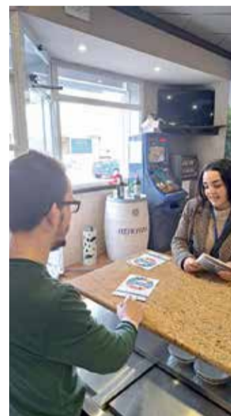
El Ayuntamiento de Ayora lleva a cabo un cuestionario a la población dentro de la iniciativa 'P de Participa'.