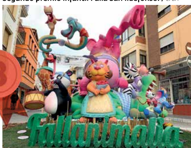
Tercer premio infantil Falla Calle el Remedio.