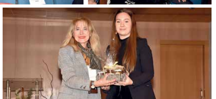
Instantáneas con los diferentes premiados y premiadas en la gala de Utiel.