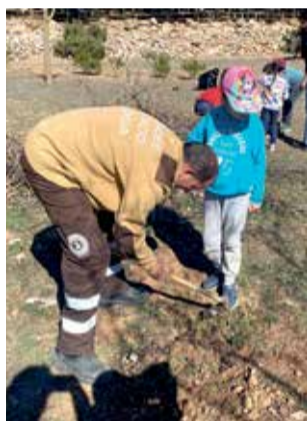
Plantación de árboles del alumnado del CRA Entreviñas. / EPDA