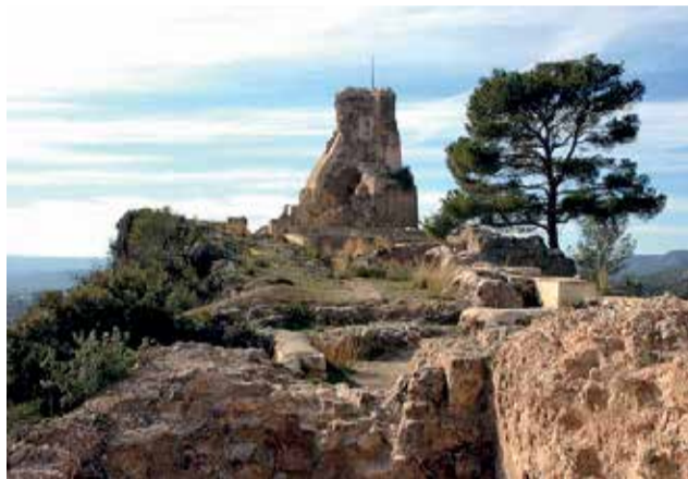
MACASTRE.—Ruinas del Castillo

“Confiamos que en breve el gobierno valenciano dé el visto bueno definitivo para poner en marcha el Plan”, indican desde el consistorio.