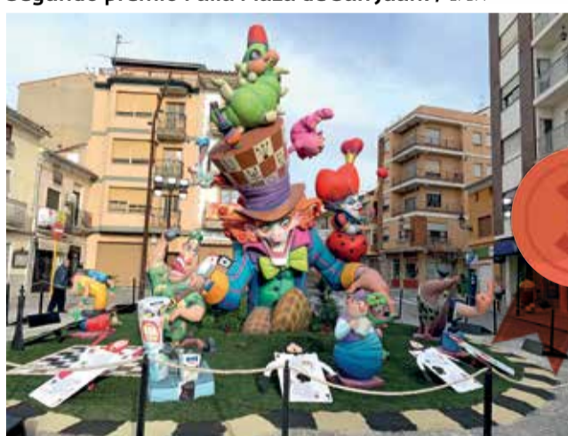
Tercer premio Falla Puerta de las Eras.