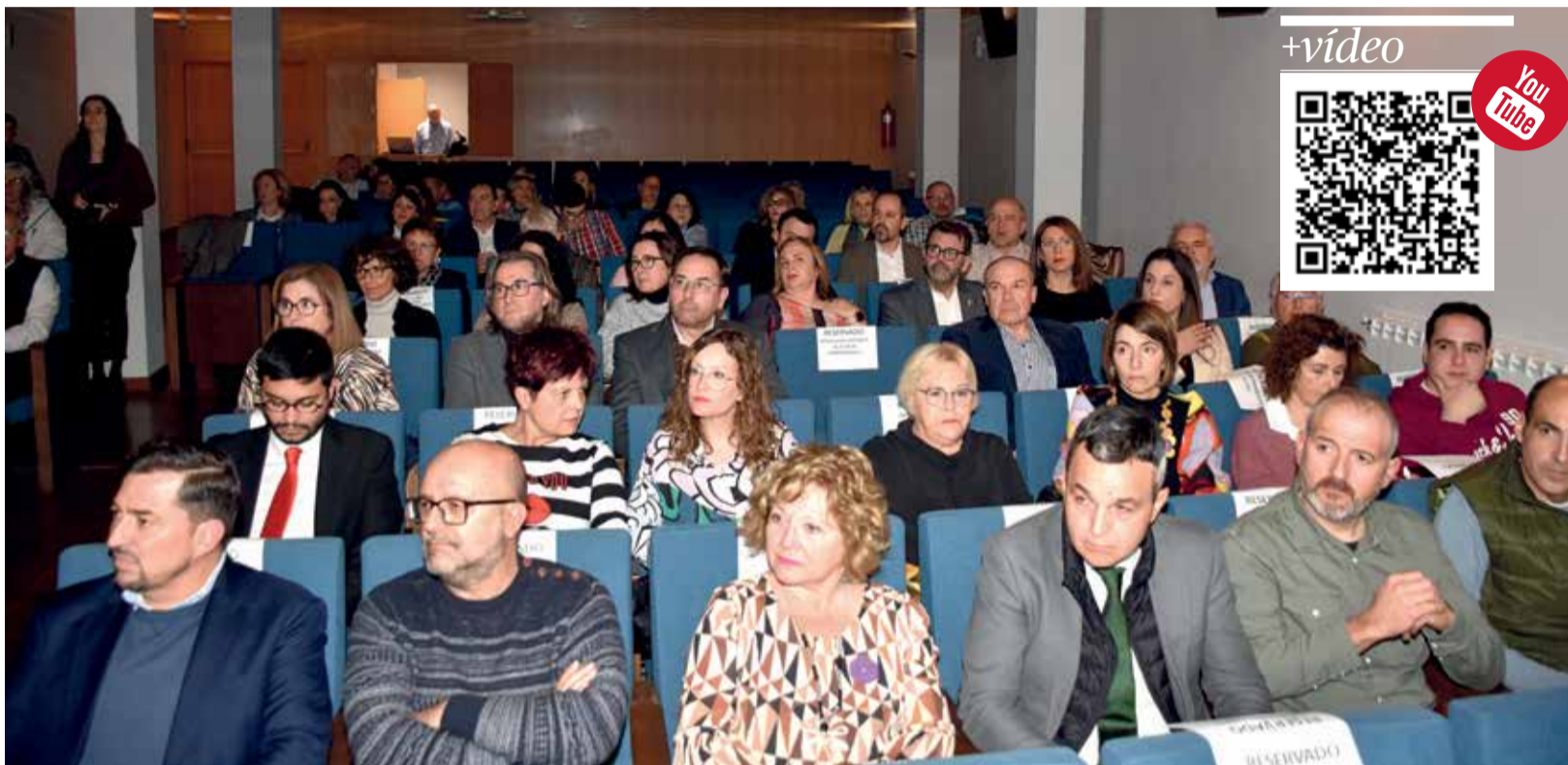
Instantánea de todos los premiados después de la gala en la Casa de la Cultura de Utiel.

EN LA GALA SE ENTREGARON 14 GALARDONES PARA DAR VISIBILIDAD AL TRABAJO QUE SE REALIZA A DIARIO