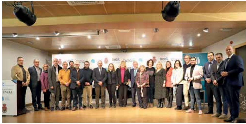
Representantes políticos y ponentes en la jornada de Utiel.

Durante la conferencia inaugural del congreso, Francesc Boya, secretario general para el Reto Demográfico del Gobierno de España, lanzó un mensaje de optimismo "porque la lucha contra la despoblación genera una armonía casi inédita entre todas las administraciones públicas, independientemente del color de sus gobiernos", y puso como ejemplo que "la Conferencia Sectorial de Reto Demográfico puesta en marcha desde el Ministerio adopta todos sus acuerdos por unanimidad". Boya incidió en la importancia de "generar redes de trabajo, en las que se ponga en común el conocimiento y las diferentes líneas de acción que obtienen buenos resultados", y para ello "era necesario hacer un trabajo previo para dotar de co-