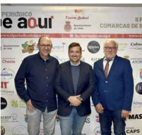
Instantáneas de los asistentes a la gala de los premios de comarcas de interior celebrados en la Casa de la Cultura de Utiel.