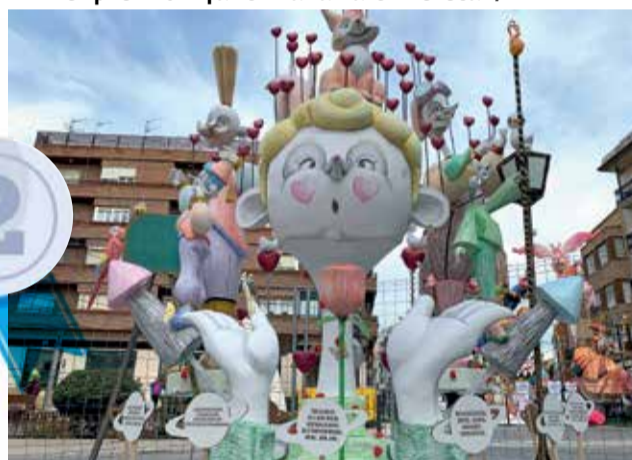
Segundo premio infantil Falla San Ildefonso.