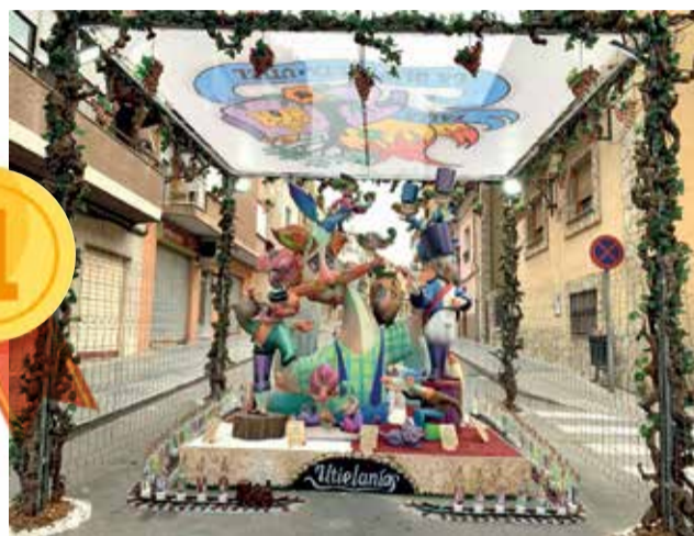
Primer premio infantil Falla La Olivereta. / EPDA