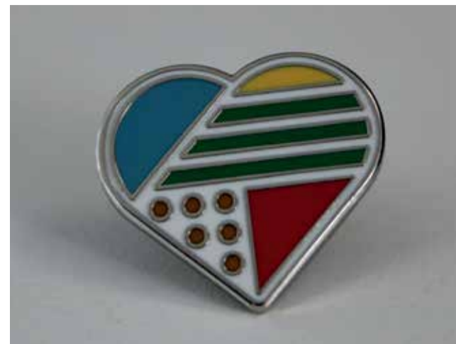
Logotipo de la marca 'Molt de Gust'.

Consumir productos ecológicos no es una moda, es una realidad y pensamos que en la proximidad está el paso para avanzar en esta producción porque se trata de mejorar nuestro entorno"