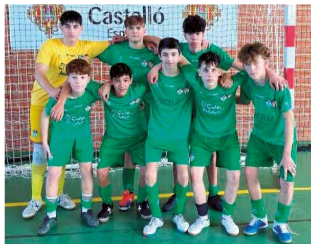
Cadete B. / EPDA