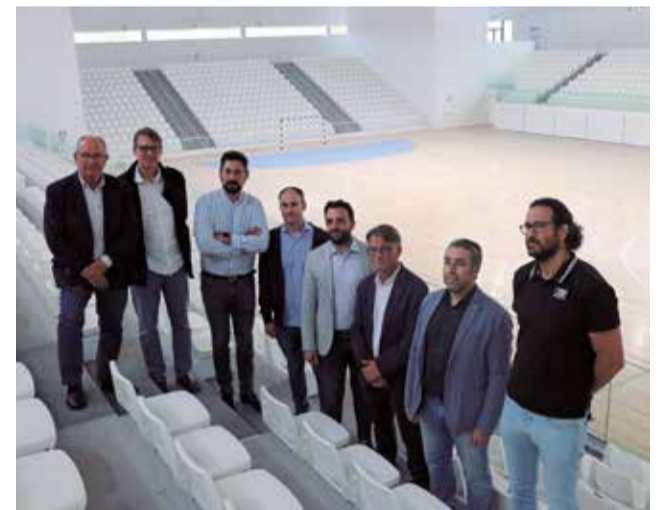
Instalaciones del nuevo pabellón del Port de Sagunt y ediles con el director general de Deportes de Conselleria.