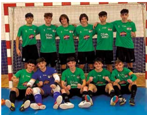
Juvenil, Liga Autonómica. / EPDA