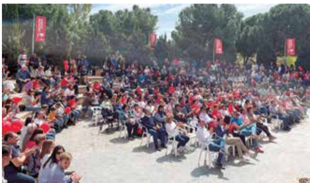
Público general, durante el acto.

EL ALCALDE PRESENTÓ SU CANDIDATURA PARA LAS ELECCIONES EN LA FIESTA DE LA ROSA