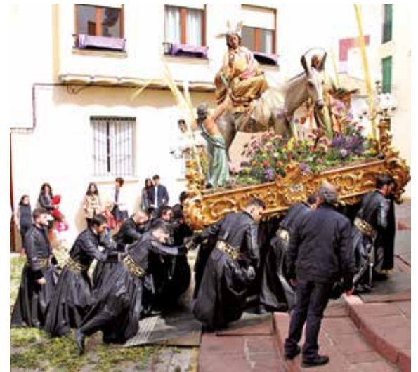
Diferentes actos de la Semana Santa Saguntina, el año pasado.