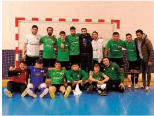
Senior Masculino. / EPDA