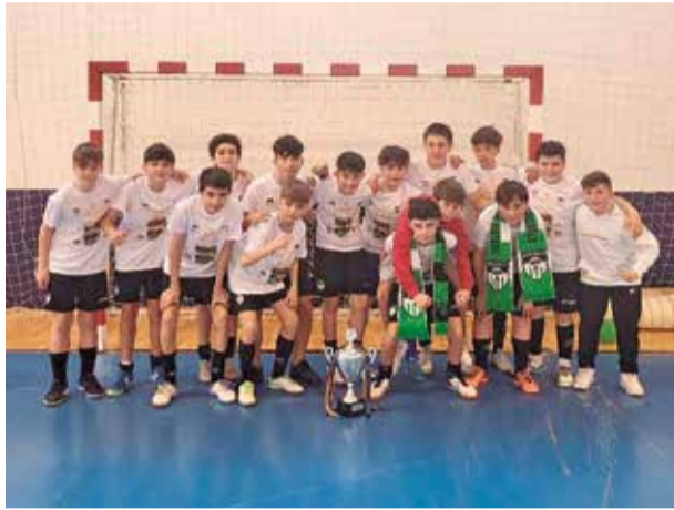
Infantil, ya campeón de Liga 2022/23.

EL PRESIDENTE: "ESTA ES UNA TEMPORADA EXTRAORDINARIA; HEMOS SUPERADO LOS OBJETIVOS"