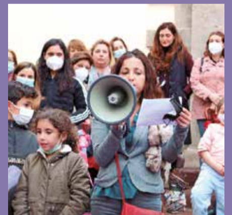
Protesta el año pasado.

Una concentración volvió a protestar a las puertas de la ermita de la Sang este Martes Santo por la tarde ante la negativa de la Cofradía de que las mujeres participen en la fiesta, decisión ratificada hace ahora un año. Un gran sector pide que la entidad, con sus más de 500 años de historia, sea inclusiva en pleno siglo XXI y como ya se ha hecho en otros muchos puntos de España; otro considera que rompería la tradición. Un año más, muchos balcones de la ciudad lucen crespones negros en las banderolas como señal de que la la lucha sigue en pie.