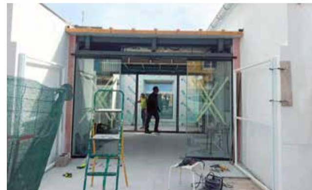
El nou consultori mèdic, en obres.

vestíbul, recepció, un pati i cinc lavabos per als usuaris. En total, el nou Consultori Mèdic té una superfície construïda de 240,23 m2. Totes les instal·lacions seran accessibles i estaran ubicades en la seua totalitat en la planta baixa de l'edifici. L'edifici és, a més, energèticament sostenible, ja que disposa d'un sistema de generació d'energia solar fotovoltaica", exposa l'alcalde de Benifairó, Toni Sanfrancisco.