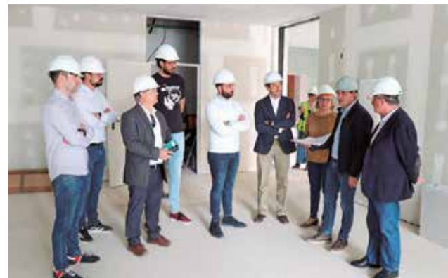
Autoridades municipales, en las obras.