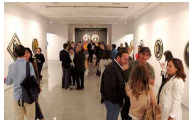
Varios instantes el día de la presentación de la exposición en la sala de la Glorieta de Sagunt. / BORJA PEDRÓS