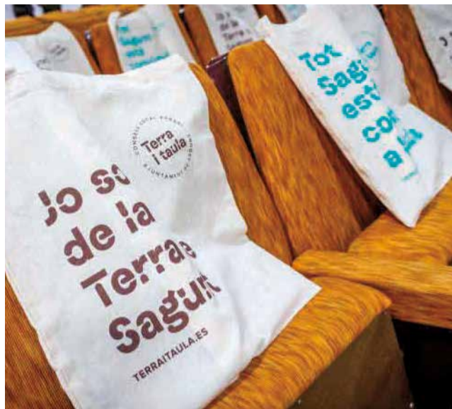
Merchandising de la campaña.

Para el alcalde, "esto no es una campaña de marketing, sino un proceso de participación para aportar puntos de vista, poner nuevos cimientos, hacer una marca significativa que apele a las personas, que la ciudadanía la haga suya y que esté dispuesta a pagar un poco más para mejorar