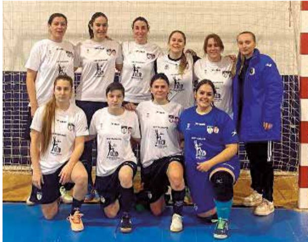
Senior Femenino.