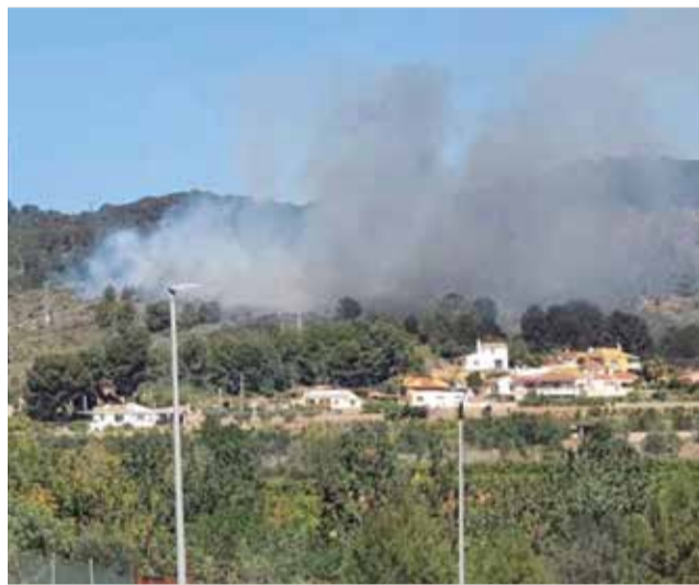
Incendio en Estivella, junto a los depósitos.

Según informaron desde el parque de bomberos de Sagunt a El Periódico de Aquí, el fuego se originó alrededor de las 12:45 muy cerca de los depósitos de agua. Al lugar se desplazaron inmediatamente un medio aéreo de la Generalitat Valenciana, tres unidades de Bomberos Forestales, una de ellas helitransportada; dos autobombas; dos dotaciones, sargento, coordinador forestal y dos brigadas