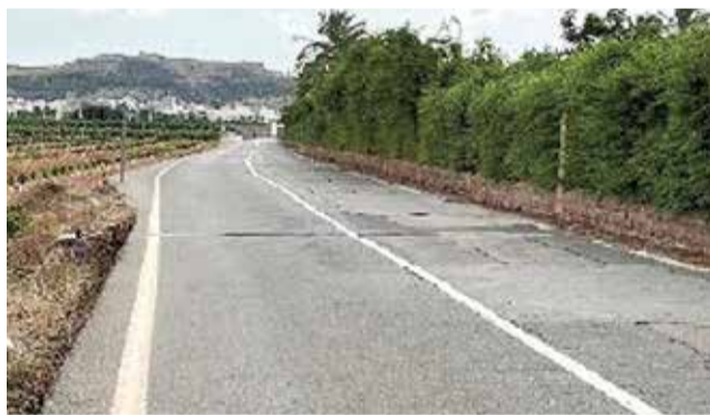
Camí de les Valls, on també s'ha actuat.