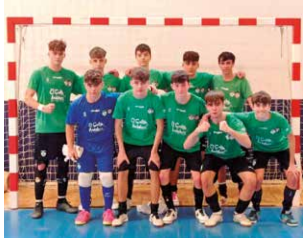
Cadete A. / EPDA