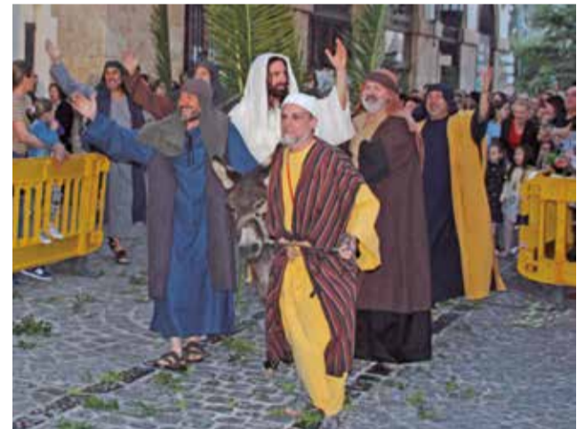
Bendición de las palmas en el Domingo de Ramos y dos instantes de la representación de la 'Passió en Viu' de Sagunt. / KIVI OSMA