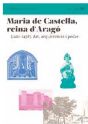
Portada del llibre.

no va impedir que es posara al capdavant de la política, quan el rei Alfons se n'anà a Itàlia, per a després no tornar més. Així, Maria de Castella es va enfrontar fins i tot amb el seu germà, i amb la Corona de Castella, d'on ella provenia, per tal que no es lliurés una guerra amb la d'Aragó, va eludir també problemes amb els nobles, i va haver de fer front a l'assumpte de les Remences a Catalunya, entre moltes altres coses. Però, per a mi, personalment, el més interessant de la reina era la seua capacitat, coercitiva inclús, per dirigir i controlar els monestirs i convents, els quals ella ma-