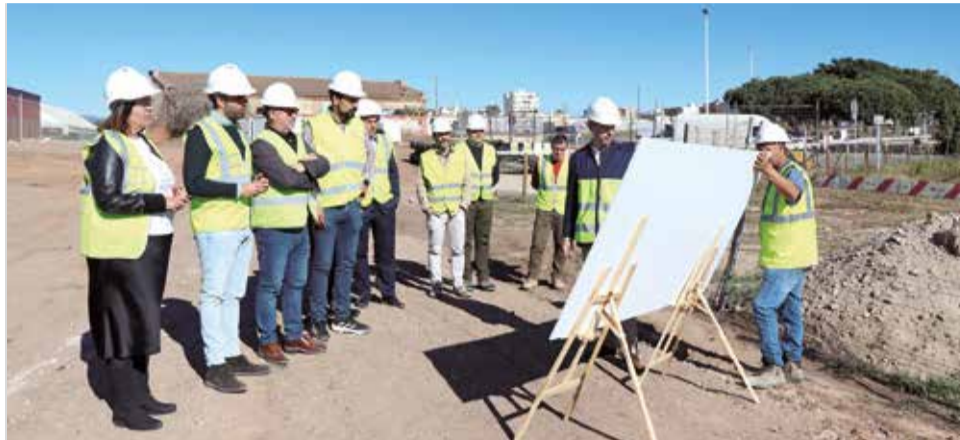
Autoridades visitan la evolución de las obras en el Pantalán.