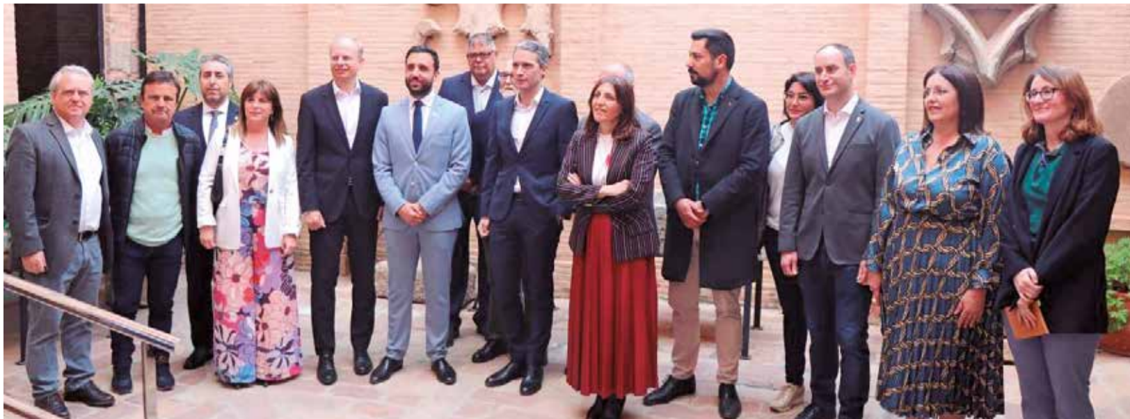
Miembros del equipo de gobierno de Sagunt y directivos de PowerCo España, tras la sesión informativa.

VOLKSWAGEN Y POWERCO EXPUSIERON EL PROYECTO DE LA FUTURA GIGAFACTORÍA EN UNA JORNADA INFORMATIVA