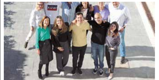
Integrants de la llista de Compromís per Canet. / EPDA