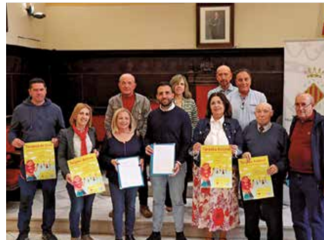
Presentación de la campaña.

Podrán adquirir las tarjetas las personas mayores de 18 años en las fechas indicadas por la comisión de seguimiento, siendo necesario para la adquisición de las mismas disponer de tarjeta bancaria, además de mostrar un documento de identificación vigente (DNI, NIE, Pasaporte, etc.). Cualquier persona podrá recoger la tarjeta de otra persona siempre y cuando aporten el poder de representación (modelo adjunto) firmado por el representante y por la persona representada junto con el DNI de la persona representada.