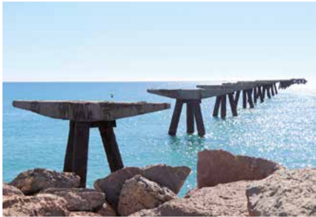
Estado actual de la parte marítima del Pantalán.

MIEMBROS DE LA CORPORACIÓN VISITAN LAS ACTUACIONES EN LAS QUE SE HAN INVERTIDO MÁS DE 5,5 MILLONES DE EUROS