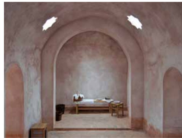
Interior de los Baños Árabes de Torres Torres.

Los baños árabes de Torres Torres son un conjunto de restos arqueológicos de un anti-