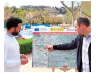
Alcalde y concejal.