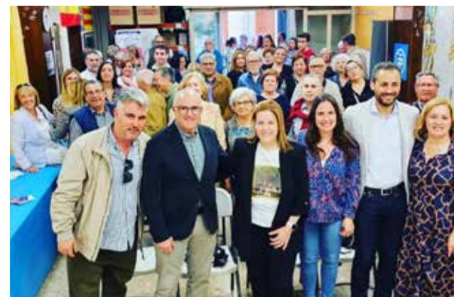
La alcaldable popular recibe los apoyos.