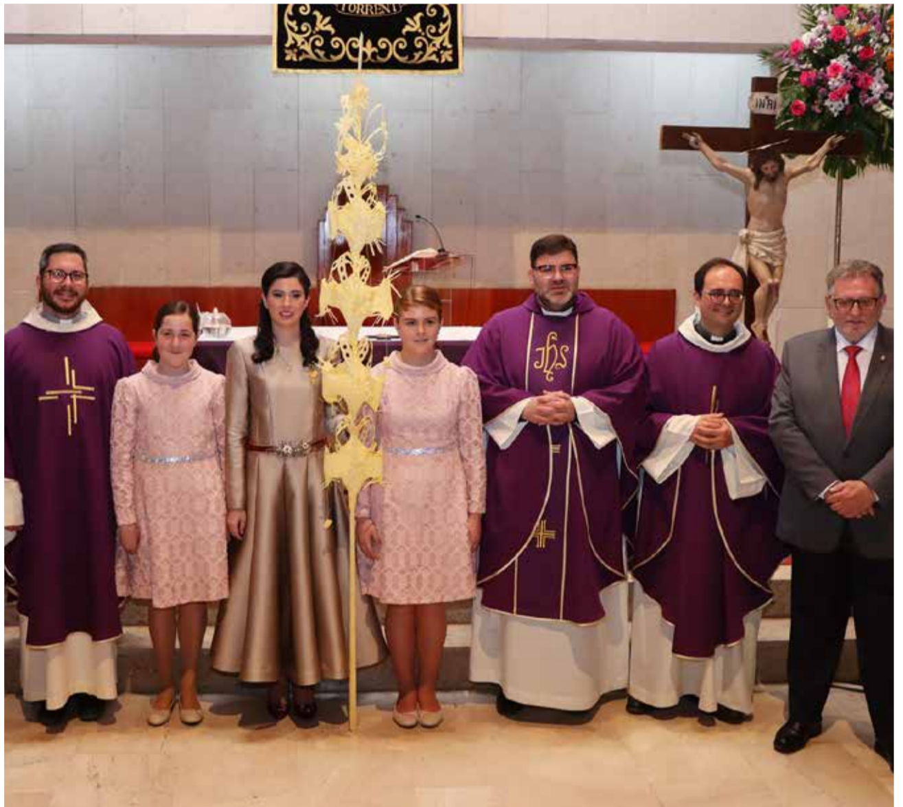
El Pregón celebrado en Torrent.

Así se dio el pistoletazo de salida a una semana repleta de actos y procesiones, que culminarán el próximo Domingo de Resurrección con el Encuentro Glorioso, el evento más significativo y representativo de la Semana Santa torrentina.