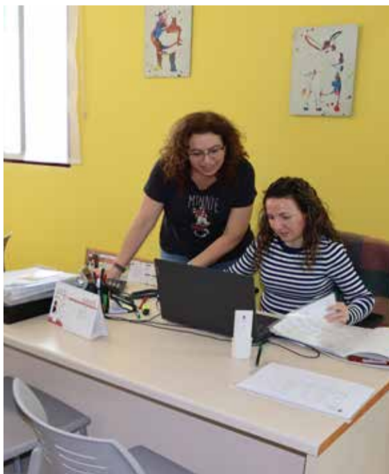
Las técnicas del departamento.

Desde el área de Servicios Sociales de Silla señalan que "era un objetivo que teníamos que conseguir, porque nuestros vecinos y vecinas se merecen el mejor servicio de atención a la dependencia por nuestra parte". El municipio se encuentra entre los pueblos que ha ejecutado, en menos de tres meses, un 96% de las peticiones.