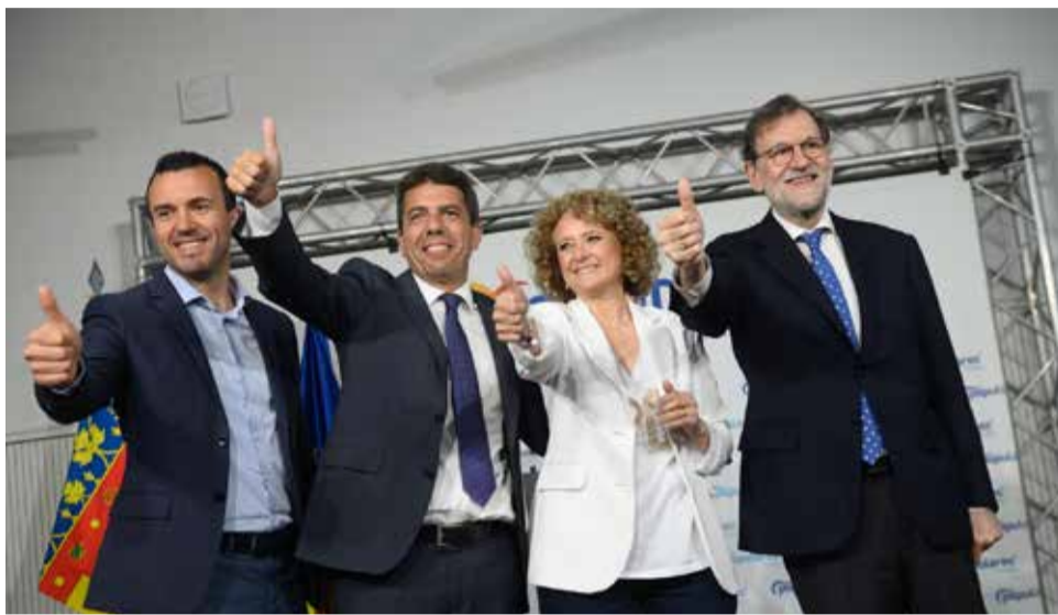
Los cargos populares con Rajoy y Folgado.

En esta línea, la candidata del PP fue la encargada de abrir el acto, en el que habló de su primer encuentro con Rajoy y del vínculo del expresidente con la localidad de Torrent. La responsable, que recibió una gran ovación de los asistentes en diferentes ocasiones, aseguró que se presentaba a la alcaldía "para ganar, gobernar, servir y trabajar por Torrent". De esta manera, bajo el lema de campaña "al amparo de Torrent", la candidata se comprometió a crear nuevas zonas deportivas para los jóvenes, ampliar las bibliotecas, impulsar be-