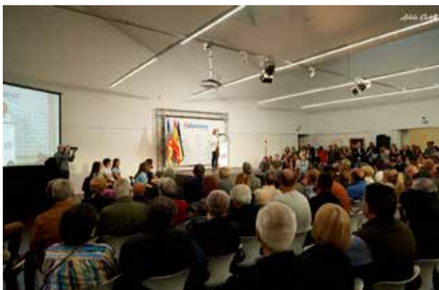
El público llenó la sala del Antic Mercat.

Por su parte, el presidente autonómico del PP, agradeció a Rajoy su presencia al ser "un valenciano más" y criticó que Torrent lleve "8 años dormido y dejando pasar las oportunidades con el gobierno liderado por Ros". Asimismo, el candidato a la presidencia de la Generalitat avanzó que si el PP gobierna la administración autonómica se llevará a cabo una "revolución fiscal", que vendrá acompañada de "más viviendas de protección oficial, un centro de salud en Parc Central, una ampliación del consultorio del