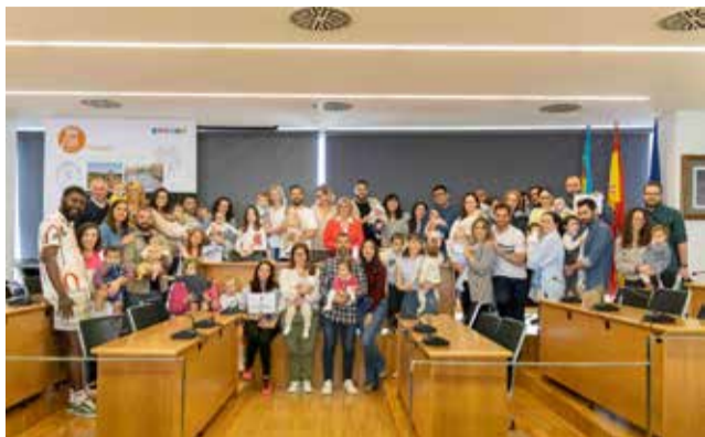
Les famílies que han participat.