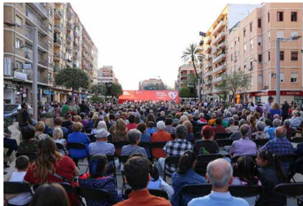
Izquierda, Bielsa y Patxi López alzan sus manos y derecha, el numeroso público asistente al acto.

EL ACTUAL ALCALDE PRESENTÓ AL EQUIPO QUE LO ACOMPAÑARÁ A LAS URNAS EN LOS PRÓXIMOS COMICIOS ELECTORALES DEL 28 M