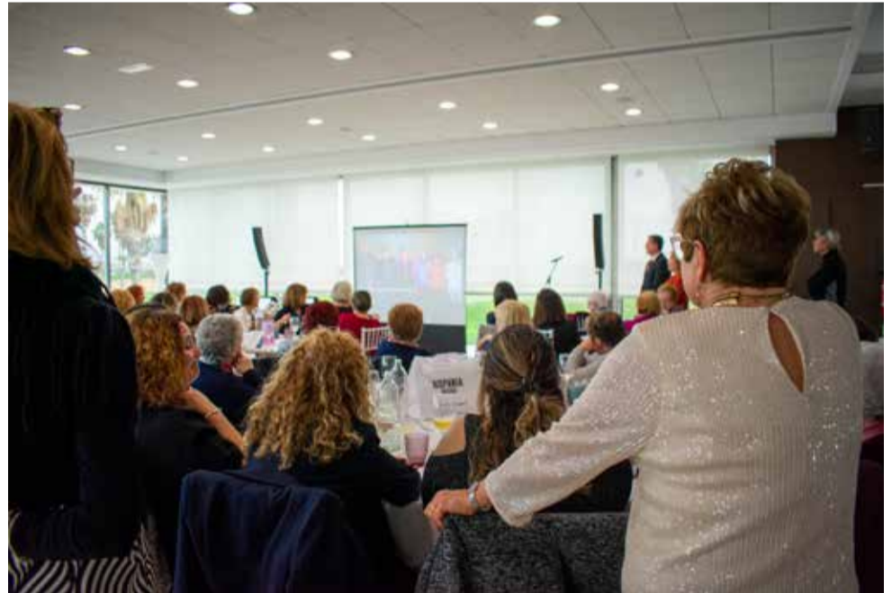
Las premiadas de esta edición, los galardones y un momento de la gala.

bor y se le anima en todos los retos que le quedan por conseguir, además de reconocerla como referente para niñas y jóvenes que quieran dedicarse a la investigación.