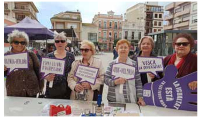
Las vecinas implicadas en la campaña.