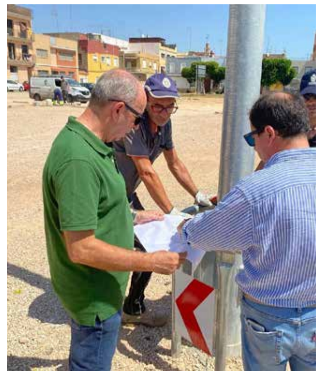
Comes visita los terrenos del aparcamiento.