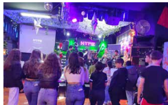
Els joves participants en el Fòrum.