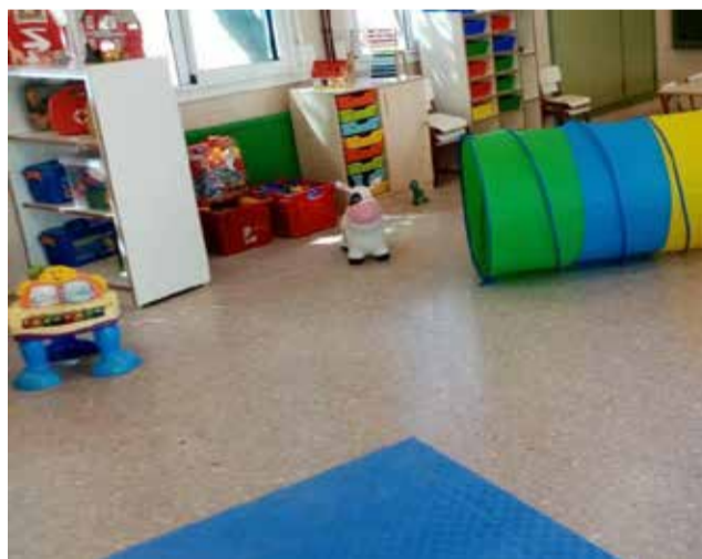
El aula del colegio Vicente Pla.

Para ello va a acometer las obras necesarias para acondicionar la vivienda del an-