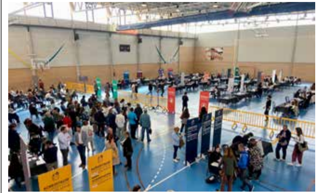
Los participantes en el evento.