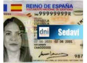
Un eixemple.

Sedaví comptarà amb una oficina per a tramitar el DNI una vegada al mes