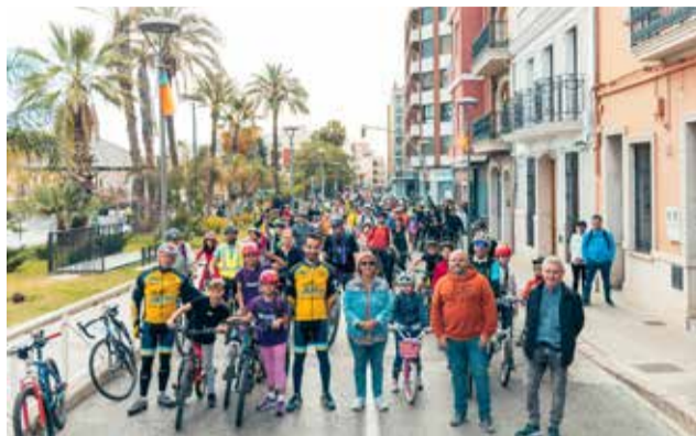
Els participants en la jornada.