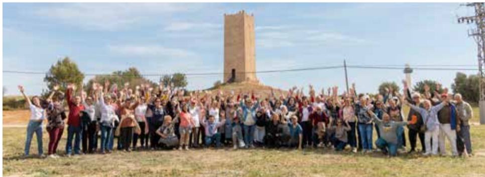
Visita a la Torre d'Espioca a Picassent.