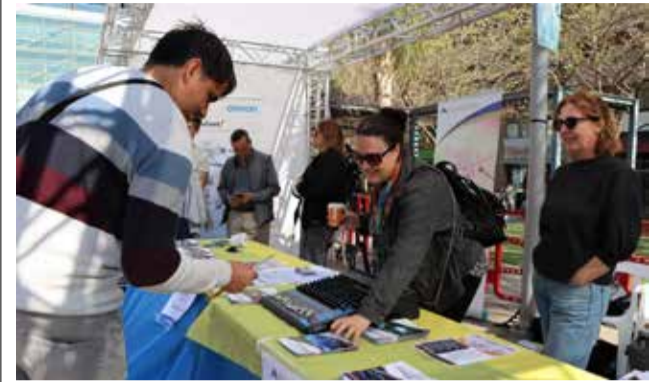
Un estudiante consulta la oferta.