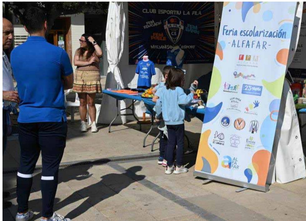
Uno de los stands informativos del evento

En el stand municipal, las familias también han podi-