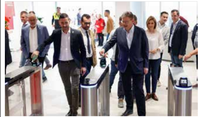
El alcalde y el presidente entran al complejo.