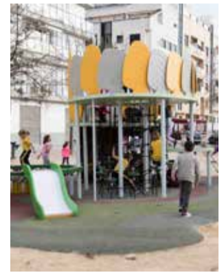
Uno de los parques.

Mucha animación y fiesta se vivió en la jornada, en la que también estuvo pre-