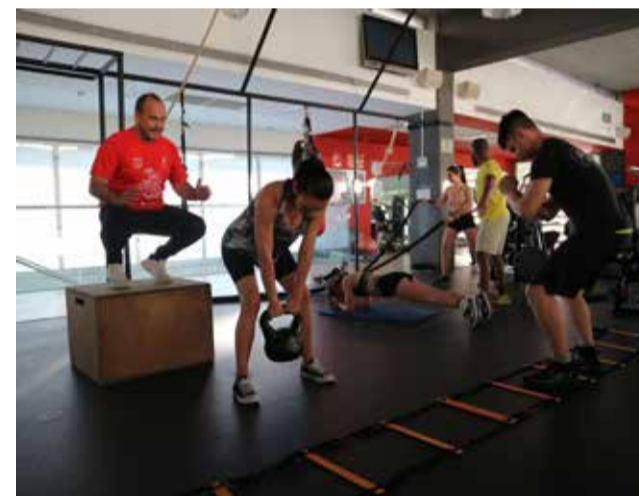
Varias de las actividades que ofrece el complejo.