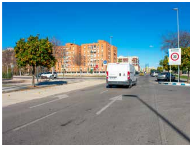
Una de las calles de la zona comercial.

Para ello, se mejorarán rotondas, se reorganizará el sentido de la circulación de diversas calles y se mejorarán las infraestructuras de la vía pública. Entre las ideas planteadas se estudia la habilitación de la continuación de la calle Pep de l'horta en