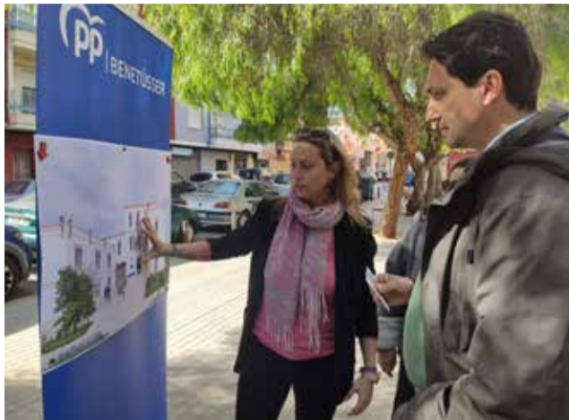
La candidata explica el proyecto.