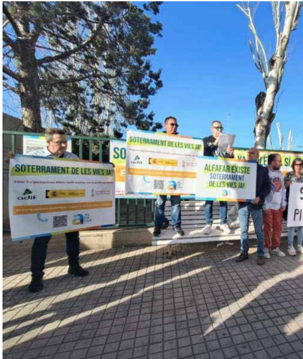
Los vecinos con los carteles en la concentración.

Durante la concentración se colocó un ramo de flores en el paso a nivel a modo de reivindicación y en homenaje a las personas que han sido arrolladas en este lugar. Además, recordaron las averías que han sufrido las barreras