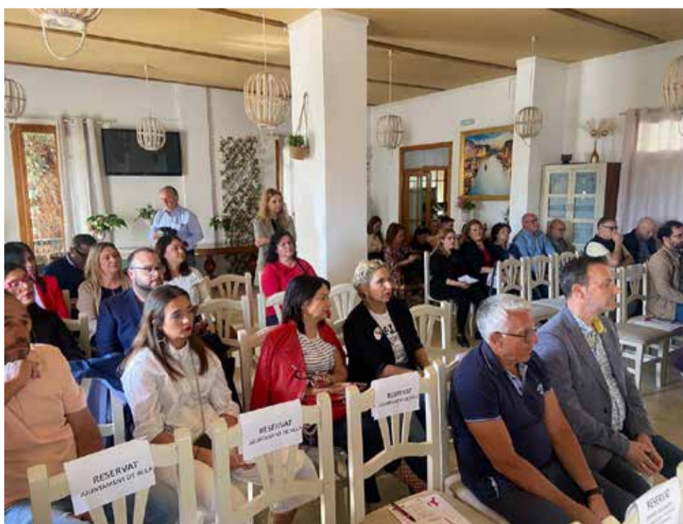
El público asistente a las jornadas.

lo importante es "hacernos visibles" y aunque hay que aprovechar los visitantes que llegan a Valencia, "el principal turista de la comarca somos nosotros mismos".