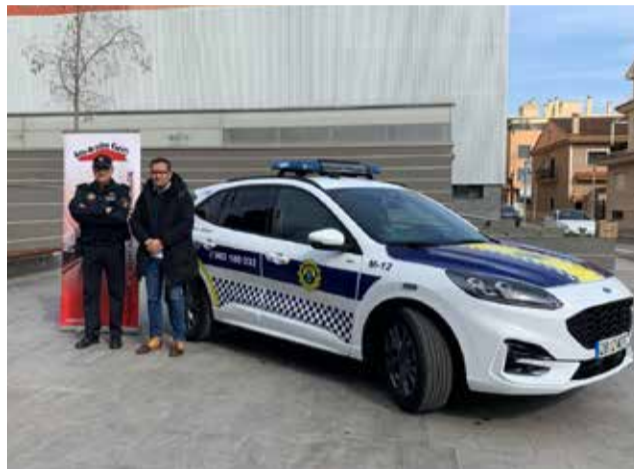
L'alcalde fa entrega del vehicle.

El primer d'ells ja ha sigut estrenat pels agents. Es tracta d'un vehicle híbrid automàtic que disposa de les oportunes mesures de seguretat i amb senyalització led i kit de detinguts. També compta amb desfibril·lador i oficina mòbil policial, per a tramitar expedients i realitzar proves d'alcoholèmia, i amb la pre-