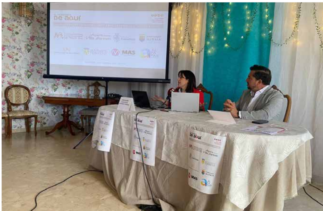
Un instante de las jornadas, realizadas en la Alquería Villa Carmen.