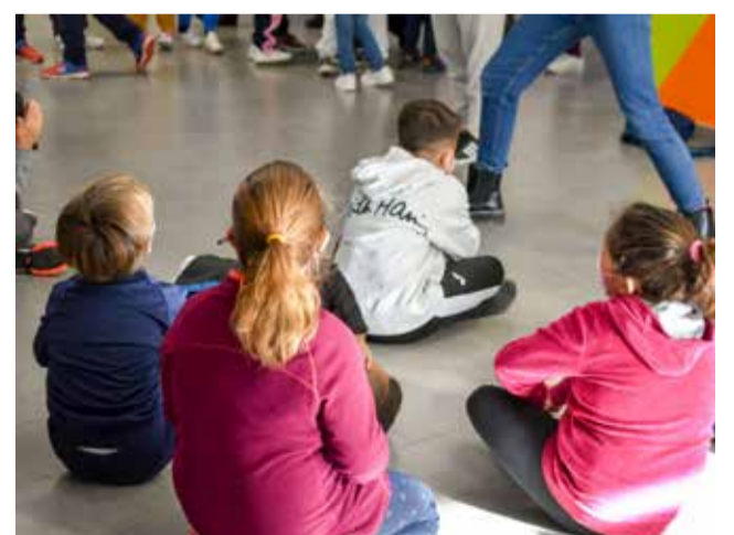
Los alumnos en la Escoleta.

En esta ocasión estará en funcionamiento el día 6 y del 11 al 17 de abril. Iniciativas como esta ofrecen un espacio flexible con oferta lúdico-edu-