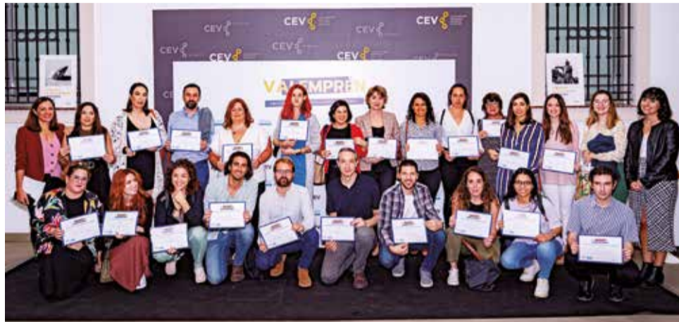
Uno de los grupos que ha participado en una de las ediciones de Valemprén.