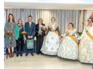
Les falles a Andorra.