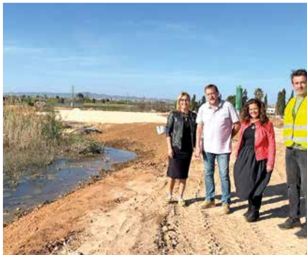
Una de las visitas al vertedero

Este antiguo vertedero de residuos no peligrosos pre-