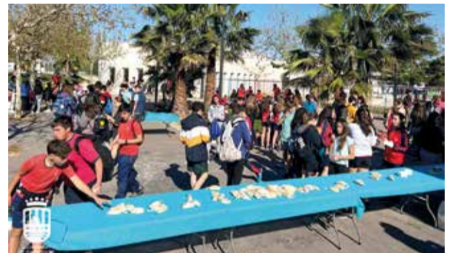
Algunes de les activitats.

esmorzar saludable gràcies a la col·laboració de les empreses locals Granny, Fruites i Verdures Gran Via, el Forn Sant Roc i Patufets. Seguidament van assistir a una xarrada sobre els hàbits saludables al món de l'esport a càrrec d'Erick Echeverria, de la Clínica Tecma Alzira. Allí, l'alumnat va poder resoldre una gran quantitat de dubtes per a poder canviar els seus