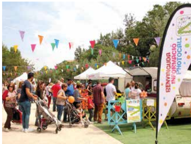
Nan@ Fest d'Alzira.

Des de l'entrada els assistents trobaran el punt d'informació del festival, on arrebregaran la polsera identificativa i podran accedir a la botiga del festival per a adquirir el seu pack del Nan@fester per 4€ (motxilla, set d'escriptura, conte de Dril, gorra, botelleta d'aigua, motxilla i ventall de les festes de Sant Bernat), i de regal