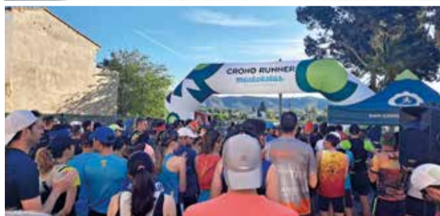
Ediciones anteriores del campeonato.