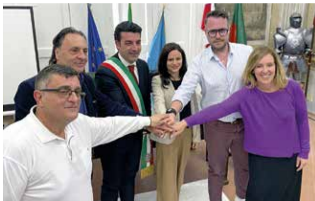
Durant la visita a Angri (Itàlia).

Ajudar als ancians i vulnerables: Les persones majors i les persones amb malalties cròniques són especialment