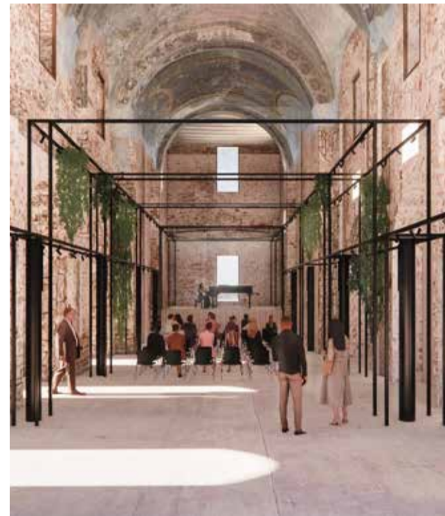
Interior i la plaça del projecte del Convent. / EPDA