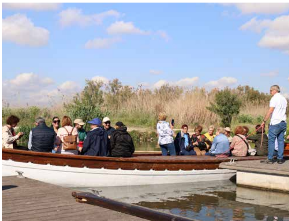
El público asistente sube a una de las barcas para el paseo.

gado de las acequias con el fin de aumentar la capacidad y mejorar la navegabilidad, en lo que se ha invertido dos millones de euros hasta 2024.