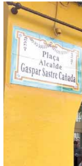
Nova plaça de Gaspar Sastre Cañada.