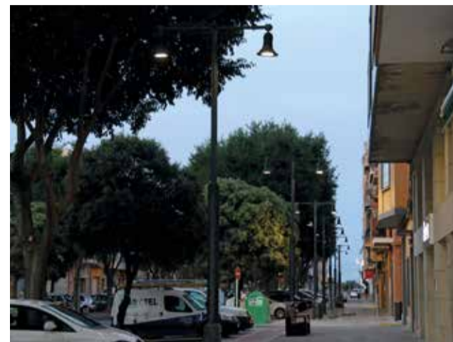
Enllumenat públic a l'Alcúdia.

En la segona fase, que es troba en fase de presentació d'ofertes fins el 19 d'abril, s'inclouen més de 600 faroles, que seran substituïdes per altres de tipus LED de potència semblant a les de la primera intervenció. L'estalvi estimat és fins i tot superior perquè afecten a elements que actualment tenen més consum i es preveu que superen els 190.000kw/h anuals. El contracte ha eixit a licitació per un preu màxim de