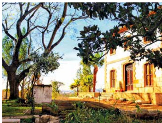
La Creueta.

ús de materials naturals, cas de la reutilització de les vorades antigues retirades en les obres de conversió en zona de vianants del centre del poble així com els troncs dels exemplars morts o en greu decadència resultants de la primera fase de neteja, que s'han reutilitzat en la mateixa finca. "La Creueta és símbol de l'Alcúdia. Un símbol a més del nostre compromís per recuperar els espais verds i posar-los a disposició de la ciutadania. Ara hem enfortit la seguretat amb la tanca perimetral i la Creueta viu