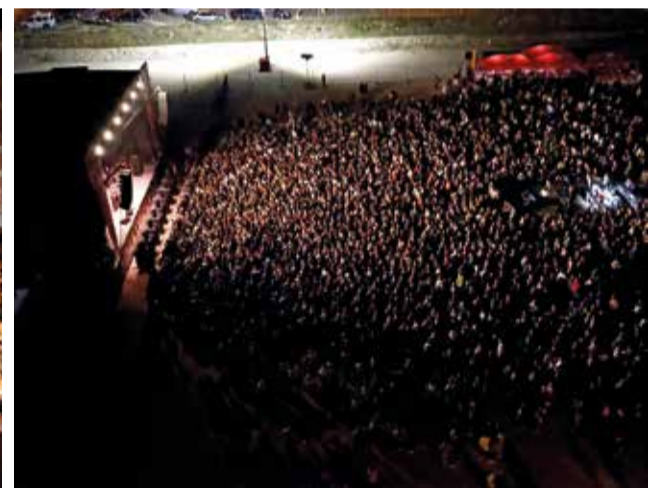
Diferents moments durant l'actuació del grup Camela a Cullera.

L'extensa i variada programació musical de les Festes Majors de Cullera conti-