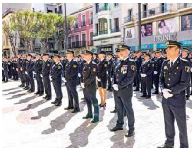
Moment de l'entrega en Elx.