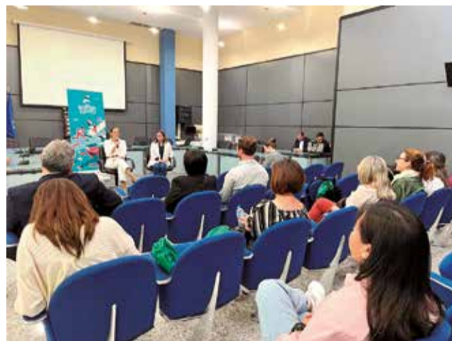
Jornada del proyecto WomenEquity.

WomenEquity es un proyecto que lidera el Ayuntamiento de Benaguasil y que aborda el acceso de las mujeres al mercado laboral desde una perspectiva europea, con el objetivo de lograr disminuir las barreras existentes y mejorar sus condiciones laborales.