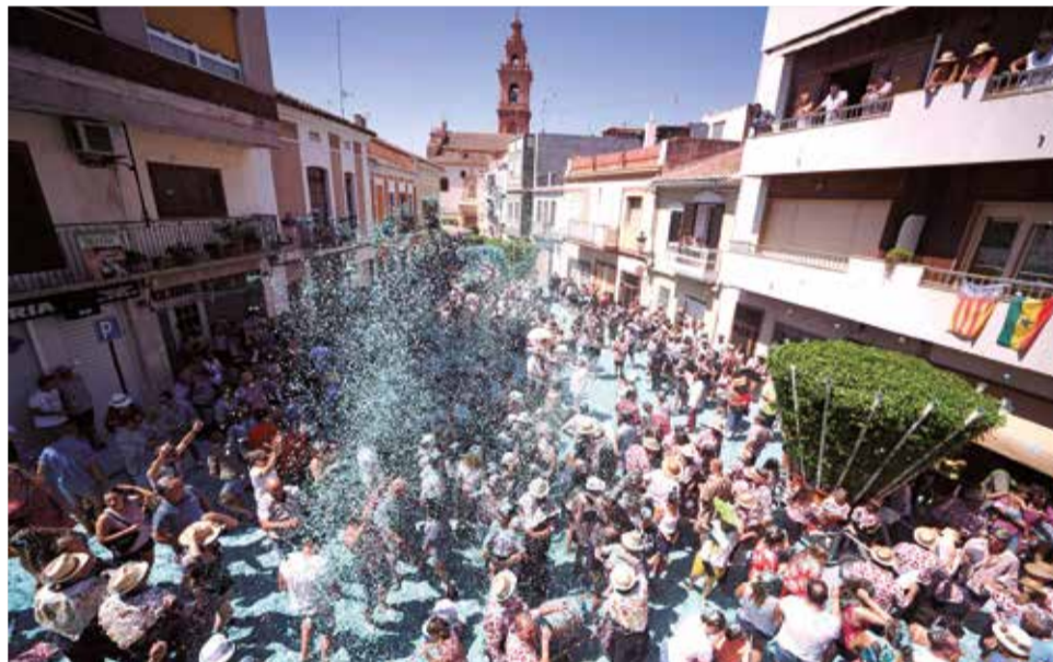
Aspecto de una de las calles de Bétera en la fiesta de Les Alfàbegues.

La Cordà, que pasa de padres/madres a hijos/as, cuenta además con figuras como la del Coheter Mayor, el Consejo Sectorial de la Cordà, una Concejalía de Fue-