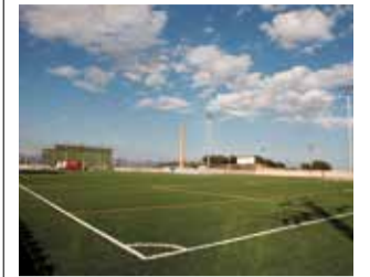
Campo de fútbol.