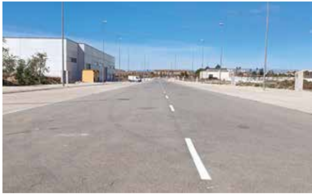
Sector Suzi-1 del polígono de l'Eliana.