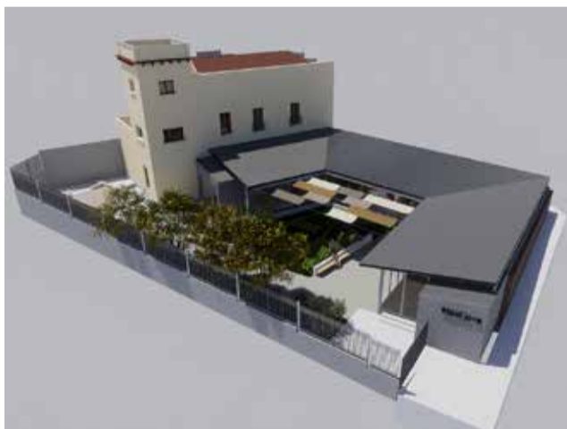
Projecte del nou espai jove de Lliria.

L'edifici s'ampliarà amb la construcció d'un nou volum, adossat a la façana nord i als murs perimetrals de la parcel·la, que es desenvoluparà entorn al jardí i albergarà la sala polivalent i la part administrativa, situada al costat de l'accés per a fer les vegades de recepció. Esta