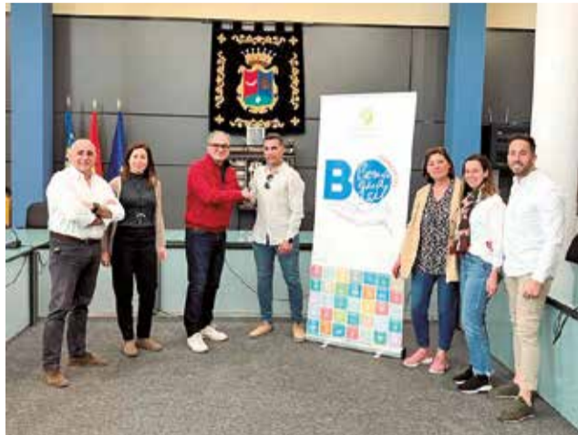
Presentación de la campaña.

La campaña, que cuenta con la colaboración de la asociación Empresaris de Benaguasil, consiste en poner en circulación bonos de 10, 20, 50 y 100 euros, que se podrán gastar en cualquiera de los comercios y establecimientos que se adhieran a la campaña.