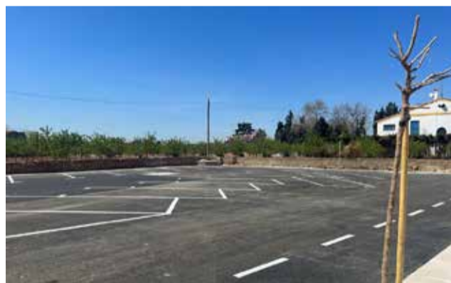
Parking en la calle Noria de Bétera.