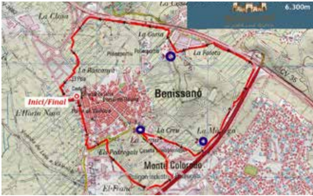
Plànol del projecte de la ronda de Benissanó.