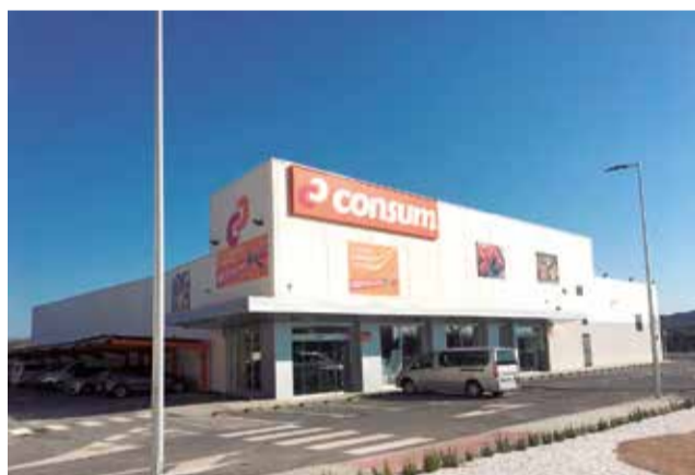
Supermercat Consum. / EPDA