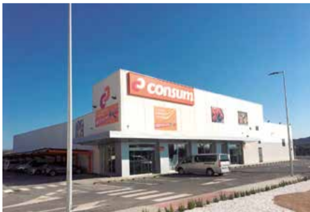
Supermercat Consum. / EPDA