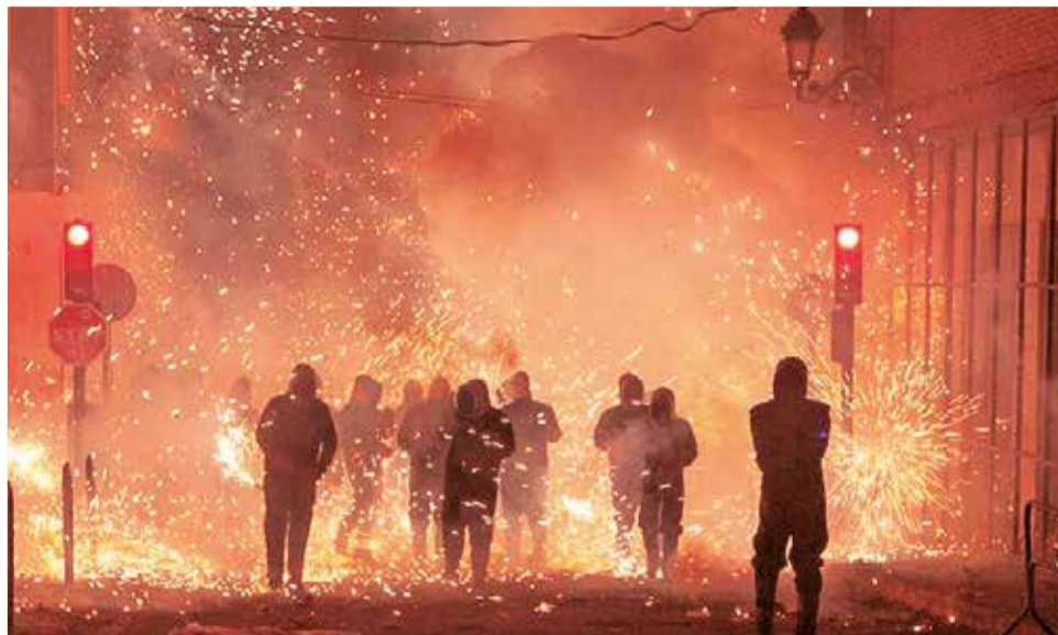
La Cordà de Paterna reúne cada año a cerca de 350 tiradores.

Las fiestas de un territorio constituyen un patrimonio de incuestionable valor. Algunas de estas celebraciones, que se suceden de norte a sur de la Comunitat Valenciana, han conseguido en los últimos años ser declaradas de interés turístico en el ámbito internacional, nacional, autonómico o local, lo que les ha dado un impulso importante. Conocemos algunas de las fiestas más turísticas de la Comunitat.