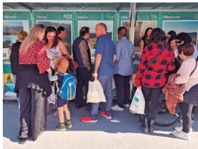
Estand d'Olocau en la Fira de les Comarques.