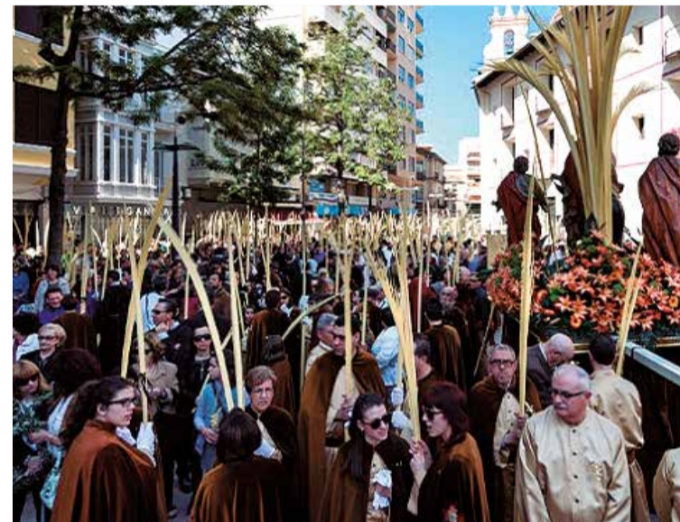
Multitudinaria celebración de la Semana Santa de Gandia.