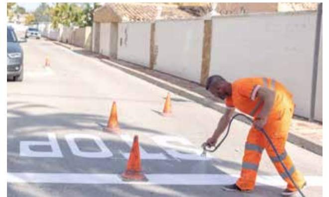
Un operario renueva la señalización viaria.