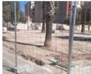
Obres del nou parc.