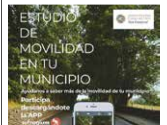
Cartell. / EPDA