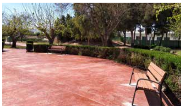
Trabajos de mejora del parque de la Morera.