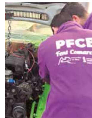
Alumnes del PFCB.

Impartits en el centre cívic El Prat de Lliria, els cursos tindran una duració de 960 hores, incloent 90 hores de pràctiques professio-