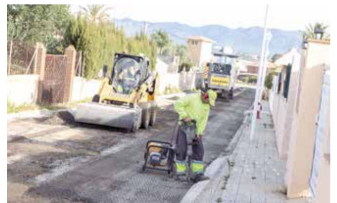
Operarios realizan trabajos de asfaltado.