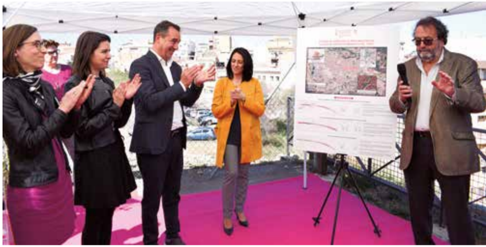
Presentación del proyecto de prolongación de la línea 9 de Metrovalencia.