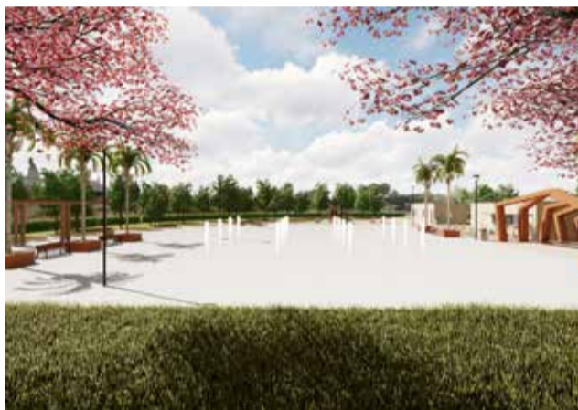
Proyecto de la pl. de la Concordia de Loriguilla.