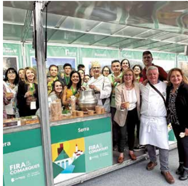
Estand de Serra a la Fira de les Comarques 2023.