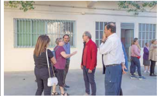
Jornada de puertas abiertas.