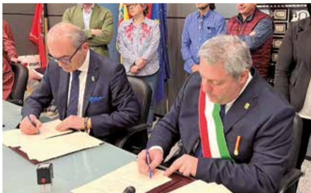
Los alcaldes durante la firma en Benaguasil.