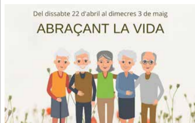
Cartell de la 'Setmana de la Gent Gran'.