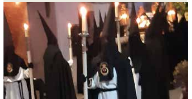
► El poble de Benissanó va celebrar les tradicionals i diferents processons de Setmana Santa entre Dijous Sant i Diumenge de Resurrecció.