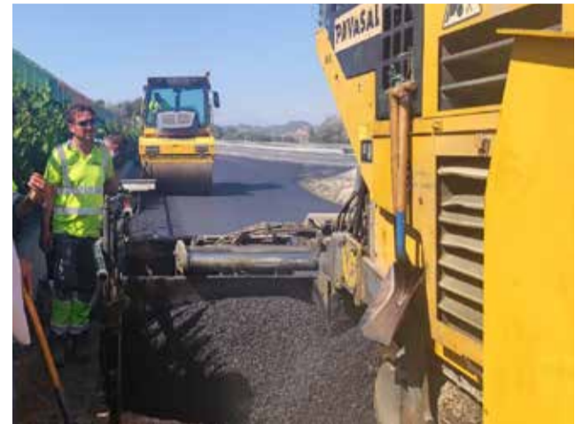
Operaris treballant en un camí agrícola.

En esta Fase 3, les zones en les quals s'estan duent a terme obres són Mulló de Crusà, Mas del Moro, l'accés al Pont de Ferro, Canya La Diega i els voltants, i finalitzaran al llarg dels mesos de març i abril.