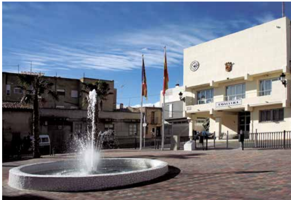
Ayuntamiento de Casinos. / EPDA

Navarré explicó que, desde un punto de vista financiero, una de las políticas fundamentales del Equipo de Gobierno "ha sido la reducción de la deuda, para evitar que un aumento de los intereses obligase a ha-