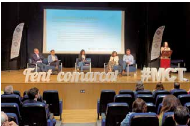
Jornada celebrada al teatre de Marines.

La cita va congregar a representants del sector públic i privat i va comptar amb diferents taules rodones. En elles, es va destacar el fet que existixen 194.000 habitatges en sòl no urbanitzable en la Comunitat Valenciana, de les quals prop de 103.000 són legalitzables i al voltant d'11.000 es troben a la comarca de Camp de Túria.