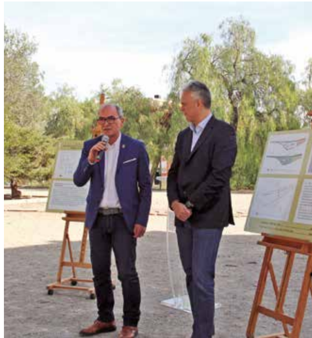
Presentación del proyecto de transformación de la 'Antiga Estació de Dalt' de Benaguasil.