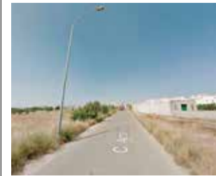
Pista del Arzobispo. / GM