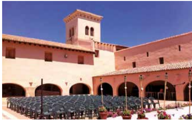
Plaza interior de la Torre del Virrey de l'Eliana.