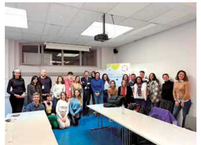
Jóvenes de Benaguasil en Bruselas.