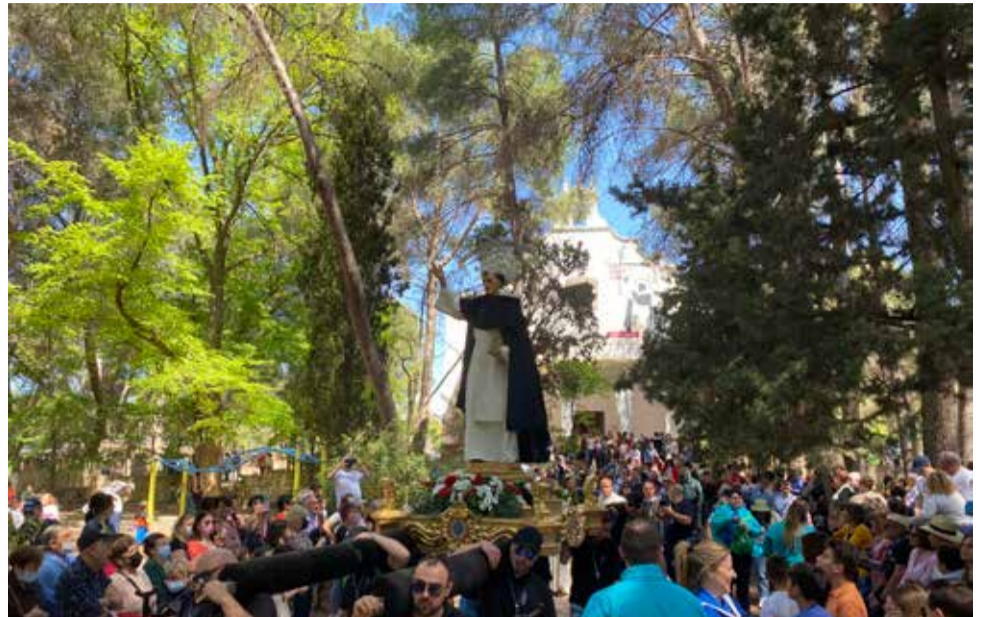
Tradicional rogativa de Sant Vicent en Lliria.