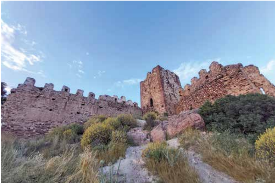
Estat actual del castell de Serra, declarat Bé d'Interés Cultural.