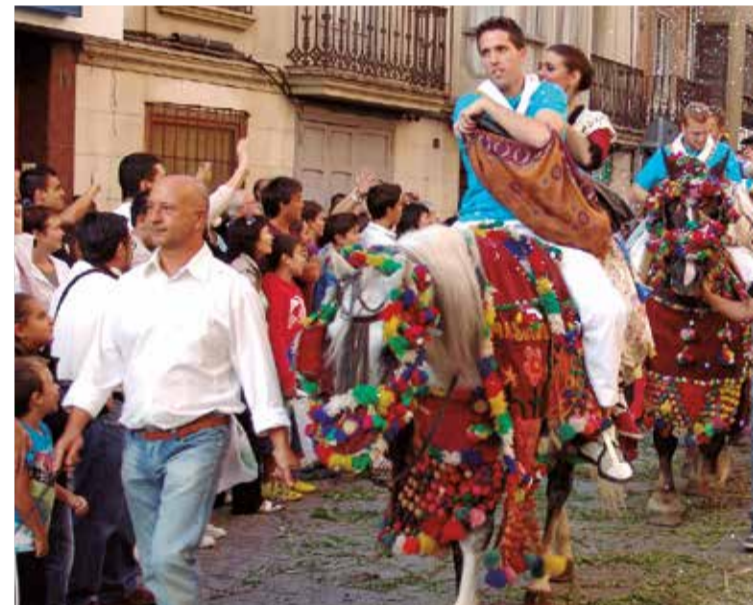
Componentes de la comisión de toros lucen su indumentaria en la Fiesta del Arroz de Sueca.

Es, por ejemplo, la llamada 'Enramada'. Se trata de un paseo que el segundo domingo de fiestas y a las ocho