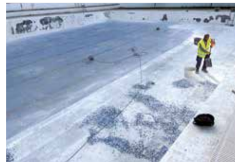
Trabajos de rehabilitación y mejora en la piscina municipal de Náquera.

zación 'El Peucal' por un valor de 140.330,96 euros y la Red de Saneamiento de la Urbanización 'Els Trencalls' y C/ Canónigo Manuel Pérez por 374.797,50 euros. En ambos casos, están ya firmadas los actos de comprobación de replanteo y, por lo tanto, en fase de empezar la ejecución de las obras.