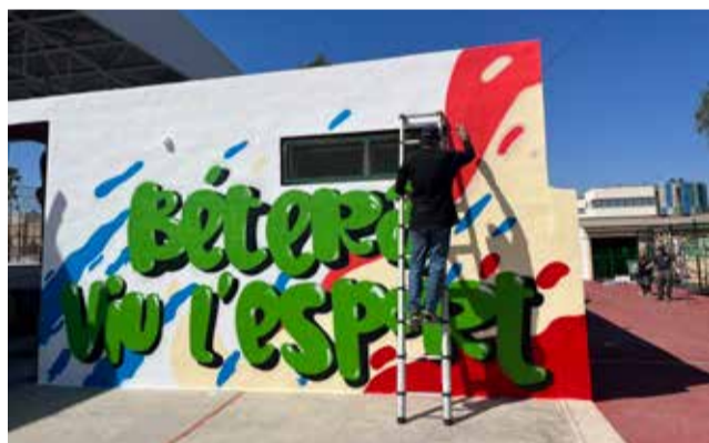
Grafiti en el polideportivo de Bétera.