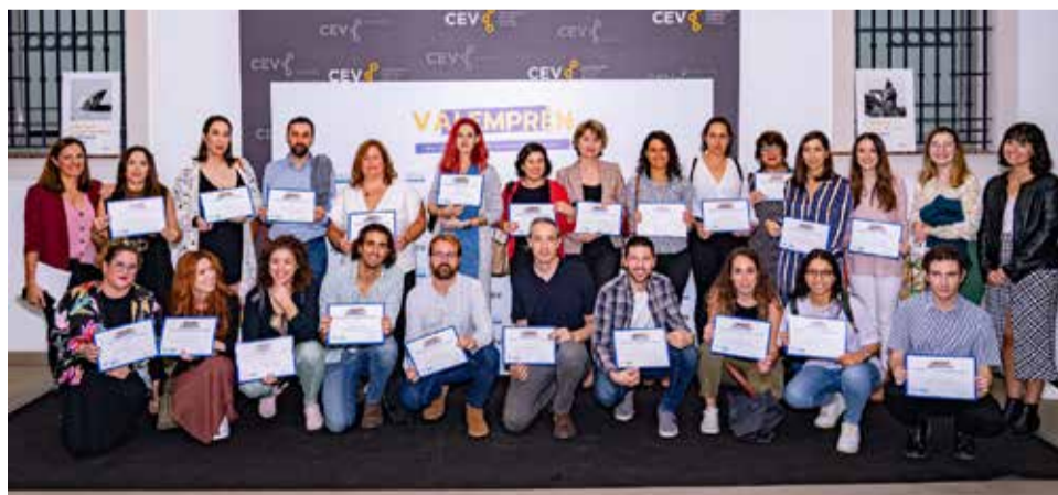
Uno de los grupos que ha participado en una de las ediciones de Valemprén.

La inscripción al programa está ya abierta hasta el