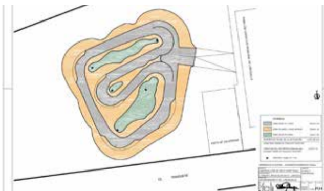
Plano del proyecto.