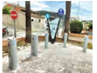
Nou pàrquing.