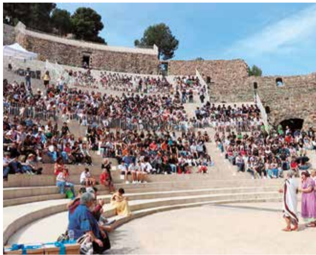
El alumnado llenó el Teatro Romano.