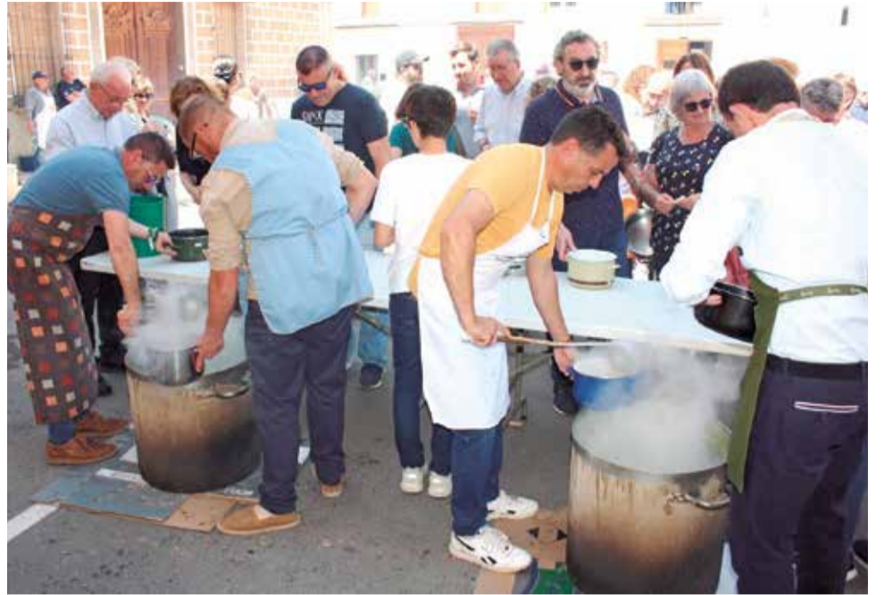
Dances i repartiment de les calderes en el dia de Sant Pelegrí, festivitat gran del municipi.