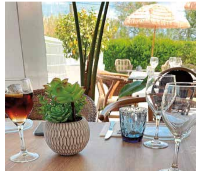
Terraza del hotel restaurante Els Arenals.