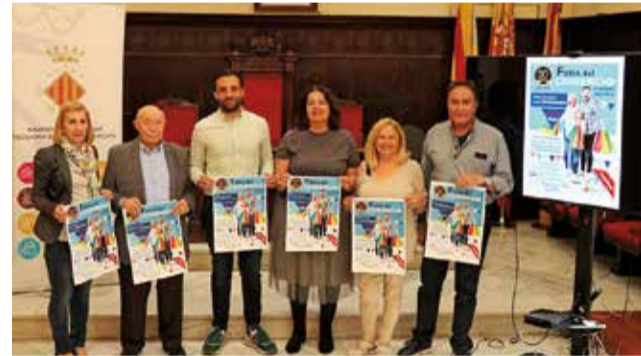
Presentación de la campaña.

En relación a las actividades programadas para el público infantil, el 6 de mayo se celebrará un concurso de dibujo a las 17 horas. Asimismo, tanto el 6 como el 7 de mayo entre las 11:30 y las 13:30 horas se desarrollarán talleres de cocina marinera.