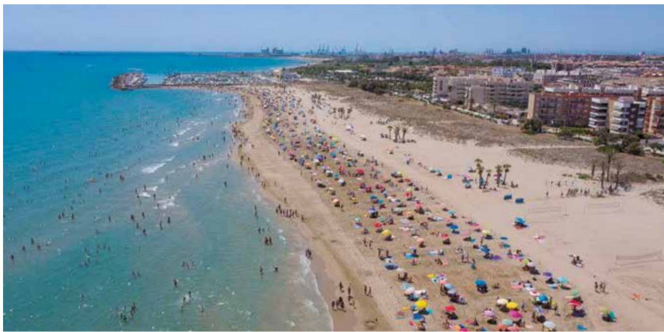
Vista de la platja del Racó de Mar de Canet d'en Berenguer.

■ L'OCUPACIÓ HOTELERA ACONSEGUIX EL 98% I L'HOSTALERIA PENJA EL CARTELL DE COMPLET