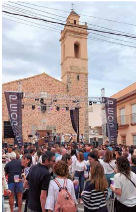
Alguns dels actes organitzats dins de la programación cultural.