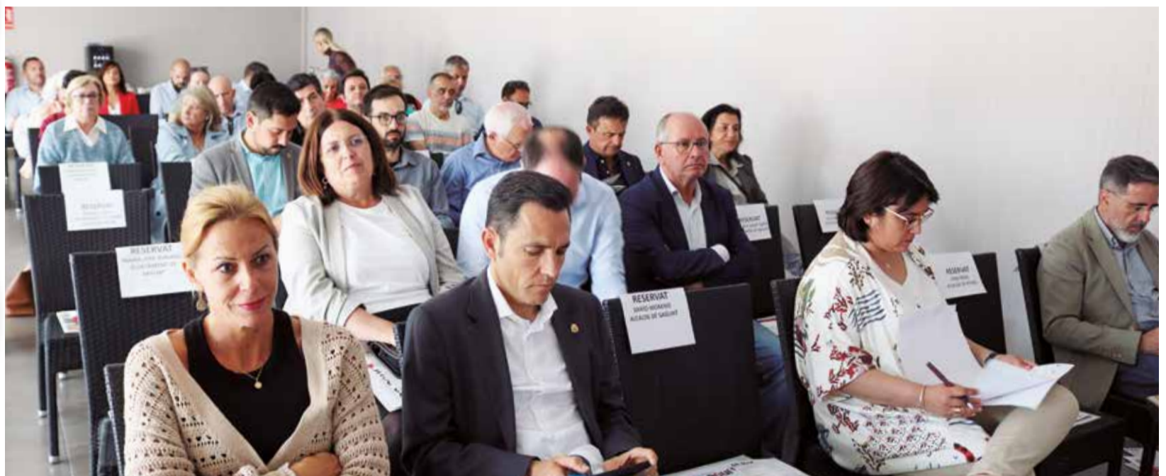
Público en las IX Jornadas de Turismo en el Camp de Morvedre organizadas por el El Periódico de Aquí.