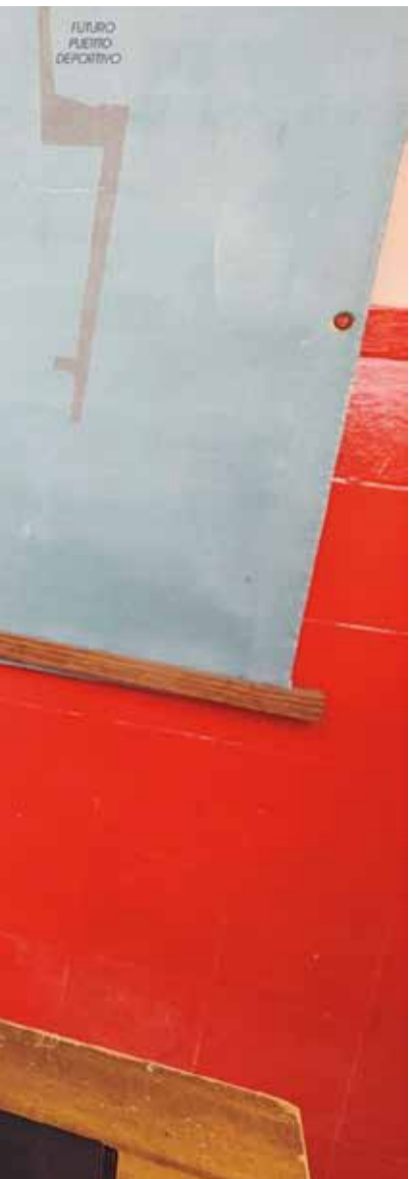
e Aquí. / EPDA