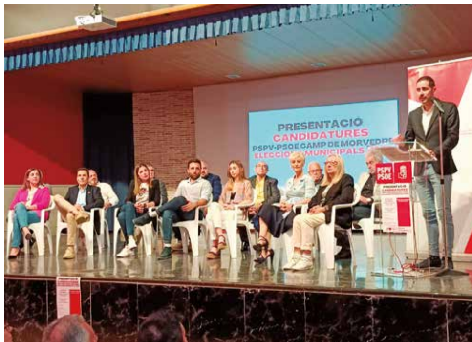
Un instante de la presentación de las candidaturas en Algar de Palància.

Carlos Fernández Bielsa marcó el objetivo de conseguir que el PSOE gobierne en los 16 ayuntamientos del Camp de Morvedre después del 28 M