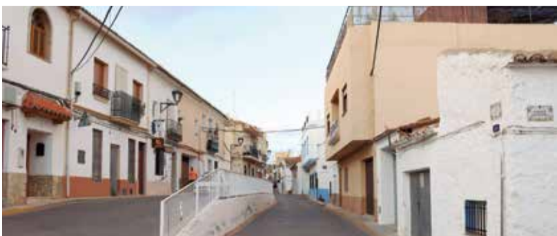
Una calle de Alfara de la Baronia. / B. P.