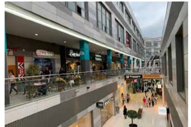
Anuncio de la apertura.

Desde la Gerencia el Centro Comercial Lepicentre, también transmiten que la firma con la empresa Ozone Bowling, es el complemento perfecto para continuar reafirmandose como el mejor centro de ocio, moda y restauración del Norte de Valencia. Ya que actualmente el Centro cuenta con las marcas líderes del retail como: Lefties, Pepco, H&M, JD Sports, Stradivarius, Mango, Celio, Ulanka, Misaco, Pepco, KIK etc; junto con la mejor restauración por variedad y calidad, como: Sona, Tagliatella, Kyoto, TGB, 100 montaditos, Asoko, etc. y la próxima inauguración del local de comida asiática INKU, con un local de diseño y alta cocina. Además del ocio más divertido para los peques de la casa con LEPILANDIA con sus más de 5.000 metros cuadrados de Ocio, combinando, multiaventura de tres alturas,