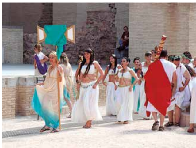
Participantes en los 'Ludi'.

El XXVI Festival de Teatro Grecolatino de Sagunto, finalizará el próximo sábado 17 de junio con la obra La Suegra de Terenci, representada por el grupo Clípeo Teatro del IES Santa Eulalia de Mérida.