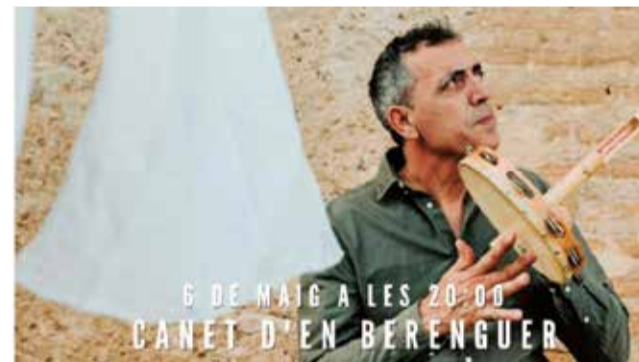
Cartell de Pep El Botifarra.

La programació de maig inclou a més l'exposició de pintura d'Egon Possehl «Retrospecció», que s'inaugurarà divendres que ve 5 de maig i romandrà oberta fins al 27. Una mostra sobre art abstracte, ple de plans de color, surrealisme i simbolisme, tècnica que li ha valgut a l'artista alemany per a rebre diversos premis i condecoracions. La mostra podrà visitar-se de dilluns a divendres, en horari de 9,30 a 20,30 i els dissabtes, de 10 a 13 h. i de 16,30 a 18,30 h.