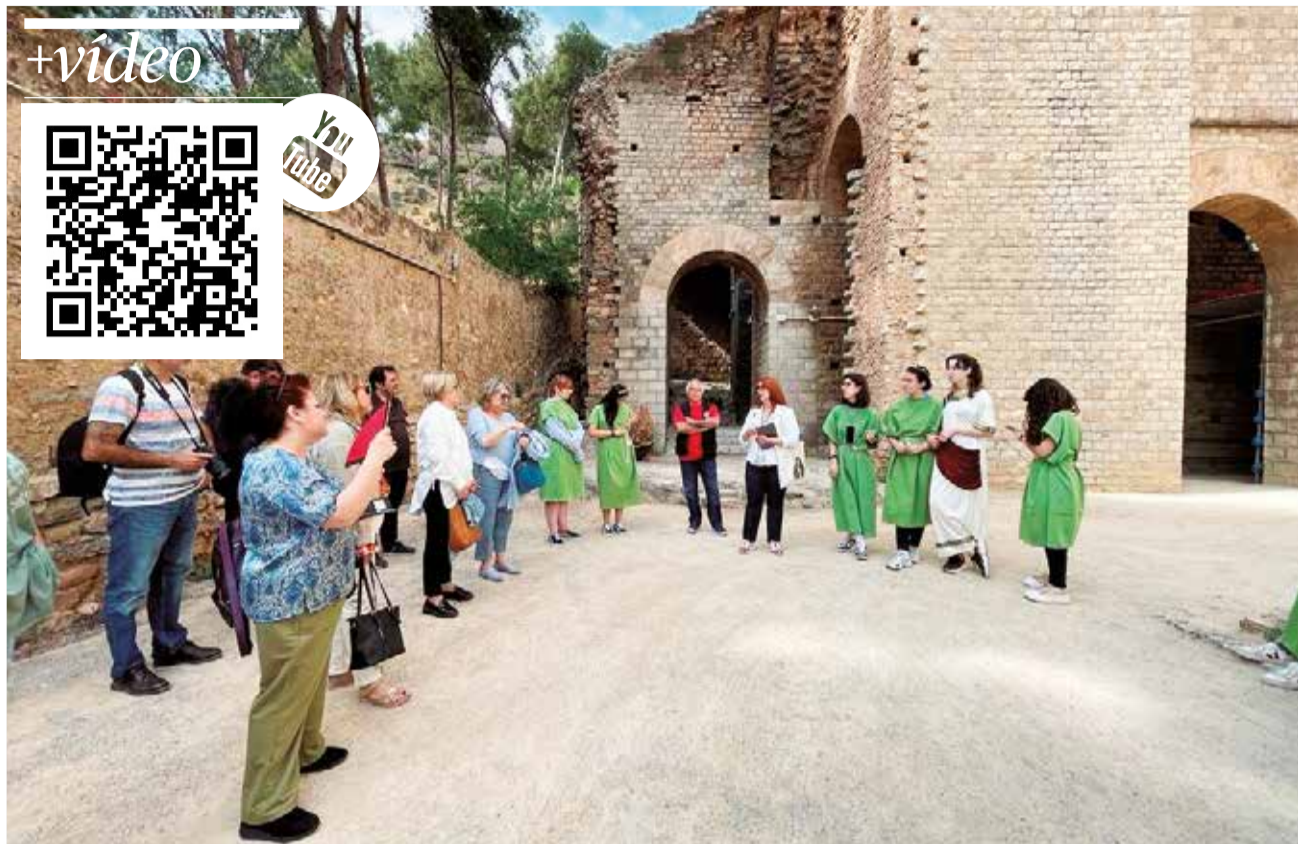
Un momento de la visita por el casco histórico de Sagunt, primer acto de las IX Jornadas de Turismo.

Las ponencias arrancaron a las 12 del mediodía, ya en Els Arenals. Fueron moderadas por el presidente del Grupo El Periódico