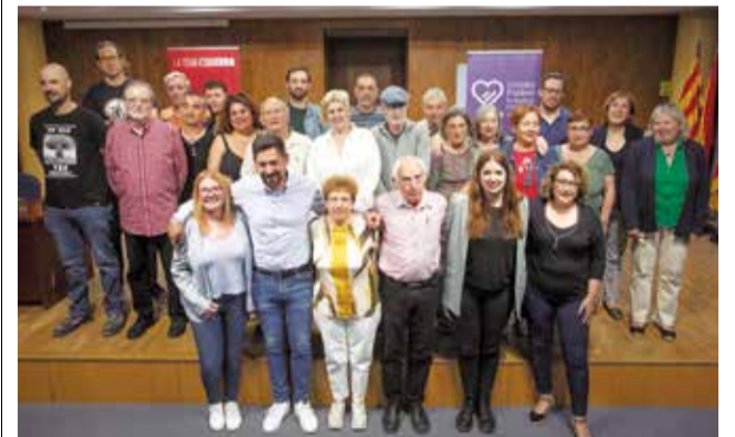
Integrantes de la lista de EUPV-UP en Sagunt.