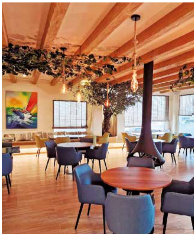
Instalaciones del restaurante La Perla, ubicado en el Club Náutico de Canet.

Sin embargo, hasta finales de julio de 2022 Crespo no recibió la licencia de apertura de manos de la Junta del Club, que durante todos