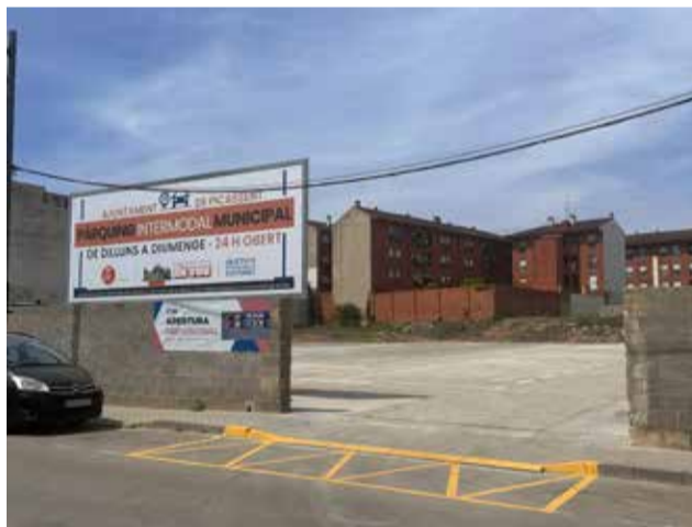
L'accés a l'espai per aparcar / EPDA

A més amb esta actuació, emmarcada dins de l'Estratègia municipal de mobilitat sostenible, la ciutadania compta ja amb 80 noves places d'aparcament públic a aquesta zona, les quals venen a sumar-se a les vora 500 existents a tot el municipi.