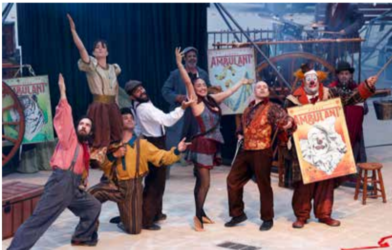
Los componentes de la compañía La Fam.