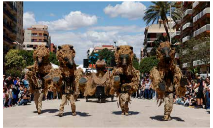
La función de Tutatis en las calles del municipio.