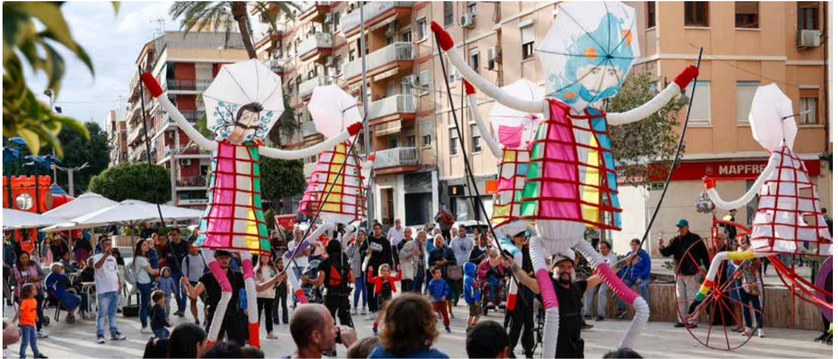
El público contempla el espectáculo de calle de Yera Teatro.

La última jornada del MAC arrancaba el domingo por la mañana con un espectáculo itinerante de la compañía Tutatis y sus Osos del Pirineo, unas marionetas gigantes manipuladas por actores y con música de percusión como gran protagonista.