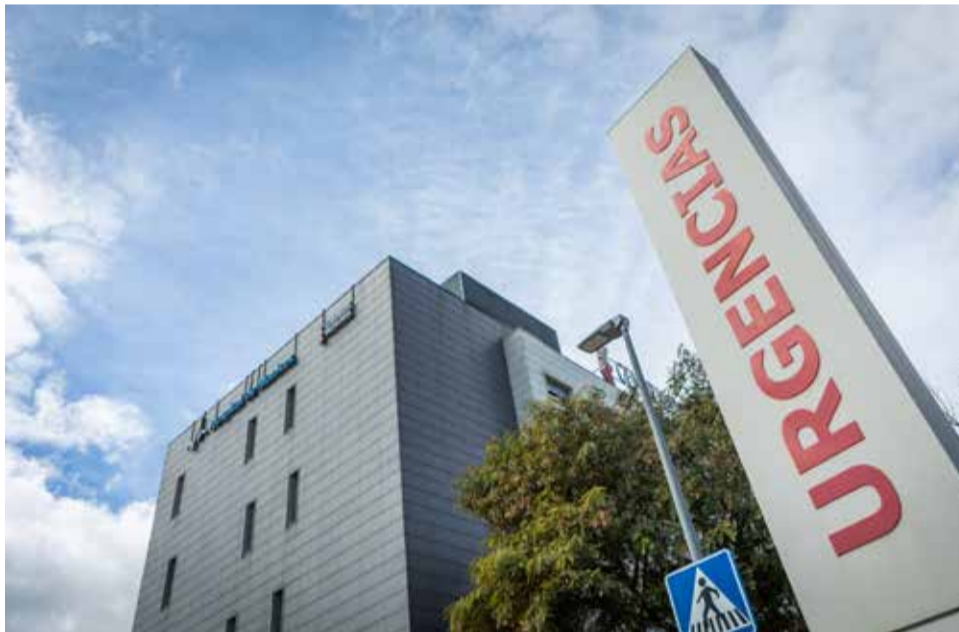
La fachada del hospital de Manises.