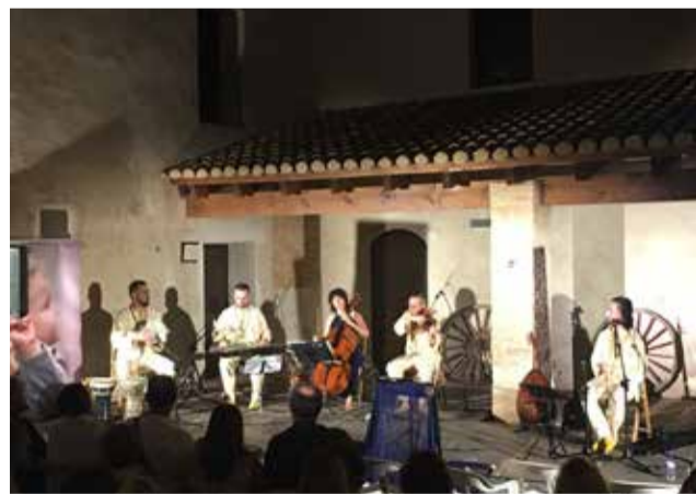
Una de las actuaciones en l'Alqueria.

Esta actuación se engloba dentro de la iniciativa Nits a l'Alqueria, que busca potenciar a través de un ciclo de conciertos la música clásica y antigua con actuaciones en este enclave único de Alfa-