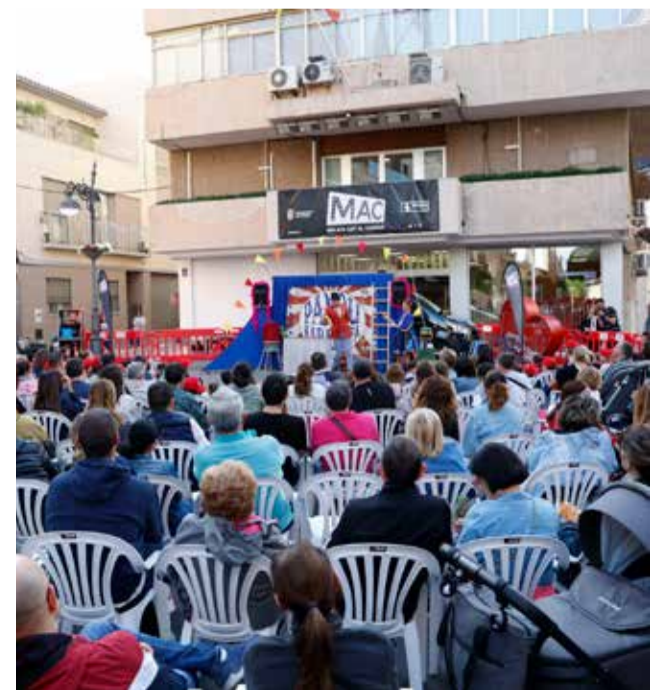
Las personas asistentes a una función.

Miles de espectadores han presenciado los más de 20 espectáculos que había programados en esta décima edición del MAC, que ya es un referente de la cultura accesible para toda la ciudadanía