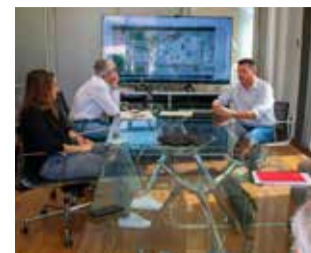
La reunión. / EPDA