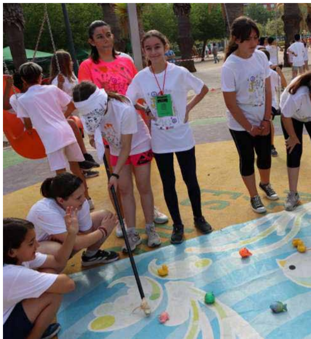
Els alumnes participen en un joc.

L'objectiu és recaptar fons per a projectes destinats a països del tercer món i consisteix en ensenyar els xiquets i xiquetes, a través de