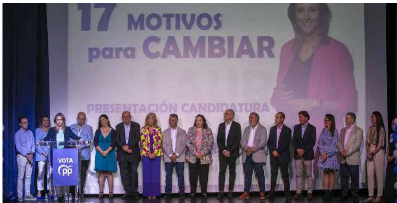
Un momento de la presentación de la candidatura en El Molí.

Tras conocer a las 16 personas que la acompañan en este proyecto de transformación, la candidata popular destacó que “serán los vecinos los que nos marcarán la hoja de