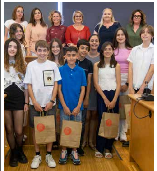
El alumnes premiats.