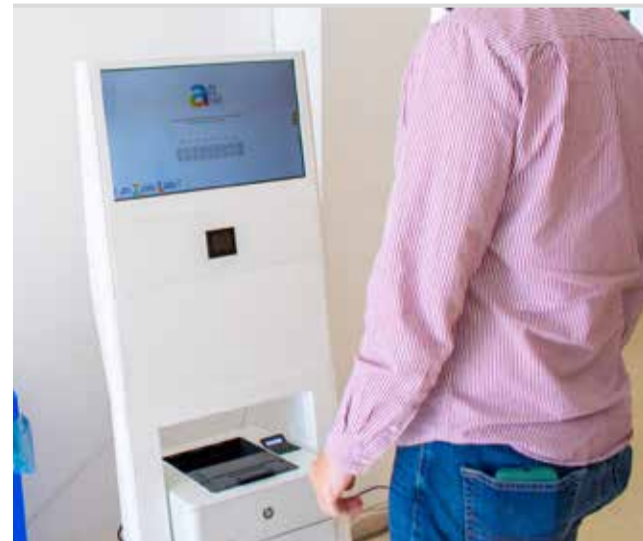
Una persona utiliza uno de los puntos.

Además, el sistema también cuenta con la función para solicitar cita previa en los SAC, reduciendo así los tiempos de espera y atención en el punto de información. A través de los puntos de autotramitación también se puede realizar el pago de recibos municipales.