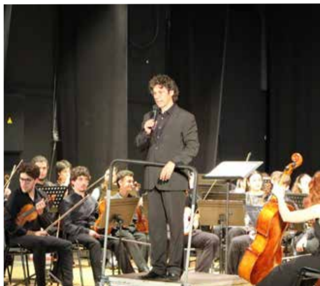
El director se dirige al público. / CARMEL FOLCH