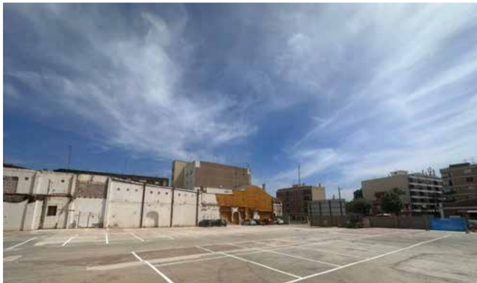
El nou aparcament públic que s'ha habilitat.

La parcel·la, ubicada al carrer Estació, té una superfície de 4.146 metres quadrats. Un aparcament intermodal que pot ser utilitzat tant per les persones residents a la zona y, també per totes aquelles que viuen a les urbanitzacions o zones més allunyades i utilitzen el metro com a mitjà de transport públic.