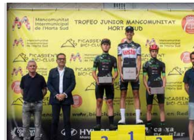
Los ganadores de la competición.