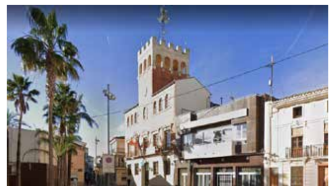
La façana de l'ajuntament

Concretament, en el cas de l'àrea d'Urbanisme i Medi Ambient, no només s'han posat en marxa diferents portals d'informació ciutadana, com el portal del PUAM (Pla Urbà d'Actuació Municipal) per a la consecució dels objectius de l'Agenda 2030; el portal de Subministraments Energètics, que mostra l'evolució i distribució de la despesa pública de llum i gas; o el portal Sentilo Smartcities amb