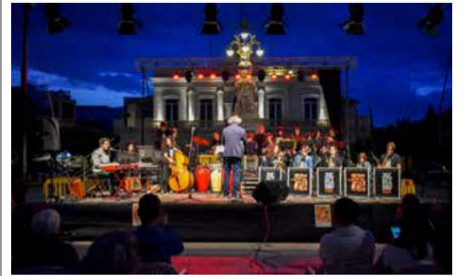
Una de las actuaciones.