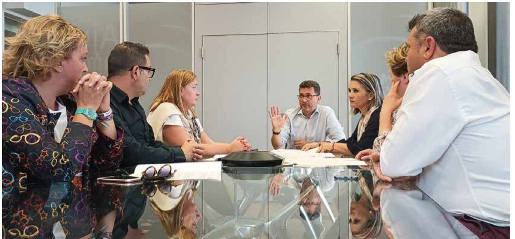
Los alcaldes se reúnen con los vecinos.