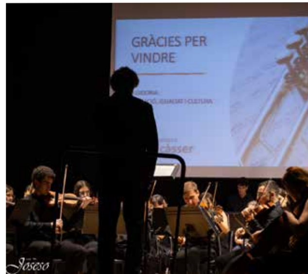
La orquesta tocando.