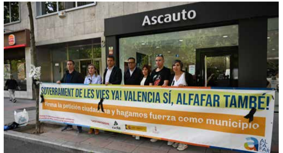
Los primeros ediles en Madrid, con miembros de la Plataforma.

Los alcaldes estuvieron acompañados por representantes de la Plataforma por el Soterramiento que han viajado hasta Madrid para llevar sus reivindicaciones vecinales tras la última muerte que se cobró el paso a nivel y que se ha convertido en la víctima número 75 y la tercera en menos de ocho meses.