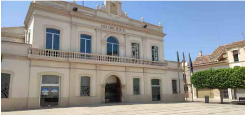
La fachada del ayuntamiento.

El Ayuntamiento de Alfafar ha organizado diferentes reuniones con los afectados, así-