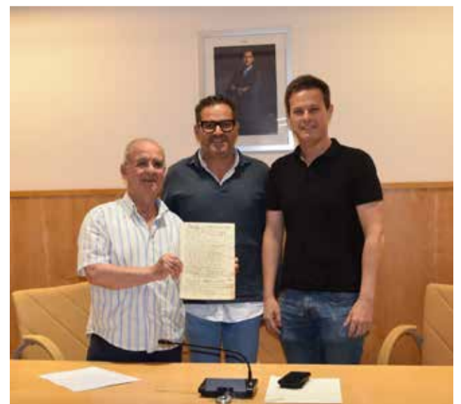
L'acte d'entrega de la còpia del document.