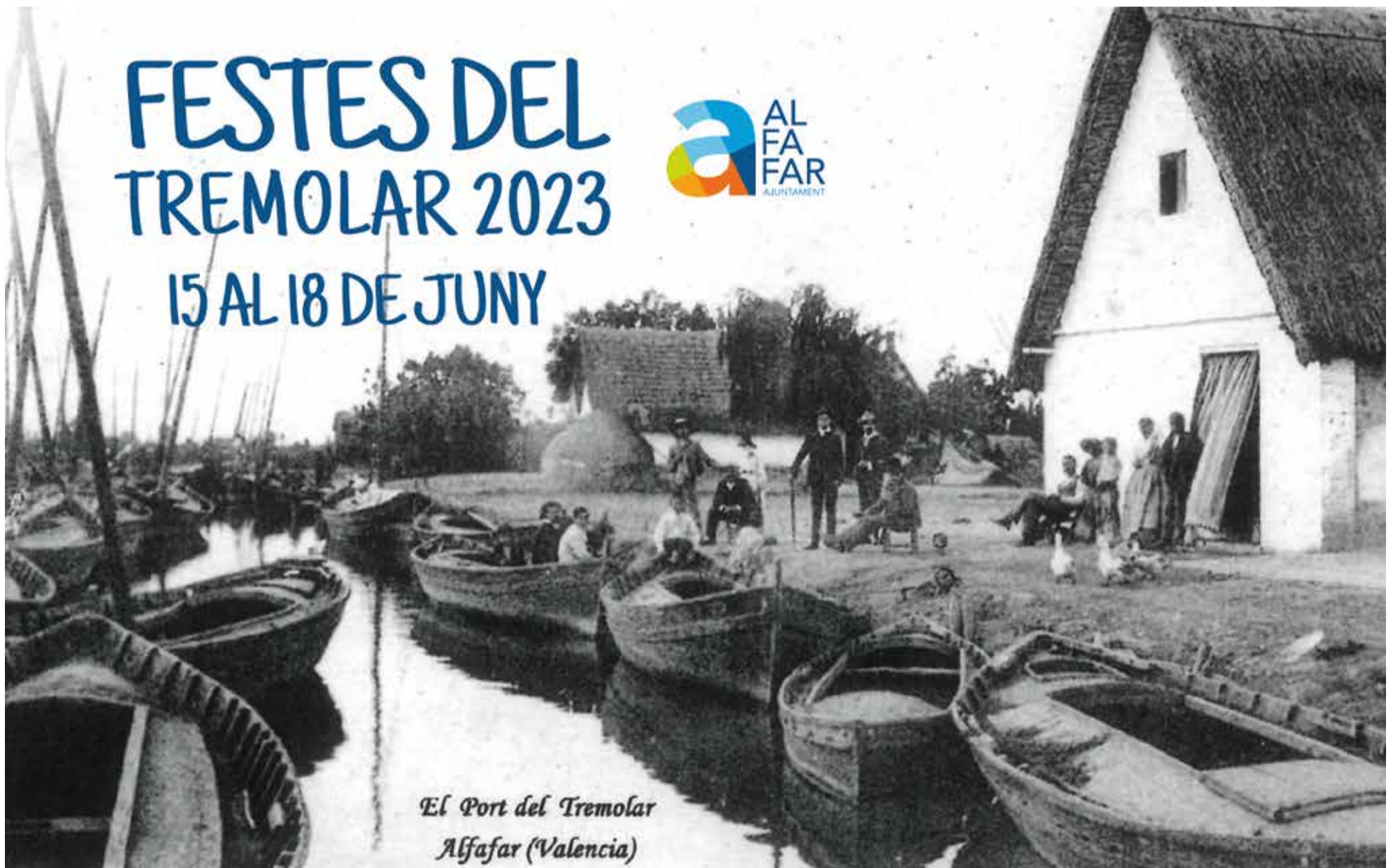
El Port del Tremolar Alfafar (Valencia)