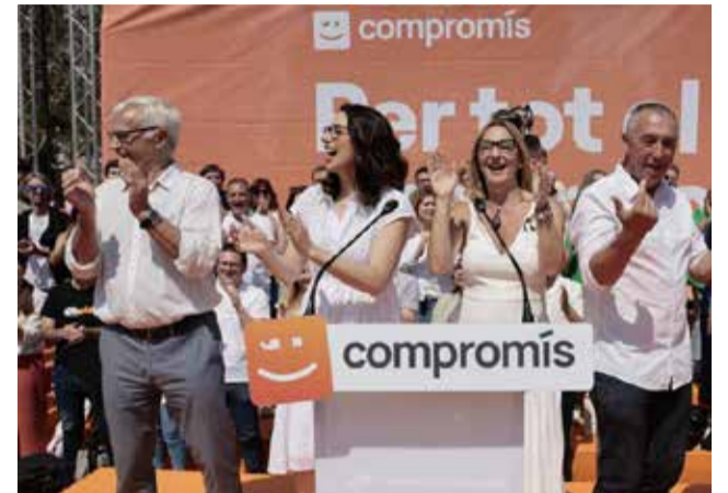
Los candidatos de la formación en el acto.