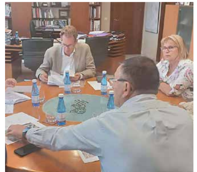
Un moment de la reunió.

El conseller de Sanitat s'ha compromés a iniciar el procés per què estes peticions proposades per l'Ajuntament de Picassent es porten a terme al llarg de 2024, dins de la política de l'actual Conselleria de Sanitat d'apropar els serveis bàsics a la ciutadania després de l'increment en recursos professionals que ha tingut el Centre de Salut de Picassent.