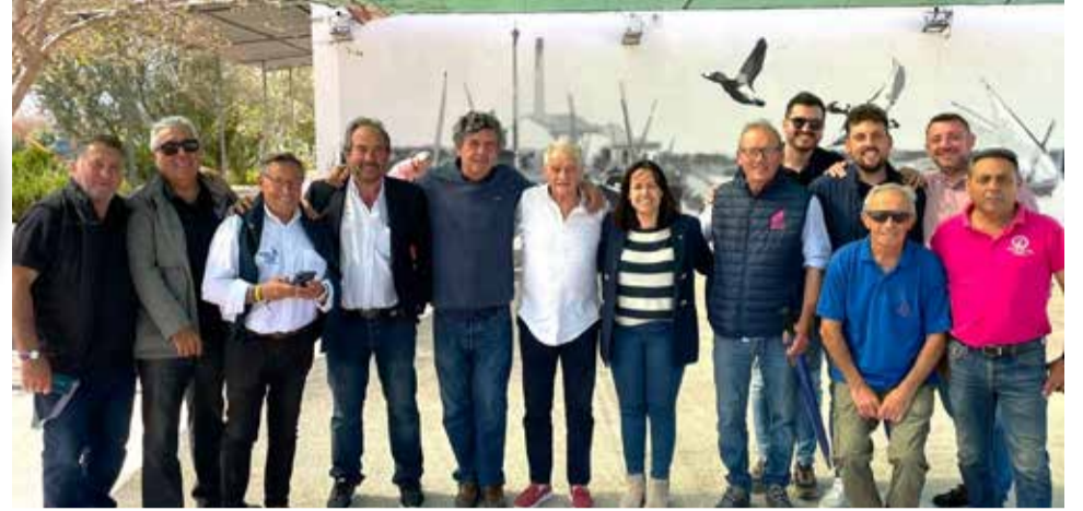
Los representantes de las asociaciones de vela latina.