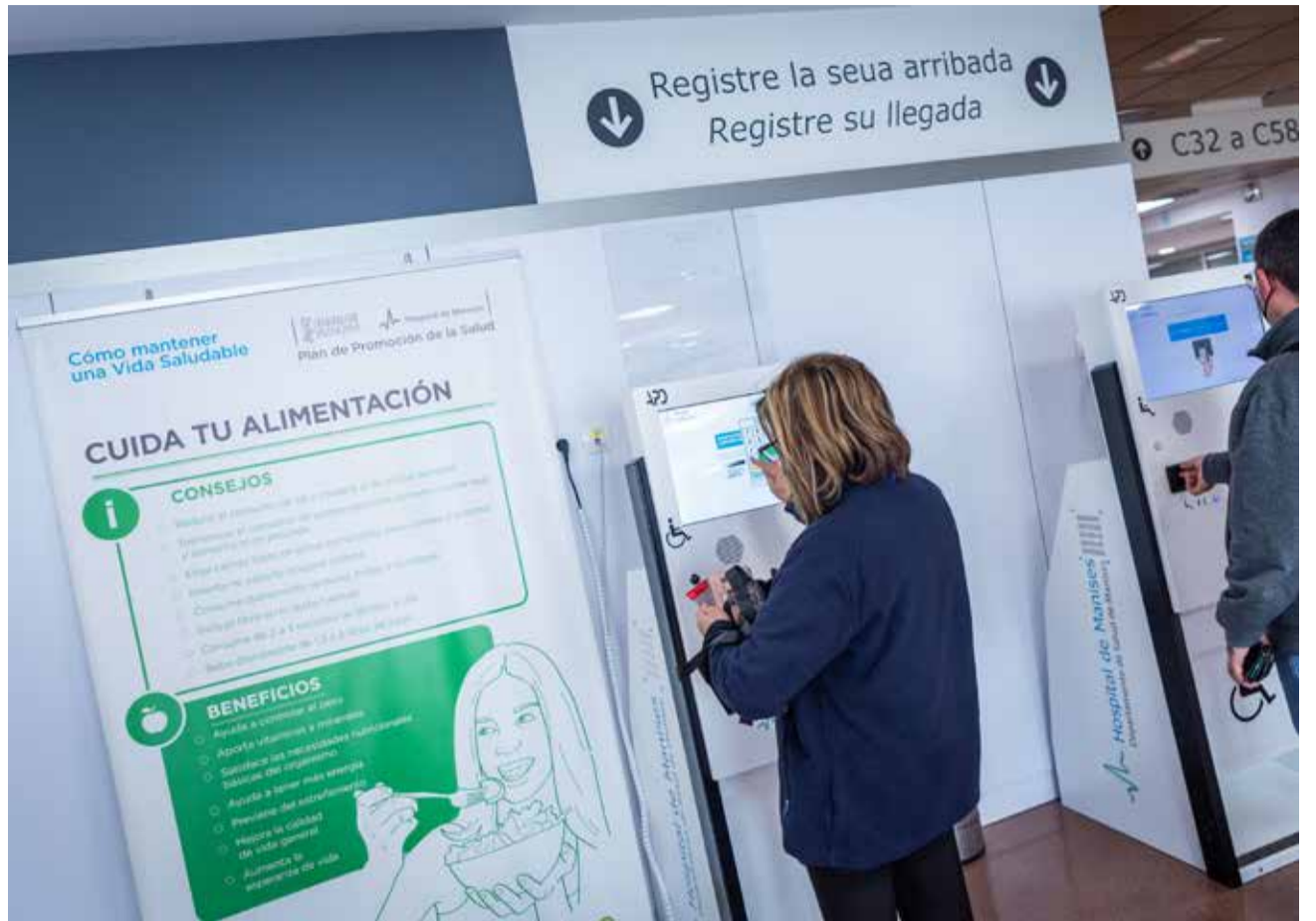
Los usuarios utilizan los paneles para confirmar sus citas.

En el primer trimestre de 2023, el área de Atención Primaria del Departamento de Salud de Manises ha disminuido un 38% el número de quejas recibidas respecto al mismo periodo de 2022, siendo también el área que menor tasa de quejas refleja, con una queja por cada 3.200 atenciones. A nivel de centros de salud, 8 de los