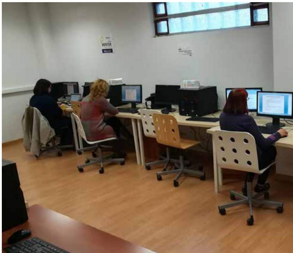
Varias personas hace uso del Aula Mentor.

Las personas interesadas en optar a estas ayudas deberán haberse examinado de inglés, francés, alemán, italiano o valenciano, ser mayores de 16 años empadronados en Alfatar y estar inscritos en la Agencia de Empleo y Desarrollo Local de Alfatar.