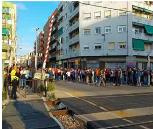
La concentración en el paso a nivel.