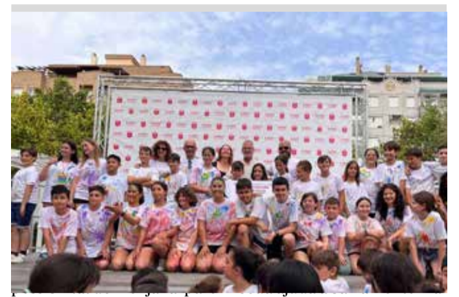
Alguns dels participants en la jornada.

brose associacions i entitats d'Alaquàs, amb tallers d'oci i manualitats, i fins degustacions gastronòmiques. També es va fer l'exhibició de la Unitat Canina de la Policia Local d'Alaquàs i de la Comunitat, amb la col·laboració de la Policia Nacional i Bombers. No van faltar tampoc les activitats solidàries, com la venda de productes i tallers i la