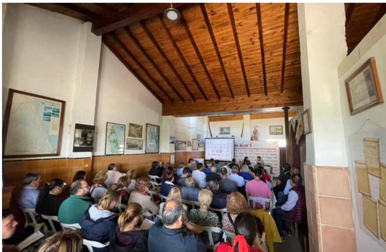
Un instante de las jornadas realizadas en la Cofradía de Pescadores del Port de Catarroja.

La Albufera es propiedad del Ayuntamiento de Valencia desde hace 100 años, a pesar de que baña diversos