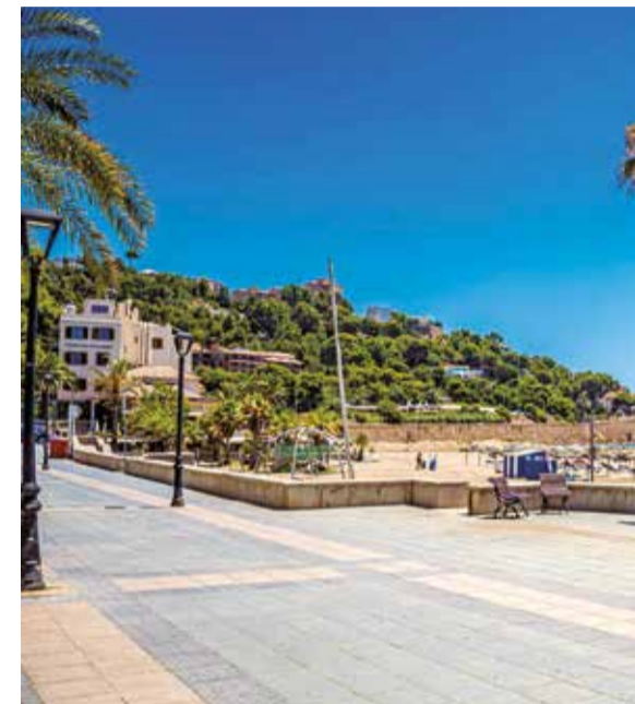
Paseo marítimo y playa Voramar de Benicàssim

de Cullera una opción perfecta para disfrutar de las vacaciones. Además, estas playas en su totalidad han sido recientemente declaradas playas sin humo. Esta iniciativa permite fomentar espacios libres de humo y de residuos procedentes del tabaco promoviendo de esta manera un estilo de vida más saludable y la protección del medioambiente ya que estos residuos acaban en el fondo marino. La calidad de las aguas de las playas de Cullera y sus servicios, así como las características de su arena están avaladas por la concesión de diversas certificaciones medioambientales y de calidad que acreditan su buen estado a la vez que su constante mejoría, suponiendo un