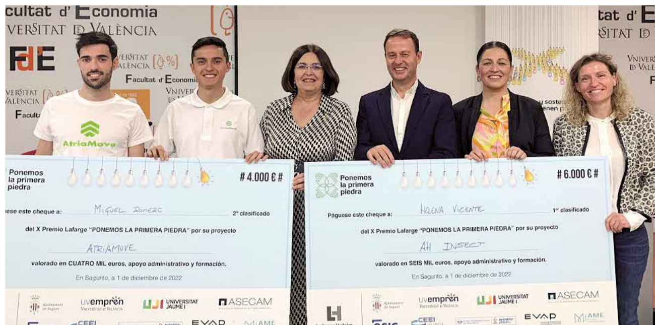
Ganadores de los premios del año pasado.

Pueden presentarse aquellas empresas y emprendedores que ya hayan iniciado su actividad, con menos de tres años de antigüedad y menos de 25 trabajadores, o que se encuentren en proceso de creación. Hasta el 30 de septiembre de 2023 se pueden enviar las candidaturas a ponemoslaprimera piedra@holcim.com. Los interesados