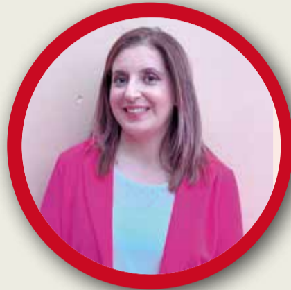
CONSOL DURAN PSOE - Faura