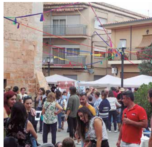
Feria en Benavites.