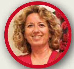
NURIA CARBÓ PSOE