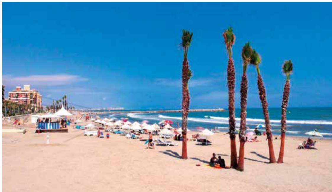
Portsaplaya, en Alboraya (l'Horta Nord).