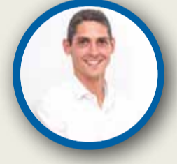
XIMO CATALÁN PARTIDO POPULAR