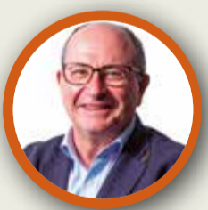
PEPE GIL COMPROMÍS