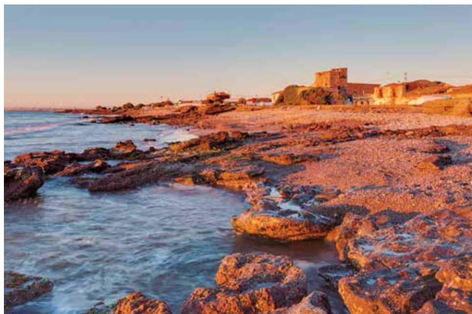
Grau Vell de Sagunt, al atardecer.

La figura de Sócrates vuelve a ser protagonista al día siguiente, 23 de junio y con aforo limitado a 30 espectadores, en la obra Licaó, del reconocido dramaturgo griego Dimitris Dimitriadis. Sergi Torrecilla protagoniza esta apología del deseo, escrita justo después del estallido de las revueltas griegas contra la crisis económica. La trama contiene la confesión del viejo Sócrates de sus fracasos más íntimos a Licaón. Esta confidencia trastornará radicalmente la vida del joven, abocado a un exilio