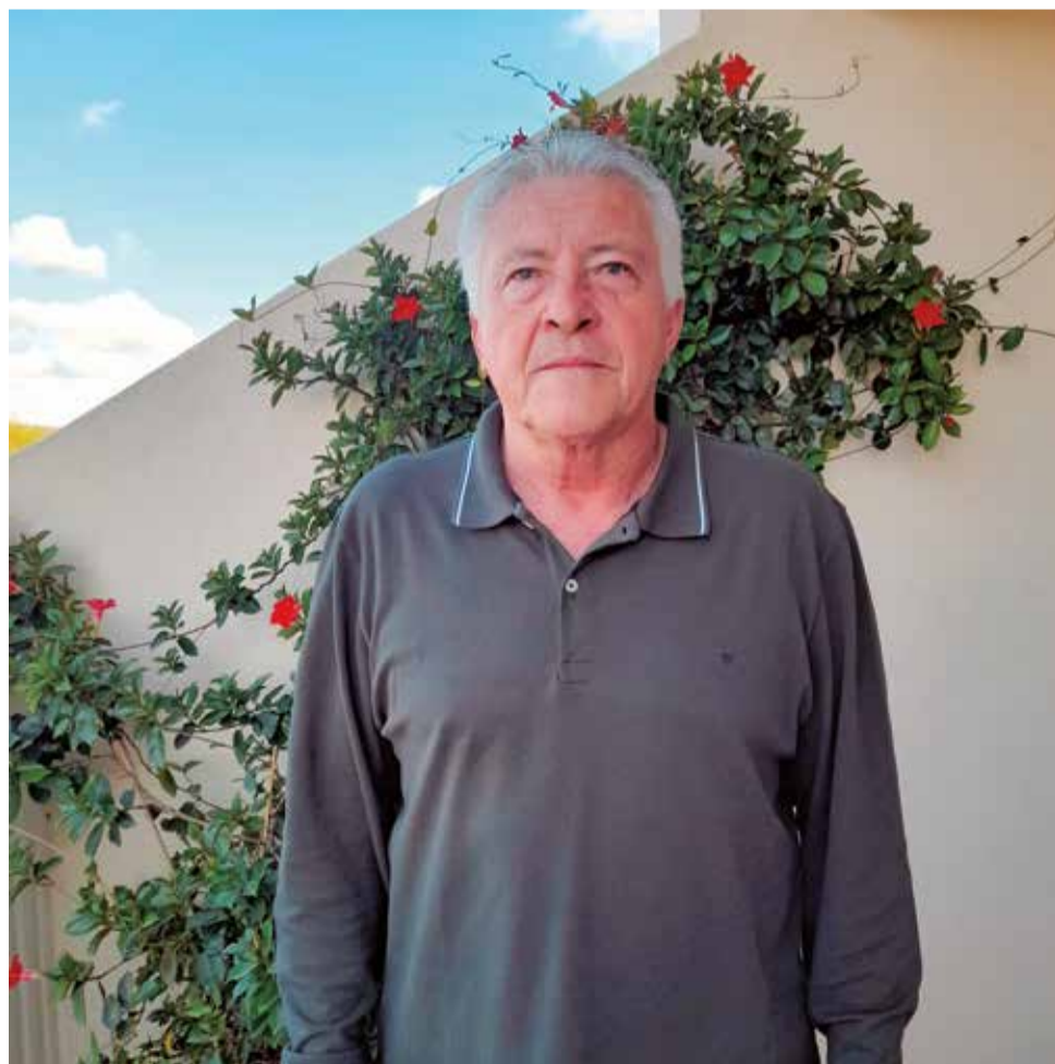
Mondragón. / EPDA

► Pues esa decisión no está en mis manos, dependerá del apoyo que tenga cada uno de los candidatos.