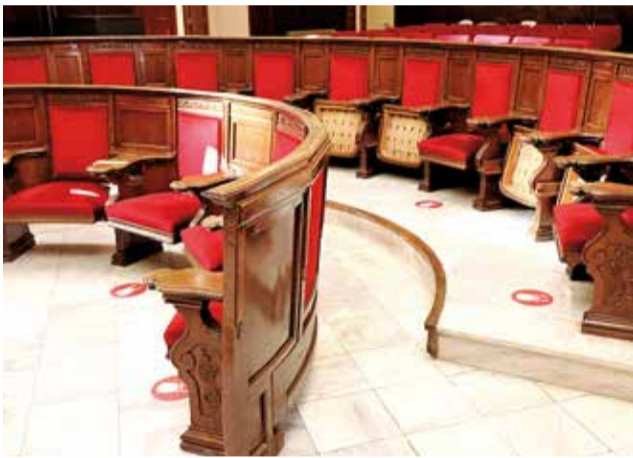
Salón de plenos del ayuntamiento de Sagunt.