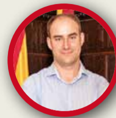
JAVIER RARO PSOE