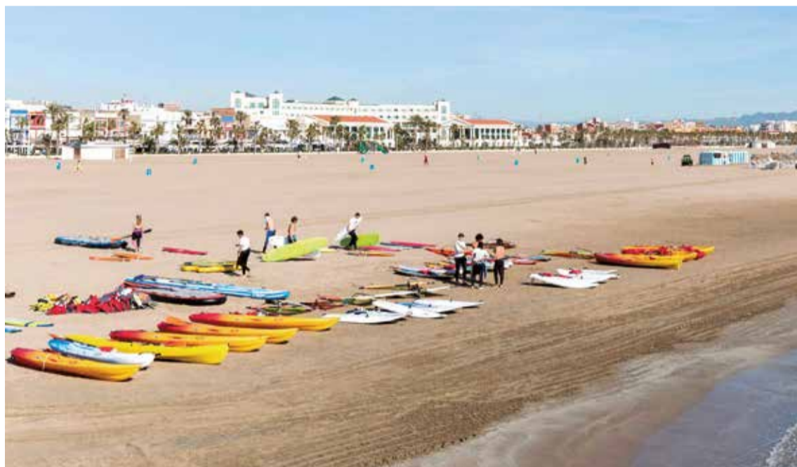
Playa del Cabanyal, en la ciudad de Valencia.

mente como Las Arenas, por el antiguo balneario del mismo nombre, hoy reconvertido en hotel-resort de lujo. Se trata de una de las principales estampas de la capital del Turia, pues sus aguas, sus pescadores y los niños chapoteando a orillas del Mediterráneo sirvieron de inspiración para el pintor Joaquín Sorolla, valenciano universal.