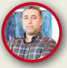
JAVIER TIMÓN PSOE