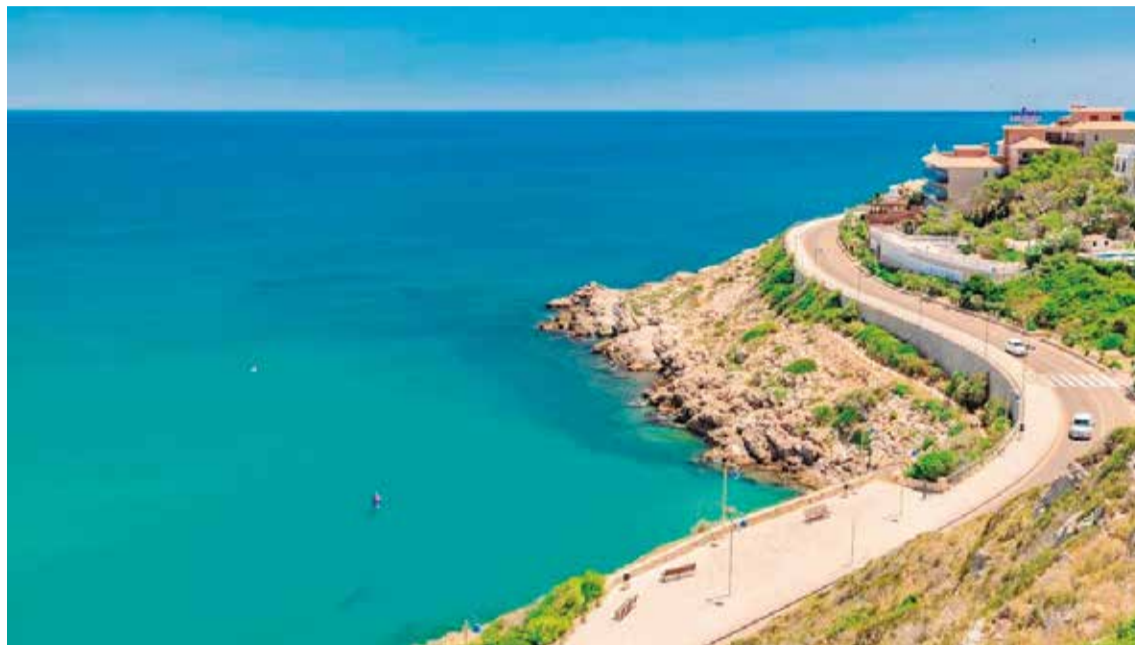
Sendero Cap de Cullera, en la Ribera Baixa.

La playa del Cabanyal es la playa del antiguo barrio de pescadores de Valencia. La zona es conocida popular-