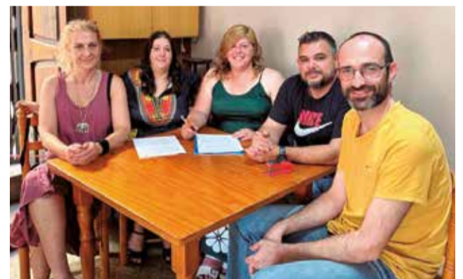
Firma del acuerdo de gobierno en Albalat.