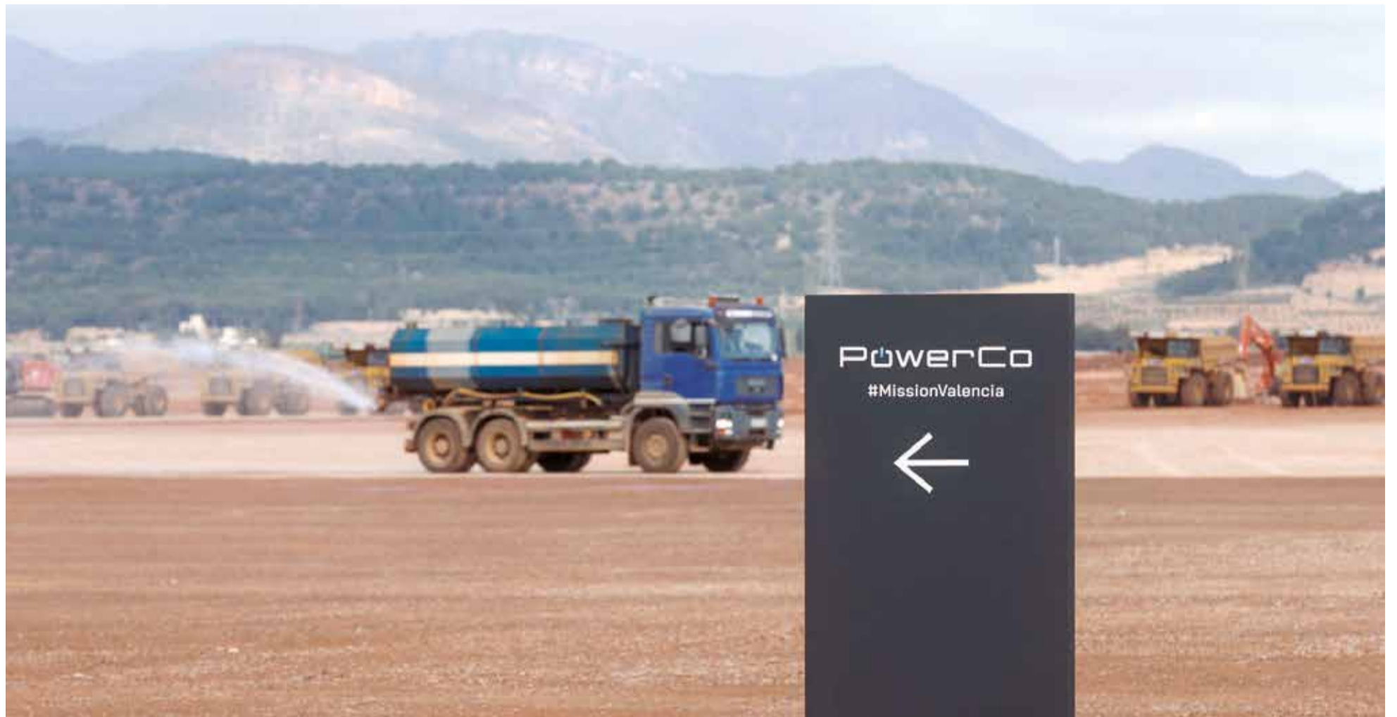
Obras en los terrenos de Parc Sagunt para levantar la gigafactoría de Volkswagen, en una imagen tomada en marzo de este año.

■ LAS OBRAS DE LA PLANTA DE VOLKSWAGEN EN SAGUNT EMPEZARÁN A LO LARGO DE ESTE AÑO CON UN CAMBIO DE SIGLAS EN LA GENERALITAT