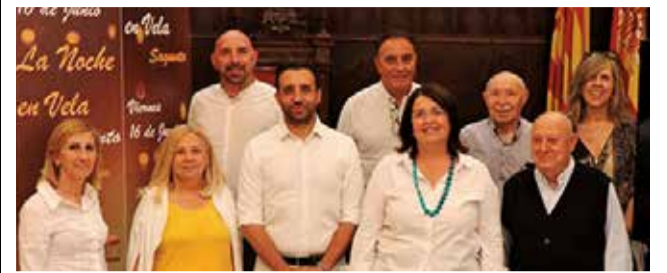
Presentación de la iniciativa. / EPDA