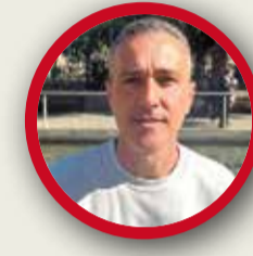
JORGE VIDAL PSOE