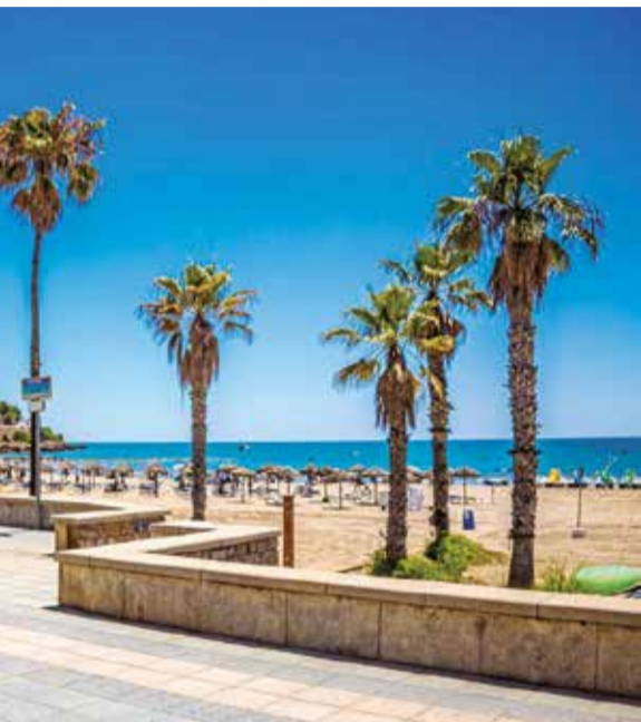
(Castelló). / EPDA

► CARACTERÍSTICA. El pantalán es un símbolo patrimonial que le da una imagen única a la zona.