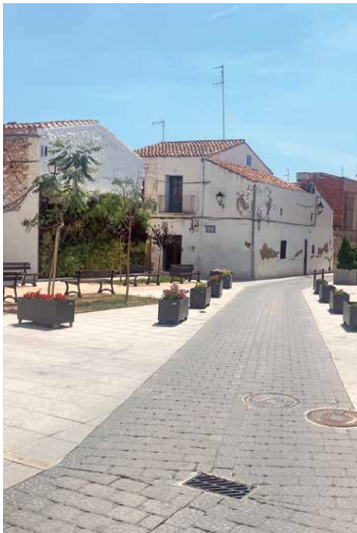
A la izquierda, el techo de la ermita de Benicalaf; a la derecha, el casco antiguo del municipio tras las obras.