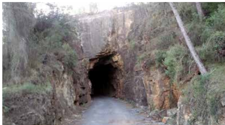
Un tram de la Via Verda Ojos Negros.

Però, si hui esmente un dels meus passejos preferits, no solament és pel