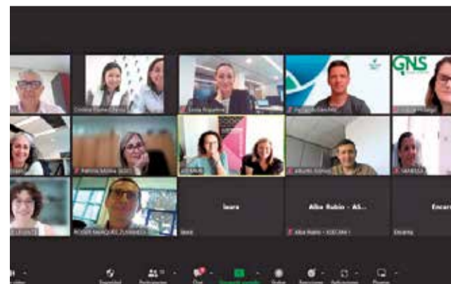
Presentación del proyecto. / EPDA

ra analizar la evolución de las acciones de fomento y sensibilización. Asimismo buscará una dinamización de la oficina mediante acciones de difusión como publicación de noticias, contacto telefónico con empresas, visitas personalizadas, preparación de material de difusión para insertar en la web, etc... así como la cumplimentación de una base de datos de los recursos subutilizados de las empresas pertenecientes a ASECAM.