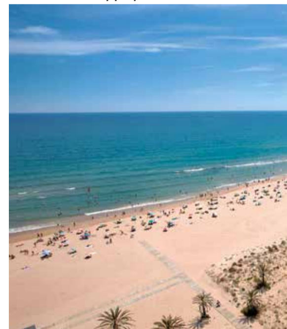
Playa nord de Gandia (la Safor).