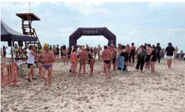
Travessia nadant a Canet d'en Berenguer.