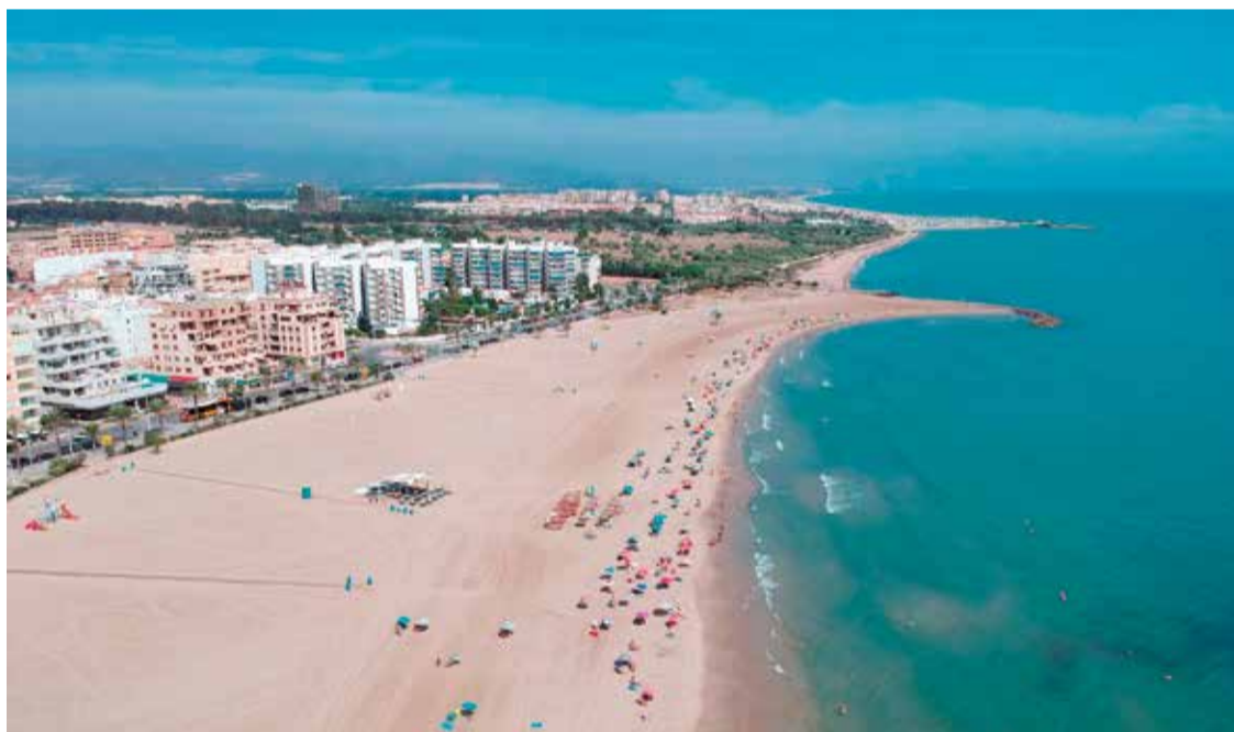
Vista aérea de la playa del Port de Sagunt.