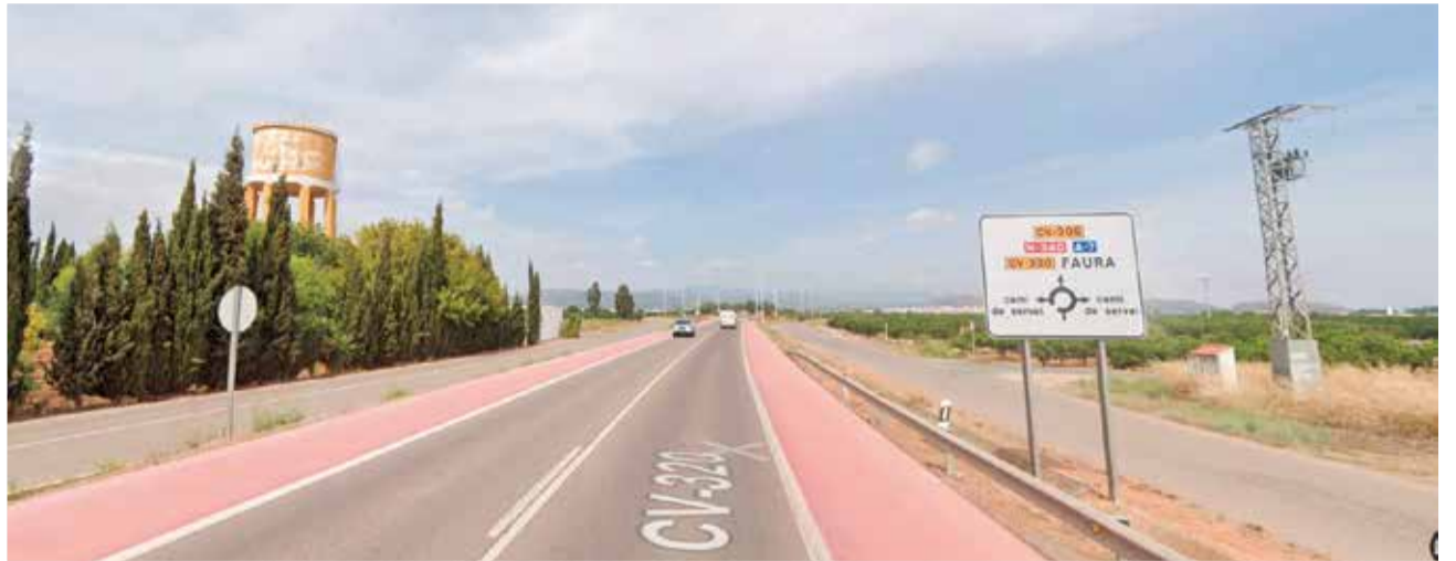
Lugar aproximado a donde tuvo lugar el accidente.

El accidente ocurrió cuando una motocicleta, en la que circulaban dos menores, de 17 años, que venían a la playa, trató de adelantar al coche dorado. El turismo circulaba a 40 km/h en una vía con límite de 80. Otro coche que iba detrás también adelantó,