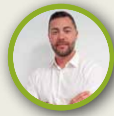
ALEJANDRO VILA VOX