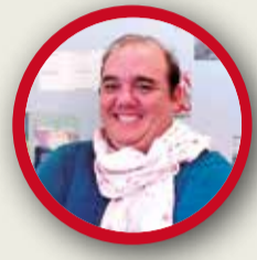
RAÚL PALMERO PSOE