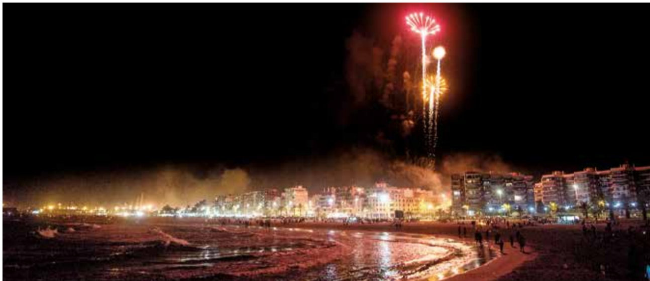
Fuegos artificiales en la playa del Port de Sagunt en la noche de San Juan de otro año.

FIESTAS PRESENTA LA PROGRAMACIÓN PARA LA NOCHE DEL VIERNES 23 DE JUNIO EN LA CAPITAL