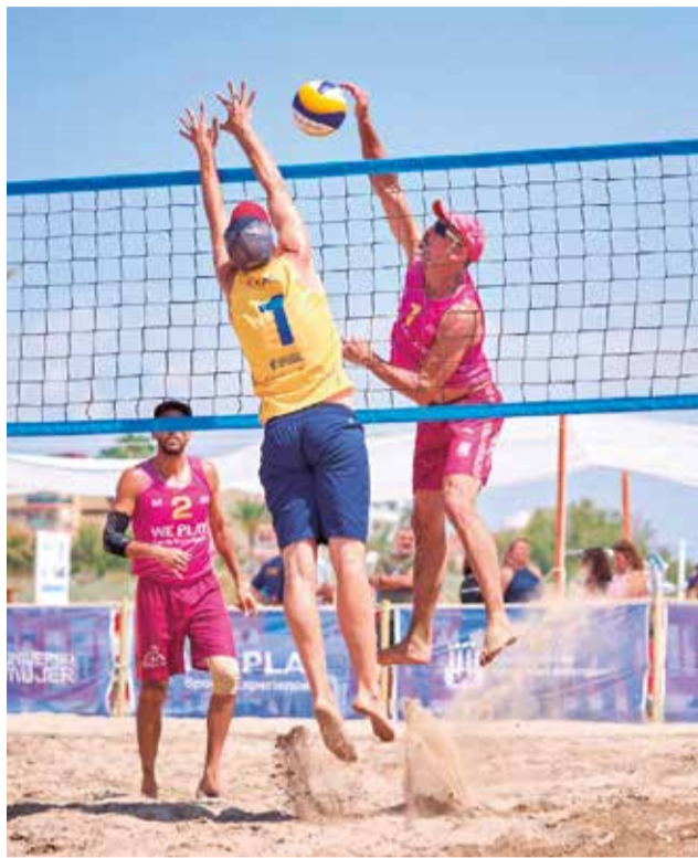
Un instant del torneig.

Més de 400 esportistes es van donar cita a la platja Racó de Mar, en la qual també es va disputar l'Internacional Beach Volley Fest, el circuit Amateur, que organitza Mediterranean Beach Volley en el qual van