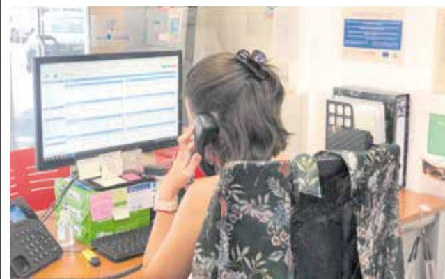
La oficina de la Agencia de Desarrollo Local. / EPDA