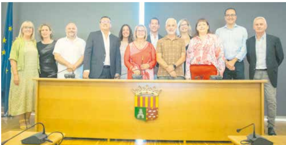
Els components de l'equip de govern.

■ CINC REGIDORS TENEN DEDICACIÓ EXCLUSIVA I NO S'HAN PRODUIÏT INCREMENTS DE SALARIS