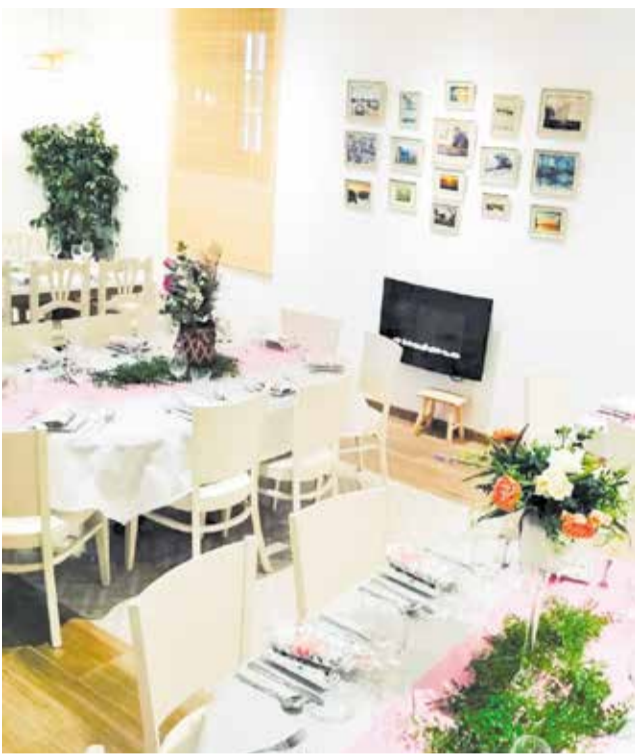
Uno de los salones para eventos.