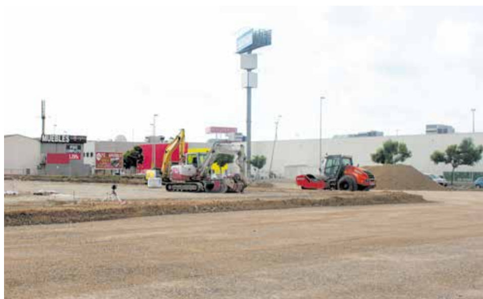
Los trabajos que se están realizando en el parque comercial. EPDA

Las últimas incorporaciones que se han sumado han sido Cecotec con su sede central, un espacio innovador en el que se ha invertido 18 millones de euros, y Centrakor, la firma francesa dedicada a la decoración y el equipamiento del hogar, que ha abierto su primera tienda en España en Alfatar Parc.