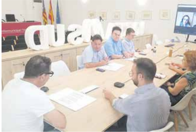
Los técnicos durante la reunión.

La entidad sigue trabajando en su estrategia turística y, con la finalidad de llegar a ser destino turístico inteligente, su próximo objetivo es convertirse en un modelo turístico basado en infraestructuras tecnológicas de vanguardia, capaz de ofrecer un elevado nivel de accesibilidad y de calidad en la experiencia, tanto de las personas residentes como de las personas visitantes. La consecución de Destino Turístico Inteligente permitiría, entre otras ventajas, la mejor captación de fondos europeos para pro-