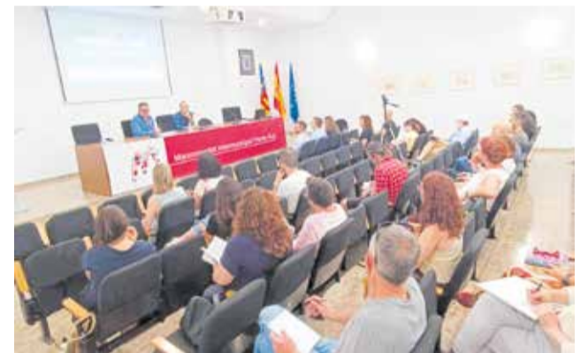
La reunión de los técnicos en la Mancomunitat.