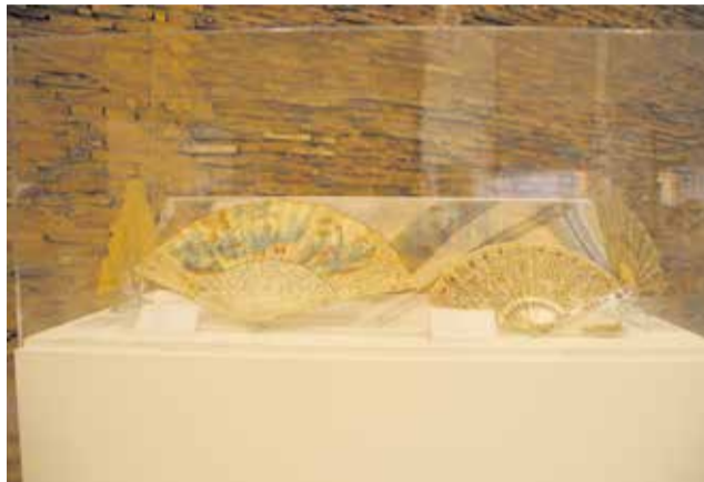
Dos exemplars de l'exposició.