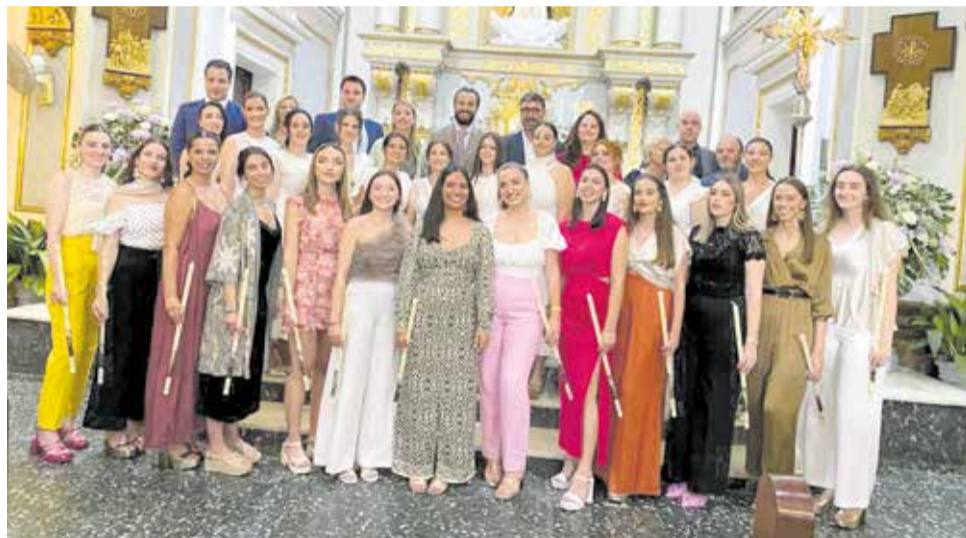
Las autoridades locales, junto a las clavarias.

Otro de los actos religiosos con más tradición fue la solemne procesión en honor a la Virgen