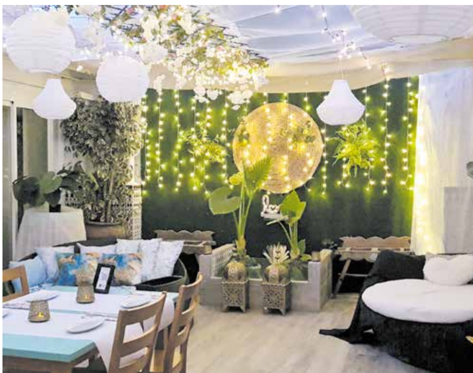
Otro de los escenarios decorados con mucho encanto.