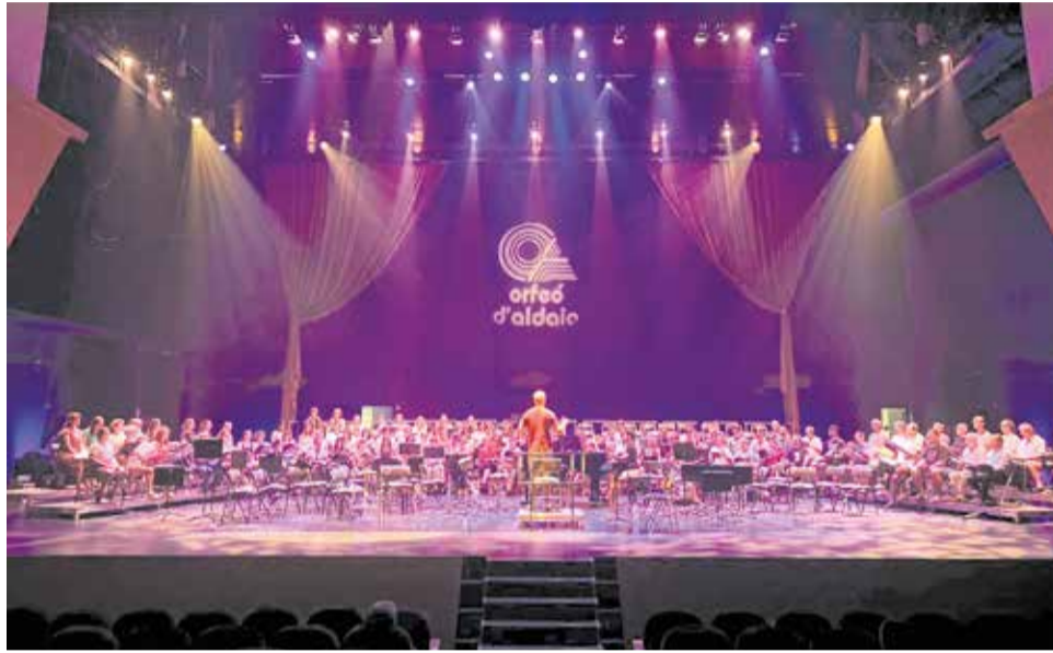
Un dels assajos previs a l'arribada de Rutter.