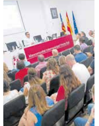
La jornada en la sede.

En esta jornada intervinieron tanto personas expertas en la Formación Profesional Dual, como centros educativos y empresas que participan en los procesos de este tipo de enseñanza práctica. El objetivo de la sesión era el de informar al tejido empresarial sobre cómo se pueden beneficiar al incorporar al alumnado de FP a sus organizaciones con el fin de que adquieran conocimientos, destrezas y habilidades en puestos de trabajo reales, de manera que estos futuros profesionales esten capacitados y acreditados.