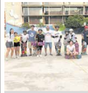
Els participants.