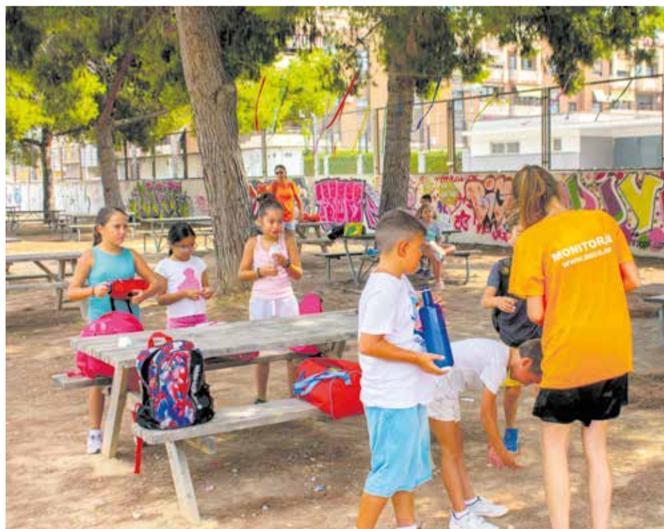
Una de las actividades del año pasado.

L'Ajuntament d'Alfatar continúa trabajando para dar opciones de conciliación familiar y laboral de acuerdo a las necesidades de las familias, a la vez que ofrece alternativas lúdicas y educativas que permiten a niños y niñas desarrollarse. El año pasado ya se puso en marcha el campamento de verano dentro de este programa con un total de 50 plazas y con el mismo objetivo.