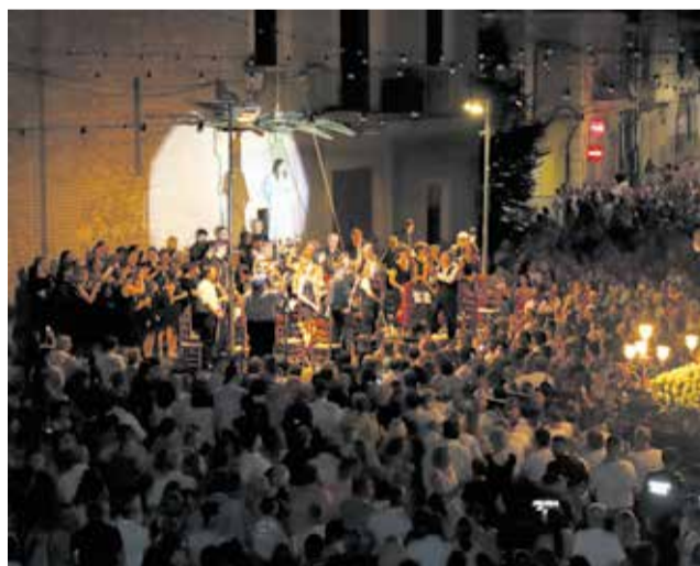
El Cant de la Carxofa en Silla.

El día del Cristo, el 6 de agosto, la localidad vive su fiesta grande con la misa en su honor. Además, es una jornada dedicada a las tradiciones, cuando los Porrots salen a la calle para bailar su danza milenaria por diferentes partes del pueblo. Los grupos coinciden en la plaza de la Iglesia, tras el oficio de religioso, donde representan un baile todos juntos. Después, se dispara la mascletá en el parque