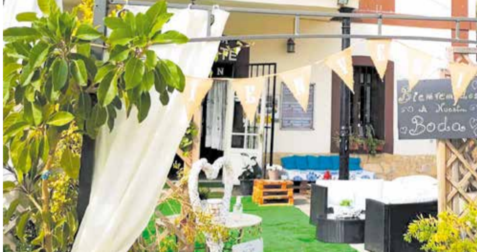
La terraza para disfrutar al aire libre