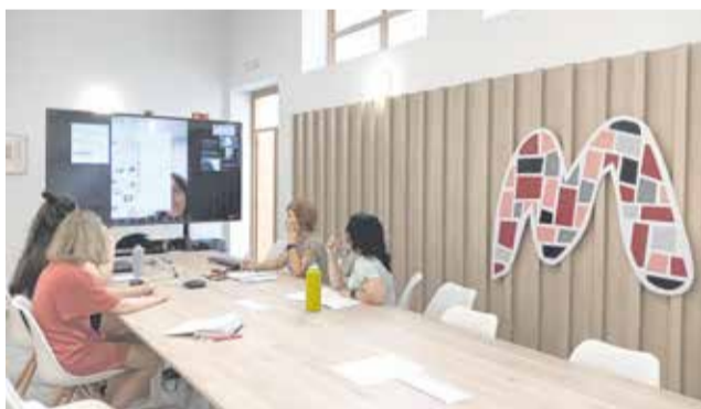
Las técnicas de igualdad se reúnen en la sede.

Las nuevas incorporaciones vienen financiadas por un contrato programa de Servicios Sociales de la Generalitat para municipios de menos de 20.000 habitantes. De esta forma, Alcàsser, Albal, Benetússer, Beniparrell, Massanassa, Picanya, Sedaví y Silla son los municipios que recibirán a las agentes y promotoras de Igualdad pa-