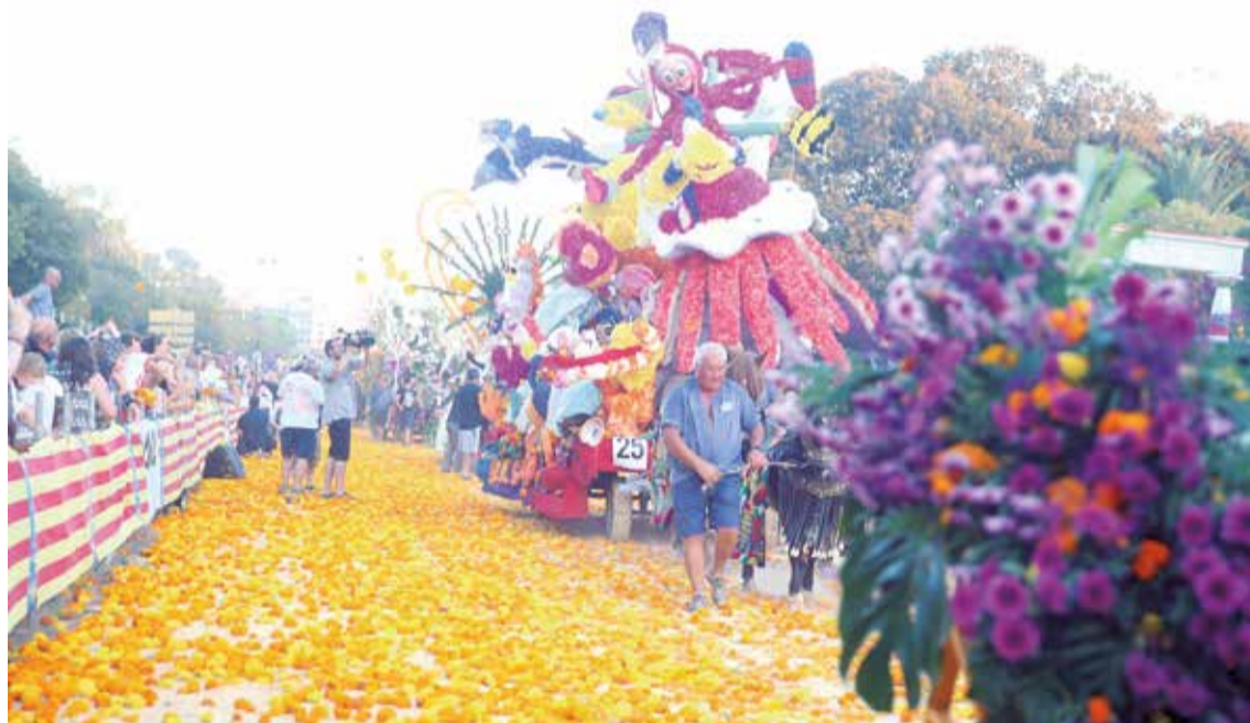
Batalla de las Flores de Valencia.