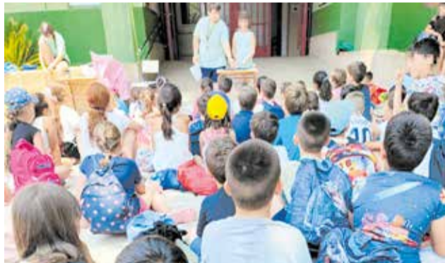
Els alumnes en una activitat.