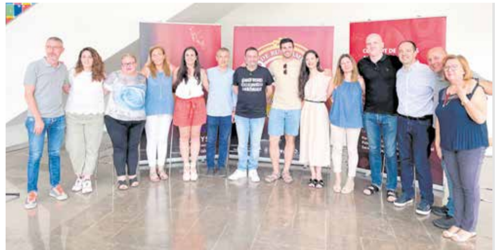
Els assistents a l'acte de presentació del projecte.

El dia 23 de juliol tindrà lloc el concert de tancament a les 20:30 hores en el TAMA, baix la batuta del director britànic