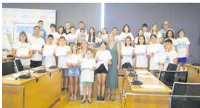
Els representants del consell amb els diplomes.