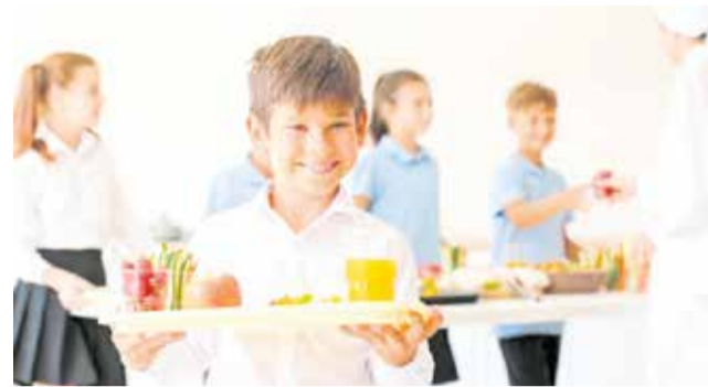
Un niño en un comedor escolar.