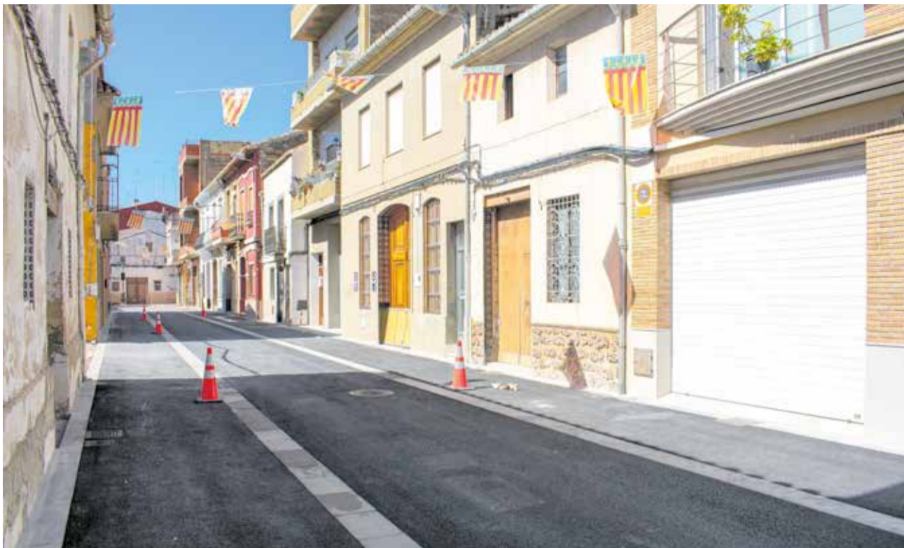
La calle Bosch Marín tras la actuación realizada de urbanización.