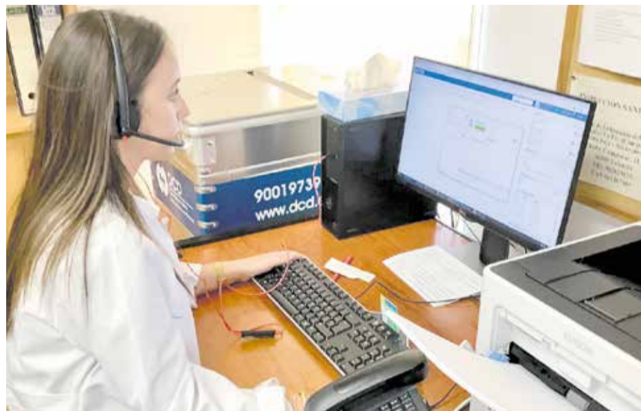
El call center de Quart de Poblet.

“Durante este primer semestre de año hemos atendido a un total de 98.916 llamadas