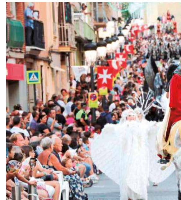
Fiestas de Moros y Cristianos de Torrent.