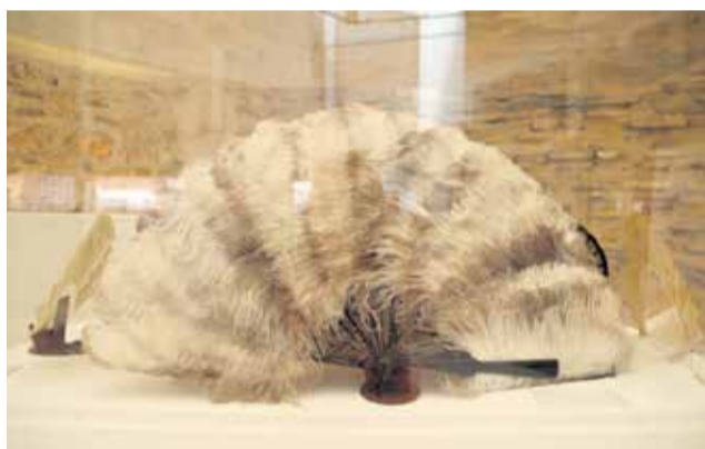
Un dels palmitos ètnics.