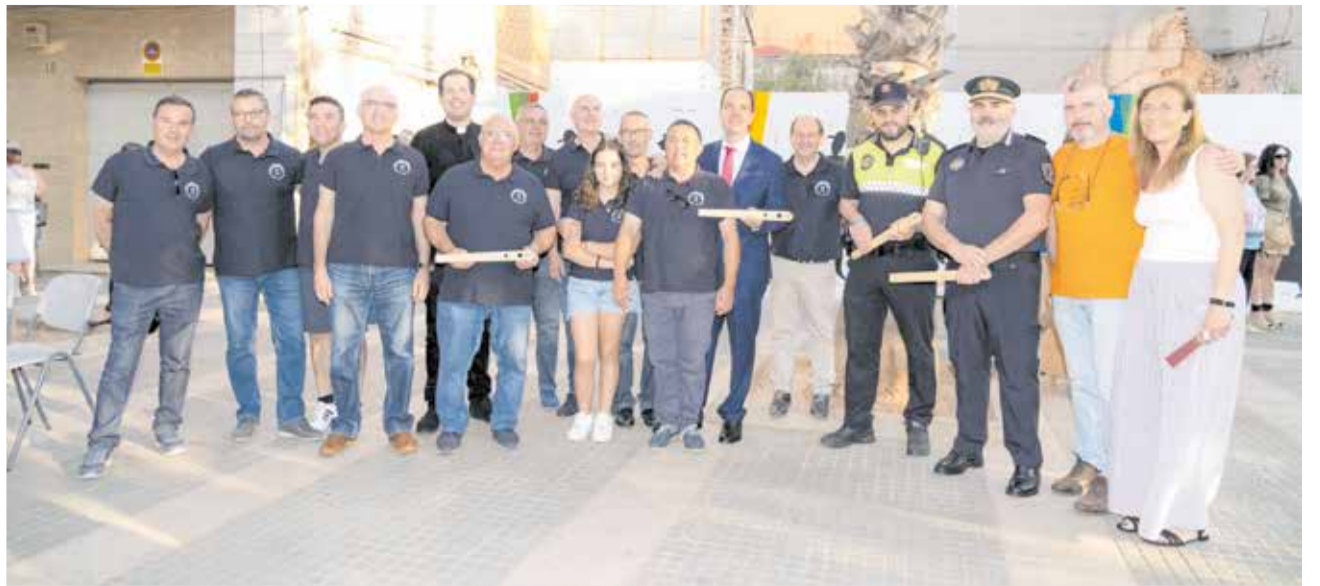
Els participants a este acte tan especial.