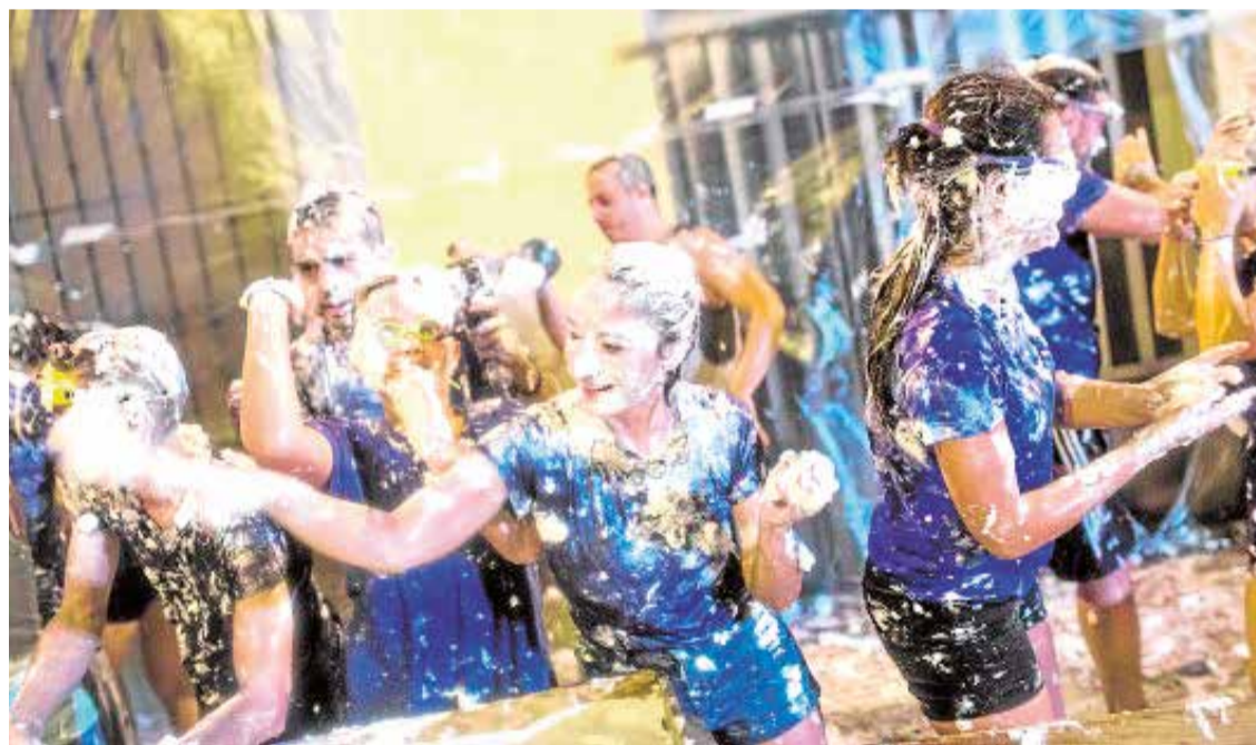
Merenguina de Lliria.