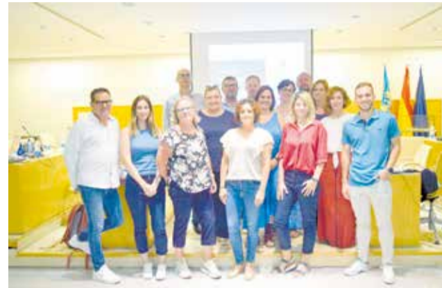
Els participants al programa.

En la sessió inaugural, entre altres temes, es va presentar el treball que s'està realitzant per a crear la guia per a educadors, els objectius que es persegueixen, públic al que va dirigit, activitats previstes i duració. Totes les parts implicades en el projecte, van compartir les dades que havien recopilat sobre l'envelliment actiu de la població, detectant