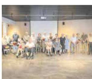
Els homenatjats. / EPDA