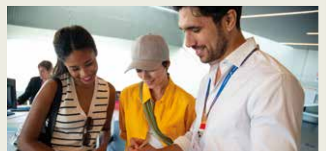
Profesionales del sector turístico.