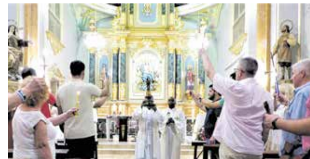
Uno de los triduos a la Virgen.

gels, el tercero será una romería que acabará en la ermita de Santa Ana. El día 26 dos misas, a las 12.30 y a las 20 horas, y ofrenda a la patrona. Para finalizar los actos litúrgicos, el día 28 a las 20 horas una solemne misa acompañada por la 'Coral Polifónica Santa Ana', seguida de la tradicional procesión por las principales calles del municipio.