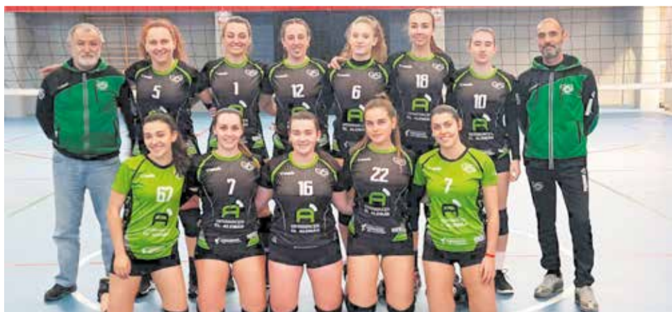
El equipo de Voleibol Sedaví Sénior Femení.