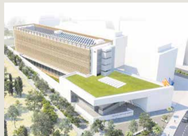
La maqueta del edificio.

En 2019, la Generalitat autorizó al Consistorio a contratar la redacción del proyecto, licitar, adjudicar y