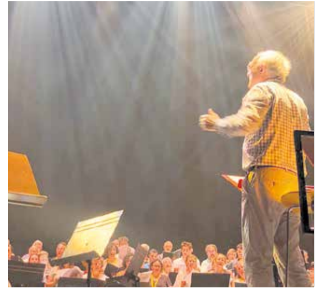
El primer assaig amb Rutter.

de fer alguna cosa important per a celebrar els 50 anys, com convocar a una persona de la talla de John Rutter". "Hem treballat molt i esperem que siga tot un èxit" va concloure.