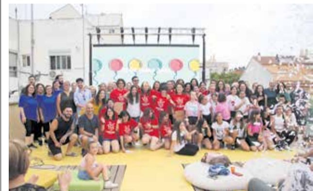
Los jóvenes participantes en el acto.