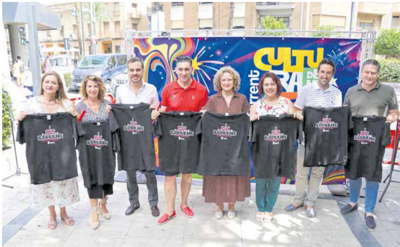
El equipo de gobierno presenta el programa de fiestas. / EPDA

Así, los festejos de Moros y Cristianos serán, nuevamente, los grandes protagonistas de la semana grande, que vivirá sus días más intensos del 24 al 30 de julio, cuando la solemne Misa Ma-