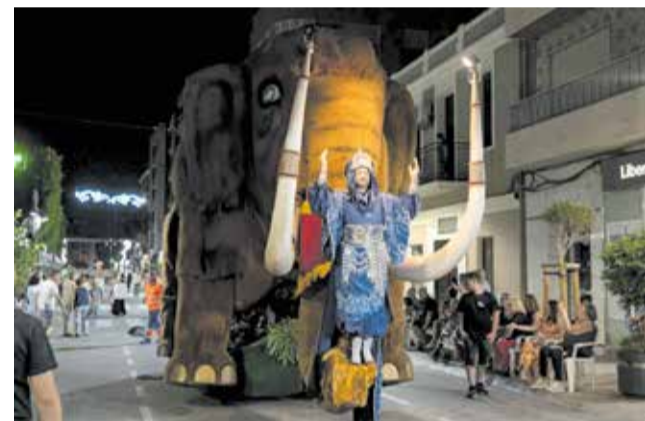
El capitán moro en su carroza.

El gran desfile se pudo seguir en directo por las redes sociales municipales así como por Aldaia Ràdio, consiguiendo acercar el acontecimiento a miles de personas más simultáneamente.