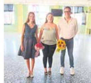
Les representants.