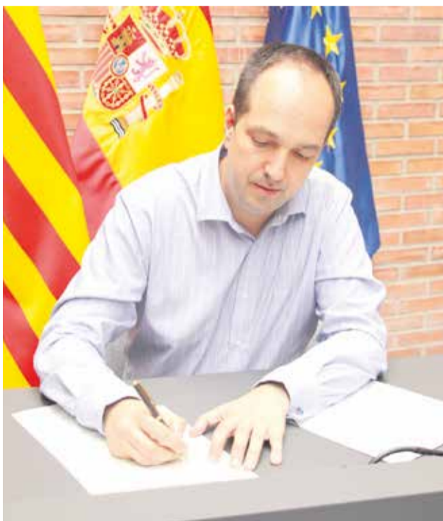
El alcalde firma el documento.

Gracias a este acuerdo, el profesorado de arquitectura de la Universitat elaborará el trabajo de investiga-