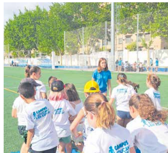
Els alumnes en una activitat.

Tot pensat per a la diversió dels menuts i la conciliació per a pares, mares, i famílies que han de treballar a l'estiu.