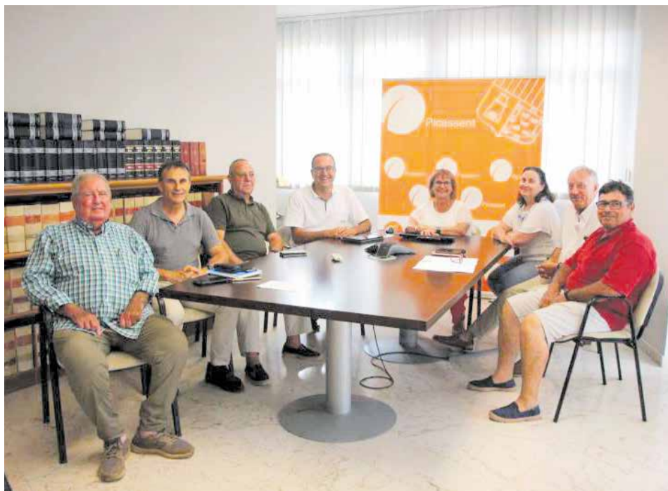
La reunión de los afectados y agentes con las autoridades locales.

Hasta el momento se han recogido 48 denuncias y el 50% de los agricultores se ven expuestos a daños graves y reiterados, tanto en los frutos, como en el arbolado y las infraestructuras de sus explotaciones. Por