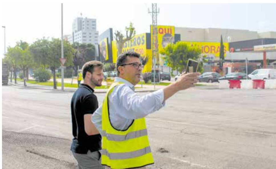
El alcalde y el concejal de Urbanismo en la zona.

UNA NUEVA CADENA DE SUPERMERCADOS SE INCORPORA AL PARQUE EMPRESARIAL CON UNAS INSTALACIONES DE 6.000 METROS CUADRADOS