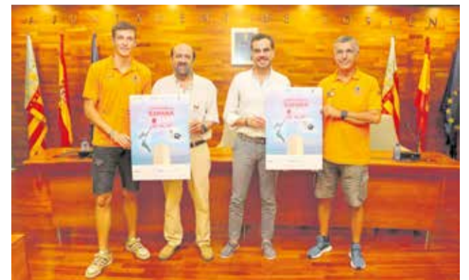
La presentación del evento deportivo.

Las instalaciones de Parc Central, con capacidad para 1.100 personas, se han adaptado para acoger a más de 3.000 con unas gradas supletorias. Desde la FDM también se ha estado trabajando prestando atención a cada detalle de la pista. Igualmente, se han dispuesto las últimas tecnologías en cuestión de medición y sis-