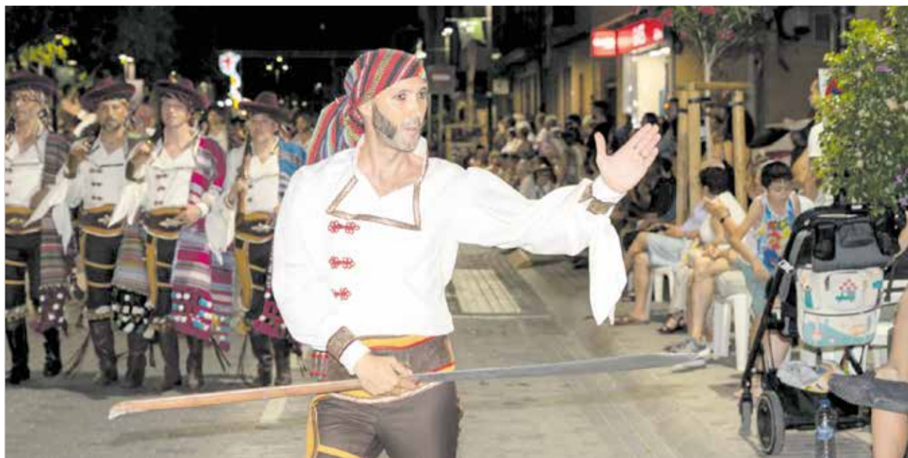
La comparsa de la capitanía cristiana de Contrabandistas de la Tonyina.

El recorrido tradicional daba inicio en la calle Iglesia y seguía por la plaza de la Constitución, para acabar en Blasco Ibáñez. A lo largo del mismo, contagiaron su ilusión, primero las escuadras cristianas, con una gran capitanía de la mano de los Contrabandistas de la Tonyina, y después por las comparsas moras, cerrando