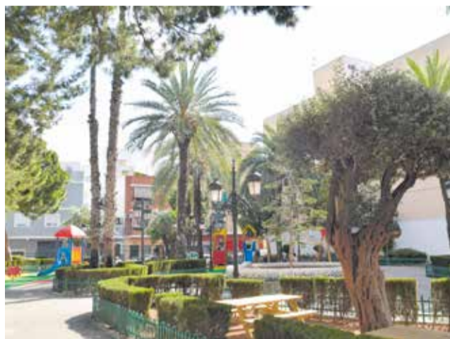
El parc que ha reobert les seues portes.