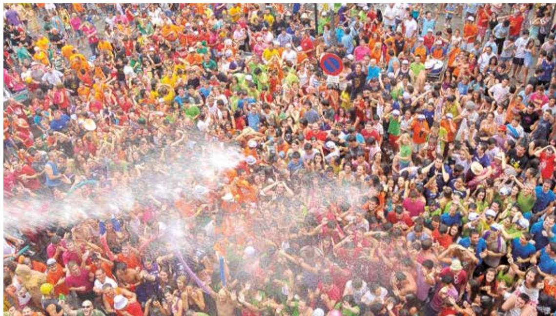
Un acto de las fiestas patronales de Sagunto.

Durante el mes de Julio Valencia organiza una de sus fiestas más importantes del año, la Gran Fira de València. Durante todo este mes estival se podrá disfrutar de más de un centenar de actividades tanto musicales, teatrales, de danza, tradición, magia, pirotecnia como de circo hasta la tradicional Batalla de Flores, que se celebrará el 30 de julio en el paseo de la Alameda. Además, de las citas clásicas, como los Concerts de Vivers, la Feria Taurina, los Jardines del Palau o la Gran Nit, destacan otras recientes, como la Correfira, las Nits de Folk, los Focs de la Fira, la Nit a la Mar o La Menu da Fira, que este año se completan con la nueva Festa al Parc. La primera edición de la entonces llamada 'Feria de Julio' data del 21 de julio de 1871, con una vistosa cabalgata, pabellones y exposiciones de plantas y venta de pro-