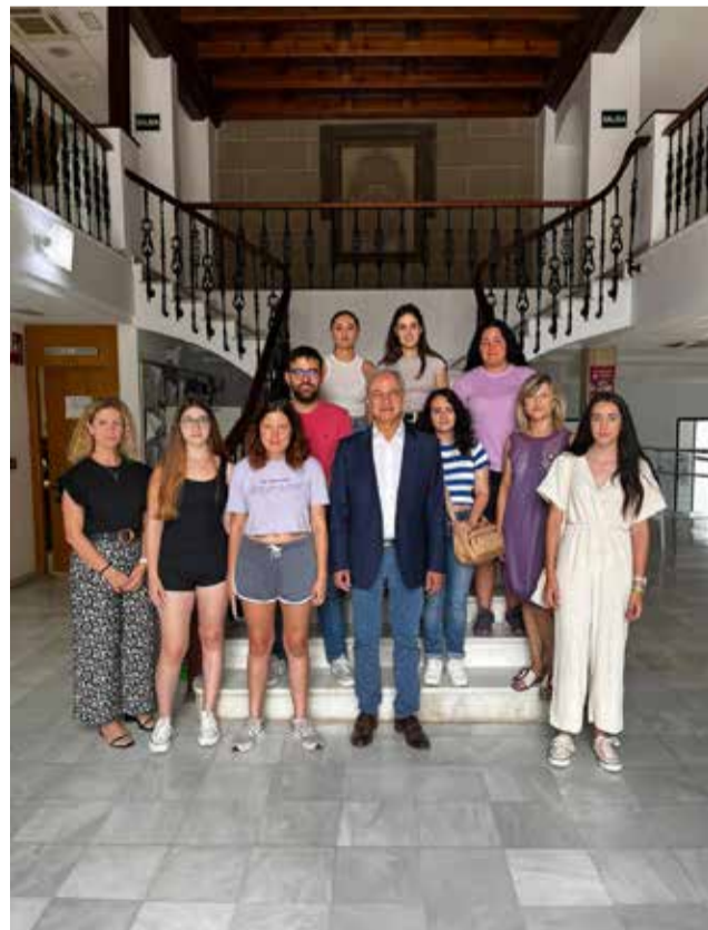
Los ochos estudiantes seleccionados.