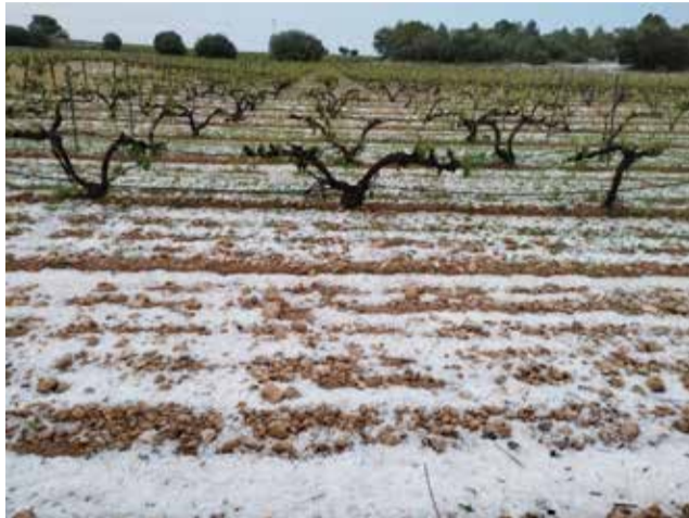
Granizada en la comarca.

En este sentido reclamará entre otras cosas la concesión de ayudas directas, la agilización de las perita-