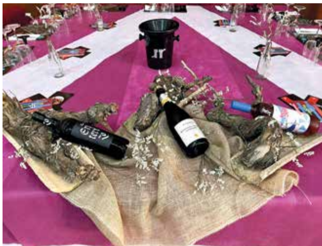
Feria enogastronómica 'Saborea Fuenterrobles'.