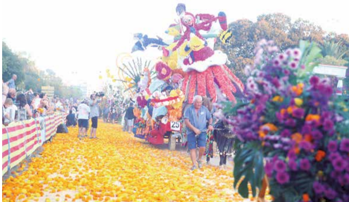
Batalla de las Flores de Valencia.