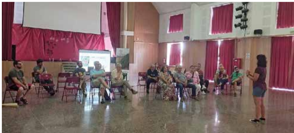
Durante la presentación de LIFE Teixeres en Chera.

Después de las presentaciones, las personas asistentes aportaron e intercambiaron conocimientos e ideas en diferentes dinámicas participativas. A la primera par-