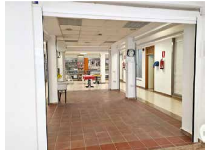
Obras en el Mercado Municipal de Chiva.

Además, a lo largo de la legislatura, desde la Concejalía de Mercados se ha cambiado el aire acondicionado del lugar, se ha sustituido la iluminación que había por ilumina-