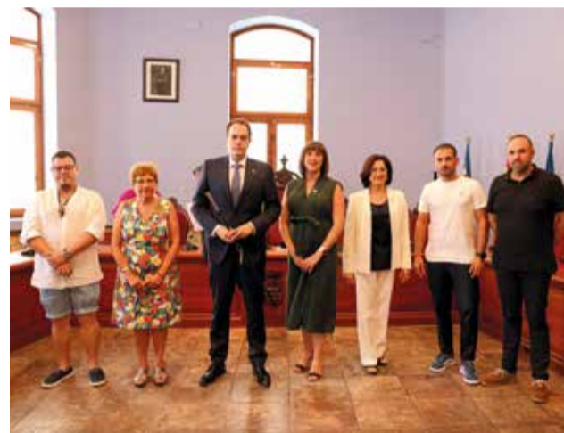
Corporación municipal de Cheste.

trabajado de manera incansable para formar un equipo de profesionales de distintos sectores dispuestos a sacrificar horas de ocio e incluso salario; con ilusión y ganas de ofrecer su experiencia al servicio de Cheste. Han sido 1.988 personas las que han creído en nuestro proyecto, nos han faltado pocos votos para obtener la mayoría ab-