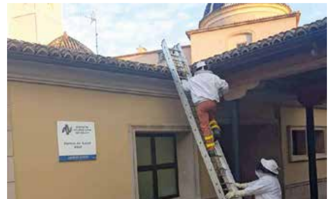
Los bomberos en el centro de salud de Utiel.