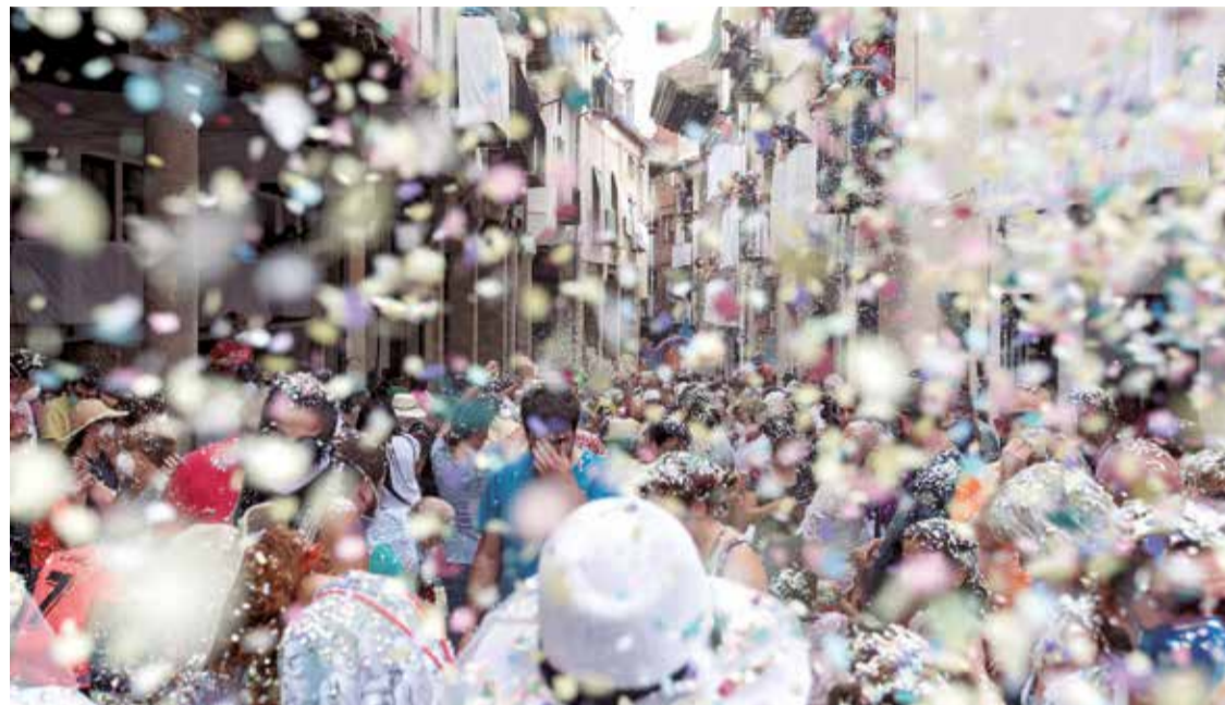
Anunci de Morella.