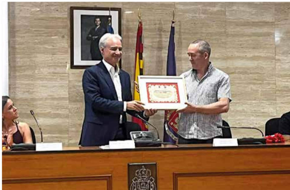
Algunos momentos del homenaje al CD Utiel en el ayuntamiento.

sueño y finalmente llegó el ansiado momento.