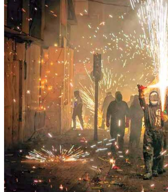
Cordà de Paterna.