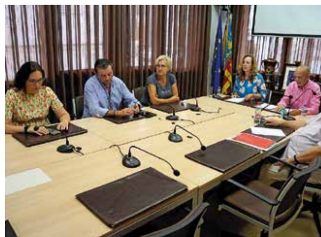
Un momento durante la reunión.

"El Partido Popular de Godelleta y la Plataforma de Urbanizaciones de Godelleta (PUG) somos dos grupos