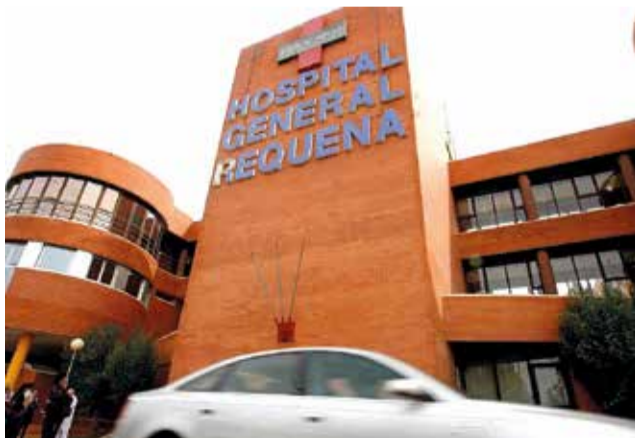
Hospital General de Requena.

Dentro de las funciones a desarrollar en estos centros, se contemplan las vacunaciones y demás medidas preventivas en el tráfico internacional de personas, así como la expedición de los certificados correspondientes a las vacunaciones. El servicio presta-