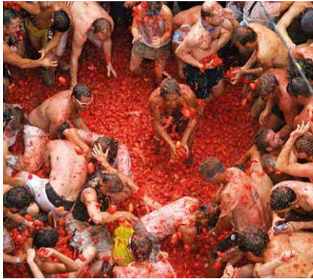
La Tomatina de Buñol.

Por un capricho del destino, allí había un puesto de verduras que fue pasto de la