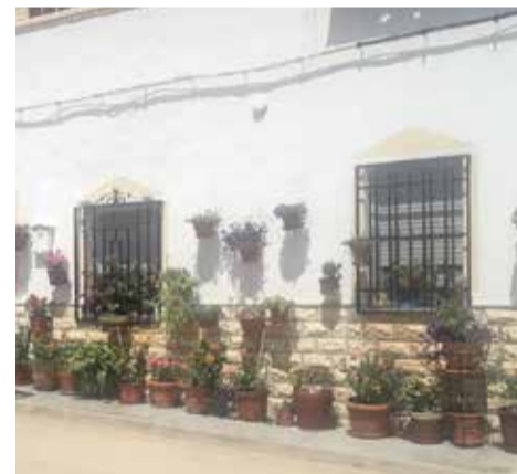
Diferentes fachadas y casas de Venta del Moro y aldeas decoradas para el concurso.