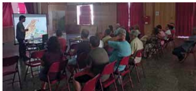
Un momento durante la jornada.

te definieron cuáles son las debilidades, amenazas, fortalezas y oportunidades del proyecto. A continuación, ubicaron los tejos que conocían al término municipal y, por último, propusieron iniciativas para implicar y concienciar a la ciudadanía en la relevancia del hábitat del tejo.