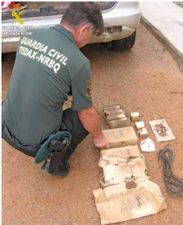
Los explosivos encontrados.

Tras abrir el maletero del coche, la patrulla comprobó que efectivamente se trata-