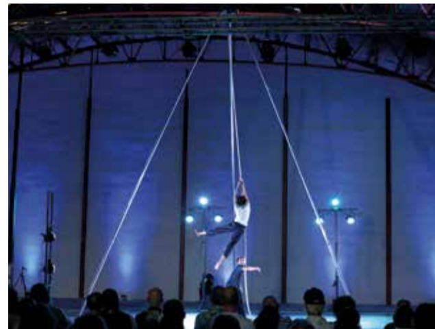
Diferentes momentos de la actuación de 'El desé home'.

ocio y actos taurinos. Desde la Concejalía de Fiestas esperamos que la población se anime a participar, ya que todas las actividades están preparadas con mucha ilusión”, manifestaba el conce-