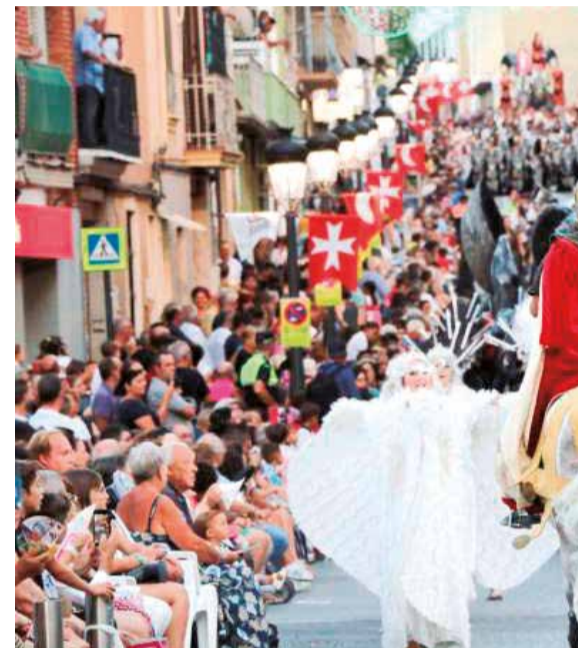
Fiestas de Moros y Cristianos de Torrent.