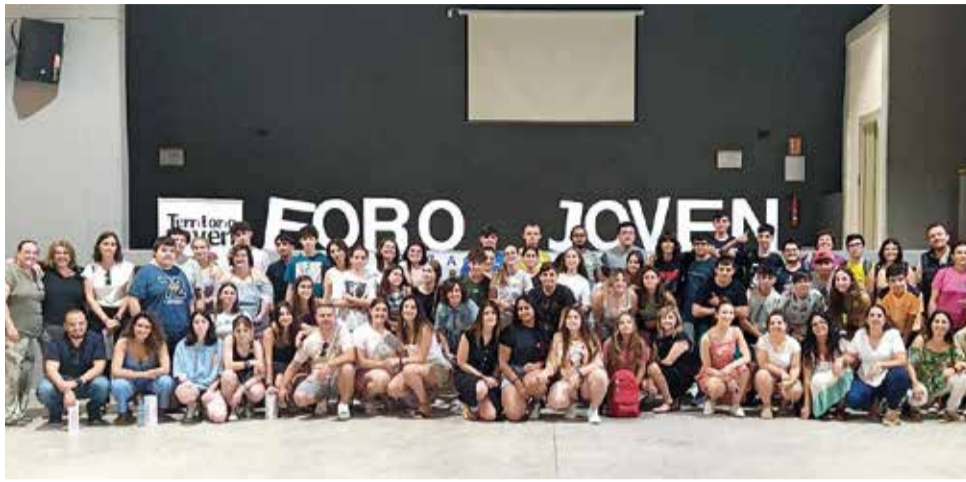
Participantes del Foro Joven de Villargordo del Cabriel. / EPDA