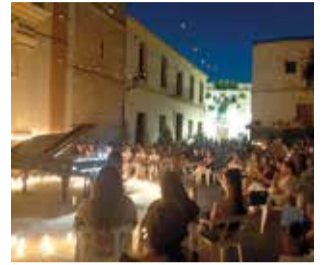
Concierto Isaías Romero.