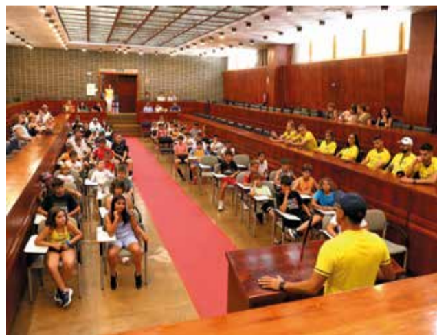
Un momento durante la presentación.

Para comenzar, a las 10:00 del pasado 4 de julio se realizó el acto de recepción. Los 65 niños y niñas participantes en el campamento se reunieron, acompañados de sus familias, en el Salón de Grados del Complejo para recibir la bienvenida por parte del