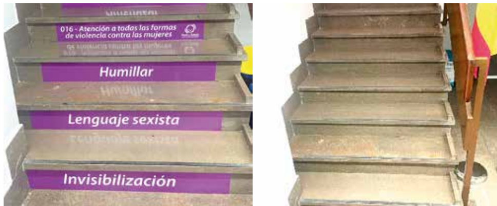
Las escaleras donde se encontraban las pegatinas.